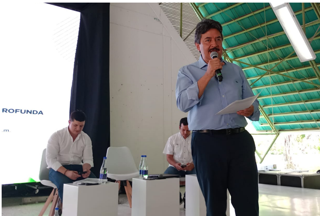
Carlos Julio González, senador.

El senador, Carlos Julio González, expresó. “tenemos 40 kilómetros en el Meta, 24 en el Huila, 12 kilómetros con la necesidad de abrirlos, y 5 de ampliación. Y la tarea que tenemos con la audiencia pública que vamos a citar, es tener listo el presupuesto, para de esta manera presentarlo al Gobierno Nacional”.