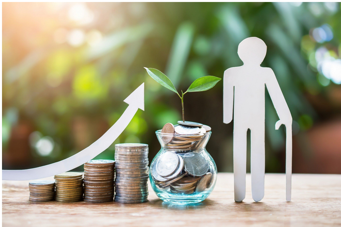
Aunque la medida busca proteger a la mayor parte de la clase trabajadora, expertos advierten que no es sostenible en el tiempo.

La reciente decisión del Gobierno de reducir el umbral para cotizar en Colpensiones ha generado debate entre expertos del sector pensional. A pesar del acuerdo alcanzado con el Partido Liberal, que buscaba facilitar el acceso al sistema pensional público.