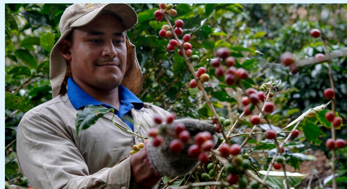
Otro de los aspectos a analizar son los derechos laborales.

"Necesitamos un sistema de 'mapeo', eso lo estamos trabajando con la Ideam, la Unidad de Planeación Rural Agropecuaria (UPRA) y Gobierno Nacional. Además, de unas certificaciones, para estar seguros que el café, no haya sido cultivado por ejemplo en un Parque Nacional. Y lo que queremos hacer a través de este plan, es identificar los obstáculos concretos y determinar cuánto tiempo necesitamos para arreglarlos", agregó el embajador europeo.