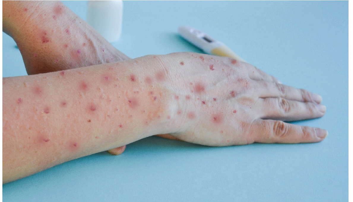
Viruela del Mono. Imagen de referencia.

El primer caso en humanos había ocurrido en 1970, en la República Democrática del Congo, en el centro de África. De hecho, en las últimas horas, un grupo de investigadores encontró una nueva cepa mutante. Lo más grave: tiene potencial pandémico.