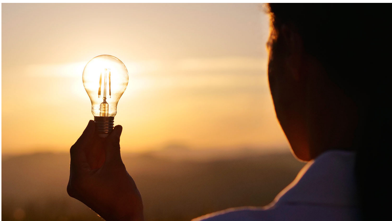
En marzo la región que más aumentó el consumo de electricidad fue el departamento del Guaviare.

A aquellos usuarios que se encuentren en mora y no se les haya suspendido el servicio de energía eléctrica, no se les reconocerá este beneficio hasta que se pongan a paz y salvo en el pago de la factura.