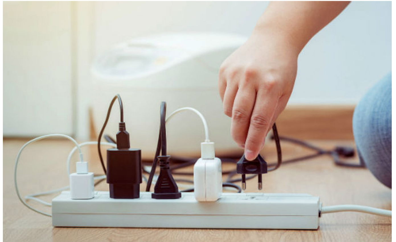
El fenómeno de El Niño revivió el fantasma de un racionamiento de energía.

Para evitar un racionamiento en el país, la Comisión de Regulación de Energía y Gas (Creg) implementará un programa de ahorro de energía para ofrecer incentivos a los usuarios que disminuyan su consumo de energía y castigar a quienes hagan todo lo contrario.