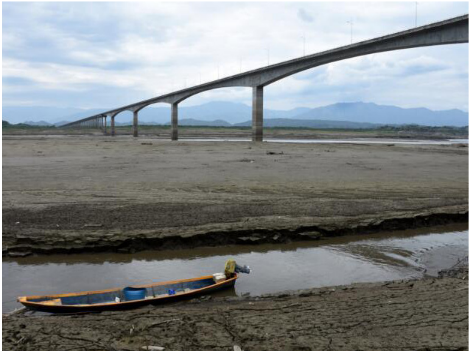
Pescadores y sector turístico del Huila afectados por la desoladora escena del embalse de El Quimbo, reducido a un lecho de lodo por la sequía.

El Ministro de Minas y Energía, Andrés Camacho, ha descartado la implementación de medidas de racionamiento energético, aunque