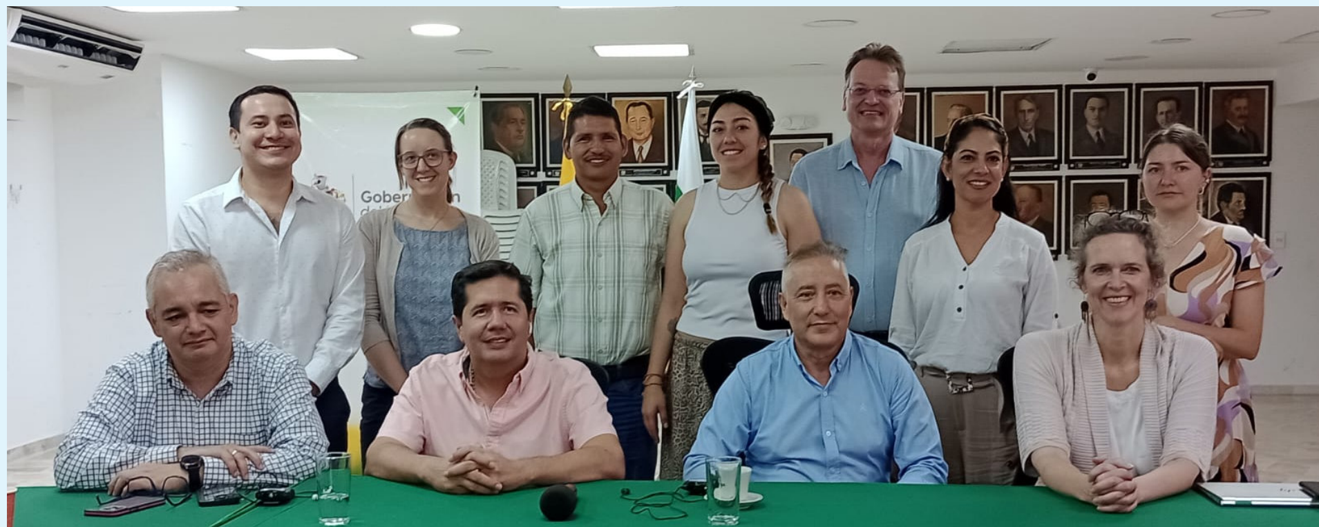
Reunión sostenida entre la delegación alemana y el Gobierno Departamental.