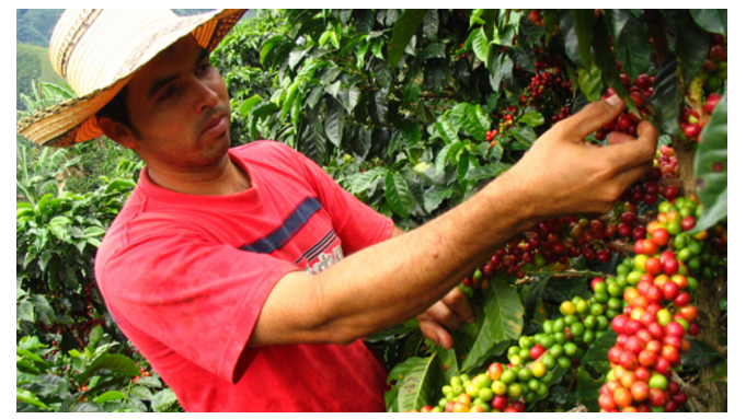
Cafeteros esperan llegada de las lluvias