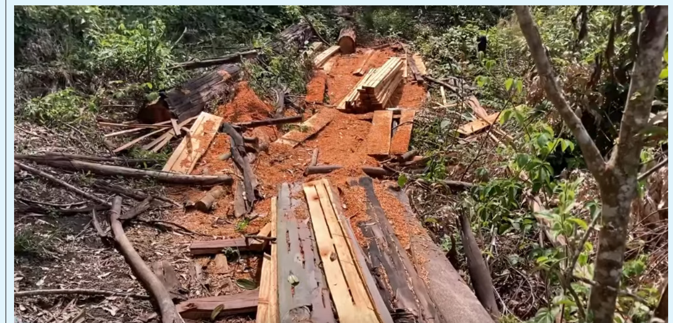
Uno de los aspectos más sensibles, es que se produzca sin deforestar.

"Y donde las empresas tienen que cumplir y todavía hay temas que están sin precisar, por ejemplo temas de legalidad, exigencias en derechos humanos y en mayo se espera que la Unión Europea,