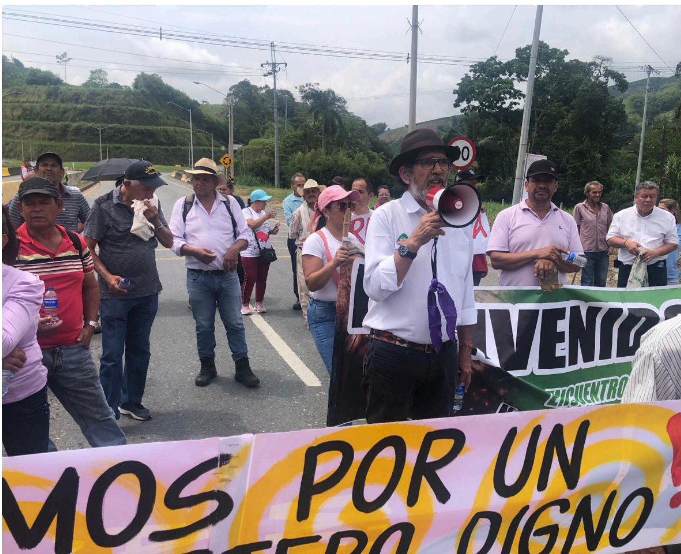
A pesar de las protestas masivas y las demandas contundentes, los caficultores colombianos aún esperan respuestas concretas por parte del gobierno y la Federación de Cafeteros.

Más de 3000 productores se congregaron en vías y plazas públicas para exigir precios justos y reformas en el sector cafetalero, desafiando los esfuerzos del gobierno por disuadir las protestas lideradas por la Unión Cafetera y otras organizaciones.