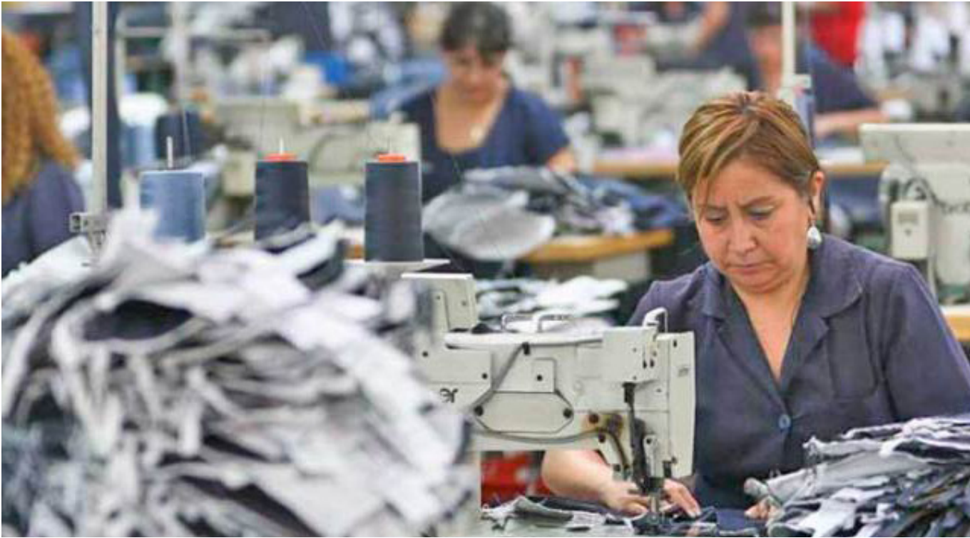
Hubo un crecimiento intermensual de 0,46 % del sector industrial y manufacturero.