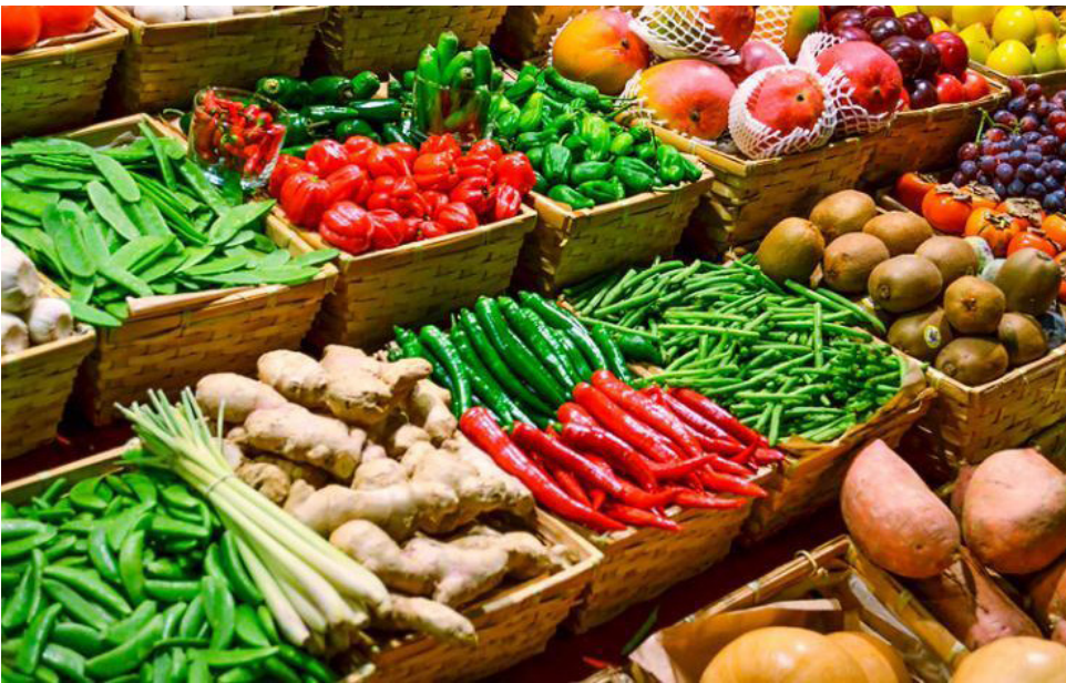
Se redujeron las cotizaciones de las verduras, las frutas y los tubérculos.

Y según el Gobierno Nacional: “con los resultados del segundo mes de este año se consolida el crecimiento que traen las exportaciones de los productos del agro, la agroindustria y la manufactura, sectores que integran las de bienes no mineros energéticos”.