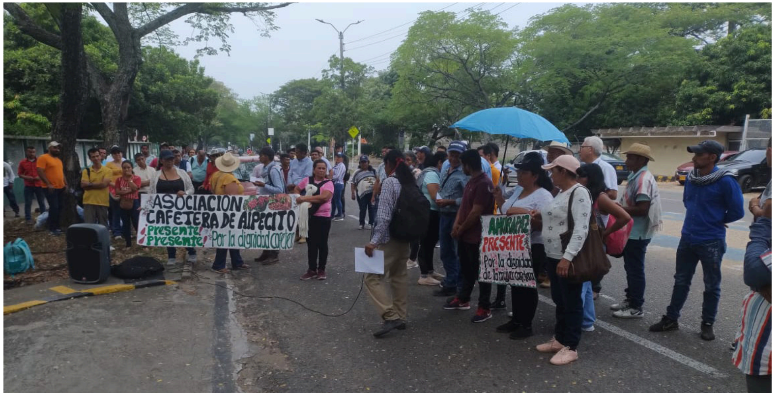
La llegada de las lluvias genera esperanza entre los agricultores del Huila, quienes confían en que estas precipitaciones ayudarán a revitalizar la producción agrícola en la región.

Advirtió que, si no se atienden las 13 demandas presentadas en Bogotá, se podría iniciar un paro nacional indefinido. Enfatizó la necesidad de acciones concretas por parte del gobierno y la renovación de la Federación para evitar más engaños y manipula-