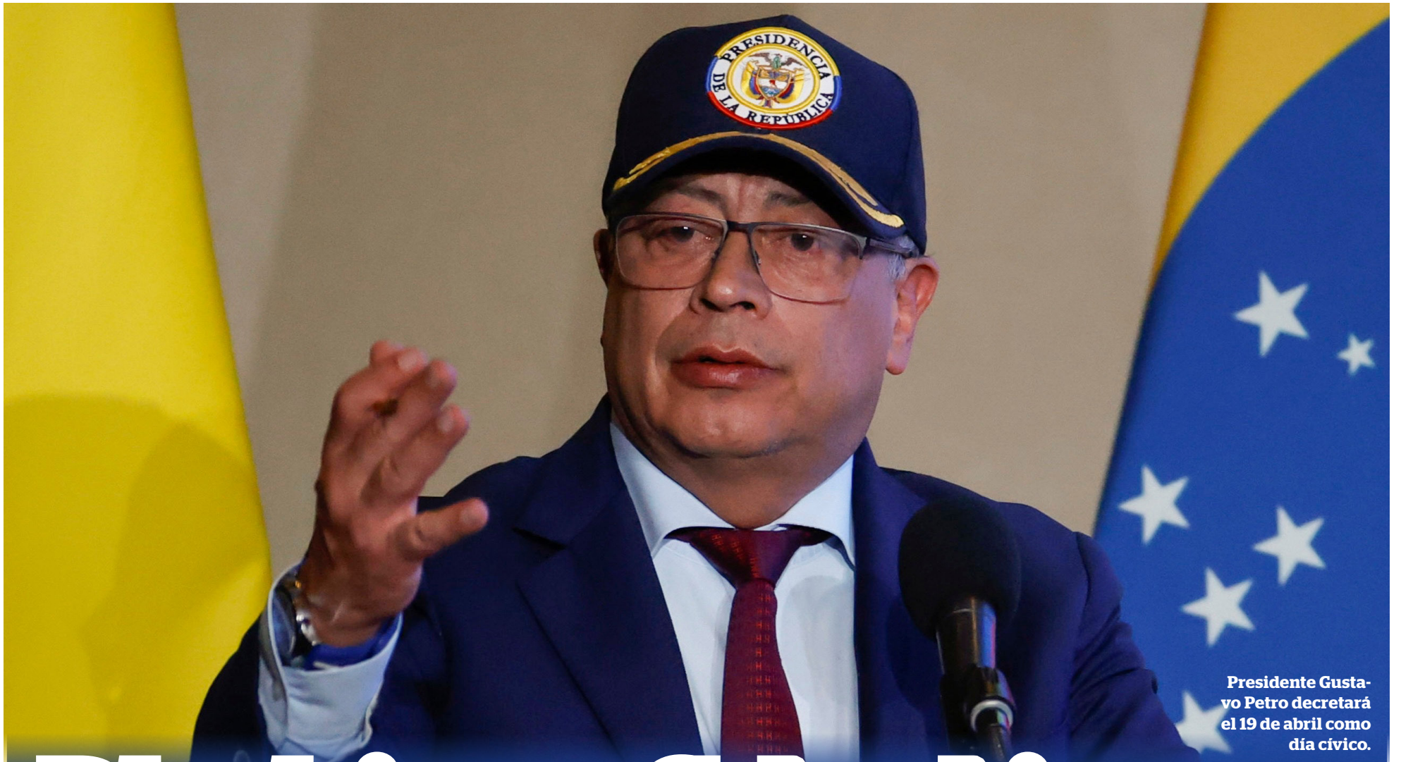
Presidente Gustavo Petro decretará el 19 de abril como día cívico.