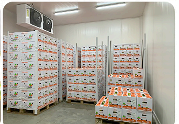
Solo en febrero se embarcaron para el mundo 758.132,8 toneladas de mercancía colombiana.