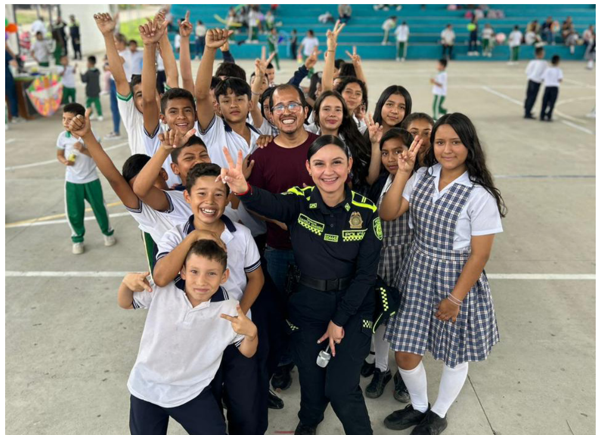
La Policía Nacional con sus grupos de Policía Comunitaria, Carabineros, GAULA, Protección y Servicios Especiales, y Tránsito y transporte, llegaron con la estrategia 'Rutas por la paz' y en coordinación con la alcaldía, celebraron el día del niño en la institución educativa municipal.