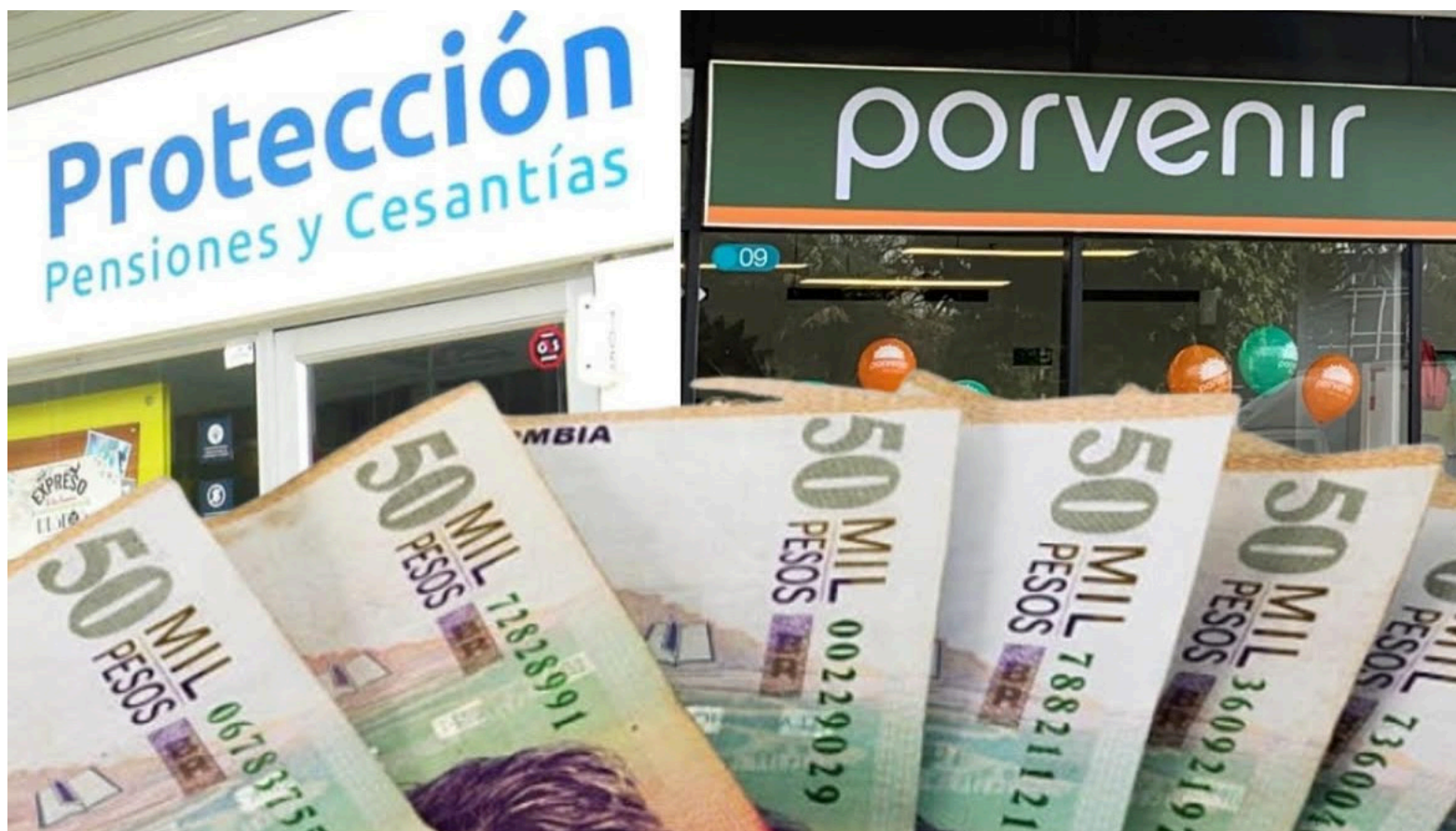
De ser aprobada, las personas que ganen menos de 2.3 salarios mínimos no podrían elegir donde cotizar.

Este cambio en la política de cotizaciones se orienta a garantizar un sistema pensional más inclusivo, permitiendo que aquellos con ingresos superiores al nuevo umbral puedan optar por destinar sus aportes a fondos pensionales privados tales como Porvenir, Colfondos, Protección, entre otros.