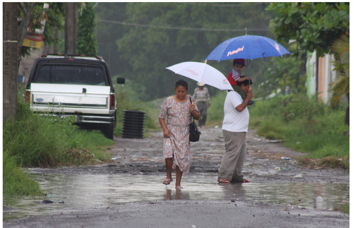
Aunque se esperan lluvias para el próximo fin de semana, las autoridades advierten que las precipitaciones podrían no ser suficientes para revertir la crisis, aumentando la preocupación por la disponibilidad de agua en la región del Huila.

El embalse de El Quimbo muestra un preocupante volumen útil del 18,04%, generando alarma entre pescadores y el sector turístico.