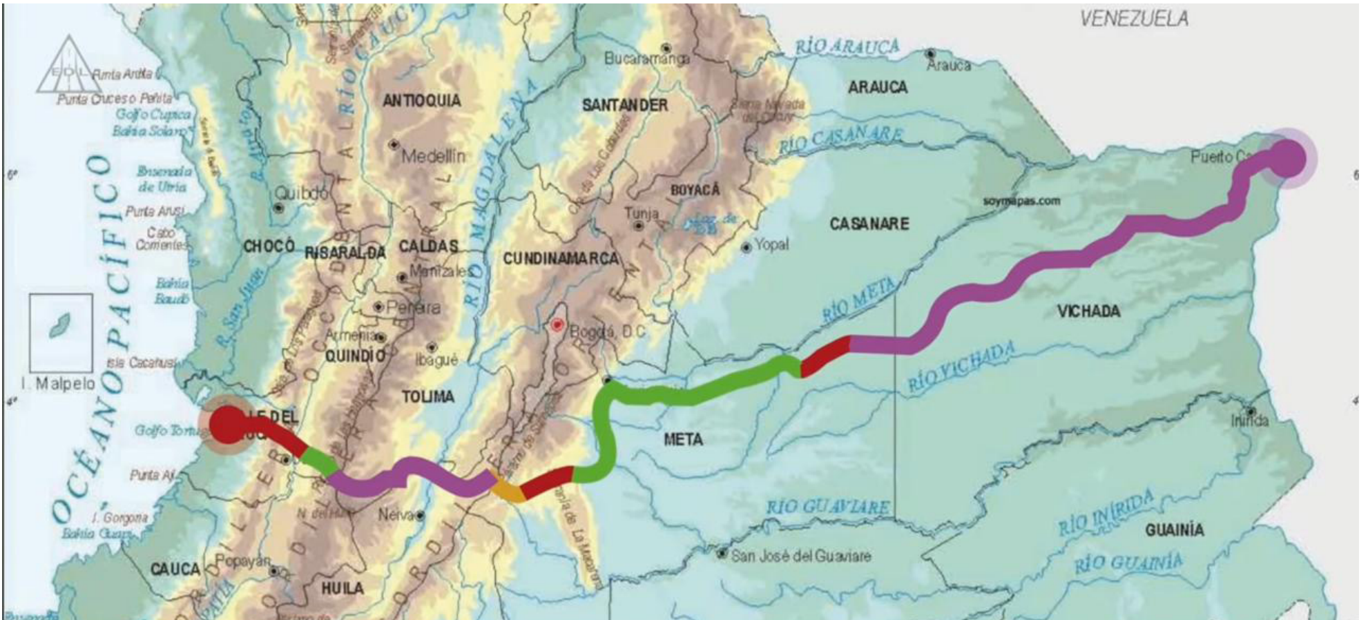
Este es el ambicioso proyecto vial, en el que se han invertido $1.4 billones.

por $283 mil millones y el punto que va de Baraya-Colombia-El Dorado, tiene una inversión de $54 mil millones, este trazado vial ya se concluyó.