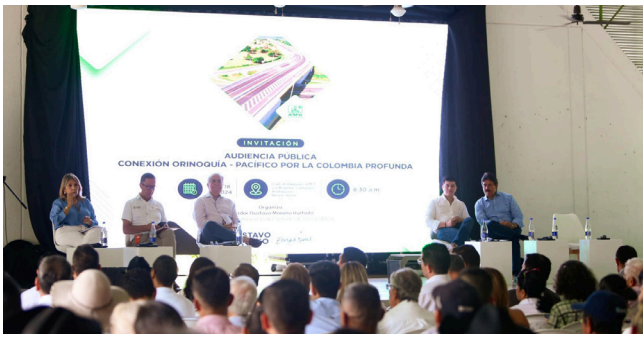
Proyecto vial Orinoquia-Pacífico impulsará regiones