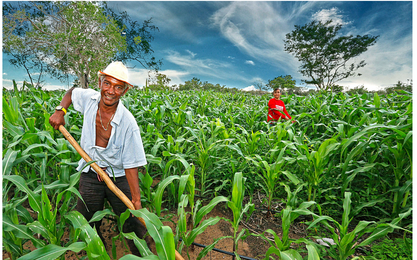
La agricultura, ganadería, caza, silvicultura y pesca; explotación de minas y canteras) son las que siguen jalonando la economía.

En cuanto a los despachos de mercancías no solo crecieron en valor: también lo hicieron en volumen. Solo en febrero se embarcaron para el mundo 758.132,8 toneladas, un aumento del 23,2% en comparación con febrero de 2023.