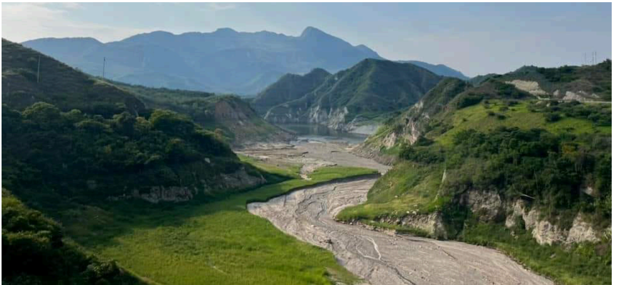
El embalse de El Quimbo, en el Huila, muestra un nivel crítico del 18,04%, despertando alarmas entre los habitantes y autoridades locales.

■ A pesar de las recientes lluvias, los embalses del Huila muestran preocupantes niveles de agua, con Betania al 65,31% y El Quimbo alarmantemente bajo, apenas al 18,04%. Aunque se esperan lluvias para el próximo fin de semana, las autoridades advierten que las precipitaciones podrían no ser suficientes para revertir la crisis.