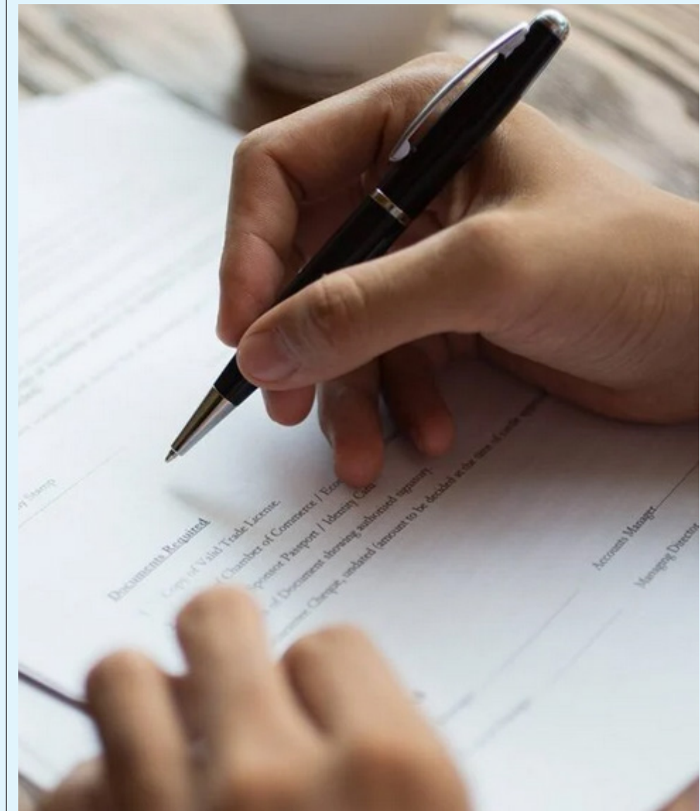
El próximo mes la U.E. expedirá una guía con todos los requerimientos que deberán cumplir todos los actores vinculados con la exportación.

El tercer aspecto apunta a generar capital, a través de crédito o inversionistas de impacto y desarrollar y escalar instrumentos financieros verdes, para que esto pueda incrementar los sistemas de producción más sostenibles, sea en el café mismo, sistemas agroforestales y el cuarto componente es la sensibilización de las capacidades de los mismos importadores en la Unión Europea, porque muchos también tendrían cierto grado de desconocimiento