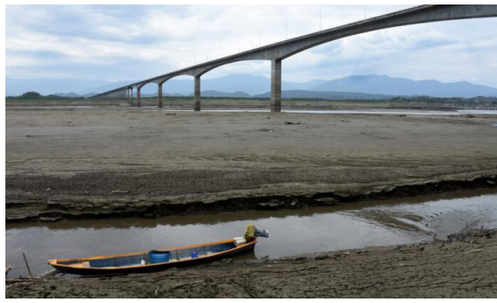
¡Betania y El Quimbo necesitan lluvias!