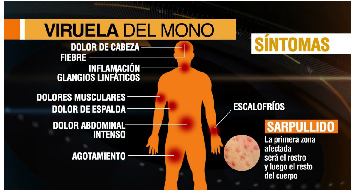
Lesiones provocadas por la viruela del mono.