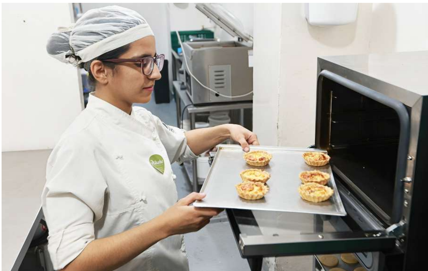
Los estudiantes recibirán formación en emprendimiento.

Por lo anterior, la funcionaria hizo extensiva la invitación para que los padres de familia se hagan partícipes de este buen proyecto, es importante que los niños vayan y los apoyen en esta iniciativa. Este programa que llegó a ocho instituciones educativas, beneficiara a 900 niños.