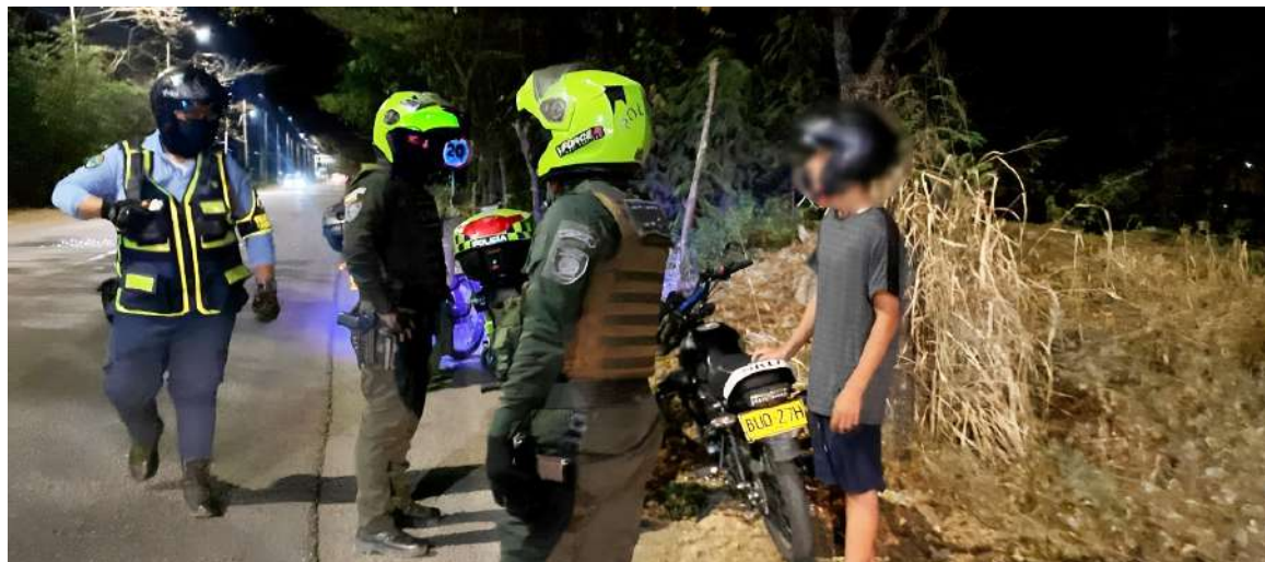
El pasado jueves, en un operativo contra los piques ilegales, fue capturado un sujeto con un arma de fuego.