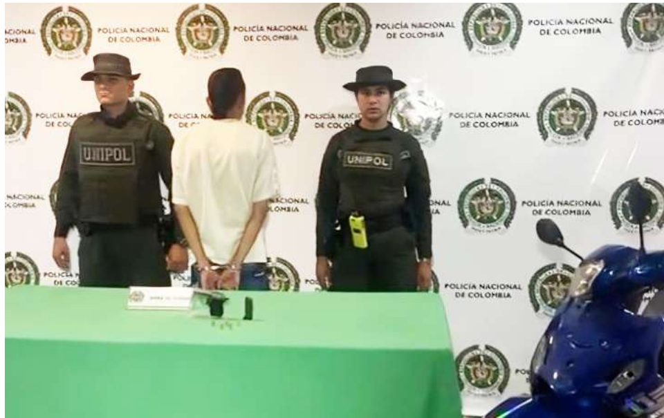
En el operativo, ocurrido en 'Neiva la Nueva', fueron inmovilizadas más de 20 motos.

Este operativo fue liderado por la Secretaría de Gobierno, a través de la Dirección de Convivencia y Seguridad, en coordinación con la Secretaría de Movilidad, la dependencia de Juventud, la