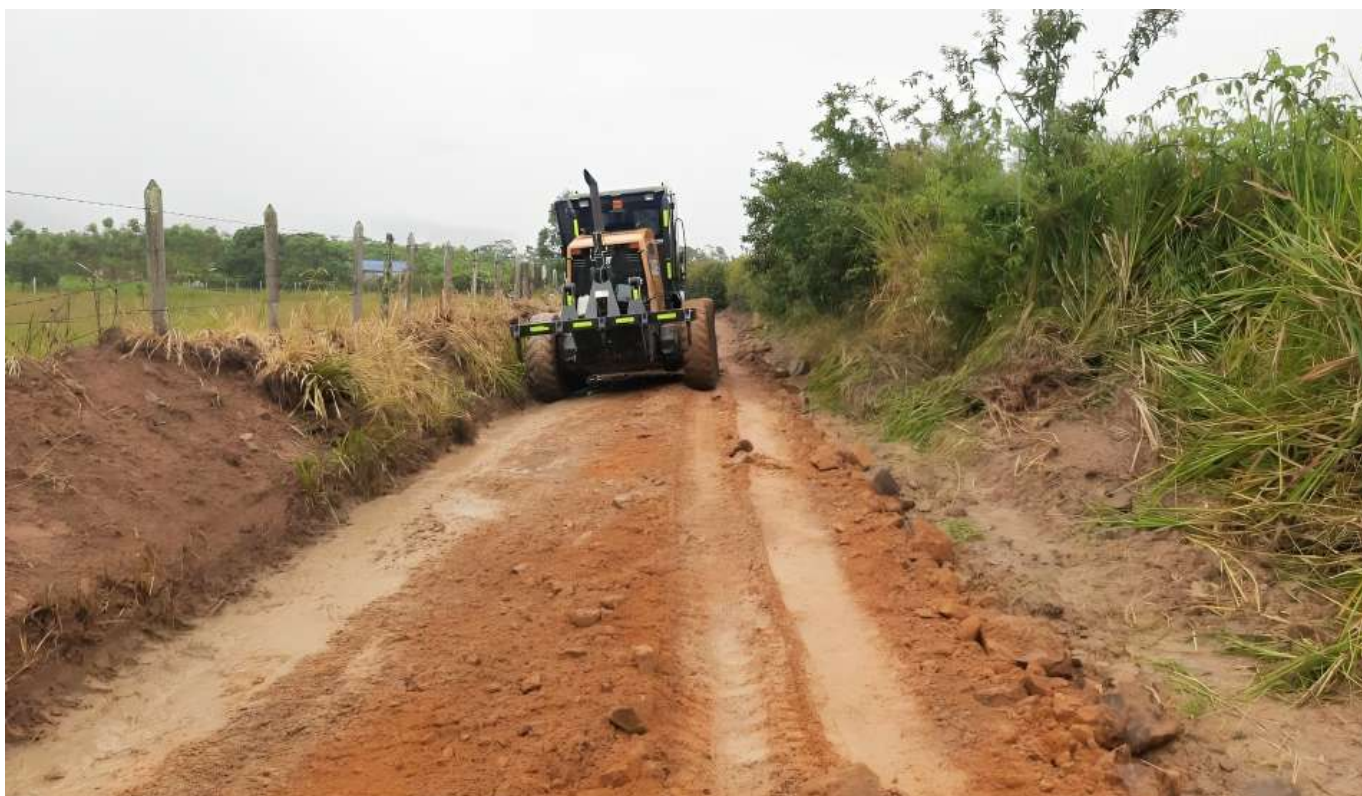
Igualmente se ha adquirido maquinaria amarilla para hacer arreglos en vías rurales.

El alcalde laboyano señaló que se viene trabajando con los liderazgos comunitarios de manera que, como contrapartida, los habitantes de los sectores ponen los materiales y la Administración realiza los arreglos en las calles.