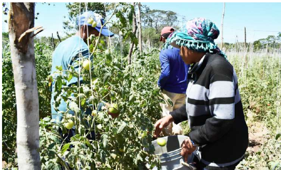
La directora del ARN indicó que estos espacios garantizarán el retorno de esta población a la vida civil.

poración Colectiva (AERC), que representan una transformación en la geografía de la reincorporación. “Estas áreas nos permitirán avanzar en la consolidación de los antiguos Espacios Territoriales de Capacitación y Reincorporación (ETCR), garanti-