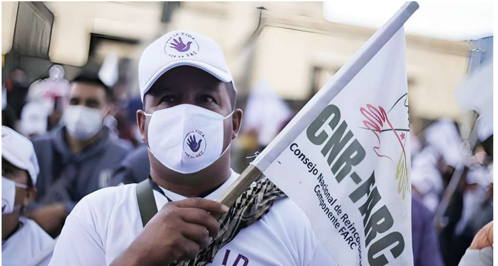
Los firmantes de paz podrán disponer de nuevos espacios para formalizar sus proyectos de vida.

Miller explicó que la normativa permitirá el reconocimiento de las Áreas Especiales de Reincor-