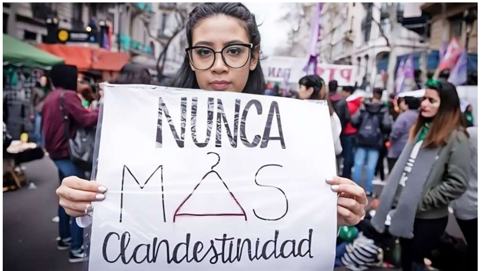
Barreras religiosas, culturales y sociales en el acceso a la interrupción voluntaria del embarazo se siguen presentando.

Cabe recordar que en 2006 la Corte Constitucional de Colombia, a través de la Sentencia C-355, reconoció el derecho al aborto legal y seguro como parte integral e indivisible de los derechos sexuales y de los derechos reproductivos de la mujer, en tres circunstancias específicas: (i) Cuando la continuación del embarazo constituya peligro para la vida o la salud de la mujer, certificada por un médico; (ii) Cuando exista grave malformación del feto que haga inviable su vida, certificada por un médico; y, (iii) Cuando el embarazo sea el resultado de una conducta, debidamente denunciada, constitutiva de