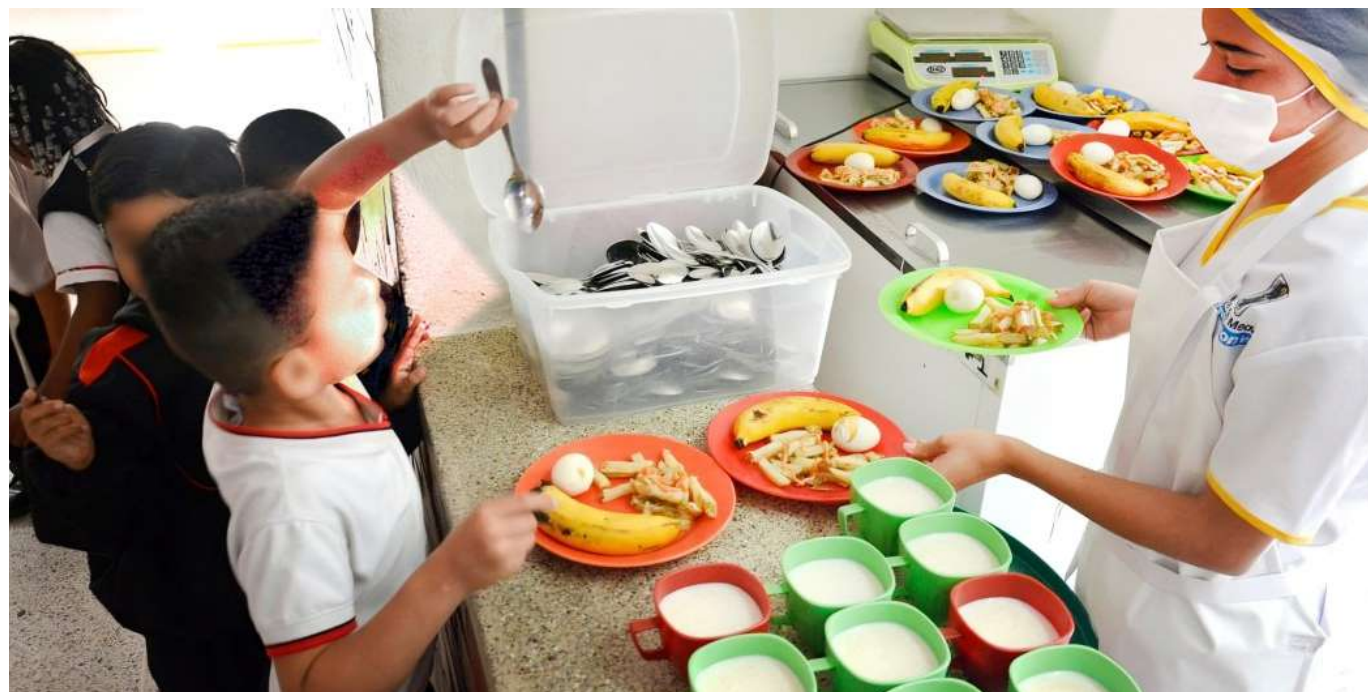
Invitaron a los progenitores y comunidad educativa, a ser veedora del Programa de Alimentación Escolar (PAE).

Llevaron dos meses con la implementación de este sistema, el cual ya ha arrojado resultados, puesto que sean frustrado cinco intentos de hurto con reacción inmediata, y desde la Secretaría, han evaluado el servicio.