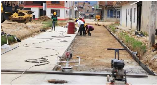
Mejoramiento de la malla vial en Pitalito