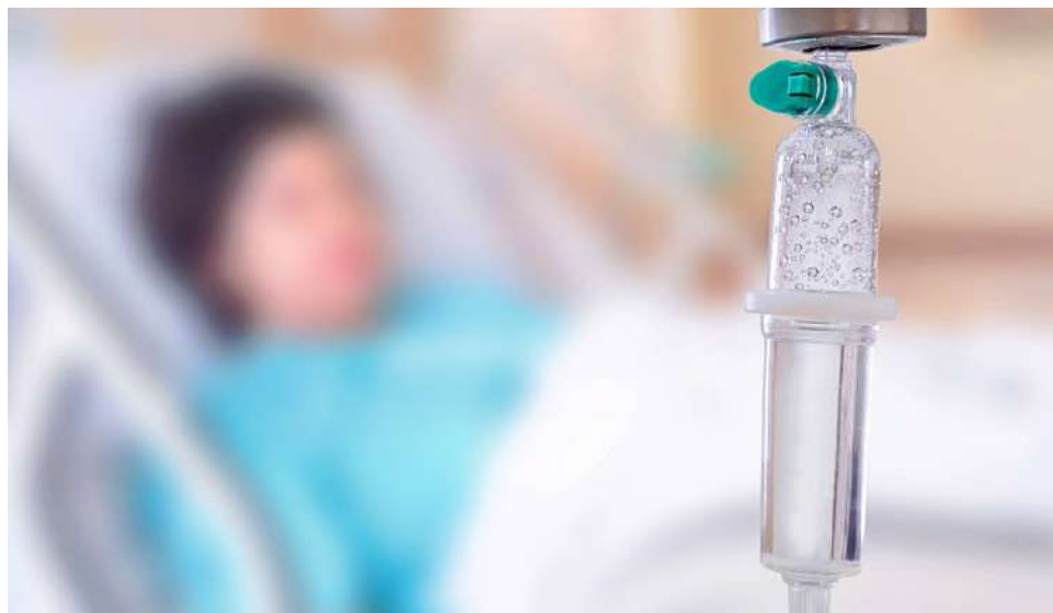
Desde ese 2015 se han realizado 692 procedimientos de muerte médica asistida por medio del sistema de salud.

nasia. Estas cifras provienen del informe De muerte lenta n.º 3, elaborado por el Laboratorio de Derechos Económicos, Sociales y Culturales (DescLab).