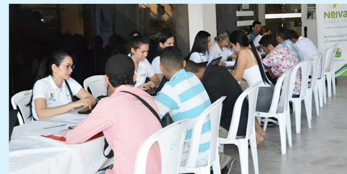
El DANE subrayó el incremento de la desocupación en la región que en periodo enero-junio de 2024 registró una tasa de desocupación del 11%.

El desempleo en la región Central, que incluye departamentos como Huila, Tolima y Caquetá, se incrementó en un 0,8% en el primer semestre de 2024, alcanzando una tasa del 11%, lo que el DANE consideró una «variación estadísticamente relevante».