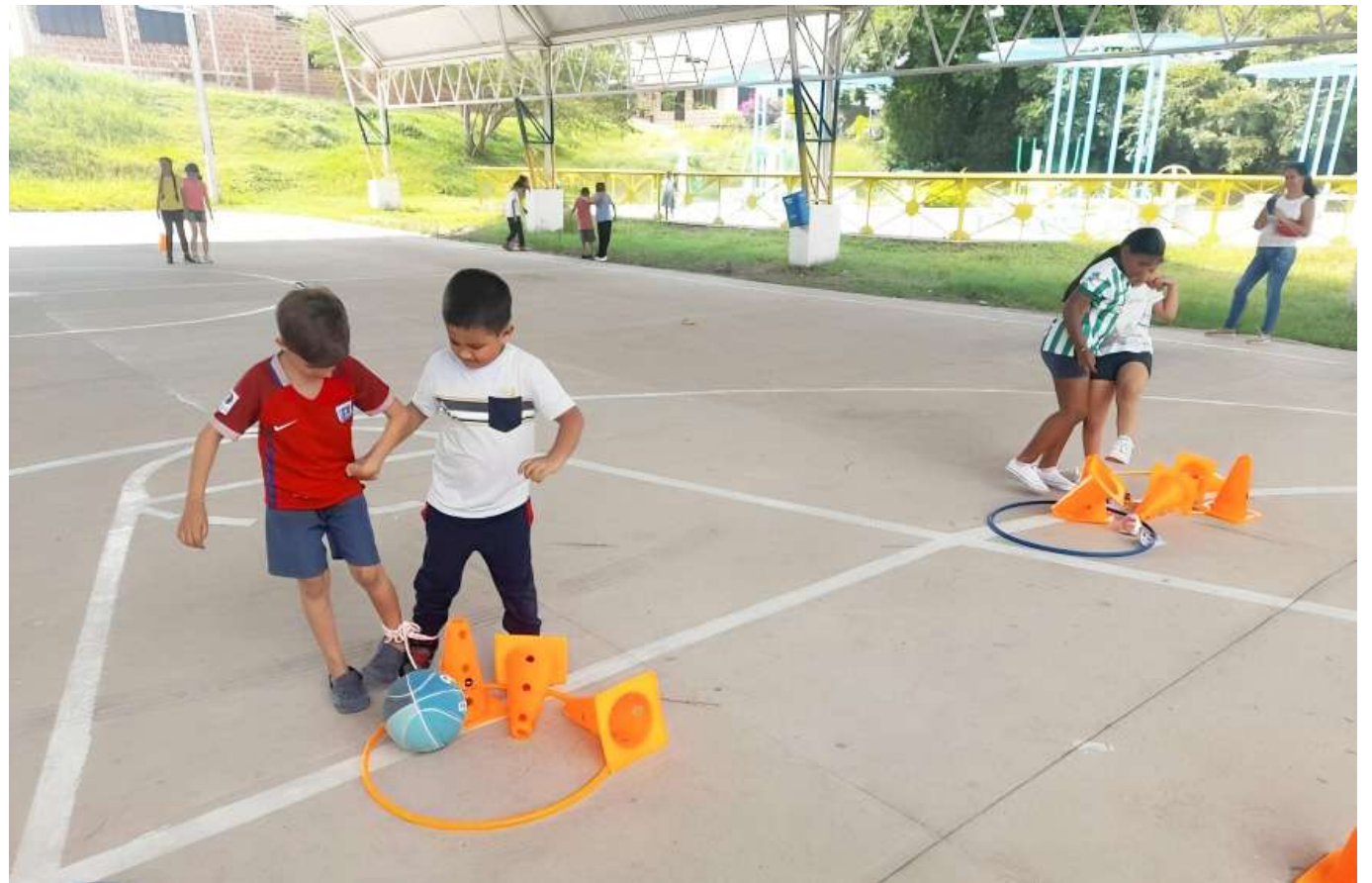
Padres de familia a apoyar a sus hijos en las escuelas de formación deportiva.

“En las visitas que adelantamos, encontramos muchos almuerzos que no estaban siendo consu-