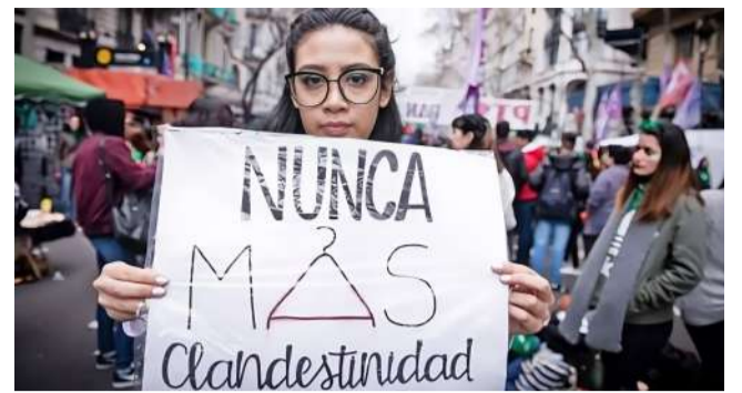
Reglamentación para el acceso al aborto