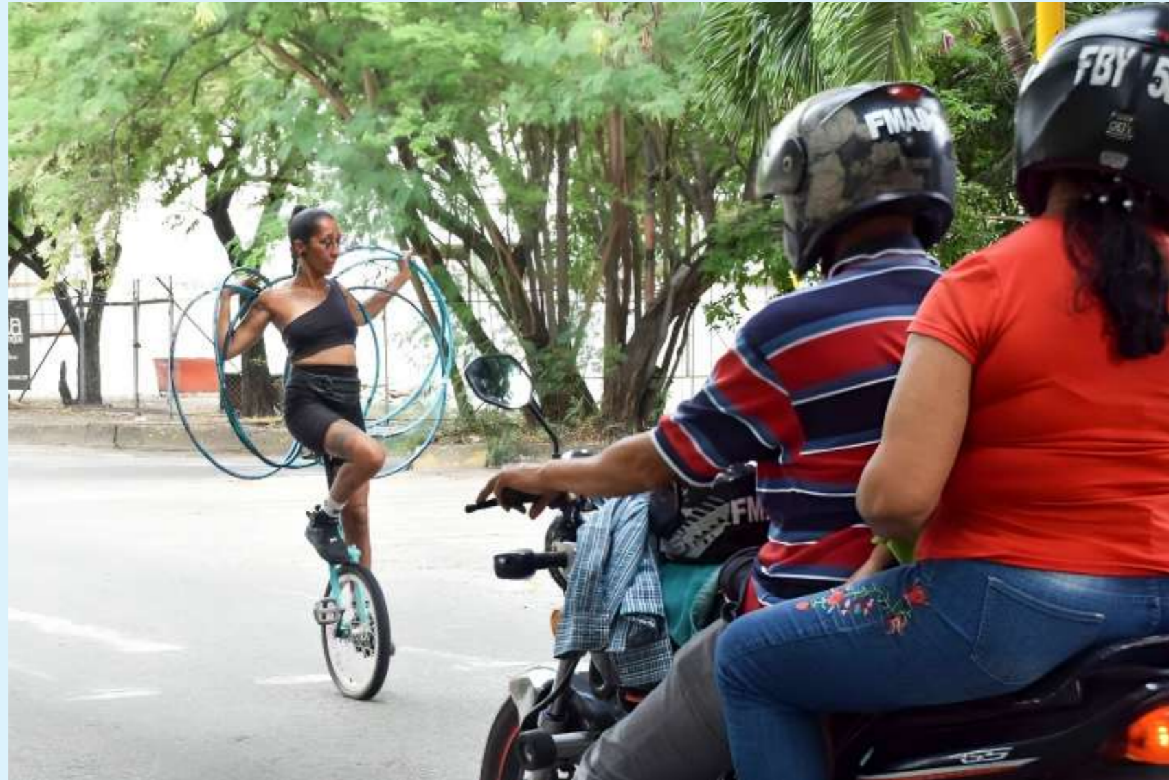
En junio, el desempleo en Colombia alcanzó un 10,3%, es decir, un aumento del 0,9% respecto al mismo mes de 2023 (9,3%).

El Huila, en particular Neiva, muestra algunas estadísticas relevantes en la más reciente Gran Encuesta Integrada de Hogares (GEIH). A nivel de cobertura de encuestas, la ciudad de Neiva tuvo un porcentaje de cobertura del 95,1%, lo que indica una alta participación en el estudio.