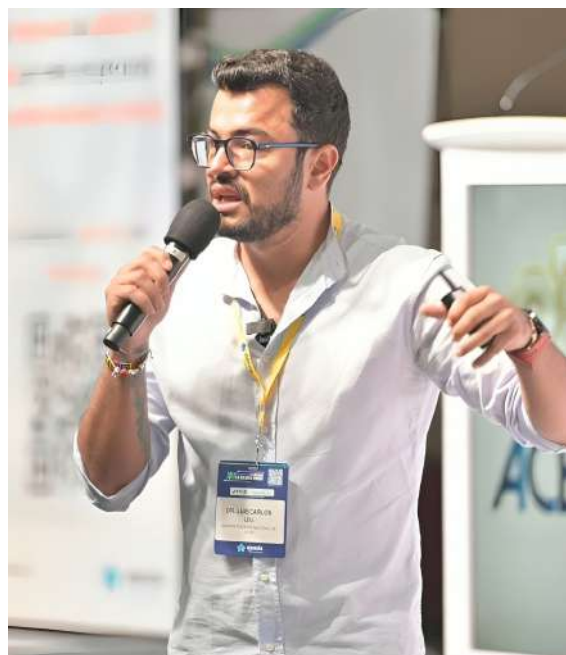
Luis Carlos Leal, superintendente Nacional de Salud.

La atención de la interrupción voluntaria del embarazo (IVE), debe ser provista en forma integral y segura, abordando no solo los aspectos médicos, sino también los biopsicosociales que se consideran relevantes para res-