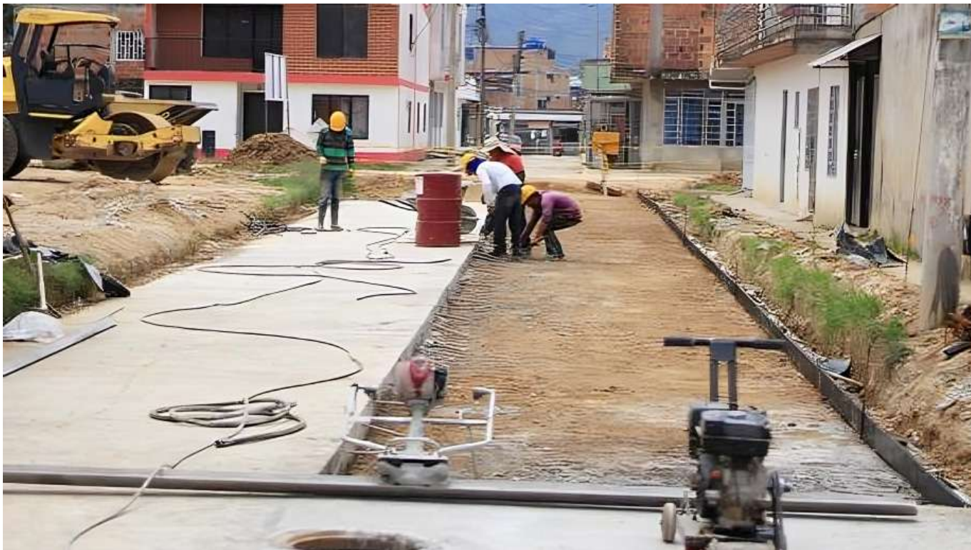
Con inversión de la Gobernación se están habilitando 15 tramos viales.

y rural, haciendo el respectivo mantenimiento de la malla vial, al igual que los convenios que tenemos adelantados ya con el Comité de Cafeteros para iniciar con la posición de placa huella”.