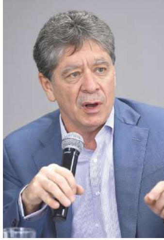
Bruce Mac Master

Cuando cumple 10 años al frente de la ANDI, el gremio empresarial más importante de Colombia, Bruce Mac Master se ha convertido en el principal contrapeso frente a las propuestas socioeconómicas de izquierda del Gobierno del presidente Gustavo Petro.