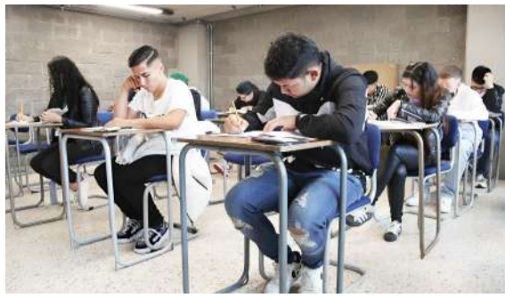
Jóvenes a 'cerrarle la puerta' a la violencia