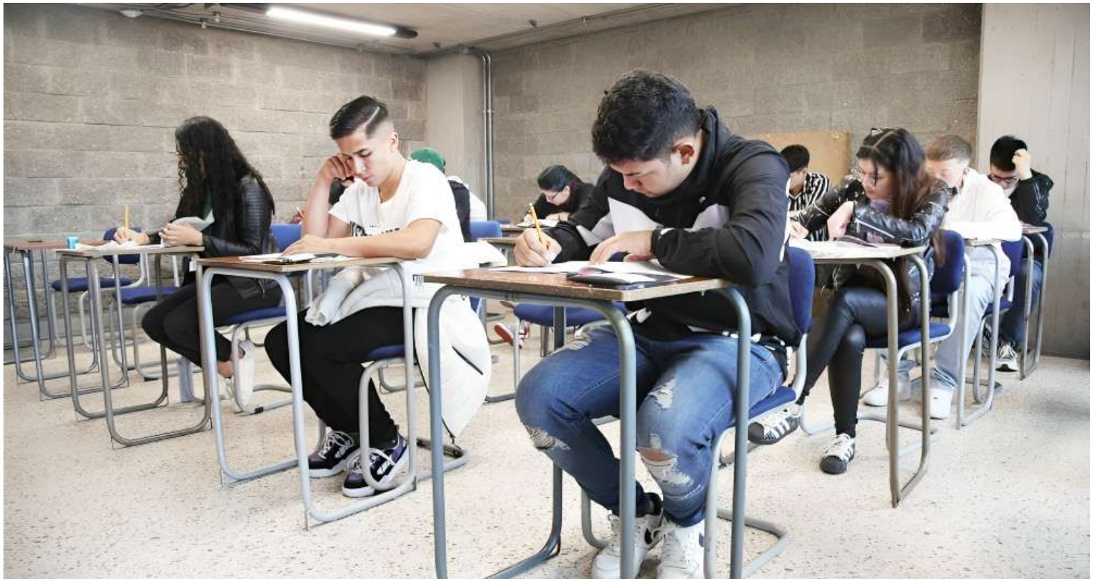
A jóvenes que cursan el grado décimo de bachiller de sectores vulnerables son capacitados en las pruebas Saber.