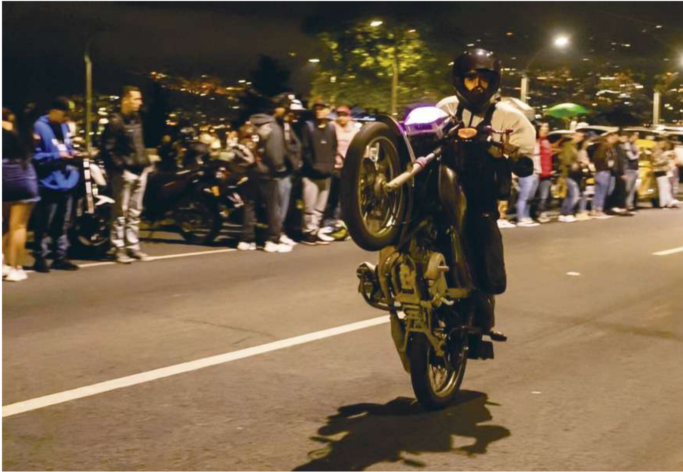
Preocupan los piques ilegales.

tancia de dirigir esfuerzos educativos hacia este grupo de usuarios viales. «Hemos insistido mucho en que los motociclistas deben comprender la importancia de cumplir con las normas de tránsito. Desafortunadamente, vemos comportamientos muy peligrosos, como conducir sin casco, ir en contravía y a velocidades excesivas». Estos hábitos, señaló Cruz, no solo ponen en riesgo la vida de los motociclistas, sino también la de otros usuarios de las vías.