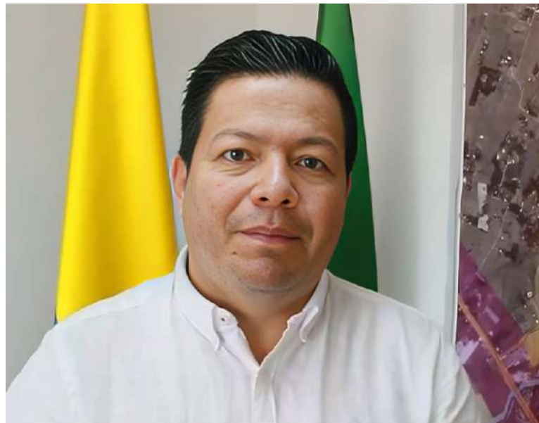
Yider Luna, alcalde de Pitalito.

Más allá de la simple pavimentación de vías, el alcalde Luna ha adoptado un enfoque estratégico para asegurar que las inversiones en infraestructura tengan un impacto real en la movilidad del municipio. “Estamos formulando también proyectos de pavimentación en la ciudad, pero no estamos pavimentando cuadritas. Estamos pavimentando tramos que conecten la ciudad, que generen movilidad en la ciudad”, explicó. Esta declaración subraya