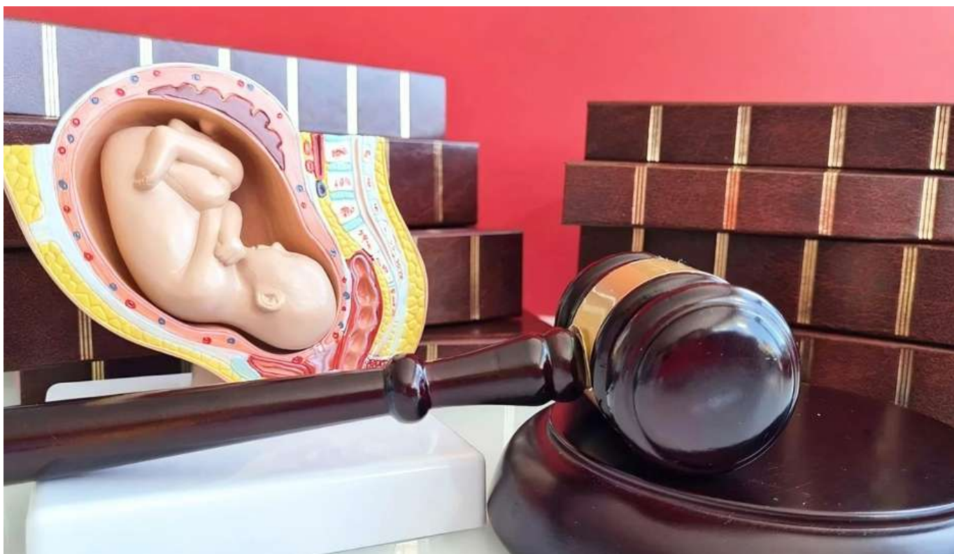
La entidad de salud, ha identificado situaciones de vulneración del derecho a la salud de las mujeres.

Y dentro de los derechos sexuales y derechos reproductivos se han reconocido los siguientes: el derecho a la intimidad personal; a la igualdad de sexo y género; el respeto a las decisiones personales en torno a la preferencia sexual; la decisión sobre el número de hijos e hijas; el espaciamiento entre ellos; la libertad para elegir métodos anticonceptivos; el derecho a la información veraz, completa y oportuna; el acceso efectivo a servicios de salud sexual y reproductiva y la interrupción voluntaria del embarazo (IVE).