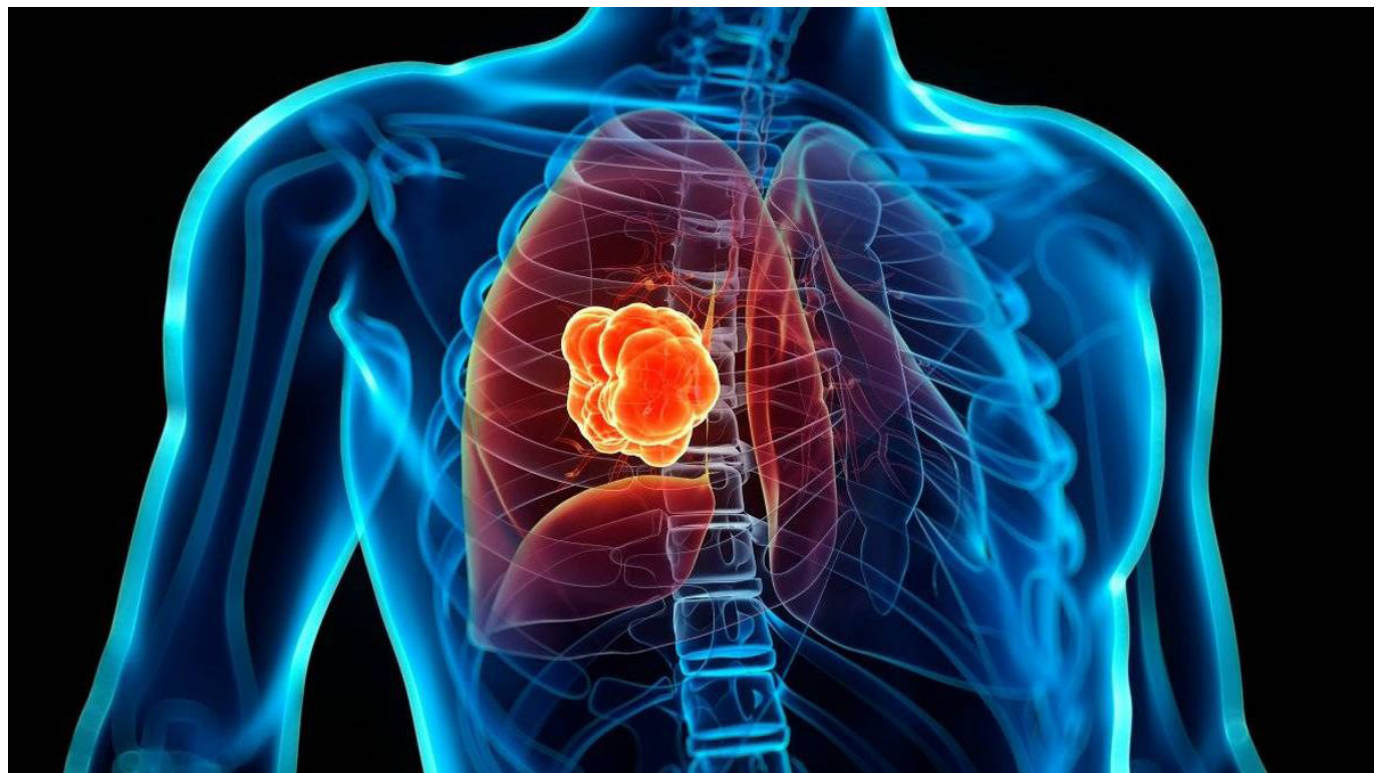
El cáncer de pulmón es uno de los más difíciles de detectar tempranamente. Estos son los tipos de cáncer silencioso.

“Muchos sistemas de salud de países de ingresos bajos y medianos están muy poco preparados para gestionar esa carga de morbilidad, y un gran número de pacientes de cáncer de todo el mundo carecen de acceso oportuno a medios de diagnóstico y tratamiento de calidad”, ha advertido la OMS.