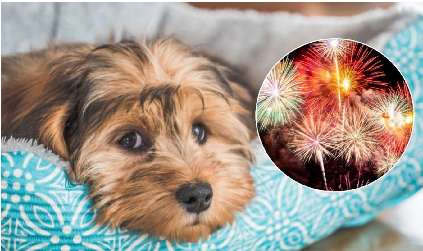
La pólvora impacta de igual manera la fauna silvestre.

Pero, ¿ustedes sabían que estos artefactos también traen consecuencias muy negativas para la fauna silvestre?