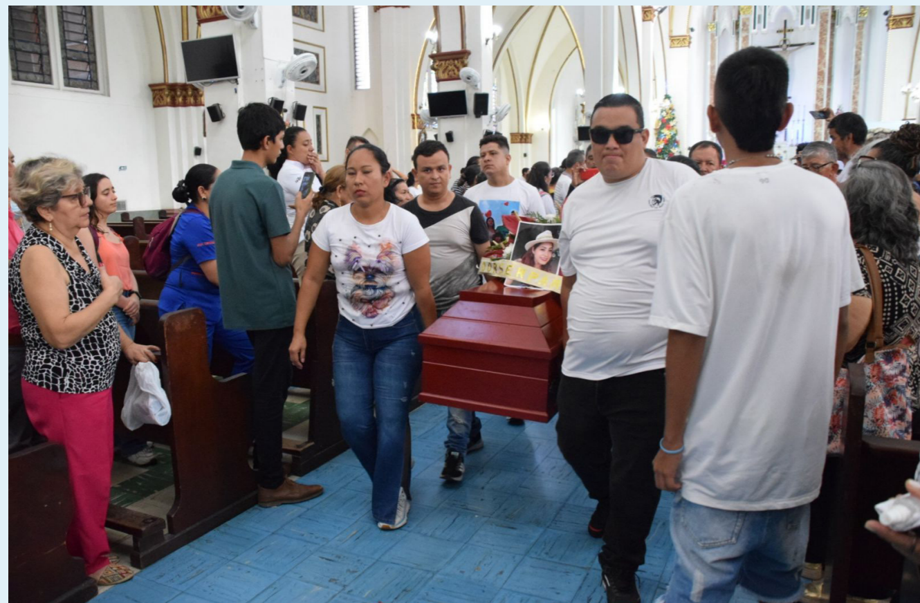
Allegados y amigos acompañaron a la familia en este último adiós.