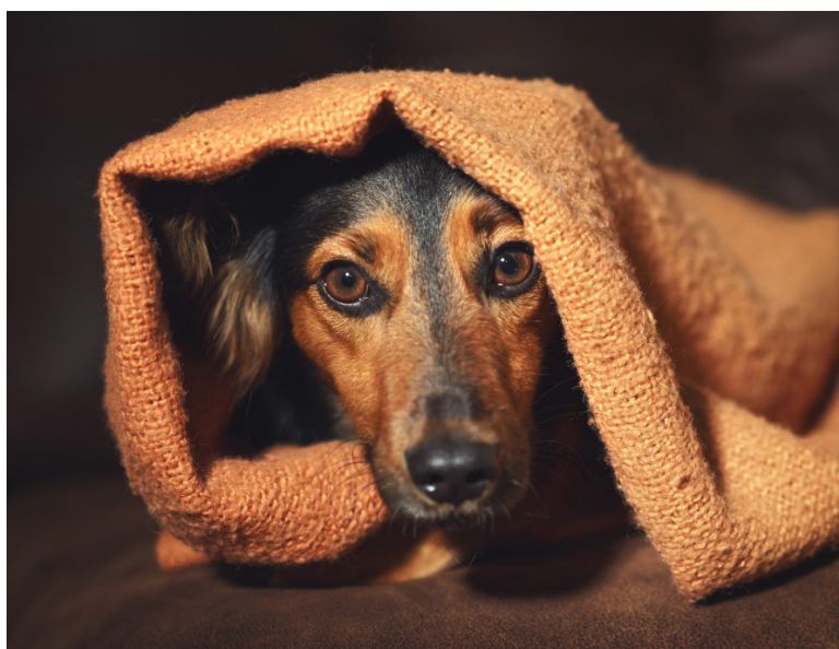
Estos sonidos pueden causar miedo, fobia, fuga por evitación, taquicardia, temblores persistentes y lesiones directas en los animales de compañía.

Según el IDPYBA con los animales en condición de calle, con los animales de granja y con los animales silvestres, es imposible tener un control o mitigación de los efectos de la pólvora.