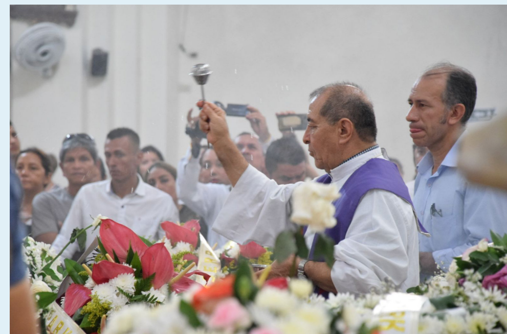
Los sacerdotes oraron por las almas de estas personas.