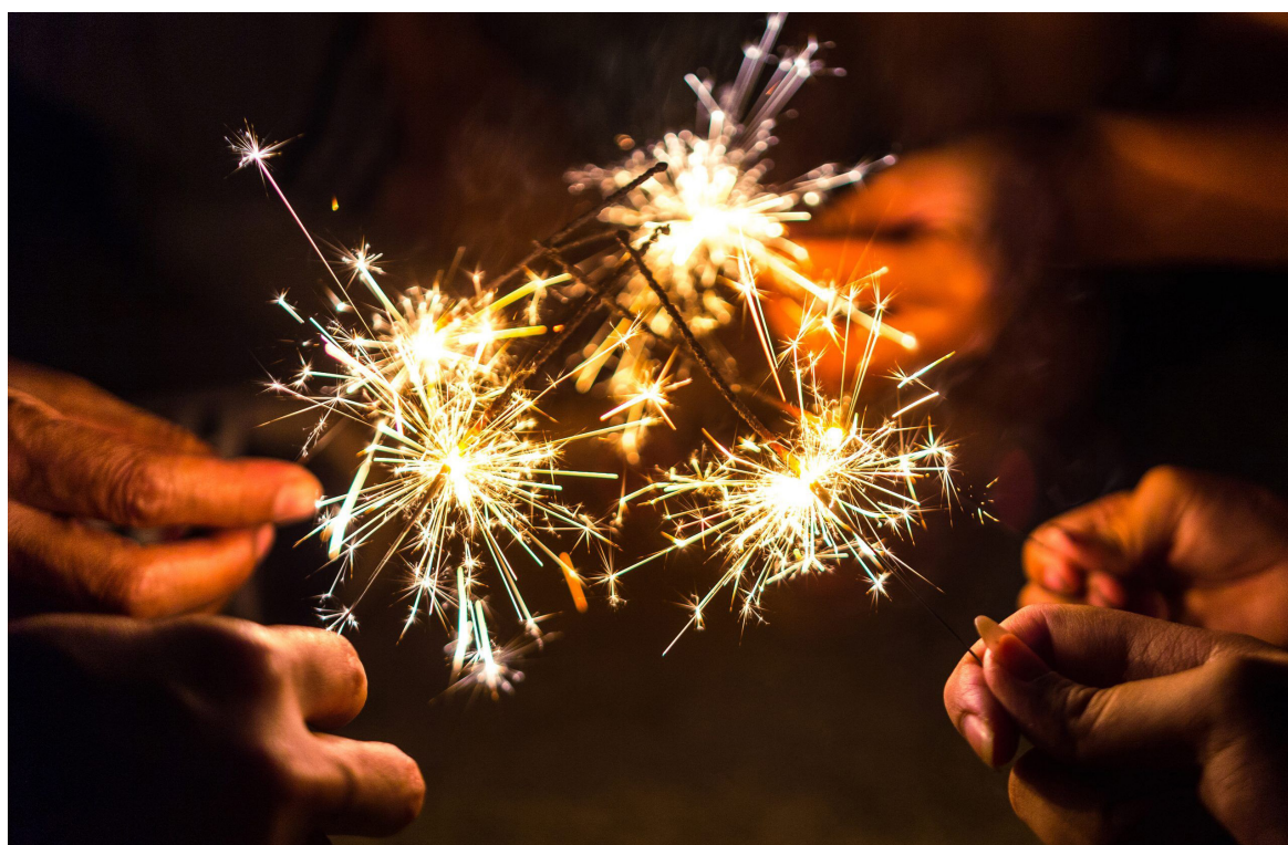
Han sido varios los animales que se han visto afectados por el uso de la pólvora.

Ya hemos hablado varias veces, y lo vamos a seguir haciendo, de lo mucho que la pólvora afecta a los animales de compañía como perros y gatos.