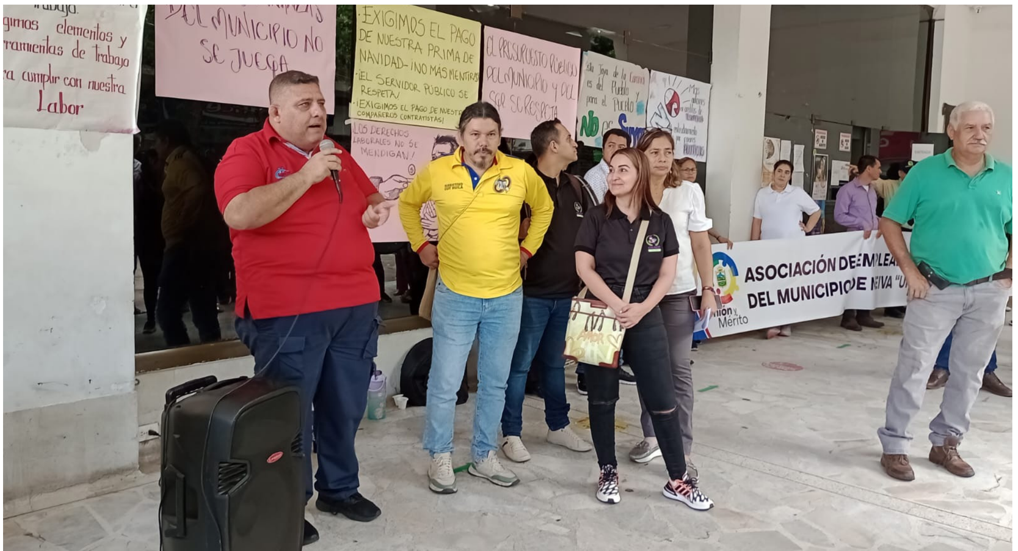
Los voceros de los protestantes, socializaron la propuesta dada.

“vamos a estar en asamblea informativa, si ellos no nos cancelan el dinero adeudado, estaríamos a las 6:30 de la mañana el miércoles exigiendo nuestra ‘prima’. Asimismo, nos dijeron que el día viernes, nos tendrían una respuesta para el pago del salario”.