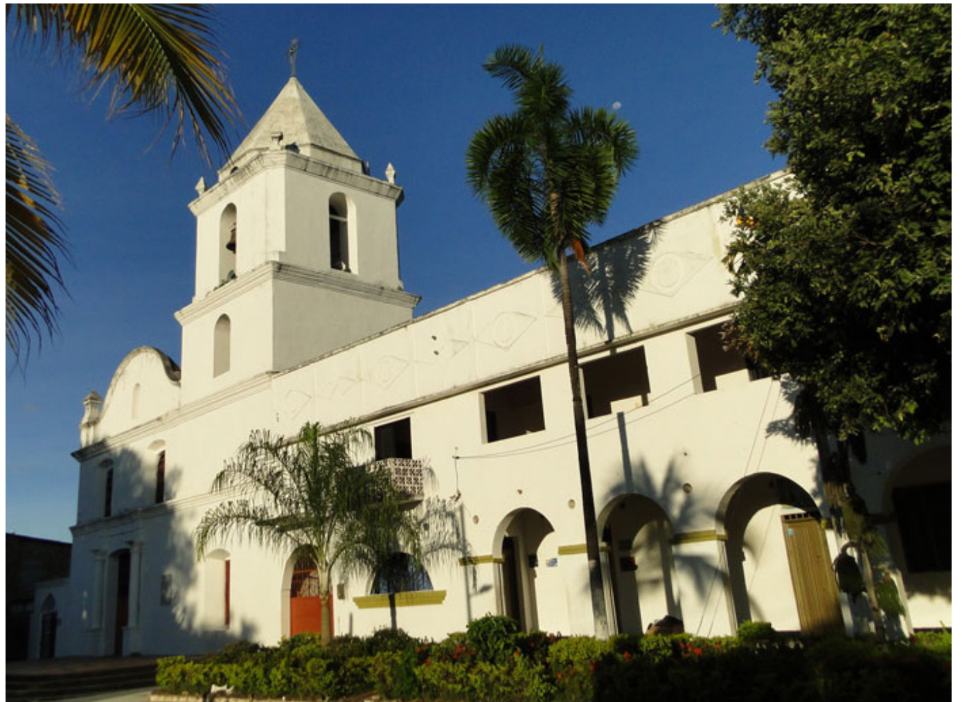
Los municipios de Algeciras, Pitalito y Tello, preocupan a las autoridades.

“Según las investigaciones, el dinero exigido a los perjudicados, depende a la actividad que desarrollen, desde el punto de vista comercial, asimismo le piden la cuota monetaria. Y nos preocupan los municipios de Algeciras, Pitalito y Tello”, agregó el funcionario judicial.