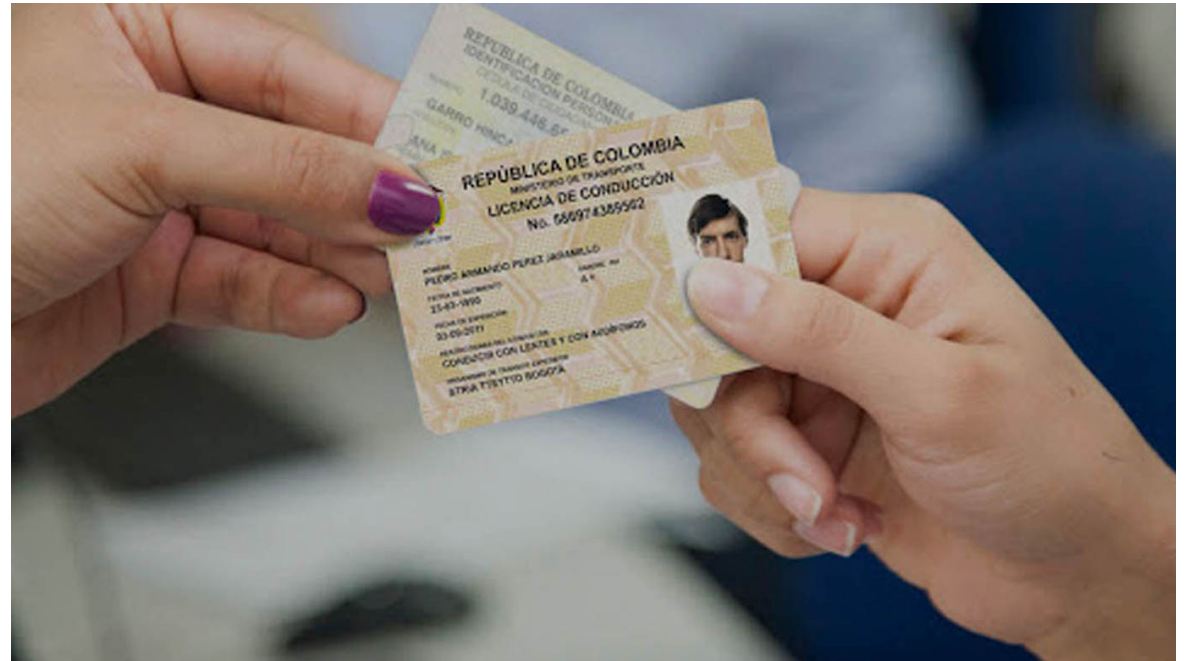
Este nuevo proyecto cambiaría el plazo de renovación para ciertos conductores del país.

Desde la oficina de licencias del CDAV hacen un llamado a la ciudadanía caleña a que se acerquen a renovar las licencias de conducción, puesto que a la fecha solo van 89 mil de las 150 mil que se tenían presupuestadas para el año 2023 y también para que se eviten sanciones en los controles de tránsito por parte de las autoridades.