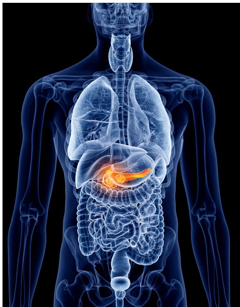
Una de las principales herramientas para mejorar la calidad de vida y las posibilidades de curarse que tienen los pacientes oncológicos es la detección temprana.

síntomas sino hasta que el cáncer ha crecido mucho o ya se ha propagado a otros órganos”, advirtió esa organización. Y subrayó que no hay pruebas diagnósticas físicas que permitan confirmar la presencia de este cáncer. La única alternativa que hay hoy son las pruebas genéticas, que se les