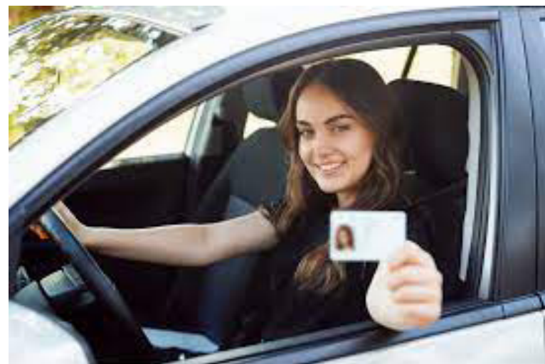
Nuevo proyecto de ley buscaría extender plazo de licencias de conducción.