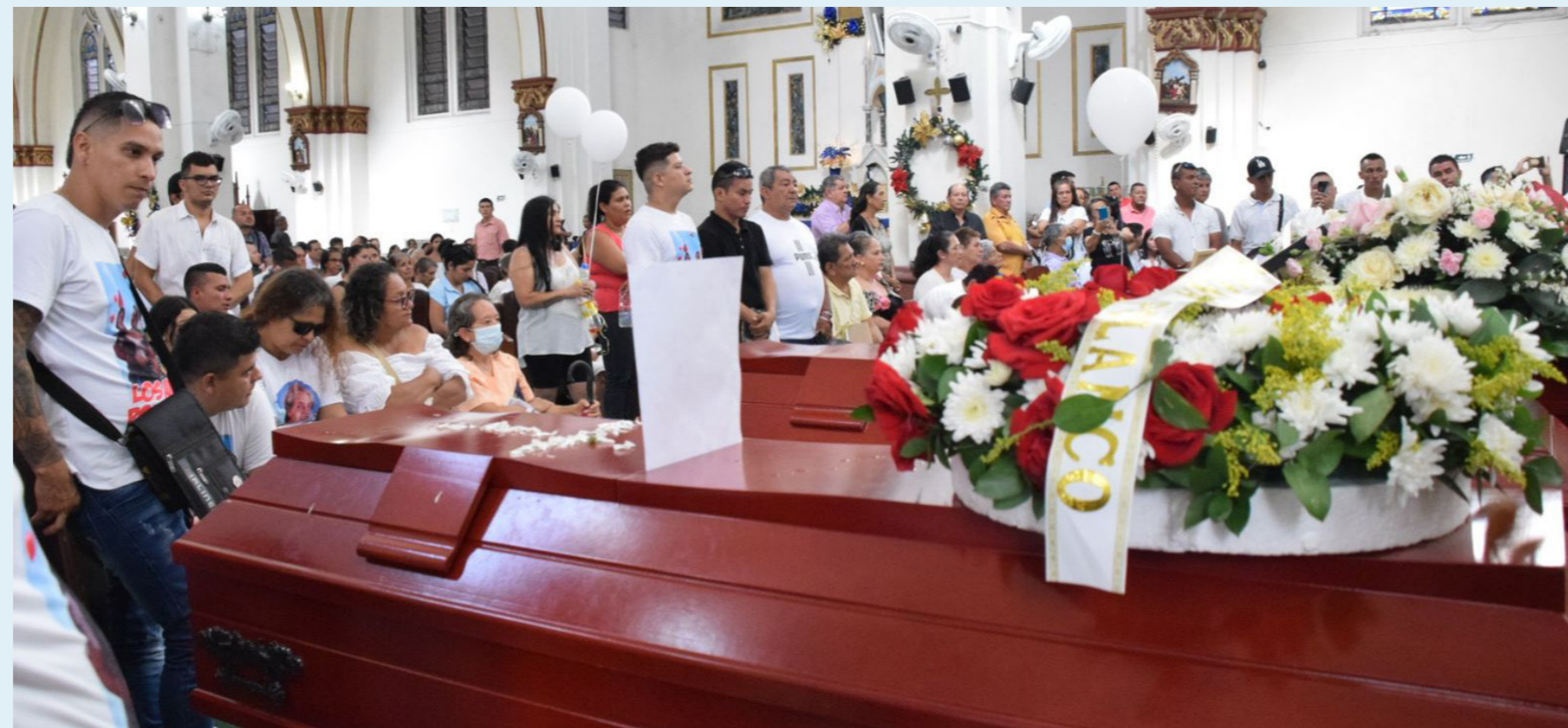
Uno a uno de los cofres funerarios fueron acomodados en la Catedral de Neiva.