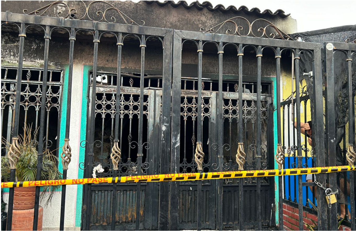
La tragedia ocurrió el pasado 15 de diciembre, cuando un incendio dentro de esta vivienda acabó con la vida de sus ocho ocupantes.

fue trasladado por una de sus hijas a la ciudad de Barranquilla, su tierra natal, donde se llevarán a cabo las ceremonias correspondientes para darle el último adiós en su lugar de origen.