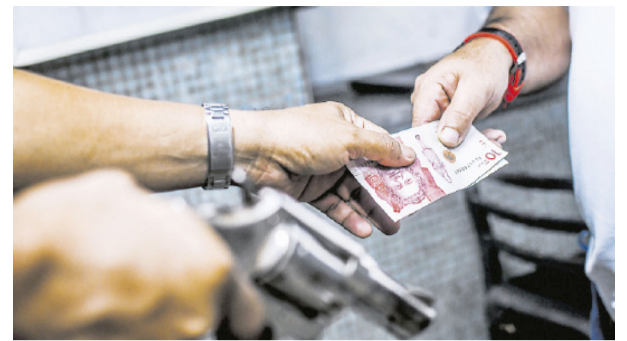
"En el Huila aumentó la extorsión en un 33%"