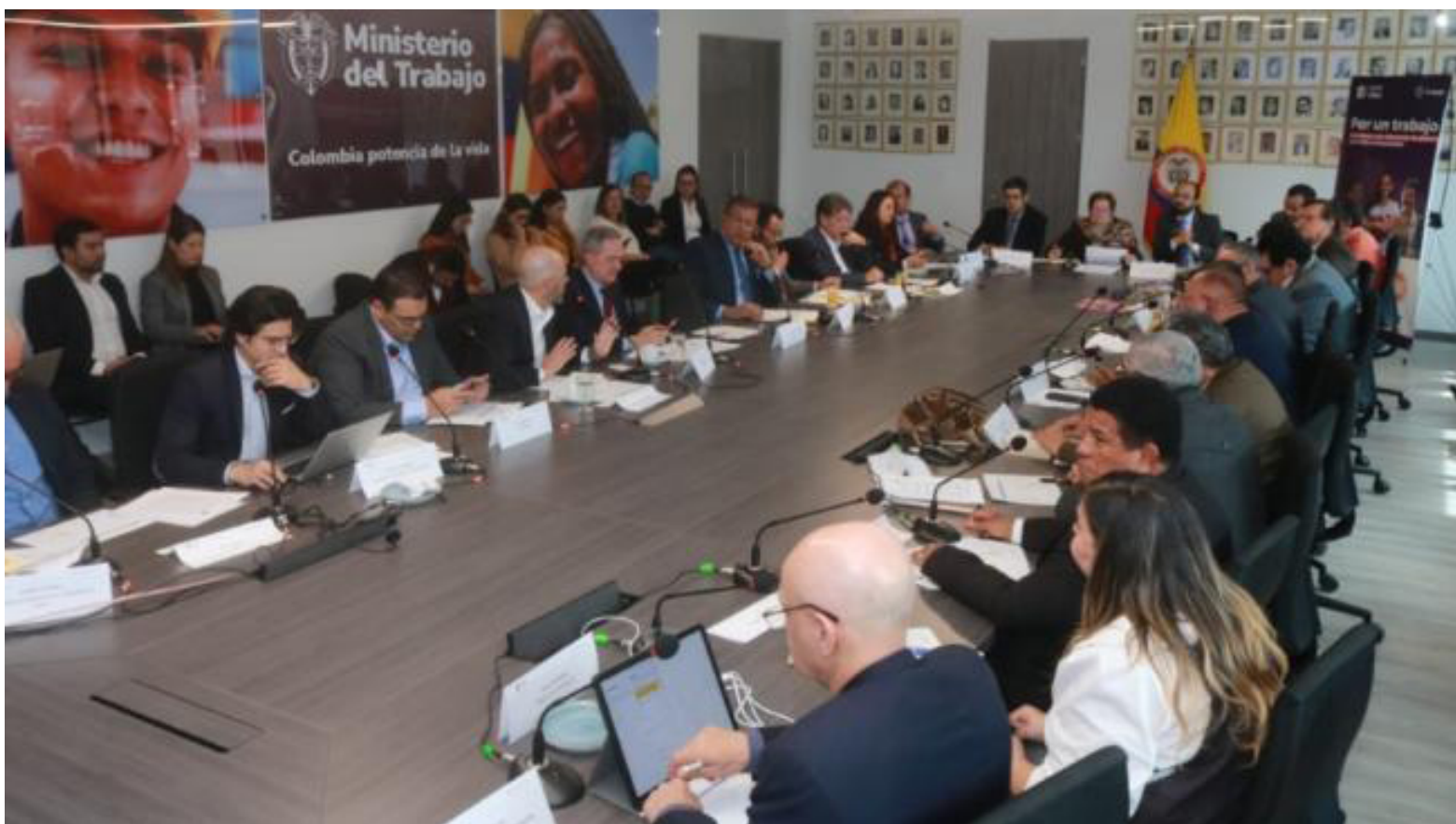
Foto 2: Empresarios, sindicatos y el Gobierno Nacional siguen sin llegar a un acuerdo sobre el aumento del salario mínimo para 2024, mientras se agotan los plazos establecidos por la ley.

Hacemos un llamado para que no se tomen medidas populistas, ni en la decisión del salario mínimo, ni en el Proyecto de reforma laboral. El Gobierno y los Congresistas tienen que escuchar las señales de una