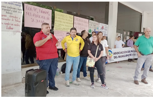
Protesta por el no pago de salarios