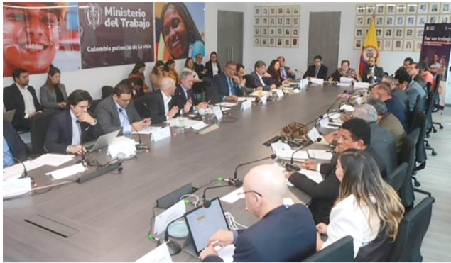
La economía sigue en 'picada'