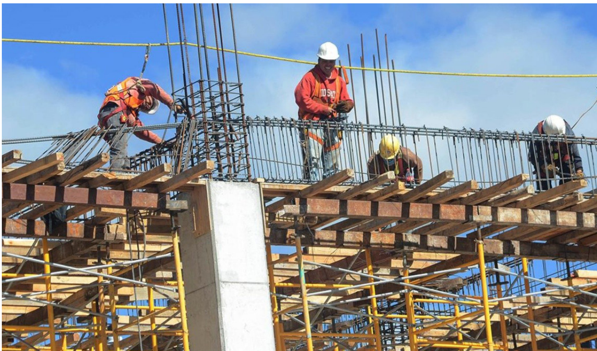
En octubre, las industrias manufactureras y la construcción lideraron la lista de sectores con las mayores caídas, registrando -5.2% y -3.0%, respectivamente.

De esta forma, al comparar cara a cara ambas propuestas, la diferencia entre las mismas sería poco más de $102.050.