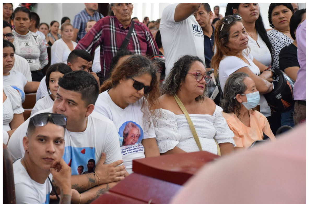
Familiares y amigos, bastante acongojados por la tragedia le dieron el último adiós a seis de las ocho víctimas mortales.

En medio de un doloroso cortejo fúnebre, seis de las ocho víctimas del trágico incendio en el barrio Santa Isabel fueron sepultadas en el cementerio central de Neiva.