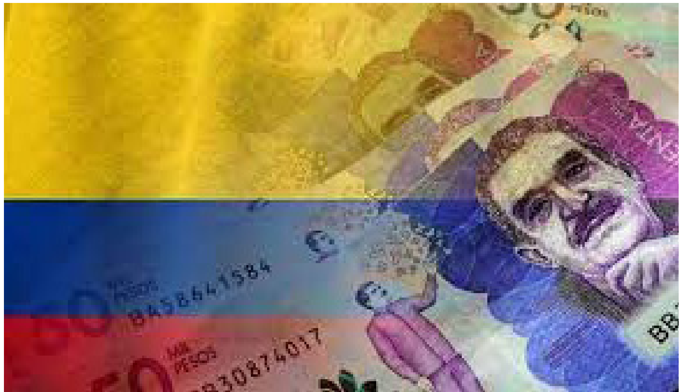
La economía no crece desde abril y cayó en octubre, está cerca de entrar en recesión.

En octubre de 2023, la economía de Colombia experimentó una contracción del 0,4%, marcando el tercer mes consecutivo de descensos, según datos del Departamento Administrativo Nacional de Estadística (DANE).