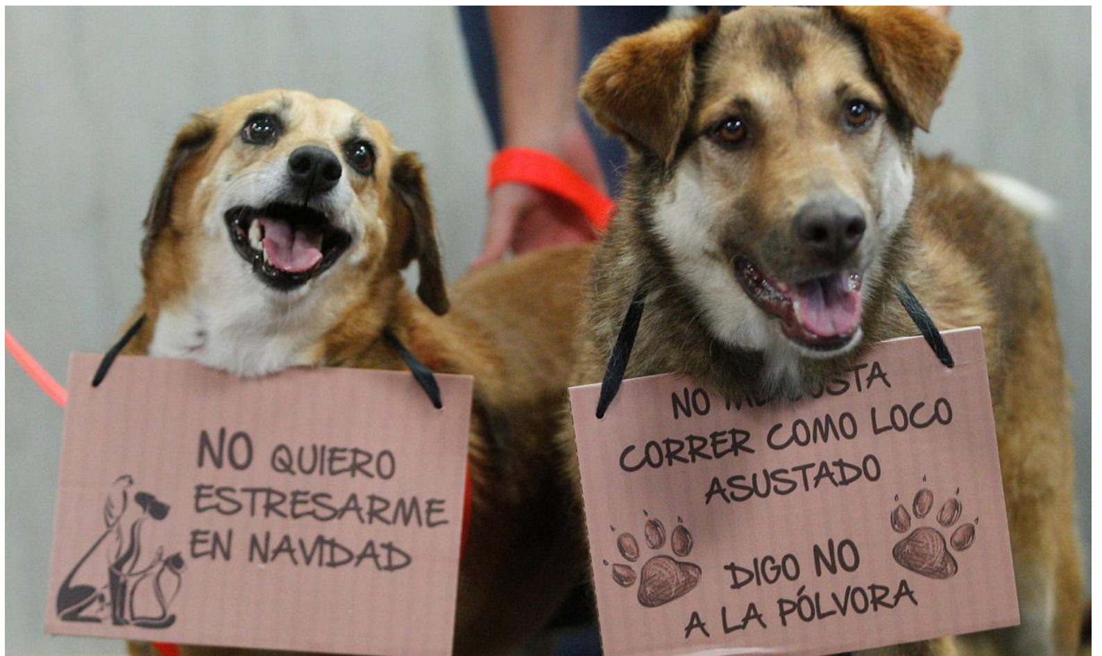
Las autoridades han hecho un llamado para no utilizar pólvora.

Este tipo de alternativas son mucho más seguras para evitar el sufrimiento de los animales y, además, para disminuir otros efectos negativos de los juegos pirotécnicos, como la contaminación del aire y las posibles ame-