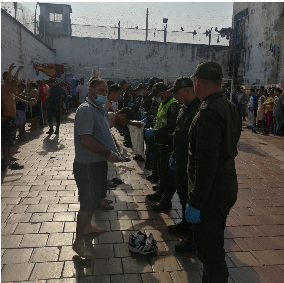
Operativos efectuados en las cárceles, donde encuentran celulares, sim card.

En otras palabras, cada 60 minutos se cometieron 44 hurtos a personas, para un promedio de 1.052 casos diarios, y cada 49 minutos se ejecutó una extorsión en Colombia, para una media de 29 actos cada día.