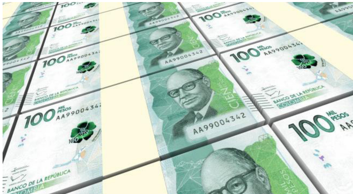
Las centrales obreras proponen un aumento del 18%, mientras que los empresarios no han revelado una cifra concreta. La brecha entre ambas propuestas supera los $100.000.