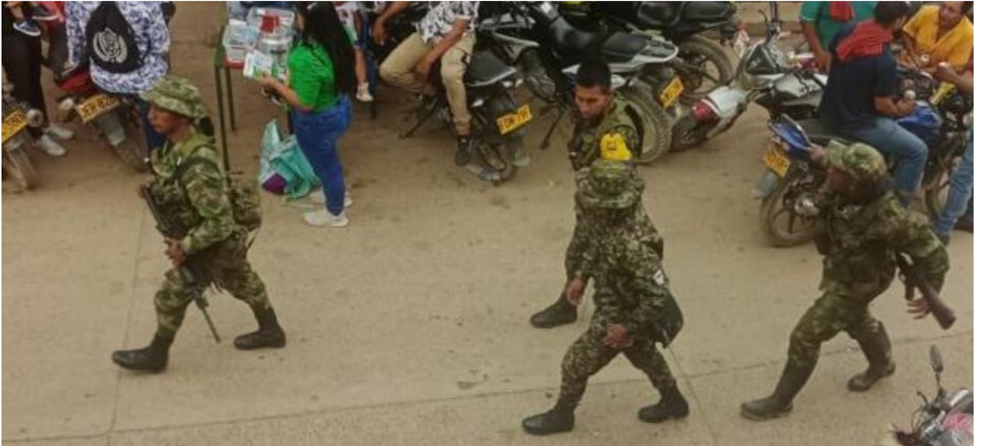
La presencia de disidentes, 'disparó' la extorsión en la región.

■ Una de las hipótesis que tiene la Fiscalía Seccional-Huila, frente al alza de los índices de extorsión en la región, es la presencia de los grupos organizados al margen de la ley en el departamento. De este flagelo, nadie se escapa, ahora estarían siendo víctimas los comerciantes minoristas.