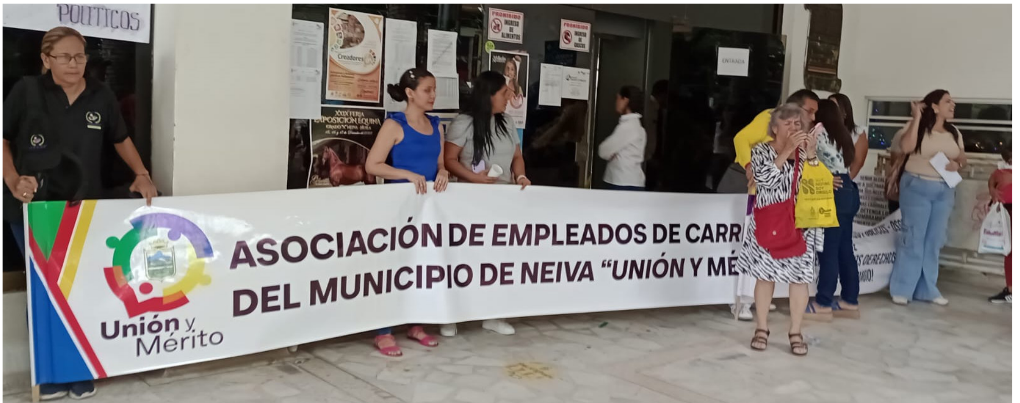
Con pancartas los trabajadores protestaron en la Alcaldía de Neiva.