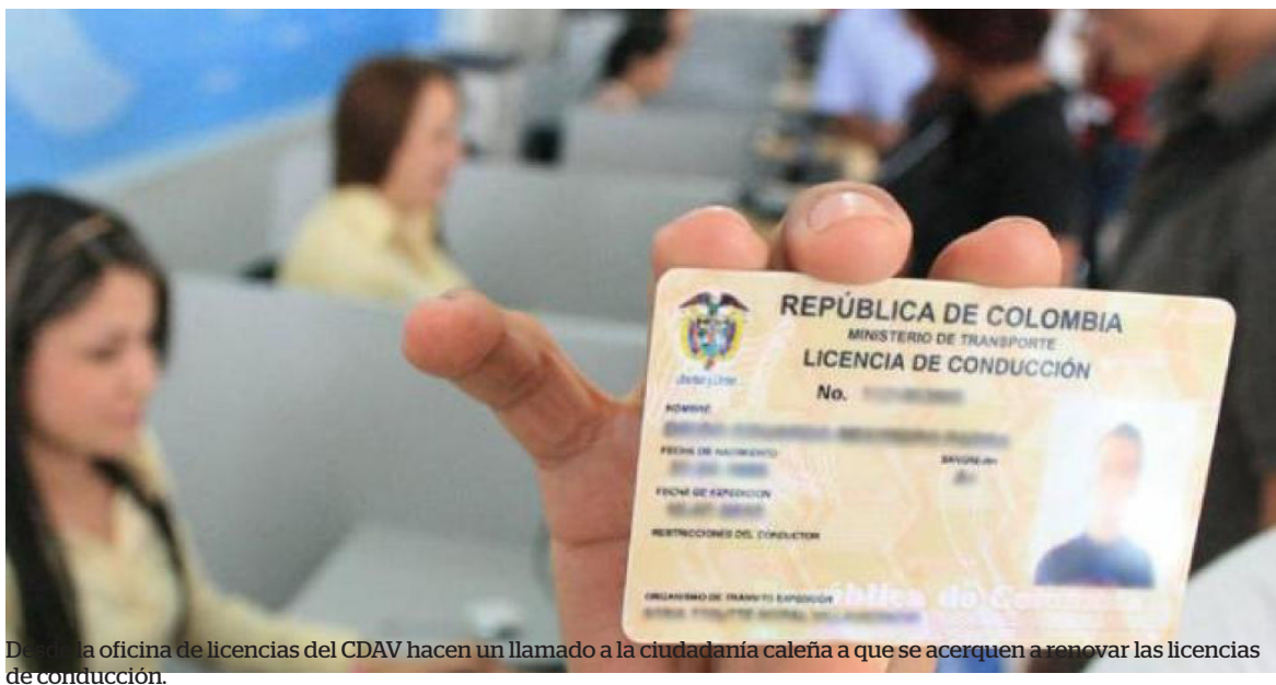
Desde la oficina de licencias del CDAV hacen un llamado a la ciudadanía caleña a que se acerquen a renovar las licencias de conducción.

"Buscamos que el Gobierno nacional reglamente incentivos económicos en el trámite de renovación de la licencia cuando los conductores presenten buen comportamiento en seguridad vial", comentó el congresista autor del proyecto.