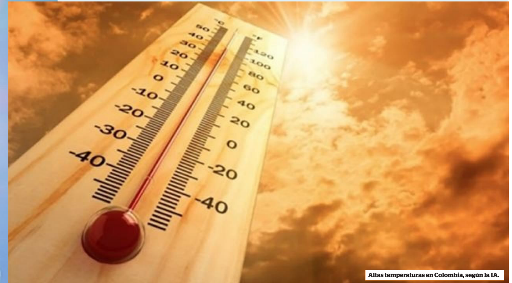
Altas temperaturas en Colombia, según la IA.

La entidad habló sobre los fenómenos meteorológicos que afectan a gran parte del territorio nacional y explicó cuáles serán sus efectos en los próximos meses.