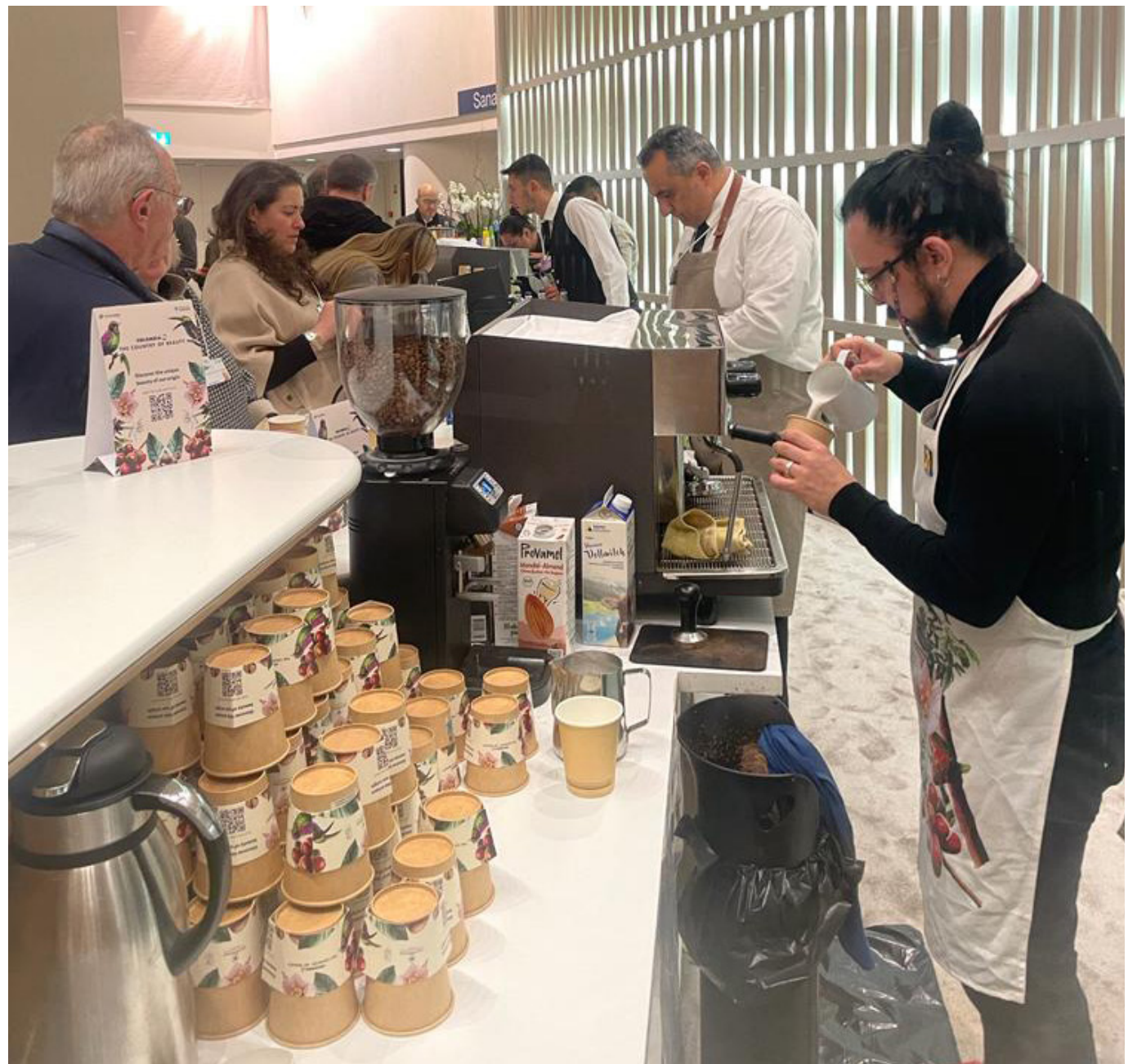
La entidad dijo que responde a la instrucción del jefe de Estado de trabajar en propósitos comunes para el país.

La entidad, que pagó más de $4.580 millones por el alquiler de la propiedad y su amoblamiento, además de la renta del automotor, explicó en siete puntos los propósitos de esta inversión, como la denominaron.