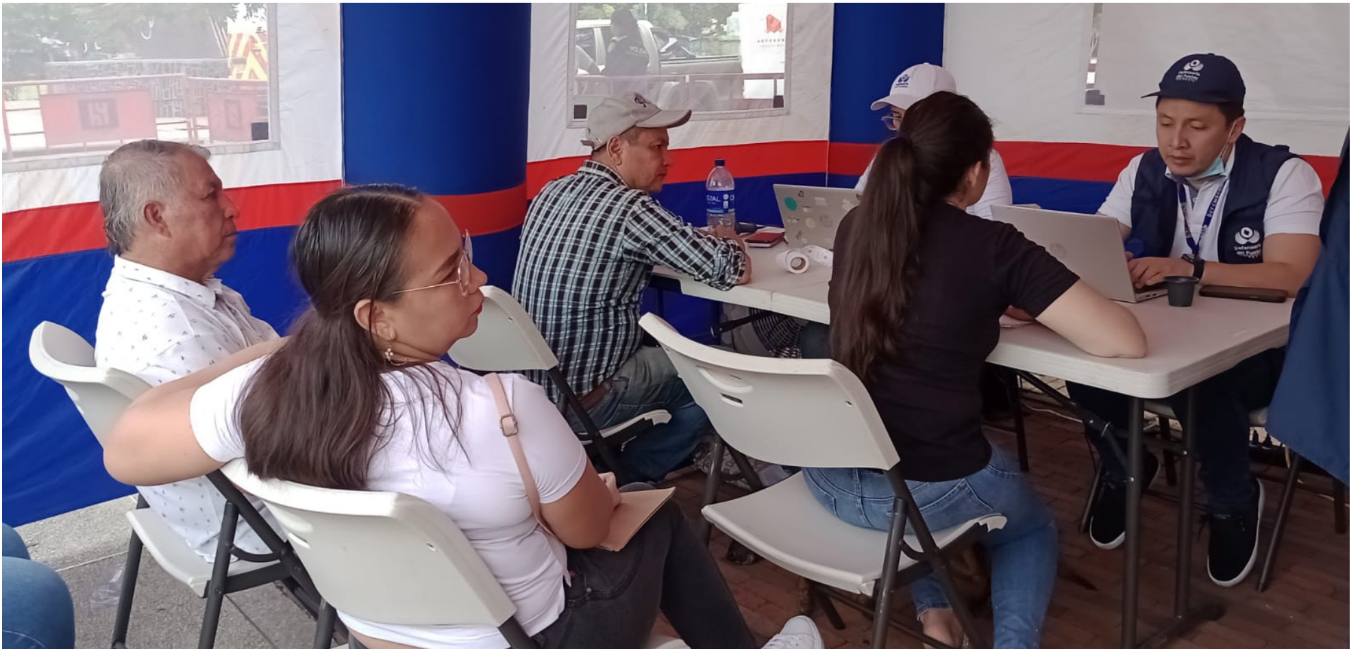
La jornada buscó atender entre 400 y 500 personas.

■ La apuesta del defensor del Pueblo, Carlos Camargo, es de llevar la entidad a los distintos territorios del país. Y las principales quejas de los huilenses, se dan por la mala atención del servicio de salud en temas como la entrega de medicamentos, prestación asistencial y citas médicas.