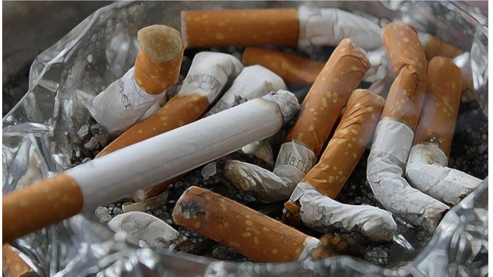
En 2022, uno de cada cinco adultos en todo el mundo eran fumadores o consumían otros productos derivados del tabaco, comparado con uno de cada tres en 2000, indicó la OMS.

Se calcula que el tabaco mata actualmente a más de ocho millones de personas cada año, incluyendo a 1,3 millones de lo que se denominan fumadores pasivos,