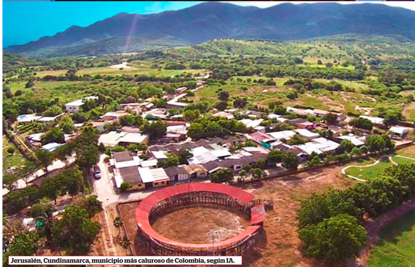
Jerusalén, Cundinamarca, municipio más caluroso de Colombia, según IA.

En el panorama actual, es vital que turistas y residentes consulten regularmente los datos meteorológicos actualizados para obtener información precisa sobre las temperaturas en estas áreas. El conocimiento de estas cifras cobra especial importancia para las actividades diarias y la planificación de viajes, especialmente en regiones con temperaturas elevadas que pueden afectar la salud, especialmente en los viajeros.