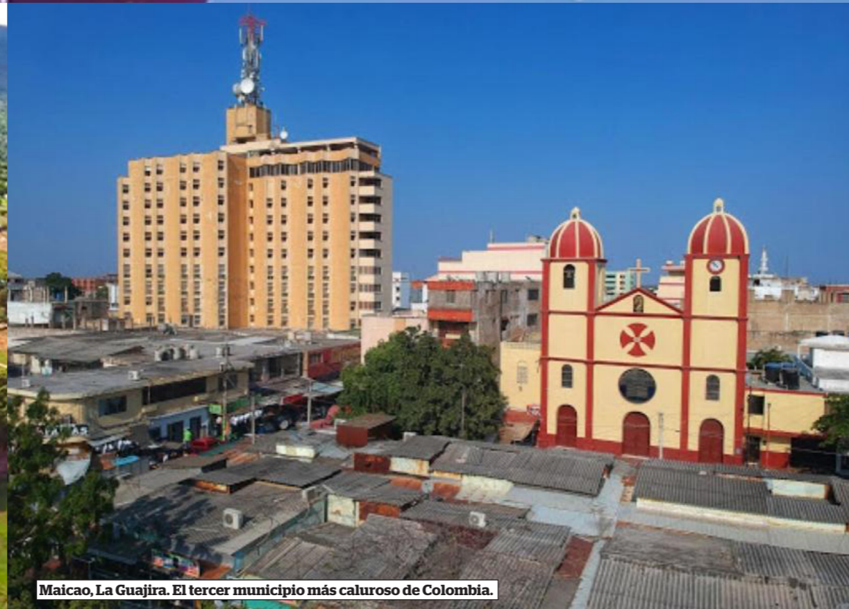
Maicao, La Guajira. El tercer municipio más caluroso de Colombia.