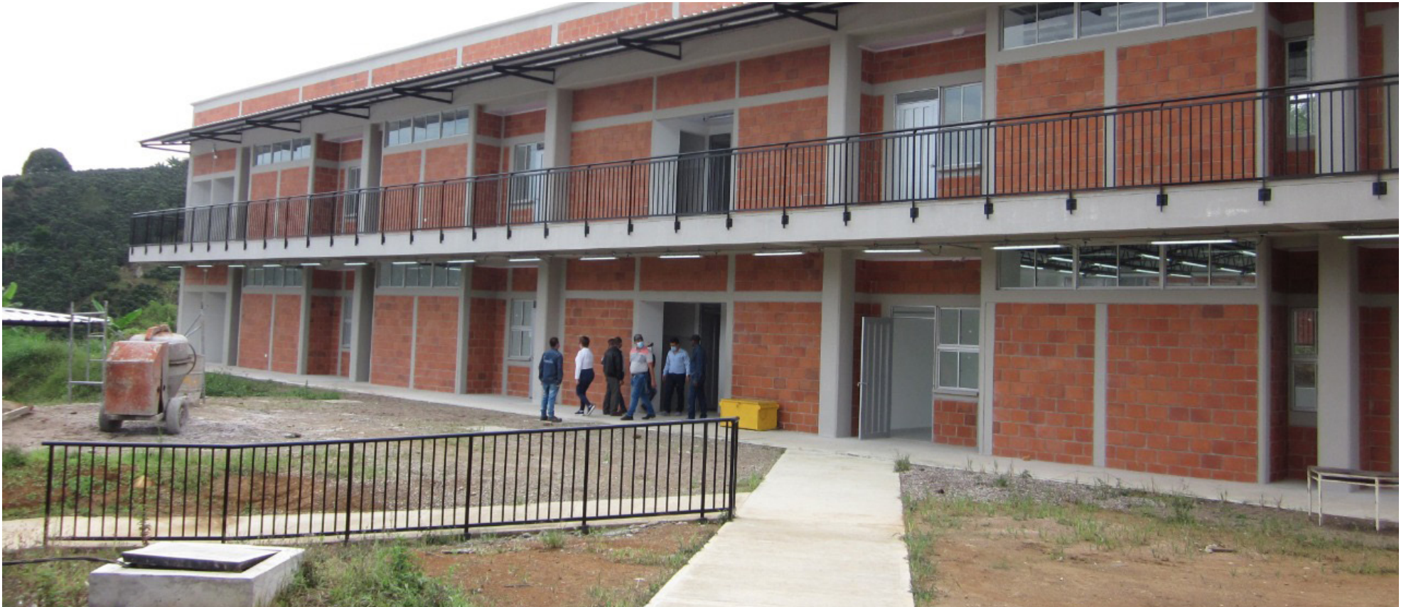
Estudiantes afrontan dificultades en aulas con carencias de infraestructura y escasez de docentes durante el inicio del calendario académico 2024 en el Huila.

■ Problemas de infraestructura, falta de docentes y un PAE retrasado, son algunos de los contratiempos que ha tenido el regreso a clases durante esta semana. Según la Asociación de Institutores Huilenses, ADIH, los nuevos gobiernos deben empezar a subsanar estas falencias para brindar una educación de calidad.