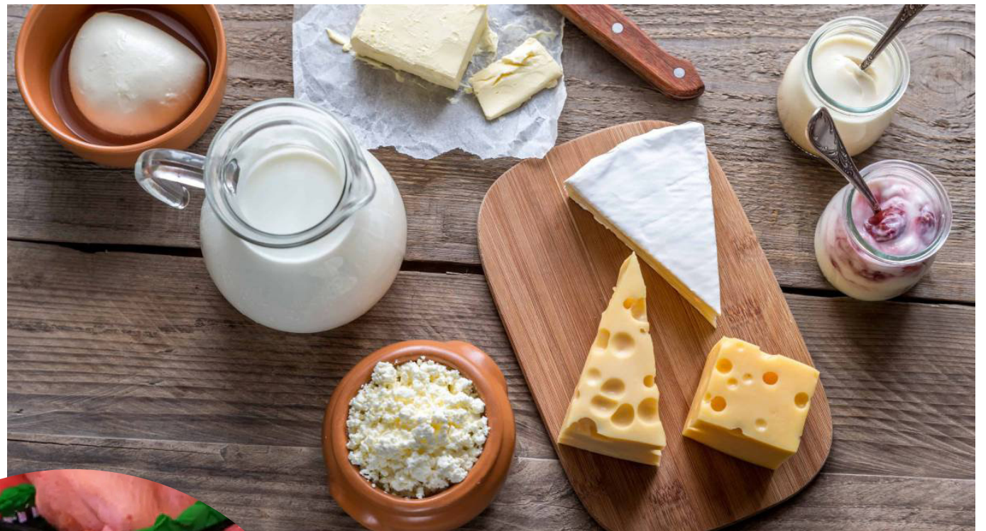
Algunos alimentos presentaron fluctuaciones importantes en diciembre, según lo reportado por el Dane.

Ahora, la leche también sería otro producto beneficiado y que hace parte de cientos de comidas que los colombianos consumen a diario.