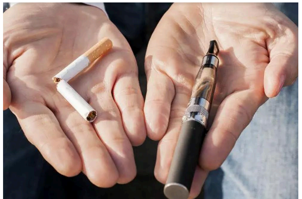
Aunque la cantidad de fumadores disminuye en la mayoría de países, la OMS alertó sin embargo que las enfermedades asociadas al tabaco pueden seguir siendo altas durante algunos años.

El número de adultos que consumen tabaco viene cayendo de manera constante en los últimos años en el mundo, informó el martes la Organización Mundial de la Salud (OMS), aunque advirtió que la industria del tabaco lucha por revertir la tendencia.