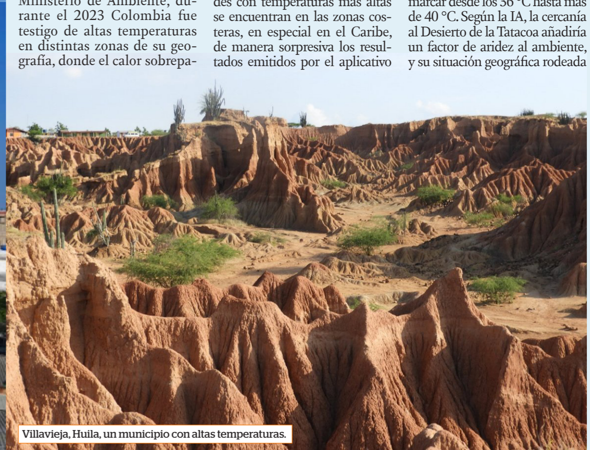
Villavieja, Huila, un municipio con altas temperaturas.