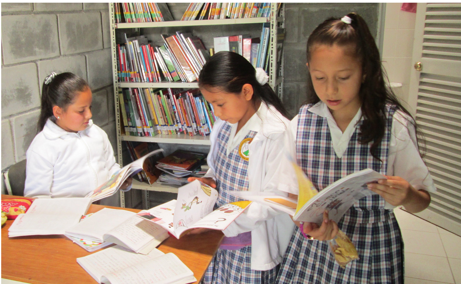
Docentes ganadores de concursos en el Huila expresan su frustración por la demora en los actos administrativos y posesiones, exigiendo respeto a sus derechos laborales.

La denuncia destaca la urgente necesidad de que se respeten los resultados del concurso y se materialicen los actos administrativos correspondientes, permitiendo así que los docentes ganadores asuman sus responsabilidades en las instituciones educativas de manera oportuna.