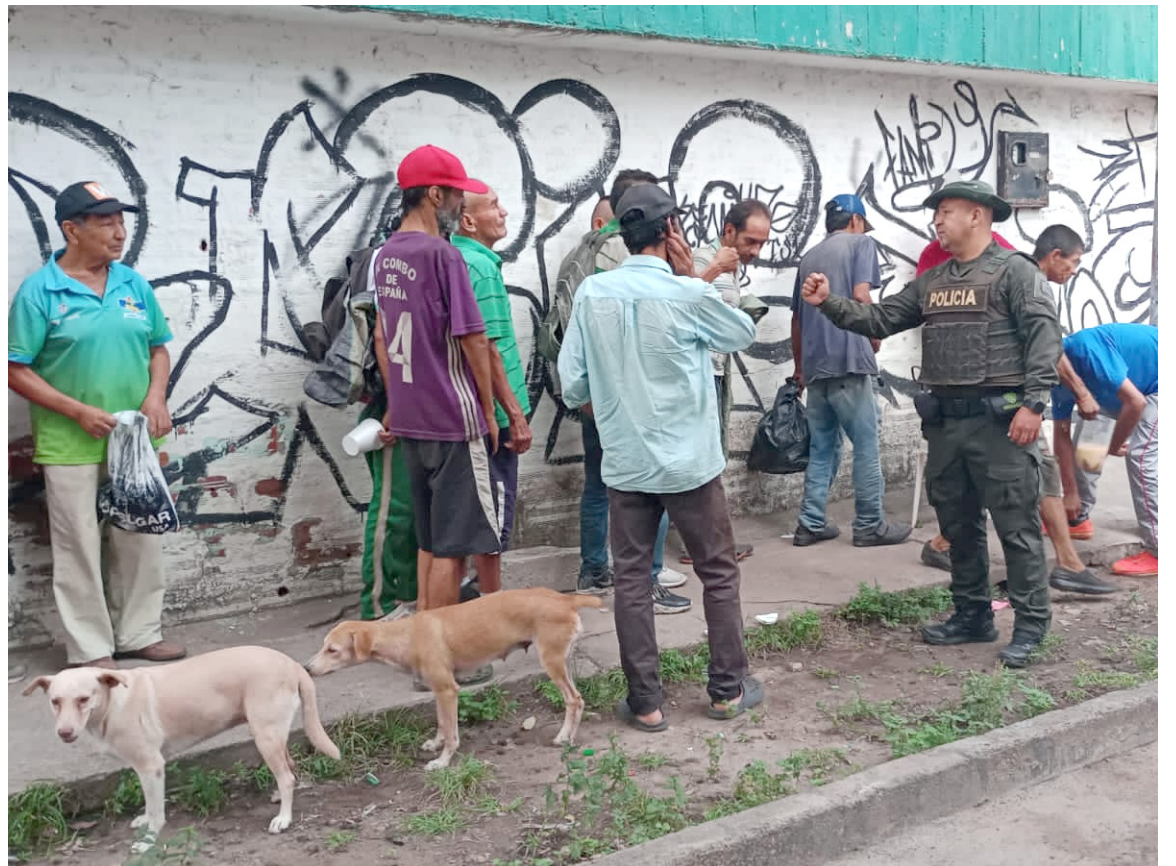
La Policía Metropolitana de Neiva, en cabeza del Grupo Antinarcóticos de la Región # 2 y con la secretaria de desarrollo social programa casa de apoyo al habitante en condición de calle de la alcaldía de Neiva.