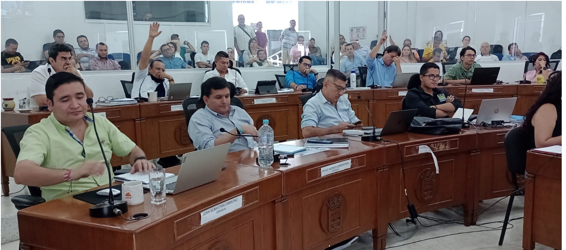
Debate de control político en el Concejo, sobre el Setp.