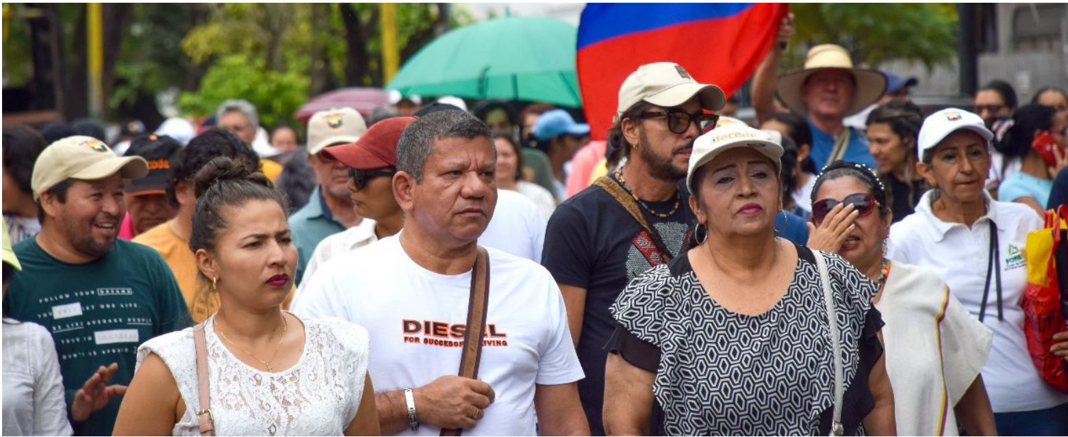
Protesta realizada en 2023 por los docentes pidiendo una mejor salud.

También los profesionales de la entidad, se encuentran atendiendo problemáticas relacionadas con vivienda, educación, género, conflicto armado y víctimas.