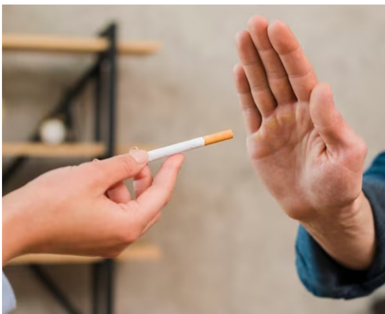
Aunque la cantidad de fumadores disminuye en la mayoría de países, la OMS alertó sin embargo que las enfermedades asociadas al tabaco pueden seguir siendo altas durante algunos años.

“Se reporta uso regular de los productos entre jóvenes, facilidad para adquirirlos y poca preocupación por volverse adicto”, acotó el informe.