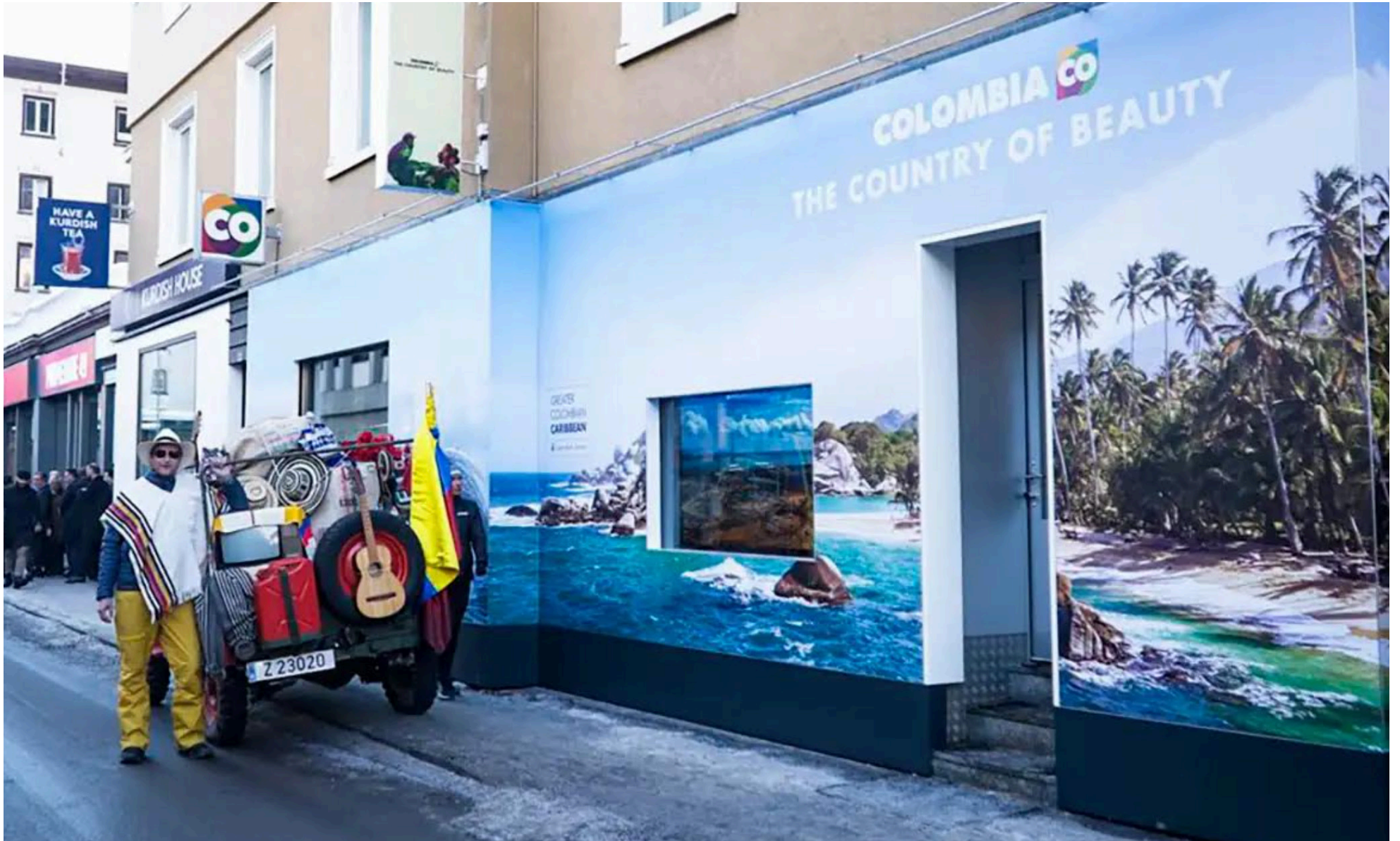
La Casa Colombia, ubicada en Davos, Suiza, tiene el mensaje "Colombia the country of beauty" (Colombia país de la belleza) en su fachada.

■ La entidad encargada de fomentar exportaciones colombianas, el turismo internacional, la inversión extranjera y la marca país, emitió un comunicado en el que se refiere al contrato que generó controversia, tras conocerse que costó cerca de $4.580 millones.