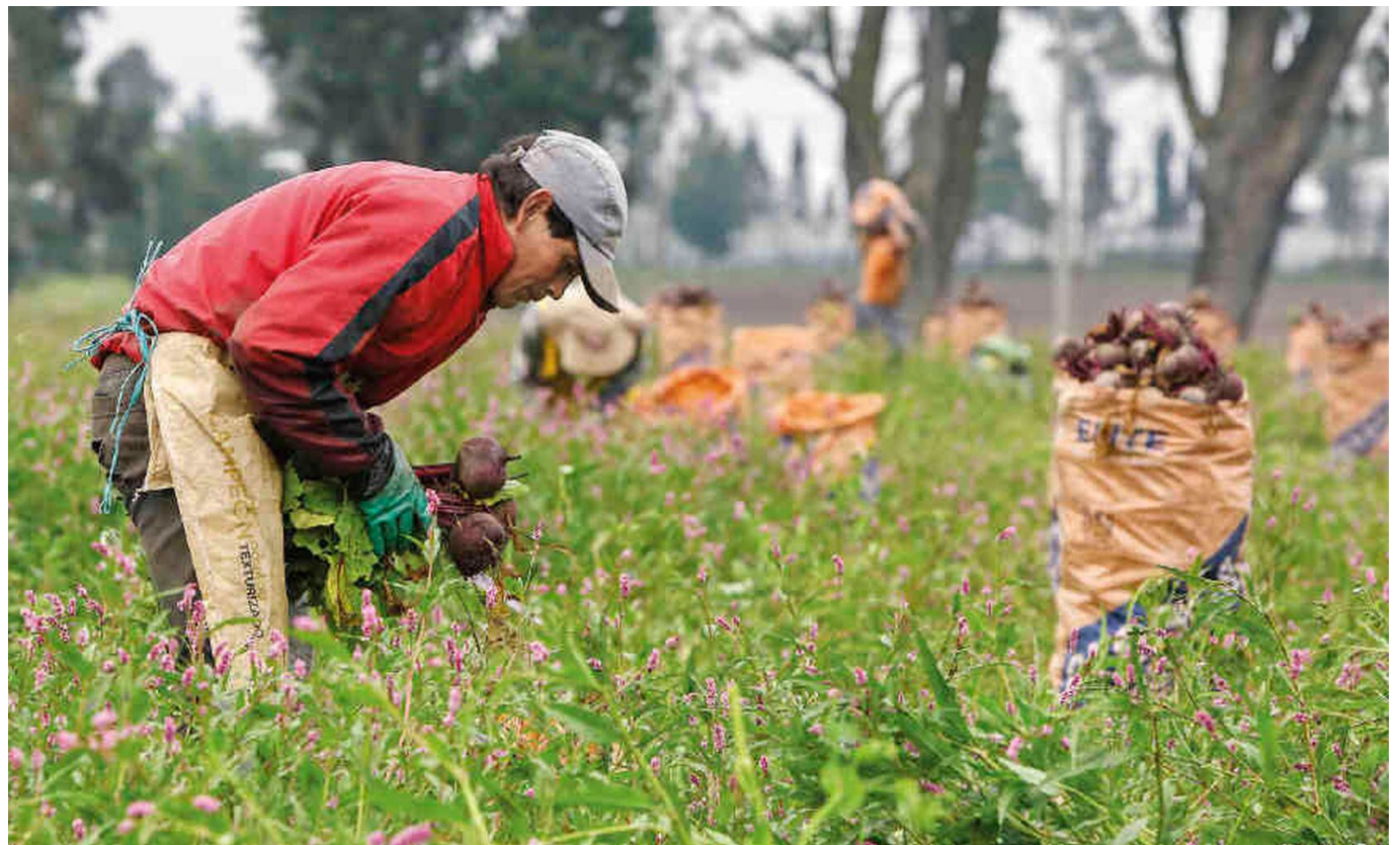
El sector agropecuario lidera el repunte económico con un crecimiento del 8,36%, según el informe del Dane en noviembre de 2023.

La economía colombiana logra esquivar la amenaza de recesión, alcanzando un crecimiento del 2,3% anual en noviembre de 2023, según informe reciente del Departamento Administrativo Nacional de Estadística Dane.