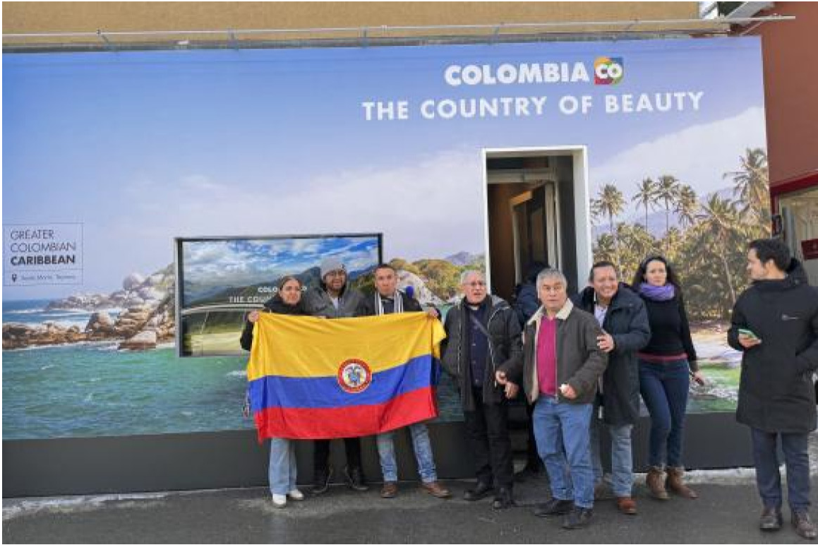
El presidente de la República, Gustavo Petro, visitó la Casa Colombia en Davos.