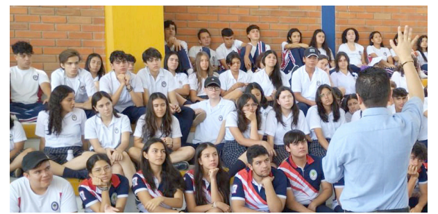
Comunidad educativa marcha contra la Ruta 45