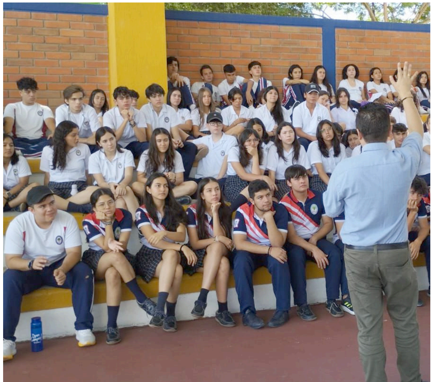
Desde las 7:20 a.m., estudiantes y la comunidad educativa junto con habitantes de la vereda Arenoso, llevarán a cabo la manifestación.

Según el Director Administrativo y fundador de la institución, existen diversas alternativas para mitigar los impactos de la ampliación de la vía, y se espera que se consideren opciones más razonables y equitativas.