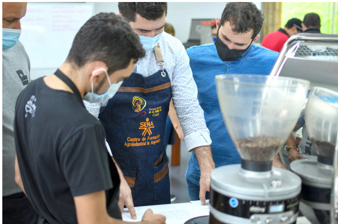
En Pitalito se ha enfocado en fortalecer el sector cafetero, brindar capacitación y apoyo técnico a los productores de café.

Entre tanto, señaló que "en Garzón, se ha trabajado en el fortalecimiento del sector cafetero y turístico. El proyecto busca impulsar la calidad y la productividad del café, así como promover el turismo sostenible en la zona,