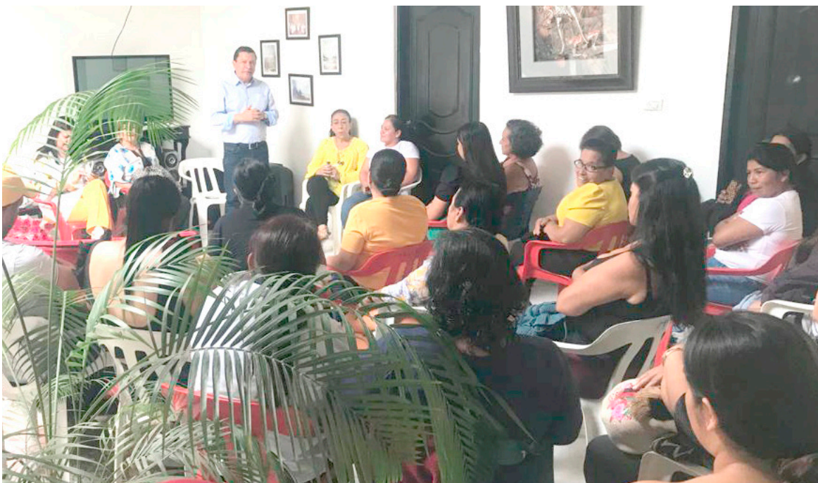
El candidato viene socializando sus propuestas y proyectos con la comunidad.