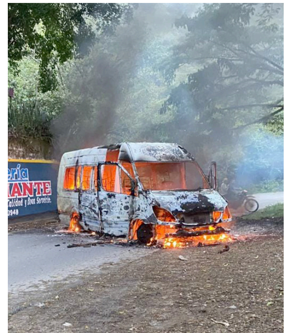
El vehículo fue incinerado en la vía Algeciras - Campoalegre.

■ Presuntas disidencias habrían incinerado un bus de una empresa de transporte, como retaliaciones ante la negativa de pagar cobros extorsivos, de los que vendrían siendo víctimas en Algeciras.