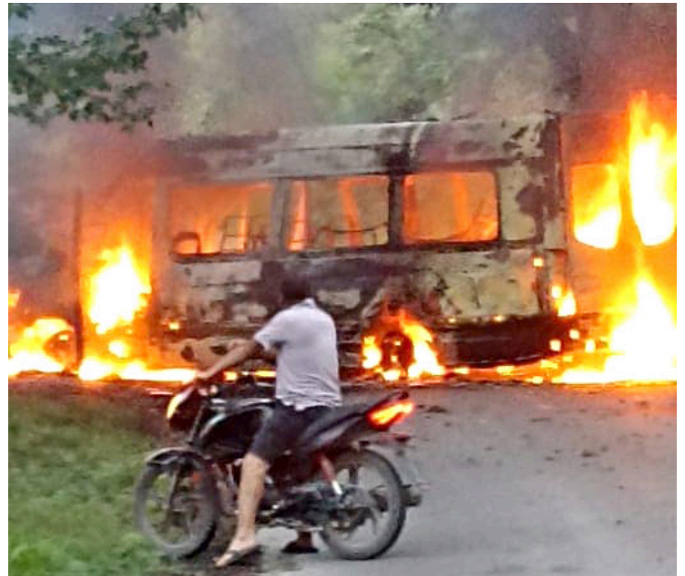
En el hecho no resultaron personas heridas.

al fuego. Afortunadamente, no se reportaron heridos.