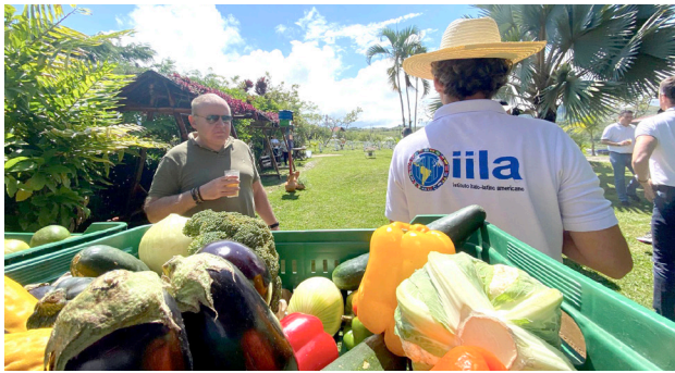
La paz desde la agricultura y el turismo