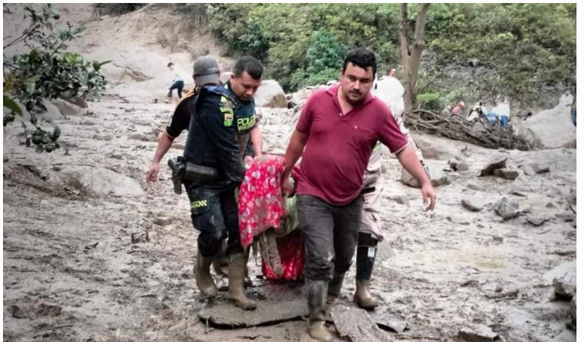
El gobernador de Cundinamarca confirmó que el número de muertos ha aumentado a 14 como consecuencia de la trágica avalancha que golpeó el municipio de Quetame. La cifra revela la magnitud del desastre que ha afectado a la región.