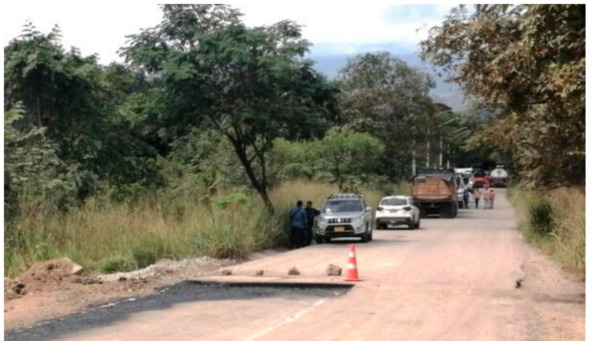
La comunidad pide patrullajes policiales.

Aproximadamente se producen más de 900 casos de robo al día en el país, según las cifras proporcionadas por la Policía. Hasta el momento, las ciudades con mayor número de casos reportados en 2023 son Bogotá, con más de 35 mil casos, Cali, con más de cinco mil delitos, y Medellín en Antioquia.