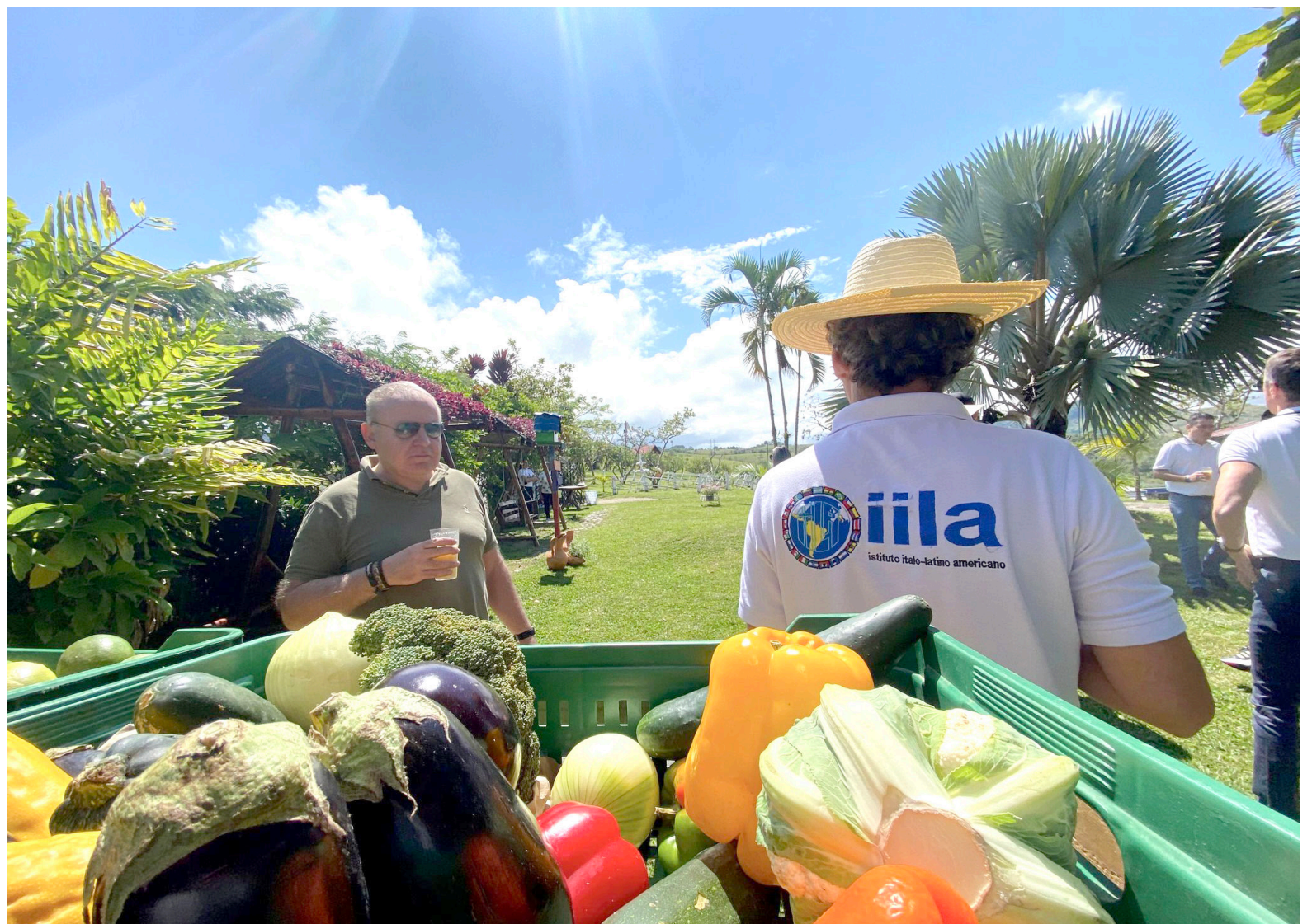
El objetivo de este proyecto es fomentar el desarrollo sostenible y una mayor inclusión social en Huila, Cauca y Antioquia, territorios que han sufrido por el conflicto armado.

“El trabajo conjunto y el enfoque en el desarrollo sostenible y la inclusión social han sido fundamentales para impulsar la consolidación de la paz en el departamento del Huila. Con cada avance, se está construyendo un futuro más próspero y equitativo para las comunidades locales, demostrando el poder transformador de la agricultura y el turismo sostenibles”, dijo.