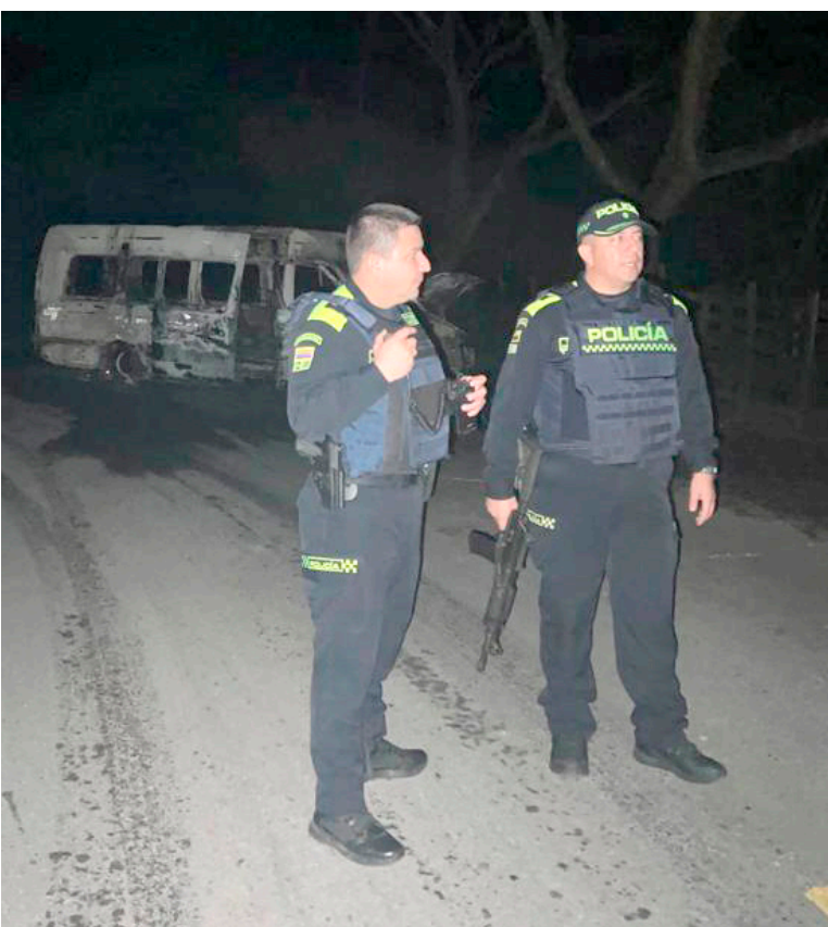
Las autoridades llegaron al lugar.

Se trataría del frente 'Javier Díaz' de las disidencias de las Farc, quienes venían en el bus,