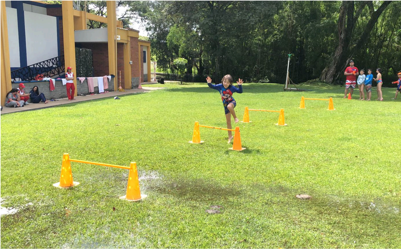
Uno de los espacios que más resultarían afectados sería la cancha deportiva, el punto de encuentro en caso de emergencia y un mariposario.

conservación y protección del entorno”, dice.