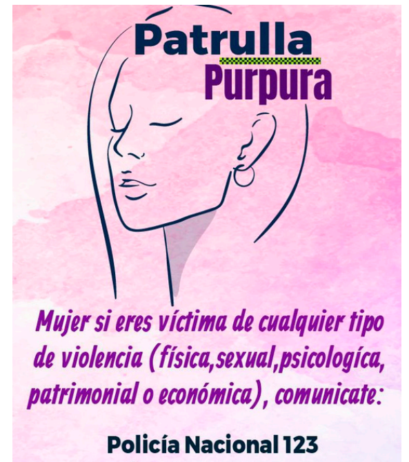
Línea de atención a las víctimas.

tar que sigan ocurriendo. “Si intervenimos de manera oportuna, estaríamos evitando, incluso, un feminicidio”, señaló el director. Esto quiere decir que entre más se priorice la investigación penal en este delito, menores serán las