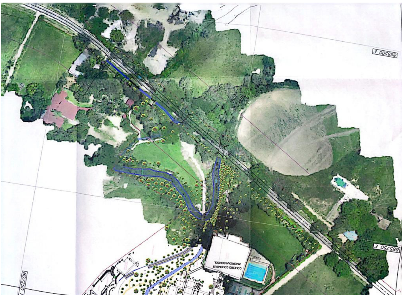
Así se encuentran distribuido el Colegio, según los planos entregados al Diario del Huila.

Asegurando también que las consecuencias de esta situación irían más allá de la pérdida de espacios y la alteración del drenaje de los pozos y las áreas deportivas. “El colegio ha trabajado arduamente en la preservación del entorno natural, logrando recuperar un valioso ambiente biótico. Sin embargo, si se les aplica esta nueva normativa, se verían afectados no solo los aspectos físicos de la institución, sino también los avances logrados en términos de