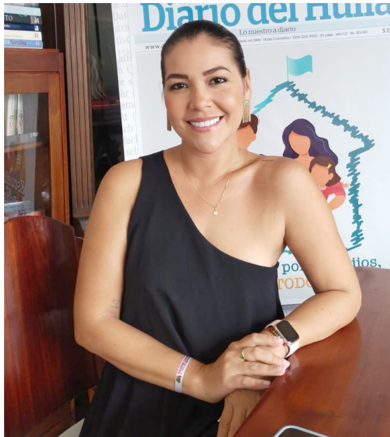
La Comunidad de las mujeres Bitá, candidata al Concejo de Neiva.