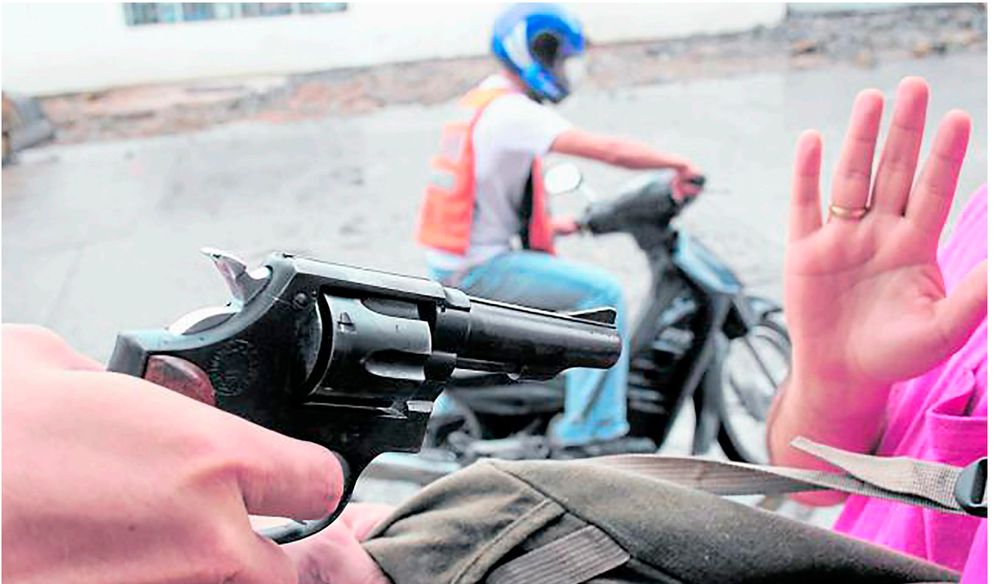
La ciudadanía tiene identificada a una pareja que se dedica al atraco.