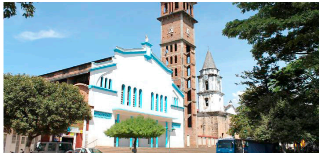
Palermunos no aguantan más la inseguridad