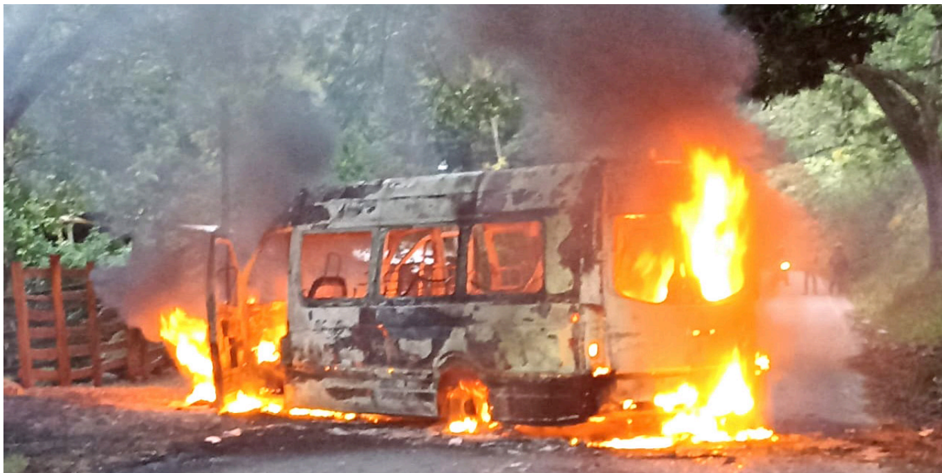
El bus afectado pertenece a la empresa de transporte Coomotor.