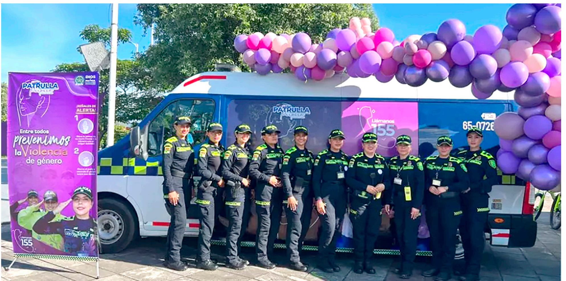
La patrulla púrpura se encarga de atender las denuncias.

“En cuanto a las conductas que afectan a las mujeres y niños, estamos comprometidos en este tipo de delitos. Hemos resuelto el 60% de los casos relacionados con delitos sexuales en el área metropolitana de Neiva, contra el 37.50% de casos resueltos en el 2022. Y el 98.5% de los delitos