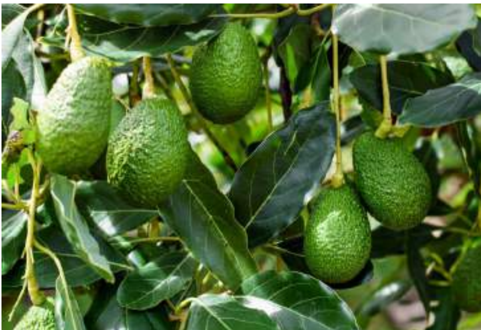
El aguacate se viene consolidando como uno de los productos más rentables del sector de ago en el departamento.

“Hoy estamos haciendo un ejercicio en articulación con el ICA, la Gobernación del Huila, La Cámara de Comercio, Procolombia y los productores, para analizar el mercado y las oportunidades que tiene el aguacate principalmente en los mercados de exportación. Hoy en día el aguacate no es tema de un gremio, una entidad, o un productor, es una apuesta productiva del país, y por ende un tema de relevancia para la nación, y estamos demostrando que es una gran alternativa para muchos de los caficultores que tienen la necesidad de diversificar sus cultivos, y una nueva oportunidad de ingresos para sus fincas”, puntualizó.