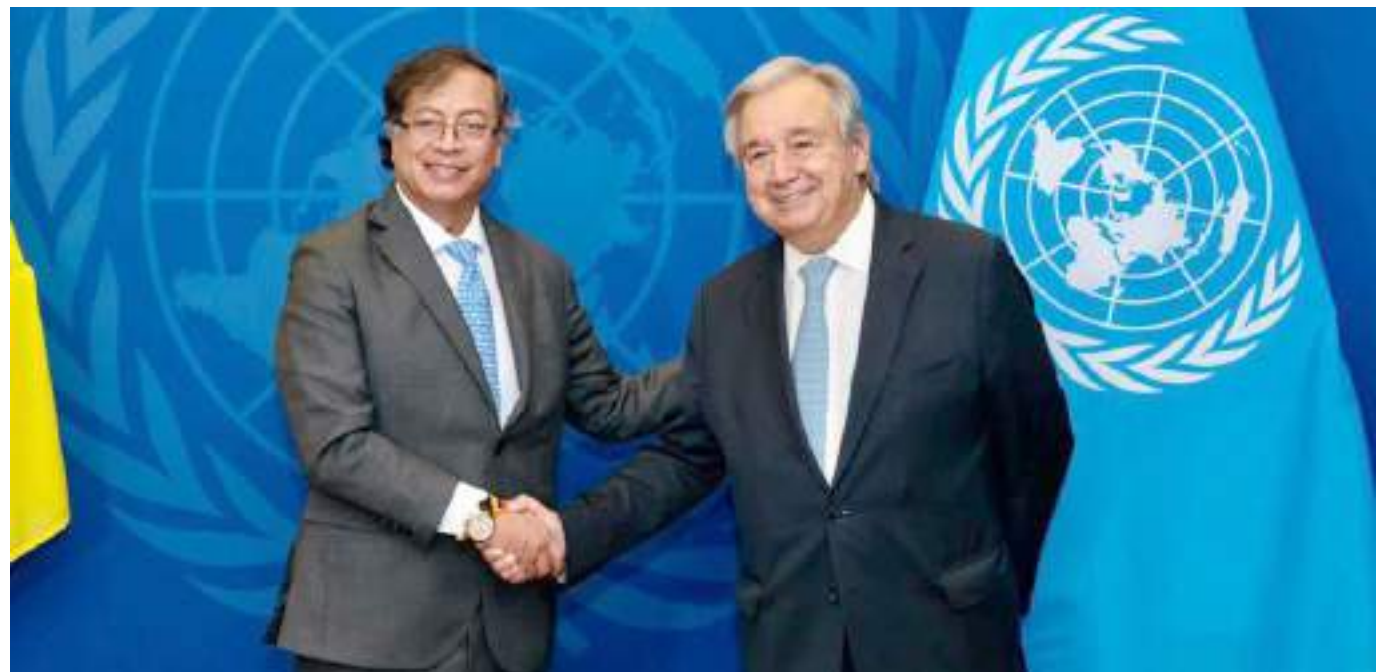
El Presidente Gustavo Petro sostuvo a su llegada una primera reunión bilateral con Antonio Guterres, Secretario General de la ONU.

Se espera que el mandatario enfoque su discurso en la paz total, la transición a las energías renovables y el cambio en la lucha contra el narcotráfico, que han sido algunas de sus banderas en campaña y ahora como líder del país.