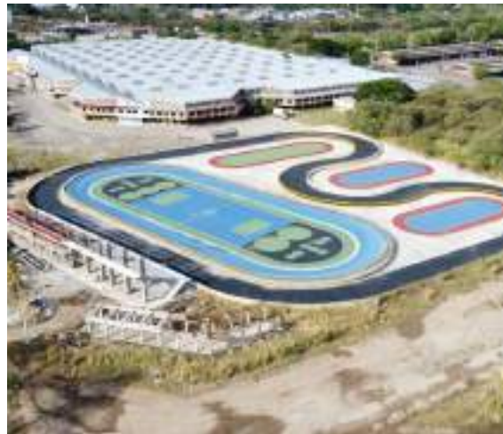
En la terminación de la segunda fase del patinódromo se invertirán $723 millones, la obra está actualmente en un 65% de avance.