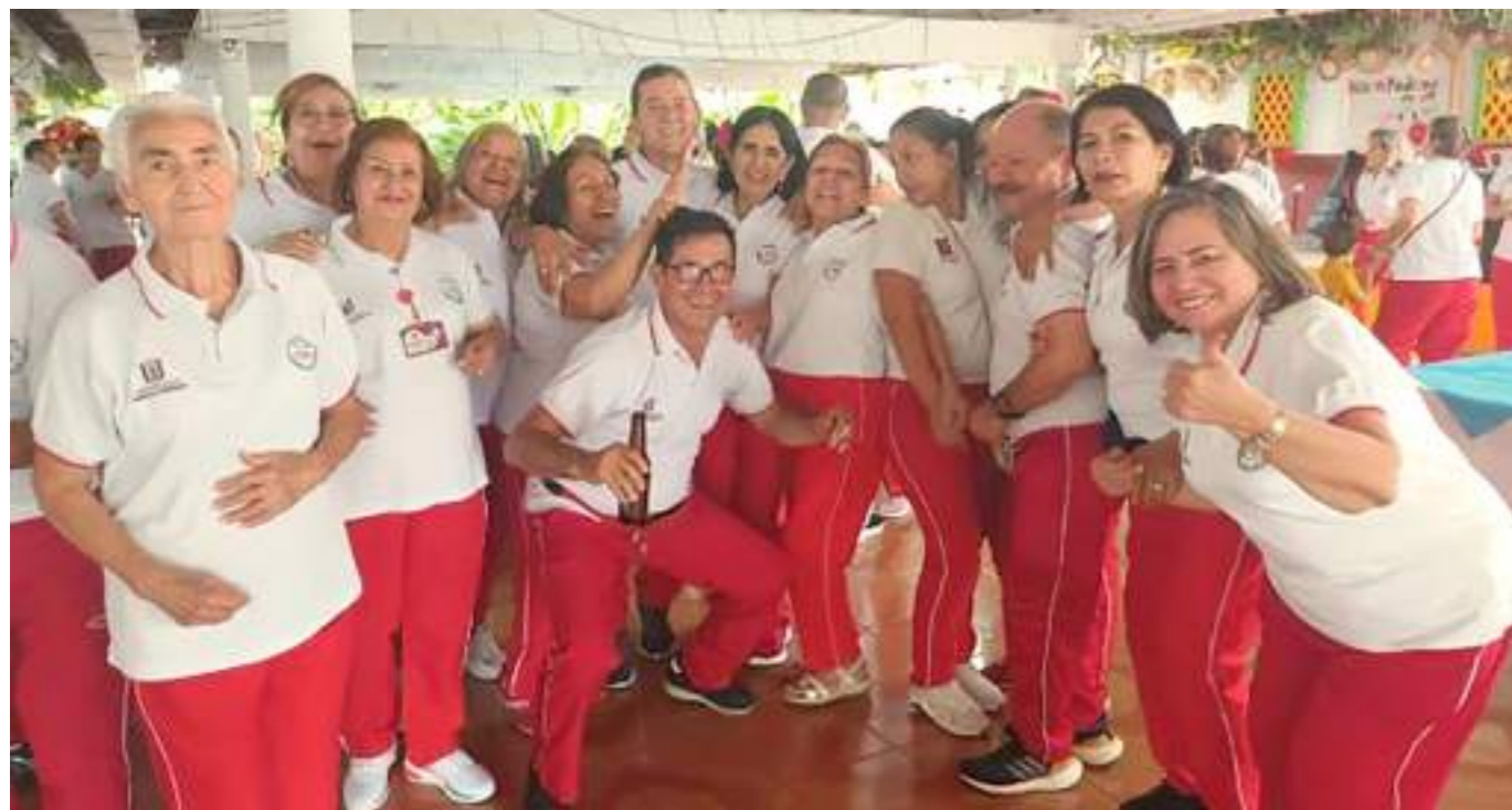
240 adultos mayores celebraron los 22 años del proyecto “Caminemos por la vida”.

■ Hace 22 años, vecinos del barrio Santa Inés, se reunieron con el propósito de hacer actividades físicas y recreativas, para lo que encontraron en la aliada perfecta. Poder por medio del deporte hacerle frente a sus enfermedades y “salir de la rutina” es uno de los propósitos más grandes que tienen.