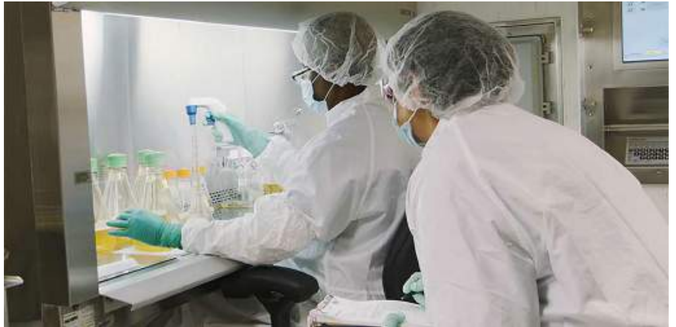
Actualmente, la terapia con anticuerpos monoclonales representa el área de crecimiento más grande de la industria farmacéutica.

“Estos anticuerpos monoclonales de larga duración fueron diseñados específicamente para la prevención y pre exposición para el tratamiento de la Covid-19. La terapia inmunológica lo que hace de alguna forma es dar un ejército armado, a todas las personas que no cuentan con esa defensa natural, para que el organismo se defienda en el momento