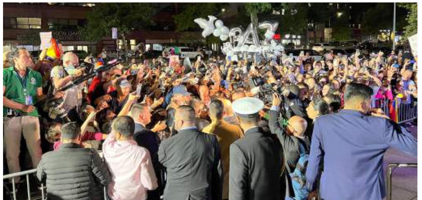
El presidente colombiano tuvo un gran recibimiento en Queens, NYC.

Y entre las personas que lideran las principales carteras del Gobierno, ninguna hizo parte de los partidos o movimientos políticos que avalaron la candidatura de Gustavo Petro como presidente de Colombia y es por esto que Gloria Inés Ramírez, del partido comunista, es la persona que quedó a cargo de la jefatura de Estado.