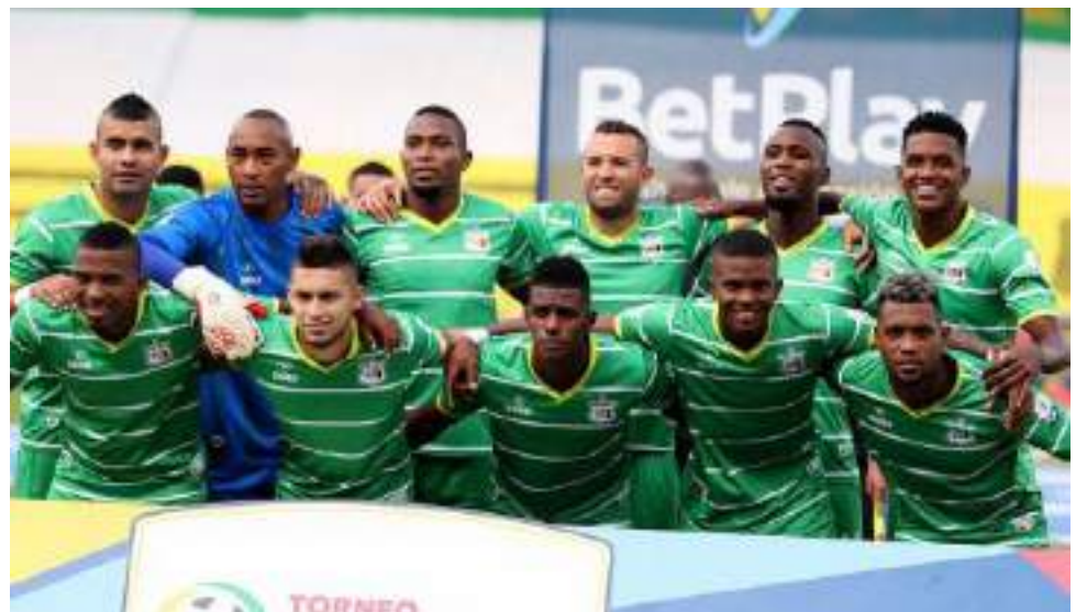
Quindío será el próximo rival del Huila en la fecha 14.

El huila se concentra a partir de esta semana en el juego del martes 27 de septiembre cuando visitará al Quindío en Armenia.