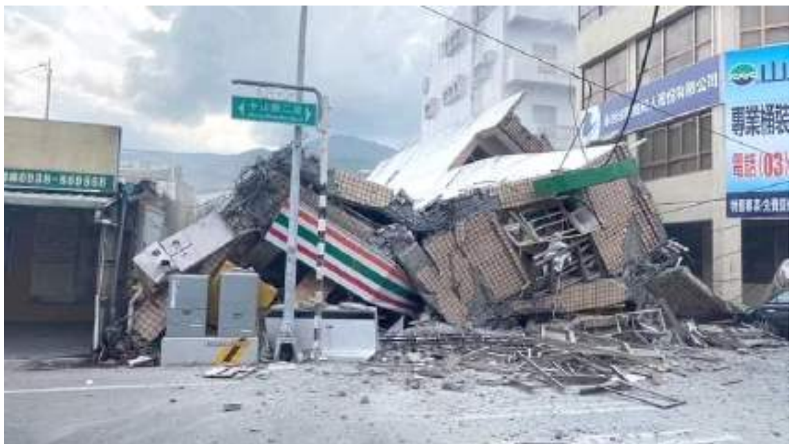
Un terremoto de magnitud 7,2 sacudió este domingo en horas de la tarde el condado de Taitung, en el sureste de Taiwan. De acuerdo con la Oficina Central de Meteorología de la isla, el sismo ocurrió a 7 kilómetros de profundidad a las 14H44 hora local a 42 kilómetros de la ciudad de Taitung, no se ha reportado pérdidas humanas.