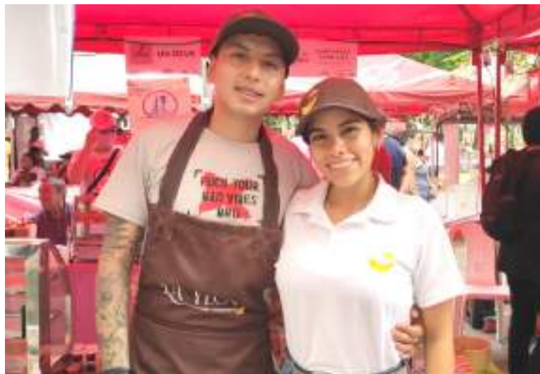
Emprendedores de Neiva pudieron tener una plaza donde mostrar sus productos.