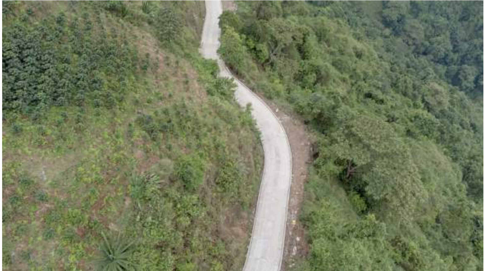
Preocupación en zona rural de Neiva y el Huila por amenazas y extorsión

“Realmente lo que nos tiene preocupados a la población campesina y organizaciones son las amenazas de las que han venido siendo víctimas algunos habitantes de las zonas rurales donde a través de llamadas extorsivas y amenazas, se les exigen altas sumas de dinero y que, si no se les entrega, tomaran represalias contras los familiares. Entonces nosotros lo que estamos haciendo es