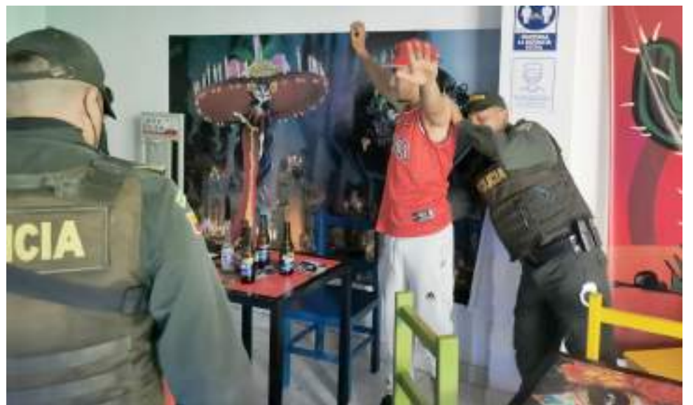
Controles policivos llegados a cabo durante el fin de semana

En cuanto a la aplicación del Código de Convivencia y Seguridad Ciudadana, fueron impuestos 61 órdenes de comparendos por comportamientos contrarios a la convivencia, teniendo como faltas más recurrentes, aquellas que ponen en riesgo la vida e integridad, 40 portar armas, elementos cortantes, punzantes o semejantes, 7 portar o consumir sustancias prohibidas en espacios públicos, 4 por Comprar, alquilar o usar equipo terminal móvil con reporte de hurto y/o extravío, 5 por riña o causar daño a otros, 6 portar armas neumáticas, traumáticas, de aire, de fogeo, de letalidad reducida; cabe resaltar que los municipios con mayor índice de