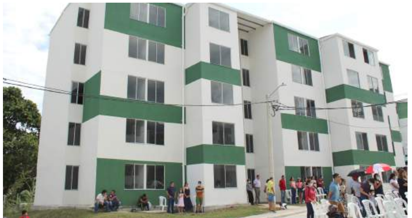
39 familias recibieron casa en el municipio de Rivera.

Hemos beneficiado un total de 210 familias donde el año 2020 pudimos entregar las 100 viviendas gratis y hoy ya en este mes de septiembre del año 2022 estamos haciendo la entrega de las primeras 39 de “Mi Casa Ya”