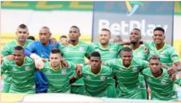
Nuevo triunfo para el Atlético Huila