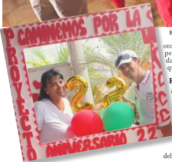
La foto para el recuerdo en los 22 años.

compartimos actividades de ocio como parques, entre otros. Tenemos nuestro kiosquito que le llamamos la ‘casa feliz’, compartimos un tinto, nos integramos, en fin, pasamos un buen momento con nuestra familia de caminemos por la vida”, agregó.