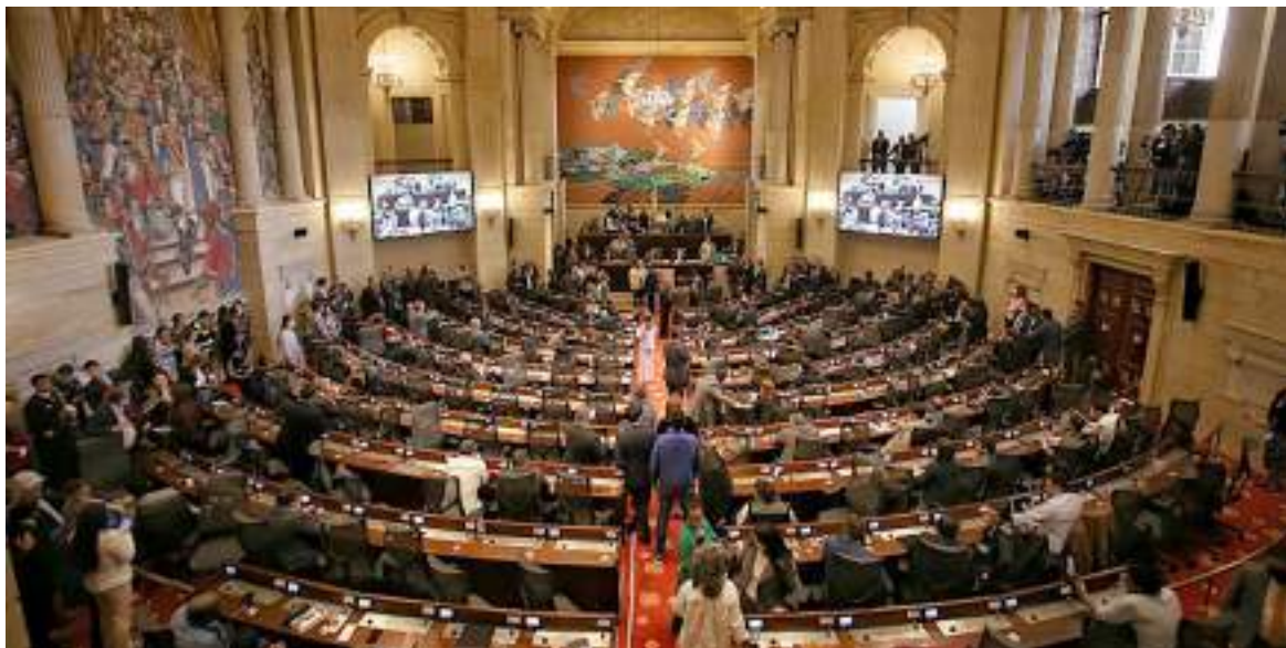
Se contempla en la reforma reducir el receso legislativo para que sea de dos meses y medio y no de cuatro.