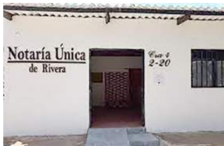
En la Notaría Única de Rivera se podrán hacer escrituras públicas, autenticaciones, declaraciones extrajudiciales, matrimonios civiles, sucesiones, divorcios, entre otros.

La Notaría Única de Rivera tendrá las funciones propias de una notaría como lo son, hacer autenticaciones, declaraciones extrajudiciales, escrituras públicas tales como: venta, donaciones, cancelaciones de gravámenes como hipotecas, cancelación de limitaciones al dominio como: patrimonio de familia, afectación a vivienda familiar, prohibición de enajenar, constitución de hipotecas, de patrimonios de familia, desglores, loteos, reloteos, englobes, sucesiones, divorcios, liquidación de sociedad conyugal y/o patrimonial de hecho, constitución de uniones maritales de hecho, constitución de sociedad patrimonial de he-