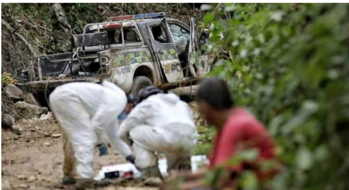
Luego de la vil masacre de los policías en el corregimiento de San Luis, zona rural de Neiva, se han dado a conocer diversos hechos de seguridad pública en Neiva y el Huila.

Argumentó también que, realmente en el departamento no han encontrado respaldo ni siquiera del Ministerio Público, por lo que, espera que a través de estas denuncias públicas se pueda tener un acercamiento y empezar a coordinar una mesa de trabajo en conjunto porque la idea es brindar tranquilidad a las comunidades. Esa falta de trabajo articulado ha generado que las denuncias públicas interpuestas durante los 15 años no hayan prosperado y no hayan recibido el apoyo idóneo para el campesinado huilense.