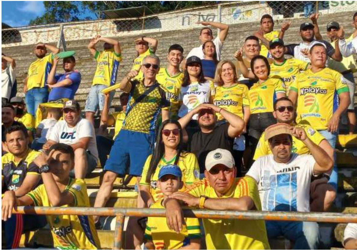
Huila se mantiene en el grupo de los ocho del Torneo Betplay.