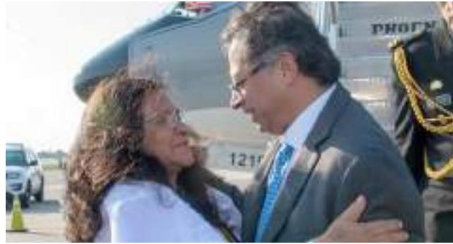
Petro en la ONU