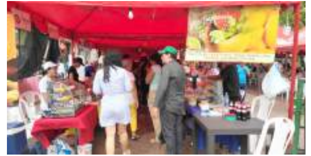
40mil neivanos se sumaron al 'Festival de la Empanada'