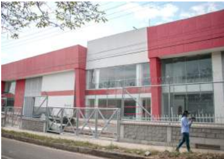
El CAIMI necesitaba recursos por $1.600 millones para su terminación.

Las obras de la primera fase del CAIMI y de la segunda fase del patinódromo en Neiva podrán finalizarse este mismo año, según indicó la Administración Municipal tras lograr el cierre financiero para las mismas. Los dineros son recursos del empréstito que le autorizó el Concejo al Municipio por $60.000 millones de los cuales $1.600 millones son para el CAIMI y $723 millones para el patinódromo.