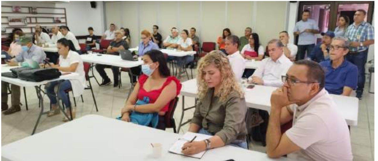
Las mesas de trabajo que se vienen realizando.

De ahí el interés del gobierno “Huila Crece” en apoyar los procesos de certificación de la mano de entidades como el ICA, Asohfrucol, Procolombia, y otros aliados estratégicos, lo que no solo permitiría el ingreso de la fruta huilense a mercados internacionales, sino mejores precios para los productores, una tarea en la que ya se viene avanzando como lo explica el secretario técnico de la cadena del