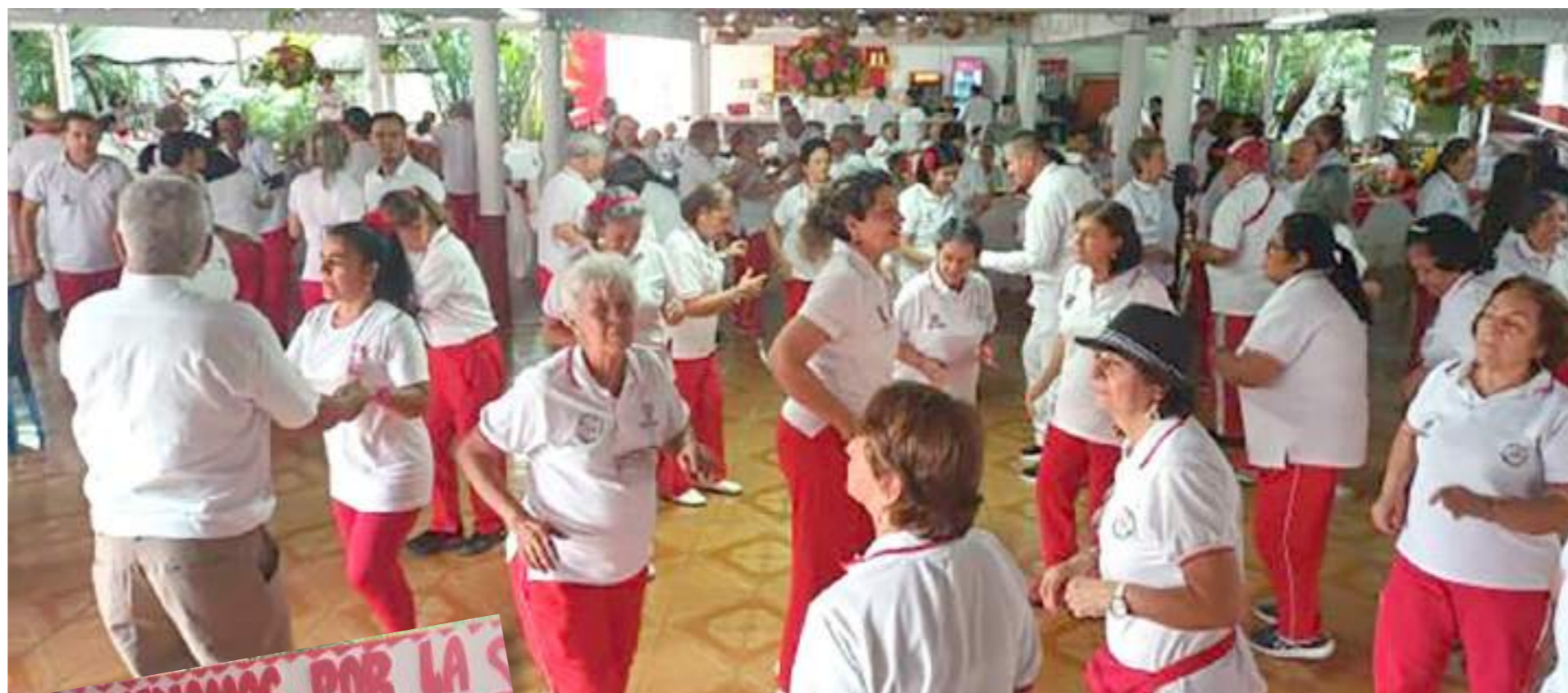
Baile en el marco de la celebración.

El pasado 12 de septiembre se cumplieron 22 años desde que varios adultos mayores, vecinos del barrio Santa Inés, se reunieron con el propósito de hacer actividades físicas para el aprovechamiento del tiempo libre.