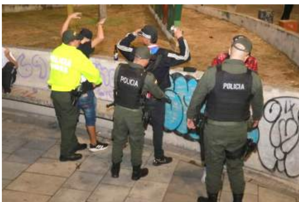
Durante los patrullajes se están haciendo todos los controles respectivos para la identificación de las personas.

La estrategia busca impactar los principales delitos que aquejan a la ciudad como lo son el hurto a personas, residencias y vehículos, pero tam-