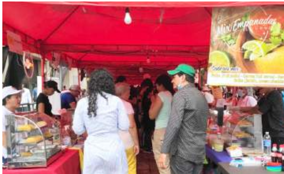
La empanada de diversos sabores, colores, formas, tamaños y precios, fue la protagonista durante este fin de semana en la ciudad de Neiva.

Este año incrementó el número de emprendedores y se realizó en un lugar diferente, lo que sig-