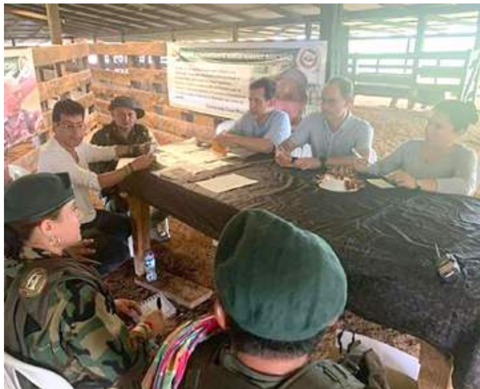
Reunión entre el Gobierno Nacional y jefes de las disidencias de las FARC

Según un comunicado conjunto que se emitió tras el encuentro, ambas partes coincidieron en la voluntad de negociar y que se necesita un cese al fuego bilateral para