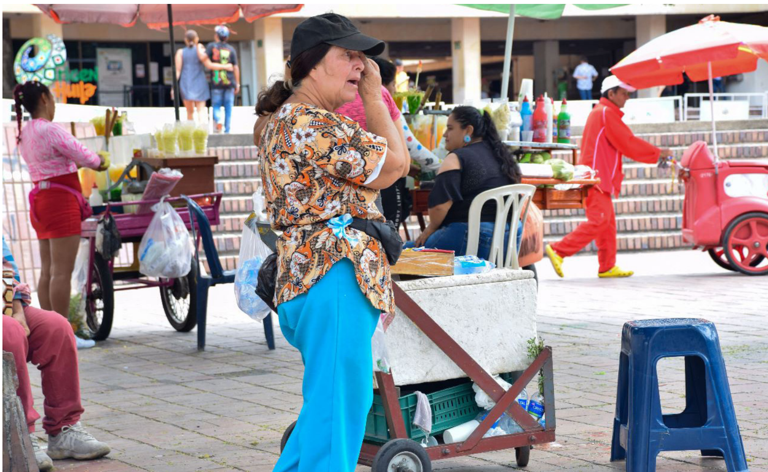
Uno de los grupos que se beneficiaría de este pilar sería el de los trabajadores informales.

Según el Gobierno, esta diferencia se debe a que las mujeres cotizan sobre salarios más bajos, la fórmula para el cálculo de la renta vitalicia contempla la expectativa