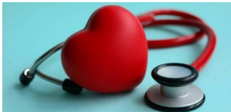
La nueva circular del Fomag tendrá vigencia por un mes.

La extensión del plazo por parte del Fomag es un paso crucial para garantizar la continuidad del servicio de salud para los docentes y sus familias. Esta medida no solo proporciona un respiro necesario en el proceso de transición, sino que también reafirma el compromiso del Gobierno y del Fomag con la salud y el bienestar del magisterio colombiano. La reacción de los docentes refleja tanto las preocupaciones legítimas ante las dificultades actuales como la esperanza de que las medidas adoptadas resulten en un sistema de salud más eficiente y justo para todos.