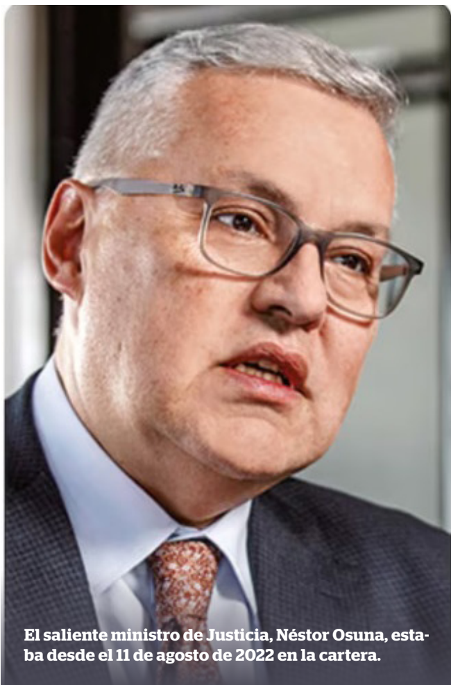
El saliente ministro de Justicia, Néstor Osuna, estaba desde el 11 de agosto de 2022 en la cartera.