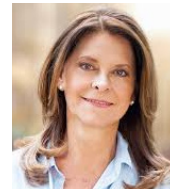
Marta Lucía Ramírez

Como es de conocimiento público, la administración de Gustavo Petro ha debilitado profundamente a la Fuerza Pública. La reducción de 800.000 millones para las fuerzas militares, propuesta por el ministro de Defensa, Iván Velásquez, ha profundizado esta crisis llevando al país a una alarmante pérdida de control territorial y debilitando la seguridad ciudadana. La diáspora de militares y policías experimentados, así como el aumento de cultivos ilícitos y criminalidad, evidencia una falta de estrategias efectivas para la generación de condiciones de seguridad.