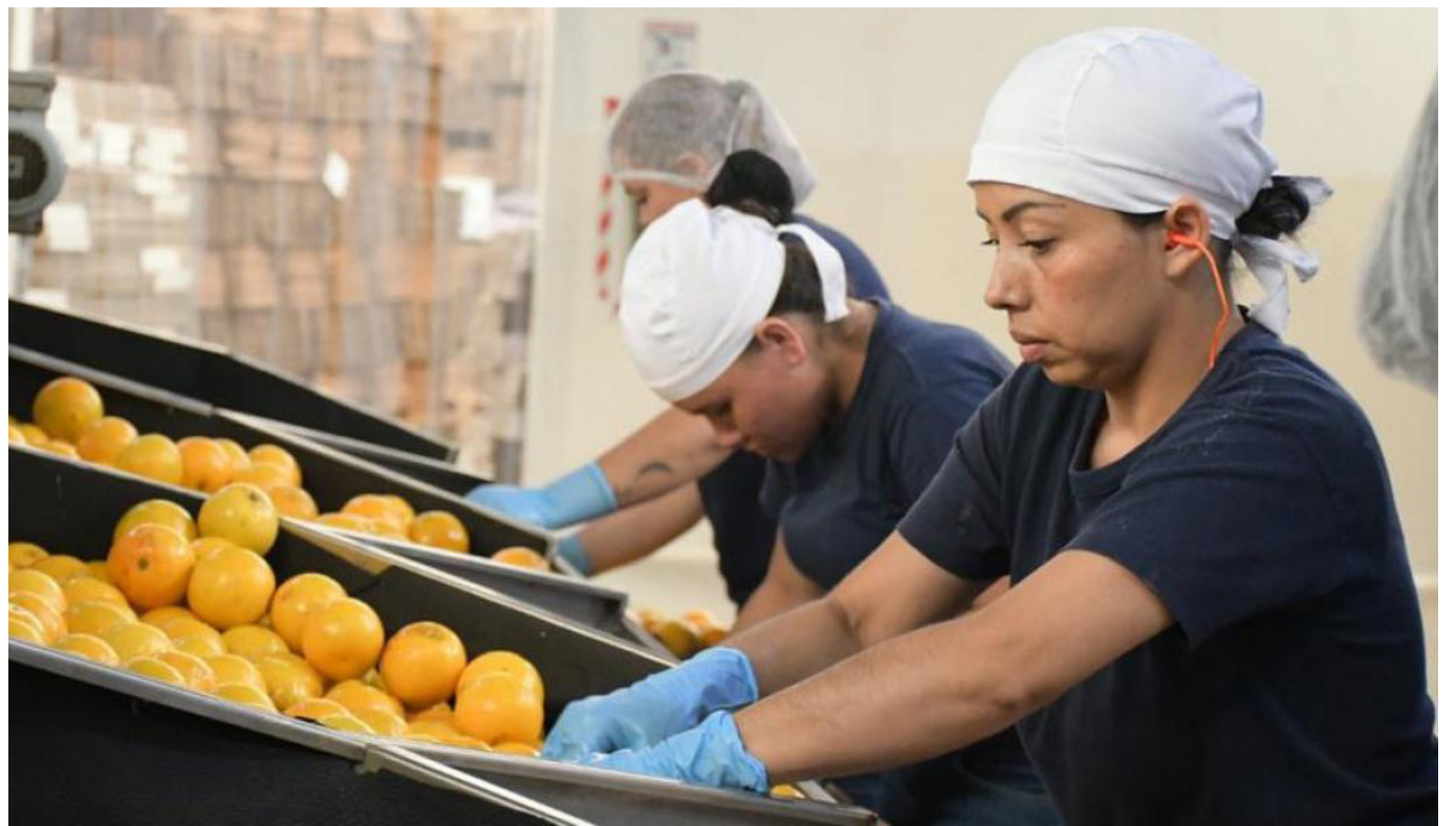
En el caso de que la persona haya ahorrado en fondo privado se reconocería la renta vitalicia con base en su saldo.

En el Régimen de Ahorro Individual con Solidaridad (Rais), bajo las condiciones actuales del sistema, así ella no cotice los últimos tres años antes de solicitar la devolución, su ahorro continuará generando rendimientos y sería de unos 113 millones de pesos, según los cálculos del centro de estudios económicos.