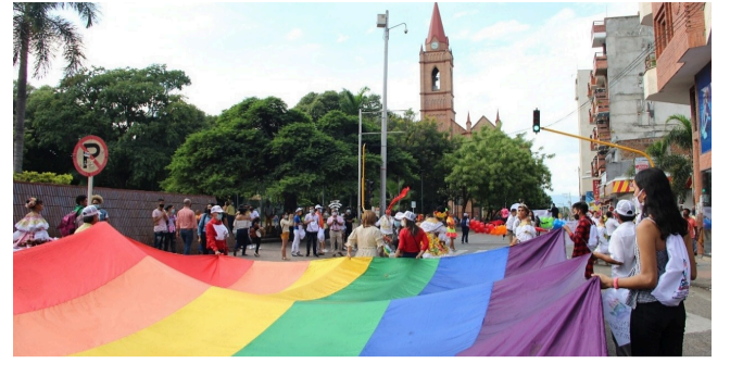
Panorama violento contra la comunidad LGBTQ+