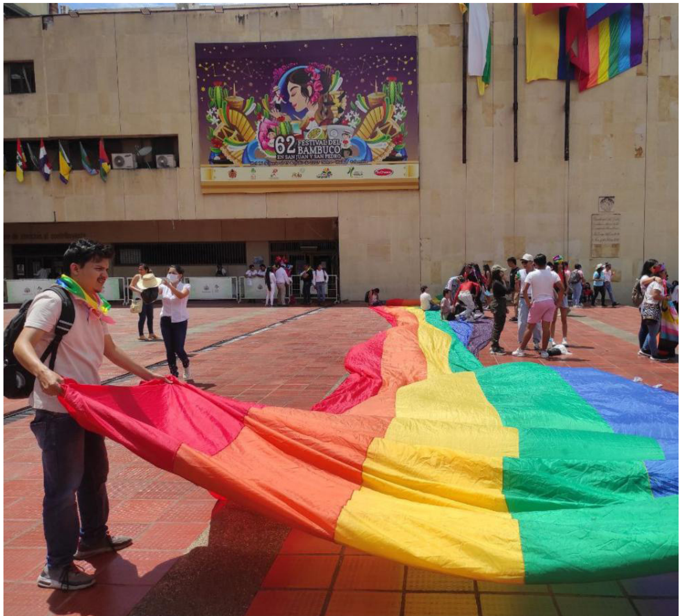
Entre enero y mayo de 2024, 286 casos de violencia contra la población con orientación sexual e identidad de género diversas.

Al ser comparado con las cifras reportadas por la Defensoría en su informe 'Una Radiografía del Prejuicio 2023', el panorama se torna más preocupante, toda vez que el año anterior registró 480 casos de violencia por prejuicio, en los que el 52,6% obedeció a situaciones por violencia psicológica y el 23%, a violencia física.