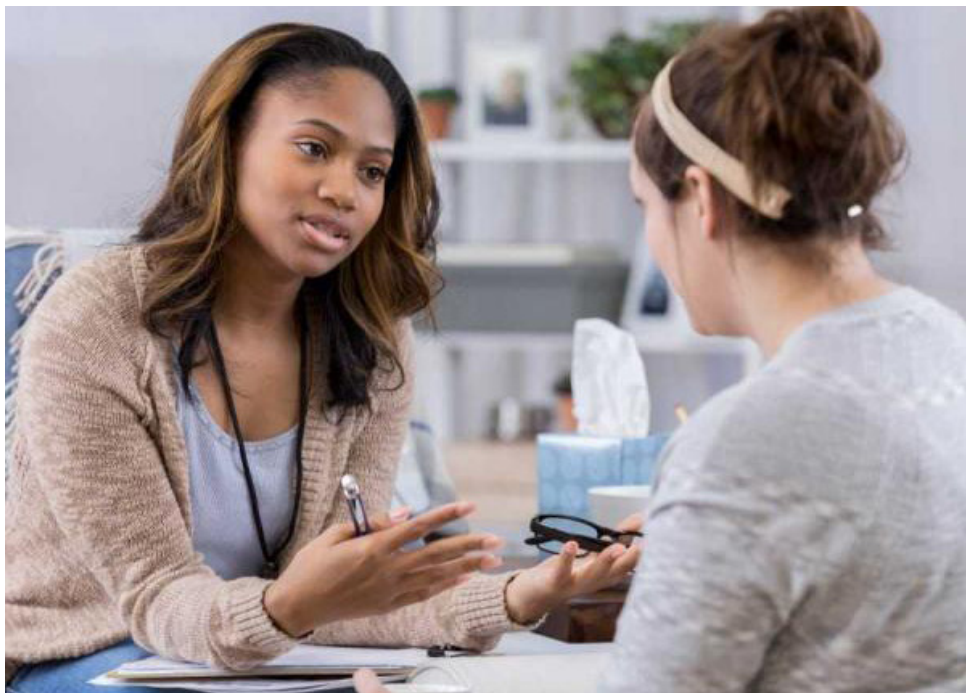
El Ministerio Público, hizo seguimiento al trabajo de las Secretarías de Salud frente a la adopción de la política de consumo de sustancias psicoactivas.

El Ministerio Público, hizo seguimiento al trabajo de las Secretarías de Salud frente a la adopción de la política de consumo de sustancias psicoactivas y las gestiones adelantadas por estos organismos para garantizar calidad en atención de personas que consumen estos compuestos.