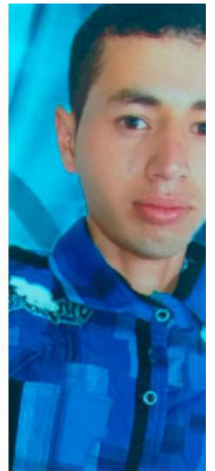
El hombre afirmó a las autoridades que hizo un pacto con el diablo.