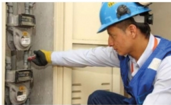
Quejas por el costo del servicio de reconexión de gas ■ INFORME 4-5