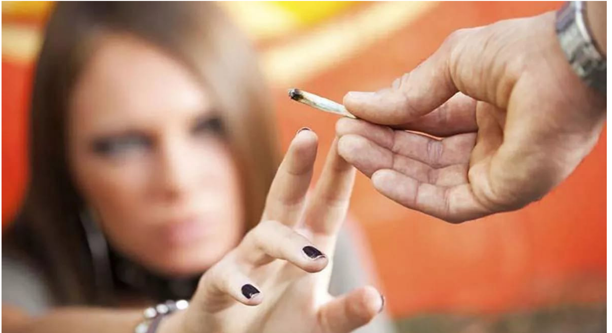
Analizan ley que garantiza la atención integral a personas que consumen sustancias psicoactivas.

■ La Procuraduría General de la Nación presentó los resultados del seguimiento realizado a la implementación de la ley que garantiza la atención integral a personas que consumen sustancias psicoactivas. El ente de control, destacó la solicitud presentada ante el Ministerio de Salud para la actualización de la encuesta de bienestar mental.