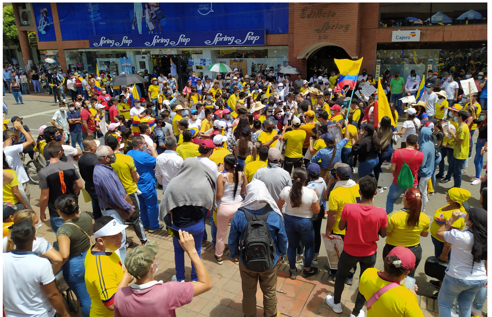
Anif señala que no se cambian las condiciones para la población que cotizó menos de 300 semanas.

La reforma pensional en Colombia es un intento ambicioso de mejorar la cobertura y equidad del sistema de pensiones. Aunque ofrece beneficios potenciales para los trabajadores informales y aquellos que no han cumplido con el total de semanas necesarias, también presenta desafíos significativos en términos de financiamiento, sostenibilidad y equidad. La implementación cuidadosa y las políticas complementarias serán cruciales para asegurar que la reforma logre sus objetivos sin causar perjuicios a aquellos que ya han estado ahorrando para su jubilación.