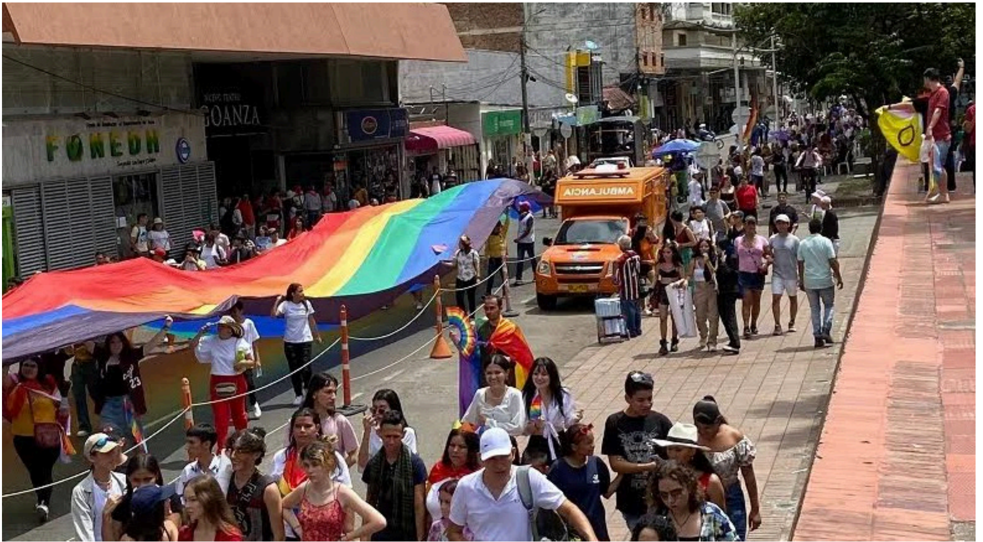
Muchas personas se ven abocadas a irse de Neiva, porque no les dan empleo.

para abrirse espacio en un país conservador. Y este mes lo celebran, debido a que a finales de la década del 60, en Estados Unidos, la comunidad LGBTI protestó por atropellos de la Policía y que fue precisamente en el mes de junio.