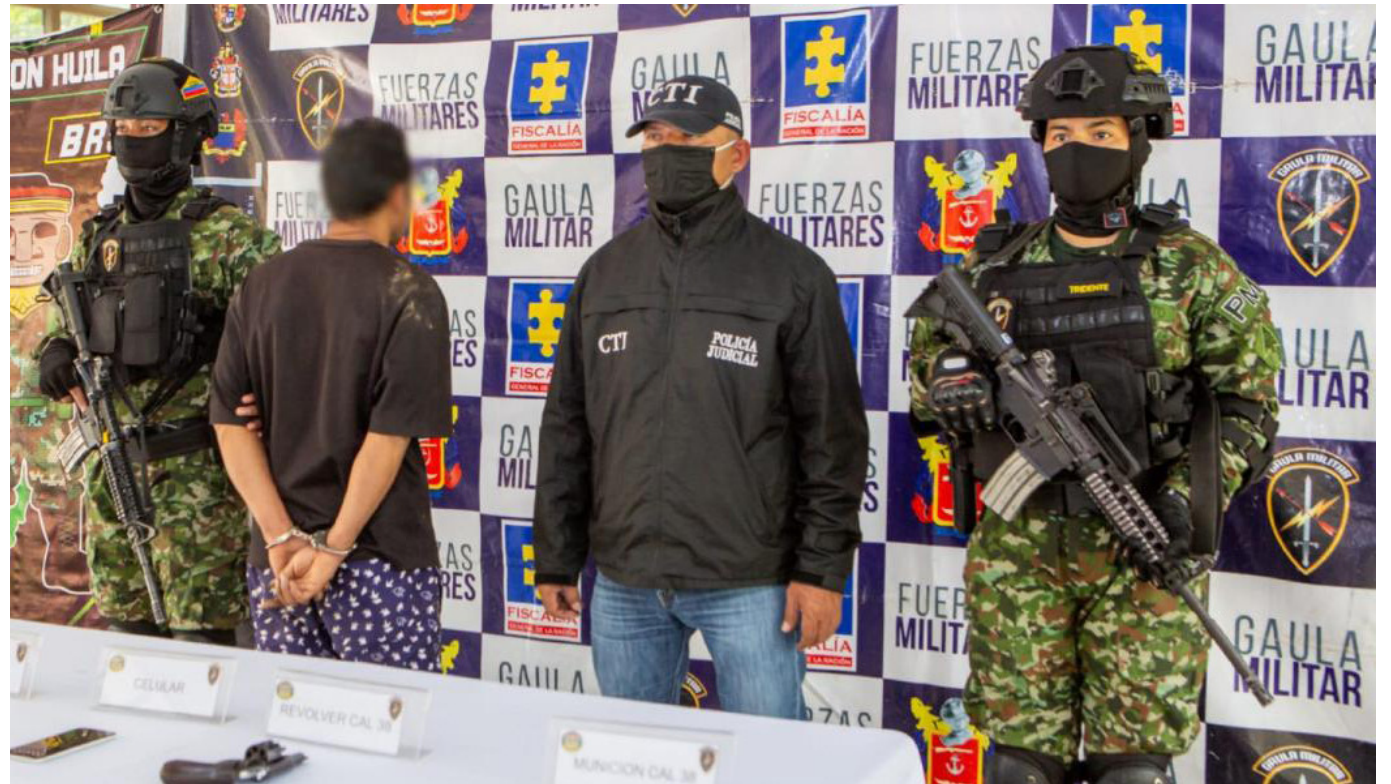
Autoridades lograron capturar a 'Satanás' en zona rural del Huila.

En la actualidad, las investigaciones contra Janer Iván se mantienen en busca de poder comprobar los otros delitos por los que se le señala.