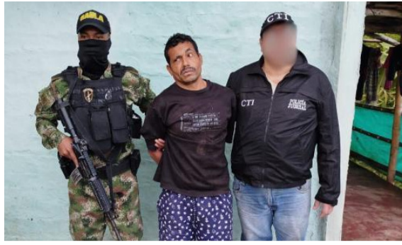
Oración de sacerdote ayudó con la captura de 'Satanás'