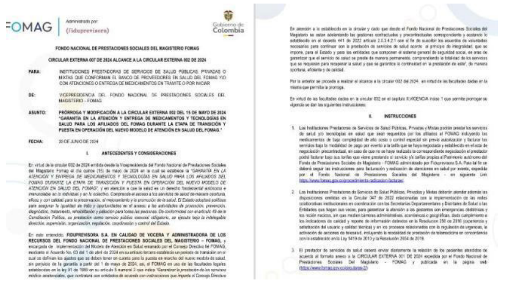
Circular 007 del Fomag.

La extensión del plazo hasta el 31 de julio de 2024, con la posibilidad de una prórroga adicional, refleja el compromiso del Fomag y del Gobierno Nacional de asegurar