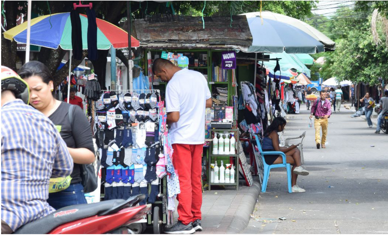
En el Régimen de Ahorro Individual con Solidaridad (Rais), bajo las condiciones actuales del sistema.

de vida, que es mayor, y a la diferencia de cinco años en la edad para acceder a todos los pilares, lo cual reduce el tiempo disponible para acumular semanas.