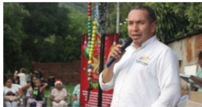
'Es necesario un rediseño institucional de la personería de Neiva' ■ ENTREVISTA 2-3