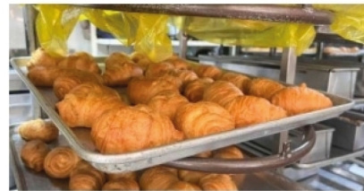
Panaderos del Huila, afectados por bajo consumo ■ ECONOMÍA 6-7