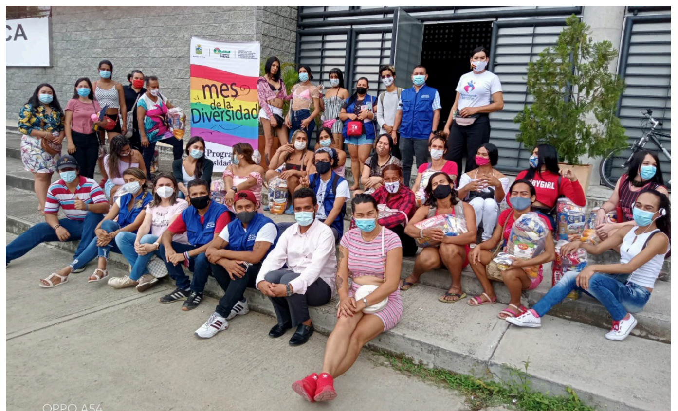
Hay que hacer más pedagogía para el respeto y el reconocimiento de la diversidad.

"Muchas personas se ven abocadas a irse de Neiva, porque no les dan empleo, porque el otro 'trabajo', son las actividades sexuales remuneradas, y es una de las realidades que debemos hablar", puntualizó el político.