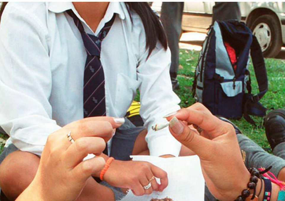
El Observatorio de Drogas de Colombia, el país ha alcanzado progresos en el desarrollo de estudios dirigidos a población general, escolar, principalmente estudiantes de básica y secundaria y universitarios.

en la salud pública y en lo social, el consumo de drogas ilícitas está creciendo en el país, no solo porque más personas las consumen sino porque el mercado de sustancias es cada vez más diverso.