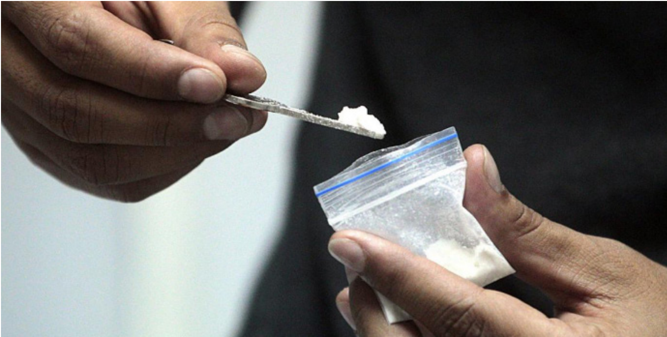
La Alcaldía de Neiva, restringe para el porte, consumo y distribución de sustancias psicoactivas y alcohólicas en todo el municipio.