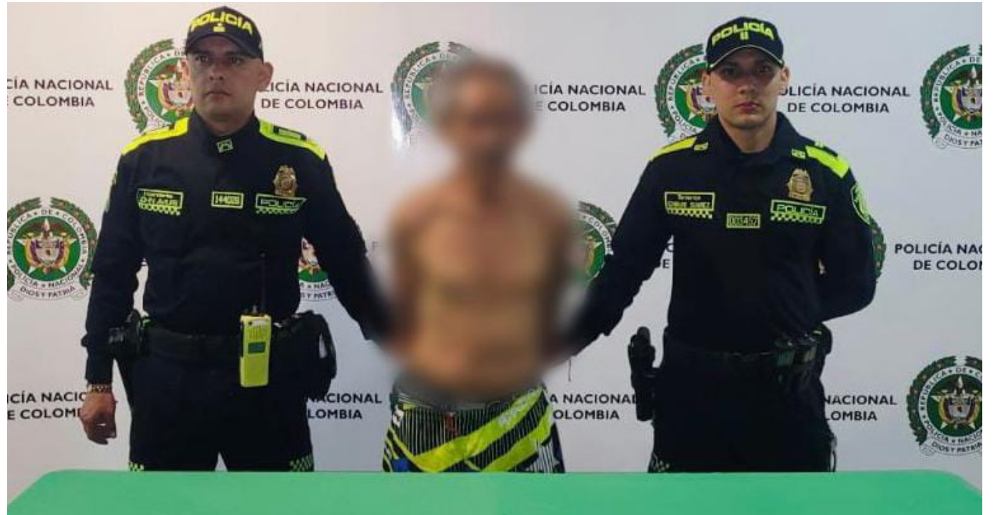
Sujeto capturado por la Policía Metropolitana de Neiva.

Las autoridades trabajan para establecer la identidad de la persona fallecida. Así mismo el capturado será llevado ante un Juez para audiencias preliminares en su contra.