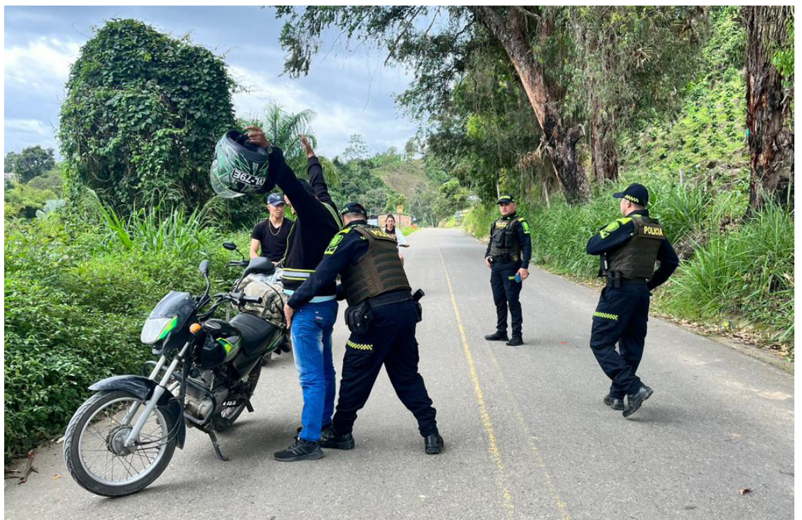
Los planes de registro y control en las carreteras del departamento del Huila, realizados por el Departamento de Policía Huila, este fin de semana.