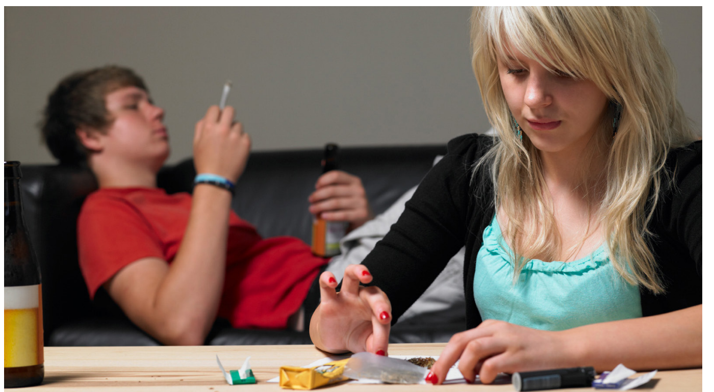
Los menores que sean sorprendidos consumiendo 'droga', deberán ser conducidos ante el defensor o Comisaría de Familia.

A través del trabajo del Observatorio de Drogas de Colombia, el país ha alcanzado progresos importantes en el desarrollo de estudios epidemiológicos periódicos, con metodologías estandarizadas internacionalmente y dirigidos a tres poblaciones clave: población general de 12 a 65 años, población escolar, principalmente estudiantes de básica y secundaria y universitarios.