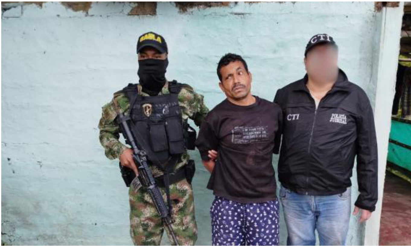
Víctimas de alias 'Satanás'.

sonas para apoderarse de su negocio de microtráfico. “Dice que con eso logró que su hermano prefiriera prestar servicio militar y hasta ahí lo persiguió”.