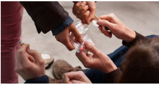
¿Cómo va la ley de seguimiento a consumidores de alucinógenos?