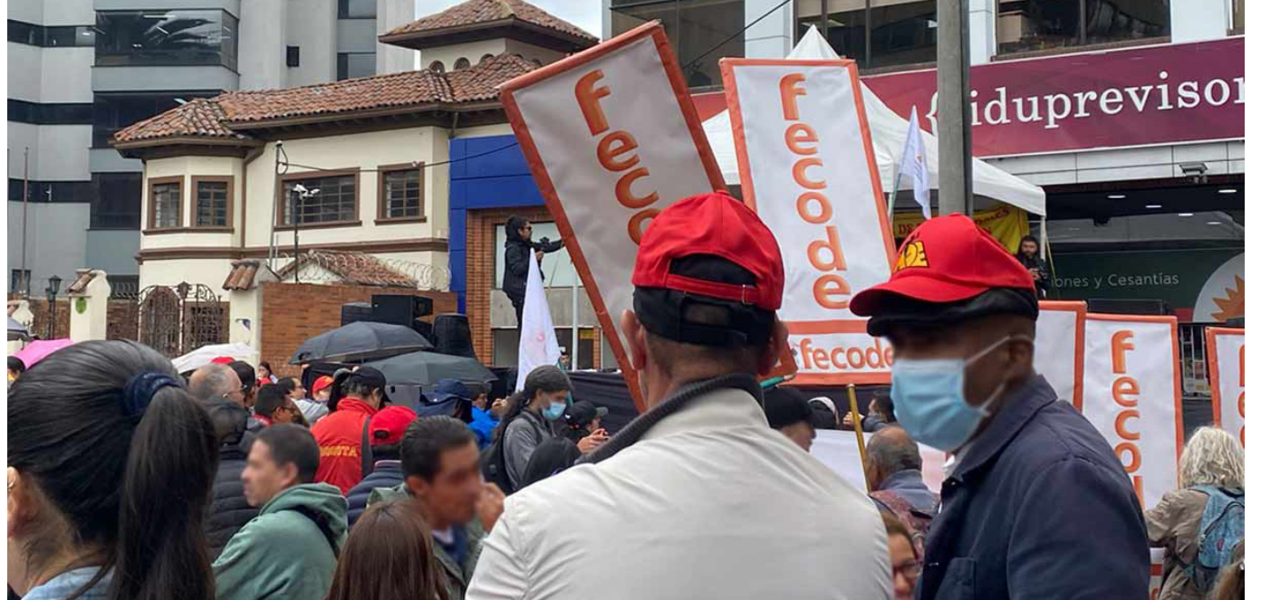
Sede de la Fiduprevisora, entidad que administra el Fomag.

La entidad administrada por la Fiduprevisora prorrogó medidas para que los docentes y sus familias sean atendidos.