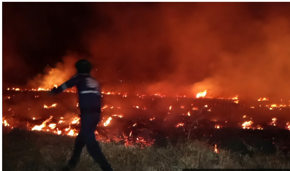
En el Huila han ocurrido más de mil incendios en la segunda temporada de menos lluvias.

comunidades, sino que también complica las labores de los cuerpos de bomberos, que dependen de estos acuerdos para financiar sus operaciones. “Hay limitaciones económicas en algunas loca-