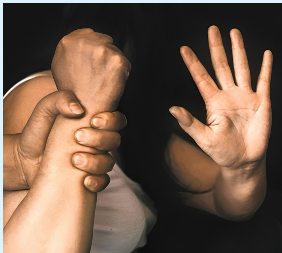
Los delitos sexuales contra la mujer se han reducido en 18 casos menos.

Cabe mencionar que la Institución, no cuenta con patrulla, se encuentran en proceso de estructuración junto a la