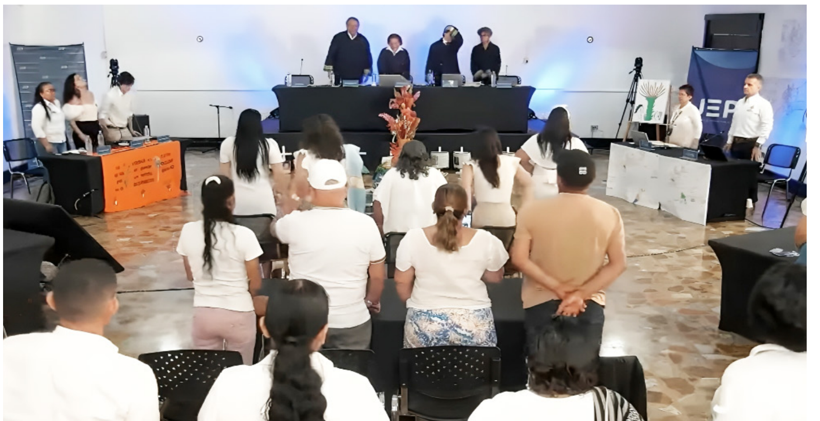
Subcaso Ariari, Guayabero, Guaviare, Caguán, Florencia y zonas aledañas - Caso 08 en Villavicencio, Meta.