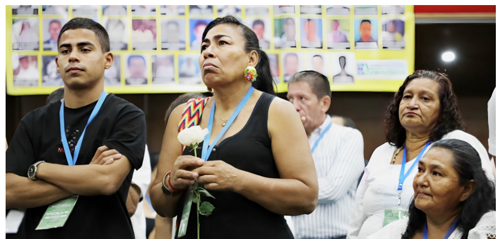
En la JEP, familiares de víctimas de ejecuciones extrajudiciales han protestado pidiendo verdad y justicia.

Cinco de los seis generales en retiro vinculados al Huila ya han sido imputados por la JEP, en el marco de la investigación por más de 6.400 ejecuciones extrajudiciales en Colombia entre 2002 y 2008.