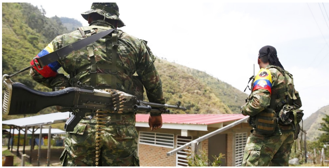
Defensoría lanza alerta por masificación de disidencias