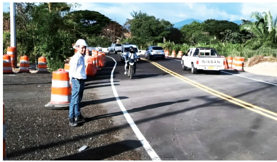
Incumplimientos de Concesión vial en Campoalegre