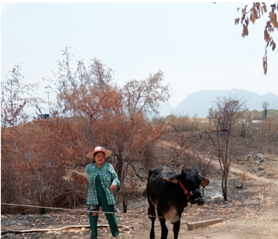
Las pérdidas durarán años en recuperarse.

A pesar de los esfuerzos iniciales de los bomberos, que contaban con personal limitado debido a permisos y otros compromisos,