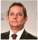
Germán Vargas Lleras

Esta semana se presentó nuevamente a consideración del Congreso el proyecto de ley que reglamenta el funcionamiento de la jurisdicción agraria, que por fortuna no había tenido trámite el semestre pasado. Esta nueva versión llega repotenciada y más nociva que la anterior e inicia su trámite por la Comisión 1.ª bajo la presidencia del gobiernista senador Ariel Ávila.