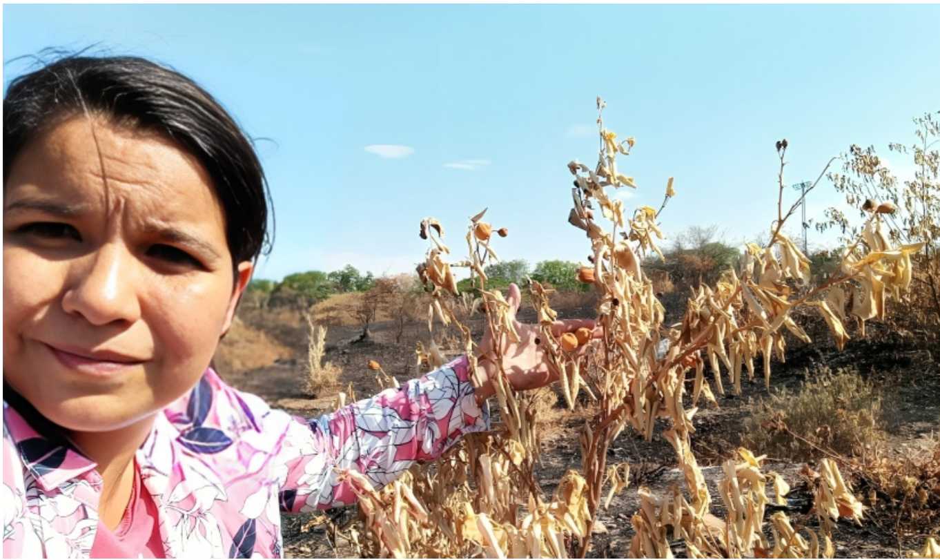
150 árboles de limón terminaron incinerados.

mento, entre ellos Neiva, Rivera y Garzón”, informa Garzón.