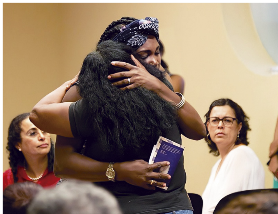
Piden mayor sensibilidad y detalle todo lo referente a las violencias basadas en género.

“Los comparecientes asuman su responsabilidad de manera íntegra y comprometida, a que hagan aportes detallados, novedosos, exhaustivos, inéditos de verdad, porque no podemos permitir que el olvido, vaguedades, suposiciones, hipótesis, reemplacen lo que las víctimas están esperando por años”, Procuraduría.