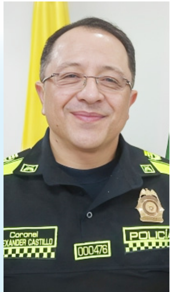
Coronel Alexander Castillo comandante de la Policía Metropolitana de Neiva.

“Y el otro plan es la transversalización de género con enfoque diferencial, es un trabajo que se hace incluso con el centro de pensamiento para la gobernanza de Ginebra en Suiza y es un trabajo que abandera la Policía Nacional al interior del Ministerio de Defensa, es decir respetar, valorar poner en igualdad de condiciones a las policías que prestan su servicio en nuestra institución”, destacó el coronel.