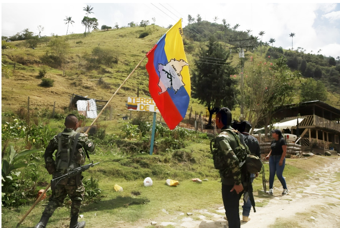
Crece violencia por presencia de disidencias Farc en el Huila.

acciones urgentes de prevención, disuasión y atención, con la finalidad de que eviten la materialización de las conductas vulneradoras de derechos”.