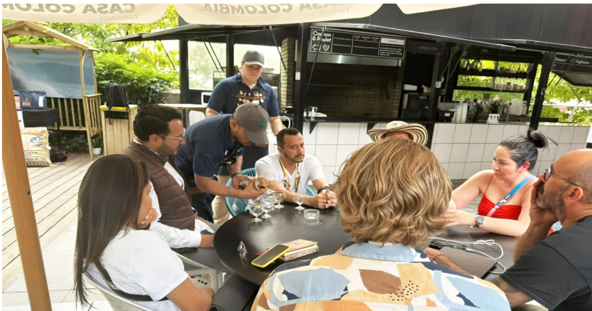
En la Casa Colombia los jóvenes atienden tanto a los deportistas colombianos, como a otras delegaciones.