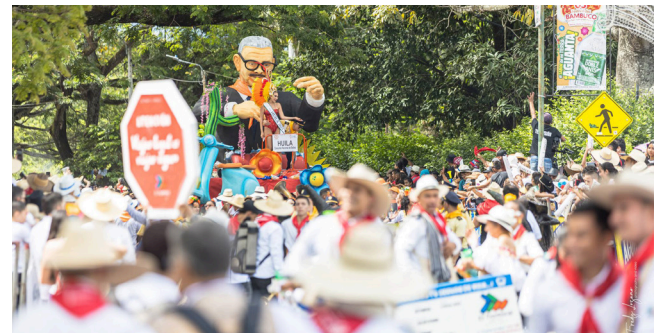
Bajó la ocupación hotelera en San Pedro