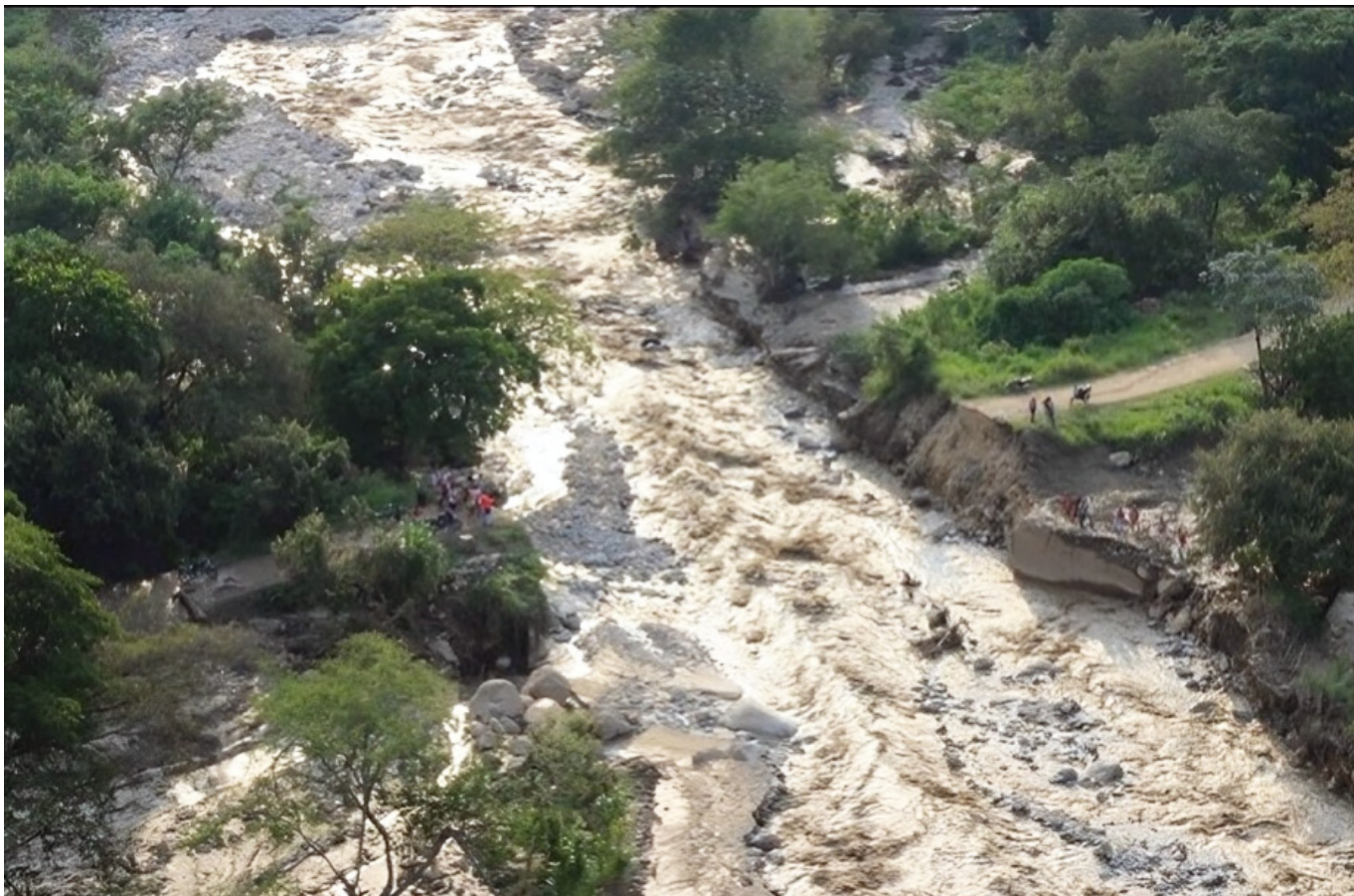
Este proyecto vial afectaría dos afluentes hídricos.

que las consecuencias no se verán de inmediato, sino a futuro.