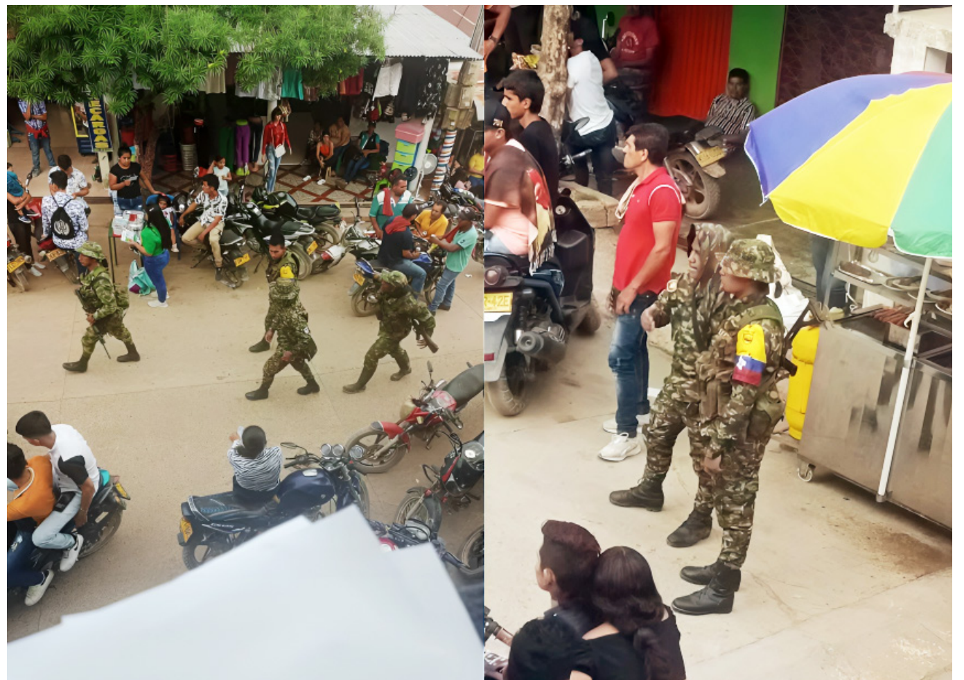
Disidencias Farc siguen afectando a la población del Huila.

De acuerdo con la Defensoría, existe la posibilidad de que estas facciones recurran a bandas delincuenciales locales para tercerizar sus actividades criminales, lo que podría agravar la situación de seguridad en la capital del Huila.