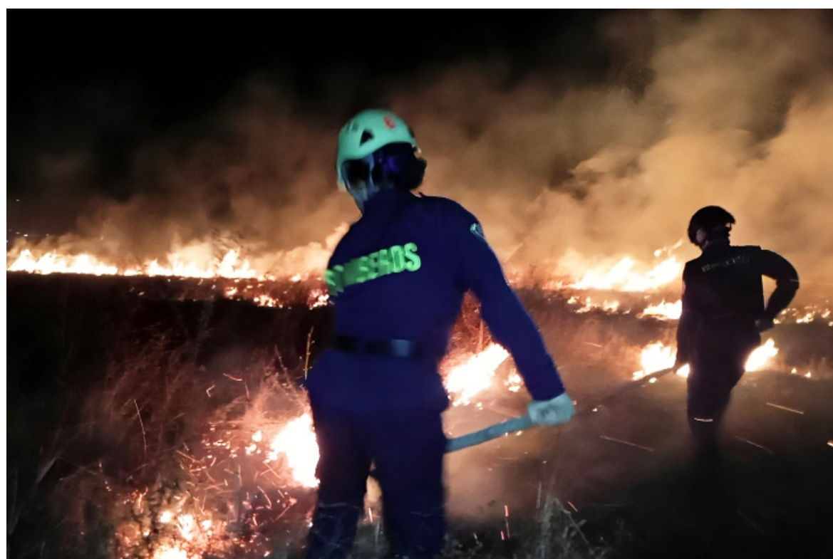
Las autoridades llaman a la prudencia y a evitar las llamadas quemadas controladas.

lidades, y a otras les falta voluntad político-administrativa para firmar estos pactos. Ya hemos empezado a cerrar operaciones en algunas estaciones porque no hay dinero que garantice la movilidad de los vehículos”, advierte Fernández.