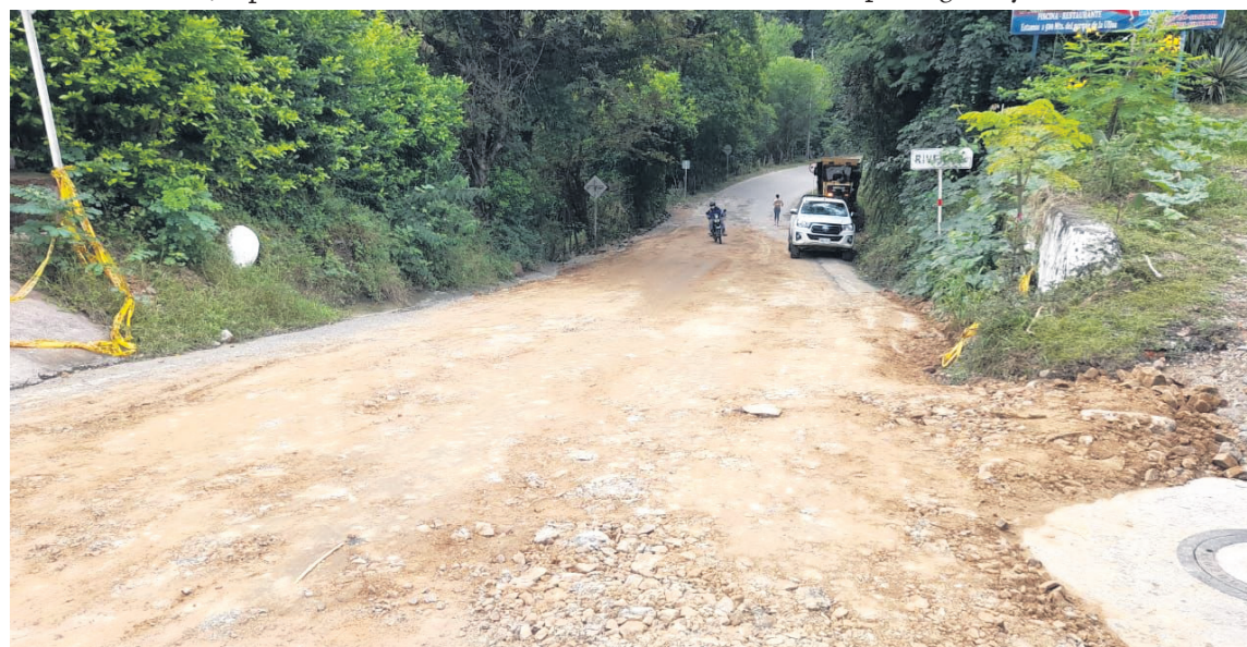
Otros de los aspectos, priorizado en el plan de desarrollo, es la conectividad y las vías e infraestructura.

Y el último de ellos, es la creación del Instituto Departamental de Acción Comunal del Departamento del Huila y se dictan otras disposiciones – IDACOHUILA.