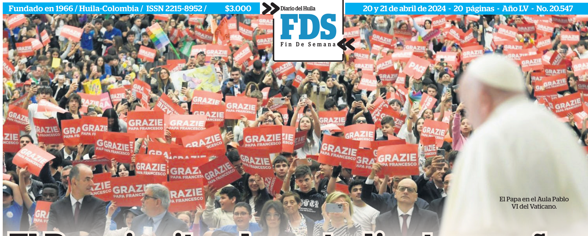
El Papa en el Aula Pablo VI del Vaticano.

20 y 21 de abril de 2024 - 20 páginas - Año LV - No. 20.547