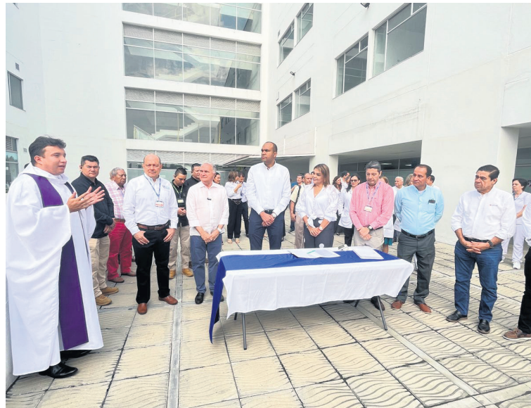
El inicio de la última fase de construcción de la Torre Materno Infantil del Hospital Universitario de Neiva es una de las acciones destacadas en los primeros 100 días de gobierno de Villalba.

El nuevo instituto, estará articulado con la política nacional de contratación pública de diversas obras como vías terciarias, alimentación escolar, entre