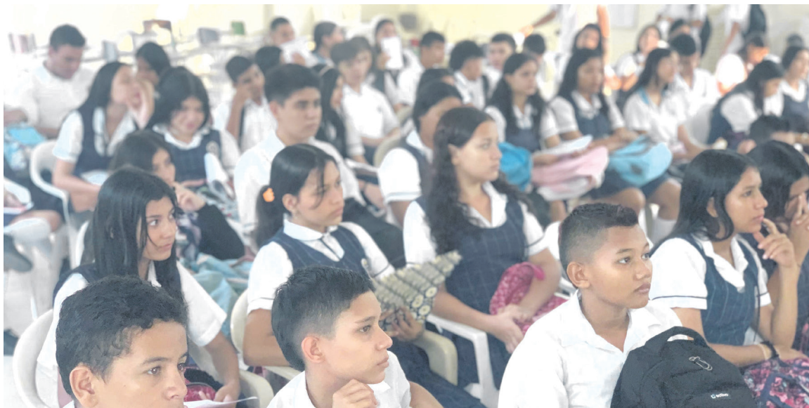
Imagen del día

Con la participación de 58 alumnos de la Institución Educativa Gabriel García Márquez, de la comuna Nueve, se dio inicio al programa del servicio social para este primer semestre del 2024, apoyado por parte de la Secretaría de Deporte y Recreación.