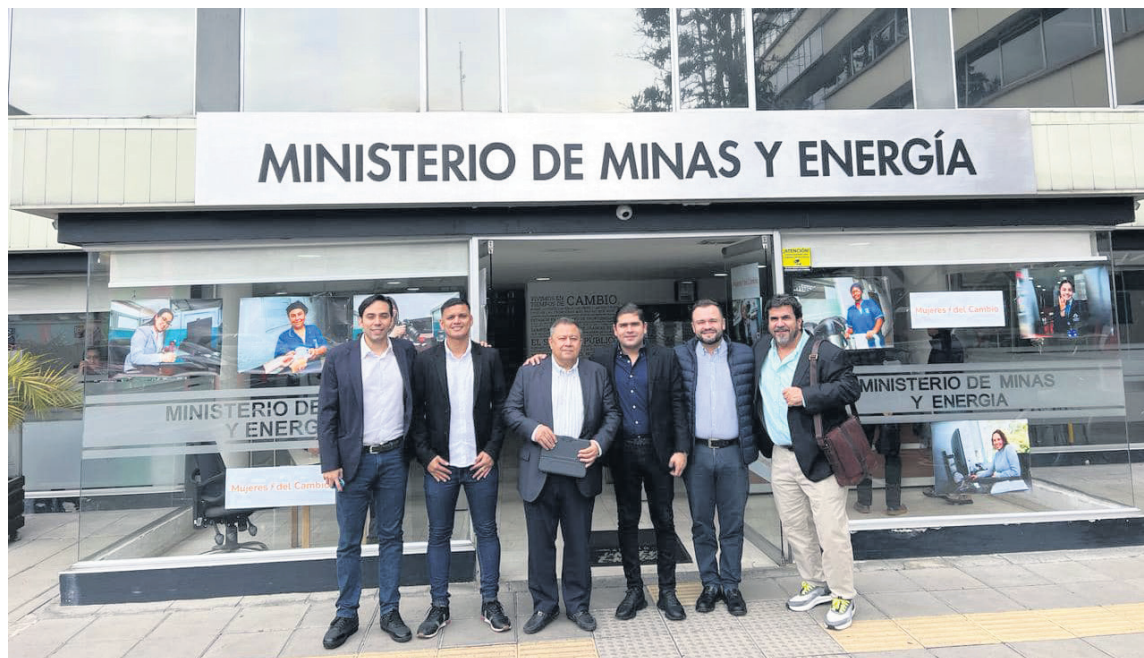
El control político especial de la Electrificadora del Huila tuvo gran acogida.

Creo que ha sido muy acertado en decidir quiénes están al frente de esas carteras, en algunas decisiones valientes como la derogación de algunos decretos, el de las daciones de pago, el de la vinculación ilegal de hectáreas al perímetro urbano de Neiva, esas son decisiones valientes porque tiene repercusiones jurídicas y bueno yo admiro eso.