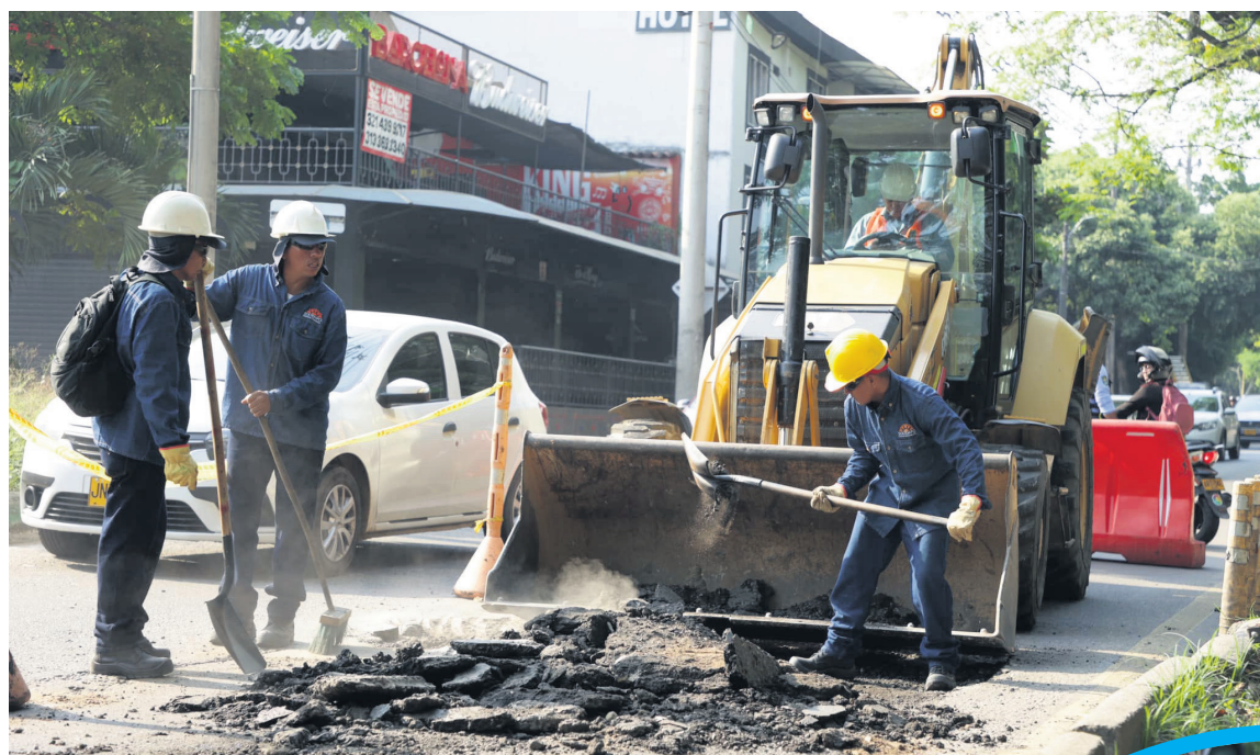
Ya se inició la recuperación de la malla vial en la ciudad.

sotros entraríamos a realizar una cofinanciación importante con recursos del fondo de seguridad del municipio. Otros de los proyectos principales es la terminación de la Unidad Permanente de Justicia, esa obra la encontramos inconclusa, estamos haciendo unos esfuerzos grandes para ponerla en funcionamiento, esto sin duda alguna va seguir ayudando a mejorar estos indicadores, también trabajaremos en la recuperación de algunos CAI móviles que encontramos en completo abandono.