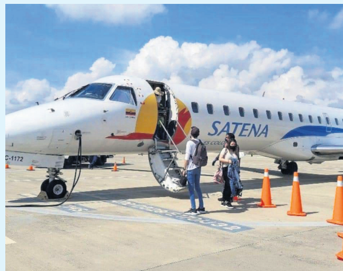
El alcalde de Pitalito hizo gestiones para reactivar la ruta aérea con Cali.

Adicional a eso, la administración municipal en coordinación con la Agencia Nacional de Tierras acompañó la entrega de las escrituras a 419 nuevos propietarios de la zona sur del Huila, en Pitalito, 177 familias del sector rural ya cuentan con escrituras de sus predios y son dueños de su tierra.