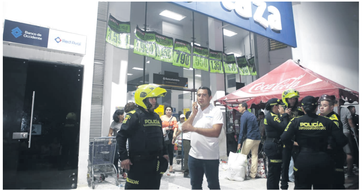
Con el último atentado, la seguridad estaría desbordada.

Es una obligación del Gobierno Nacional. Hemos adelantado varios llamados y vamos a hacer un comunicado mucho más fuerte frente al tema de seguridad, ya con el atentado en el Supermercado Surtiplaza, sentimos que esto se nos está saliendo de las manos”, añadió la parlamentaria.