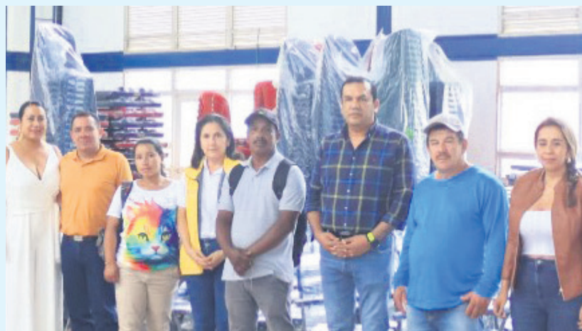
Se hizo entrega de mobiliario a las instituciones educativas San Miguel y San Vicente.

El mandatario enfatizó: “lo que pedimos es un trabajo coordinado desde el territorio, con directrices que nos otorgue el gobierno Nacional”. Así las cosas, se logró a través del Gobierno Departamental, establecer un Puesto de Mando Unificado con el propósito de hacerle un monitoreo al orden público en la zona.