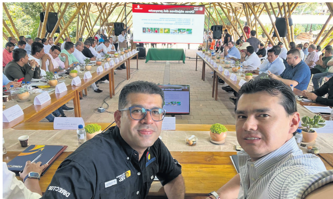
La gestión de recursos del ámbito nacional es de gran importancia para Neiva.

Tenemos proyectos ambientales muy importantes, como el Jardín Botánico, el parque del Cacao, el centro de bienestar y protección animal, en donde dos de estos proyectos ya le hemos adelantando actualización de precios, un proyecto ya estaba en fase tres, a ese le terminamos su actualización, el otro estaba en fase dos y ya estamos culminando la ingeniería de detalle de este para tenerlo listo y conseguir los recursos a través de Gobernación. Estamos pon definir el predio para el Centro de bienestar y protección animal, que es un gran compromiso con los animales y yo sé que esta será una obra muy bonita que le estaremos entregando a los ciudadanos.