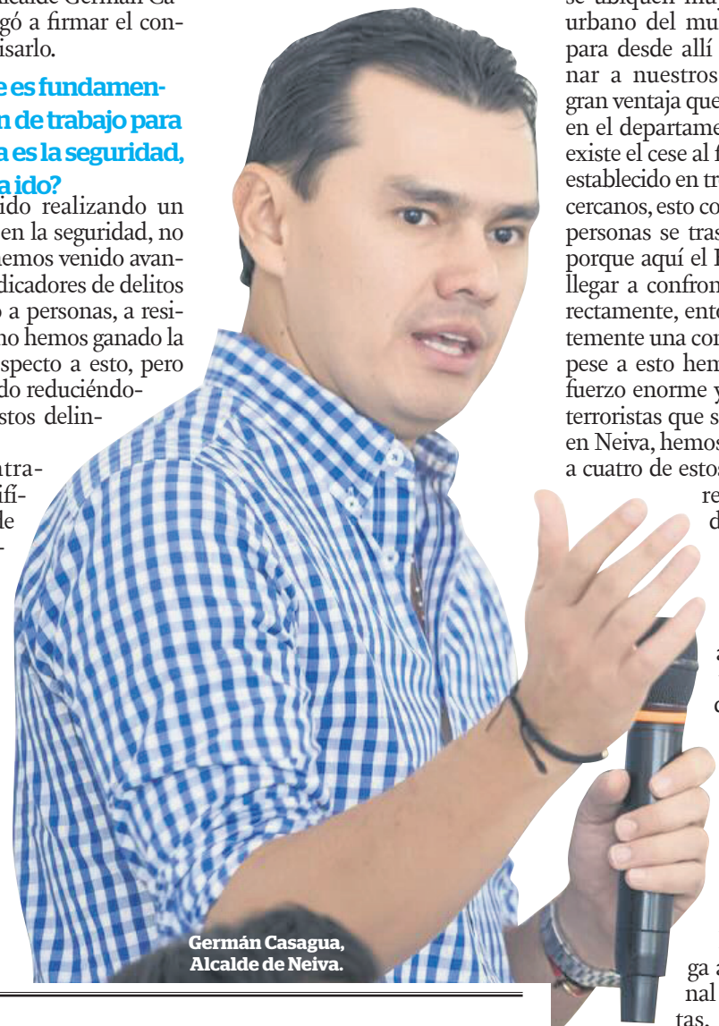
Germán Casagua, Alcalde de Neiva.

Tenemos un proyecto enorme, necesitamos reestructurar todo el centro de inteligencia, de control de las cámaras de seguridad, estamos trabajando para presentar un proyecto de cerca de 26 mil millones de pesos, en donde tendríamos la implementación de 200 cámaras de seguridad con una central de monitoreo, es un proyecto que está avanzando y esperamos gestionar recursos ante el Gobierno Nacional, no-