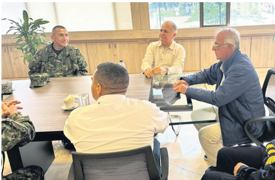
Rodrigo Villalba Mosquera, Gobernador del Huila, destaca la importancia de la seguridad como prioridad fundamental en su gestión.

La agenda de seguridad ha sido prioritaria, marcada por la realización de múltiples Consejos de Seguridad Extraordinarios y