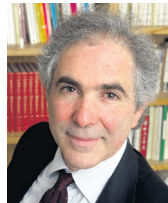
EDUARDO POSADA CARBÓ

Encargado de Negocios Embajada de EE. UU. en Bogotá