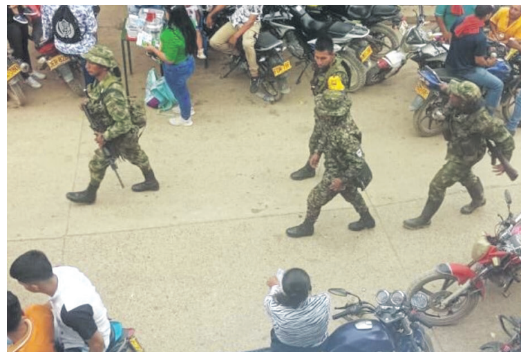
La funcionaria pide que el Gobierno Nacional, levante el cese al fuego con las disidencias.

“Y de esta manera combatir a las disidencias, que hoy tengamos claro que los acuerdos, no deben quedarse solo en el papel, sino que se conviertan en una realidad y esto es un ‘secreto a voces’.