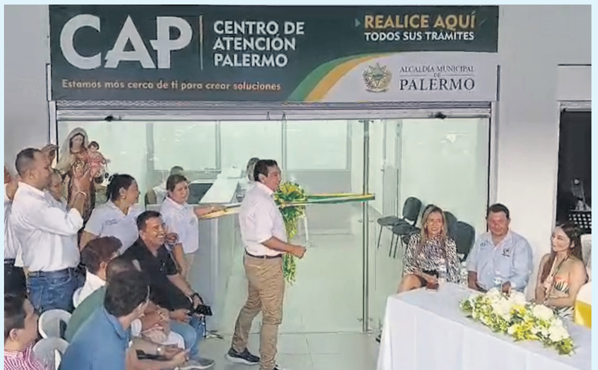
Inauguración de la oficina en Amborco, cerca de Neiva).

Para Oviedo es clave controlar la inseguridad en Palermo y apostarle a “reconocer, planear y tener claro” cuál es la deuda del municipio para renegociarla y pasar del 12% a un 6% “y tener unos años muertos, que me permita viabilizar el programa de gobierno”.