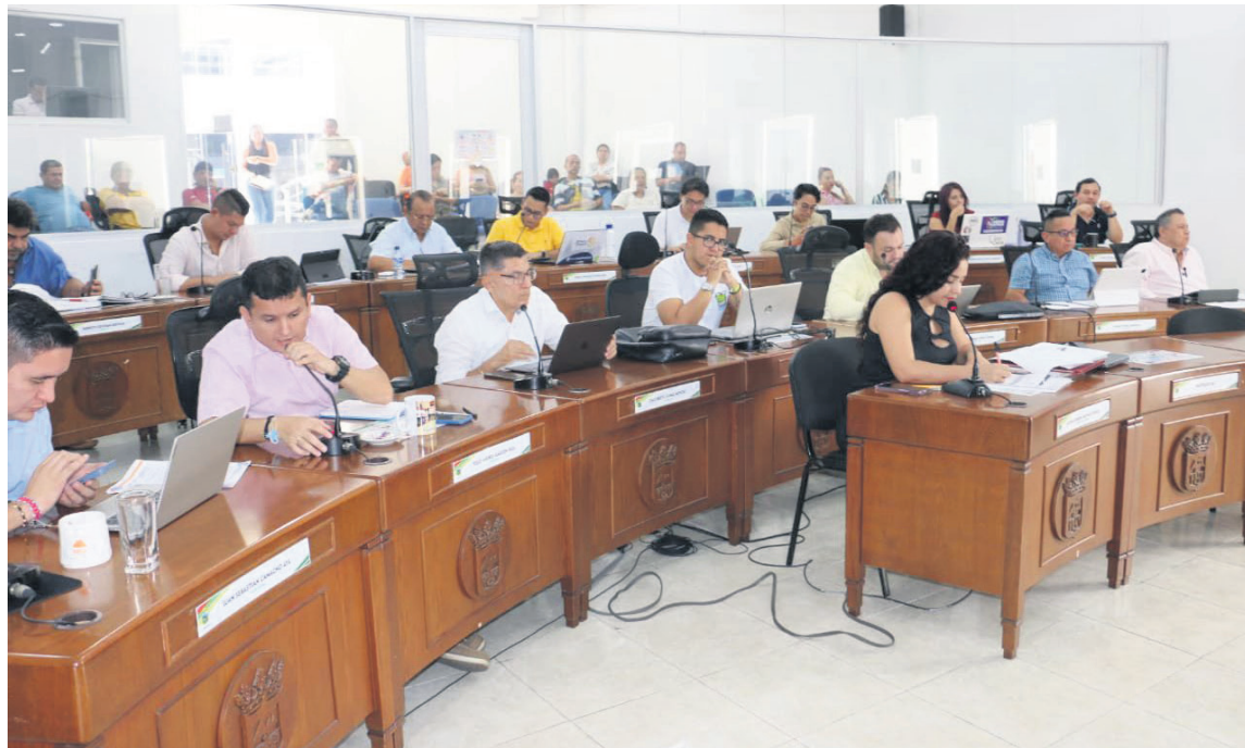
Casi todas las secretarías fueron llamadas a debate de control político.

Por otro lado, está el tema de la malla vial, creo que allí cometió un gran error la administración municipal y es que