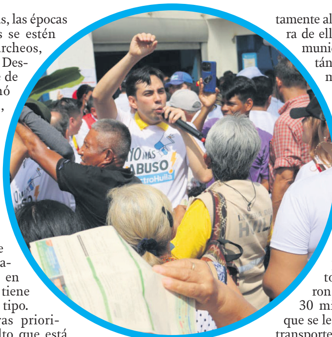
El Concejo lideró una marcha contra el aumento en la tarifa del recibo de electricidad.

Pero existen otras prioridades de tipo oculto que está sufriendo la Administración Municipal, que no son tan conocidas y no afectan tan direc-