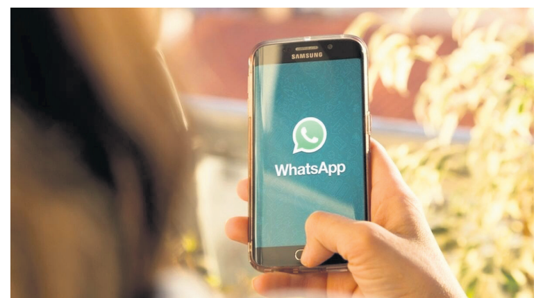
La aplicación de mensajería instantánea cuenta con muchas funciones que muchos no conocen.

Activar las notificaciones de WhatsApp para poder respon-