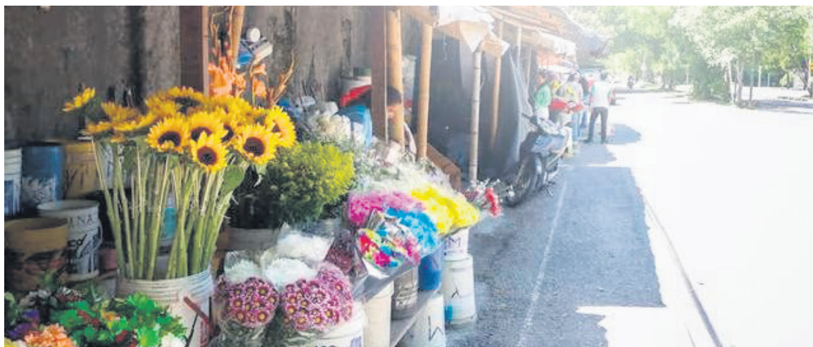
Imagen del día

Serán 12 casetas que serán distribuidas en el Parque de los Niños para que los vendedores informales de flores den un paso a la formalidad; mientras que los otros 23 espacios públicos serán reubicados en puntos estratégicos de la ciudad, beneficiando a personas en condición de vulnerabilidad.