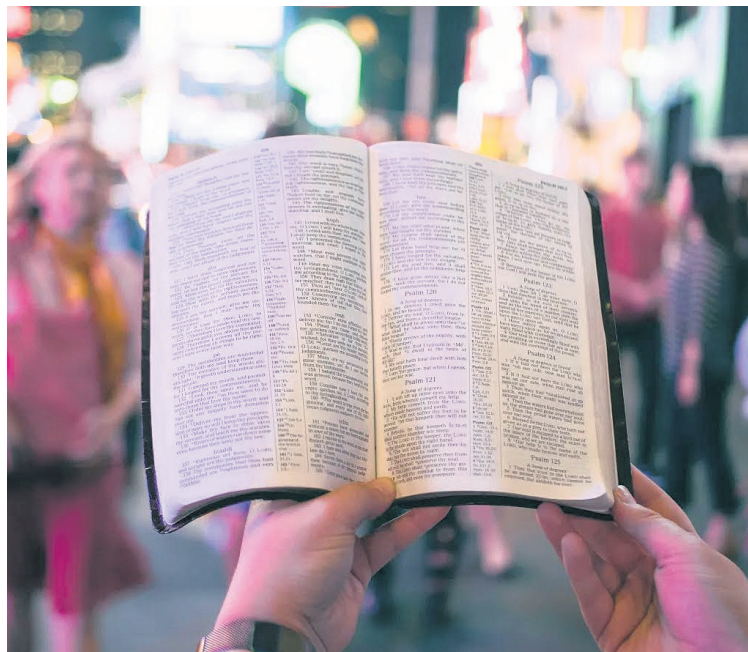
Para el Papa Francisco, es importante evangelizar por el mundo.

La misión de Francisco Javier llegó entonces a Japón, donde "ningún misionero europeo se había aventurado todavía", prosigue el Pontífice, que describe los tres "años muy duros por el clima, las oposiciones y la ignorancia de la lengua" pasados en el país por el santo y luego el deseo de llegar a China. Empezó su nuevo viaje, que sin embargo no llegó a buen puerto porque el misionero jesuita "murió en la pequeña isla de Sancian, esperando en vano desembarcar en tierra firme, cerca de Cantón". Fue el 3 de diciembre de 1552 y tenía 46 años, "pero sus cabellos ya estaban blancos, sus fuerzas consumidas, entregadas sin escatimar esfuerzos al servicio del Evangelio", subraya el Papa. Una vida pasada en las misiones la de San Francisco Javier, en una actividad muy intensa "siempre unida a la oración, a la unión con Dios, mística y contemplativa".