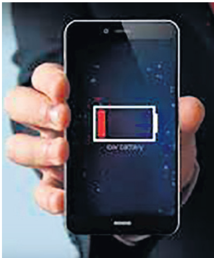
Existen aplicaciones que pueden truncar la duración de la batería del celular.

"En esta sección podrás ver un listado de las apps que usas y un porcentaje que indica el uso de