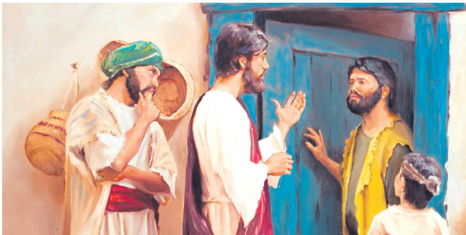
El amor a Cristo fue la fuerza que lo llevó hasta las fronteras más lejanas.

En la Europa cristiana, que miraba "hacia los confines entonces