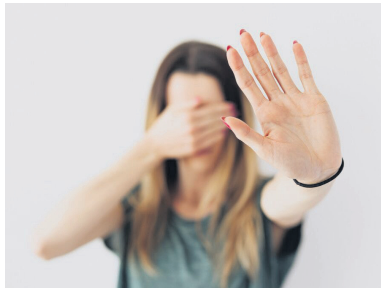
Los casos de violencia contra la mujer continúan aumentando en el Huila.

En el mes de febrero 2022 fueron capturadas 32 personas y este año 33 de estas 15 en los dos años fueron por violencia intrafamiliar y 17 en 2022 y 18 en 2023 fueron por lesiones personales.