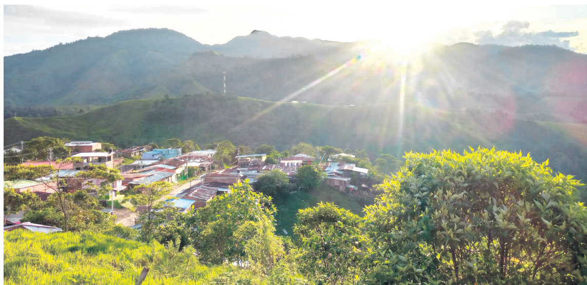
El Pato, Balsillas, dos territorios estratégicos considerados despensas agrícolas que podrían contribuir significativamente con la seguridad alimentaria una vez se de fin al conflicto que ha marcado la historia de la población.