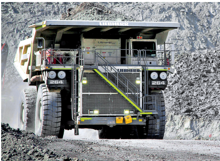
En Colombia hay 13 plantas para la producción de agrofertilizantes en Antioquia, Atlántico, Bolívar, Cundinamarca y Valle del Cauca.

este proyecto lo vamos a hacer y prácticamente Corpoagrominh, va a tener su planta de fertilizantes en el norte del departamento del Huila. Son cerca de 10 mil millones de pesos entre los dos proyectos”, puntualizó Trujillo.