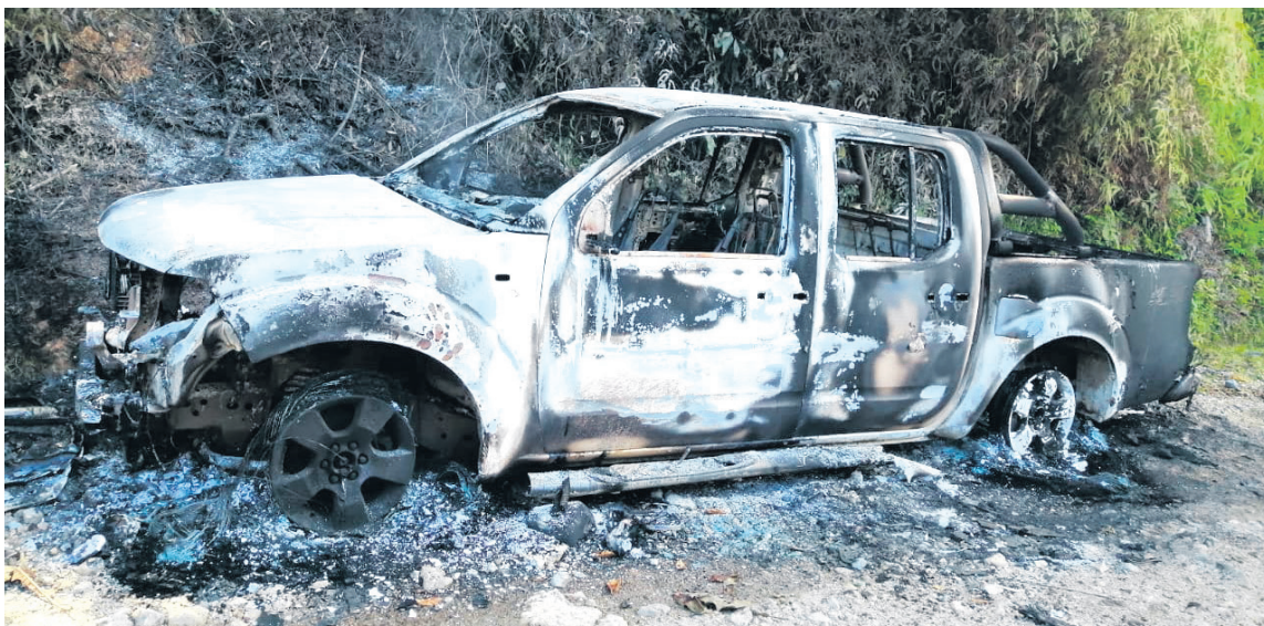
Sobre las 6 a.m. de este jueves, una camioneta marca Nissan apareció incinerada, los hechos son atribuidos a grupos armados sin identificar. La situación se dio en la vereda Los Andes.

“Frente a este fenómeno gravísimo de las extorsiones, se ha dispuesto la presencia de cerca de 120 nuevos efectivos de la Policía Nacional, para el departamento en una reorganización, una distribución que, de acuerdo con las mayores complejidades en los territorios, será definida con el coronel Castro, comandante del departamento de Policía Caquetá. El cese al fuego no significa impunidad, ni significa permisión para continuar desarrollando las actividades delictivas. Es decir, no obstante, la existencia del cese al fuego, la fuerza pública, las Fuerzas Militares, la Policía Nacional, tienen que redoblar esfuerzos para reprimir todos los delitos cometidos por esas organizaciones ilegales. Y si la acción de represión del delito, esas organizaciones ilegales pretenden enfrentar a la Fuerza Pública, la Fuerza Pública tiene toda la legitimidad, toda la capacidad, todas las facultades para repeler el ataque de que sea víctima”, anunció el ministro de Defensa, Iván Velásquez.