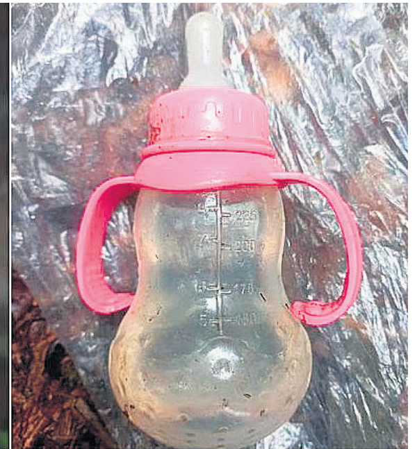
Según el abuelo de los niños algo sobrenatural estaría guiándolos a través de la selva.

mismo primero de mayo, día del siniestro, la Operación Esperanza se establece como un objetivo y estrategia militar días después, completando hoy 19 de mayo, 14 días de arduas labores de búsqueda en la selva del Caquetá.