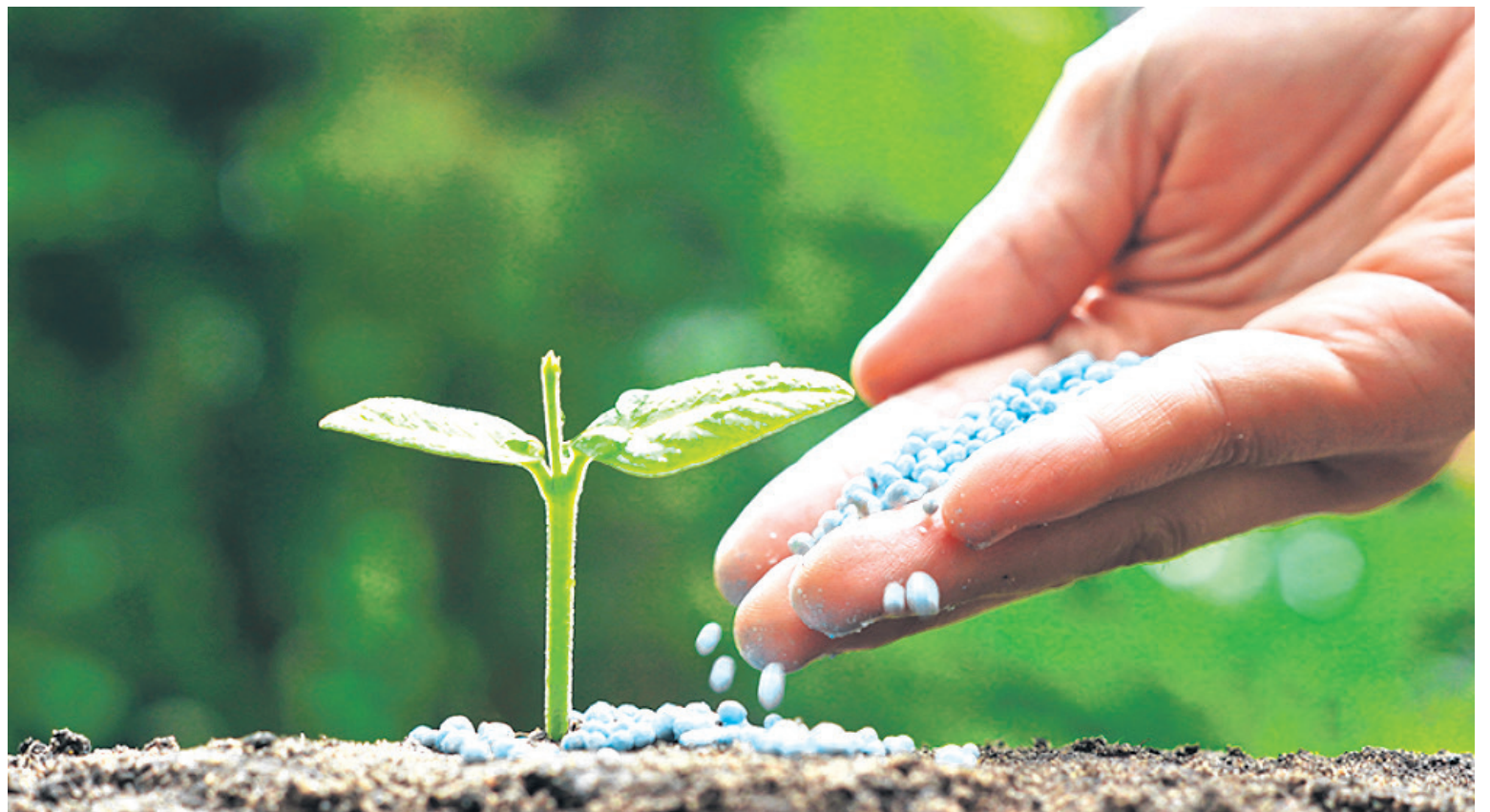
Según la Uptra, durante el primer trimestre de 2023, se registró una disminución del 4,8% en el precio de los fertilizantes en Colombia.

A nivel nacional, en marzo, el subgrupo de fertilizantes simples experimentó una reducción del 3,51%, convirtiéndose en el octavo mes, con excepción de noviembre de 2022, en el que se registra una tendencia a la baja en los precios de los fertilizantes,