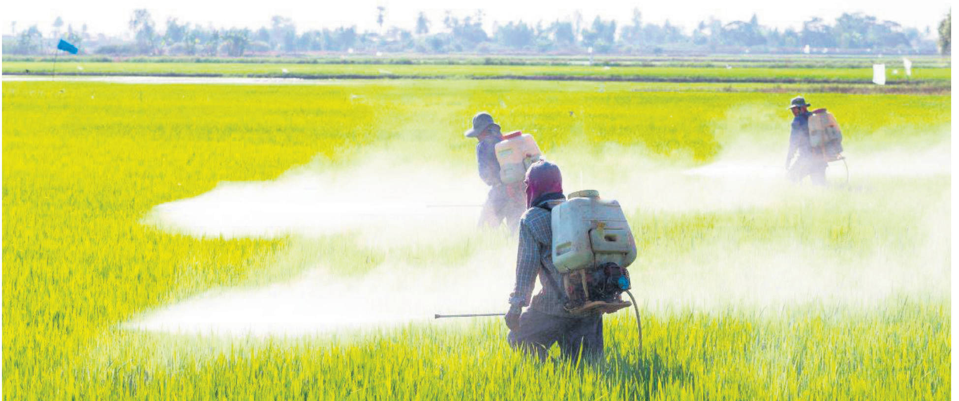
El glifosato es un herbicida de amplio espectro, desarrollado para eliminación de hierbas y de arbustos, en especial los perennes.

En la más reciente tertulia en el Botalón abordamos el tema del glifosato, hemos escuchado sobre él, su relación con el problema del narcotráfico y el debate sobre las consecuencias de su uso, pero es de precisar que el glifosato es un herbicida de amplio espectro que ataca a plantas que no ofrecen un beneficio y compite con aquellas que son deseadas por el agricultor.