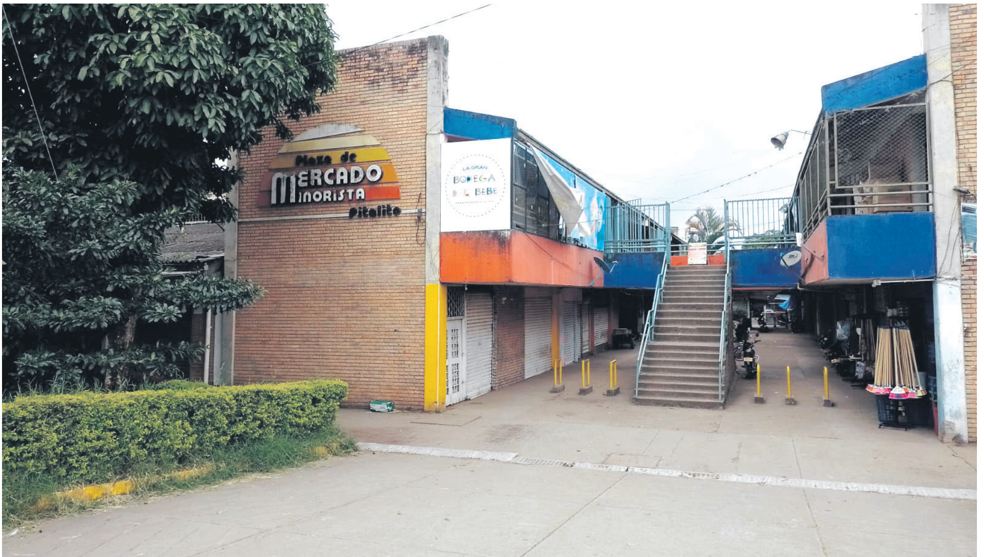
En la imagen aparece presuntamente Olimpo Rivera Medina, ingresando al establecimiento con la perrita.

La población no cabe del asombro. El sujeto agresor, habría tenido relaciones con habitantes de la calle dentro del centro de abasto. Se pronuncia el alcalde del municipio y los comerciantes.