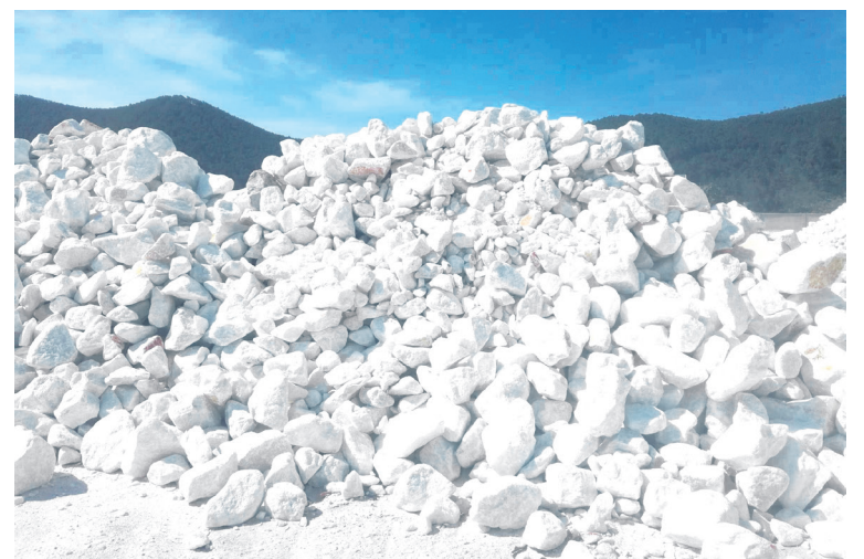
El objetivo con las plantas es pasar de la roca a la obtención en presentación del talco polvillo de calcáreas.

En cuanto a los fertilizantes líquidos, los números también fueron destacados. La producción nacional superó los 7,2 millones de litros, mientras que se importaron 3,3 millones de litros