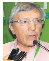
ERNESTO CARDOSO CAMACHO

Con ocasión de la anunciada visita al Huila del expresidente Uribe prevista para hoy sábado 20 de mayo, es necesario recordar que estamos muy próximos a vivir una de las decisiones más trascendentes del sistema judicial que, para bien o para mal, habrá de definir buena parte del futuro inmediato de la política nacional.