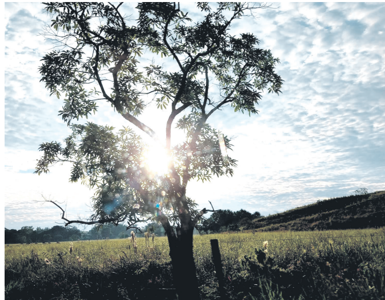
Las comunidades esperan que se logre la Paz Total para así tener todas las garantías que les permita alcanzar la tan anhelada tranquilidad que se ha visto afectada por más de 5 décadas.

Puntos que se leen en el documento firmado por la Asociación Municipal de Colonos del Pato, AMCOP, la Asociación Ambiental del Bajo Pato, ASABP, la Asociación Agro Ambiental Campesina y Gremial de Guacamayas Parti-