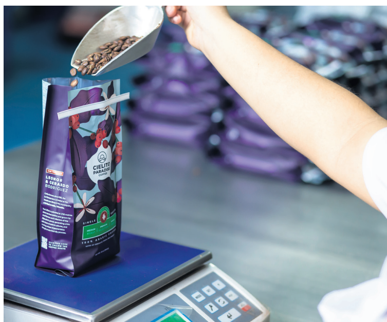
Se destaca además que el 90% del proceso logístico, desde la compra hasta el empaquetado y logística, se encuentran en el Huila, generando desarrollo económico.

Entonces mi trabajo ha sido más que todo tener una buena relación y entender los desafíos y las preocupaciones, ayudarle de una u otra forma a esa persona con quienes trabajamos. Pagarles en este caso el mejor café que se pueda pagar, y mantenernos en un precio justo para mantener esa relación y que ellos tengan una mejor implementación en sus procesos y beneficios”, puntualizó.