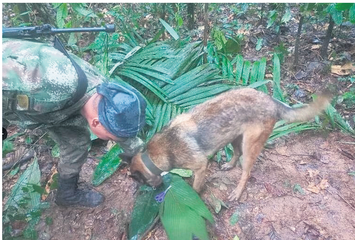
El Ejército continúa realizando la búsqueda de los niños.

Por otra parte, vale la pena recordar que el piloto reportó problemas en el motor de la aeronave minutos antes del siniestro, de acuerdo con el cuerpo oficial de atención de desastres.