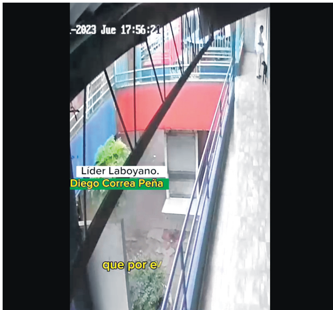
Fachada de la Plaza de Mercado de Pitalito.

contra quienes lo han denunciado. Manifestó que en la plaza ha realizado trabajo de desparasitación de anima-