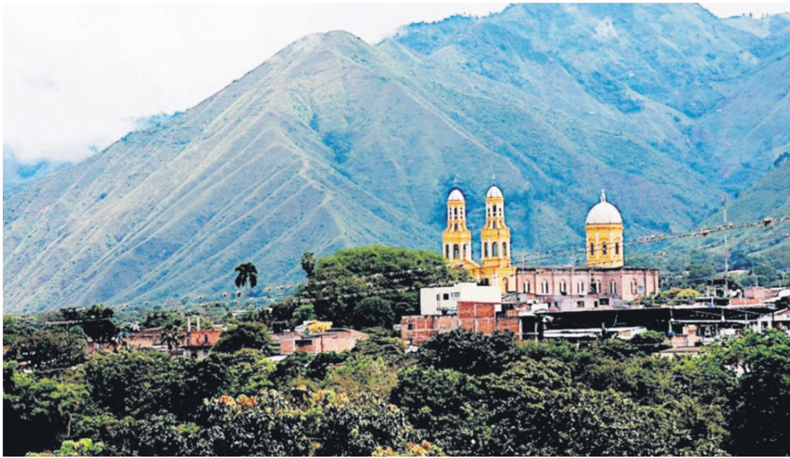
Palermo, es reconocido a nivel nacional por la extracción de calizas, dolomitas y mármoles, necesarios para la producción de agrofertilizantes.

“En muchas ocasiones, el hecho de que tengamos calcaría o fósforo no implica que la planta lo vaya a absorber, necesita un proceso de acidulación y calcinación. Con