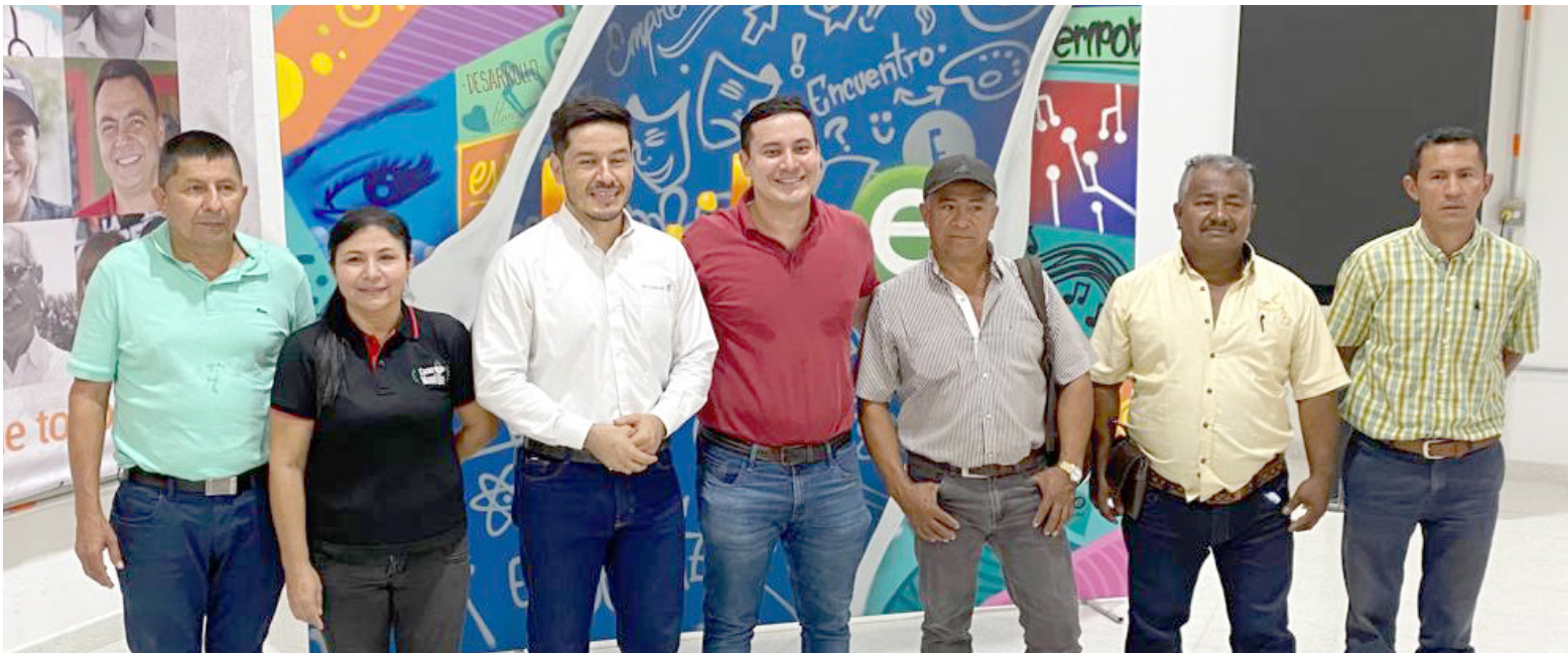
En la foto, los principales y suplentes de los cuatro eslabones de la Cadena de Café.