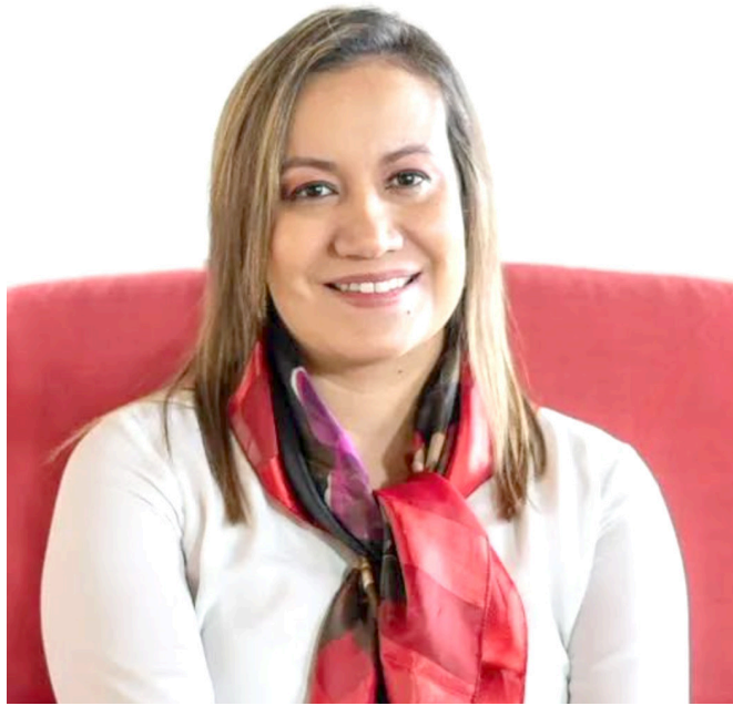
Carolina Corcho, Ministra de Salud.

El representante Andrés Forero, del Centro Democrático, denunció un presunto caso de corrupción en el Ministerio de Salud.