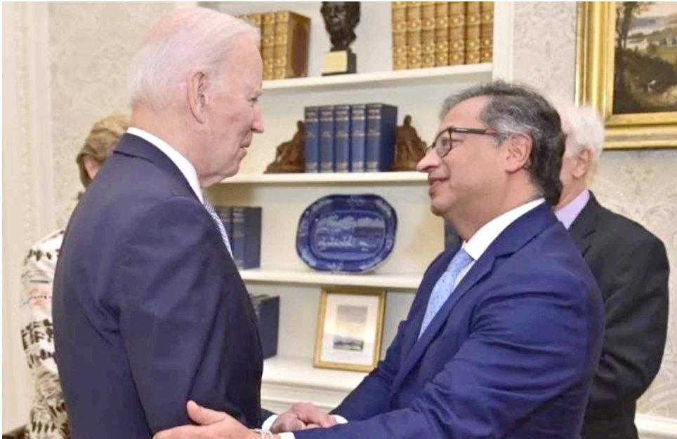
Gustavo Petro y Joe Biden.