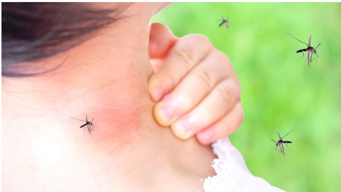
Campoalegre, Hobo y Suaza son los municipios declarados con alerta de brote de dengue debido a la gran cantidad de casos reportados.

Lavar, desinfectar y cepillar todos los rincones de los tanques, albercas y demás contenedores de agua.