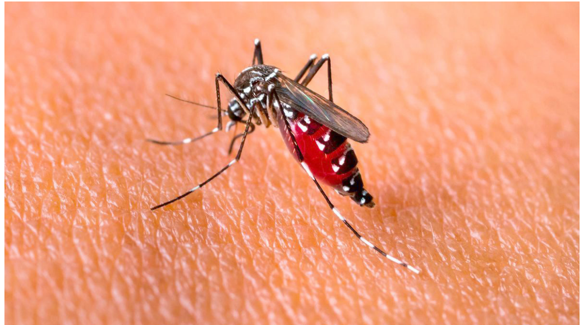
Neiva, Aipe, Palermo y Rivera son los municipios declarados con brote de dengue.

El 77% de los casos de dengue identificados en el Huila que presentaron un nivel considerable de gravedad fueron tratados de manera intrahospitalaria y el 85% de los calificados como graves, recibieron el respectivo tratamiento en unidades de cuidados intensivos de diferentes instituciones de salud.