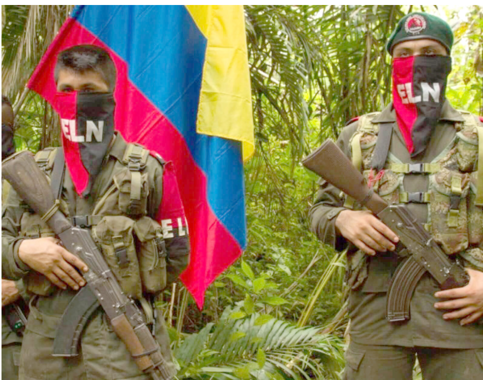
La verdad, justicia, reparación integral, la no repetición y el no olvido son aspectos claves de la propuesta planteada a través de la nueva agenda.

Para finalizar, el punto seis es el Plan General de Ejecución de los acuerdos que, según lo ilustrado en la Ley 2272 de 2022, que conceptualiza a la Paz Total como política de Estado, los consentimientos alcanzados en la mesa de diálogos deben ejecutarse en los próximos gobiernos, concluye el documento.