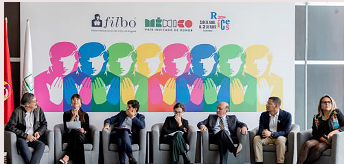
Cerca de 2.000 actividades y 500 expositores formarán parte de la Feria.

El país invitado de honor este año es México y se esperan autores de la talla de la nigeriana Chimamanda Adichie.