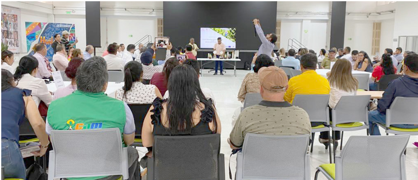
En la conformación del equipo central se aprobarán, promoverán y construirán las políticas y todo lo relacionado con el café en el departamento.