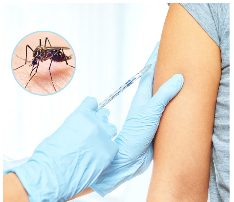
La administración departamental ha hecho un llamado a las instituciones y entidades para analizar la situación que mantiene cifras elevadas.

Además, desde la administración departamental se reiteró el compromiso y responsabilidad de la población para contribuir con la eliminación de los potenciales sitios y/o posibles criaderos del vector endémico de la región, como también desarrollar acciones, planes, estrategias y jornadas que intensifiquen la búsqueda y acumulación de elementos inservibles que, por sus cualidades representan una amenaza en lo que refiere al almacenamiento de reducidas cantidades de agua limpia que lleven a la proliferación del vector Aedes Aegypti o mosquito tigre, caracterizado por