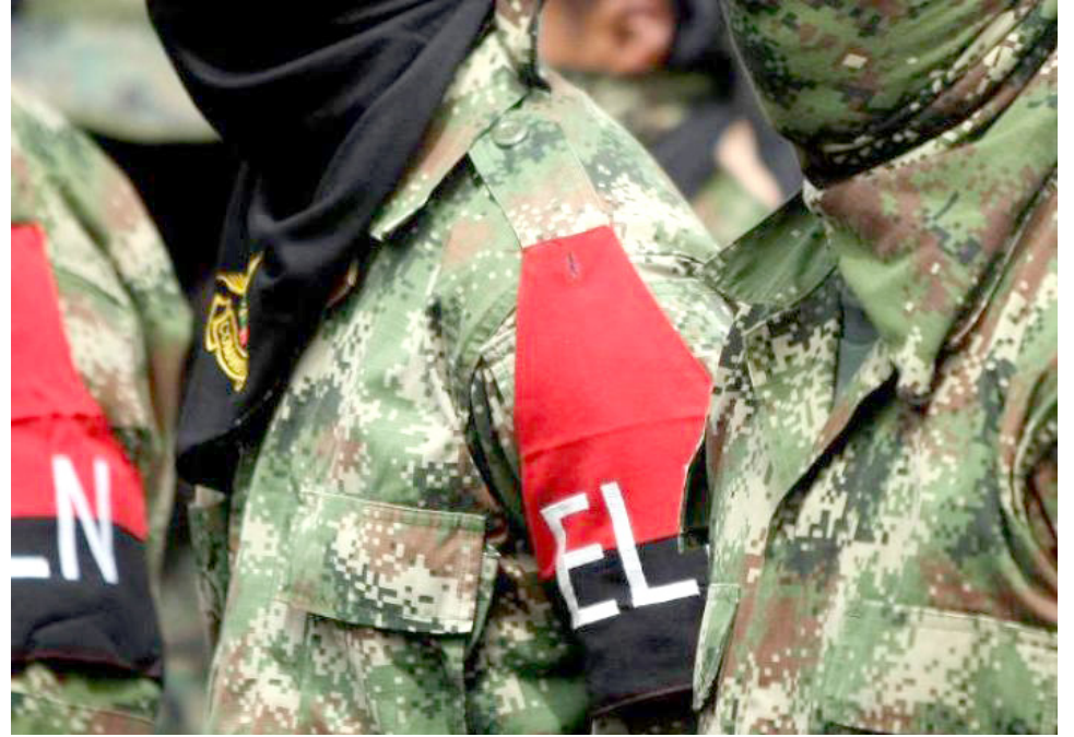
En la nueva agenda propuesta se pretende incluir a la totalidad de actores sociales afectados por el conflicto.

La nueva agenda propuesta por el senador Cepeda incluye seis puntos que tienen como objetivo conducir al establecimiento de bases sólidas para lograr la Paz Total.