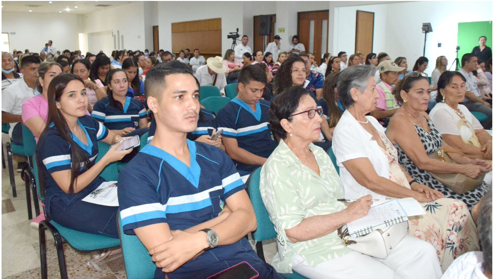
Entre el 31 de enero y el 30 de diciembre del 2022 la ESE Carmen Emilia Ospina realizó 23.027 que permitieron identificar las comunidades con mayor índice larvas.

que, a través de las brigadas de salud, pudiéramos llegar a cada uno de los rincones de esta ruralidad de Neiva ya que algunos están muy retirados”, manifestó el doctor Muñoz Paz.