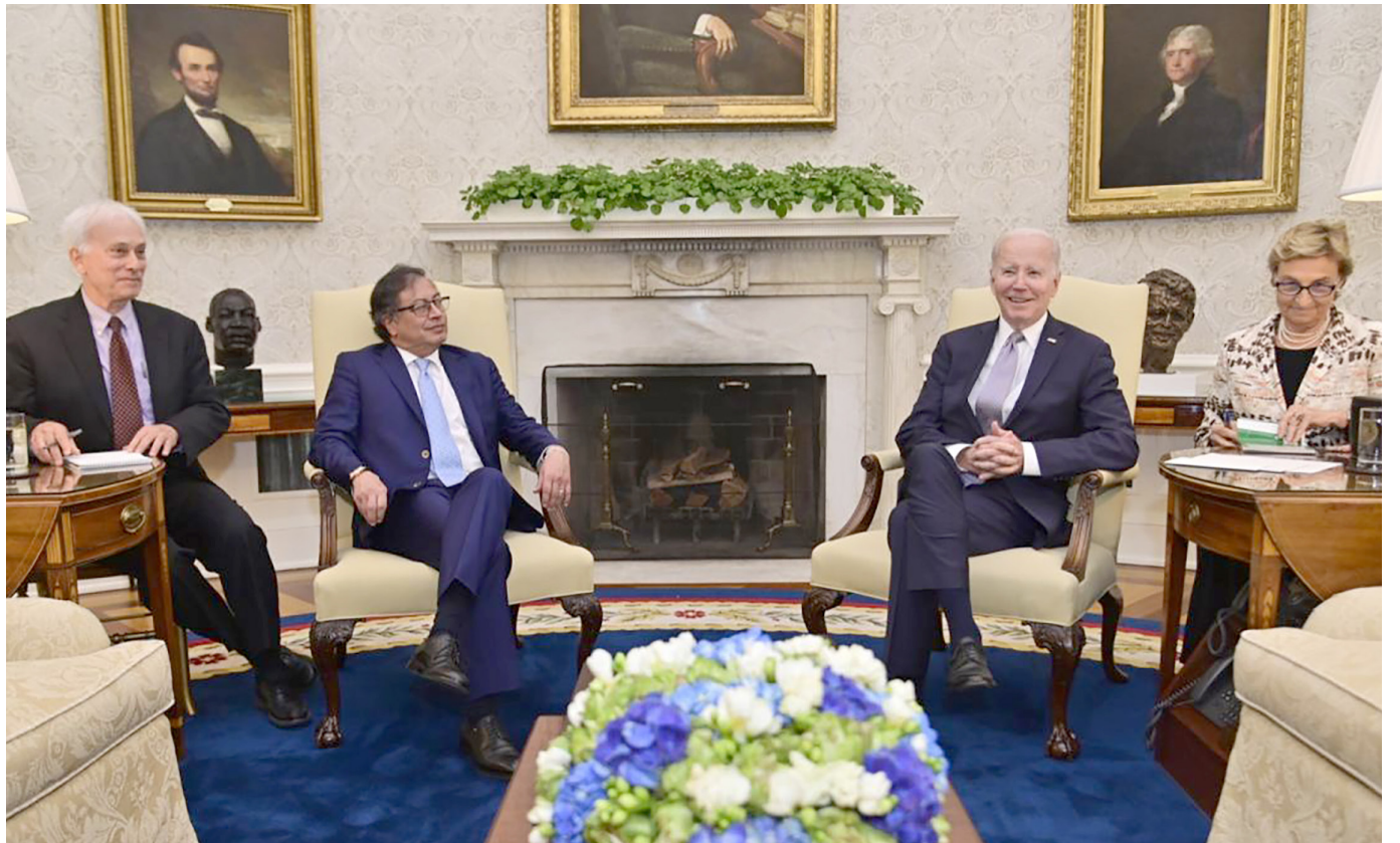
Reunión de Biden y Petro en la Oficina Oval.

Gustavo Petro, presidente de Colombia, y Joe Biden, presidente de Estados Unidos, se reunieron este jueves en la Casa Blanca, en el primer encuentro bilateral de los dos mandatarios desde que asumieron el cargo.