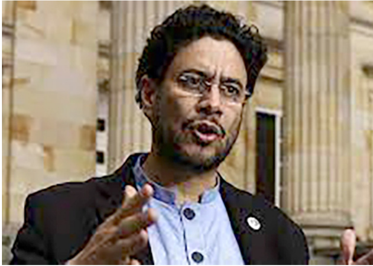
La próxima sesión del diálogo entre el gobierno nacional y el ELN está programado para el 27 de abril.

■ El senador Iván Cepeda presentó la propuesta de crear una mesa de negociación con el ELN para que se desarrolle en Colombia.