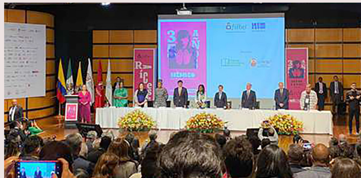
México es el país invitado de honor y Cali, la ciudad invitada.