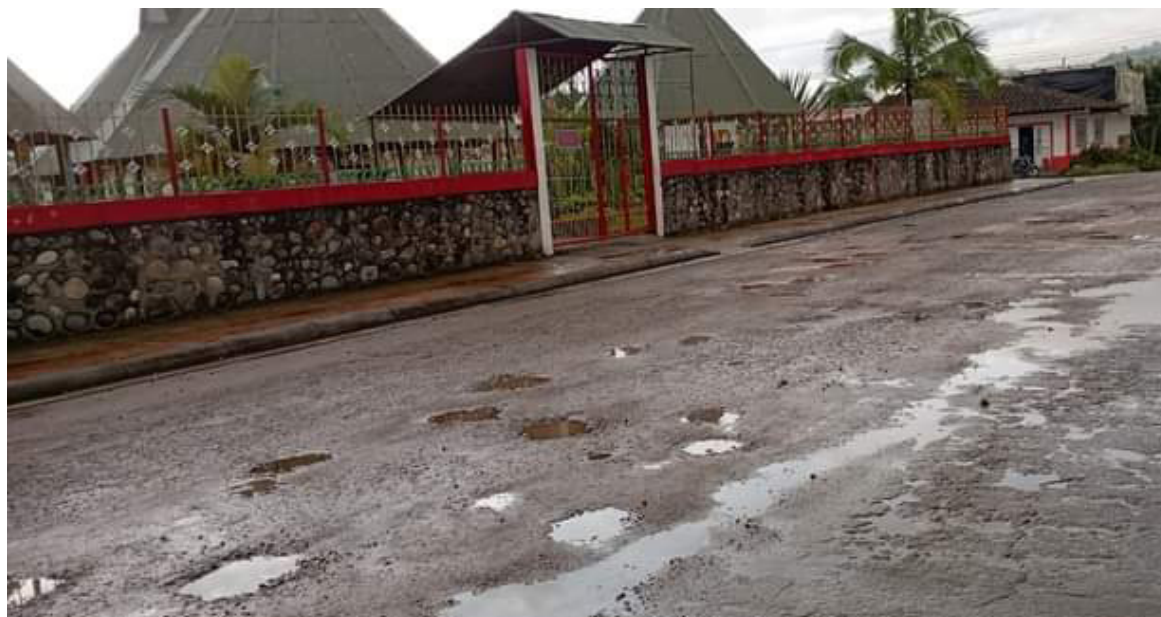
Habitantes indican que el precario estado de las vías está afectando directamente al sector turístico.

“Los gobiernos están utilizando los tiempos electorales para hacerle promesas a las comunidades rurales, especialmente en San Agustín, en tema de placa huellas. Además, con la connotación turística, los gobiernos también han pasado por alto el arreglo de las vías”.