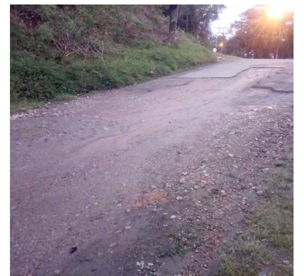
Los proyectos de placa huella, han sido prometidos desde el 2019, por varios candidatos pero, agregan, que a la fecha no hay resolución.