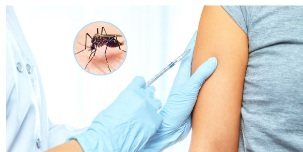
Casos de dengue continúan aumentando en el Huila