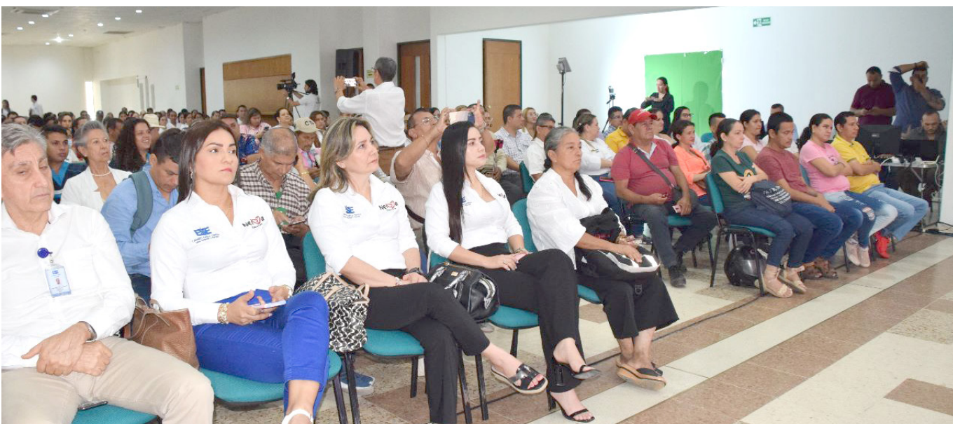
Comunidad participó en la audiencia pública de rendición de cuentas de la ESE Carmen Emilia Ospina.

Dos de los principales desafíos a los que se ha enfrentado la ESE Carmen Emilia Ospina ha sido la pandemia y la gran brecha presupuestal que le dejaron las EPS Comfamiliar y Medimás, cuya deuda asciende a más de 9 mil millones de pesos.