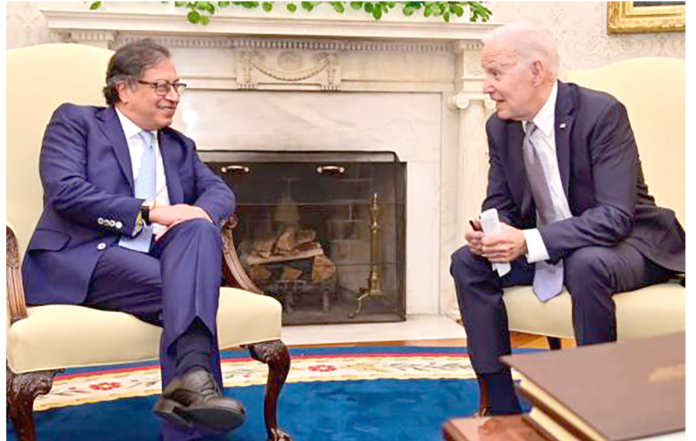
El mandatario habló sobre la construcción de una "alianza por el progreso".

■ El presidente colombiano explicó a la prensa los principales detalles de su encuentro con Biden.