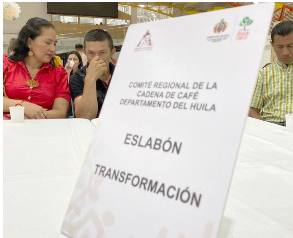
En este trabajo, se desarrollaron las mesas de los eslabones de producción, transformación, comercialización y exportación.

En este ejercicio se socializó el reglamento del Comité y se eligió el cuerpo operativo, en pro del acuerdo de competitividad, y el equipo central para propuestas con la Gobernación del Huila.