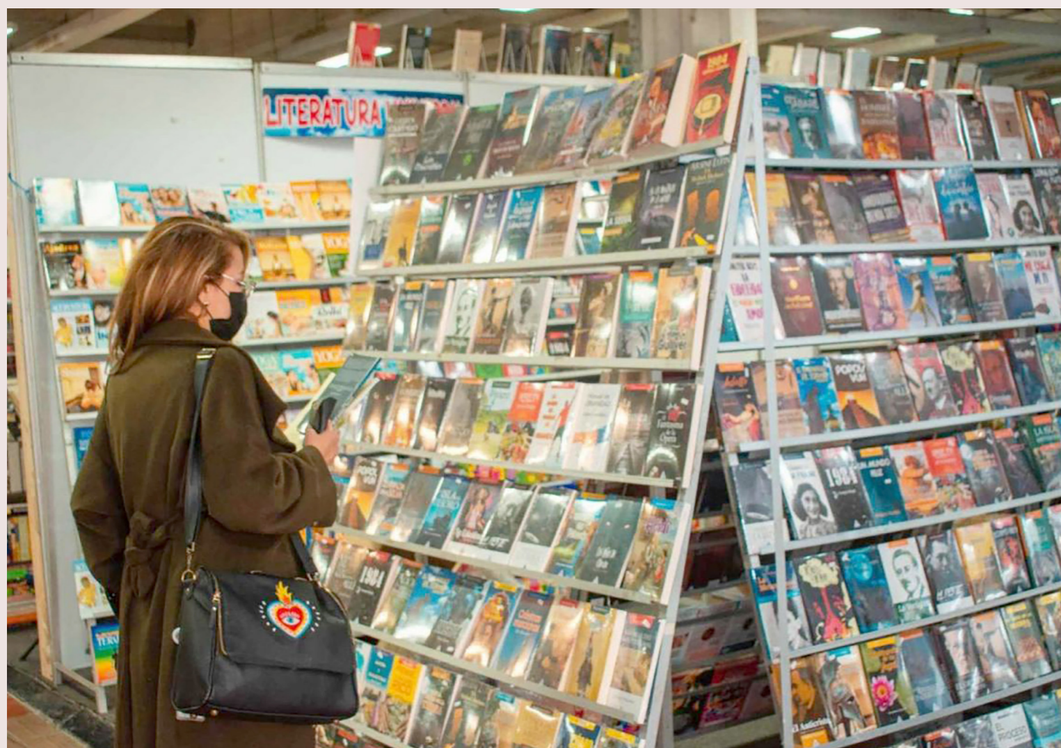
La FILBo comenzó el 18 de abril y va hasta el 2 de mayo en Corferías. El país invitado de honor es México.

Para el ingreso a la feria también habrá ciertos convenios. Entre ellos, los docentes de la Secretaría de Educación del Distrito y los trabajadores del Ministerio de Educación podrán acceder al recinto de manera gratuita, presentando el carné de funcionarios. Los suscriptores de El Espectador podrán acceder al evento con entradas 2x1 todos los días.