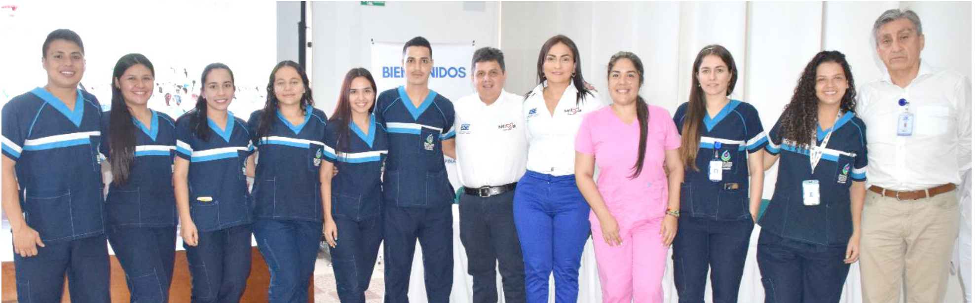
La comunidad opina que está satisfecha con las acciones de mejora desarrolladas en la ESE.

para la infraestructura de las sedes, incluyendo las de Fortalecillas, Aipecito, los avances que se han hecho de manera muy importante en el CAIMI, de cara ya a este semestre que esperamos terminar la importante obra, dan cuenta de una rendición de cuentas en donde la prioridad fue la gente”, explicó el gerente de la entidad.