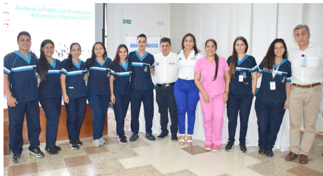
Así está la atención en salud en Neiva