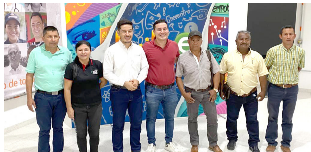
Caficultura huilense conformó el Comité regional