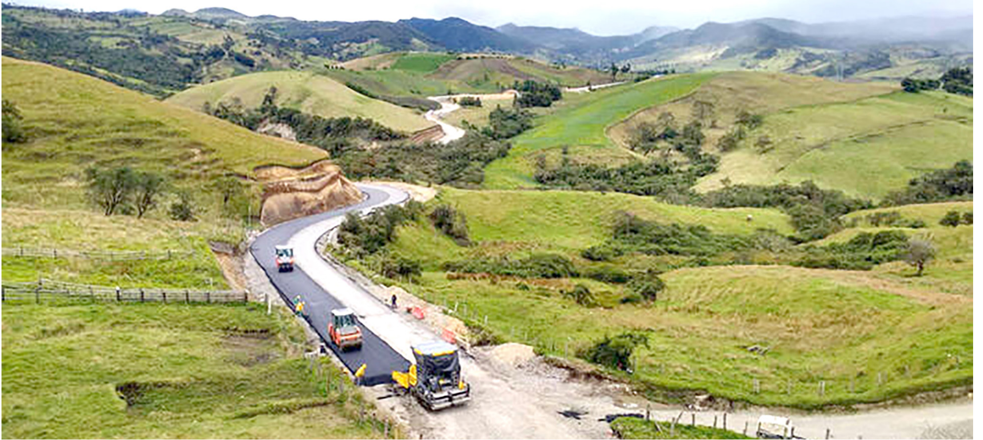
En la zona, permanece la zozobra, y muchos transportadores prefieren guardar silencio frente al tema de inseguridad.

■ En una verdadera odisea se ha convertido el paso entre los departamentos del Huila y Cauca, ante la precariedad del corredor vial. Transportadores aseguran que a la altura de los sectores de El Lago y Córdoba, hay situaciones críticas de tránsito.