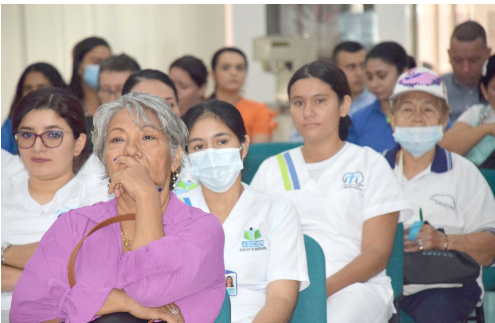
El cierre de las EPS en el Huila afectó considerablemente el ingreso presupuestal de la ESE Carmen Emilia Ospina.

enfocado a darle estabilidad institucional para que pueda prestar los mejores servicios y el desarrollo de proyectos que constituyó otros de los elementos de gran alcance