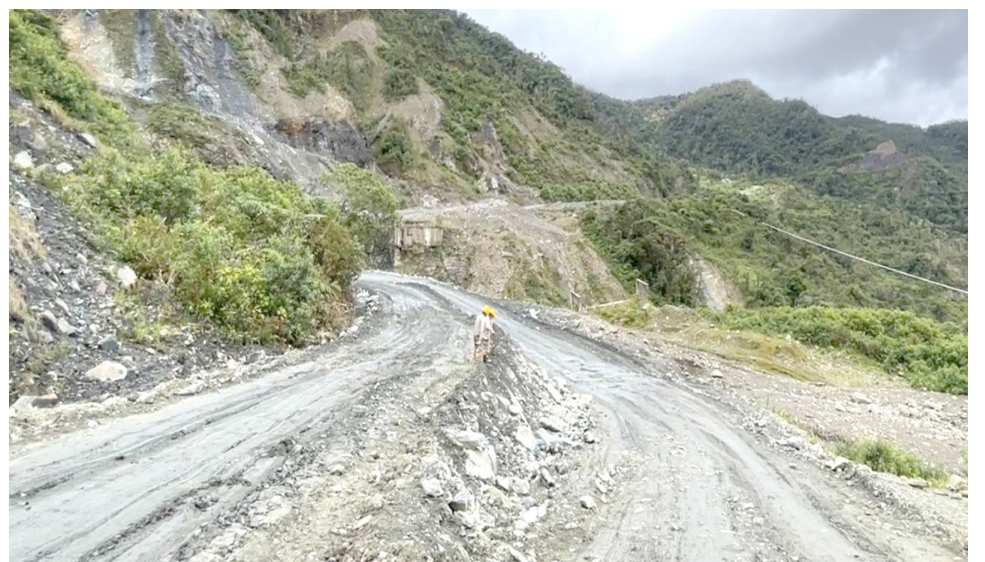
Transportadores señalaron que nuevamente hay dificultades en dos puntos específicos: sectores de El Lago y Córdoba, sobre el kilómetro 70.

El proyecto, en el contrato 518 de 2012 incluía el mejoramiento, gestión social, predial y ambiental de la Transversal del Libertador fase II, por 45.57 kilómetros en el sector Totoró - Gabriel López - Inzá - Guadalejo - La Plata.