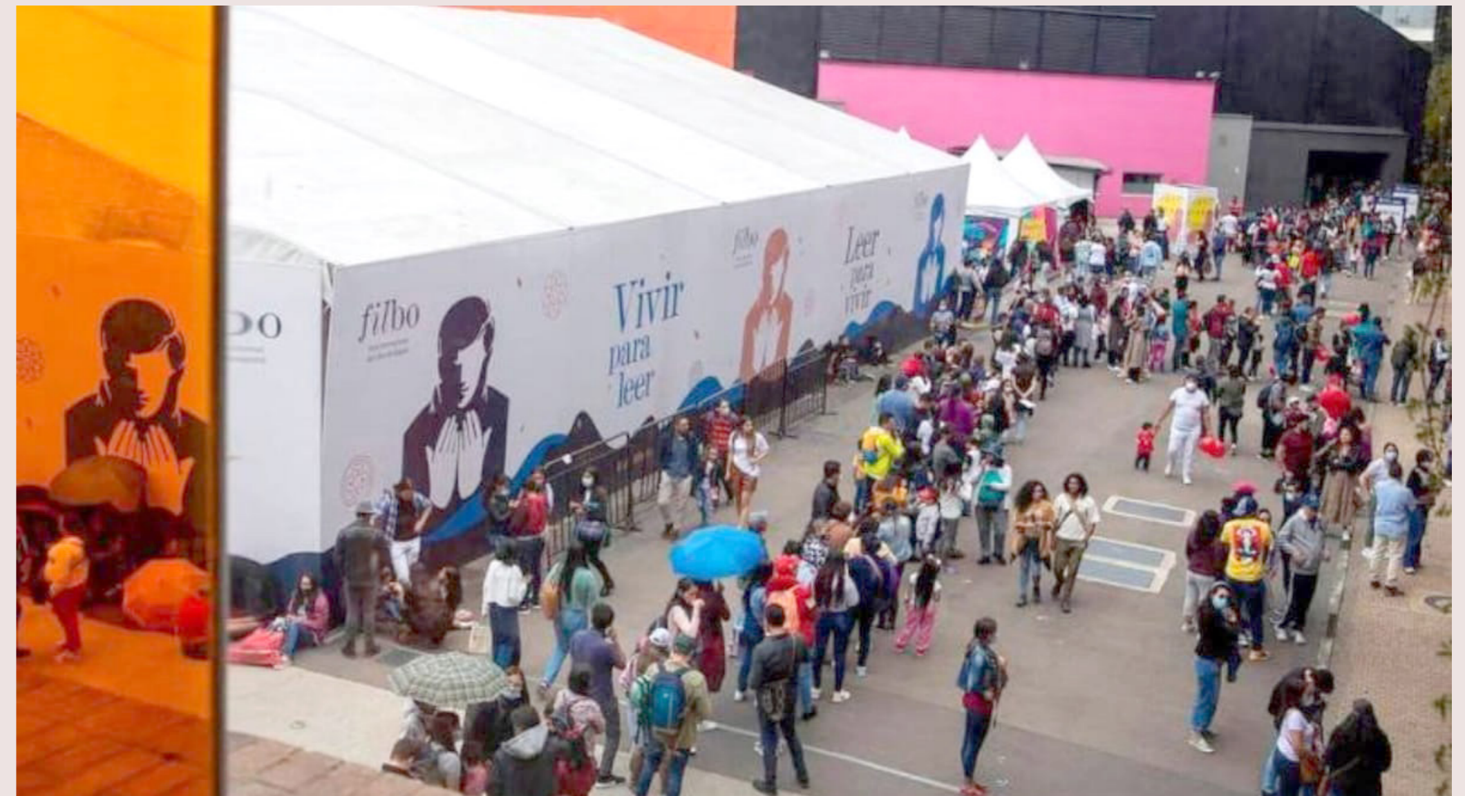
Filbo 2023 tendrá este año una agenda de más de 150 actividades con 200 invitados, del 18 de abril al 2 de mayo.

El evento organizado por la Cámara Colombiana del Libro y Corferías, contará con el pabellón “#LEOBogotá, una ciudad que LEO es una ciudad que cuida”, a cargo de Idartes, en el cual