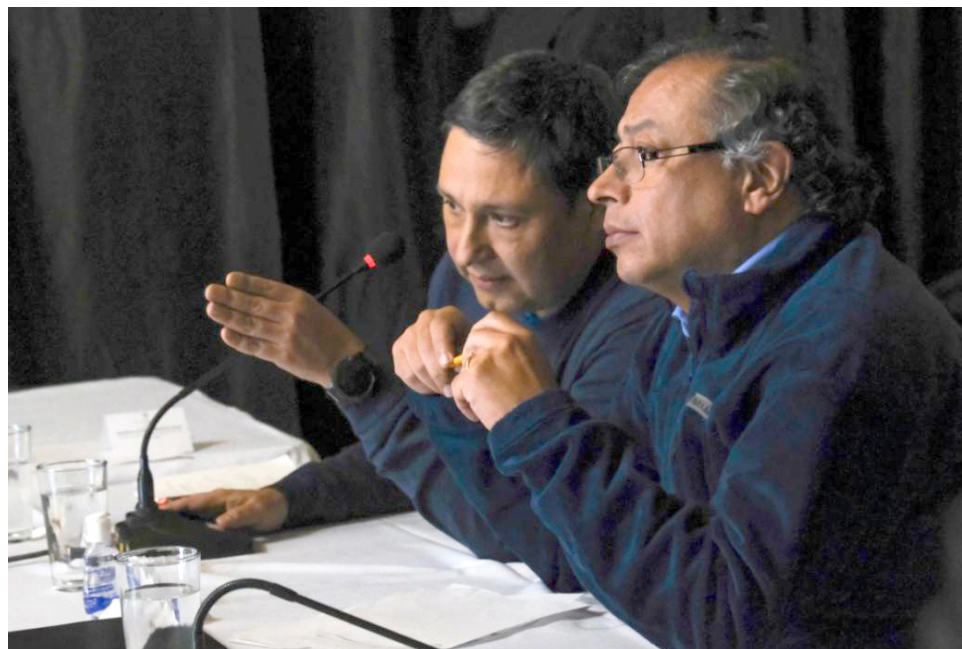
Desde la bancada del presidente aseguran que se perdió la confianza en el funcionario.

“Ya no hay cercanía, se fue perdiendo”, agregan, señalando que Mauricio Lizcano no ha estado en ninguna de las reuniones de carácter político en las que ha participado el presidente Gustavo Petro en los últimos meses. Sobre todos hacen énfasis en la crisis que causó el tire y afloje por la reforma li-