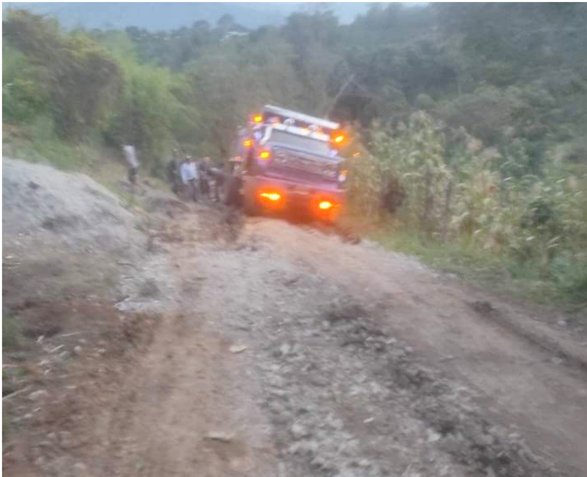
Según la comunidad, el mal estado de las vías, es usado como promesa de campaña por los candidatos de turno.

■ Mediante denuncias anónimas, habitantes del municipio de San Agustín, señalaron que han tenido que recurrir a mingas para poder intervenir varias vías de la zona rural y hasta las que conducen al Parque Arqueológico, porque el Estado no lo ha hecho.