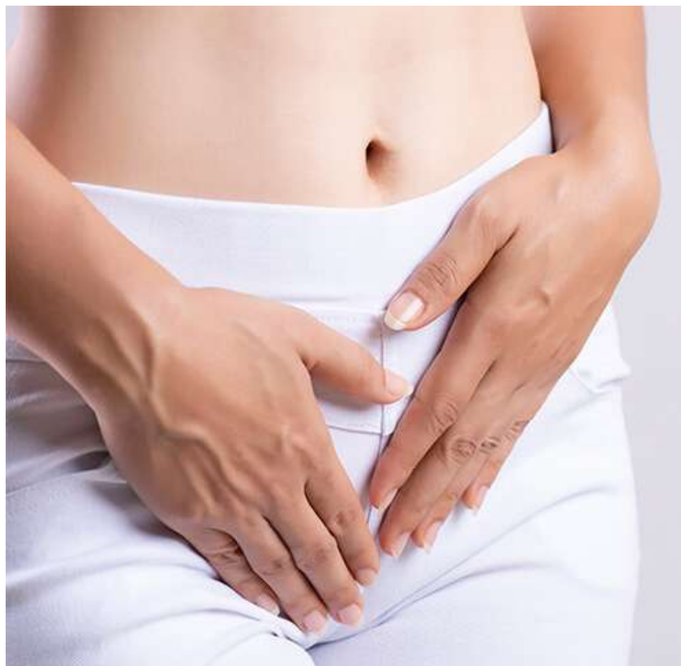
La incontinencia urinaria, pérdida del control de la vejiga, es un problema frecuente y que a menudo causa vergüenza.

Cuando se sufre de incontinencia de esfuerzo se puede tener pérdidas de orina en las siguientes situaciones: al toser o estornudar, al reír, al inclinarse hacia adelante, al levantar cosas pesadas, al hacer ejercicio y al tener relaciones sexuales.