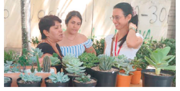
Cultivo de cactus y suculentas de la terapia al emprendimiento