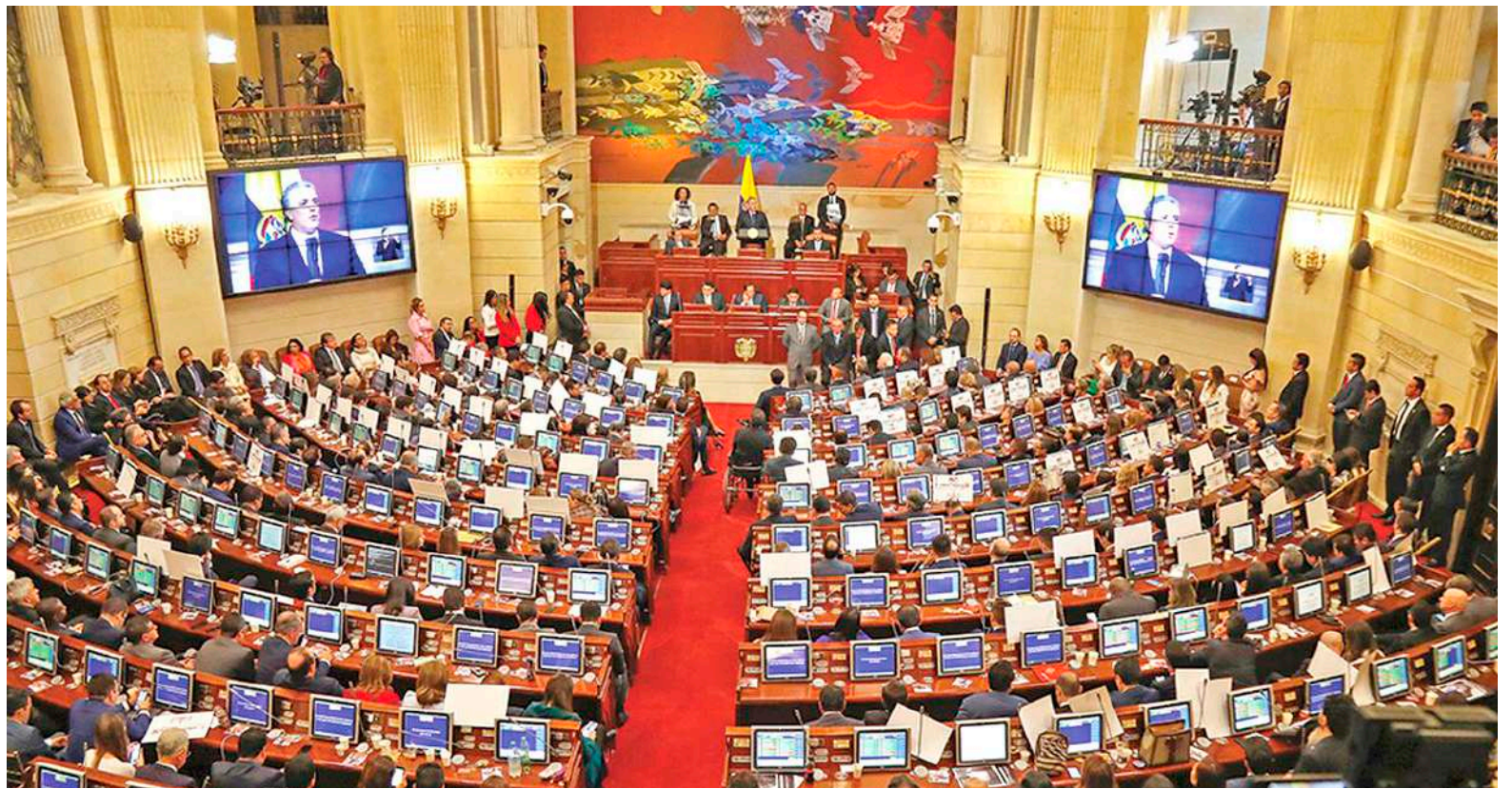
El Congreso tendrá la labor de evaluar estas iniciativas.

de la reforma está volver a establecer que la jornada nocturna comience a las 6 de la tarde, revirtiendo lo que hoy es a partir de las 10 de la noche. También buscará suprimir los contratos temporales, así como establecer un salario mínimo vital y móvil, estabilidad laboral y protección especial a la mujer.