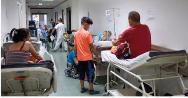
Alerta amarilla para la red hospitalaria en el Huila