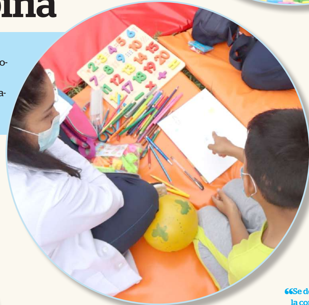
Los estudiantes han logrado fortalecer sus habilidades a través de la práctica.

importante dentro de los servicios de salud.