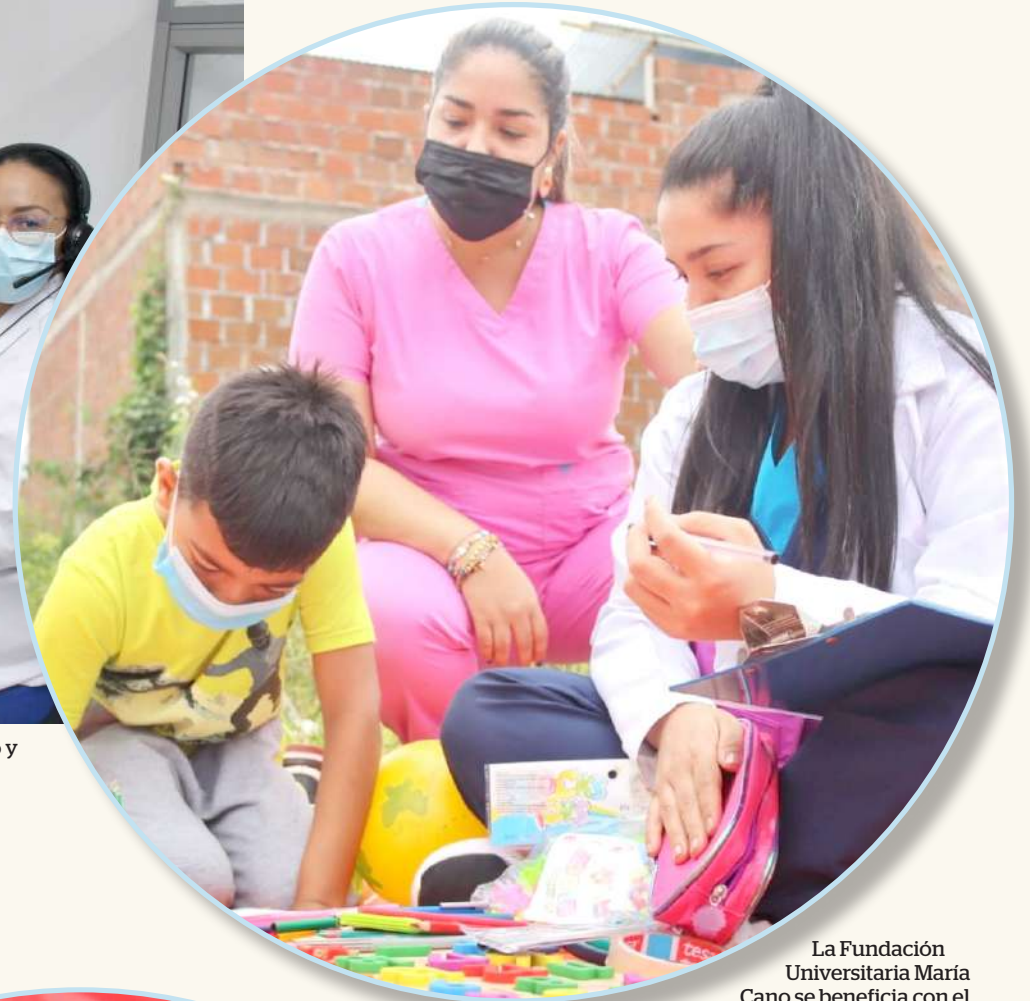
La Fundación Universitaria María Cano se beneficia con el programa de Fisioterapia.