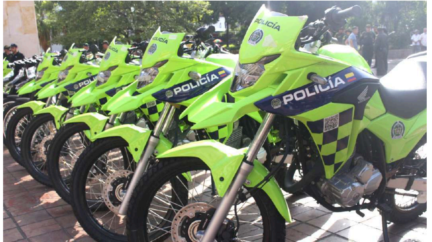
Normalmente los entes territoriales entregan elementos de movilidad y tecnología a las autoridades policiales en aras de que puedan cumplir su misionalidad

En efecto de que las autoridades policiales tengan la posibilidad de cumplir con su misionalidad. Ante esto, Diario Del Huila, indagó con los comandantes de Policía Huila y Policía Metropolitana de Neiva.