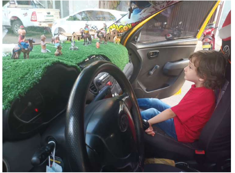
Muchos se sorprenden cuando los recoge en las calles.