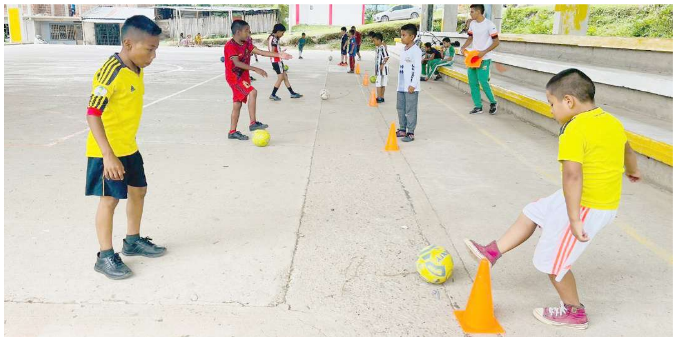
Con el programa se llegó a 800 niños y niñas en el departamento.

“Cerramos el programa este año con una atención de cerca de 800 niños y niñas en diez municipios de la geografía huilense, este impacto se consiguió a través de varias disciplinas deportivas”.