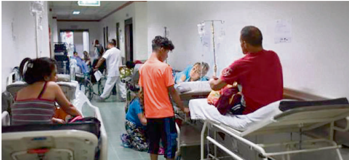
Se debe garantizar la atención hospitalaria.

Con el propósito de garantizar la adecuada prestación de los servicios de salud en todo el