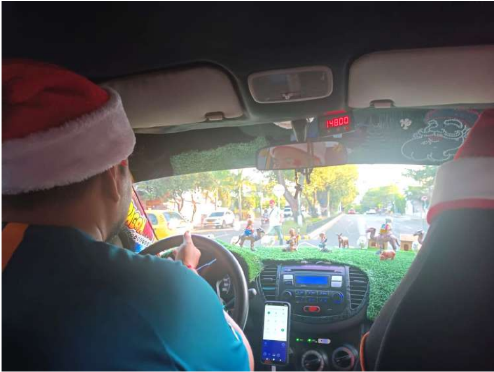
Carreras con pesebre a bordo del taxi.