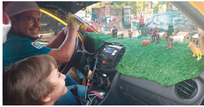
Taxi con espíritu navideño