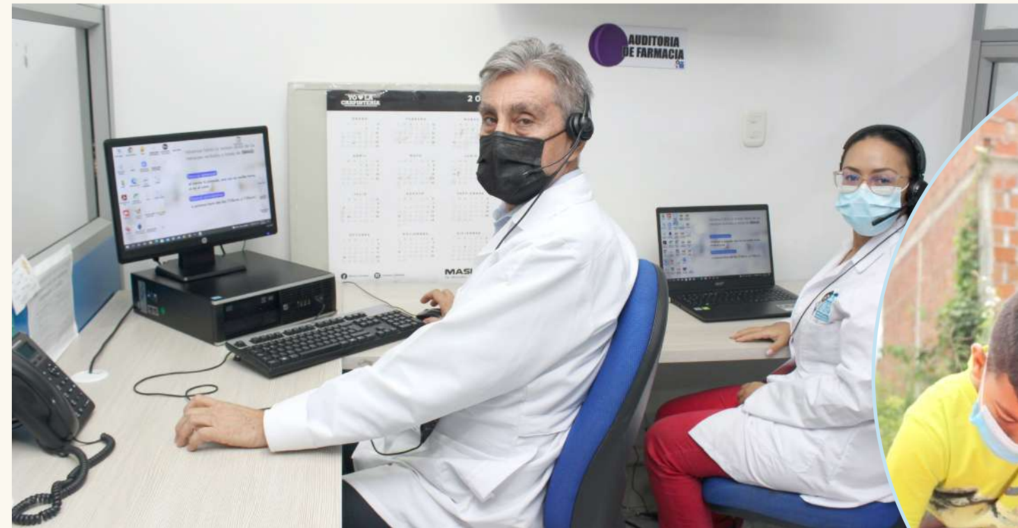
El Convenio Docencia Servicio contribuye a la formación de estudiantes de universidades y centros de educación para el trabajo y desarrollo humano.