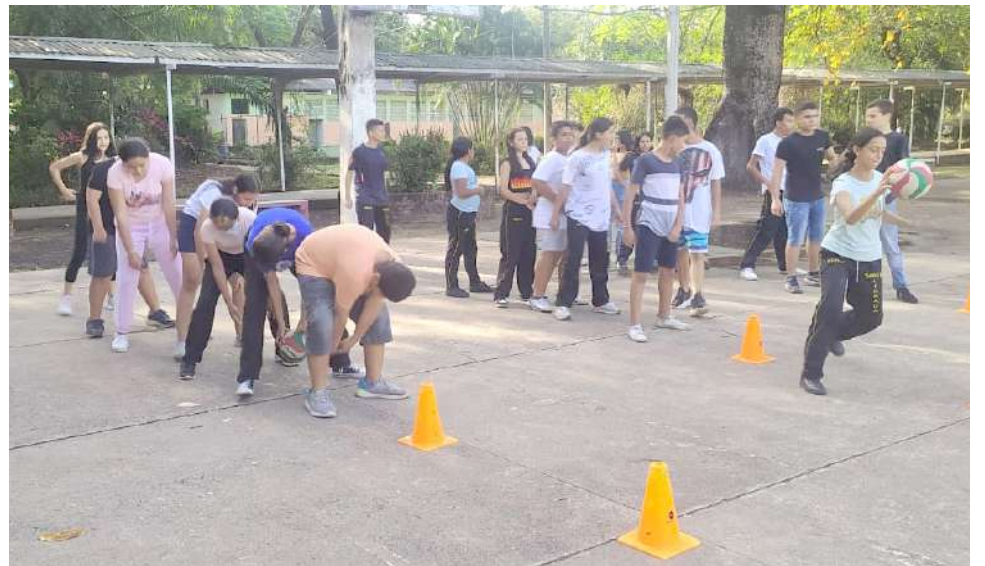
El impacto es mayor si se tiene en cuenta la interacción con las familias.