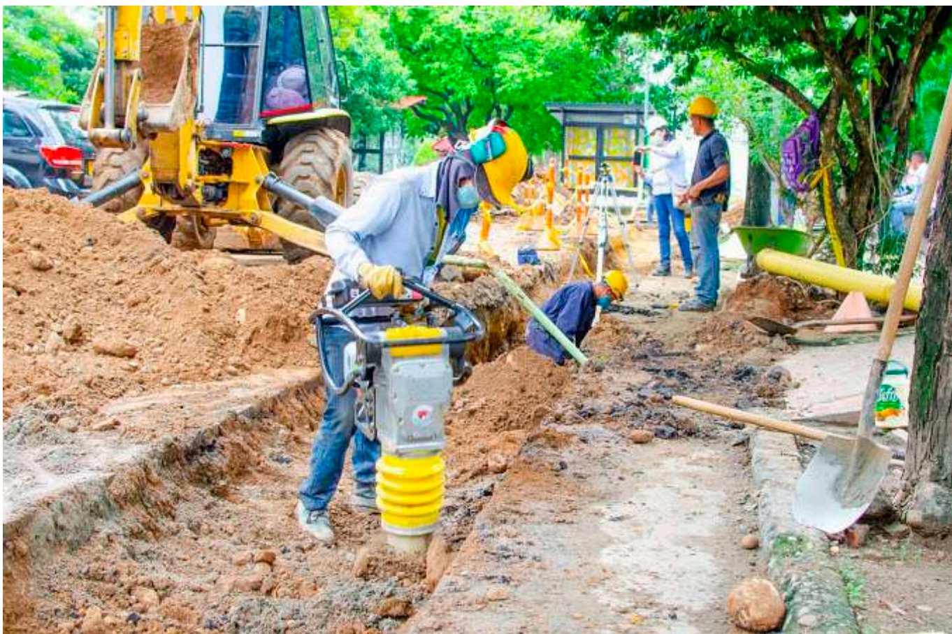
También se aprovechó el espacio para realizar algunos cuestionamientos que realizan los mismos ciudadanos.

La sectorización necesitaría otra intervención que nos la ha prometido el Gobierno Nacional, y con ello, sería una fase tres.