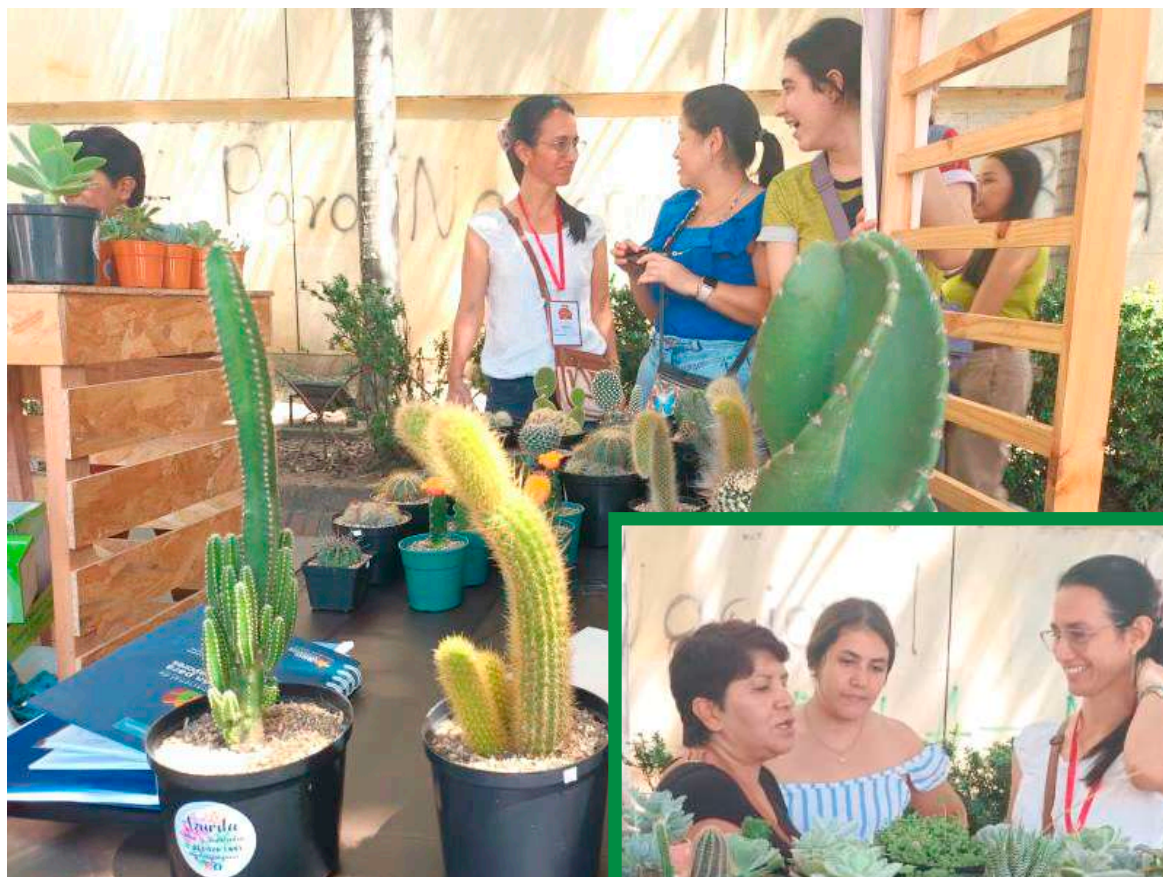
De la terapia al emprendimiento con cactus y suculentas.

Con el cultivo de cactáceas llevan ya más de dos años, que han aprendido a cultivar paso a paso, a través de las ganas de aprender, leyendo mucho y teniendo siempre como base el interés por crecer cada día con un enfoque que a la vez con el