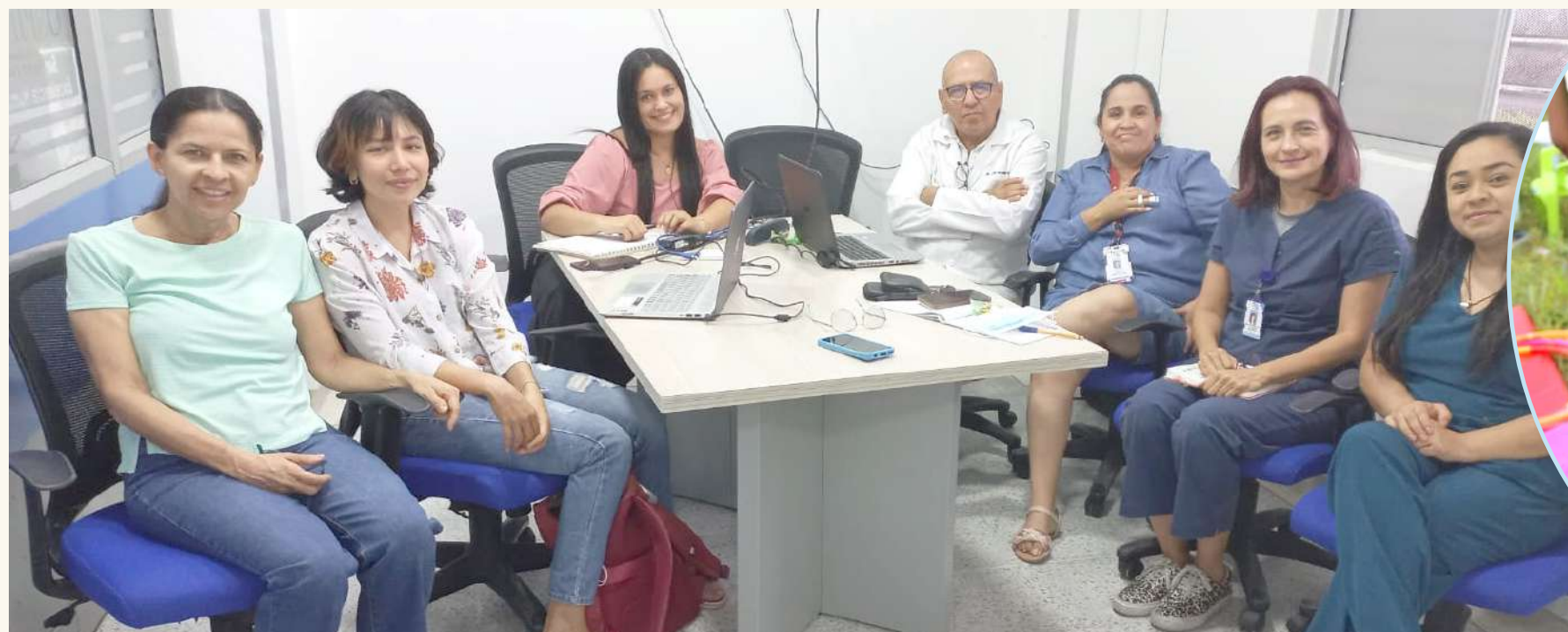
Funcionarios y contratistas han logrado capacitarse a través del convenio.