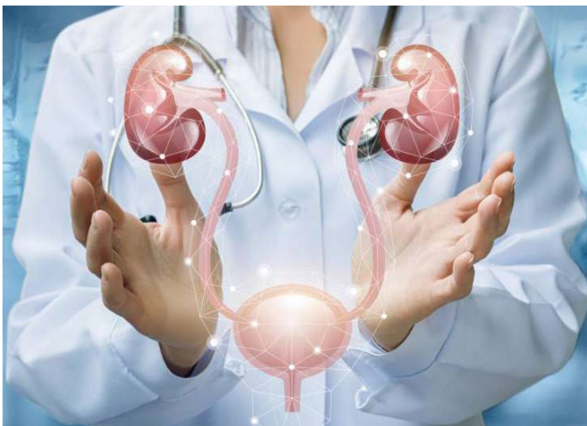
La incontinencia urinaria puede ser causada por determinados hábitos diarios