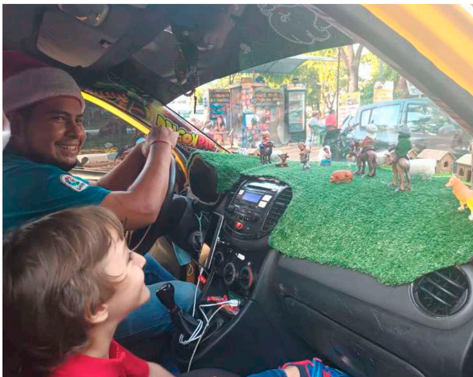
Los más felices son los niños.

El pesebre lo armó el siete de diciembre en compañía de la no-