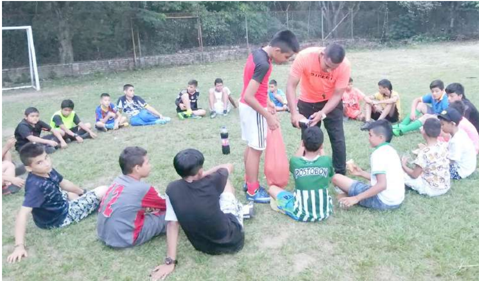
Fueron varias las disciplinas deportivas las que se practicaron.