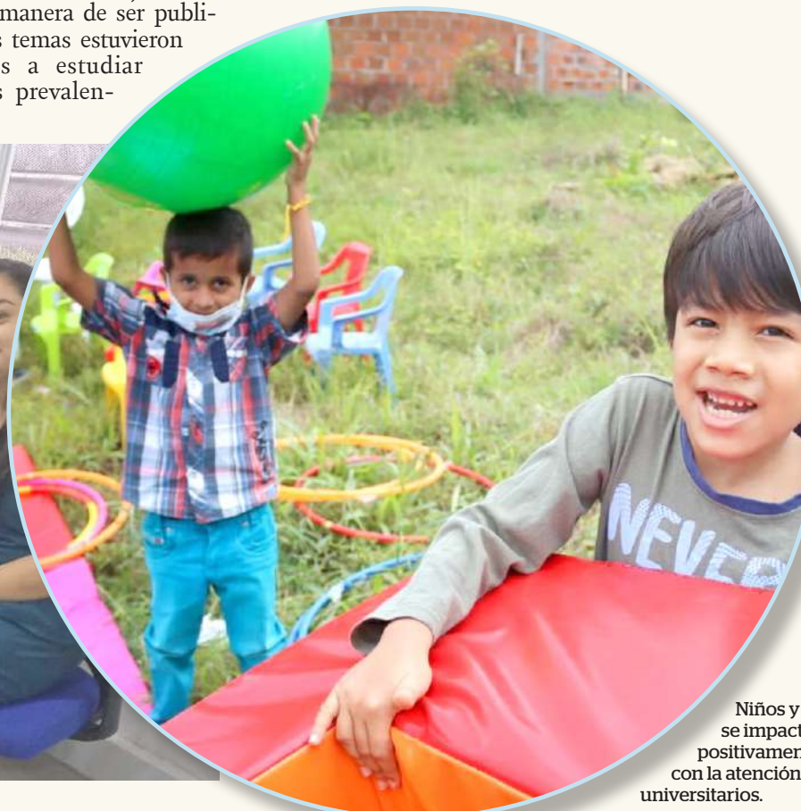
Niños y niñas se impactan positivamente con la atención de los universitarios.

tes dentro de la institución", detalló el docente sobre este ejercicio en el que continuarán organizando para lograr que la investigación en el área ambulatoria sea una actividad normal e