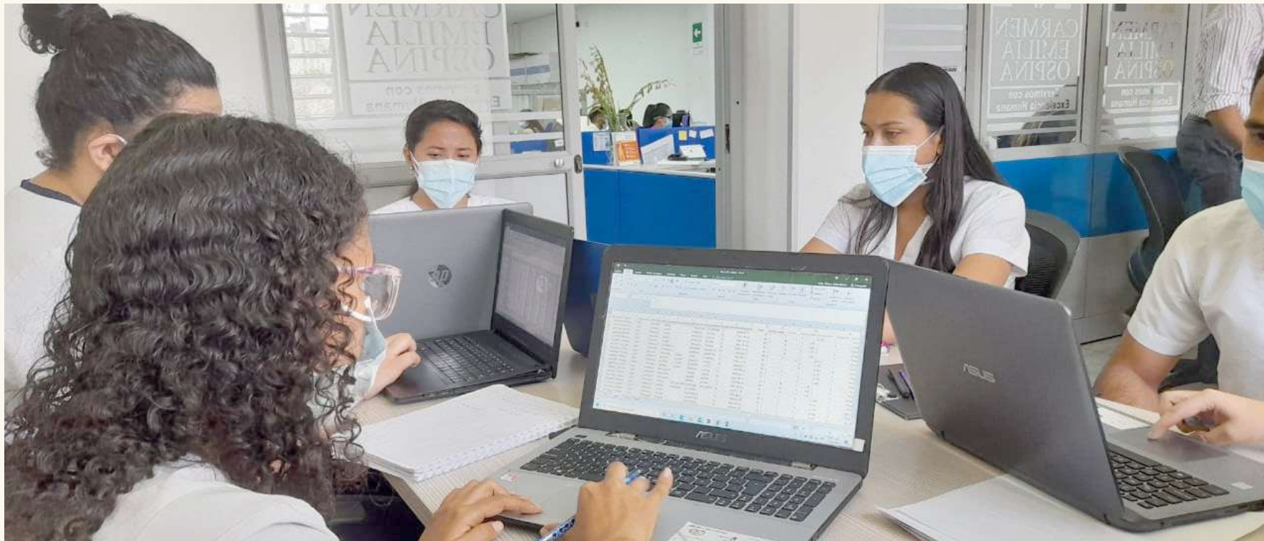
El Convenio Docencia Servicio ha logrado beneficiar a 1.500 estudiantes.