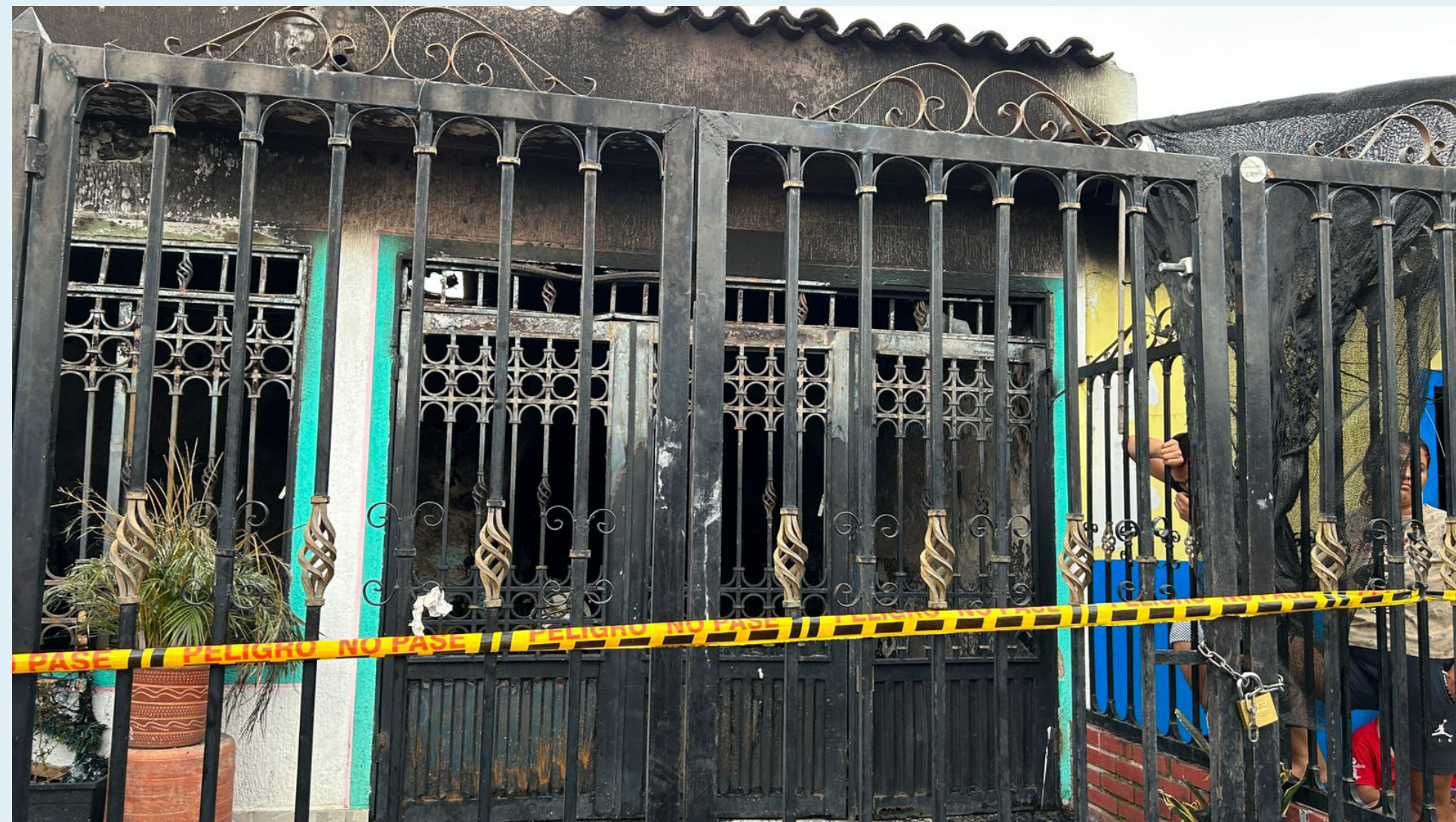
Ocho personas fallecieron tras el incendio el pasado 15 de diciembre en el barrio Santa Isabel de Neiva.

Ya cuando se pudo acceder al sitio y se empezó a controlar las llamas, se comenzaron a encontrar las personas. Ellos estaban todos en