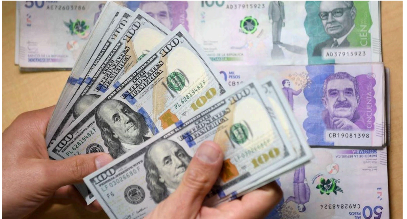
Peso frente al dólar.