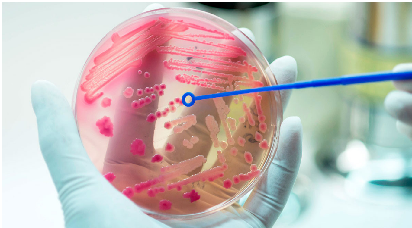
La septicemia puede provocar coágulos sanguíneos atípicos.

El otro desafío es mejorar el sistema de identificación de pacientes con septicemia para tratarlos antes de que sea demasiado tarde.