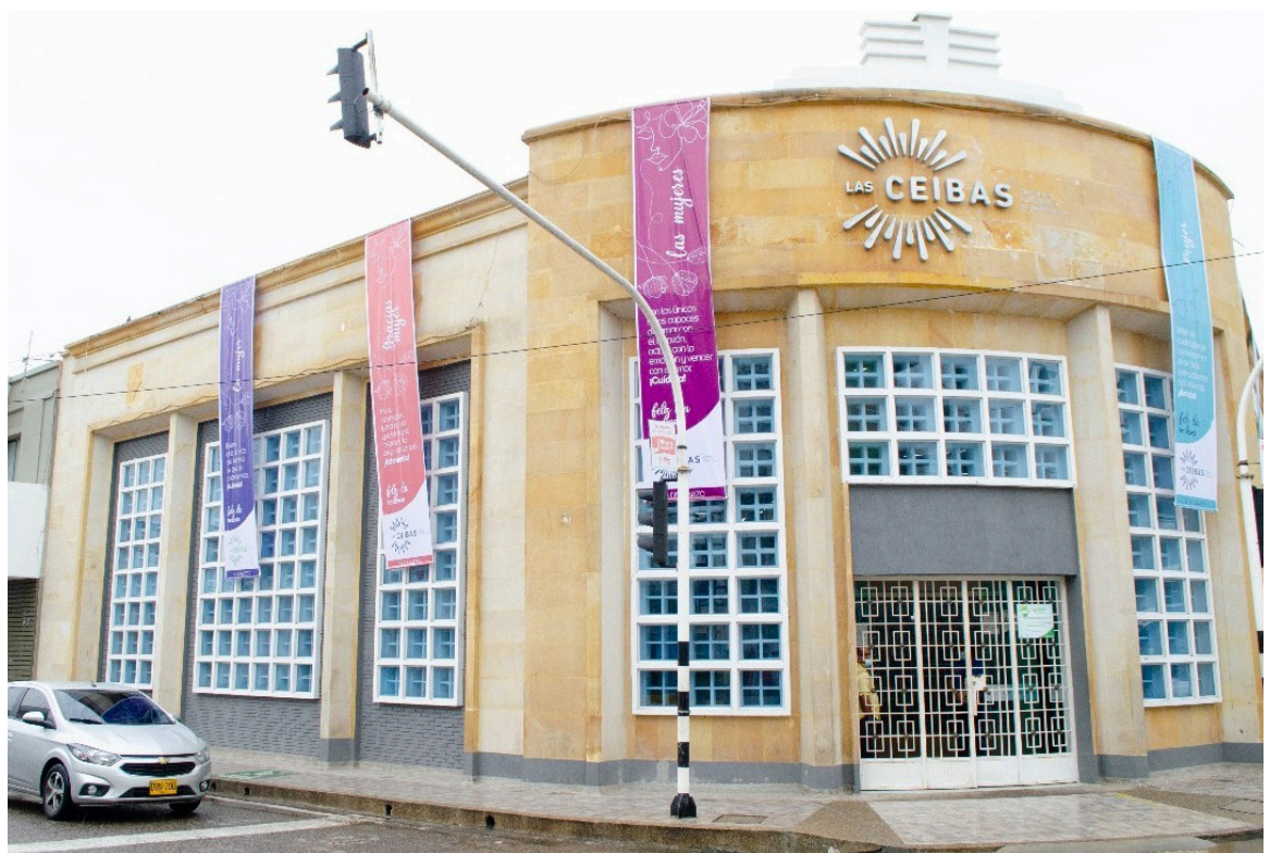
En EPN, encontraron hallazgos por $89 millones.

Gilberto Mateus Quintero, contralor de Neiva, manifestó. “Tenemos unos hallazgos fiscales por cerca de $3.500 millones de pesos, y unos beneficios de auditoría por $215 mil millones. De igual manera, hay descubrimientos administrativos y esto permitiría que el desempeño de la gestión fiscal mejore”.