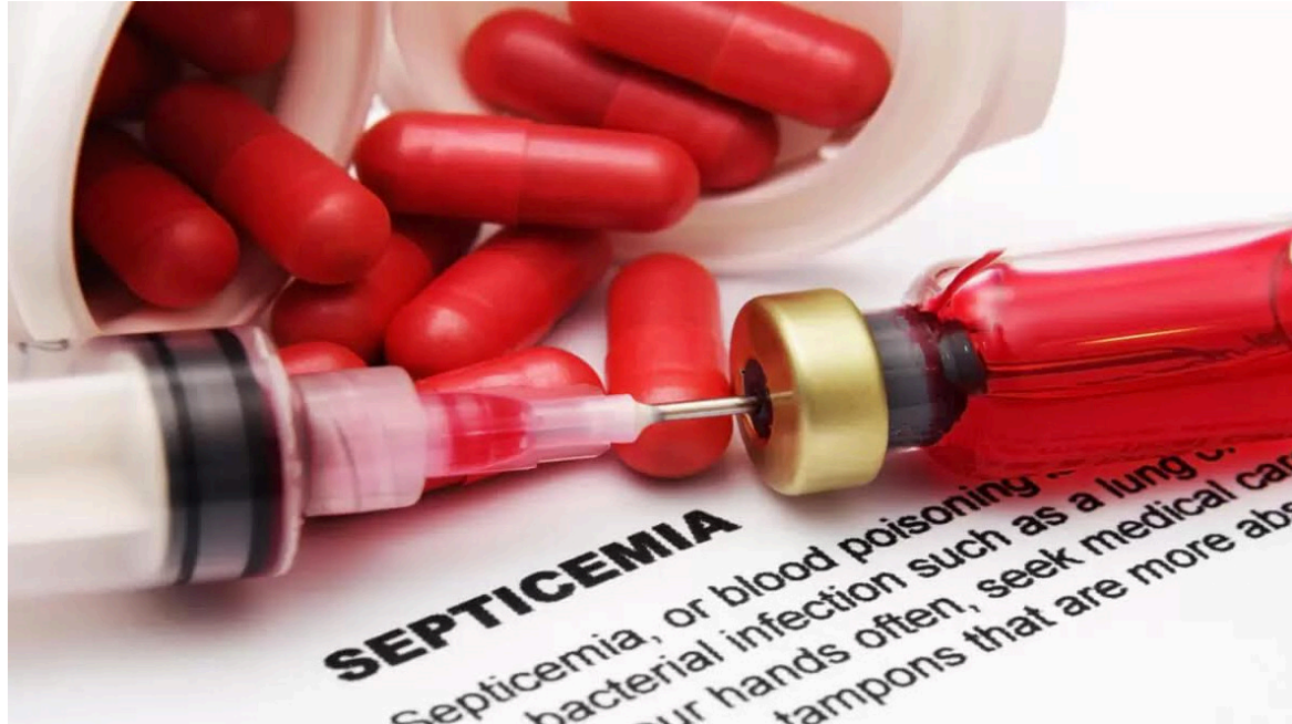
El tratamiento contra la septicemia es más exitoso si se la detecta tempranamente.

duras graves, traumatismos físicos o enfermedades prolongadas (como diabetes, cáncer o enfermedad hepática) también corren riesgos mayores.