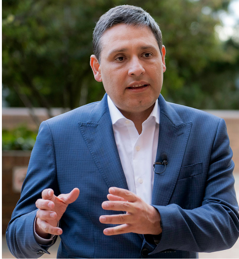
El ministro de las TIC, Mauricio Lizcano, realizó la apertura de la subasta de 5G.

Todos tuvieron 80mhz, el primer bloque lo obtuvo la Unión Temporal de Movistar y Tigo por $318.306 millones.