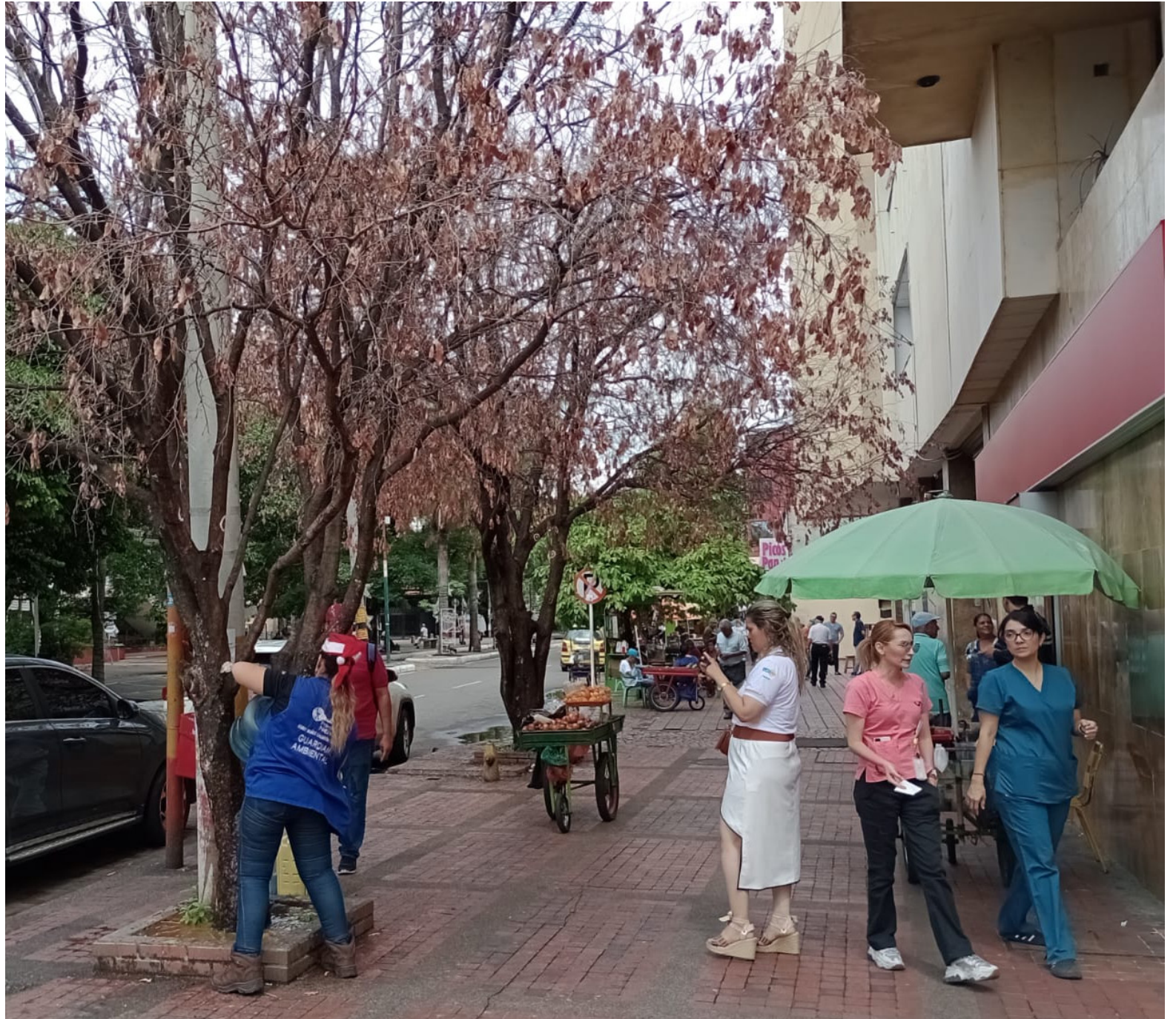
Las plantas ya se estarían recuperando.

En este sentido, la Policía ambiental y la Fiscalía han aperturaron una investigación exhaustiva para identificar a los responsables de este acto de vandalismo ambiental. Las autoridades presumen que el motivo detrás de este ataque, puede estar relacionado con la incomodidad causada por