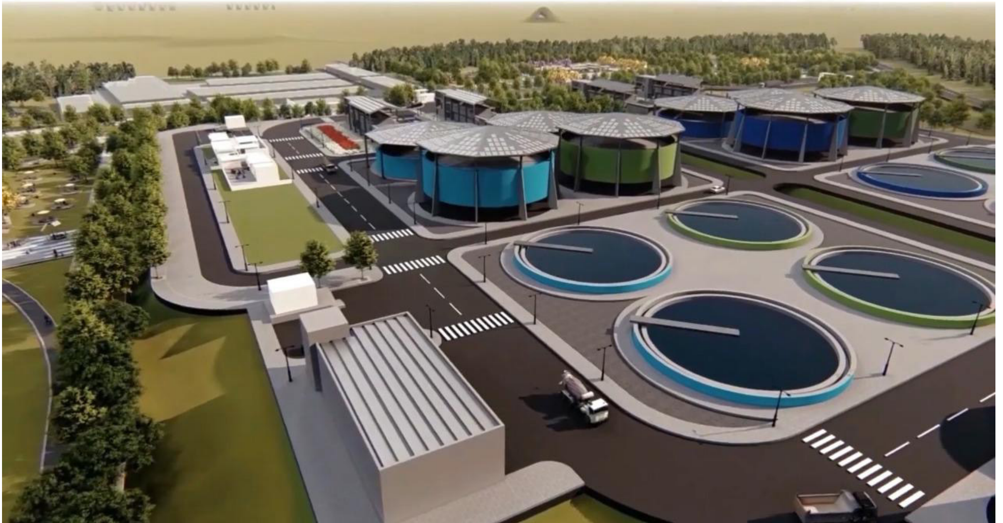
Neiva se quedaría sin PTAR.

cieros completos para su ejecución, solo se tiene: Ubicación lote contiguo al Parque Jardín Botánico, Estudio de suelos y Estudio de títulos”, según dijo Germán Casagua.