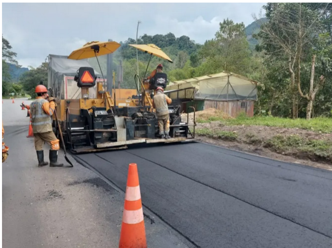
Corredor vial Santana-Mocoa-Neiva, con un contrato valorado en $4.7 billones.