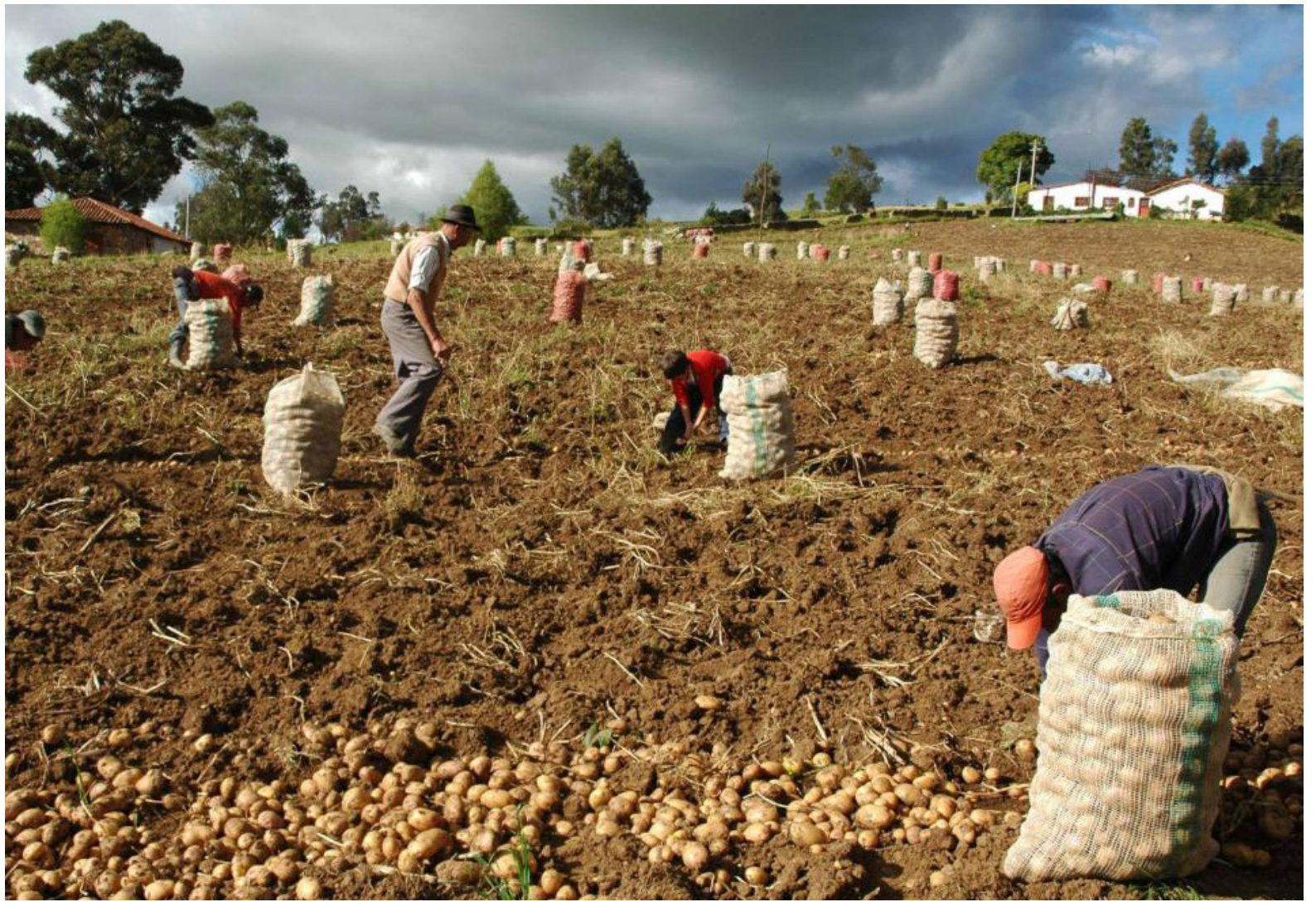
La Región Andina, conocida por su diversidad agrícola, enfrenta amenazas a cultivos de ciclo corto como arroz, cebolla y papa. Además, la posibilidad de heladas preocupa a los productores, exacerbando los desafíos ya existentes.

En la categoría de los tubérculos y frutas, como la papaya o el plátano, así como en general, los