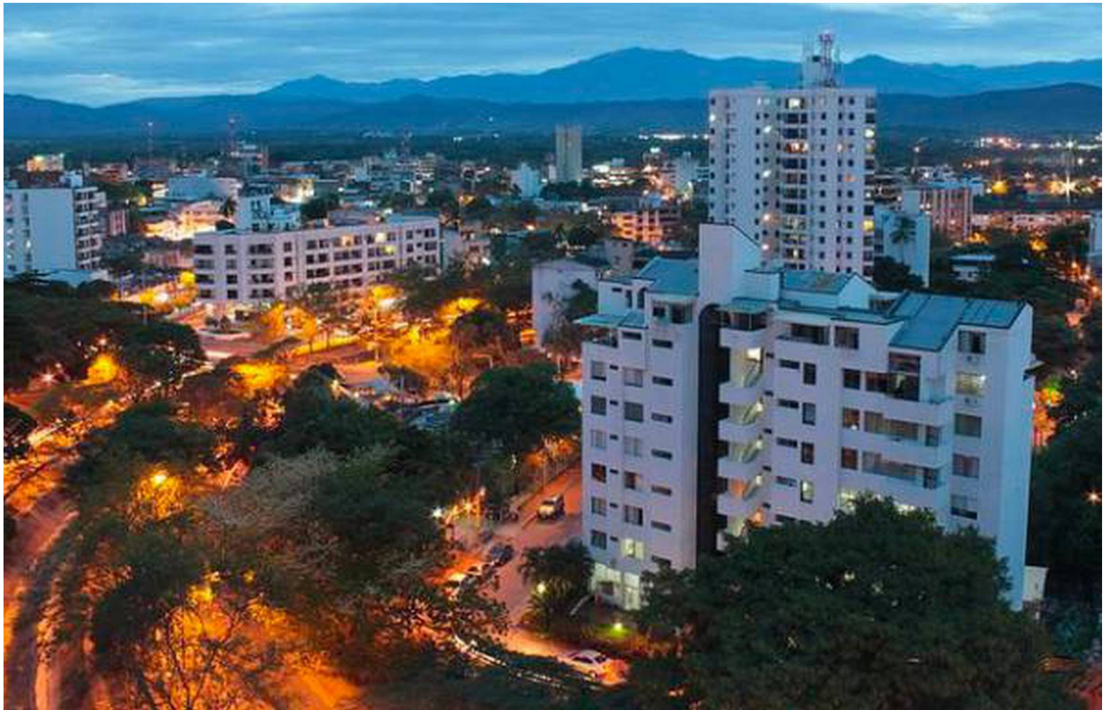
Así mismo el Alcalde electo señaló que la Administración saliente no deja un POT.

Adicional a esto, esta empresa, determinará cuanto se le cobrará