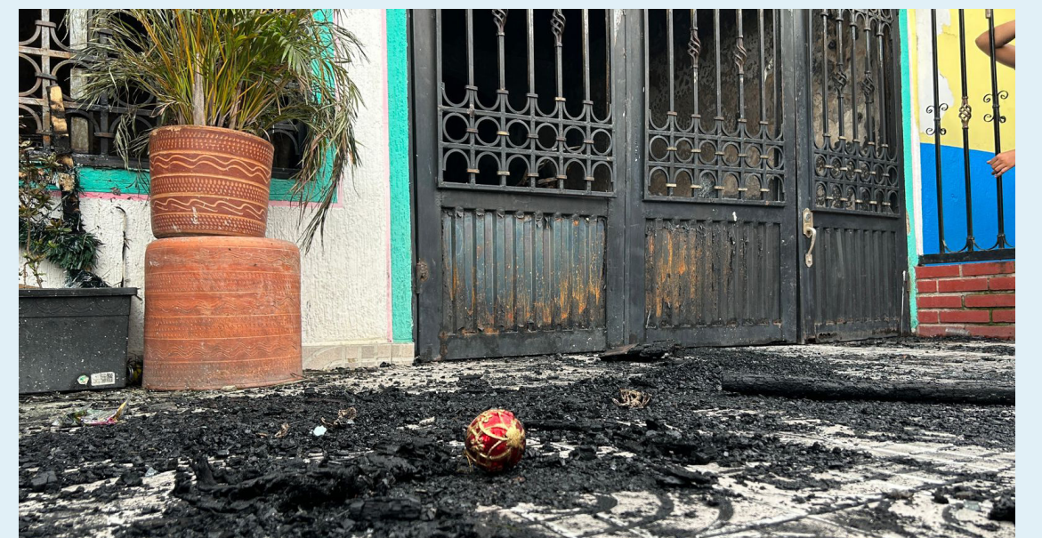
En Neiva no se había registrado un incendio de esta magnitud que dejara esta cantidad de muertos.

La familia ya recibió cristiana sepultura en medio de varios homenajes realizados por amigos y allegados.