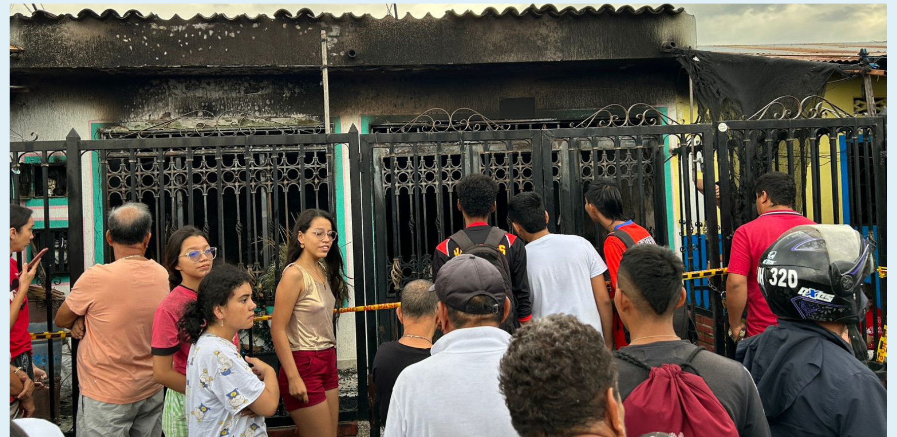
El pasado lunes se cumplieron las exequias de todos los fallecidos.

Por eso en los establecimientos exigimos señalización fotoluminiscente, sensores de humo, luces de emergencia, el extintor. Básicamente uno debería tener un extintor en la casa, de 10 libras, un botiquín, eso son cosas básicas que uno debe tener en la casa. Lo que pasa es que nosotros somos reactivos mas no preventivos. Además, revisar las instalaciones eléctricas, las veladoras, los cargadores de los celulares. Las baterías de los computadores. Todo eso puede generar emergencias.