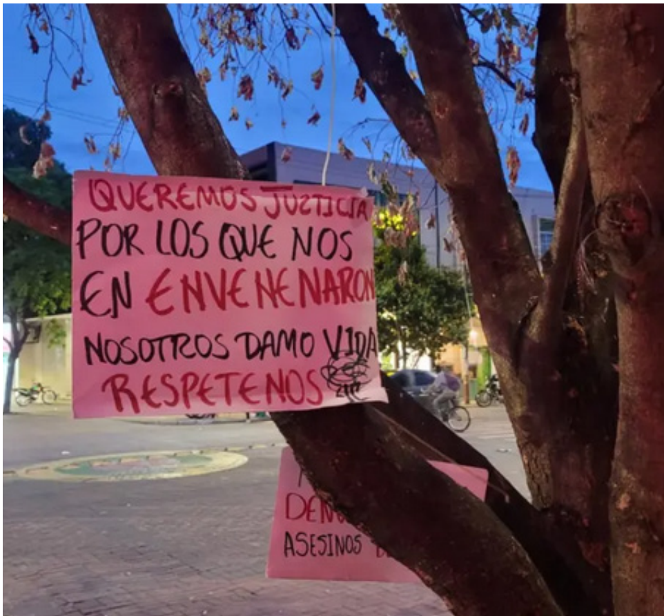
Protestas realizadas por organizaciones ambientales y ciudadanía.