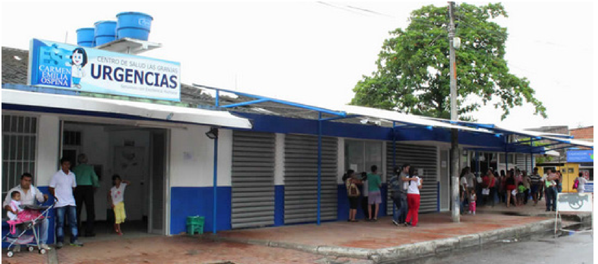
En la ESE Carmen Emilia Ospina, descubrieron hallazgos fiscales por $167 millones