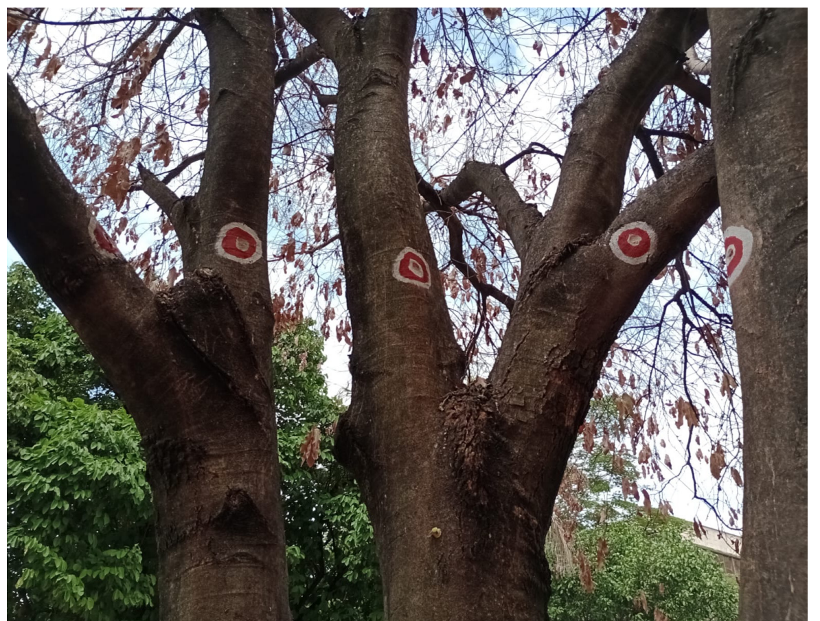
Autoridades ambientales, indican que a los Oitis, les inyectaron glifosato.

“En cuanto a la recuperación de las plantas, les estamos suministrando, sueros nutrientes activadores de sus membranas, para que se desintoxiquen. Ya tienen ‘retoños’ verdes y sí están reaccionando. Le damos miel de purga, con avena y canela, este último producto es un regenerador”, añadió la funcionaria.