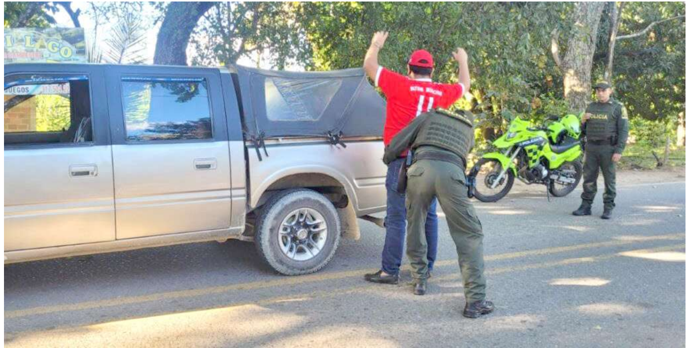
Los controles y las estrategias pensadas desde la institucionalidad de han empezado a implementar.

Teniendo este mapa implementamos un plan de choque que tiene dos componentes: social y policivo.