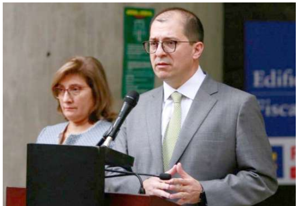
El Fiscal General Francisco Barbosa apoyará la ley de sometimiento de Petro, pero propuso modificaciones.

No dejarle toda la tarea a la Fiscalía General y no violar el principio de cosa juzgada fue con lo que Barbosa terminó su lista de ‘peros’ en la reunión con el presidente.