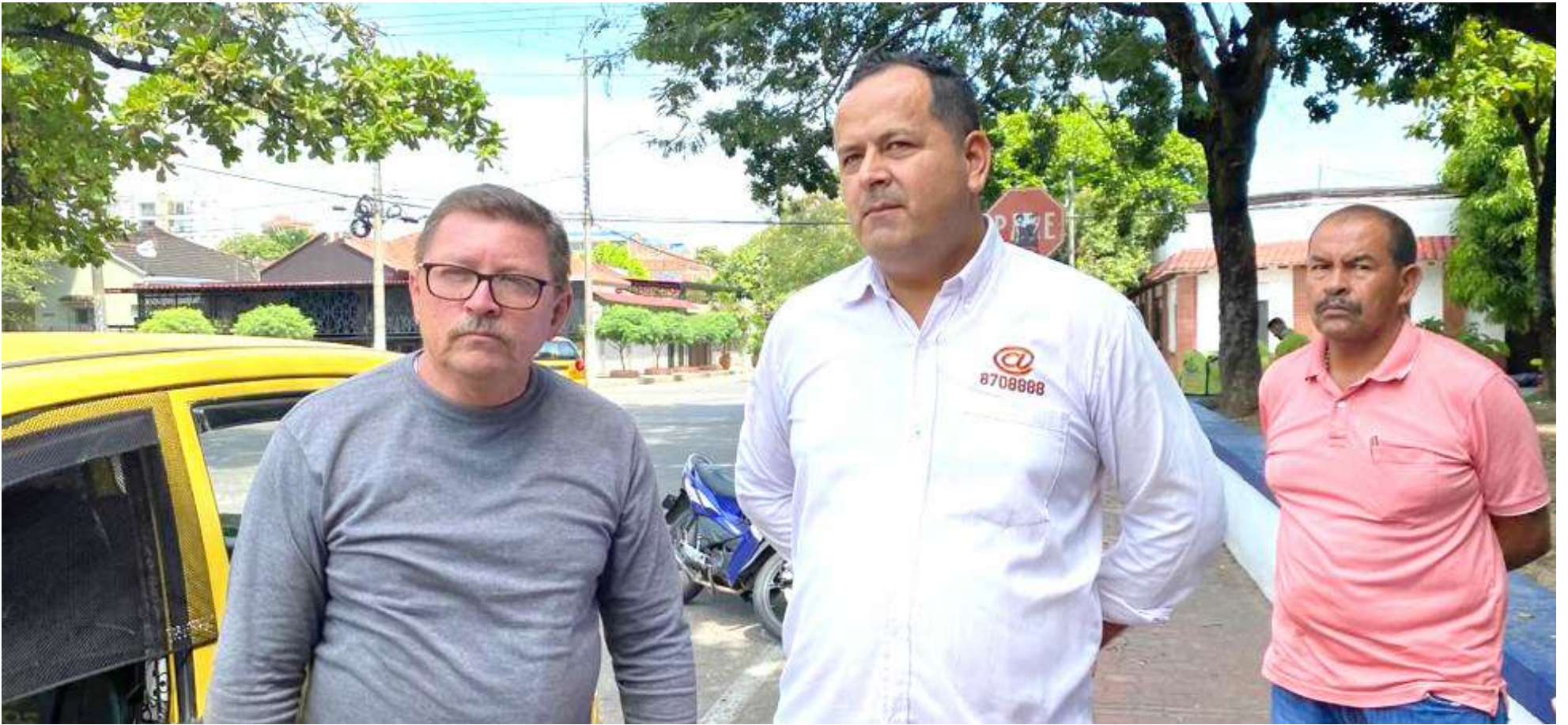
Taxistas aseguran que por el momento, las autoridades no les han informado de casos de paseo millonario en Neiva.

dor de movilidad y también propietario de un vehículo tipo taxi, indicó que por el momento ellos no tienen conocimiento de ninguna denuncia o estadística con respecto a este hecho delictivo.