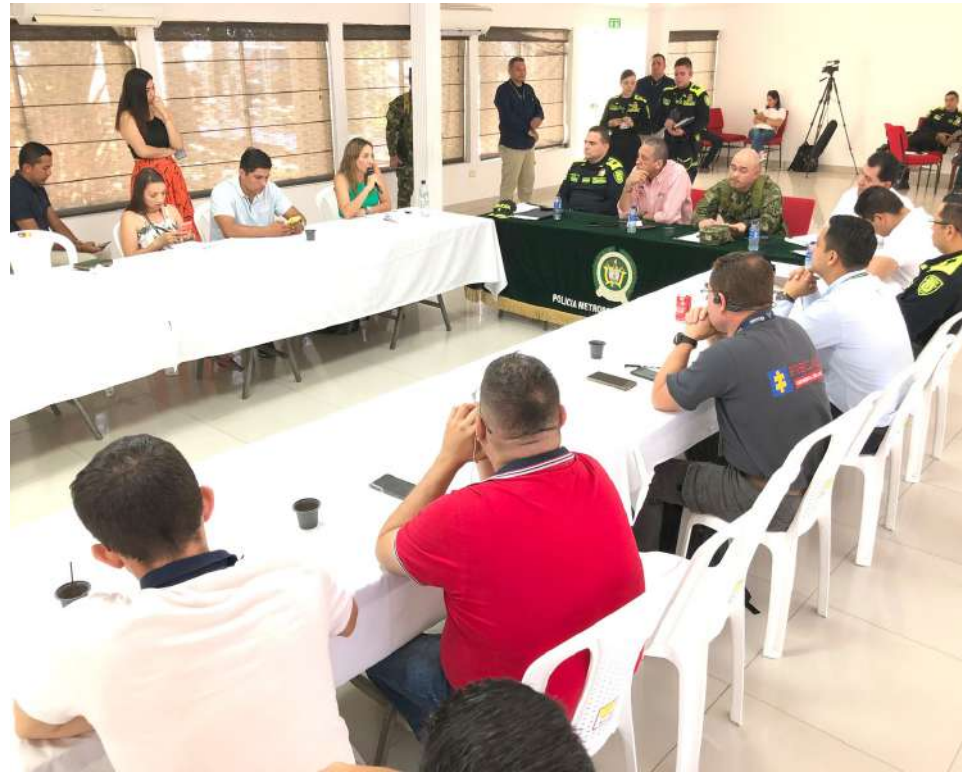
Consejo de seguridad en Neiva.

Fuerzas especiales de la Policía, el Ejército y la Fiscalía, se encuentran en esa municipalidad y en el lugar de los hechos, trabajando en la recolección de material probatorio.