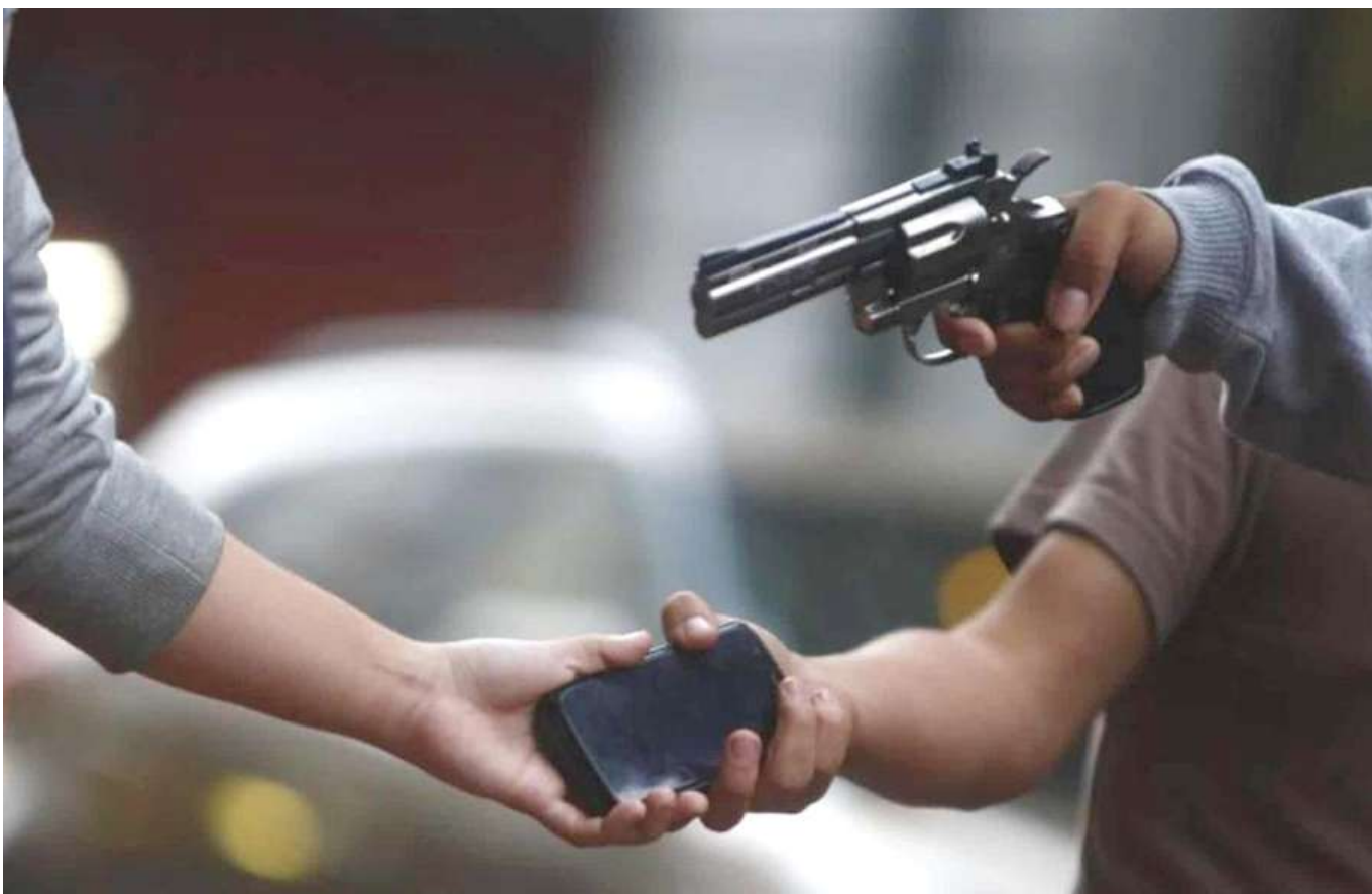
En Neiva se presentan en alta escala robos a mano armada.

Teniendo este mapa implementamos un plan de choque que tiene dos componentes: social y policivo. El social se llama 'ambientes sociales de aprendizajes para la vida, la convivencia y la paz' vamos a llegar a cada uno de los sitios identificados donde