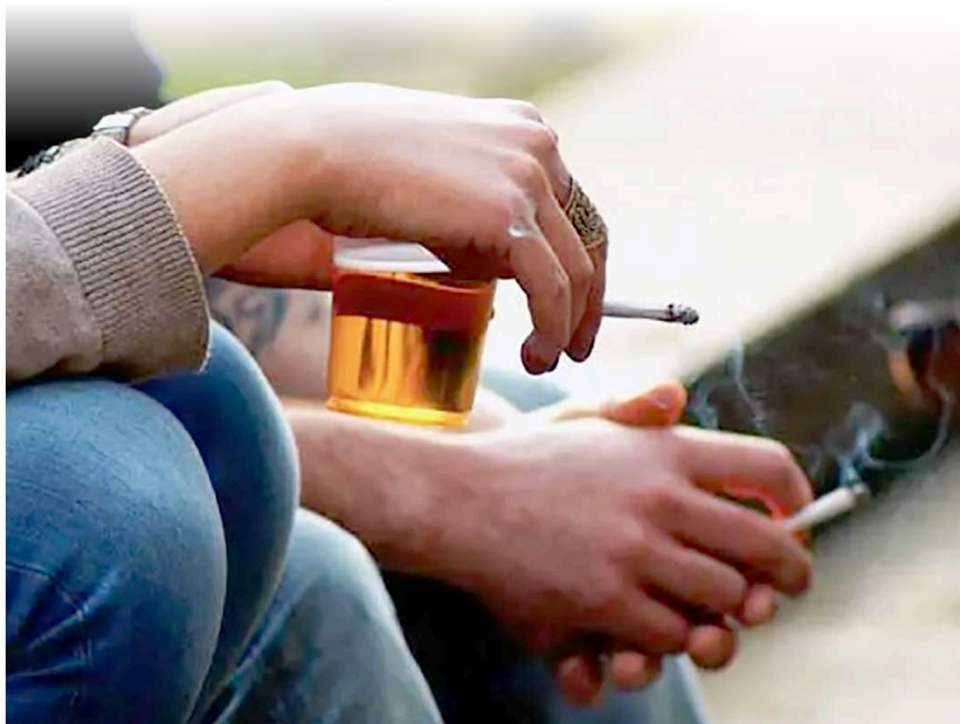
El consumo de licor y sustancias psicoactivas ha aumentado la criminalidad en jóvenes.

Nos vamos a articular con empresarios para que los que se unan puedan ofrecer en sus empresas empleos para estos jóvenes y cuando tengamos el barriido final con los planes de vida que vamos a ejecutar enlazamos con los institutos y los llevamos al aparato productivo. Esto es todo un proceso.