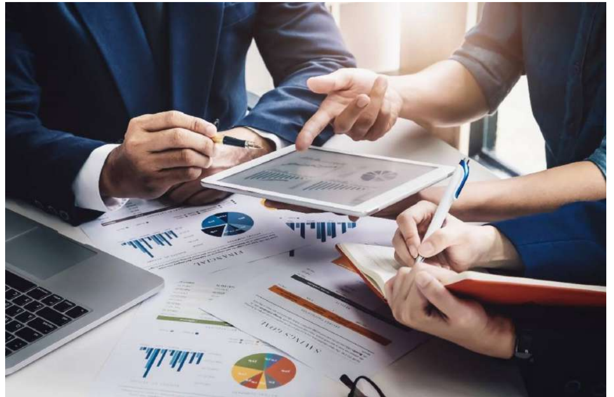
La región Central fue una de las más afectadas en cuanto al mercado laboral.

Para el segundo semestre del 2022, aumentó la tasa de ocupación en todas las regiones, con respecto al periodo anterior. El mayor crecimiento se presentó en las regiones Orinoquía, Amazonía