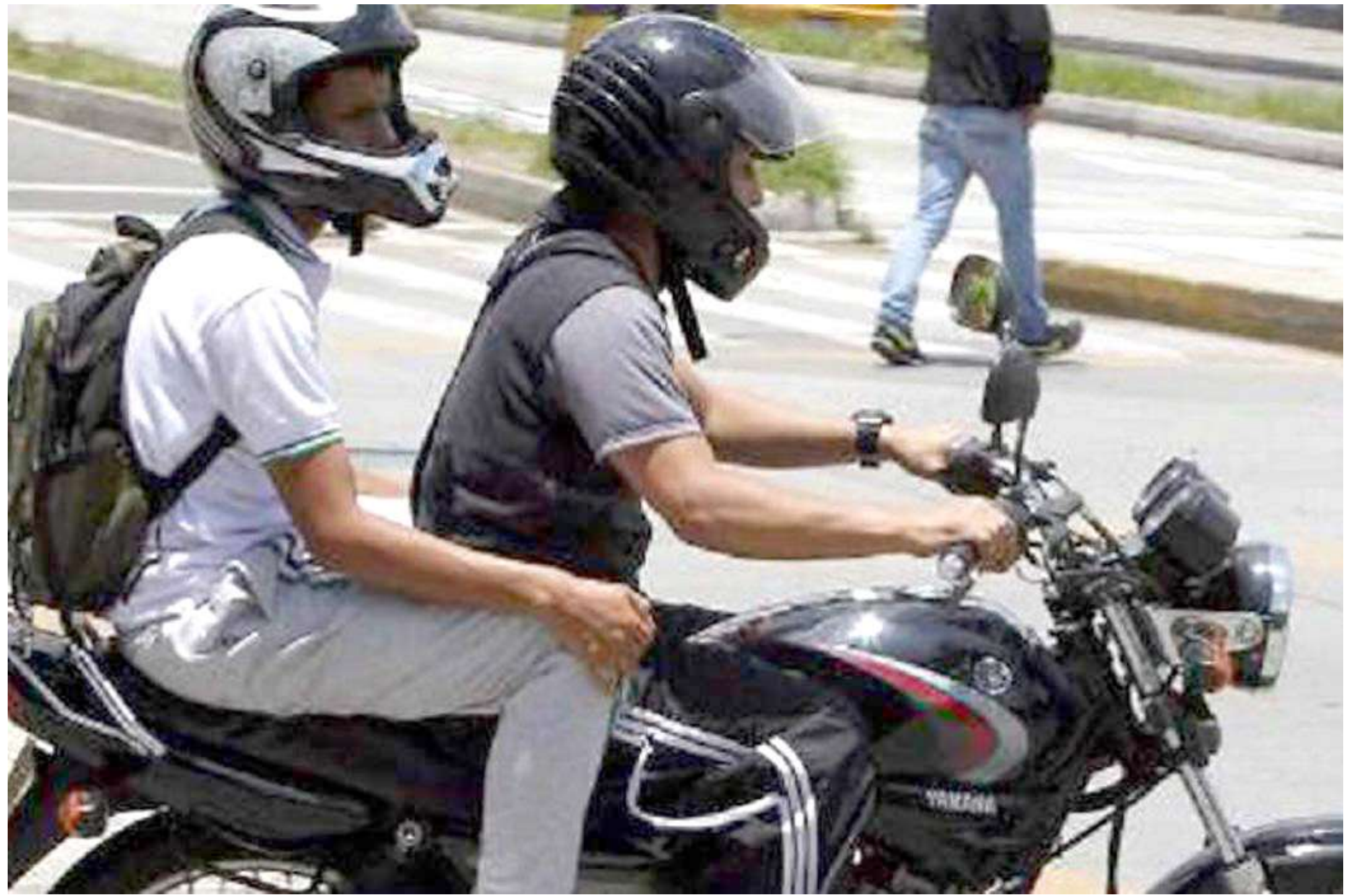
Los delinquentes de transportan en motos con modelos ya identificados

Ya estamos avanzando, no puedo dar nombres, pero ya tenemos identificadas y es un trabajo que venimos haciendo con los mismos informantes de las bandas quienes les hemos ofrecido todas las garantías para que se desarmen y puedan entregar información. Con esto tenemos todo un