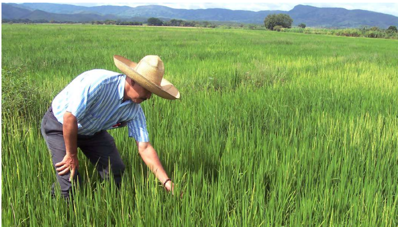
Entre julio y agosto de 2022, Perú envió 5.595 toneladas de arroz a Colombia.

Además, se logró establecer por parte del DANE, que “la mayor variación del área cosechada según los principales departamentos arroceros se presentó en Huila con un 22,9 %, tras cosechar 2.979 hectáreas más en el segundo semestre de 2022, 15.999 hectáreas, con respecto al mismo periodo del año 2021 con 13.021 hectáreas”.