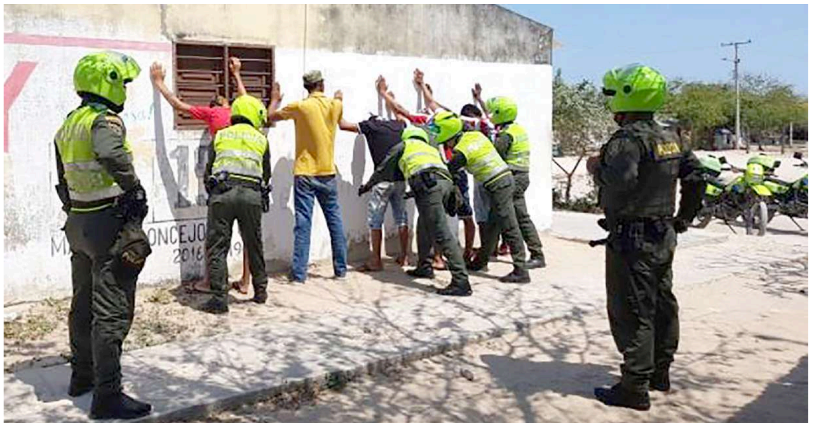
Los controles son permanentes, pero las estrategias parecen quedar cortas.