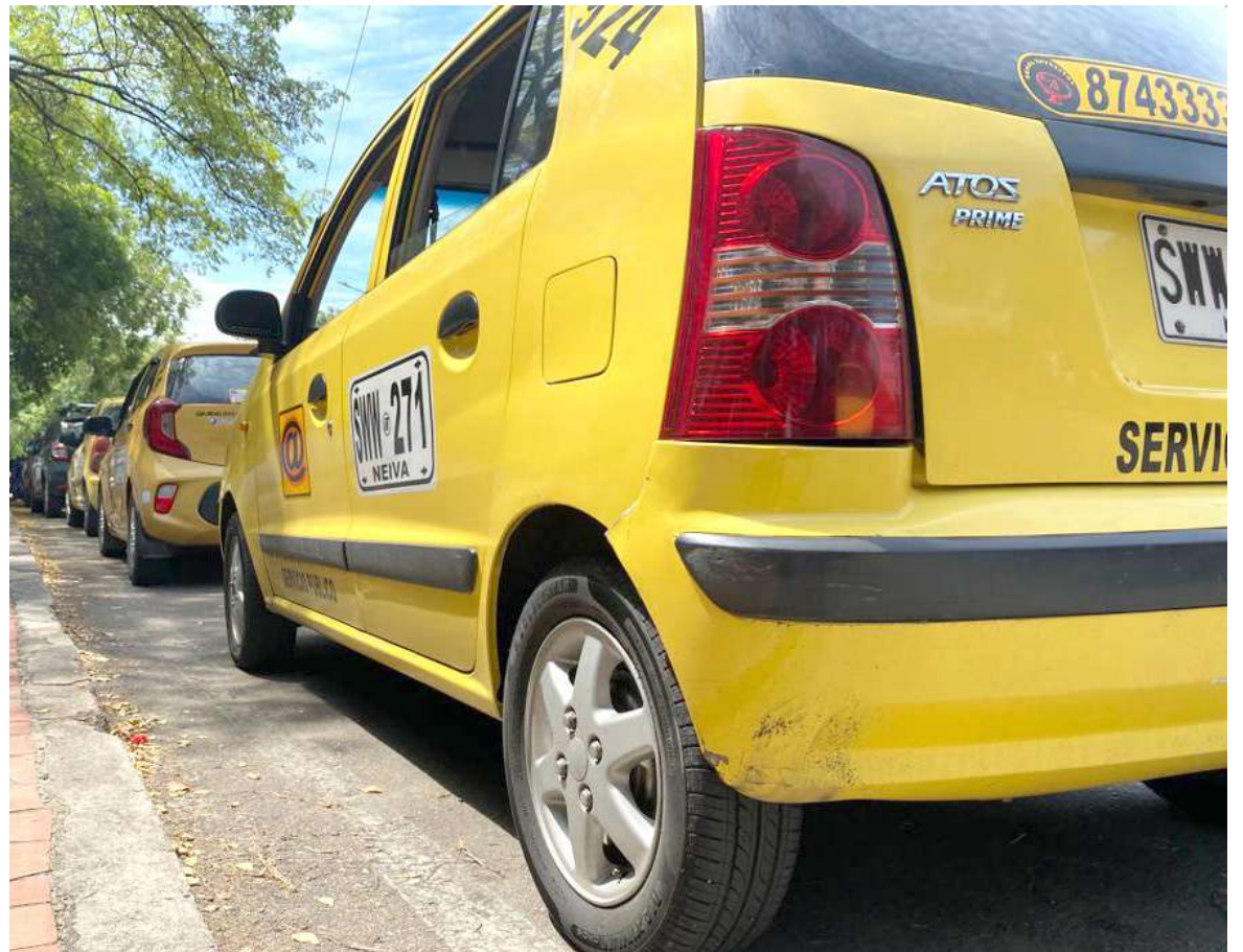
En la ciudad de Neiva hay 2.196 taxis.

Según Carlos Rojas, taxista de la capital del Huila, el también