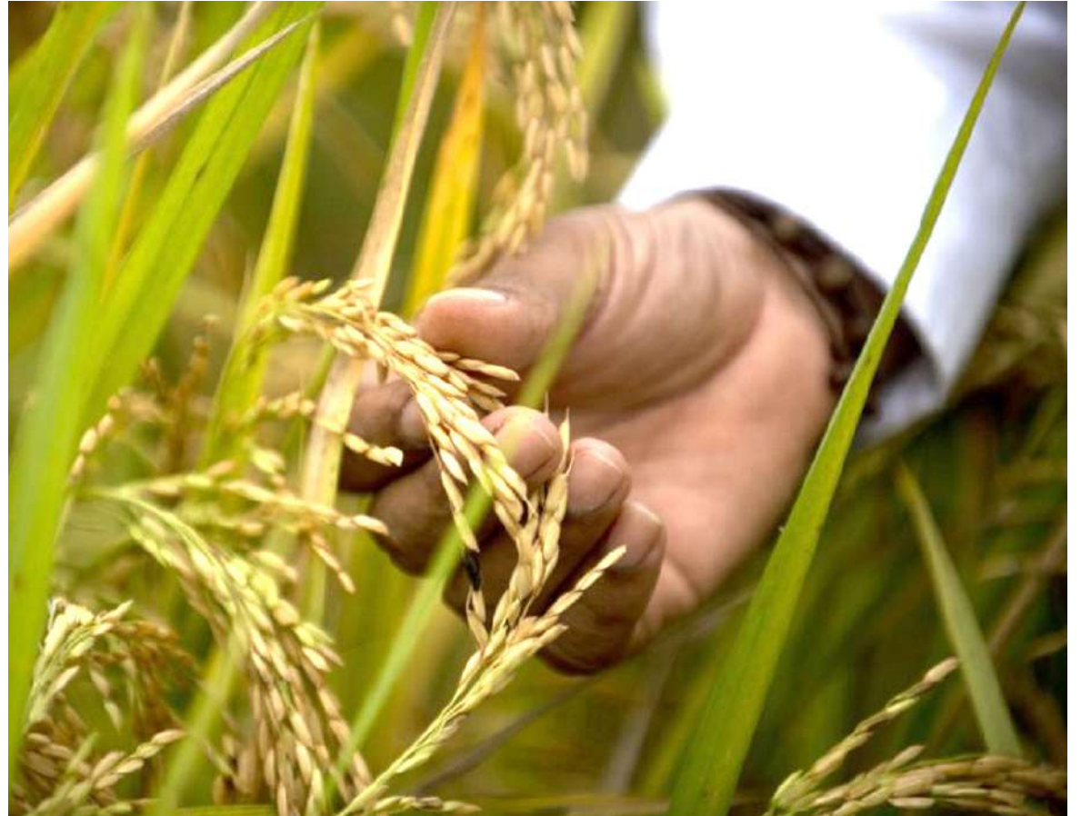
Se estima que en el Huila hay 6.500 productores de arroz.

“Acá llega arroz por la ruta 45 desde Perú y Ecuador, principalmente. Incluso me atrevo a decir que hay arroz que llega por ese mismo corredor desde Putumayo y San Miguel de contrabando, por lo cual le pedimos a las autoridades que hagan un control vigilado ante esta situación”, explicó.