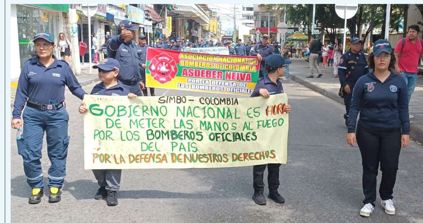
Piden que les respeten su experiencia y capacitación.