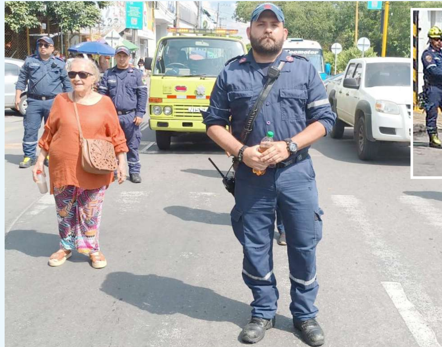
Los bomberos oficiales en Neiva marcharon al igual que en todo el país.

Los cuerpos de bomberos de Colombia a nivel nacional, salieron a las calles para protestar sobre la protección de sus derechos y la profesionalización de la carrera.