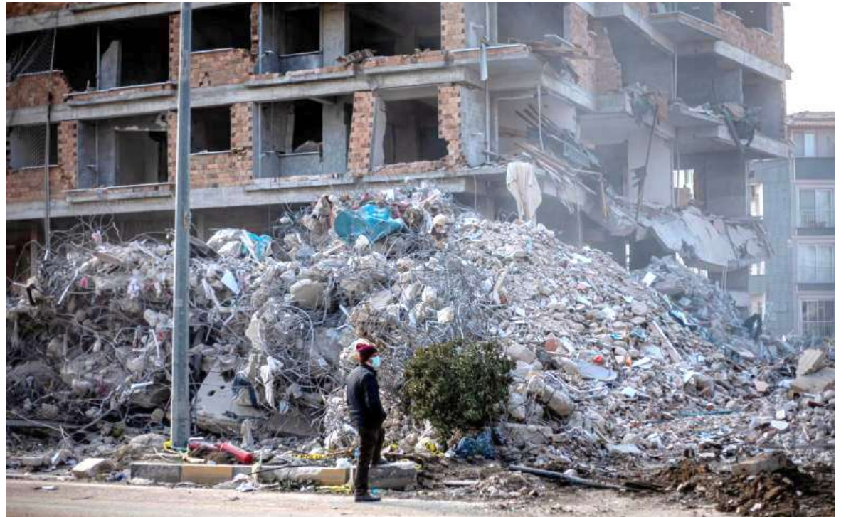
Nuevo sismo en Turquía deja más personas muertas y cientos de heridos.

Las autoridades turcas reportaron al menos 3 personas muertas y 213 heridas por este nuevo sismo, mientras que en Alepo (Siria) 70 personas debieron ser hospitalizadas.