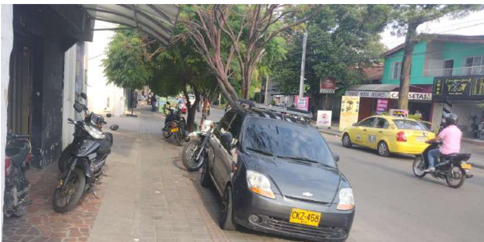
La invasión del espacio público es otro de los problemas.

Así están las cosas por el lado del Estadio en pleno centro de Neiva, en donde el panorama no cambia y los problemas son comunes; inseguridad, invasión de espacio público, mal estado de las vías y los conexos.