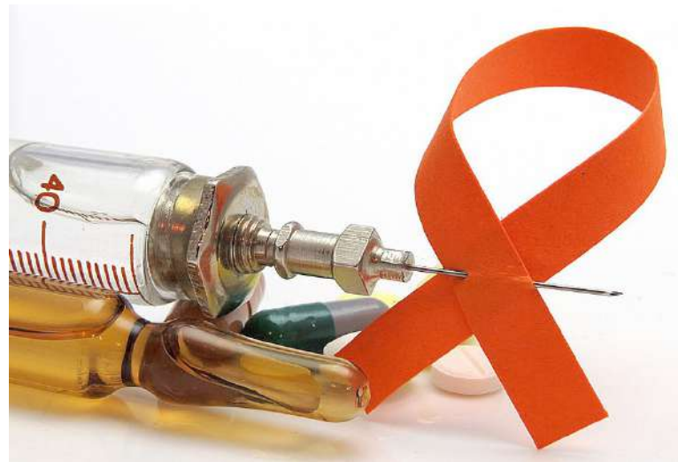
Un nuevo paciente encuentra la cura para el VIH.

Por muchos años se dijo que el VIH no tenía cura y que solo se podía controlar con los medicamentos y el tratamiento, pero hasta ahora tres personas pueden decir lo contrario desafiando a la ciencia.