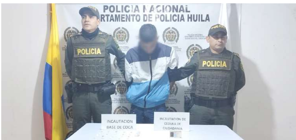
Uno de los detenidos con la sustancia psicoactiva.