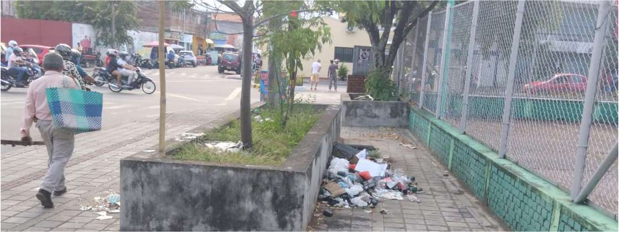
Los alrededores del Urdaneta en mal estado.