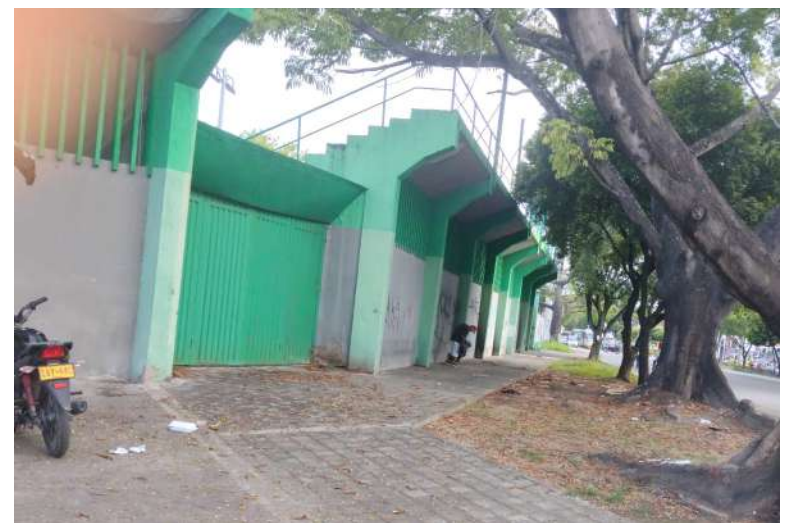
El Urdaneta por la carrera séptima.

Otro de los problemas que a diario tienen que sortear los habitantes del Estadio, es el mal estado de las vías con el agravante que es un sector de mucha movilidad en la ciudad.