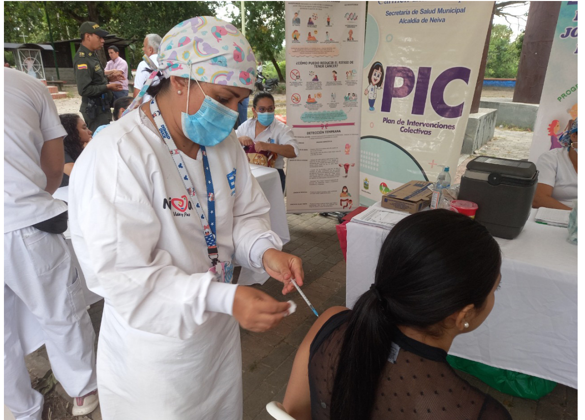
Hubo poco dinero para salud y estamos altas tasas de dengue.