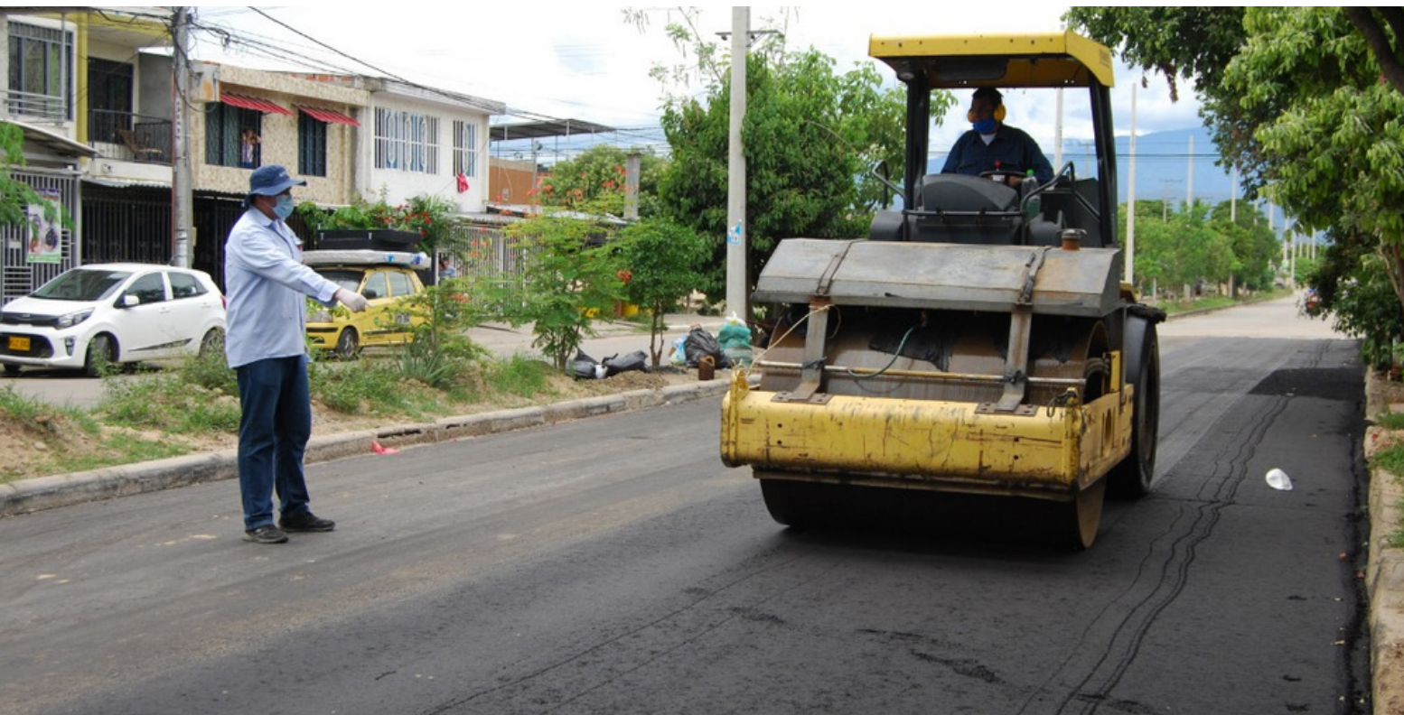
El clamor popular es el arreglo de las vías, le asignaron $963 millones.

Y la solicitud que hizo el cabildante, es que las Escuelas de Formación, no funcionen solo cinco meses. “Alcalde por favor, estas no pueden laborar menos de diez periodos. Porque uno encuentra en los barrios, gente que trabaja gratis, le están haciendo un favor al Estado. Espero que en próximas adiciones que vengan, por favor no les de miedo que queden dineros, específicamente para esta finalidad. El burgomaestre, ha indicado que esta es la manera de quitarle a la delincuencia a los jóvenes por medio de la educación y cultura”.