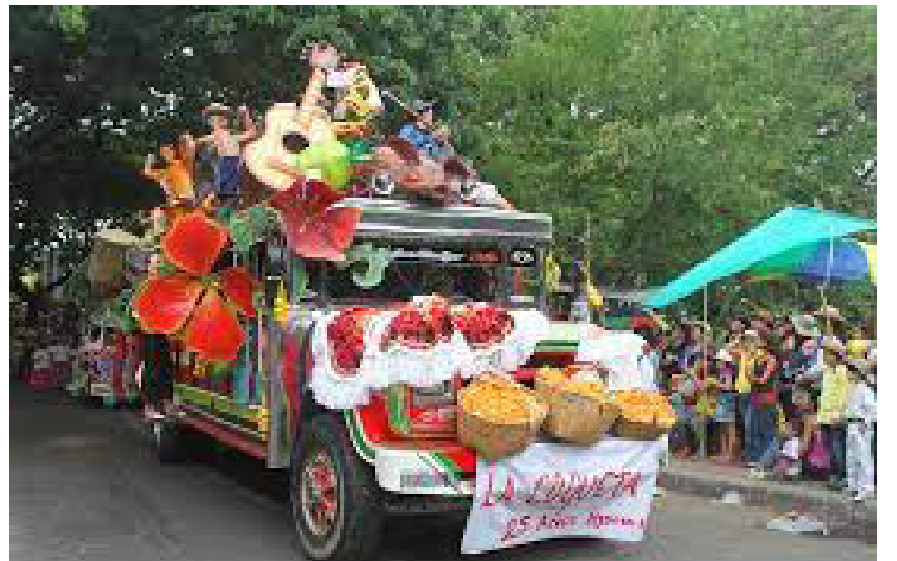
Los desfiles de San Pedro, iniciarán en la avenida Inés García de Durán y culminarán en el puente ‘El Tizón’.

“Se trata de la sensibilización de toda la ciudadanía, para que empecemos a sentir ese sentido de pertenencia por nuestra ciudad, a evidenciar lo que nos ha regalado a nosotros, a reconocerlo y por supuesto de alguna forma empezar a retribuirle algo a Neiva”, reveló la funcionaria.