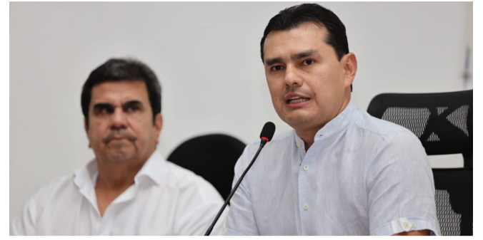
“No llegamos a repartir cargos a diestra y siniestra”, alcalde de Neiva