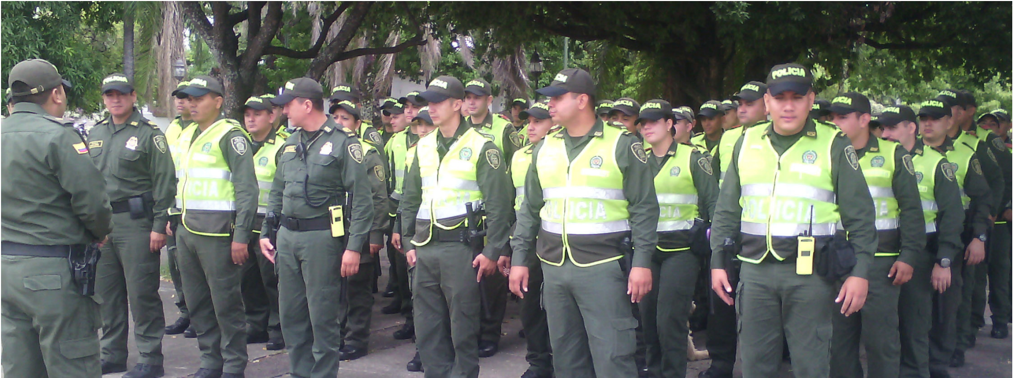
Las fiestas de San Juan y San Pedro comenzarán el 18 de junio, y se espera que para entonces la ciudad cuente con todo el personal adicional previsto.

la celebración del Día de las Madres, donde no se registraron homicidios. Ya tuvimos un refuerzo de personal que permanece en la ciudad”, destacó el coronel Castillo.