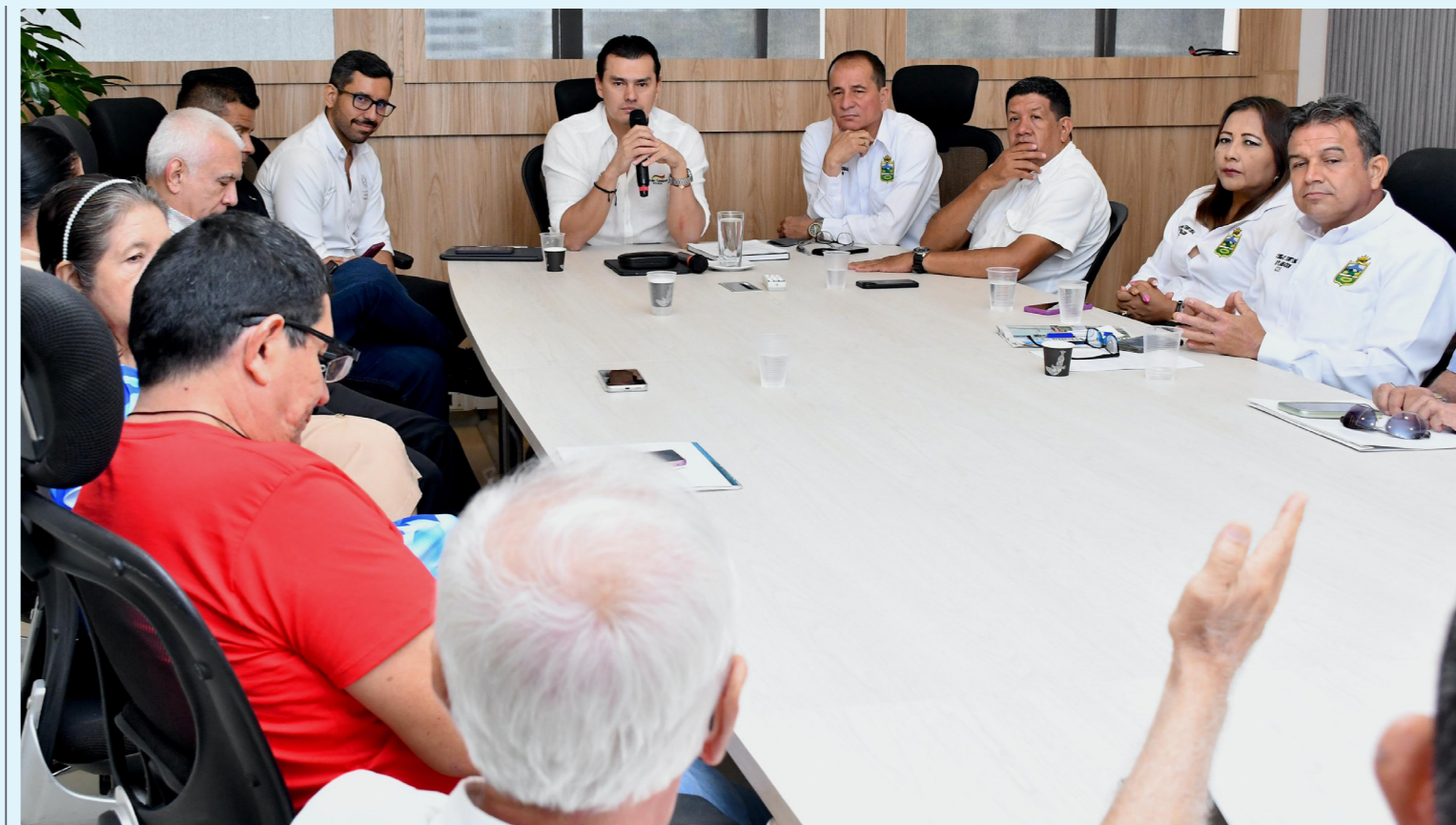
Este proyecto, aprobado en primer debate, busca eliminar la burocracia excesiva y optimizar los recursos públicos.

Esta medida, aprobada en primer debate por el Concejo Municipal, pretende modernizar la gestión municipal y optimizar los recursos para proyectos de desarrollo y pago de deudas.