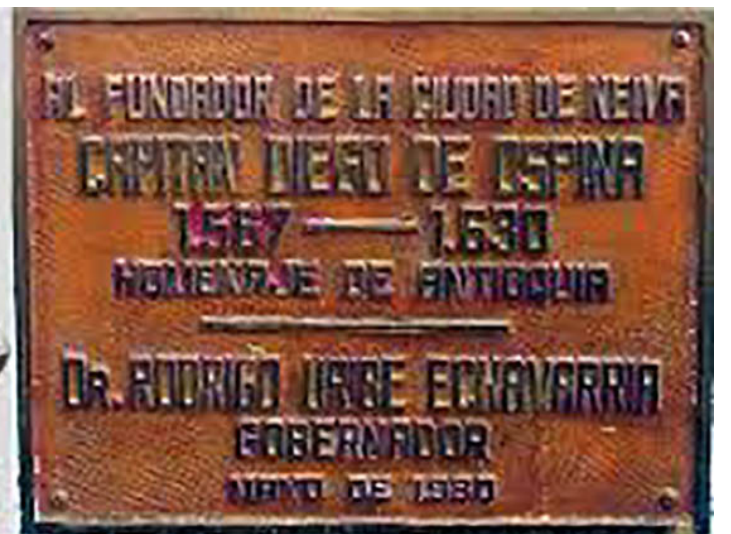
Le llevarán una ofrenda floral al busto del capitán y fundador, Diego de Ospina.

go Ospina y Medinilla, y al mismo tiempo disfrutaremos sobre las 9 de la mañana del desfile en homenaje al cumpleaños de Neiva, al que denominamos ‘Neiva te ama’.