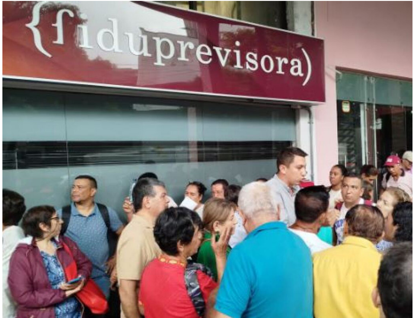
Cientos de Maestros han reclamado a las afueras de la Fiduprevisora en busca de una solución para la entrega de sus medicamentos y órdenes para exámenes con especialistas.

De acuerdo con Fecode, desde el 1 de mayo se ha venido trabajando junto con el Gobierno, Fomag y la Fiduciaria La Previsora en la coordinación de acciones en las diversas regiones y departamentos que permitan que el proceso de transición de modelo “transcurra con la mayor certeza y efectividad” sin poner el riesgo la vida y salud de los maestros.