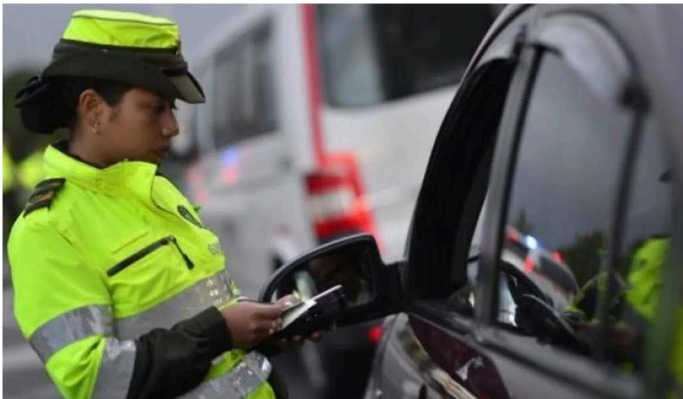
El código de la cédula permitirá conocer el perfil de cada persona.

Debido a que el aplicativo se encuentra en fase de pruebas, una de ellas se registró en Valledupar, en donde más de 140 policías realizaron la verificación de la identidad de múltiples ciudadanos en un operativo de control y registro. Cabe destacar que la aplicación será de uso exclusivo de la policía, pero dentro de los objetivos se encuentra que pueda ser adaptada y estar disponible para ser empleado por empresas públicas o privadas.