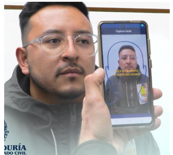
El director de la Policía Nacional afirmó que esto representa un avance para la seguridad.

Dentro de los detalles entregados por las autoridades al respecto se conoció que el capturado sería parte de una estructura criminal que delinque en Perú y Colombia, la cual estaría a cargo del envío de estupefacientes a Europa