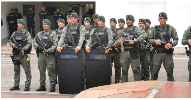
Mil policías reforzarán las fiestas de San Pedro