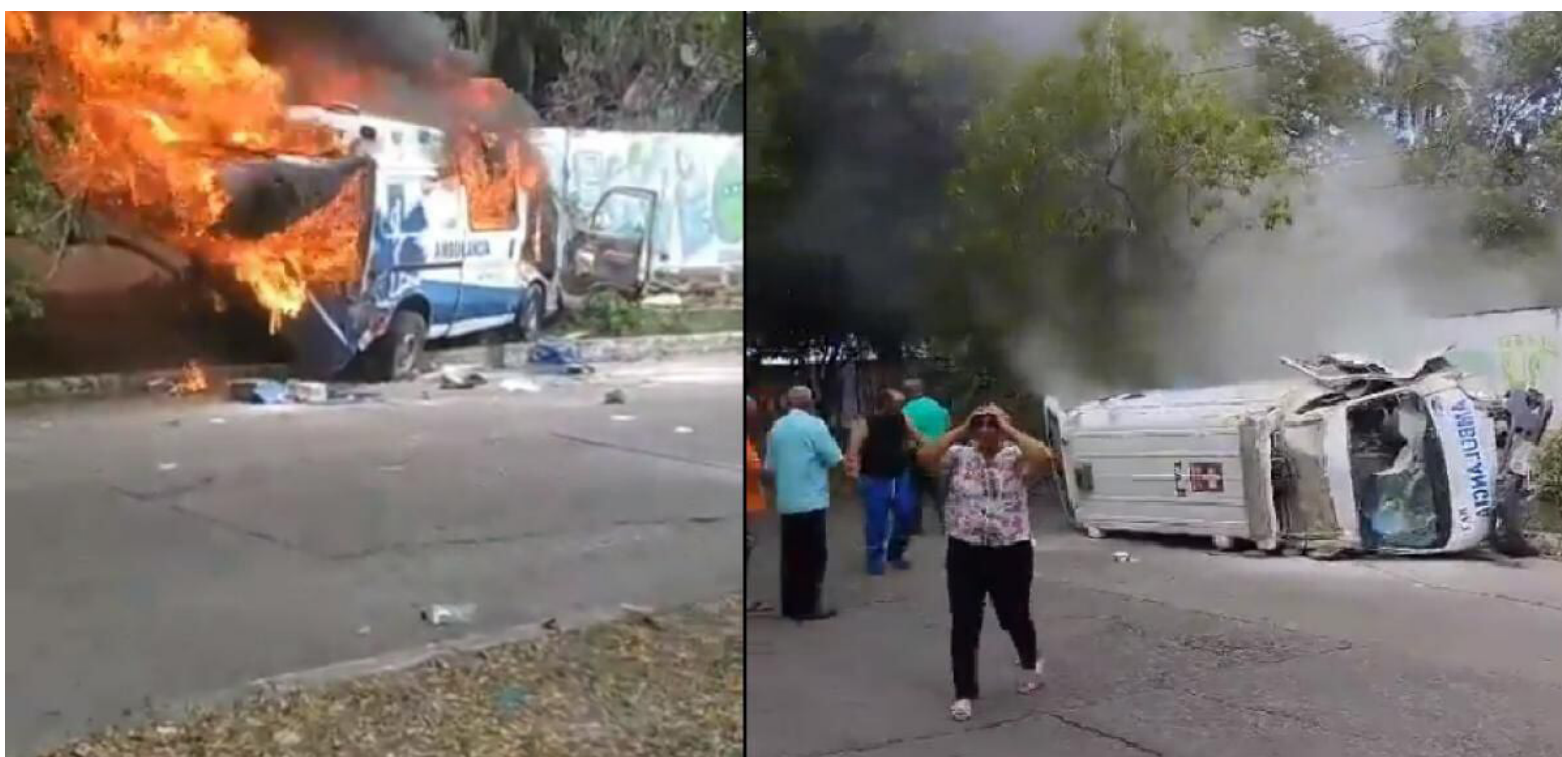
Son varios los accidente generados por ambulancias en la ciudad de Neiva.

"Venimos adelantado el trabajo, el estudio correspondiente para poder realizar la modificación del Acuerdo Municipal 027, con el fin de entregarle a Neiva un sistema de atención de emergencias que cumpla con las necesidades que tiene el municipio. Esta reunión es fundamental porque hemos definido una ruta y hoja de trabajo. La atención de las emergencias no distingue clase social por lo que es imperativo que podamos contar con la voluntad política del Concejo municipal para procurar la implementación y aprobación de un nuevo acuerdo que se ponga a tono con la normatividad nacional y que frene de una vez por todas ese problema en que se ha convertido la atención de emergencias", señaló la funcionaria.