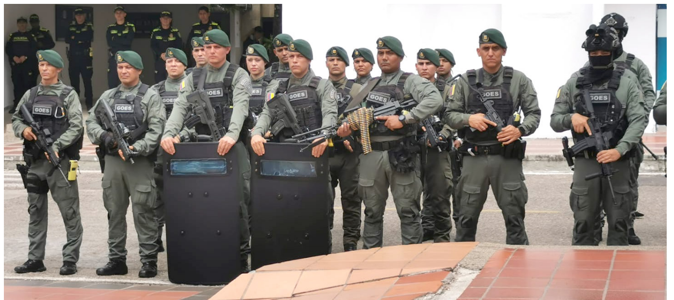
Una de las novedades es la llegada del Grupo de Operaciones Especiales (GOES) a Neiva, por primera vez en la historia de la ciudad.

Cerca de mil policías se desplegarán en Neiva para garantizar la seguridad durante las fiestas de San Juan y San Pedro, las más importantes de la región.