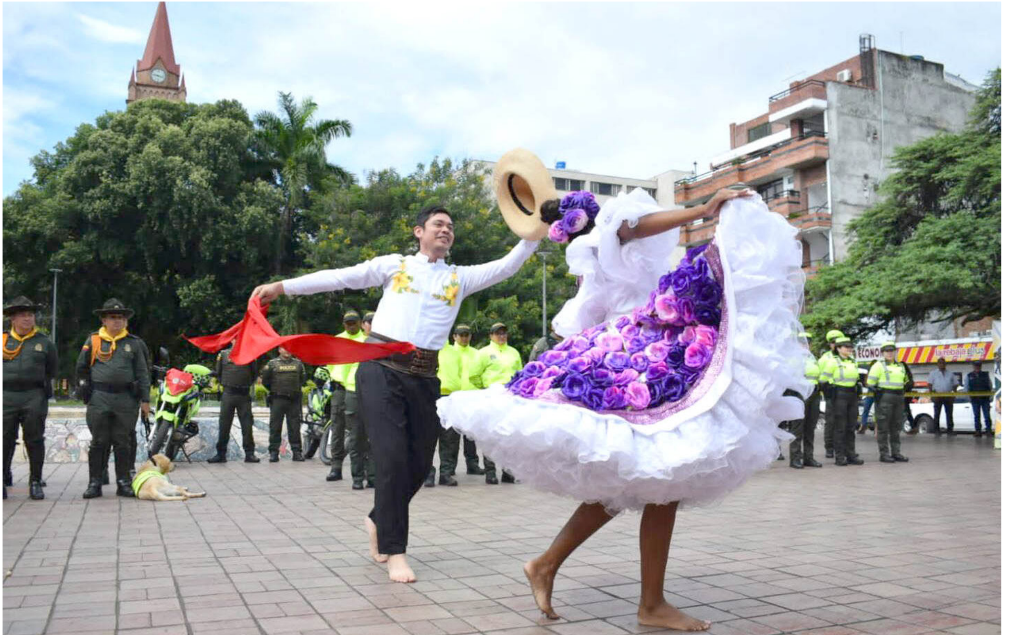
Mil policías de diversas especialidades reforzarán la seguridad en Neiva durante las celebraciones de San Juan y San Pedro.

■ Con la llegada de mil policías a Neiva, las autoridades buscan asegurar unas festividades tranquilas y seguras para todos los asistentes. Estos refuerzos incluyen al Grupo de Operaciones Especiales (GOES), que por primera vez estará presente en la ciudad.