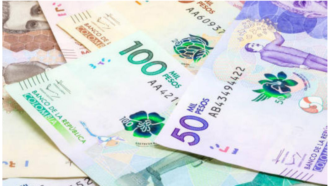
$16.563.996.159 llegarán a las Entidades Prestadoras de Salud.