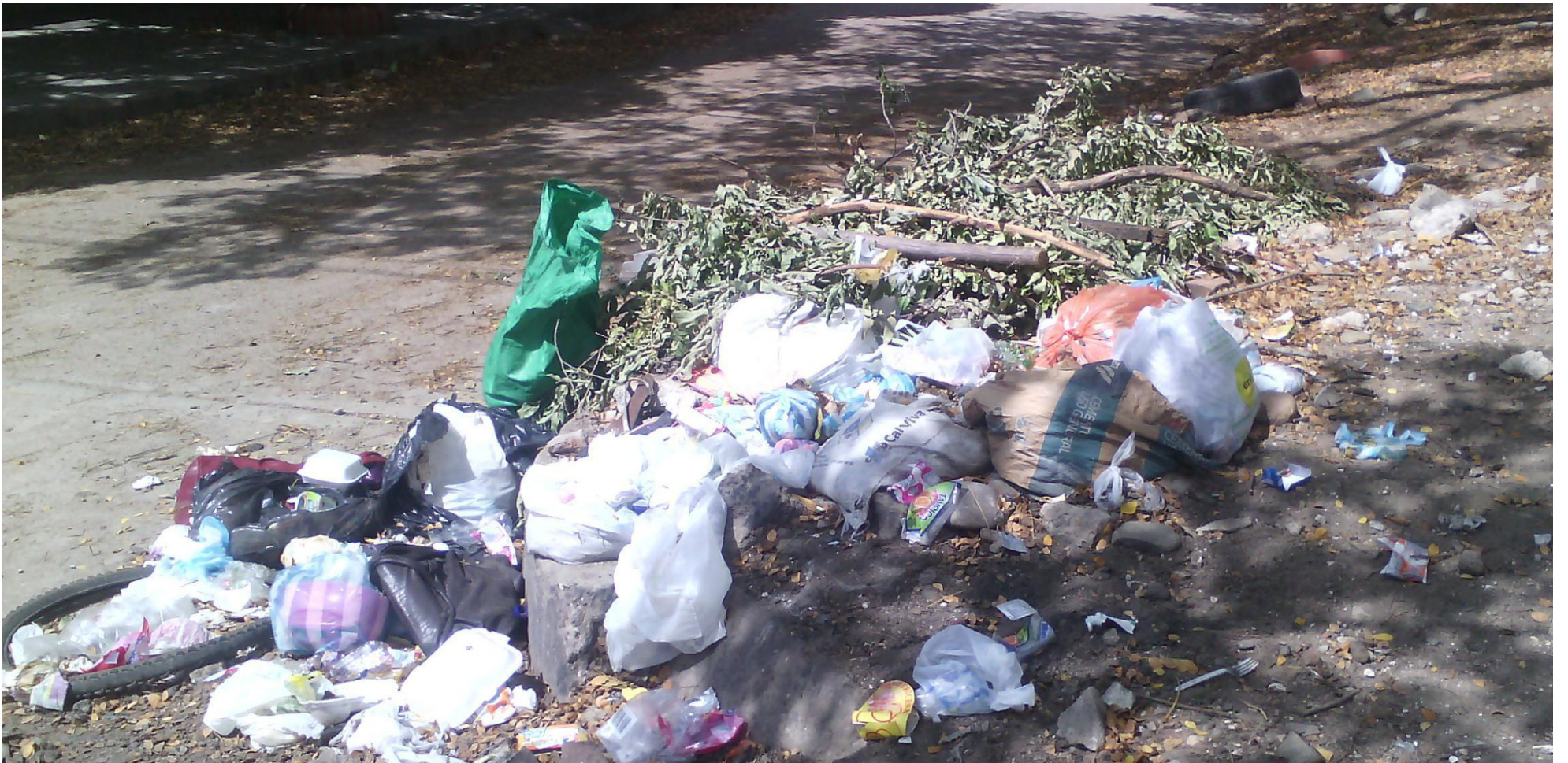
Lanzarán una campaña de cultura ciudadana, orientada por el alcalde, Germán Casagua.