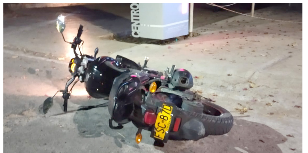
La motocicleta abandonada por alias 'Oso' el día del atentado en la compraventa de vehículos.

Alias 'Oso' pertenecería a la red de apoyo del GAOR del Frente 'Dario Gutiérrez'. Además se conoció que dicho establecimiento venía recibiendo extorsiones.