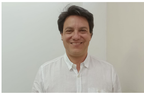
Aprobada adición presupuestal