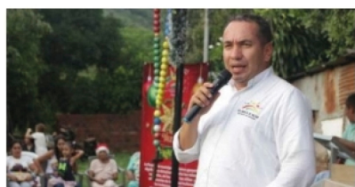
'Es necesario un rediseño institucional de la personería de Neiva' ■ ENTREVISTA 2-3