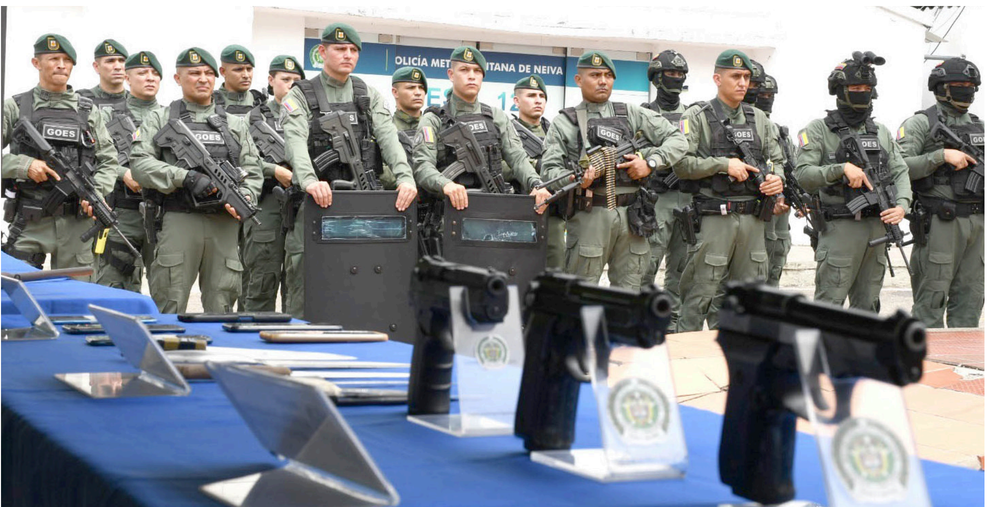
Este grupo cuenta con el UNIPOL, otra unidad que ha contribuido a la disminución de los indicadores de delincuencia en Neiva.