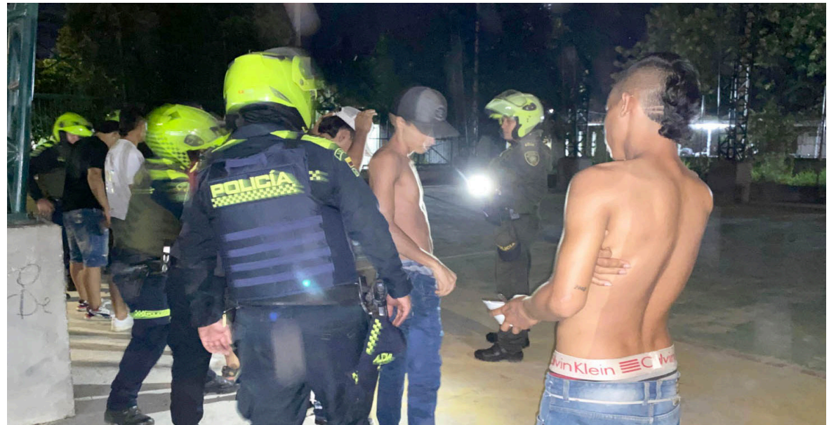
La Policía Metropolitana continúa realizando controles en toda la ciudad.

Las autoridades han capturado al 90% de los responsables de los atentados terroristas contra el sector comercial, mejorando significativamente la seguridad en la ciudad.