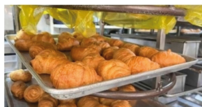
Panaderos del Huila, afectados por bajo consumo ■ ECONOMÍA 6-7