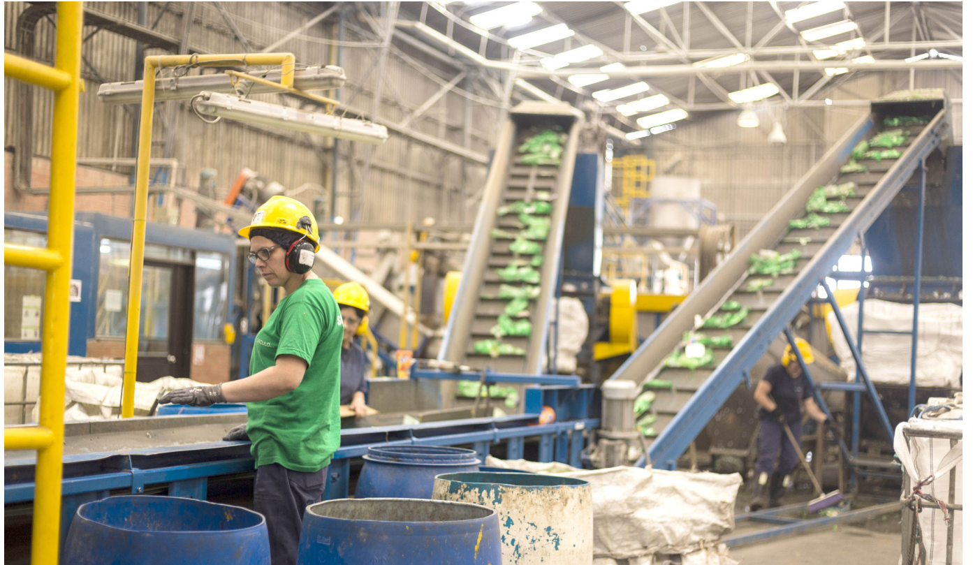
La reducción de la jornada laboral en Colombia se aplicará para que los empleados dediquen más tiempo a las familias.

Este cambio estructural en la jornada laboral de Colombia se alinea con tendencias internacionales que buscan mejorar las condiciones laborales y el bienestar de los trabajadores. Dichas medidas se implementarán bajo una estricta supervisión para asegurar su correcta ejecución y el cumplimiento de los objetivos propuestos.