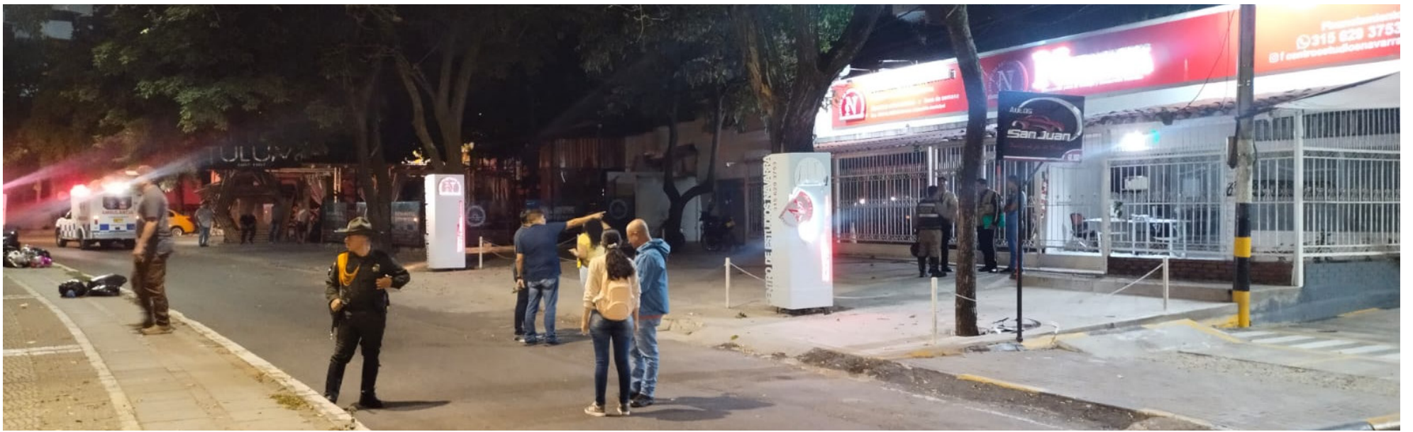
El primer atentado registrado en Neiva ocurrió en el mes de febrero.