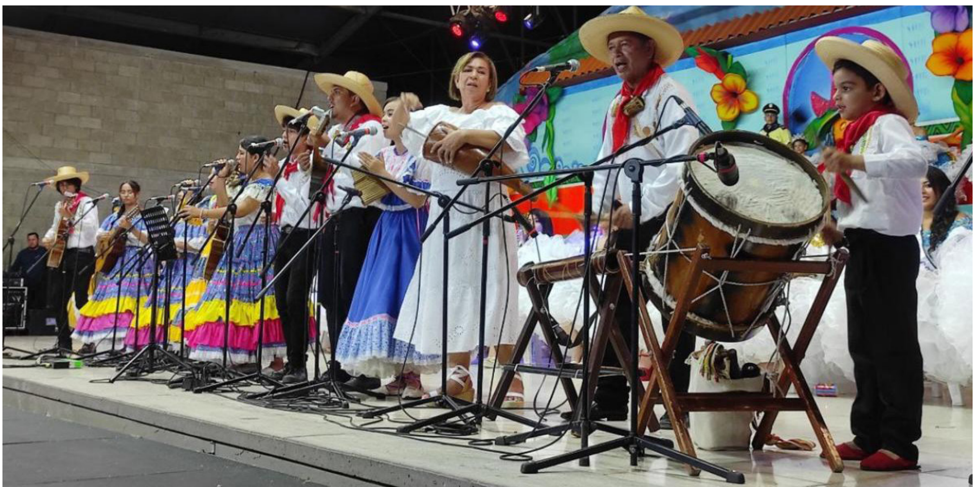
Las Escuelas de Formación, buscan ganarle jóvenes a la violencia y consumo de estupefacientes.

del Sistema General de Participación, la últimas doce avas del 2023, y las seis doce avas del 2024, cabe decir que prácticamente en su gran mayoría $16.000.000, son recursos del Sistema General, que gira directamente al Régimen Subsidiado de Salud".