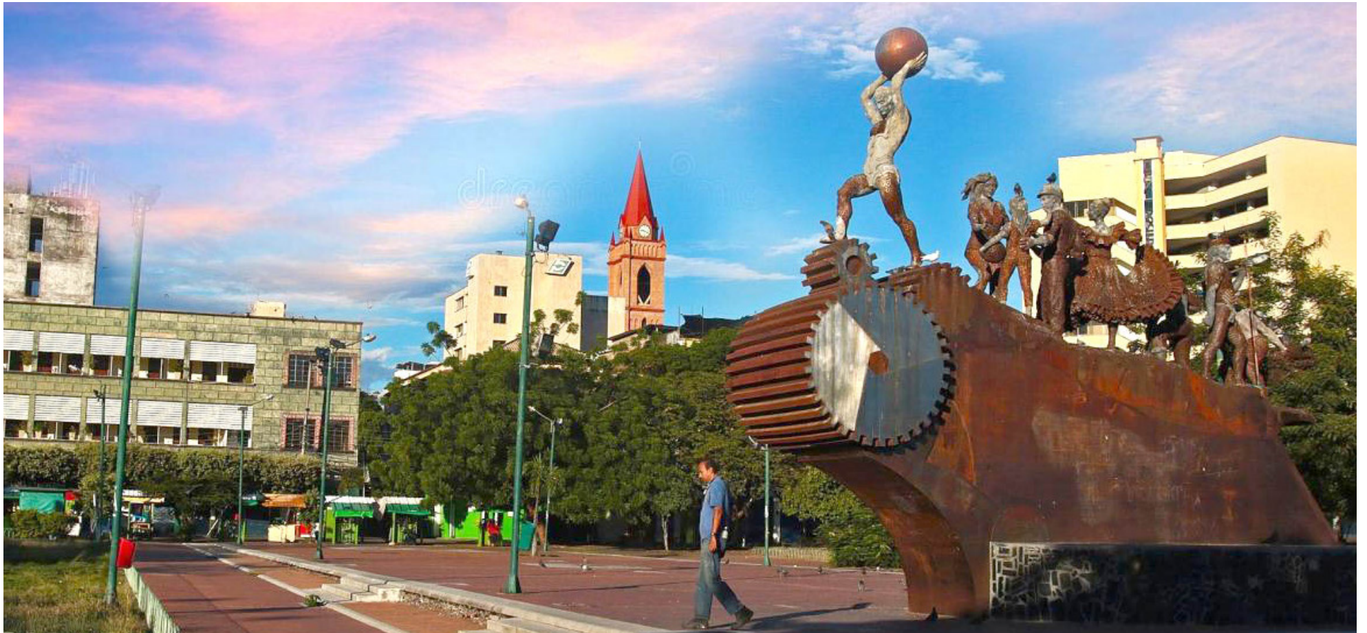
El próximo viernes la capital opita, se encuentra de plácemes.

■ El próximo 24 de mayo, la capital opita, se encuentra de plácemes, para ello la Administración Municipal, va a realizar el Primer Encuentro Nacional de Danza Infantil, que se llevará a cabo en la Asamblea Departamental, vienen delegaciones de varios departamentos. Asimismo, habrá una ceremonia eucarística en la iglesia Colonial.