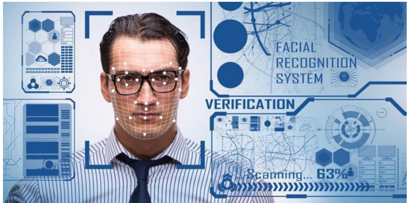
La aplicación fue desarrollada por la Policía Nacional y la Registraduría Nacional.

Dentro de las estrategias mencionadas, la Policía Nacional reveló que se ha desarrollado una aplicación en conjunto con la Registraduría Nacional para agilizar los controles de registro y la identificación de personas que tengan antecedentes o tengan procesos judiciales abiertos.