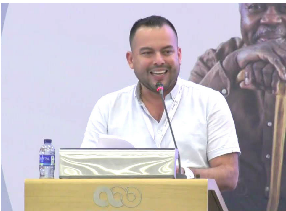
Edwin Palma, viceministro de Relaciones Laborales e Inspección, remarcó que la reducción de la jornada laboral estará aplicada de acuerdo al Código Sustantivo del Trabajo.