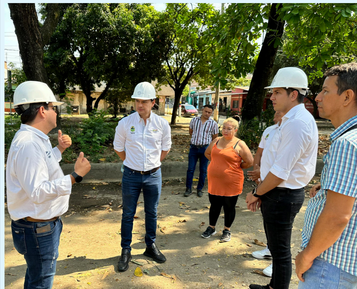
La reestructuración propuesta se fundamentará en un Estudio de Cargas y en la visión estratégica de la administración actual.