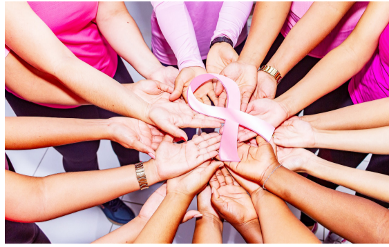
Cáncer de mama en el Huila