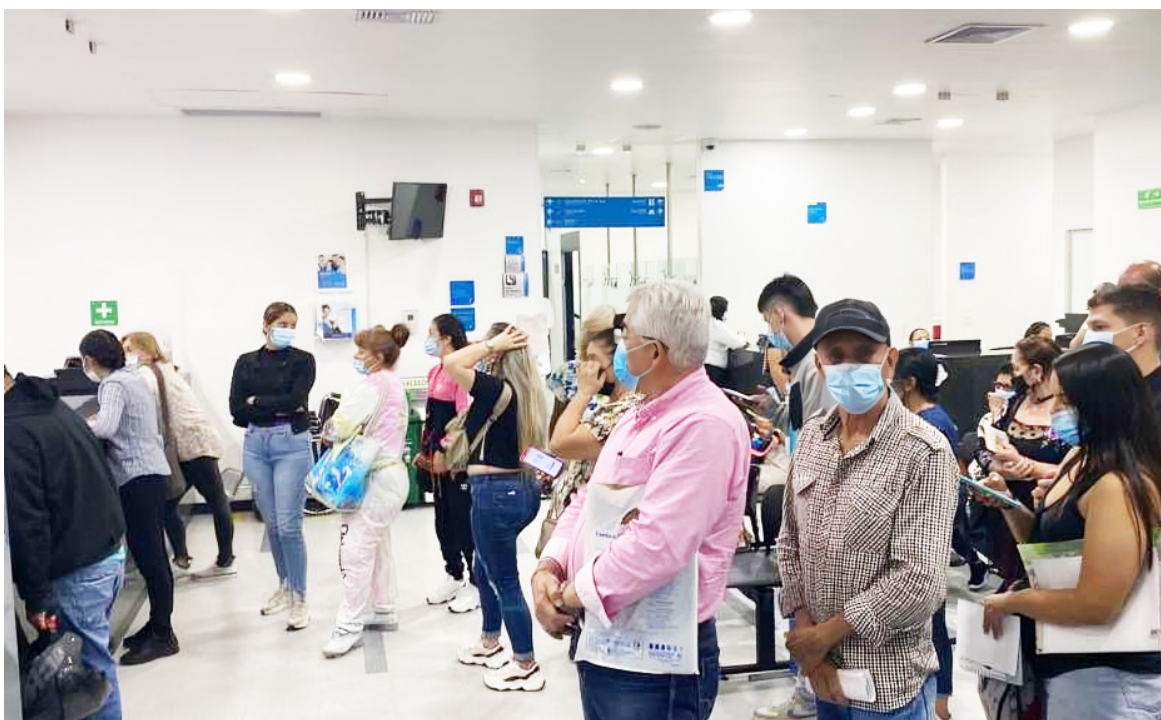
El ente asistencial va a manejar gran volumen de pacientes de una EPS, la pregunta se fundamenta en si tienen la capacidad para atenderlos.

“Faltan especialistas y la disponibilidad de insumos y reactivos en los laboratorios de la entidad. Esta situación fue puesta en conocimiento de la Secretaría de Salud Departamental, que tiene competencia en términos de habilitación. Y tenemos entendido que hay procesos sancionatorios por parte de la entidad mencionada”, reveló la cabildante.