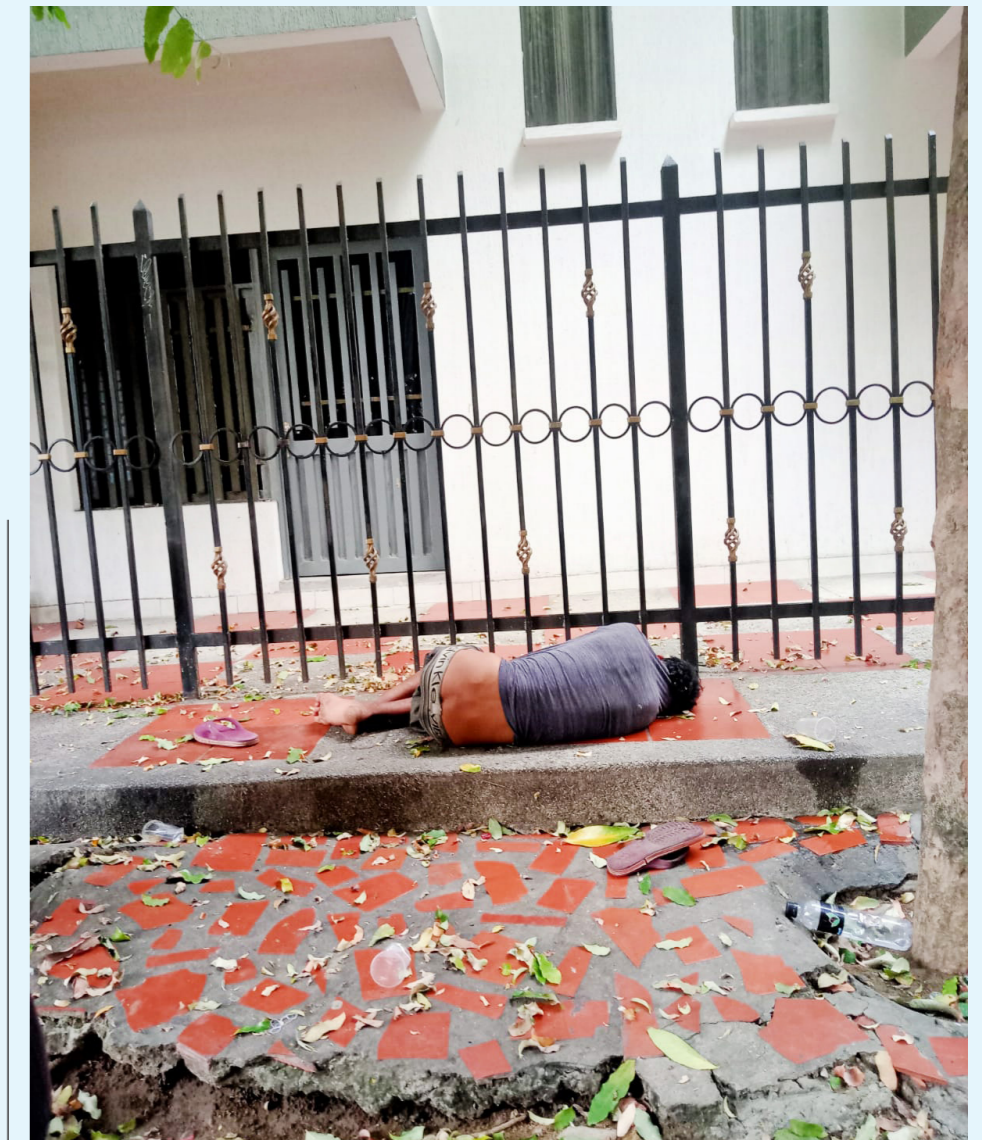
La inseguridad se ha vuelto una constante en el barrio, con habitantes de calle que amanecen en los andenes.

El ruido generado por los bares y las peleas entre consumidores ha añadido una carga adicional para los residentes, quienes se ven obligados a encerrarse en sus hogares por el miedo a la violencia y el desorden. La situación ha alcanzado un punto crítico, y los vecinos han comenzado a organizarse para buscar soluciones.