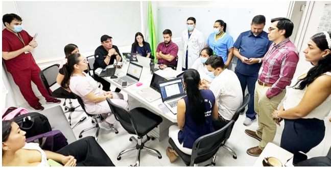
Retrasos en pagos y fallas en el servicio en Belo Horizonte