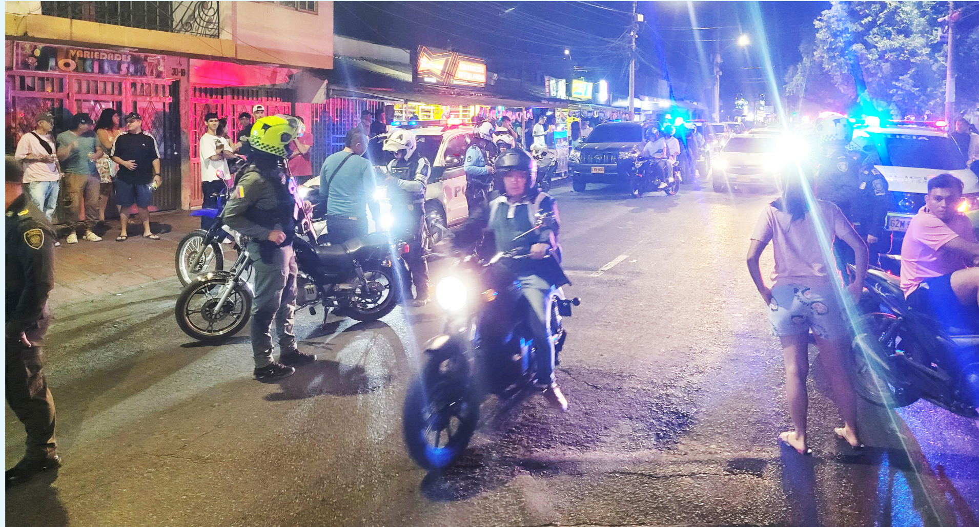
La comunidad clama por medidas efectivas que devuelvan la dignidad y el orden a sus calles.

La problemática ha ido empeorando durante los últimos cinco años. La llegada masiva de bares y establecimientos que venden alcohol ha atraído a un gran número de jóvenes, quienes frecuentan la zona, incrementando el consumo de alucinógenos. Este cambio en la dinámica