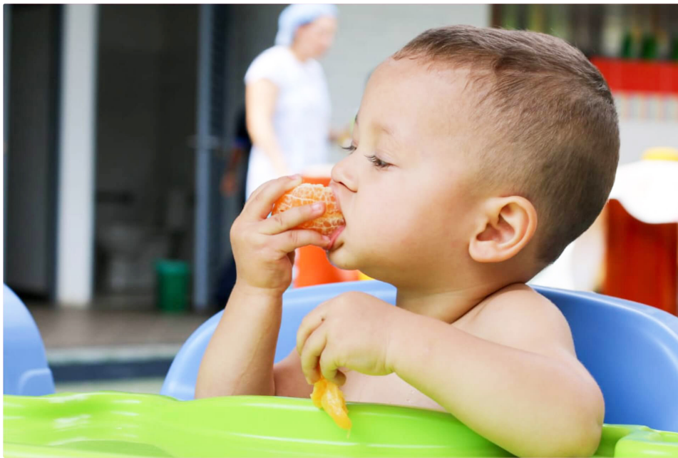
La desnutrición priva al cuerpo de los nutrientes necesarios para su correcto funcionamiento.

sobre la importancia de la prevención de enfermedades y el cuidado nutricional. Entre las recomendaciones para padres, destacan: