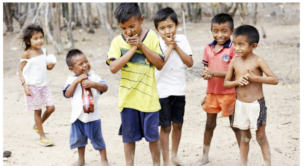
La lactancia materna exclusiva los seis primeros meses de edad es crucial para el desarrollo del bebé.

En el país, los niños menores de cinco años son los más afectados, enfrentando consecuencias graves como retrasos en el desarrollo físico y cognitivo, aumento de enfermedades y, en casos extremos, la muerte.