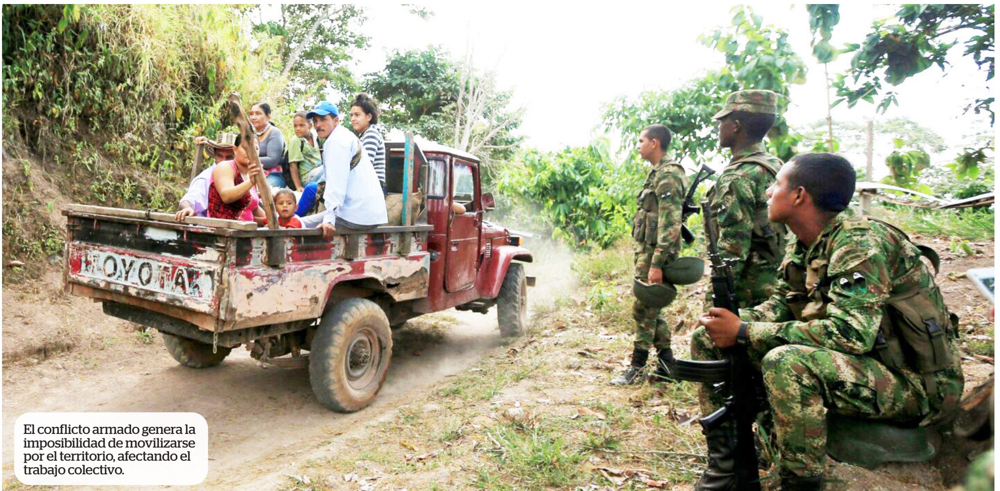
El conflicto armado genera la imposibilidad de movilizarse por el territorio, afectando el trabajo colectivo.