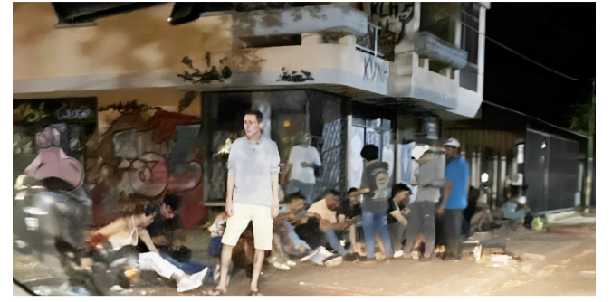
Entre el ruido y el descontrol en la Comuna Uno