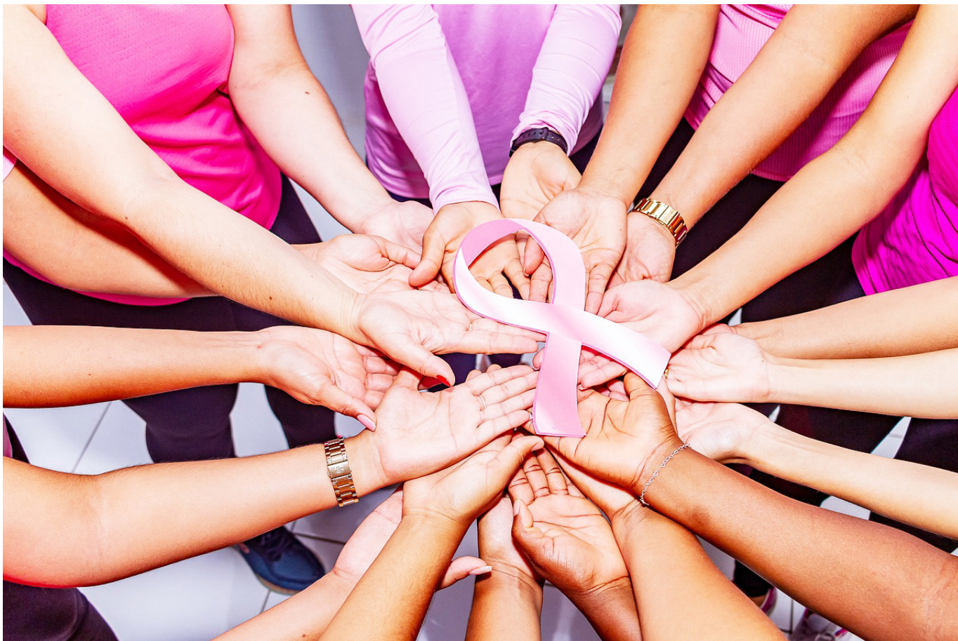
A nivel nacional, la tasa de incidencia del cáncer de mama ha mostrado un aumento en los últimos años.

El compromiso de la comunidad, los profesionales de la salud y las autoridades es vital para transformar la realidad del cáncer de mama en Huila. La concientización, el apoyo y la educación son herramientas poderosas que pueden marcar la diferencia en la lucha contra esta enfermedad, garantizando así que más mujeres tengan la oportunidad de recibir un diagnóstico temprano y un tratamiento adecuado.