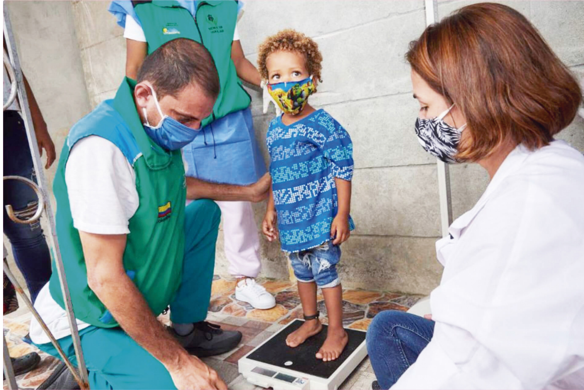
Más de 281.6 millones de personas sufrieron hambre aguda en el último año, señala el Informe Mundial sobre Crisis Alimentarias.

EPS Famisanar se ha comprometido a combatir esta problemática mediante programas educativos que buscan concienciar