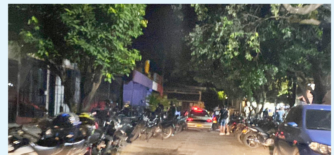
Los residentes exigen acción para recuperar su entorno y garantizar un espacio seguro.

La comunidad sigue esperando un cambio significativo, un compromiso genuino de las autoridades para abordar no solo el problema del descontrol urbano, sino también para garantizar que sus hijos y jóvenes crezcan en un entorno seguro y saludable. Mientras tanto, la lucha por recuperar su barrio continúa.