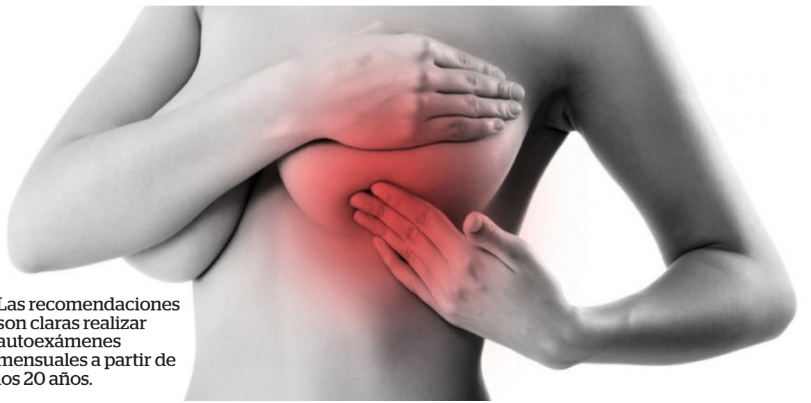
Las recomendaciones son claras realizar autoexámenes mensuales a partir de los 20 años.

Las dificultades económicas también juegan un papel crucial. Muchas familias enfrentan limitaciones financieras que impiden el acceso a tratamientos y exámenes, complicando aún más la situación. Los costos asociados con el transporte hacia los centros de salud, así como los gastos relacionados con los tratamientos médicos, son barreras que deben ser superadas para garantizar que las mujeres reciban la atención que necesitan.