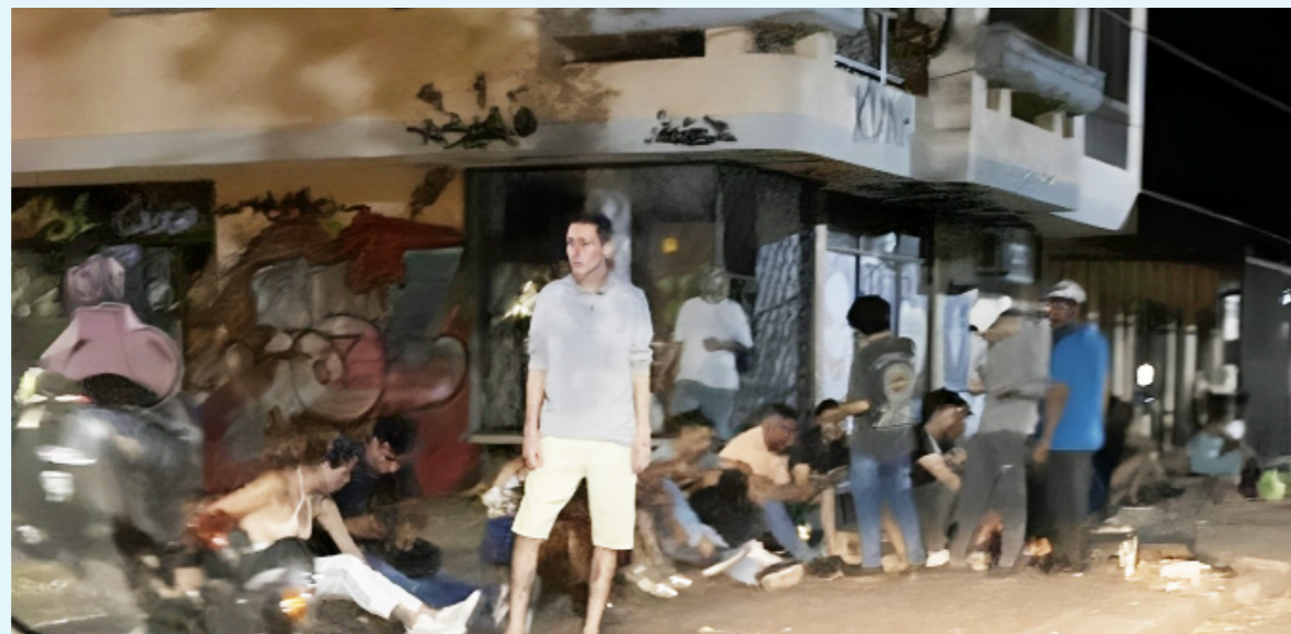
El deterioro del espacio público es evidente, con borrachos que realizan sus necesidades fisiológicas en plena vía pública.

social del área ha hecho que los residentes se sientan inseguros en sus propios hogares. Los jóvenes y niños de la comunidad, que transitan cerca de varios centros educativos —incluyendo la Universidad Surcolombiana y varios colegios— se ven obligados a convivir con consumidores