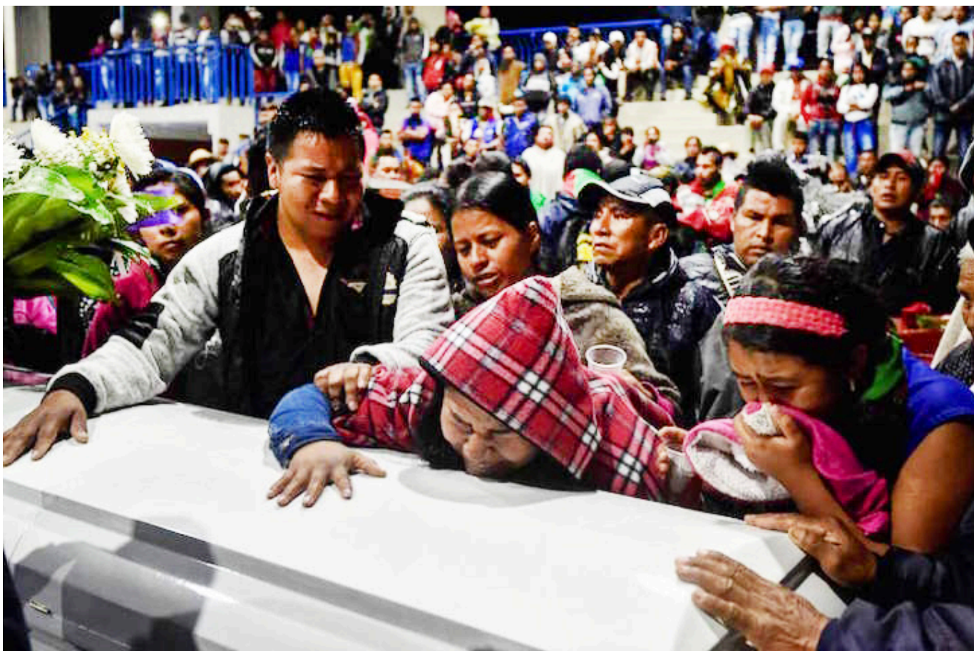
La violencia los acecha.

La Defensoría, hizo un llamado a la institucionalidad y a la sociedad para que protejan los derechos de estas comunidades. Es imperativo que se respeten sus formas de vida tradicionales, su cultura y sus actividades propias de agricultura, pesca y recolección de alimentos.