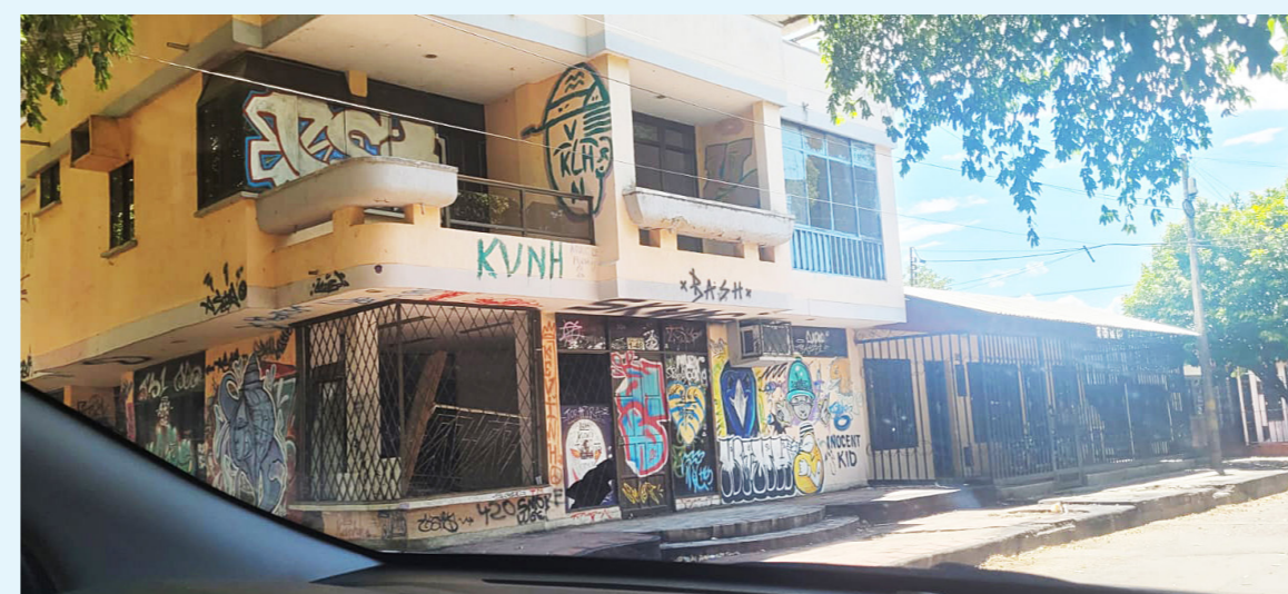
La falta de intervención de las autoridades ha llevado a que no haya límites.