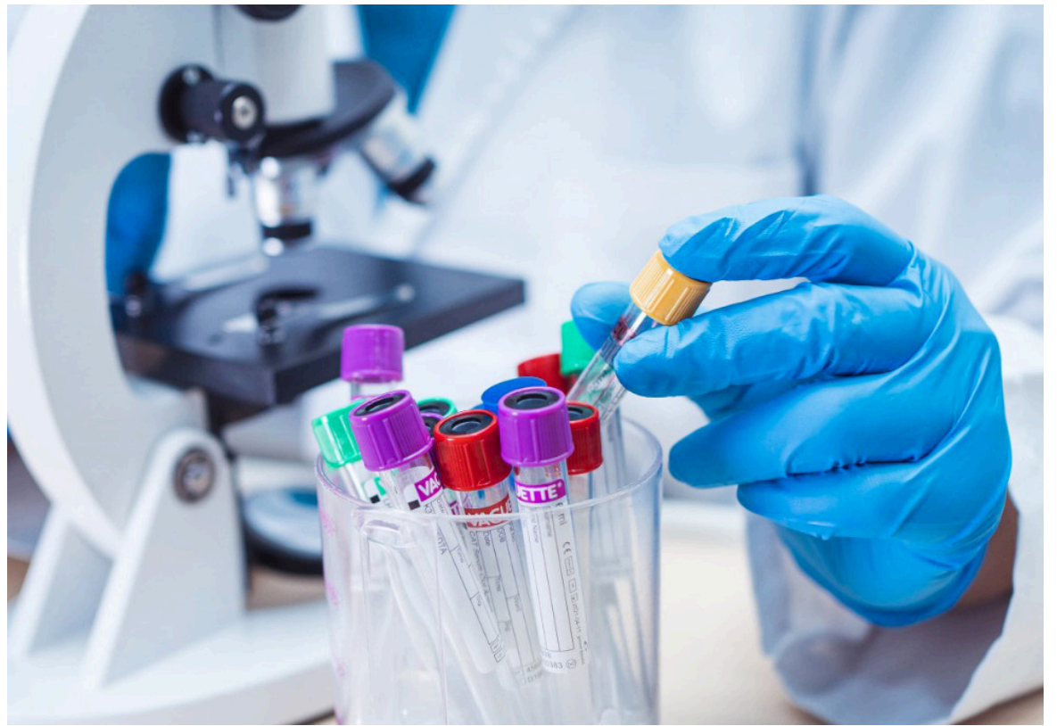
Habría falta de insumos y reactivos en los laboratorios de la entidad.