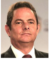
Germán Vargas Lleras

En 7 helicópteros artillados llegó la delegación del Gobierno Nacional al corregimiento de El Plateado, en el municipio de Argelia, Cauca. Junto a Laura Sarabia, los ministros de Agricultura, Minas y Energía, Ambiente, Comunicaciones, Salud y Defensa y otros varios directores de entidades nacionales. El que no llegó fue Petro. En esta ocasión no adujo motivos de salud, sino de seguridad. ¿Qué tal? ¿A dónde habremos llegado?