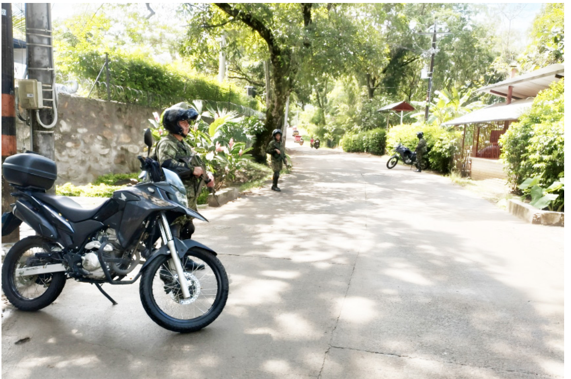
De manera preventiva las autoridades han reforzado la seguridad en el municipio de Rivera, con el fin de brindarles seguridad y tranquilidad a los pobladores y visitantes.