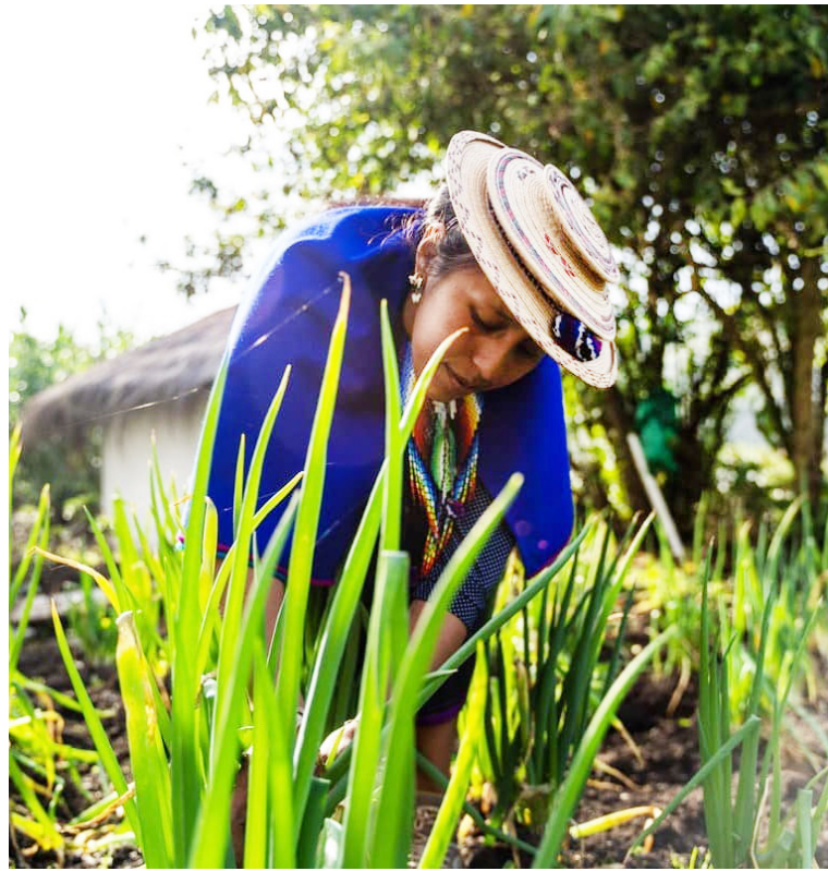
El conflicto armado afecta a las comunidades indígenas en su vida en comunidad y a nivel personal.

Ahora, en el Auto 004 de 2009, la Corte Constitucional señaló. “Algunos pueblos indígenas de Colombia están en peligro de ser exterminados, cultural o físicamente, por el conflicto armado interno, y han sido víctimas de gravísimas violaciones de sus derechos fundamentales individuales y colectivos y del Derecho Internacional Humanitario.”