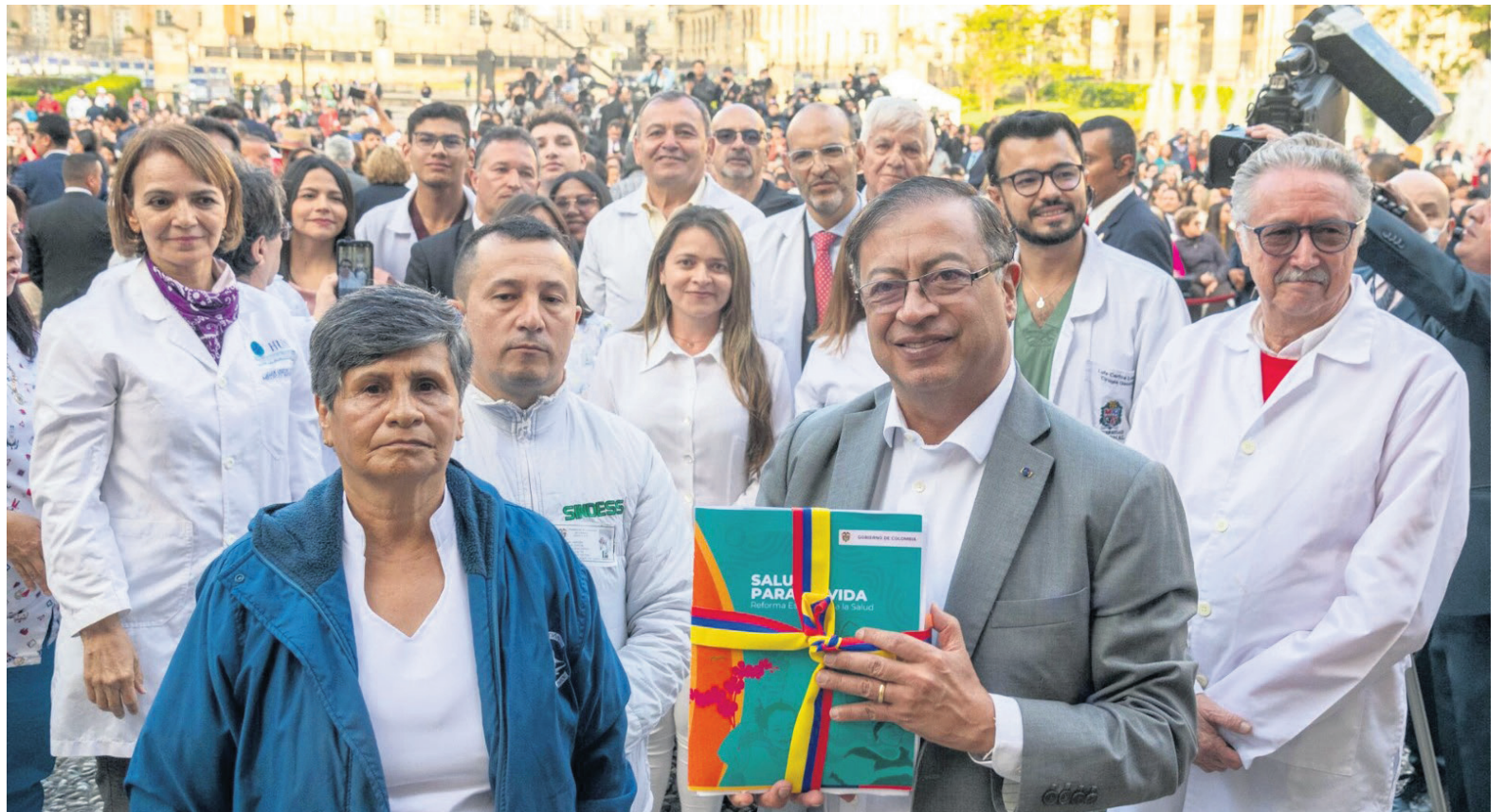
El informe de ponencia positiva sobre la reforma a la salud obtiene la aprobación en la Cámara de Representantes, desencadenando la formación de la Comisión Accidental.

Según el documento oficial, se destaca que el resultado final de esta reforma será el producto de un proceso participativo que involucra