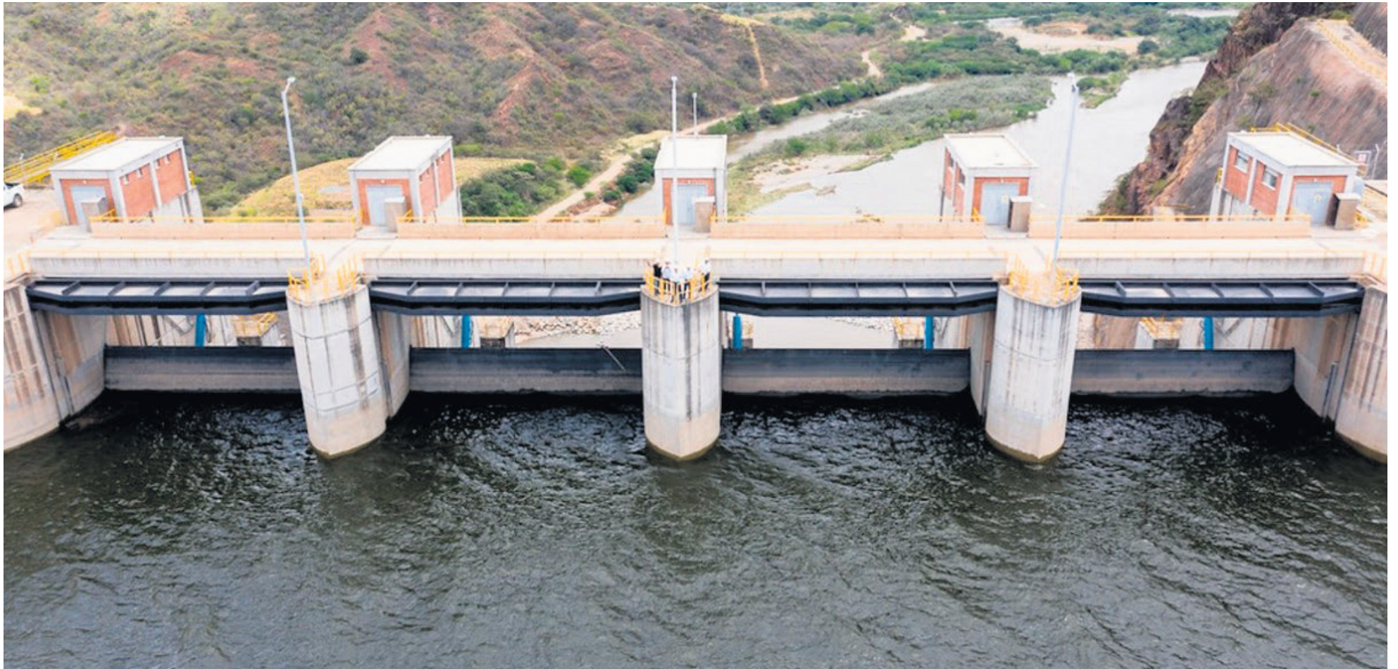
Funcionarios hicieron visita técnica a la Central Hidroeléctrica El Quimbo.