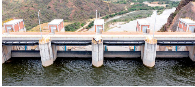
Se debe socializar el Plan de Contingencia del proyecto del Quimbo