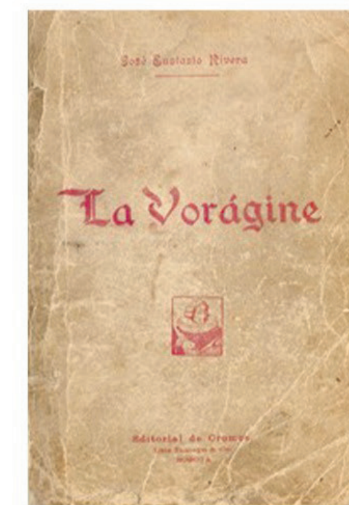
Primera edición de La vorágine . Editorial de Cromos, Bogotá, 1924

Finalmente, con un compromiso grande por integrar al Huila a la agenda cultural nacional, el Ministro se agendó