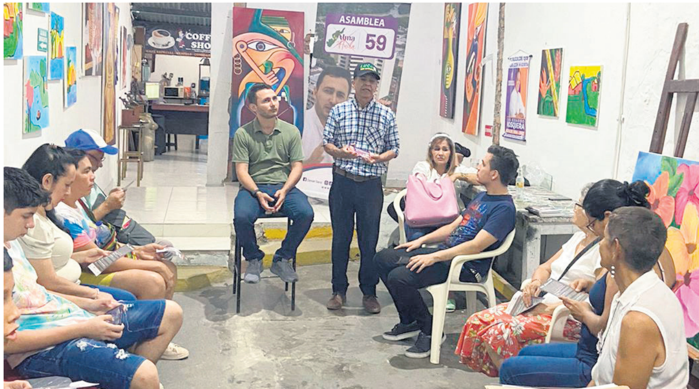
El candidato ha sido un abanderado de la cultura en el Huila.

parte de las instituciones para que podamos ayudar a que este sector crezca y allí como diputado también voy a ser ese diputado que va a estar con conocimiento pero también con mucho cariño, impulsando las políticas programas que le apunten a desarrollar el turismo desde la perspectiva de promoción turística, gestión de destino, mejoramiento de producto turístico y desde luego capacitación al sector.