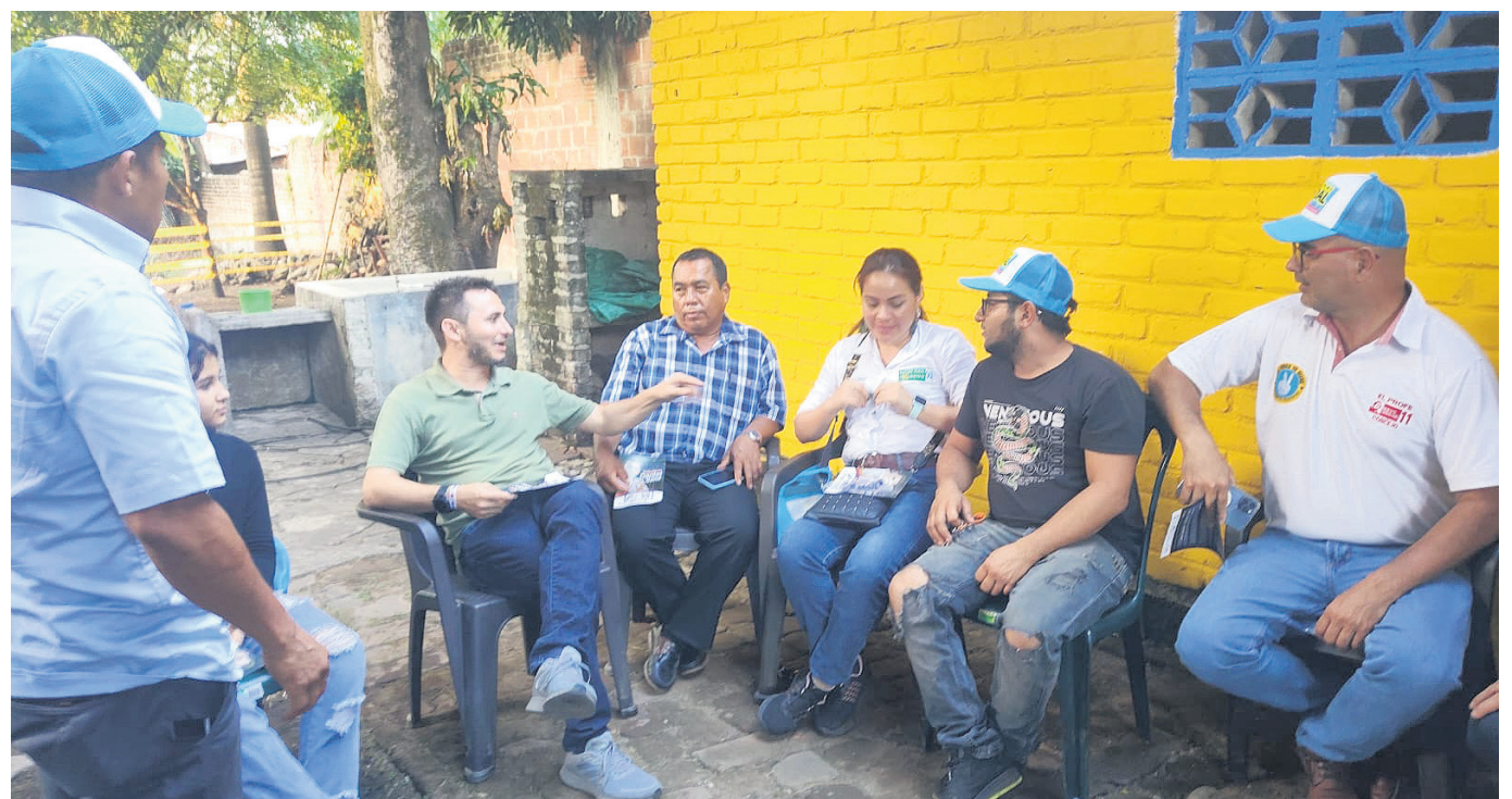
Los opitan ha recibido al candidato en los diferentes municipios.

El turismo, es una de las apuestas productivas que tiene el departamento del Huila, se avanzó de la mano de las universidades, cámaras de comercio, diferentes instituciones, los empresarios le metieron el hombro bastante fuerte y ahí que nosotros recibimos el turismo en el puesto 15 del índice de competitividad turística, hoy en día el departamento del Huila está en el puesto 10, es un avance muy importante, desde luego falta mucho de parte del gobierno, de