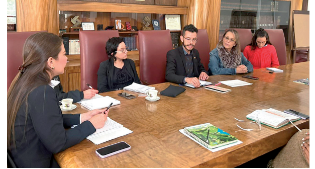
Unidos Por La Vorágine