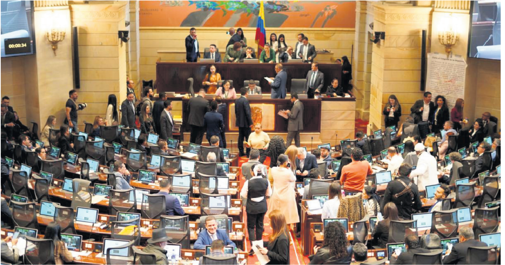
Representantes de diferentes partidos políticos se unen en la Comisión Accidental para buscar consensos en la reforma a la salud.