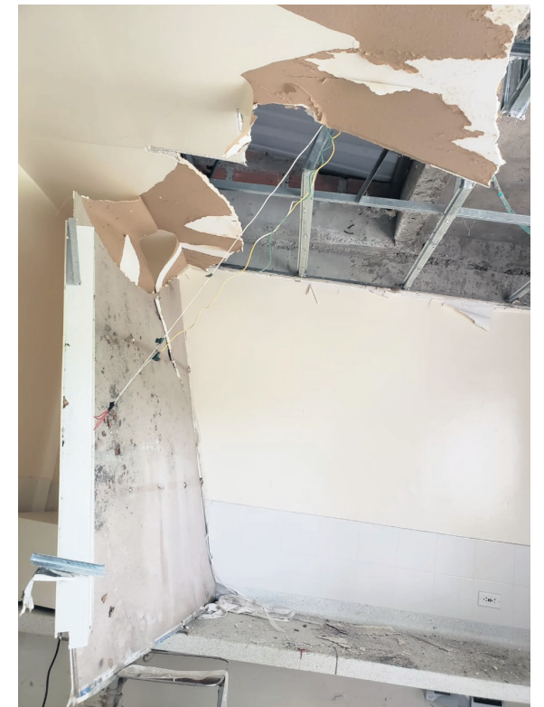
El proyecto, que formaba parte de un conjunto de cinco obras similares, fue gestionado por la Alcaldía Municipal en el año 2011

Los habitantes de Praga y las zonas aledañas exigen que este asunto no caiga en el olvido. La vida de los pobladores está en juego, y es imperativo encontrar soluciones rápidas para garantizar el acceso a atención médica de calidad en esta parte del norte del Huila