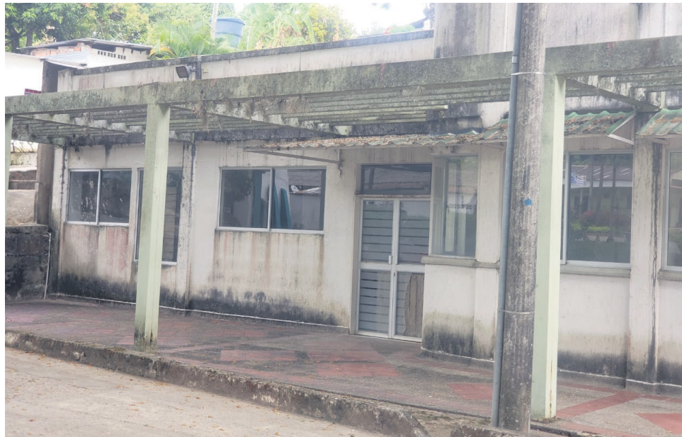
La Administración Municipal de Aipe, encargada de este inmueble asegura que les hace falta recursos para poder subsanar la situación.

munitaria de Praga, expresó su frustración al respecto: “Cuando lo entregaron hace 12 años, al otro día ya llovía dentro, no sé qué pasó que no hicieron cumplir los seguros y lo de veeduría que debió de tener esa obra. La comunidad se ha dirigido en varias ocasiones a Aipe para hallar respuestas, pero lo que responden es que eso no es del municipio, sino que es de salud, y los de salud dicen que eso es del municipio”.