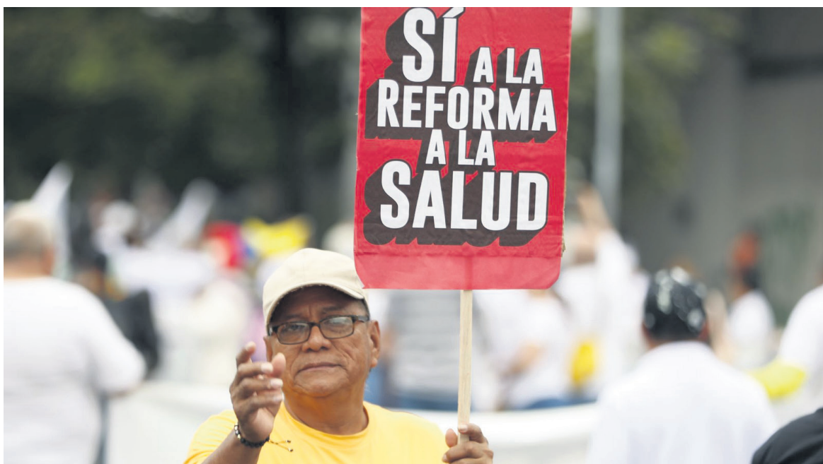
Con 93 votos a favor y 43 en contra, pasó en el Congreso la ponencia positiva del proyecto de la reforma a la Salud

Esta Comisión Accidental, junto con su compromiso de consulta y consenso, representa un paso fundamental en el camino hacia una reforma a la salud que satisfaga las necesidades de los ciudadanos colombianos. La resolución también hace referencia a una Comisión Accidental previa, denominada “Para el esclarecimiento de la verdad sobre el sistema de salud en Colombia”, que sigue activa y continúa trabajando en la mejora del sistema de salud del país. Para obtener detalles completos sobre la Resolución 0741 de 2023 y conocer más sobre la subcomisión encargada de concertar los puntos pendientes de la reforma a la salud, se recomienda revisar el texto completo del documento oficial.