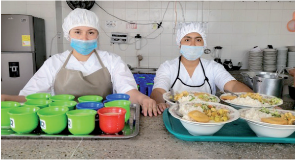
Aseguran recursos para terminar el PAE