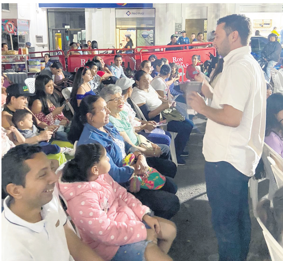
Sanz viene recorriendo el departamento del Huila, socializando sus propuestas.

sultados muy interesantes precisamente para el desarrollo de estos dos sectores.