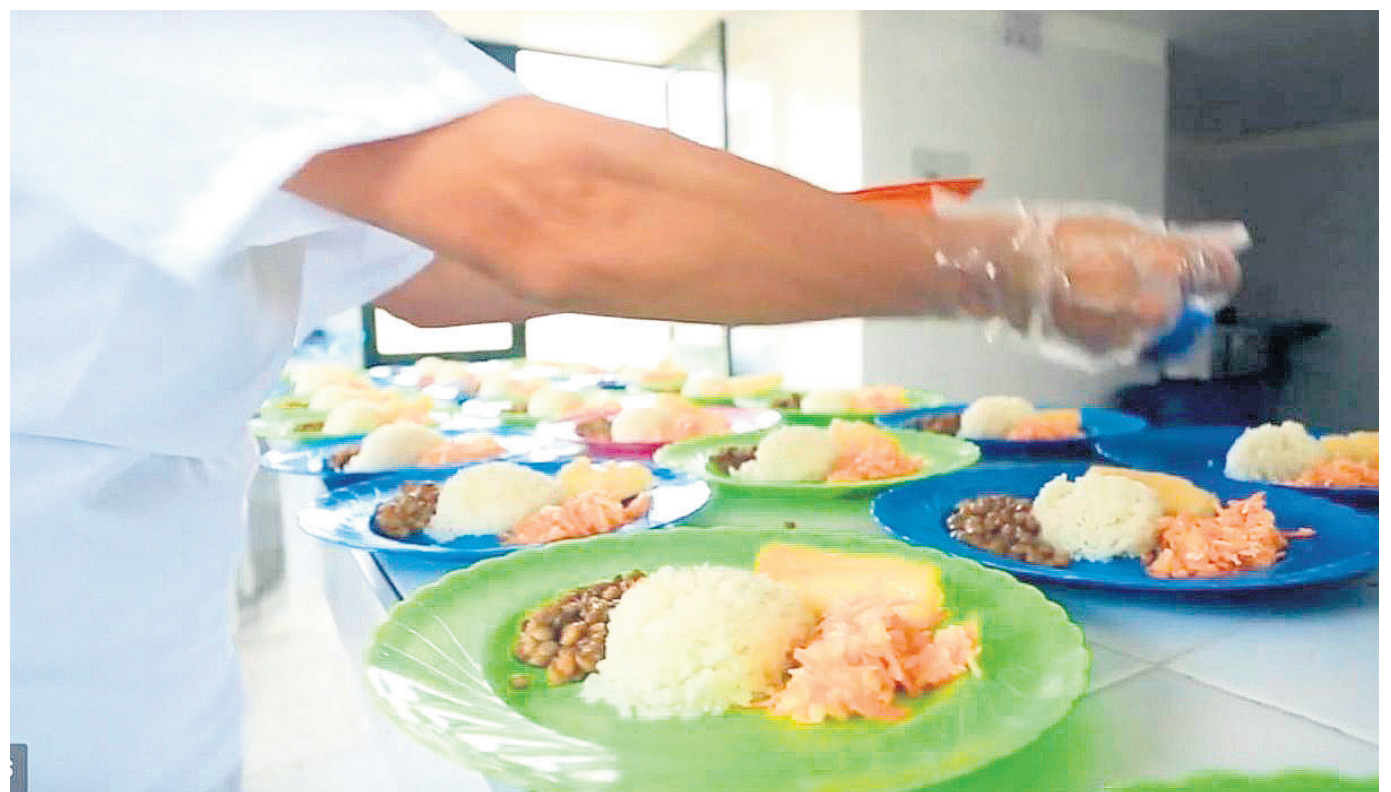
Acevedo, Agrado, Guadalupe, Pital, Suaza y Timaná, no tendrán PAE por dos días.

“Vamos a hacer una nueva contratación, y con esto ya tendríamos la prestación del servicio en los 25 días que nos faltan. La idea es conectar los contratos nuevos con la finalización de los vigentes, para que no haya contratiempos”, añadió la secretaria de Educación.