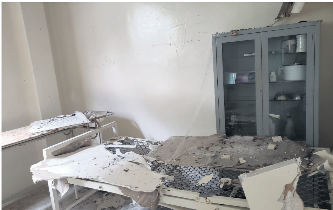
El deterioro del puesto de salud en Praga es evidente, con su infraestructura en ruinas y abandonada.