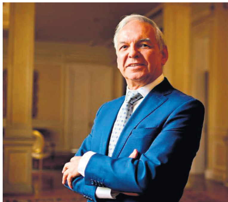
Ricardo Bonilla, ministro de Hacienda.

El impacto del pilar contributivo en la sostenibilidad fiscal se agrava cuando se contempla el umbral de 3 SMLV.