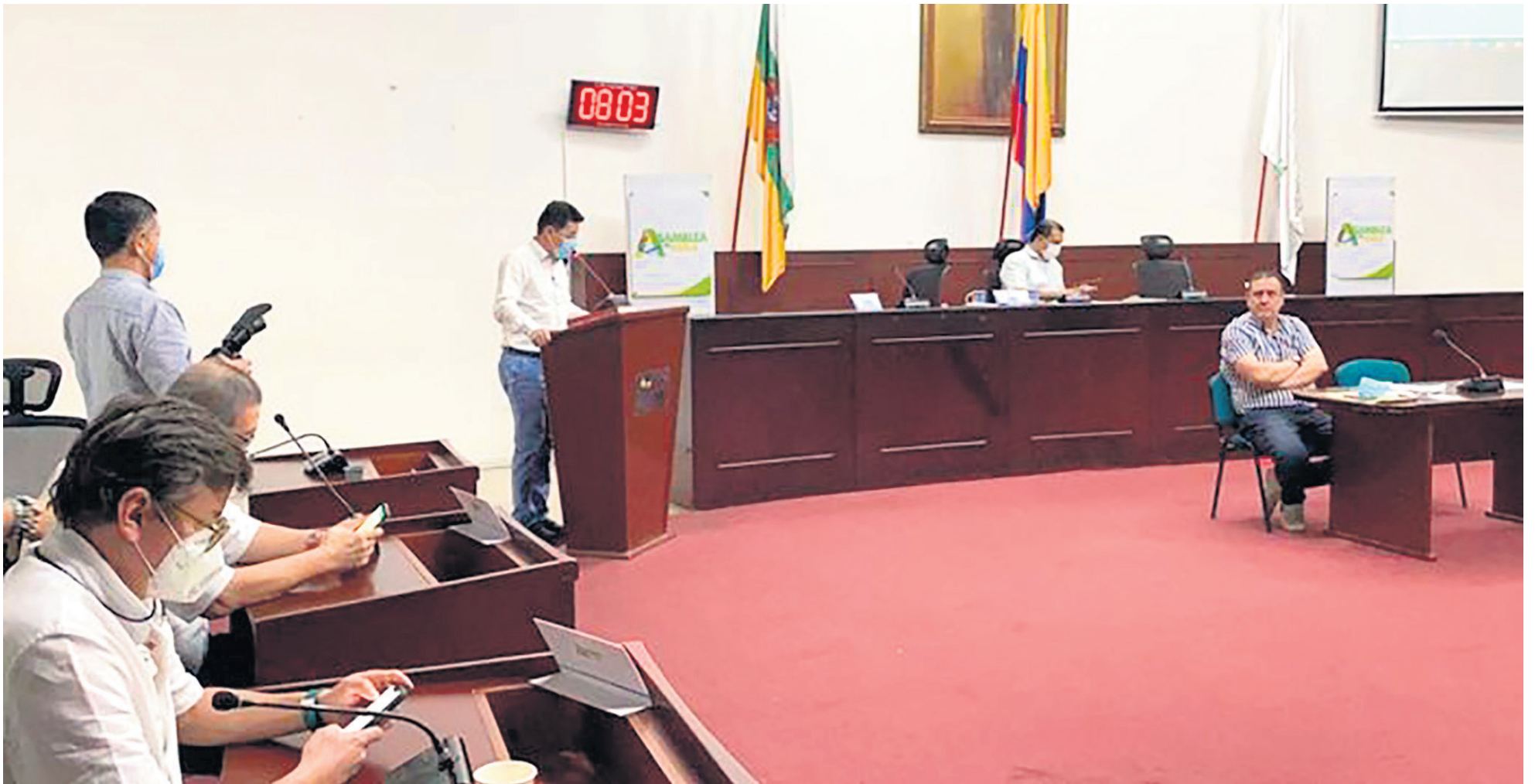
Los diputados promovieron la ordenanza para asignación de recursos.