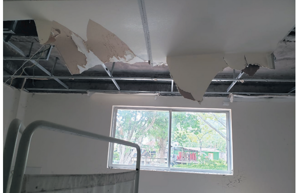
Estas imágenes y declaraciones reflejan la crítica situación del puesto de salud en Praga y la urgente necesidad de tomar medidas para garantizar atención médica adecuada para sus habitantes.