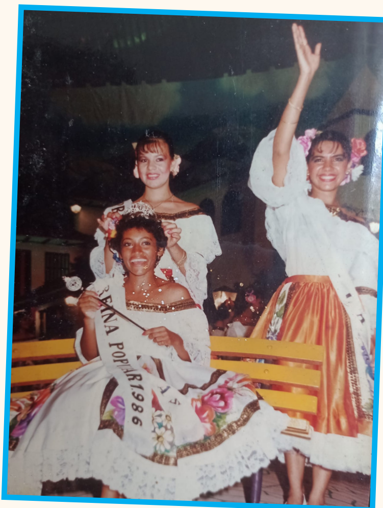
La señorita del barrio Las Palmas, se alzó con la corona en 1986.