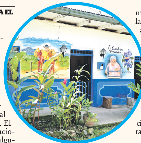
En las fachadas de las casas, se pueden encontrar algunas de sus melodías.

Desde la Alcaldía de Neiva, le apuestan a que la ciudad, se convierta en un modelo de paz y uno de ellos es el 'Sendero Villamil', que es un proyecto comunitario, la gente se asoció y empezaron a darle vida al turismo rural y científico. El sendero tiene varias estaciones y en las fachadas de algunas casas, se pueden encontrar canciones alusivas de este importante compositor.