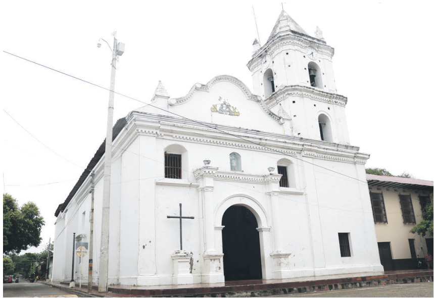
En total los once cargos que están en juego ya fueron asignados y quienes ganaron el concurso ya pasaron el periodo de prueba.

nerlo en cuenta para remitir la OPEC a la CNSC, pues goza de presunción de legalidad”, asegura.