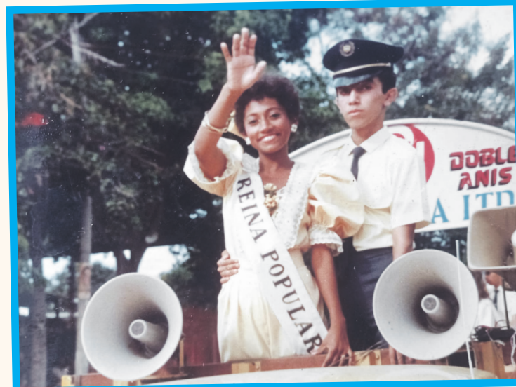
Desfile de la soberana.