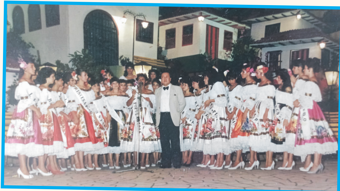
Las candidatas participantes en el certamen.