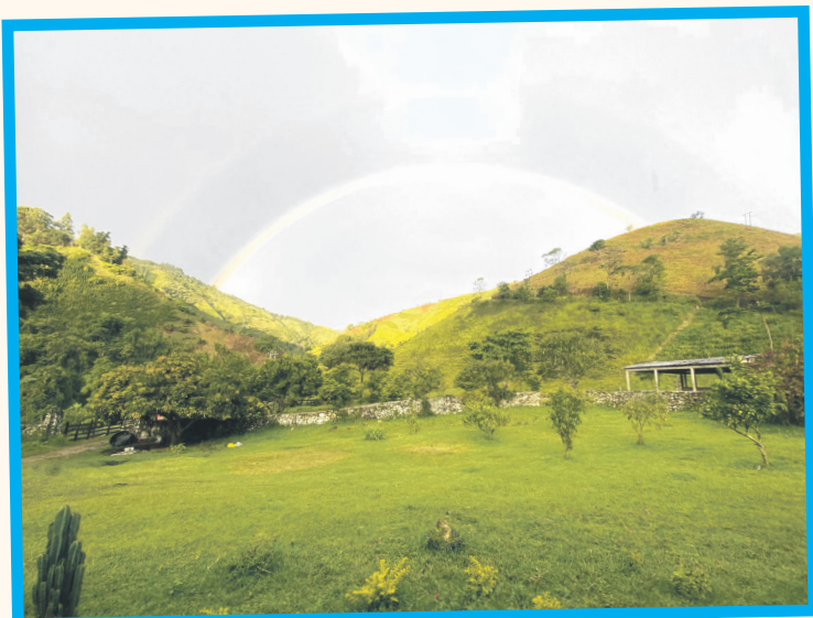
Paisaje que pueden encontrar los turistas.