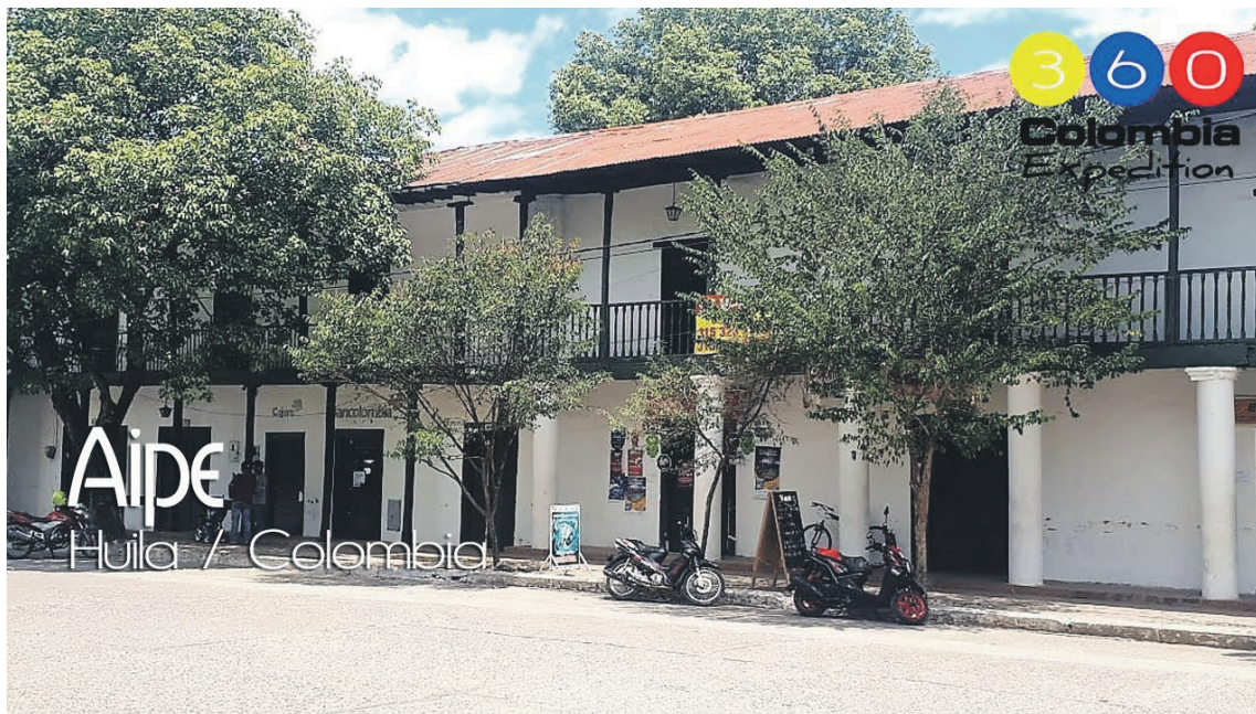
Más de nueve personas demandaron la nulidad de los actos administrativos que dieron vida a la convocatoria de la CNSC.

Según los iniciadores del pleito, los actos administrativos no cumplieron con el principio de publicidad previsto en el Artículo 65 del CPACA (Código de Procedimiento Administrativo y de la Contencioso Administrativo), “resultaba ineficaz y, por lo tanto, no era obligatorio para sus destinatarios”, señalan. No obstante, a pesar de ese “vicio de ineficacia”, la Alcaldía de Aipe y la CNSC (Comisión Nacional del Servicio Civil) expidieron la convocatoria con desconocimiento de los artículos 31 de la Ley 909 de 2004 y 2.2.6.34 del Decreto