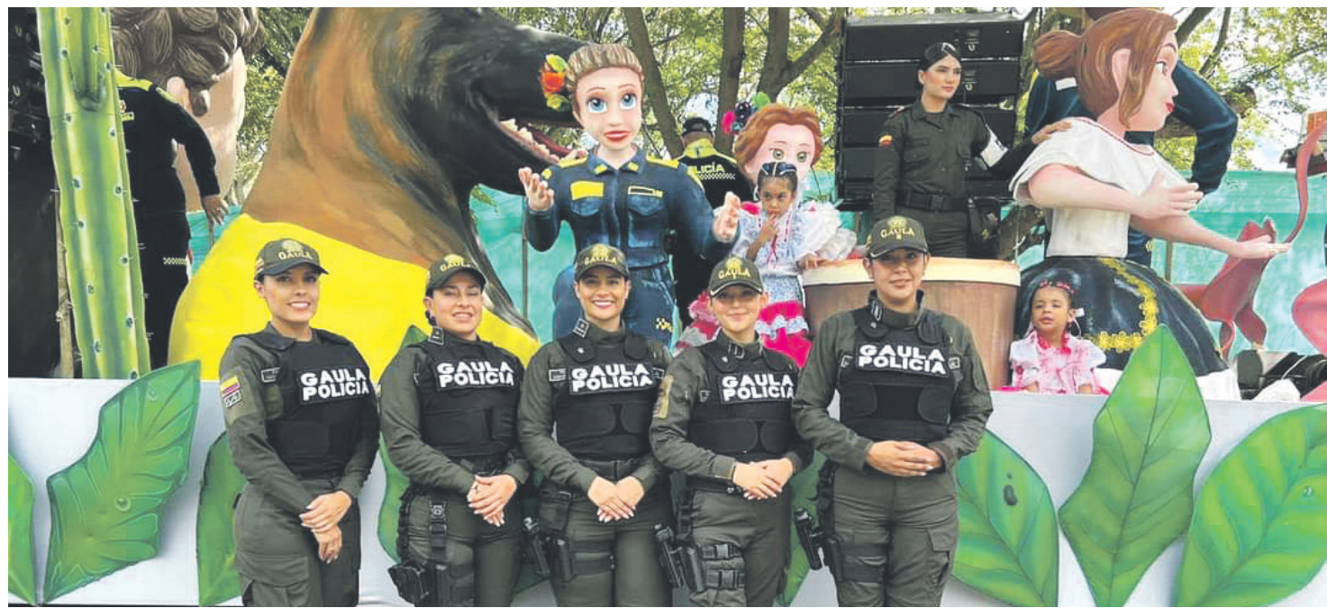
La implementación de estrategias de seguridad para el San Pedro por parte de la Policía Metropolitana de Neiva.