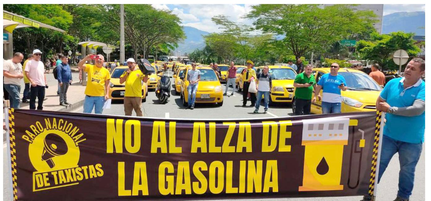
El alza del precio de la gasolina, viene afectando a la ciudadanía en general.

El incremento ha afectado considerablemente al transporte de alimentos, construcción y al servicio de transporte público, según