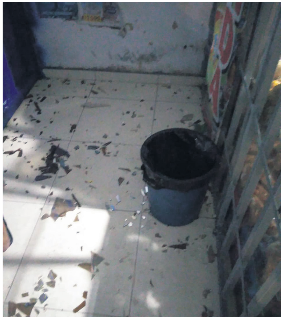
Los desmanes dejaron varias viviendas afectadas en el barrio La Libertad.

A pesar de las reuniones previas que se hicieron entre las autoridades locales y los líderes de las barras de ambos equipos en Neiva no se pudo evitar que se presentaran estos enfrentamientos entre los hinchas.