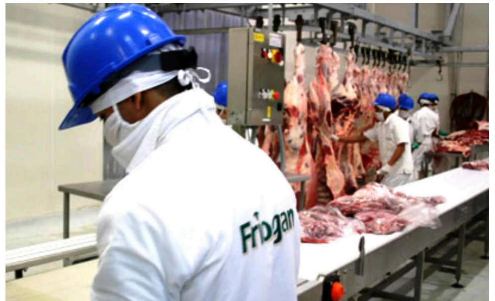
En el matadero se destruyeron 280 kilogramos de carne bovina que podrían poner en riesgo la salud de los consumidores.

(A.U.): Es que no hay otra explicación. Tienen que hacer un estudio. El otro tema aquí es que el Estado no tiene dentro de sus funciones administrar mataderos. Esa tarea no se la pueden poner a los alcaldes municipales. La tarea misional del Estado es muy diferente. Por otro lado, ningún privado va a coger tampoco un matadero de estos porque se mata muy poquito. Solo cinco o diez animales a la semana. Porque el negocio antes lo manejaban los matarifes, unos señores de botas negras y camiseta rota que llegaban ellos mismos, sin la mínima protección, a pelar la res en una sola mesa. Hoy en día el Invima exige que cada operación de la faena, debe hacerla un operario especializado para garantizar la inocuidad del producto y evitar contaminar. En la actualidad, en un frigorífico normal se usan hasta 16 operarios en un solo proceso y se tiene hasta un jefe ambiental.