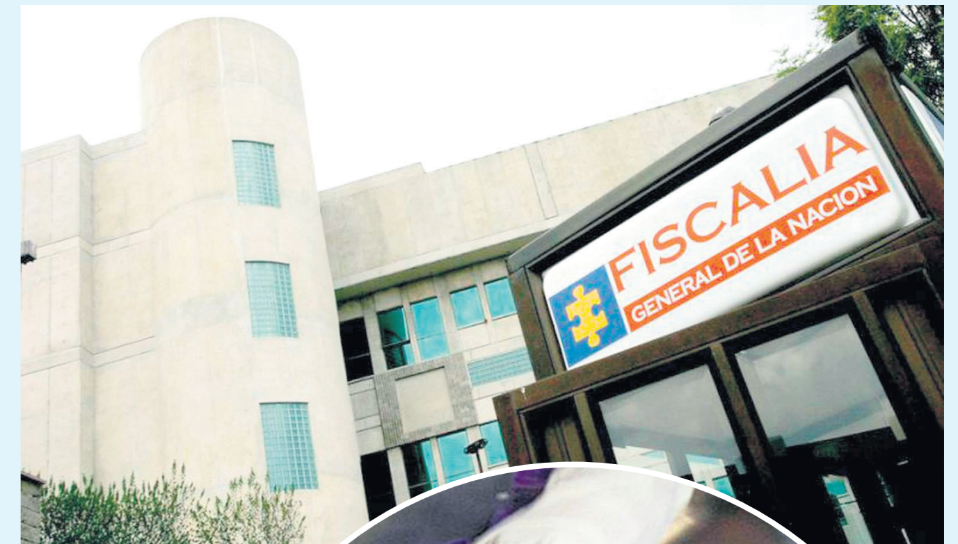
La comunicación y el consentimiento es clave.

Finalmente, el Consejo de Política Criminal sostuvo que como está redactada la propuesta podría generar un problema probatorio: "La evidencia probatoria de la Fiscalía recaería exclusivamente en el testimonio de la víctima, mientras que la evidencia probatoria de la defensa estaría en cabeza del investigado, poniendo en riesgo la