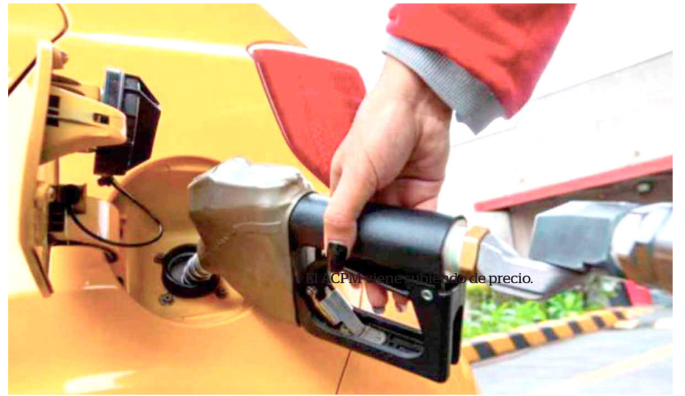
Los transportadores entraron en paro nacional.

En ese sentido, habrá varias jornadas de movilización en las ciudades capitales de Colombia. Sin embargo, en Neiva, hasta el cierre de esta edición no se tiene conocimiento de que ya esté previsto si en la capital del Huila también se realizará esta manifestación de protesta. Este martes