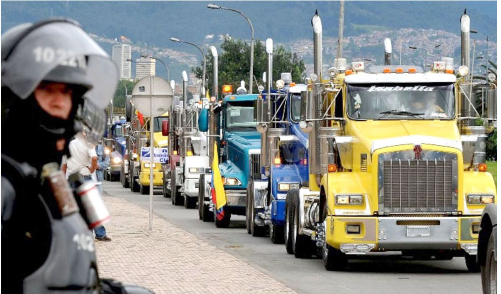
Los transportadores a nivel nacional se encuentran convocando a paro nacional.

■ Ante el alza al precio de la gasolina en Colombia se ha venido convocando por un sector de la derecha nuevamente una manifestación nacional contra el gobierno del presidente Gustavo Petro, cuya razón también había motivado a los taxistas del país a realizar un plantón nacional el pasado 9 de agosto en las principales ciudades.