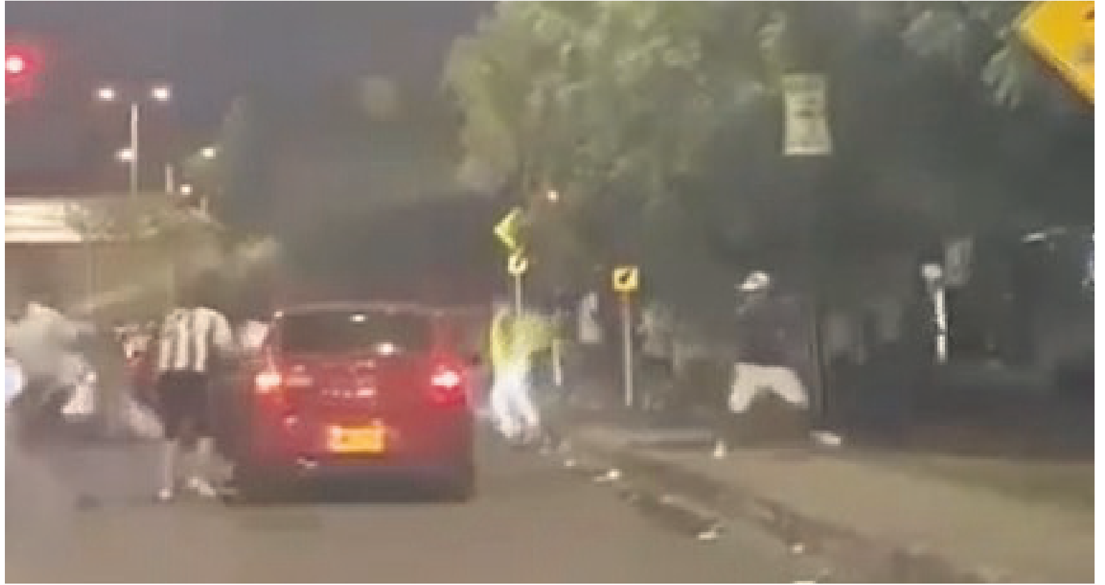
Riña entre hinchas del Atlético Huila y Atlético Nacional en la carrera 16.

Otros hechos de violencia se presentaron en el barrio La Libertad e inmediaciones de la Planta