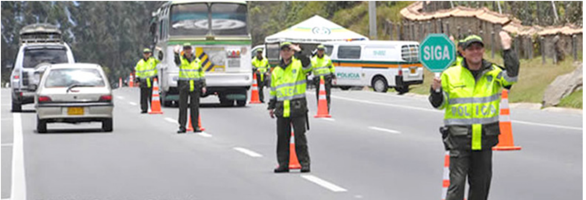
Las autoridades impusieron 140 comparendos.

vial se concentra en el tránsito urbano.