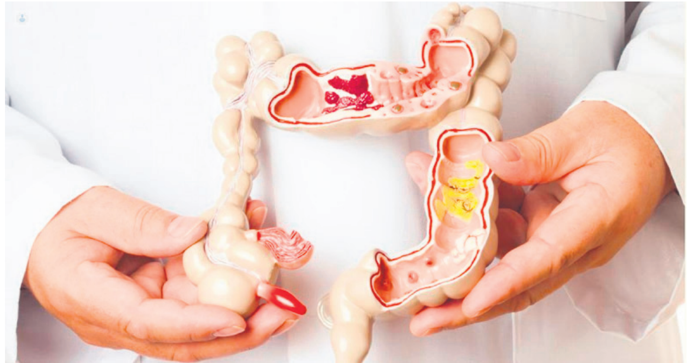
Una de las principales afectaciones del intestino grueso es el llamado colon irritable.

Asimismo, descubrieron que muchos de los loci relacionados con el SII también están involucrados en la regulación del sistema nervioso.