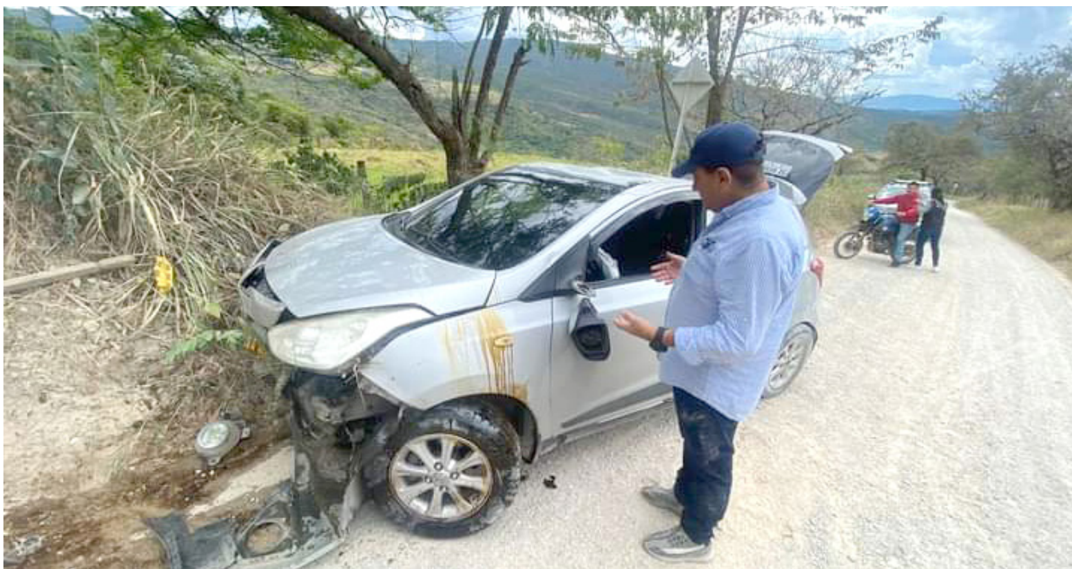
Accidente de tránsito en zona rural de Paicol.

Ya para finalizar, tres personas que viajaban en el vehículo de placa BNV-773, resultaron lesionadas, luego que el conductor del carro, perdiera el control, se salieran de la vía y cayeran a un abismo a la altura de la vereda Quebradón entre los municipios de Pitalito y Palestina. También se conoció que en el Valle de Laboyos una camioneta, arrolló a una pareja de motociclistas y luego se dio a la fuga, pero quedó registrada en una cámara de seguridad.