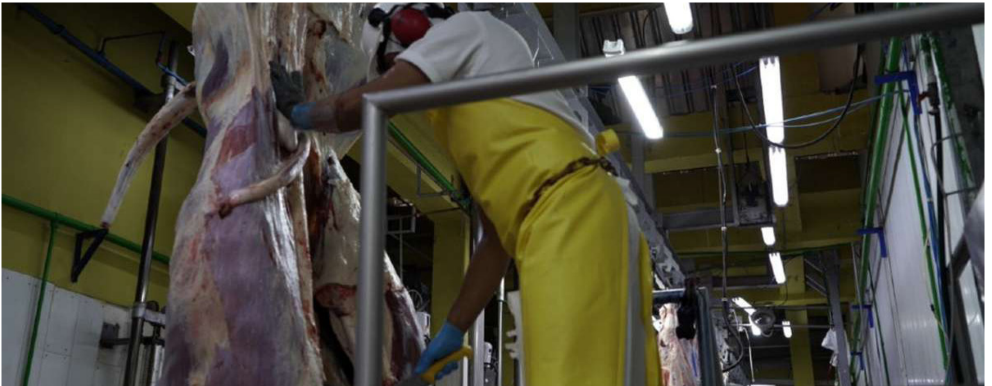
El decreto vigente permite, según el Invima, combatir actividades ilegales, como el sacrificio clandestino y el transporte y expendio de carne y productos cárnicos comestibles de procedencia ilegal.

riencia: van a encontrar que esas tuberías están revueltas. Les tocaría romper todo el matadero. Desde la parte técnica y de ingeniería es imposible que cumplan. lo mismo con normas de sismo resistencia. ¿Qué matadero antiguo va a cumplir con unas especificaciones de esas? Ninguno. Les tocaría rehacer los mataderos. Es mucho más barato hacer un matadero nuevo que reabrir los que ya existen.