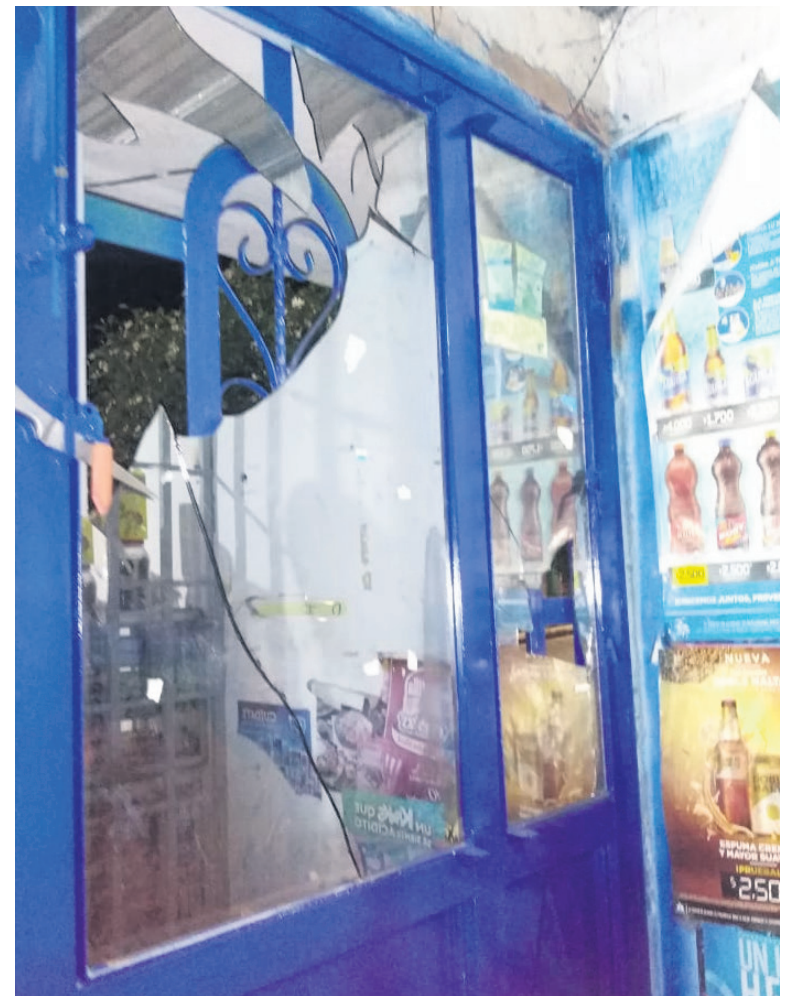
Algunas viviendas quedaron afectadas en techos y ventanas.

Un grupo de hinchas del Atlético Nacional y del Atlético Huila se enfrentaron frente al estadio arrojándose piedras, botellas y elementos que encontraron a su paso, hecho que se extendió por varios minutos afectando también la movilidad por la carrera 16 de ese sector