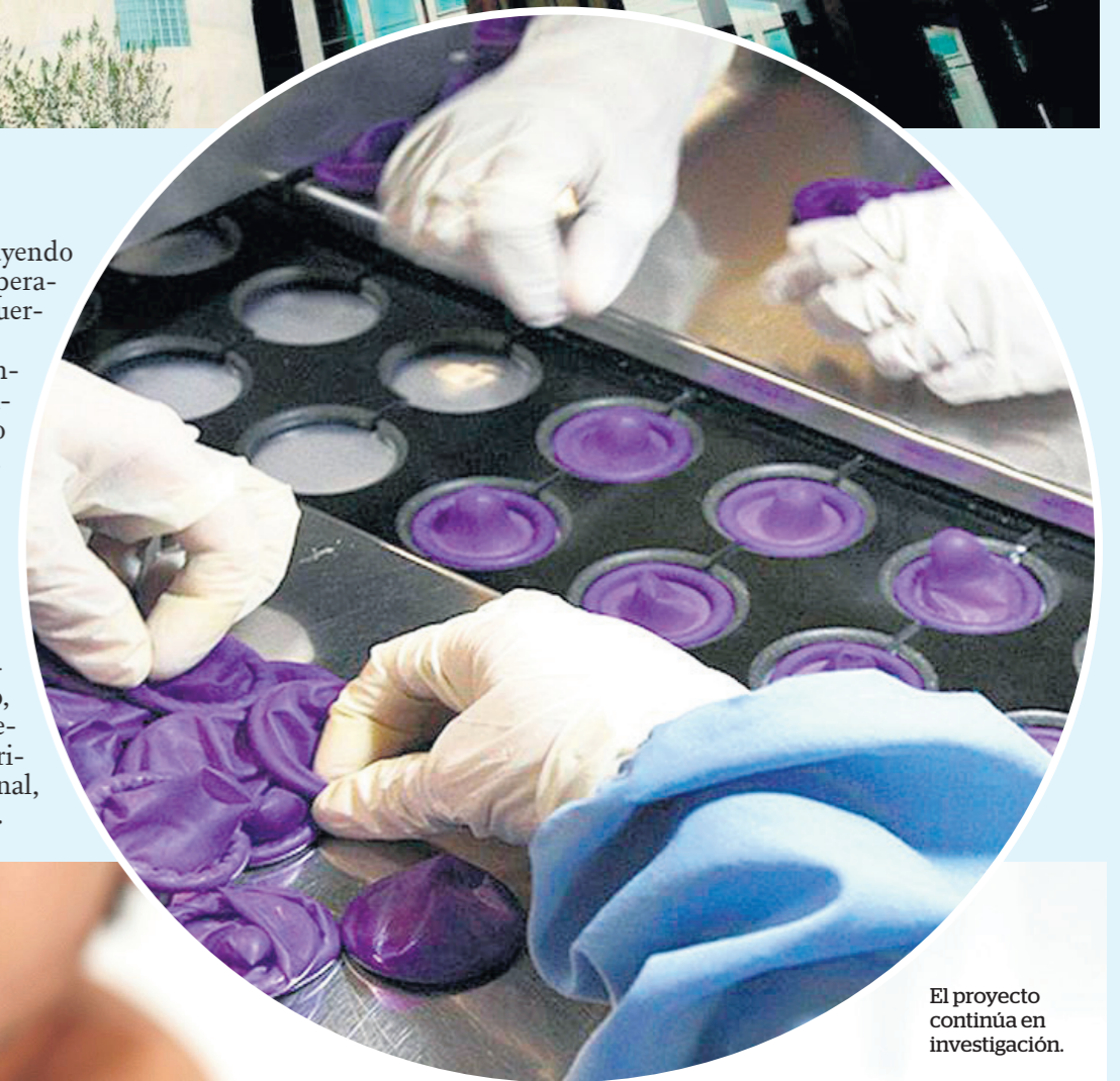
El proyecto continúa en investigación.

Por todo esto, el concepto concluye diciendo que este proyecto carece de suficiencia de evidencia empírica, coherencia, seguridad jurídica y no toma en cuenta la prohibición del populismo punitivo "al tratarse de un proyecto de ley sin sustento, sin estudios, que presenta una política criminal que no es racional, estable ni realizable".