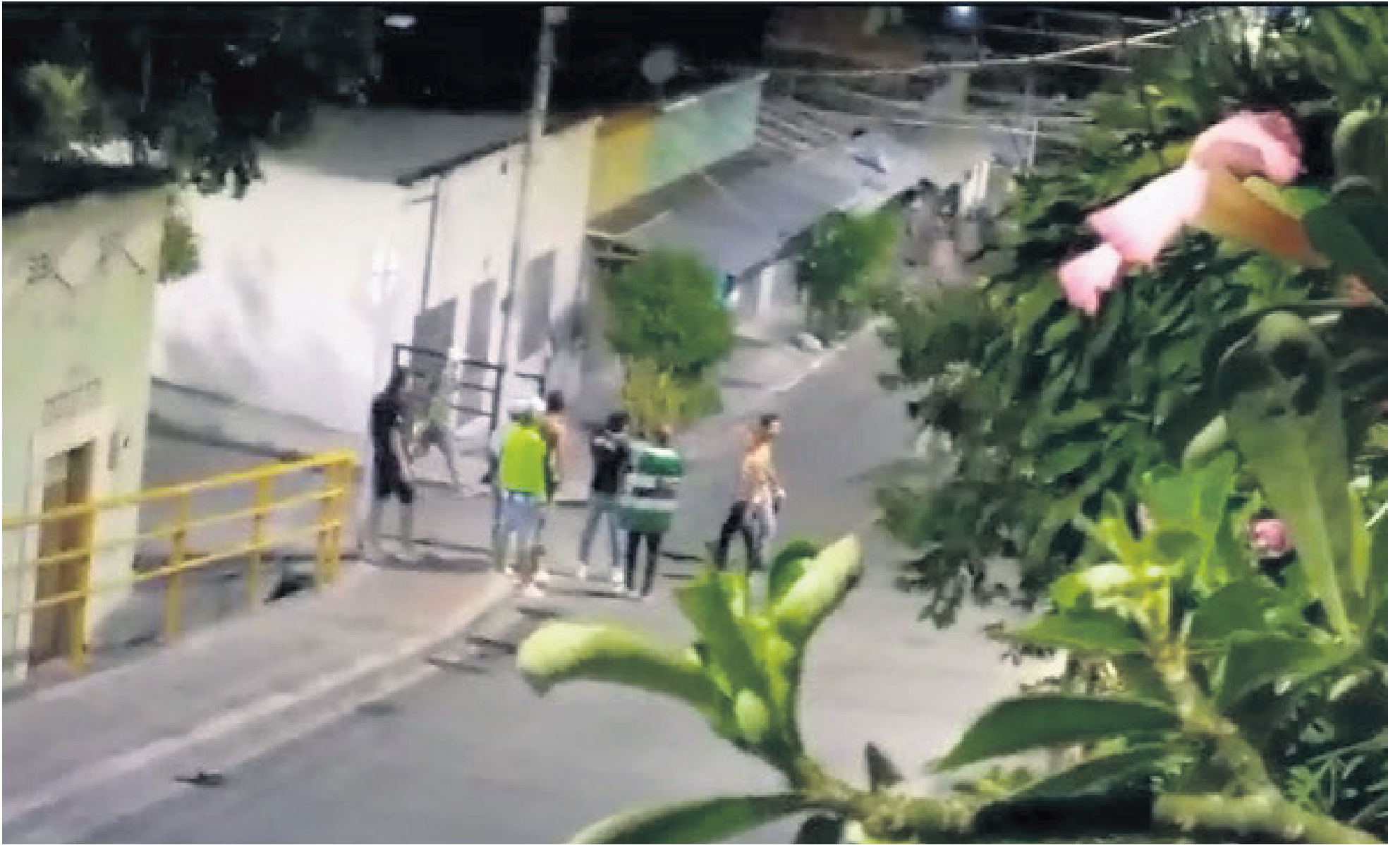
Hinchas del Atlético Nacional intimidando a los residentes en la calle 18.