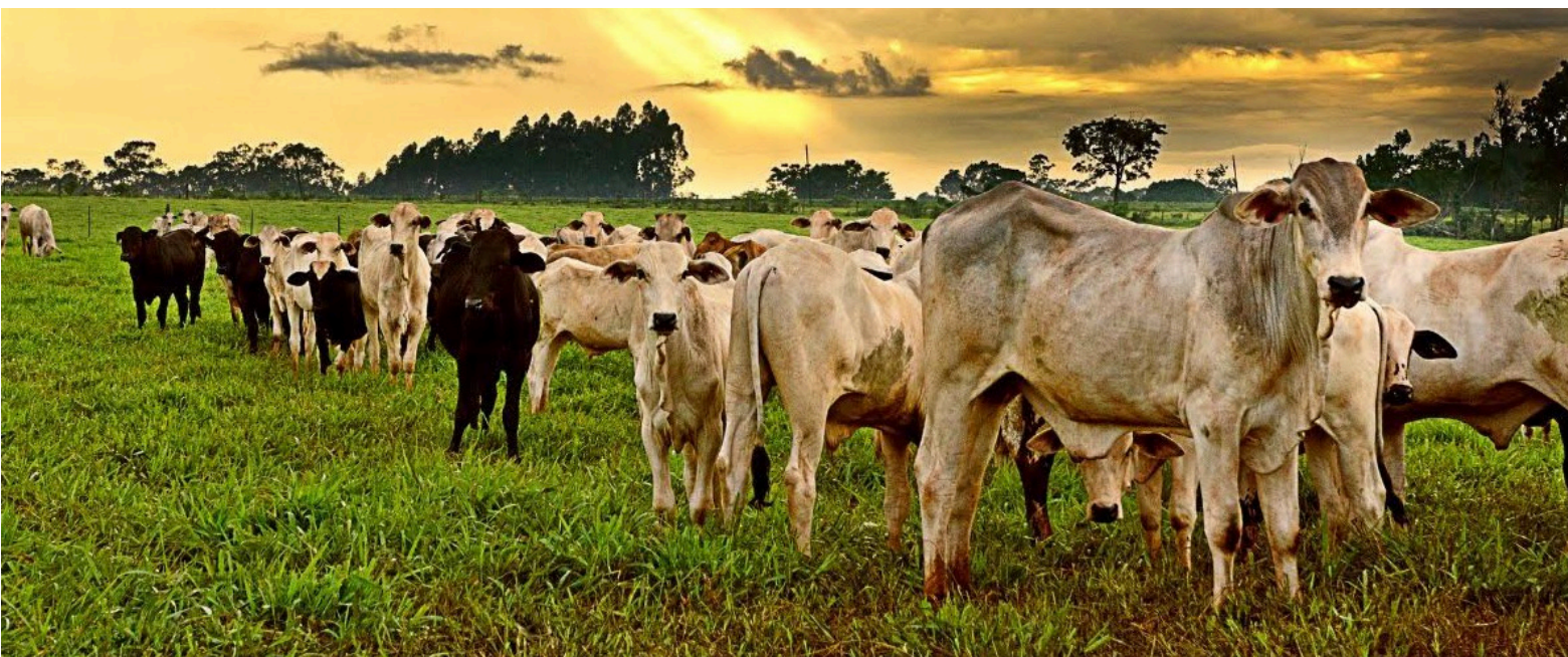
De acuerdo con el Invima, el proyecto de modificación del Decreto 1500 de 2007 "está enfocado a resolver las dificultades de abastecimiento.

(A.U.): El riesgo es grande. Lo que se está comprometiendo es la salud pública. Porque será difícil controlar esas plantas. El Invima, que es la entidad encargada, no podrá llegar porque ni siquiera tienen capacidad para vigilar en su totalidad las que existen y no tienen presupuesto para viajar. Y los mataderos no tienen cómo pagar las inspecciones del Invima. Existe una enfermedad que se llama la faciola hepática (llamada mariposa); es un parásito que les sale en el hígado a los animales. En las plantas controladas, donde hay un inspector del Invima, este revisa el hígado del animal y constata que no exista el parásito y así garantizar que no vaya al consumo humano. ¿Podrán los mataderos garantizar eso, por ejemplo? Es claro que no.