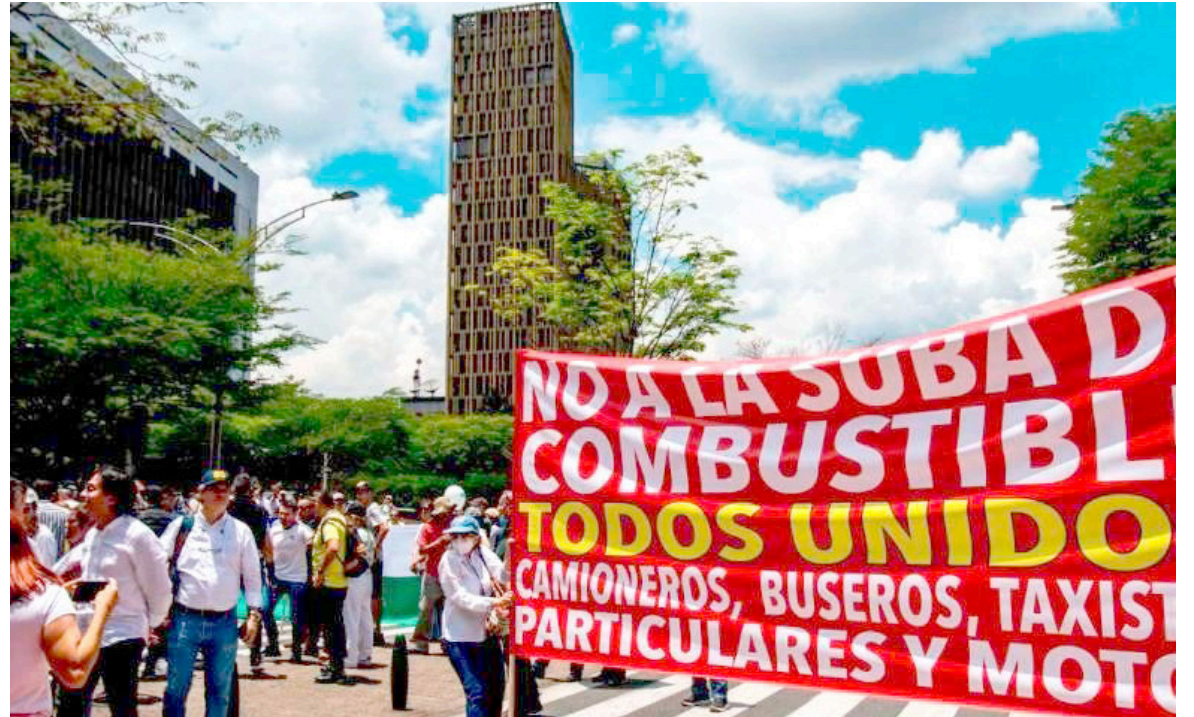
El ACPM viene subiendo de precio.

indican algunos expertos economistas. En ciudades como Neiva, el precio de la gasolina en las estaciones de combustible para este mes de agosto se ha mantenido entre los 13,990 y los 14,050, mientras que en Pitalito en 13,897 y 14,050, teniendo en cuenta que el aumento solo ha sido para la gasolina corriente. Las ciudades con el precio más económicos son Pasto y Cúcuta. El senador Jota Pe Hernández manifestó que no es justo que un país como Colombia “Pague el 100% del combustible al precio internacional cuando importa solo el 20 % del exterior, por lo que cuestionó por qué se debería pagar el 80 % restante a precio internacional” mencionó también ante la expectativa que existe si el ACPM también tendrá un incremento.