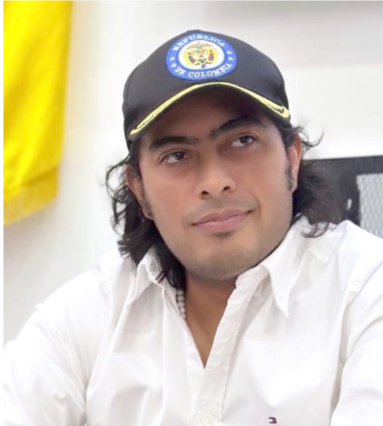
Nicolás y Gustavo Petro.

Tras su liberación, el exdiputado del Atlántico viajó a Barranquilla, ciudad a la que el presi-