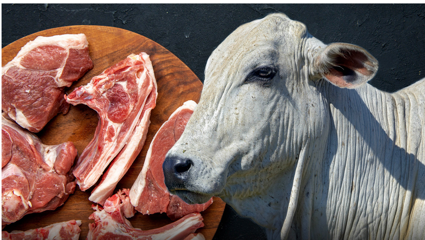
Este alimento escaseará en el puerto petrolero.

(A.U.): Es que estamos hablando de lugares que fueron construidos, en su mayoría, hace más de 50 años cuando no existía la normativa que existe hoy en día. Es imposible que cumplan con las condiciones. Y ni siquiera es culpa del mismo matadero o del alcalde de turno que lo mandó a construir. Y entrar a modificar eso es muy difícil. Piense por ejemplo en la red sanitaria. Si quisieran hoy que fuera óptima, la misma norma dice que no pueden pasar de un área sucia a un área limpia. Lo digo por expe-