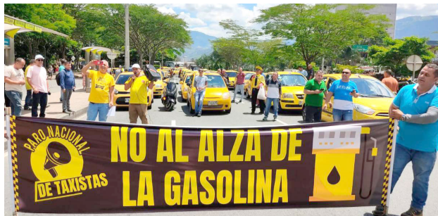
Paro Nacional ante alza de la gasolina y el ACPM