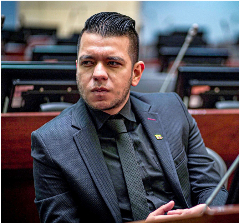
El paro estaría programado para este 28 de agosto.