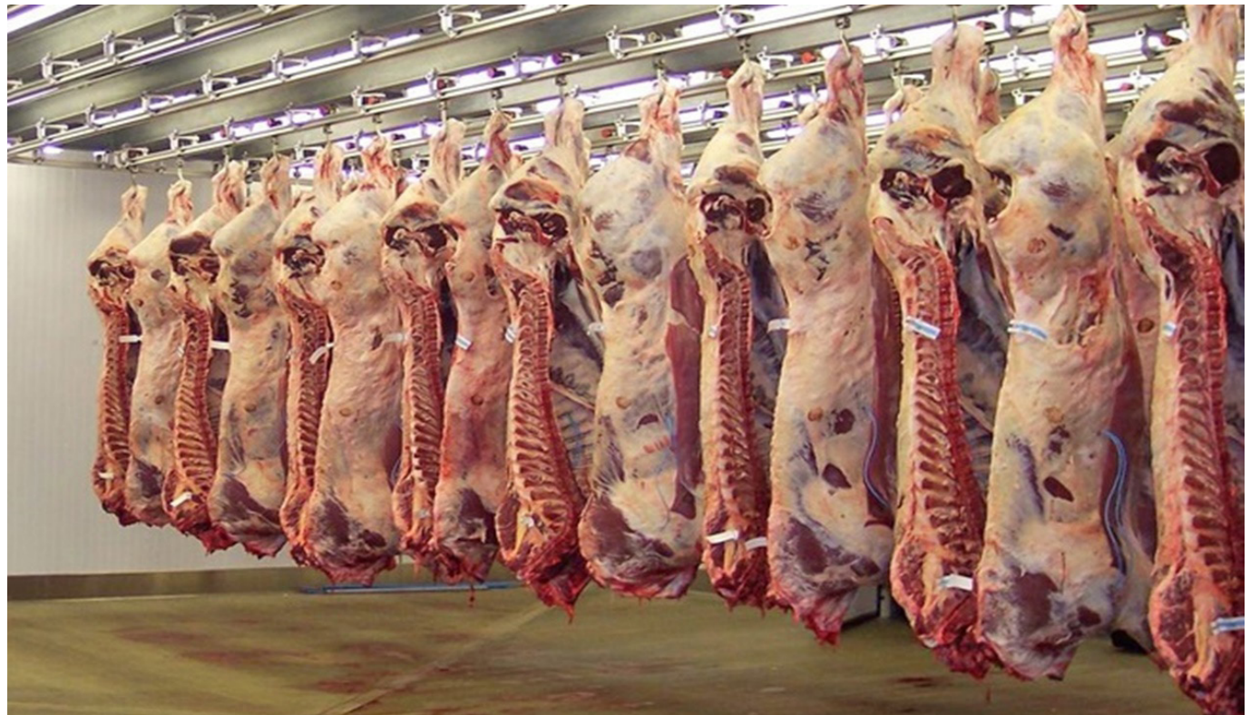
Los mataderos fueron cerrados por el Invima hace más de una década para garantizar el consumo de carne en buenas condiciones.