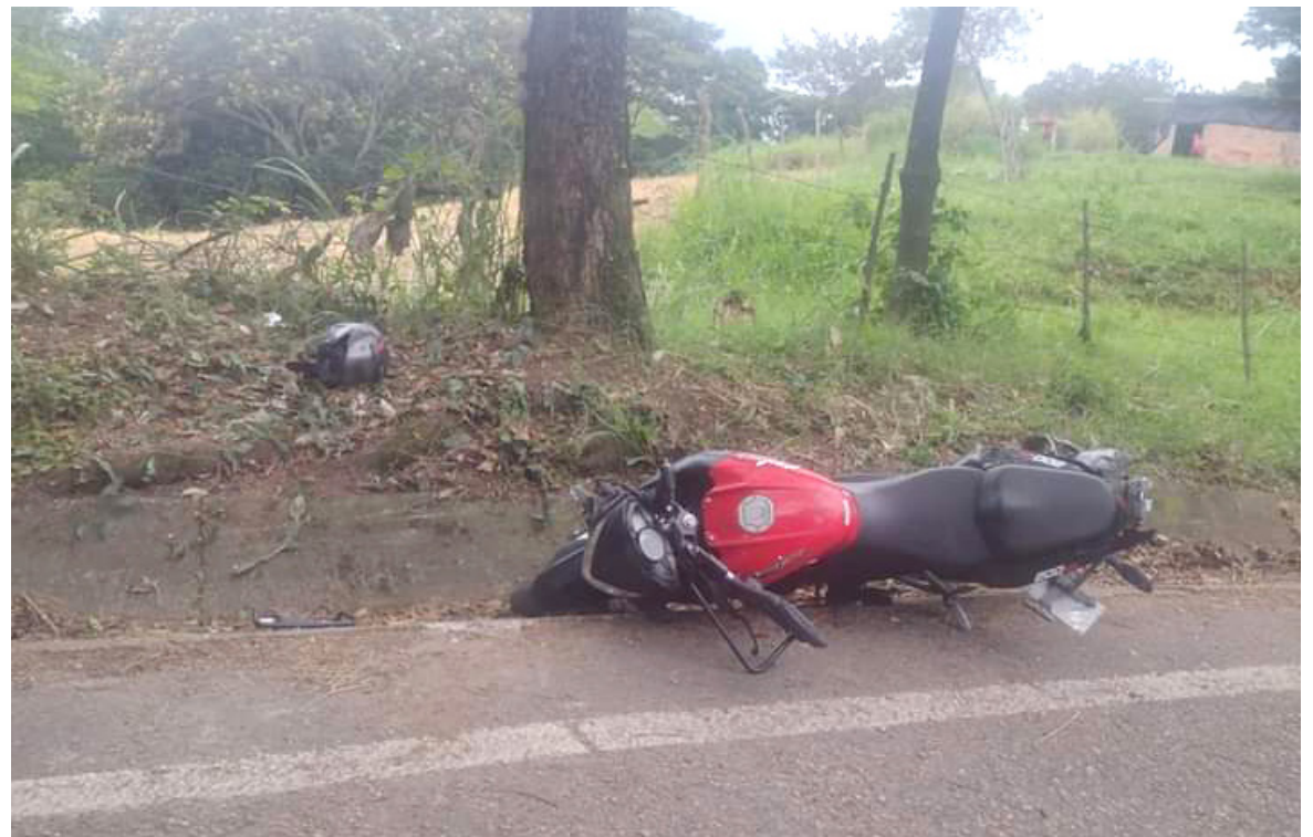
El motociclista es el actor vial más afectado.

El Observatorio de la Agencia Nacional de Seguridad Vial asegura que cada día se producen alrededor de 10 muertes en el país, donde el actor vial afectado principalmente es el motociclista. Los siniestros en este tipo de vehículo aumentan significativamente, con altas tasas de lesiones y fallecimientos.