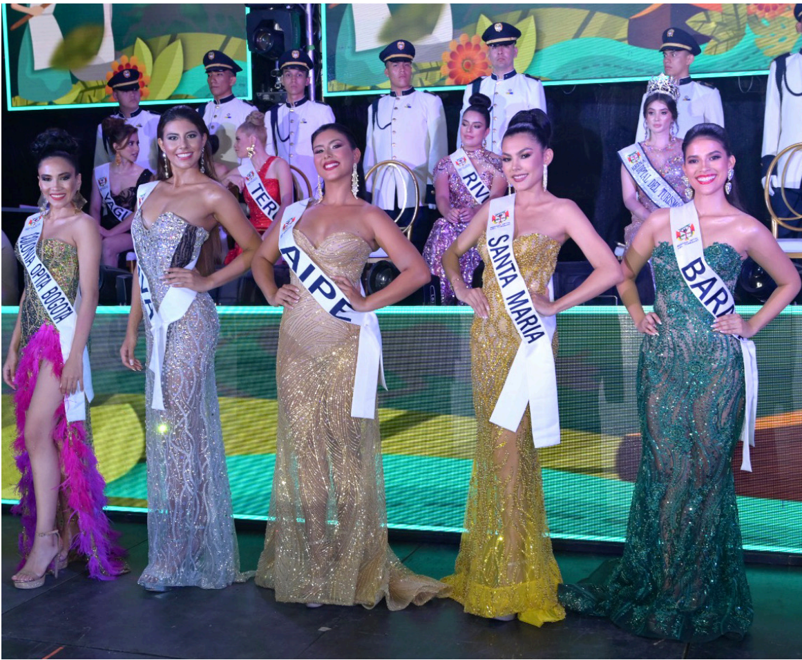
Las semifinalistas del certamen realizado en Yaguará.