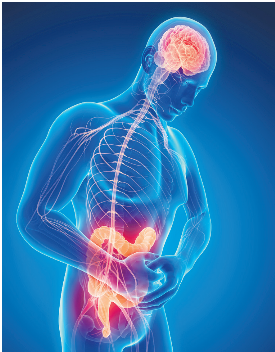
Las crisis por colon irritable pueden durar horas o días.

Aunque el colon irritable no suele ser un padecimiento de gravedad si es importante contar con la asesoría adecuada de un profesional para impedir que este empeore o a futuro pueda acarrear otras patologías bien sean mentales o de otra índole.