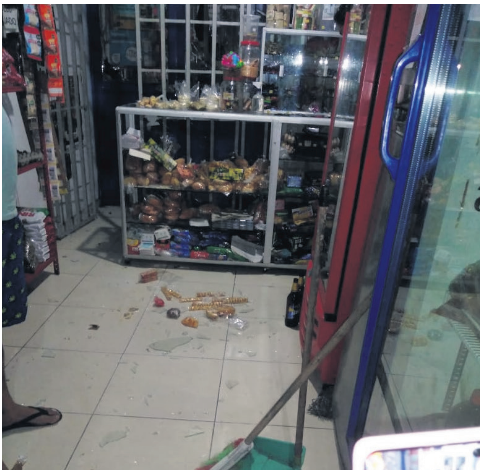
Tienda afectada por las piedras lanzadas.

Sin embargo, para la Policía Metropolitana esta situación no significó una alteración significativa al control de seguridad en la zona de cara a la celebración del partido y por el contrario, el dispositivo que se tuvo para la atención funcionó