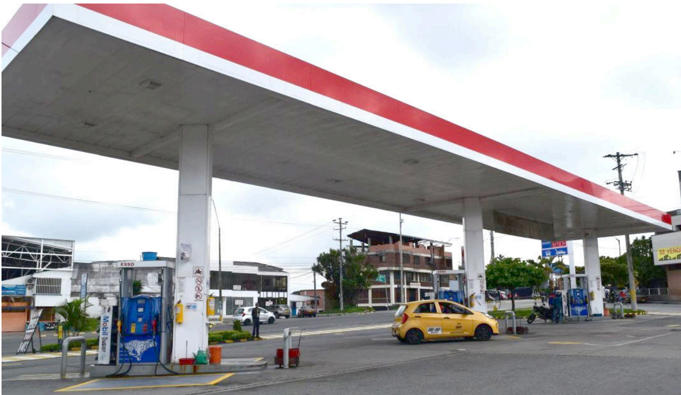
Se prevé que la gasolina seguirá aumentando su precio hasta el 2024.

Añadió que “no tiene sentido que le sigan subiendo el precio al combustible sobre la base de cobrarlos como si ganáramos como ciudadanos norteamericanos y en dólares” y que “no hubo ninguna respuesta clara del Gobierno”.