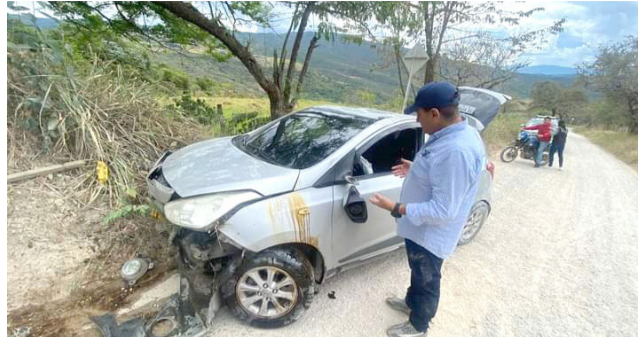
Puente festivo siniestrado en el Huila