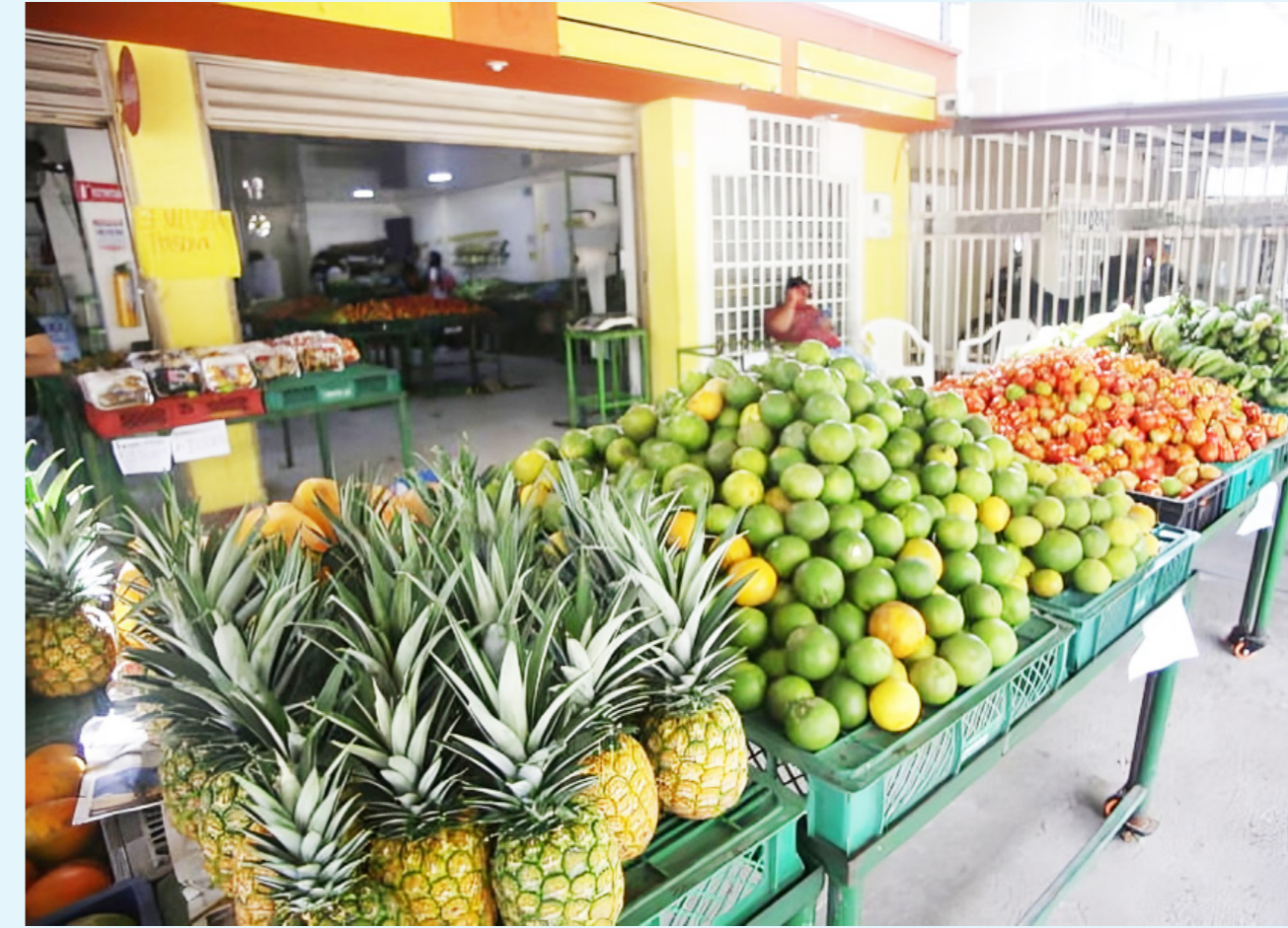
Aunque el IPC muestra baja inflación, muchos habitantes no perciben una mejora económica.

A nivel nacional, las ciudades con mayor inflación, como Bucaramanga y Riohacha, presentan incrementos significativos en el costo de vida, impulsados por los precios de arriendos, servicios públicos y alimentación. En contraste, Neiva, al igual que Villavicencio, Santa Marta y Tunja, se ha beneficiado de un aumento más