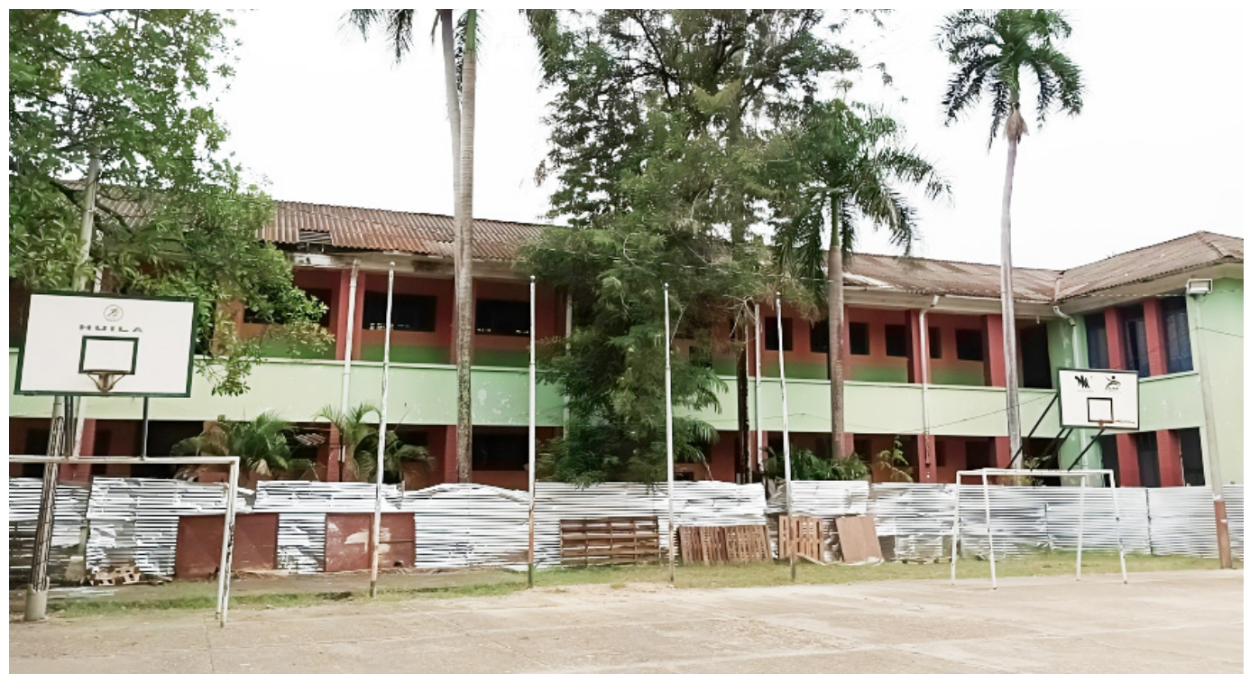
El bloque 'C' está aislado y se deteriora cada día más.