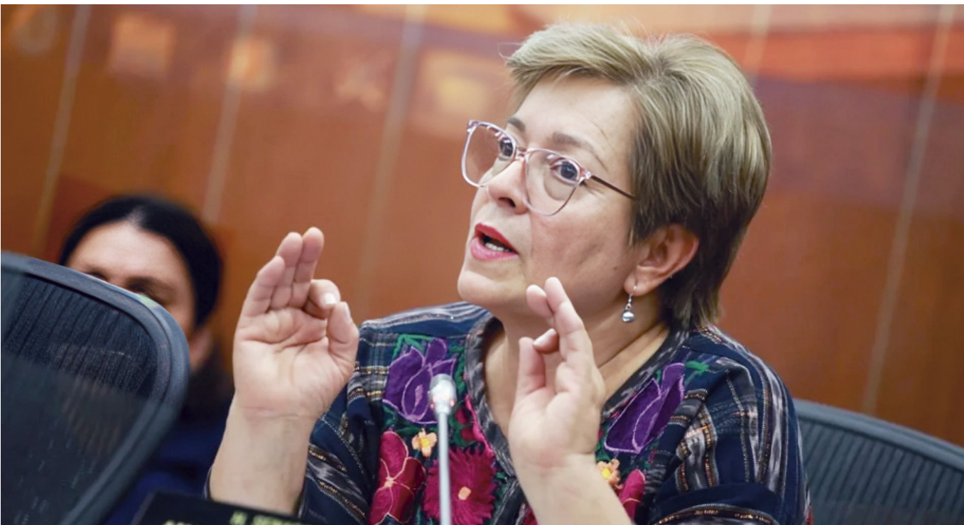
Gloria Inés Ramírez, ministra del Trabajo, confirmó que, tal y como se aprobó, se reafirman los principios con los cuales fue presentada, que son los del artículo 53 de la Constitución Política Nacional, que garantiza la estabilidad laboral.

El exministro José Manuel Restrepo advierte que la reforma actual podría destruir hasta 500.000 empleos formales si no se ajustan sus costos.