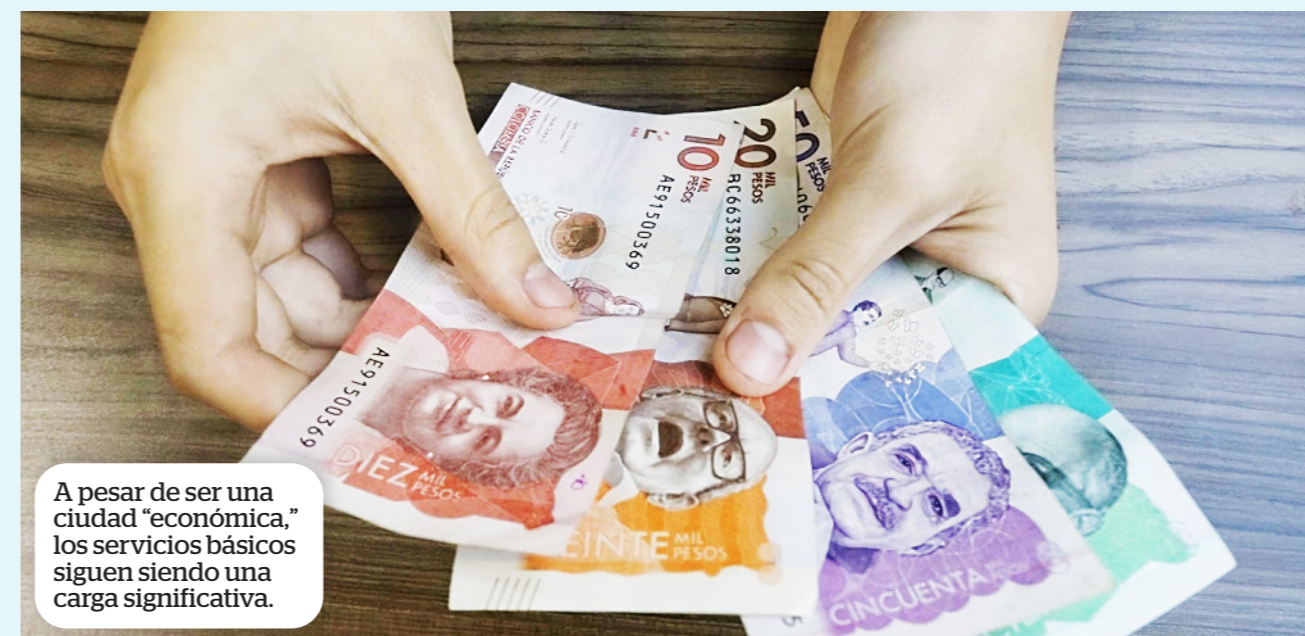
A pesar de ser una ciudad "económica," los servicios básicos siguen siendo una carga significativa.

En el sector agrícola, que es vital para la economía del Huila, los precios de productos como el café, el arroz y las frutas han mostrado fluc-