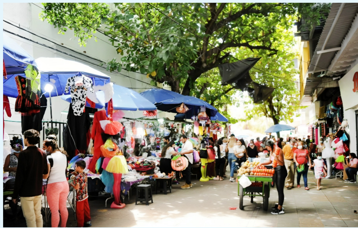
Sectores como la educación y restaurantes han mostrado leves aumentos en los precios.

ejemplo, el alza en los precios de los arriendos y los servicios públicos, así como en los sectores de educación, restaurantes y hoteles, ha sido determinante para que el costo de vida sea más alto. Este fenómeno no se replica de la misma manera en Neiva, donde