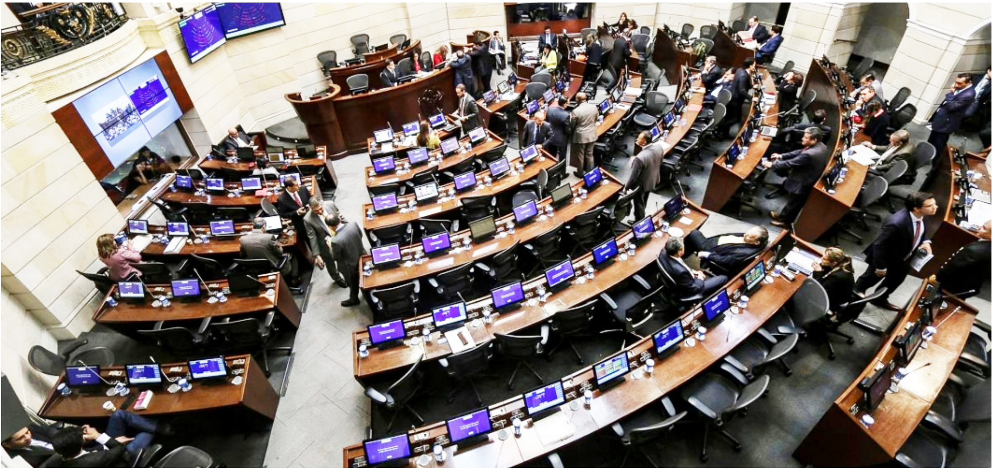
La Cámara de Representantes eliminó siete artículos del texto original de la reforma laboral. De igual manera, agregó otros ocho.

la discusión y ajuste de la reforma. Entre los puntos críticos que señaló está la necesidad de revisar los costos laborales que la reforma podría imponer a las empresas. De no corregirse, advirtió que muchos sectores productivos, especialmente las micro y pequeñas empresas, podrían verse obligados a cerrar o a reducir sus operaciones, empujando a más trabajadores a la informalidad.