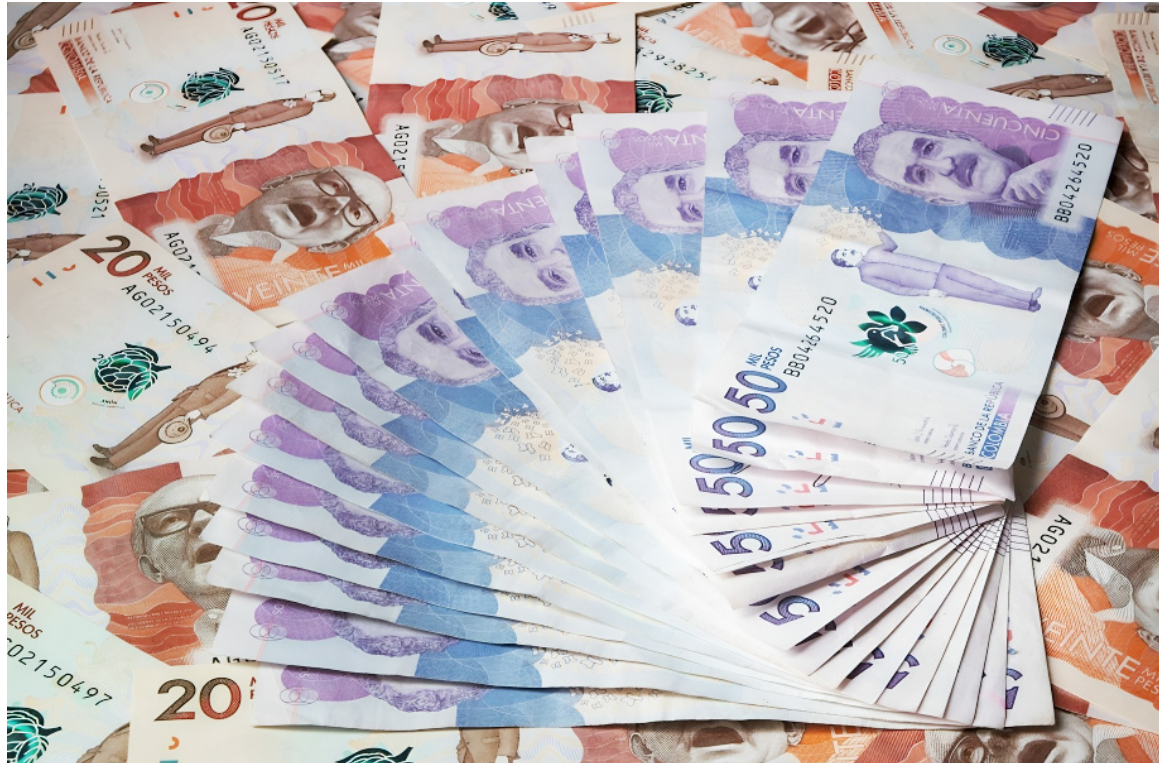
El dato de inflación anual es clave para el aumento del salario mínimo en Colombia.