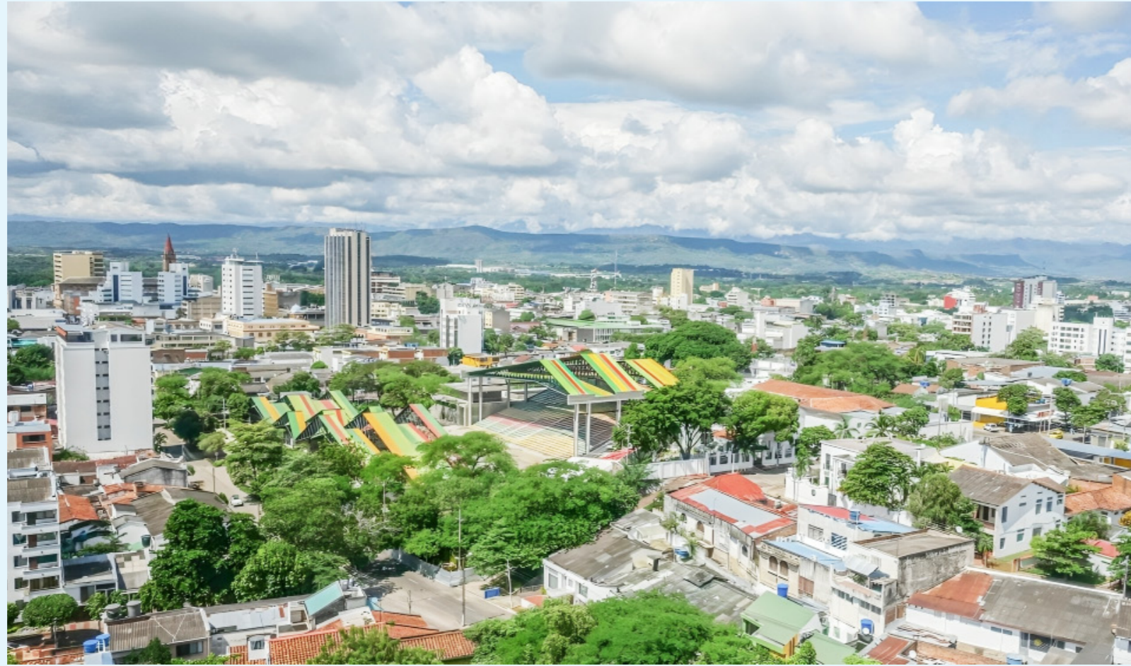
La ciudad es la segunda más barata para vivir en Colombia, según el informe del Dane.

El comportamiento de la inflación en Colombia está marcado por factores que afectan de manera desigual a las diferentes ciudades. En el caso de Bucaramanga, por