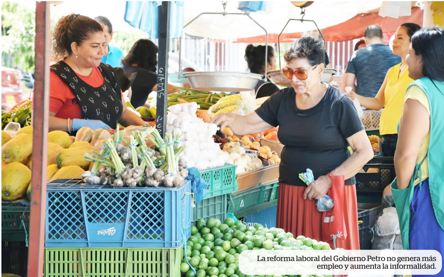
La reforma laboral del Gobierno Petro no genera más empleo y aumenta la informalidad.

■ La iniciativa del Gobierno nacional fue aprobada en la Cámara de Representantes, pero el Senado de la República tendrá la oportunidad de mejorarla con dos nuevos debates.