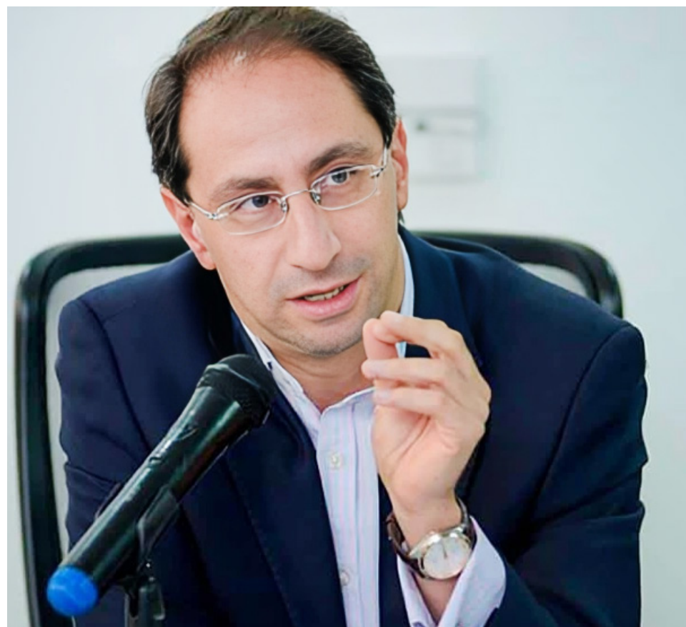
José Manuel Restrepo, exministro de Hacienda, espera que el Senado modifique la reforma laboral del Gobierno Petro para que esta genere empleo.

La reforma laboral propone adelantar la jornada nocturna a las 7:00 p.m. y extender la licencia de paternidad a cuatro semanas.