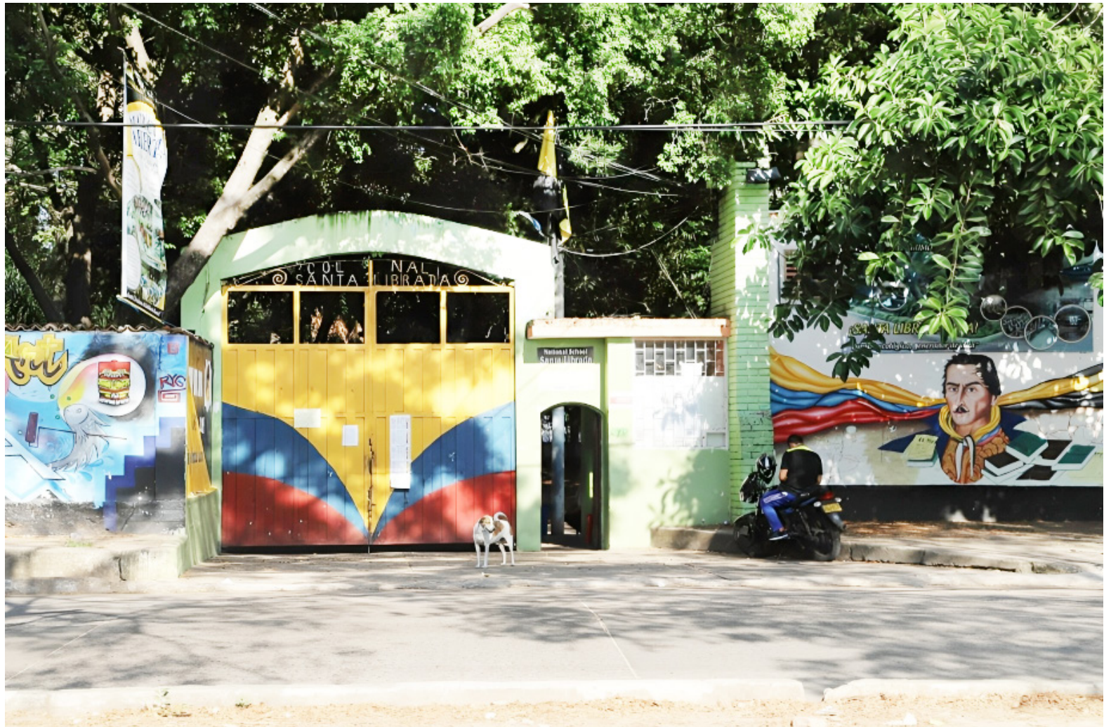
Se necesitarían $10.000 millones para arreglar todo el centro de enseñanza.