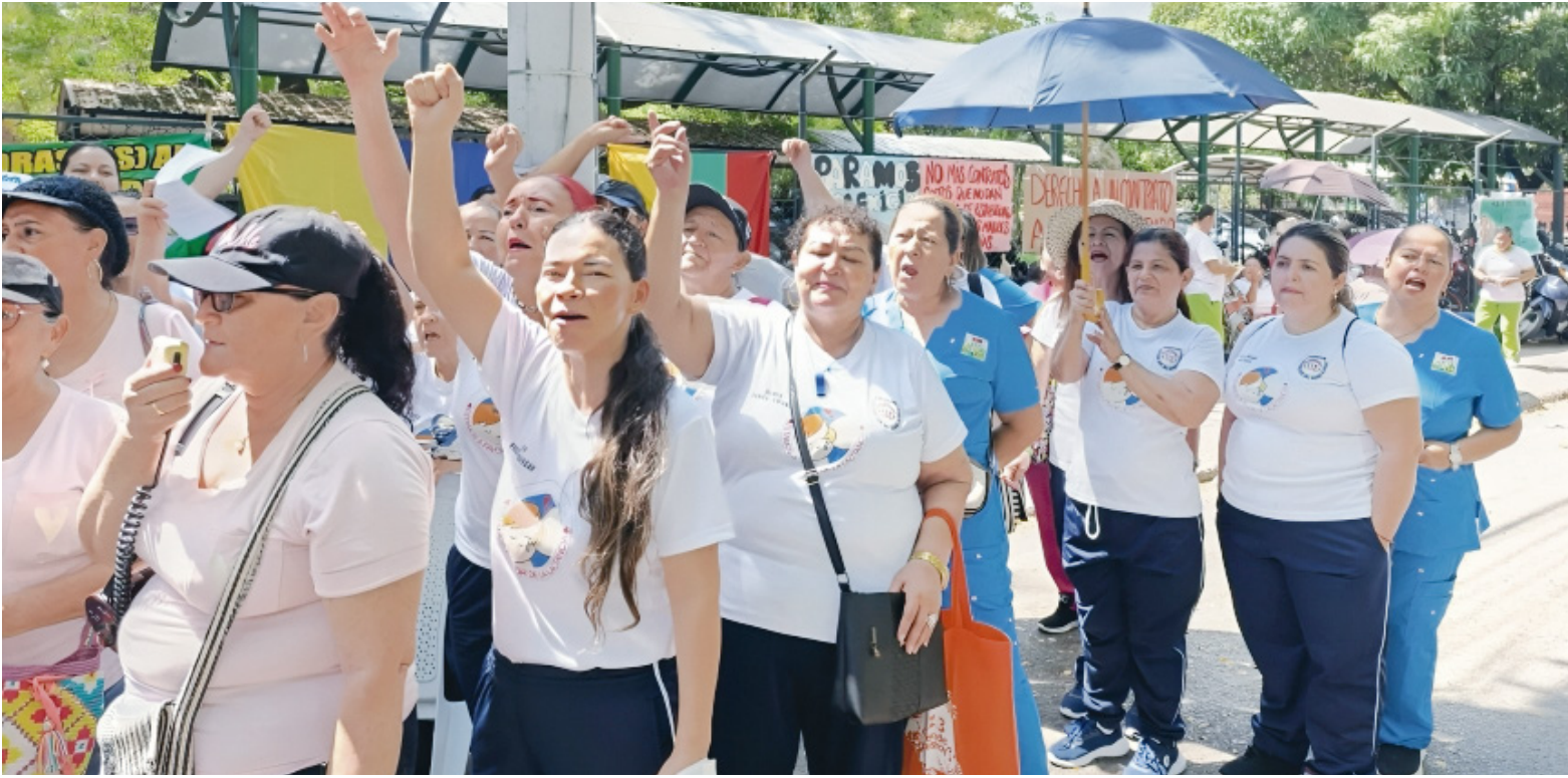
En ocasiones las operarias, deben acudir a prestamos gota gota para pagar sus obligaciones.

realizado de manera lenta, es el subsidio de vejez para las madres comunitarias”.