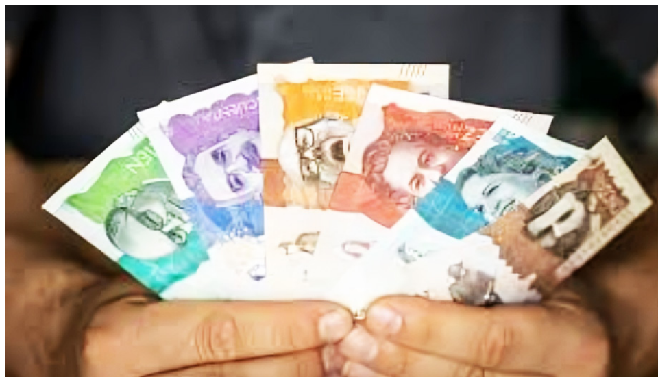
Las reuniones entre representantes del Gobierno, empleadores y trabajadores para concertar el aumento del salario mínimo se darán, de manera formal en diciembre.