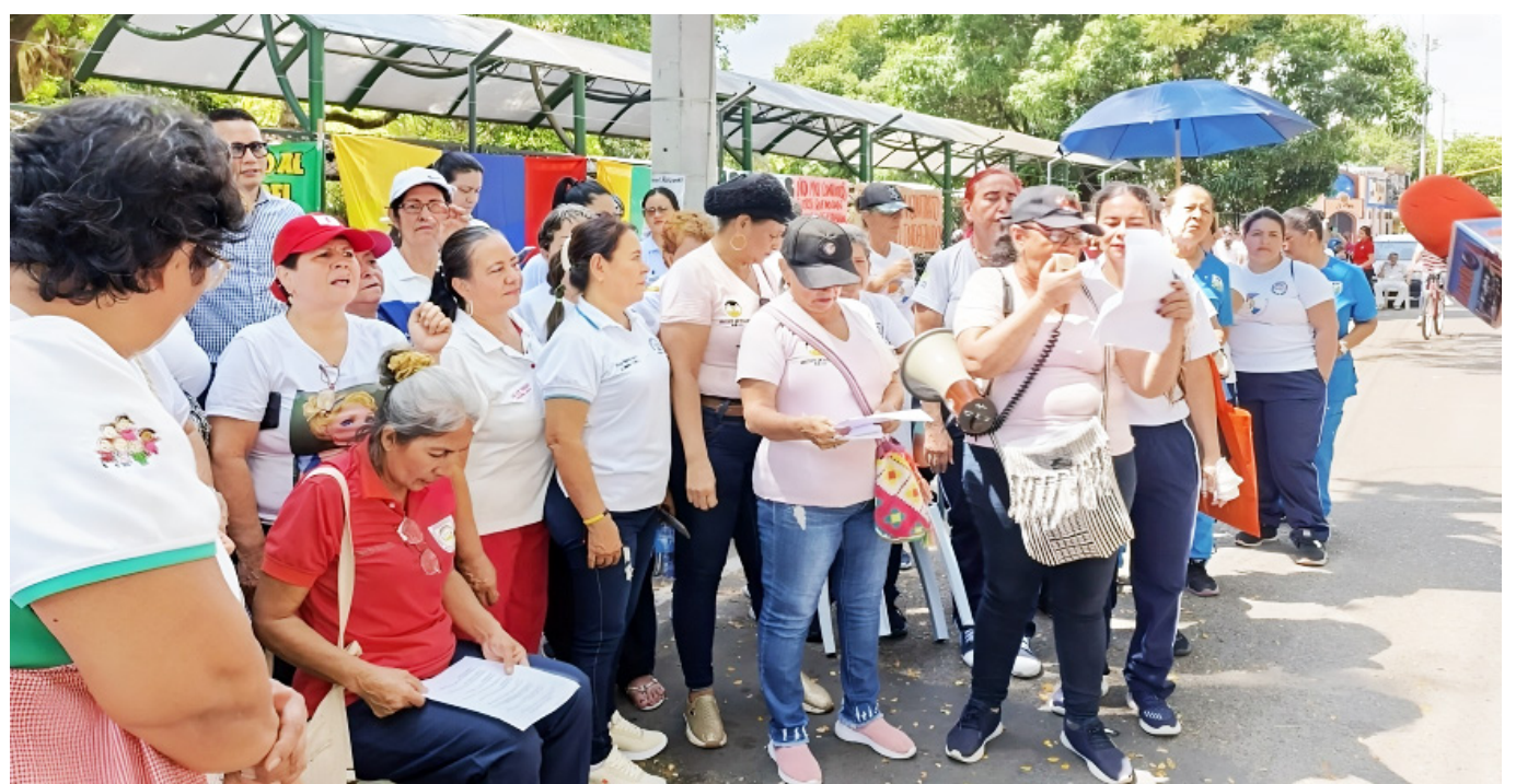
Alrededor de 400 mujeres entraron en cese de actividades de carácter indefinido.

Fui a EPN, donde hicimos un pacto de pago, donde le propuso a los funcionarios, que le descontaran $500.000 y le dejaran $223.000. "Y no pude cancelar la deuda oportunamente ya que tuve un percance familiar, por que también el 'sueldito' es muy poco", dijo la mujer.