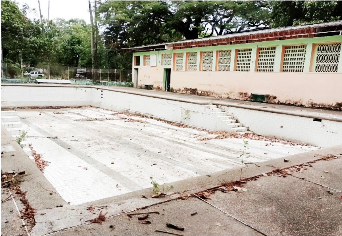
Así se encuentra la piscina actualmente.

El mismo gobernador del Huila, Rodrigo Villalba, indicó que apenas contarán con este proyecto, iba a apoyar esta iniciativa.