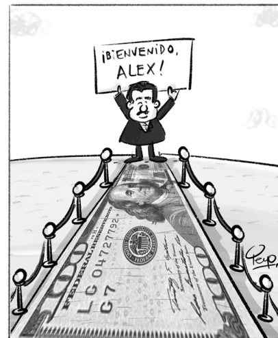
ALFOMBRAS DE BIENVENIDA

www.diariodelhuila.com e-mail: correolector@diariodelhuila.com