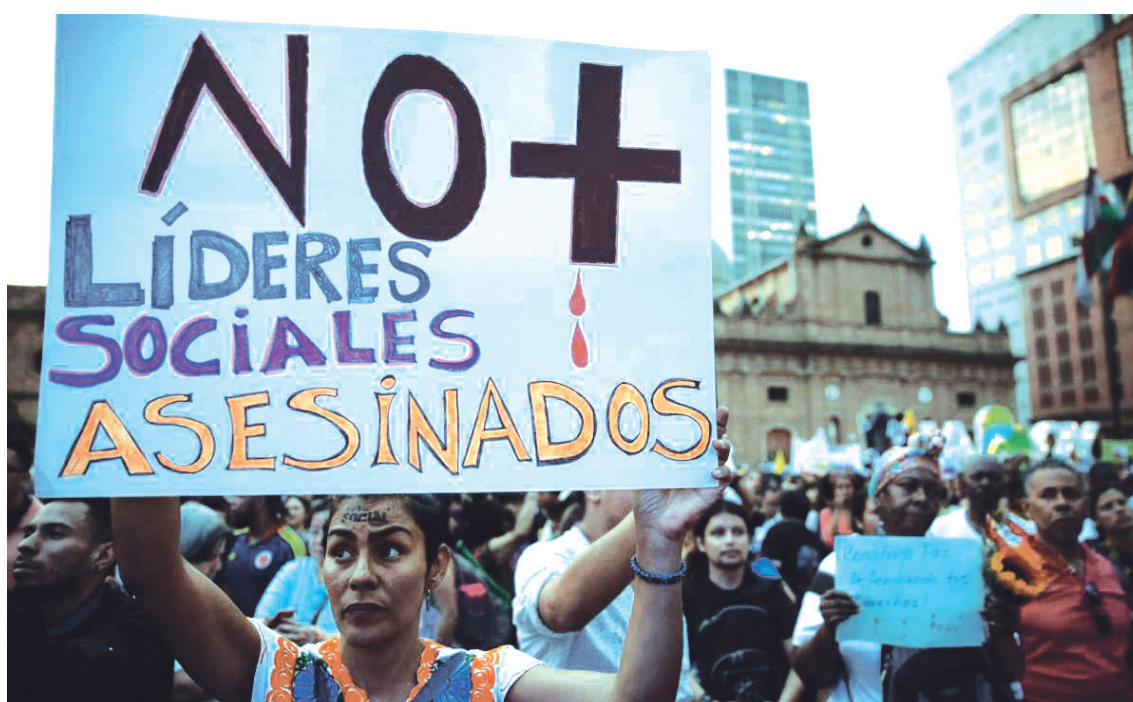
Líderes y firmantes de paz asesinados en el Huila durante el 2023. Una llamada urgente a la institucionalidad para proteger vidas en medio de la creciente ola de violencia.

Cinco firmantes de paz y 6 líderes sociales fueron asesinados en el departamento del Huila, durante el 2023. Una cifra que según el Instituto de Estudios para el Desarrollo y la Paz (Indepaz), es una de las más altas registradas en el país.