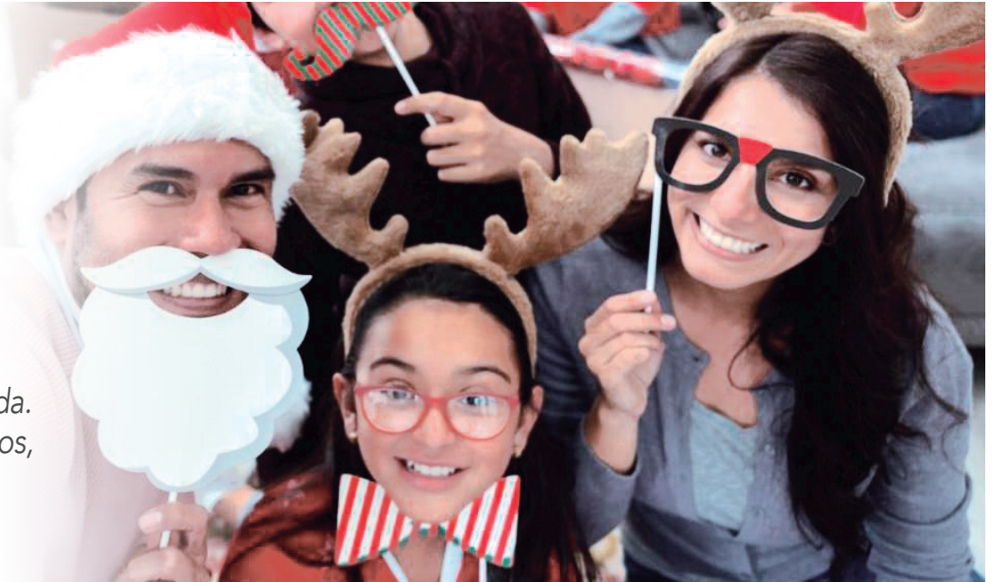
Lo particular de estos juegos es entretener a las familias.

La Navidad es una época para disfrutar con la familia y realizar actividades divertidas pensadas para esta temporada. Algunas de las ideas más populares es jugar a los aguinaldos, una tradición colombiana para ganar regalos.