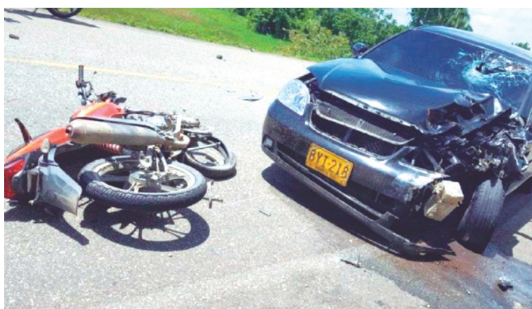
En los últimos cinco años, según la Policía Nacional, se han registrado 906 homicidios por accidentes de tránsito.

La mayoría de personas que habitan zonas urbanas son más propensas a este tipo de muertes, con excepción de