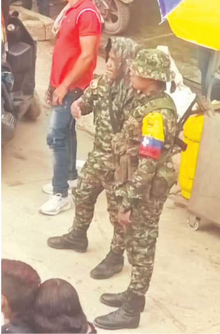
Las muertes incrementaron con la presencia de las disidencias en la región.

car este número, toda vez que el año pasado hubo menos casos, 66, como ya se indicó, poseíamos un índice de esclarecimiento del 49%, lo cual refleja un gran esfuerzo por parte de las autoridades, para mantener cada uno los resultados de acuerdo a las misionalidades institucionales”.