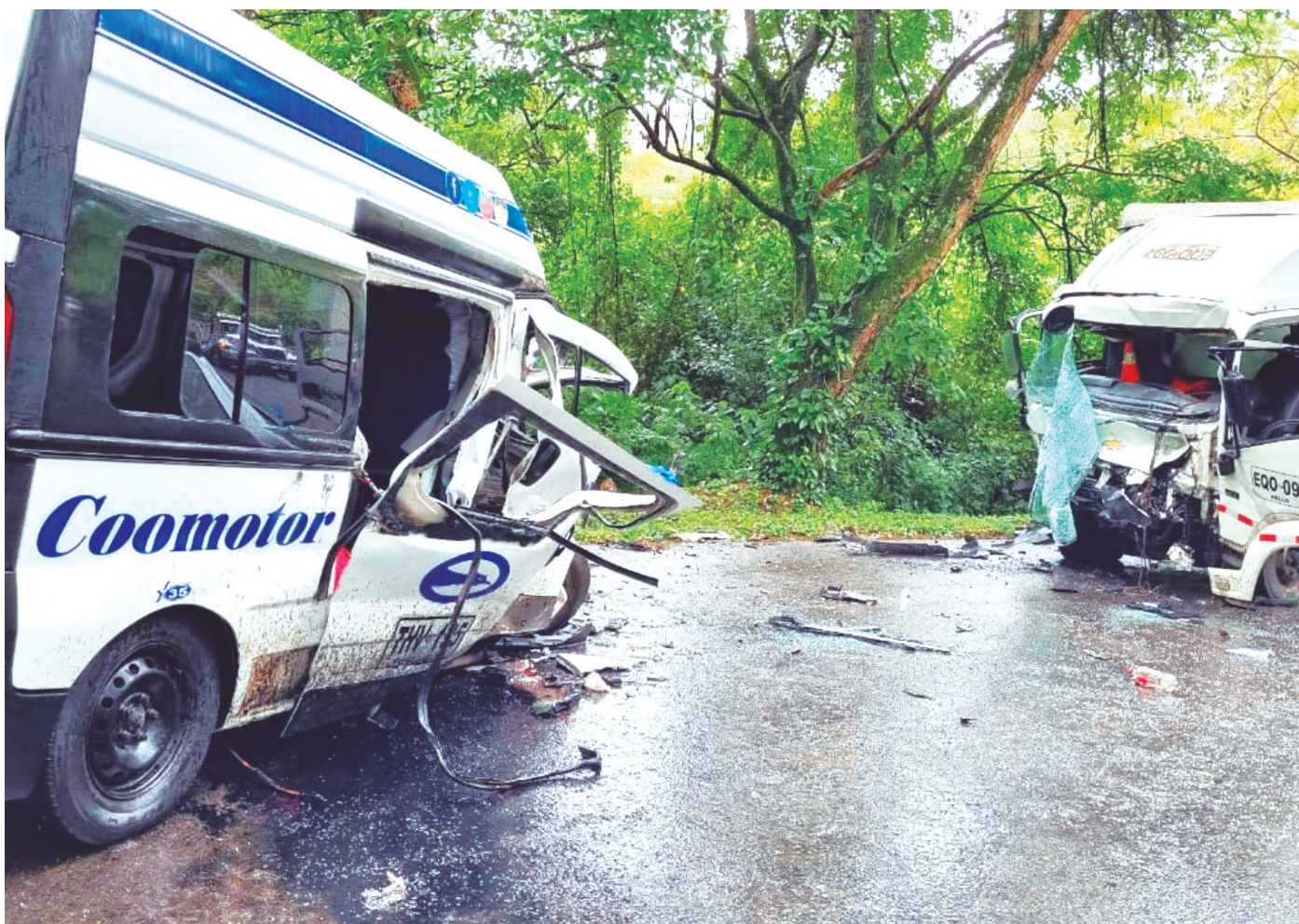
El pasado 11 de enero sobre la ruta La Plata-Tesalia (occidente del Huila), se registró un accidente entre un colectivo y un camión tipo furgón. El saldo final fueron nueve personas fallecidas.

Según el reporte de la Policía Nacional, en los últimos cinco años se ha registrado 906 muertes violentas en accidentes.