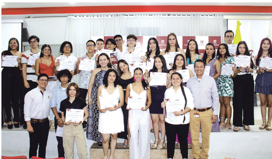
En el auditorio 'Olga Tony Vidales' de la Universidad Surcolombiana se llevaron a cabo múltiples graduaciones de los estudiantes de inglés en sus diferentes niveles del programa Ileosco. ¡Felicitaciones!