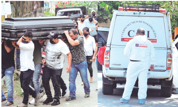
185 vidas de líderes sociales y defensores de Derechos Humanos, perdidas en Colombia en 2023. La cifra incluye 42 firmantes del acuerdo de paz.