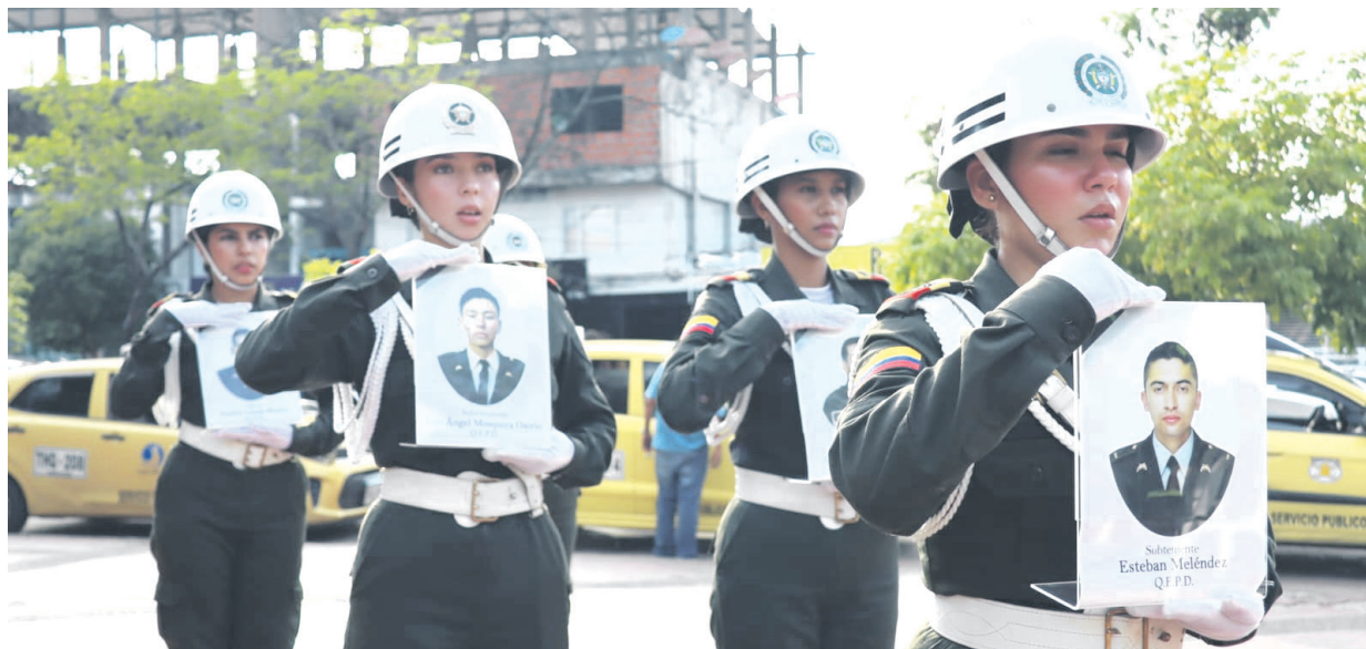
La Policía Metropolitana de Neiva, rindió un sentido homenaje a nuestros 5 compañeros de la Seccional de Investigación Criminal “SIJIN”. Héroe que ofrendaron sus vidas por la Patria, en hechos ocurridos hace 22 años en la vía que de Neiva conduce a Natagaima.