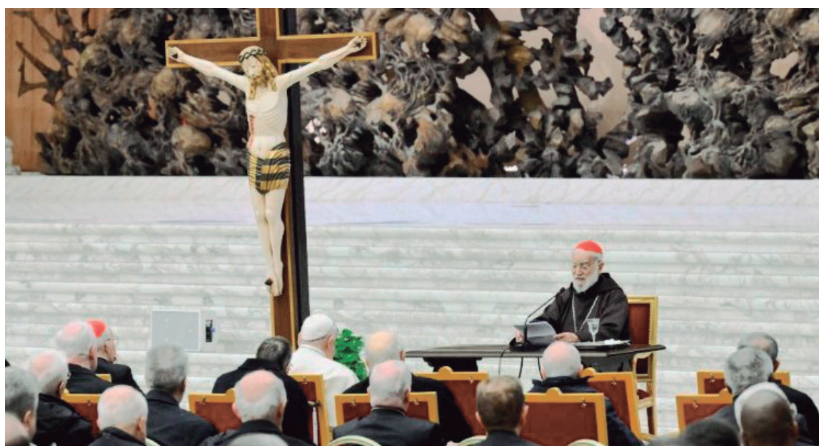
Segunda predicación de Adviento para el Papa y los miembros de la Curia Romana.

“La anunciación del ángel a María, la peregrinación de la fe de la Madre de Dios y la invitación de abrir las puertas de nuestro corazón a Jesús”, han sido los temas centrales, de la Segunda predicación de Adviento para el Papa y los miembros de la Curia Romana, dirigido por el cardenal Raniero Cantalamessa.