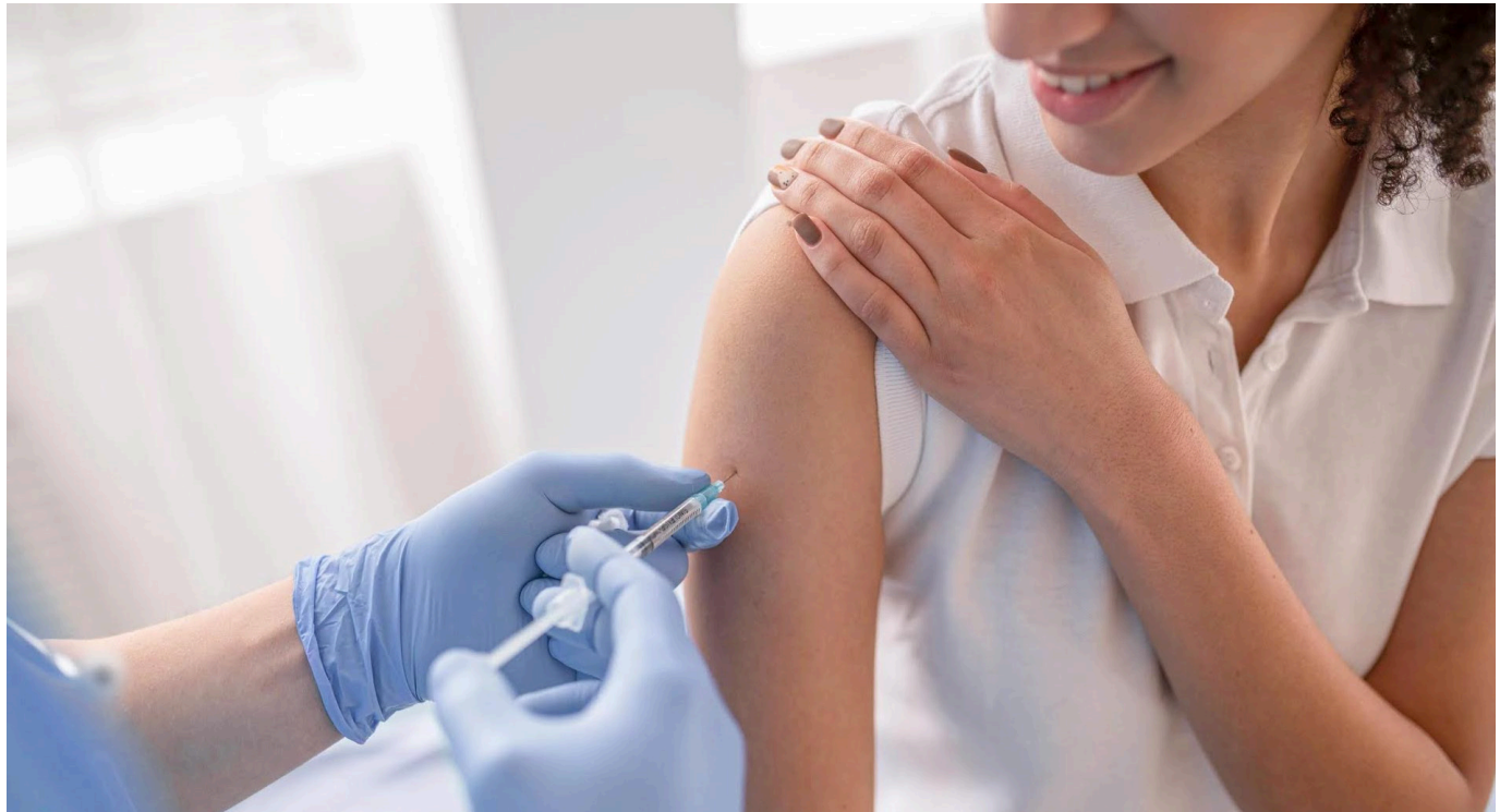
Expertos recomiendan tener al día la vacunación contra enfermedades como la fiebre amarilla, la influenza, el sarampión, la rubéola y el covid-19.

Este ciclo de vida inicia desde el embarazo, para prevenir enfermedades como difteria, tétanos, tos ferina, influenza y covid-19. En los recién nacidos, para prevenir la hepatitis B y la tuberculosis.