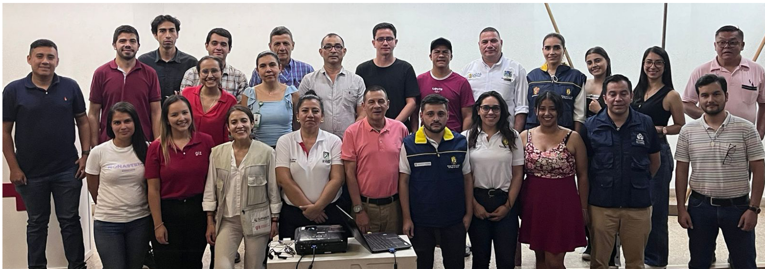
es importante destacar que la UNGRD también ha asesorado a 44 municipios costeros en la reducción del riesgo de desastres.

Finalmente, es importante destacar que la UNGRD también ha asesorado a 44 municipios costeros en la reducción del riesgo de desastres, lo que refleja un esfuerzo continuo para construir una Colombia resiliente frente al cambio climático y la variabilidad de fenómenos marino-costeros.