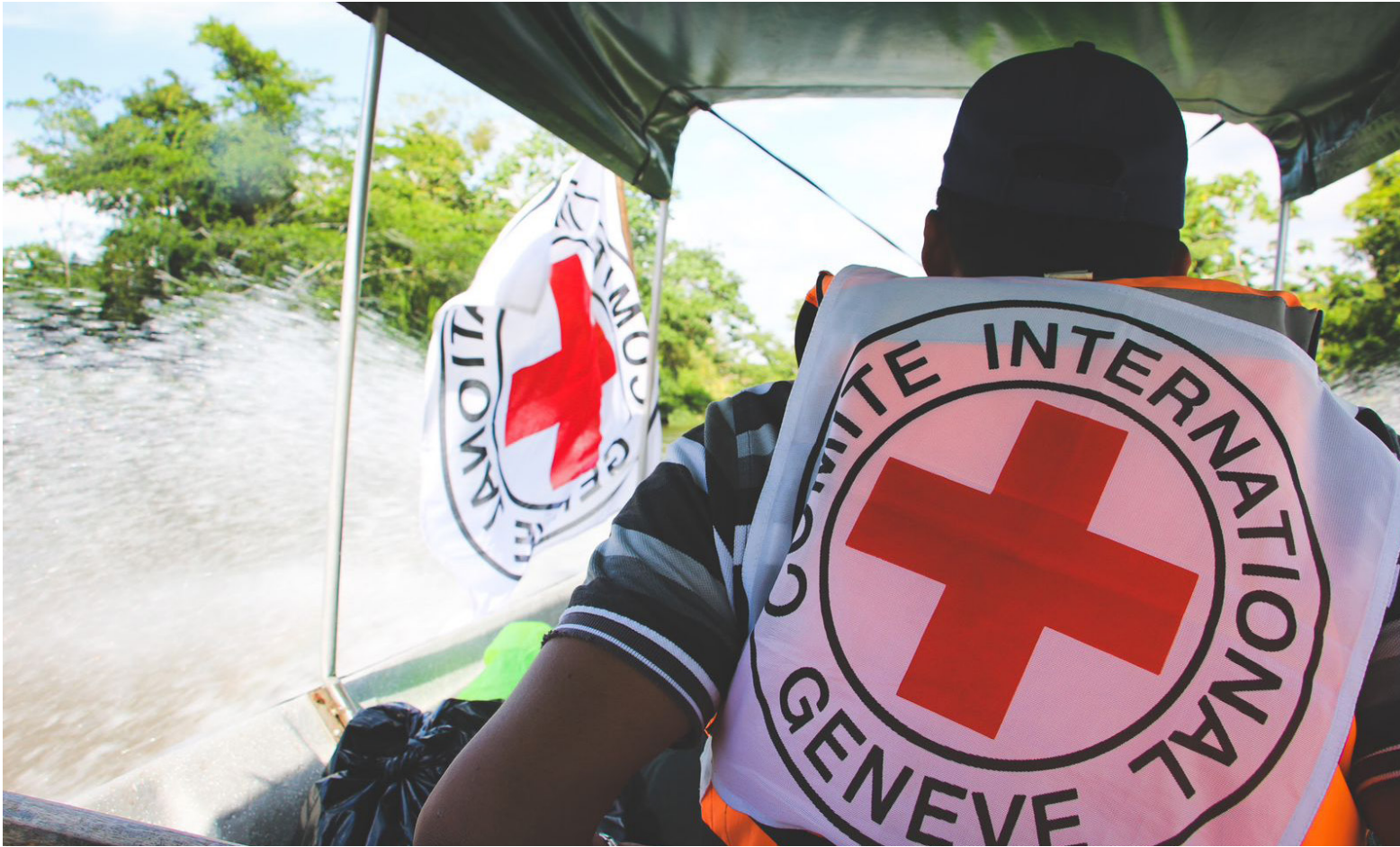
Es crucial garantizar la seguridad y protección del personal médico para asegurar el acceso a la atención de salud en Colombia y avanzar hacia una paz duradera y justa en el país.

bertad, el acceso humanitario, el respeto a los servicios de salud, y otras temáticas que contribuyen significativamente a aumentar la protección de la población civil”.