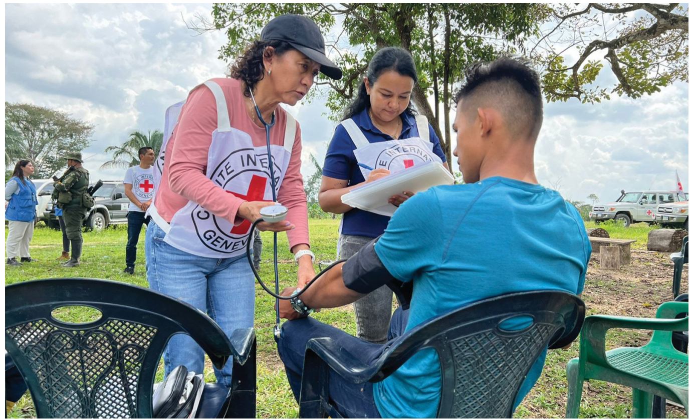
El departamento del Huila reporta 32 ataques a misiones médicas según el informe del CICR, reflejando un preocupante aumento de la violencia contra el personal sanitario.

El informe del CICR revela un preocupante aumento en los ataques a misiones médicas en Colombia, con el departamento del Huila como una de las regiones más afectadas, reportando 32 actos de violencia contra la asistencia en salud.