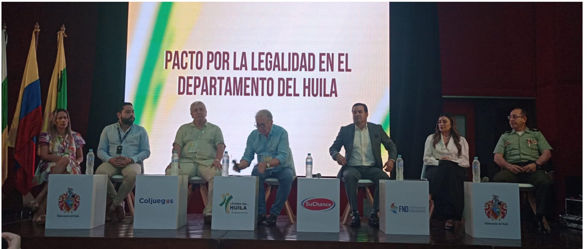
Autoridades se unieron para luchar contra el contrabando y anunciaron estrategias.

Las instituciones se han unido y firmado el pacto por la legalidad, en 'cabeza' del gobernador del Huila, Rodrigo Villalba. Incluso van a solicitar un grupo de Policía Fiscal y Aduanera para los departamentos del Huila y Tolima. E invitan a consumir los productos de la región, ya que los impuestos de estas mercancías, van al sector salud.