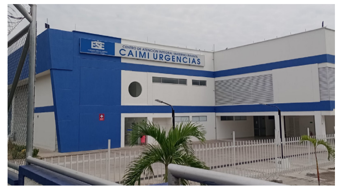
Las irregularidades del CAIMI