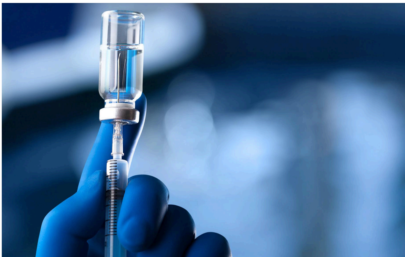
La vacunación ayuda a disminuir el riesgo de desarrollar enfermedades al estimular la producción de defensas.