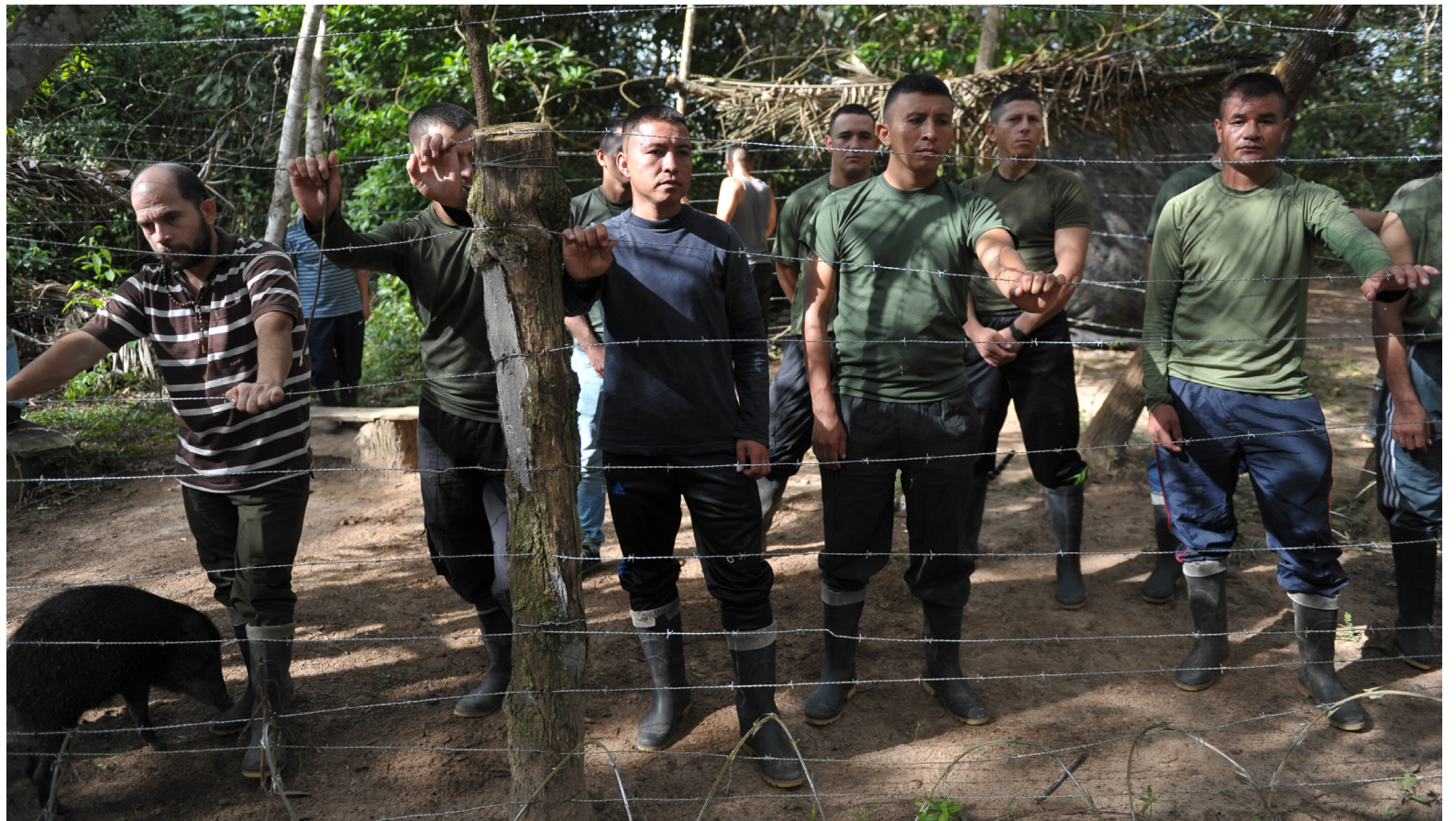
El Comando Conjunto Central de las FARC, responsable de numerosos secuestros en Tolima, Quindío y el Norte de Huila, enfrenta la mirada crítica de la sociedad colombiana en esta audiencia regional.

La Sala de Reconocimiento de Verdad de la JEP profundiza en el esclarecimiento de los secuestros perpetrados por las FARC en diferentes regiones del país.