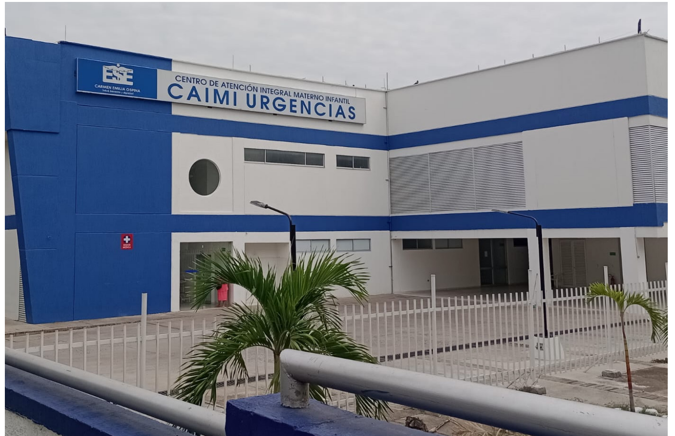
En esta obra se han invertido $ 2.945.281.425.