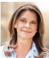
Marta Lucía Ramírez

Colombia es un país que a pesar de sus dificultades y grandes desafíos nunca había sentido un riesgo serio para su democracia y sus libertades. Sin embargo, ese riesgo se percibe hoy en el actuar arbitrario del Gobierno y lo sienten todos los lugares de Colombia.