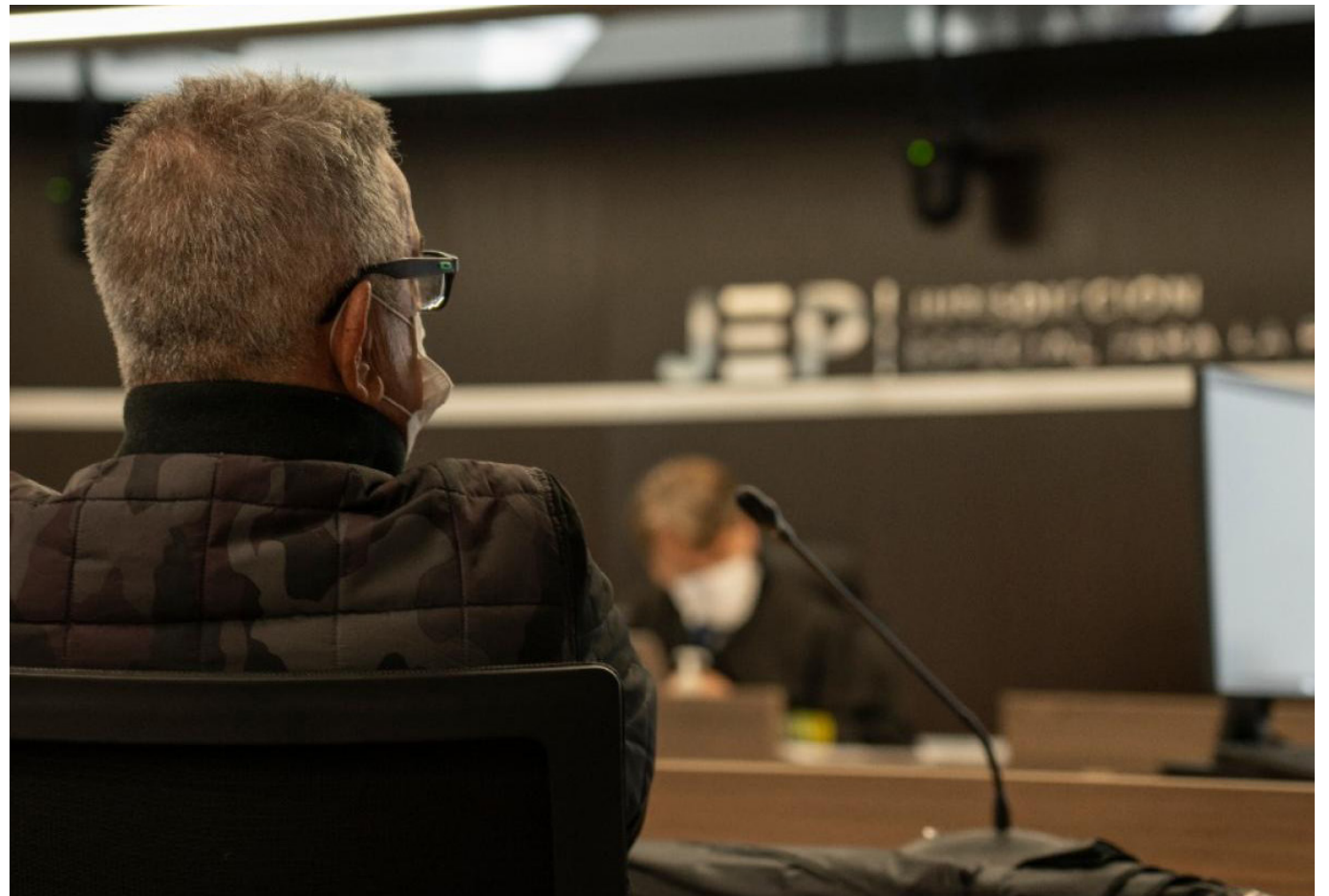
Los exguerrilleros tienen la oportunidad de reconocer los daños causados y contribuir con la verdad para la reconstrucción de lo afectado por el secuestro en Colombia.

En la audiencia del viernes 26 de abril estarán presentes víctimas provenientes de zonas rurales y urbanas de Ibagué, del suroccidente del Tolima y de la cordillera Central hacia Quindío.