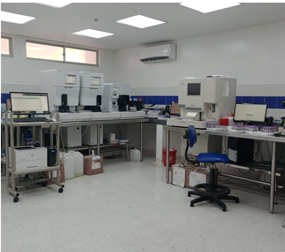
El centro de atención cuenta con modernos equipos.

Posteriormente, la funcionaria, señaló: “a mí me parece que lo que montaron ese día, fue un circo, donde lamentó decirles, que los ‘payasos’, fuimos los cabildantes. Incluso le pregunté a la directora técnico científica, si el en lugar habían atendido partos y me dijo efectivamente, yo le dije no me diga mentiras”.