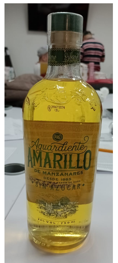
Licor y cigarrillos, es los que más ingresa a la región sin pagar impuestos.

Destacado 1. El gobernador del Huila, Rodrigo Villalba, destacó. “Vamos a estructurar un plan por la convivencia y seguridad, ahí vamos a incluir el tema de la legalidad y la lucha anticontrabando. Este pacto que vamos a firmar, no es ‘letra muerta’. Tiene que contar con una estrategia fronteriza”.