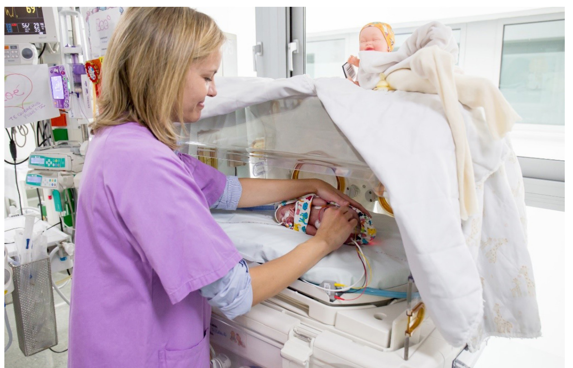
Para que entre a funcionar en su totalidad, solo haría falta contratar el personal idóneo.