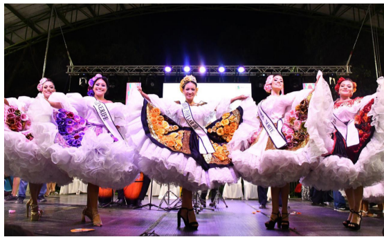
Danza, música y folclor en las rondas Sampedrinas