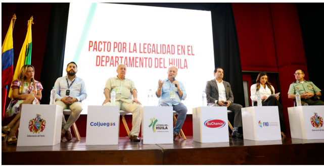
Contrabando dejó millonarias pérdidas en el Huila