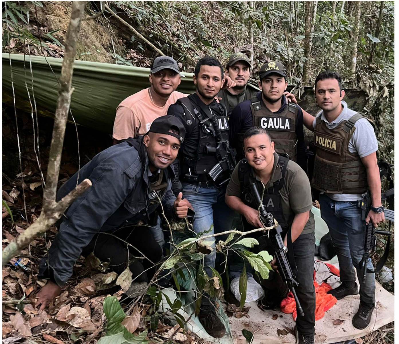
Seis presuntos secuestradores de comerciante de Acevedo, fueron arrestados.