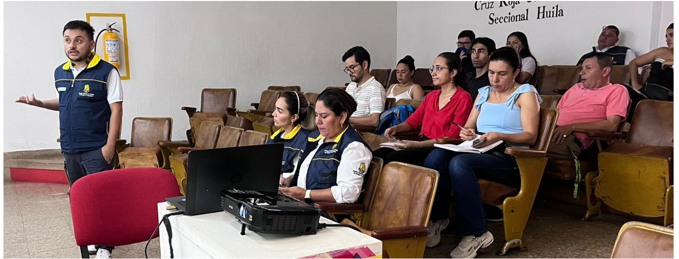
La Unidad Nacional para la Gestión del Riesgo de Desastres (UNGRD) ha brindado asistencia técnica a los 32 departamentos de Colombia.

Durante el encuentro, se ofreció asesoría en la formulación o actualización de Planes Municipales de Gestión del Riesgo de Desastres.