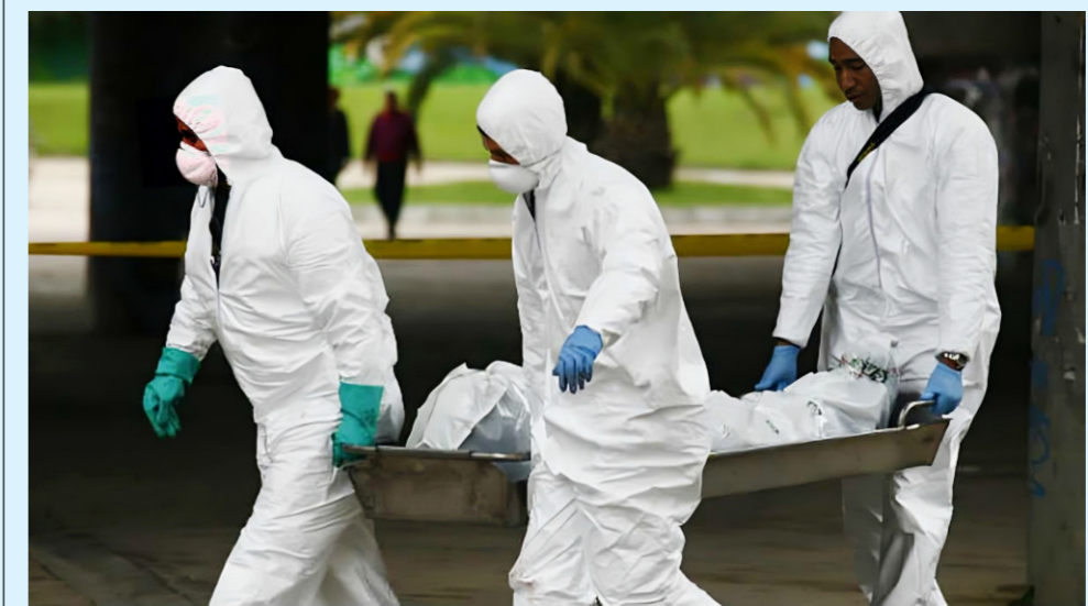
En Hobo, se registró la masacre de cinco personas.

Por su parte, Germán Casagua, alcalde de Neiva expresó: "estos grupos se están aprovechando de los diálogos que realiza el Gobierno Nacional para sacar ventajas, donde la Fuerza Pública, no puede salir a realizar confrontaciones directas y para nadie es un secreto que casi la totalidad de las extorsiones, vienen de estos grupos".