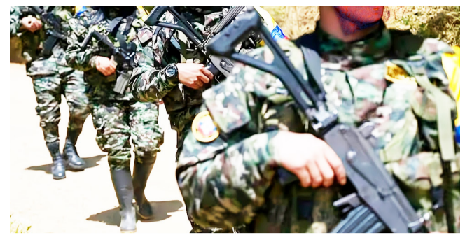
Jóvenes instrumentalizados por las disidencias