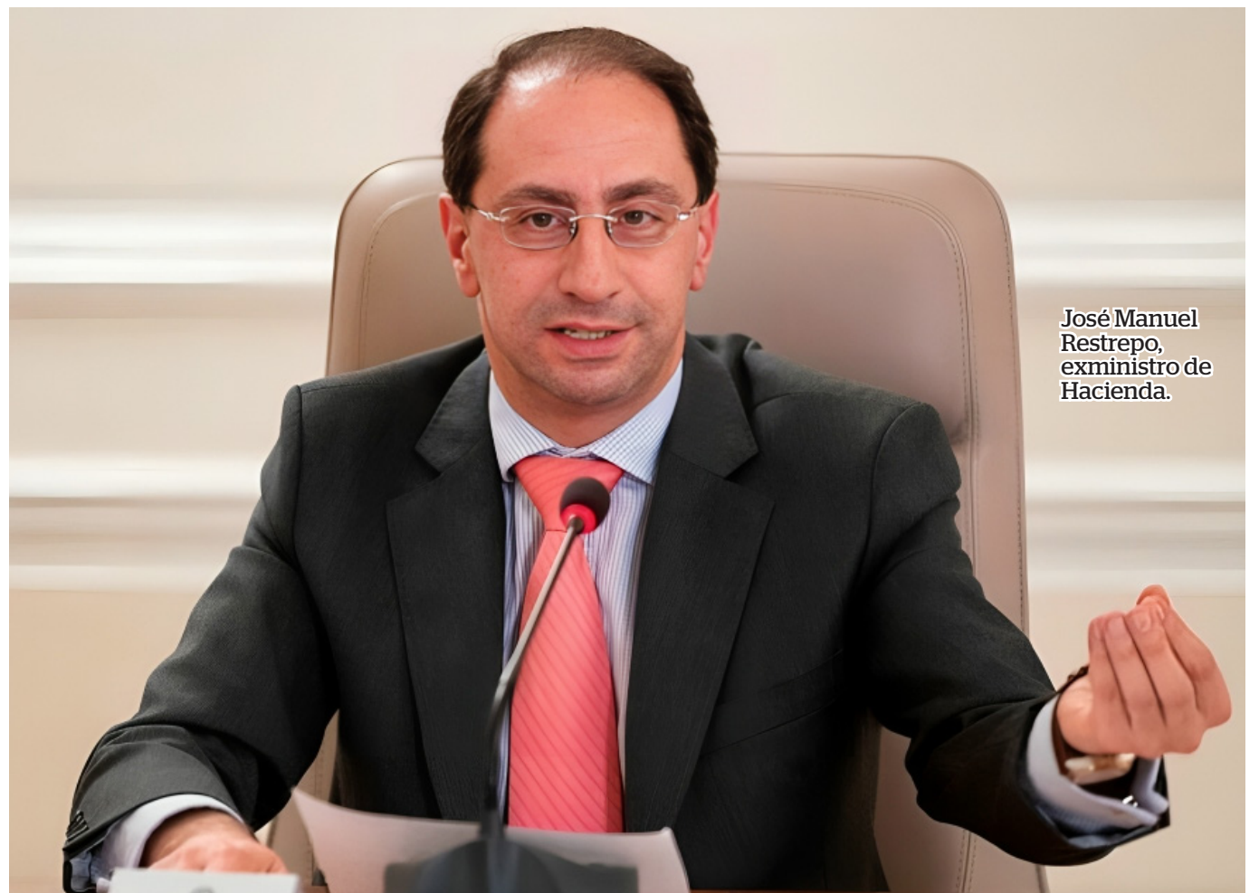
José Manuel Restrepo, exministro de Hacienda.

En particular, los resultados de la industria y la construcción requieren estar en la mira de la reactivación, pues “ya completan 14 meses en rojo, y estos sectores son claves en la generación de empleo”, advierte Restrepo.