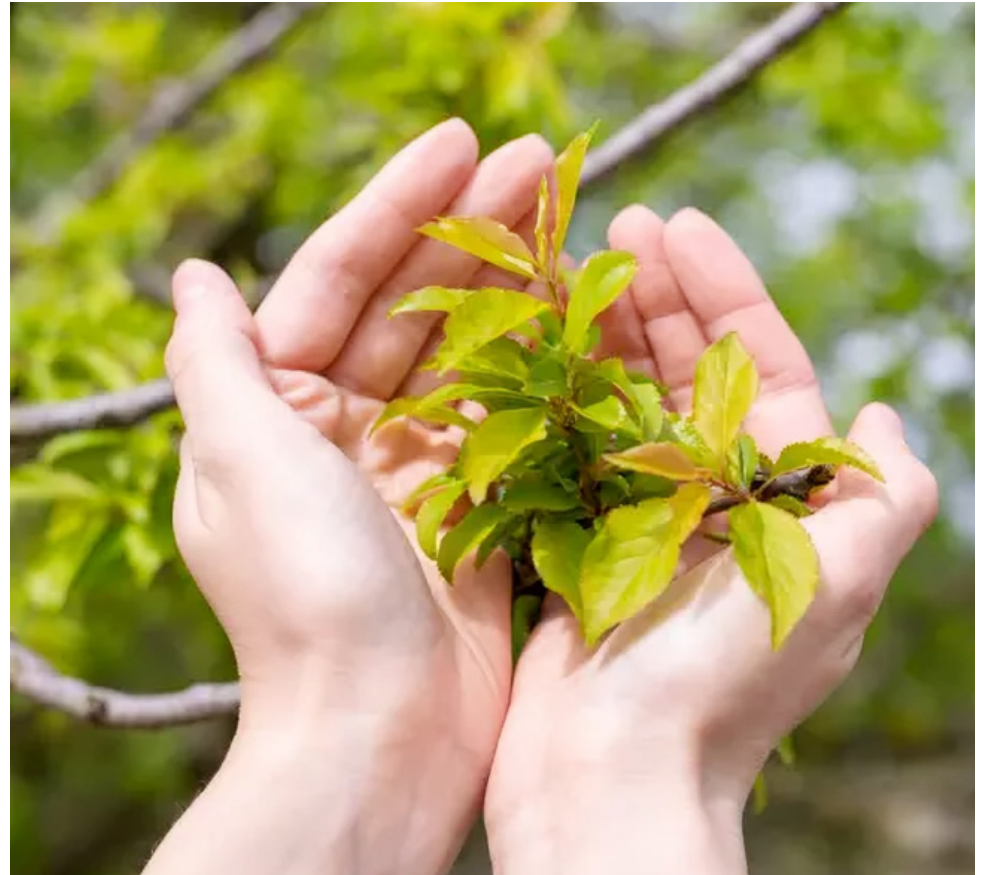
El concejal señaló la importancia de organizar las compensaciones por aprovechamiento forestal de las constructoras.