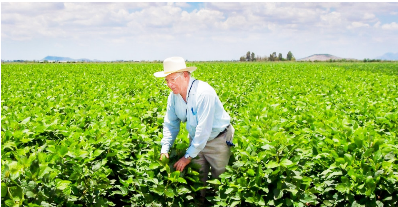
En el primer trimestre de 2024 el agro se ubica como uno de los sectores con mayor crecimiento, con 6,3 por ciento.

“Actualmente, es solo del 22 por ciento comparado con el promedio de 27,4 por ciento de los últimos cinco años, y es esencial para la reactivación, la cual debe tener claridad en la financiación”, señaló Lacouture.