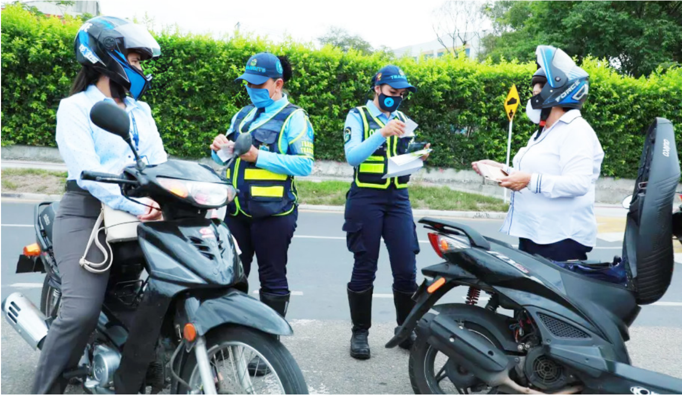
La Supertransporte le ha exigido a Neiva que cumpla con el SISI/PECCIT.

de Movilidad, luego de expedida la Resolución 7339 del 22 de septiembre del 2023 que amonestó al municipio por la ausencia de controles al transporte ilegal, inició labores de control a los automotores que prestan de manera ilegal el servicio de transporte individual, “aquí en Neiva la Secretaría de Movilidad recibió una sanción drástica por parte de la Superintendencia de Transportes y, de allí en adelante, ellos se han puesto a trabajar en la labor de sacar a los carros que estén haciendo transporte ilegal y llevándolos a recaudo de los patios, pero desafortunadamente falta mucho aquí en el transporte ilegal en Neiva, nos vemos siempre afectados porque de una u otra manera se ven carros particulares prestando el servicio de transporte”, agregó y afirmó que no es solo los vehículos por medio de apps o piratería y los mototaxistas, sino también la aparición de motocarros, los que están afectando al gremio, “ahora el Motocarro, el cual solamente está homologado para ciudades con población inferior a los 50,000 habitantes, entonces no se está viendo ese resultado