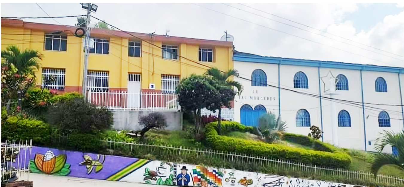
Este ente territorial, tendrá un nuevo colegio.

"Es un proyecto de infraestructura bastante importante para el municipio de Nátaga, correspondiente a la construcción de una