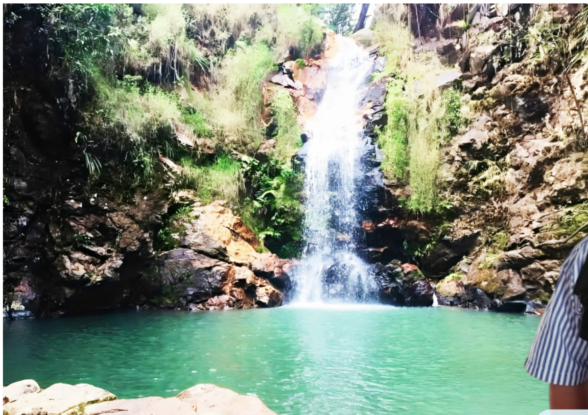
Sitio a visitar la Cascada ‘Marruecos’.