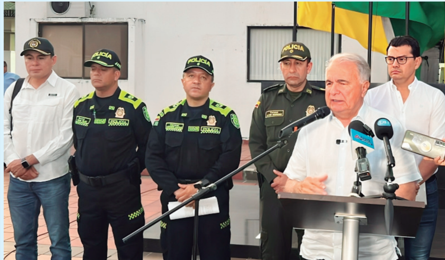
Autoridades dieron a conocer las estrategias adoptadas.

tes del sector indicaron que habían sido citados al sector", dijo un investigador.