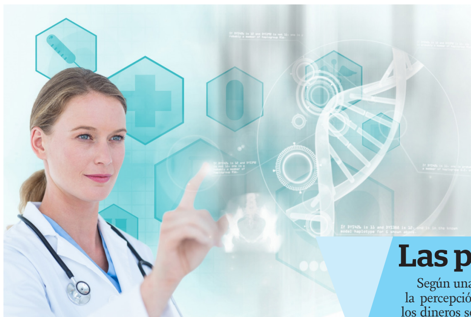
En el último año y reafirmando su compromiso con la salud de los colombianos.

En resumen, la digitalización del sector salud y la creciente demanda de servicios accesibles y eficientes reflejan la importancia de plataformas como DoctorAkí. La capacidad de estas plataformas para conectar a pacientes con profesionales de la salud, junto con su enfoque en la mejora continua de los servicios, es esencial para enfrentar los desafíos actuales y futuros de la salud en Colombia.