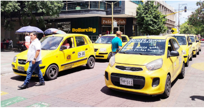
Taxistas en Neiva marcharán contra la ilegalidad