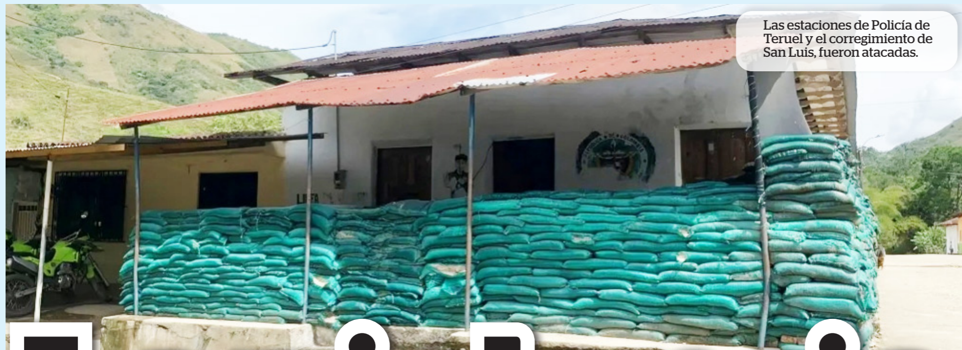
Las estaciones de Policía de Teruel y el corregimiento de San Luis, fueron atacadas.

Y es que el pasado domingo, tres personas fueron asesinadas por grupos al margen de la ley y sobre uno de los cuerpos dejaron un panfleto, que decía: Farc-ep. "De lo que se conoció es que días atrás habían llegado siete personas, cuya procedencia no se sabía. Y algunos comercian-