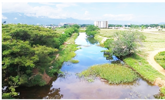
Medio ambiente al 'banquillo' en el Concejo de Neiva