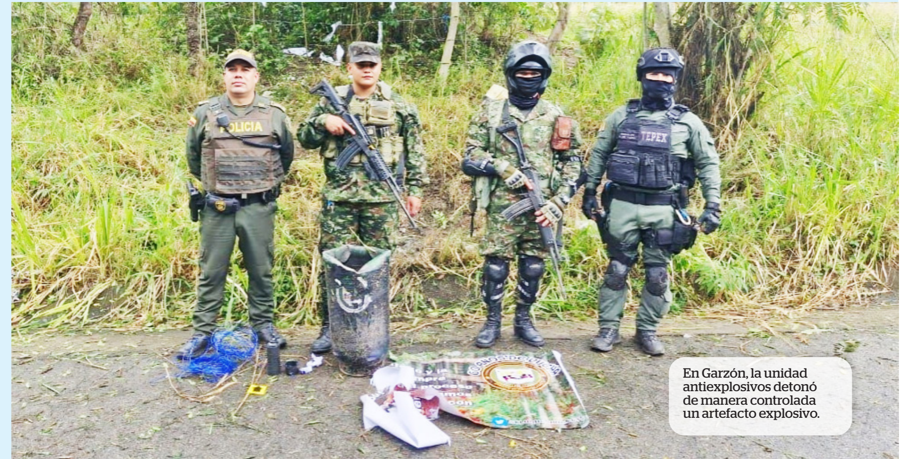
En Garzón, la unidad antiexplosivos detonó de manera controlada un artefacto explosivo.