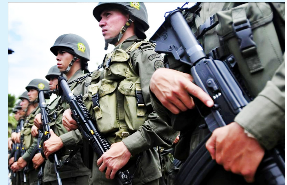
Ante esta serie de hechos, llegó a la ciudad un nuevo contingente de agentes.