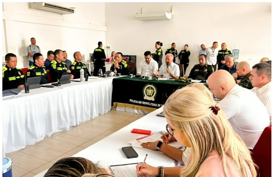
El consejo de seguridad realizados por las autoridades municipales y departamentales ante los recientes hechos de violencia en el Huila.