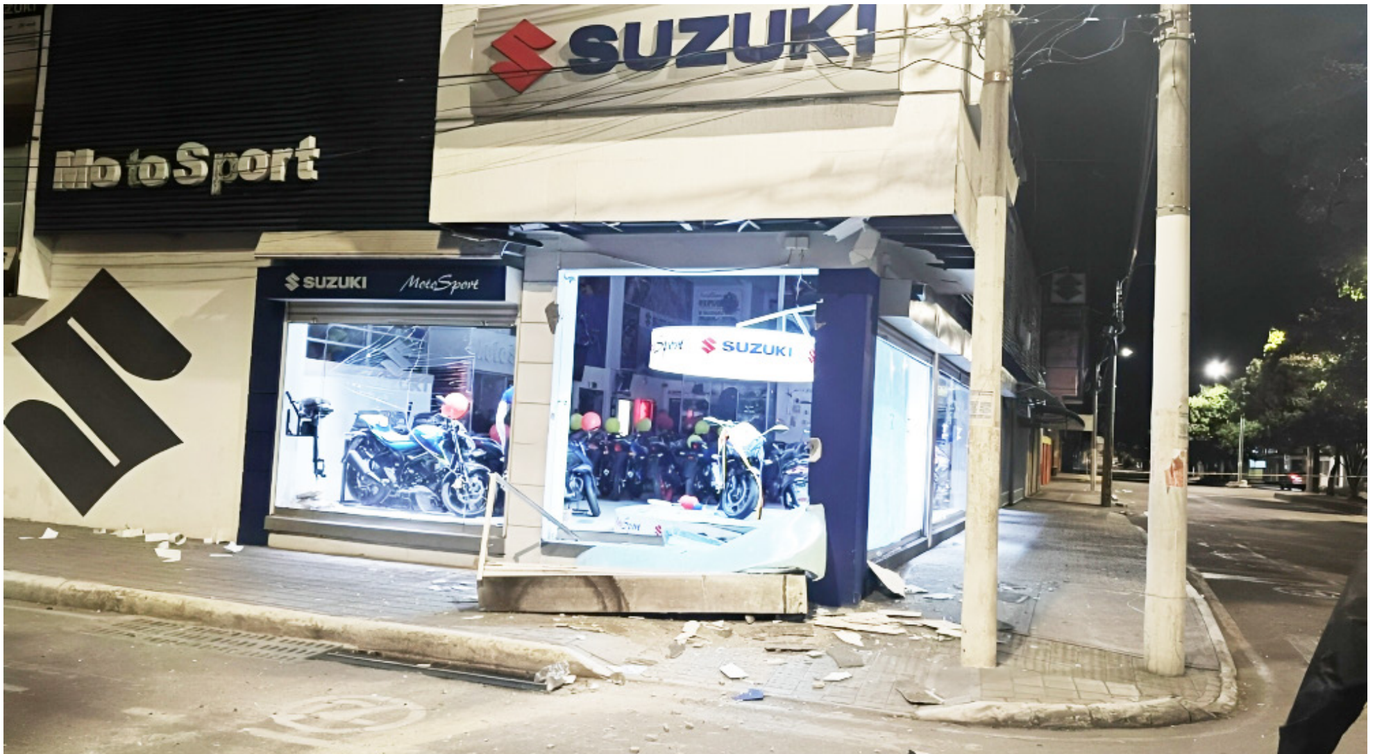
Entre $2 y $3 millones pagarían los 'armados' por atentado.

■ Una compleja situación vive Neiva, debido a que está siendo afectada por el bloque 'Jorge Suárez Briceño' de las disidencias de las Farc y hay 24 columnas de estos actores armados, que operan en los municipios cercanos a la capital opita. Y el grupo que tiene injerencia en la ciudad, sería el responsable de los atentados.