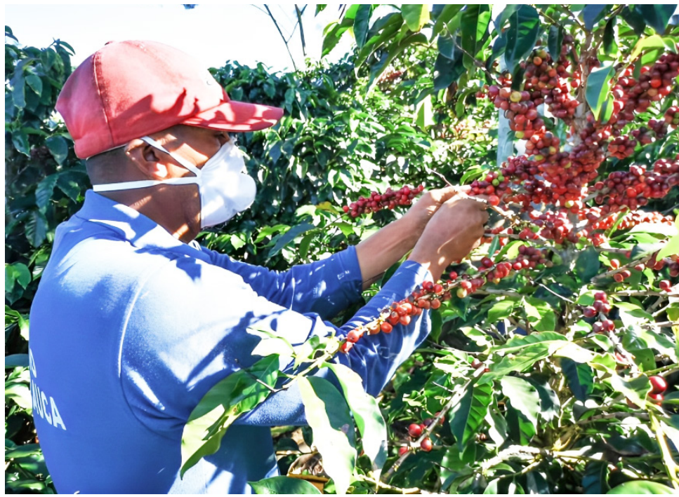
Uno de los planes es transformar el café en producto listo para el consumo.