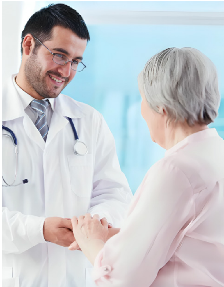
Existen tres principales preocupaciones en los colombianos a la hora de gestionar sus necesidades de salud.

La salud de los colombianos enfrenta tres preocupaciones principales: la atención oportuna y de calidad (57%), el bienestar general y la prevención de enfermedades (21%), y la cobertura de medicamentos y exámenes (10%).