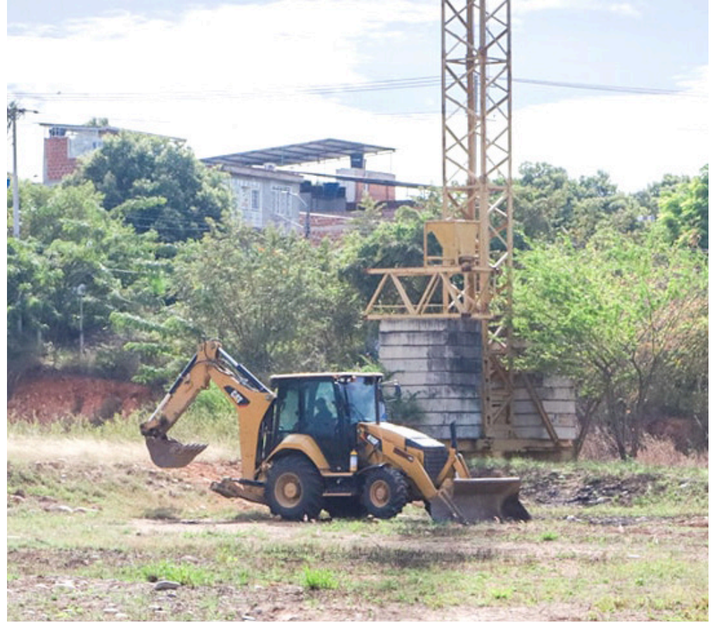
Fronteras del Milenio III constará de 13 torres de 12 pisos.