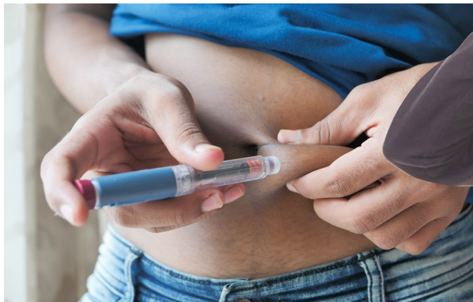
Cuando una prueba de diabetes en ayunas arroja resultados que son de 99 mg/dl o menores significa que los niveles de glucosa están normales.

La Coca Cola tiene grandes cantidades de azúcar.