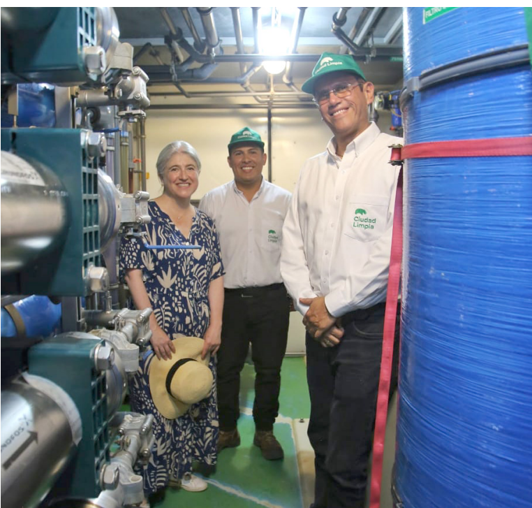
La Ministra visitó el relleno sanitario Los Ángeles.

rios de Cambia Mi Casa deben tener un puntaje Sisbén igual o inferior a C18.