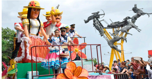
Aplaudido desfile Popular en Neiva