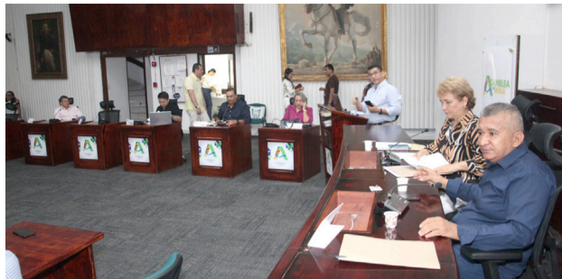
Proyectos departamentales en la mira de la duma