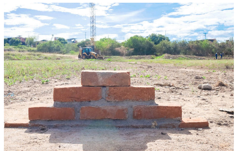
Las familias podrán aplicar al subsidio nacional.

El proyecto de Fronteras del Milenio III cuenta con recursos garantizados por parte de la Alcaldía, la Gobernación y Comfa-