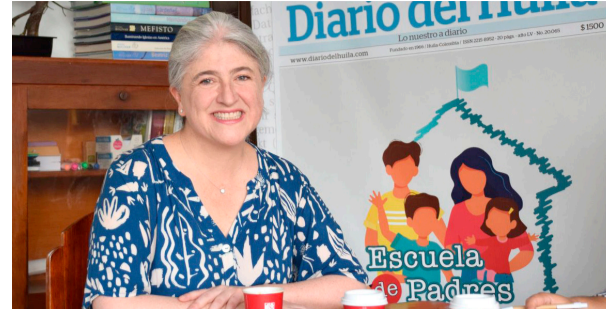
“El PND, nos va a permitir la titulación de predios privados”