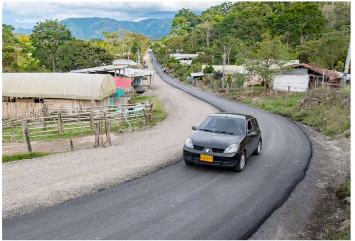
El Anillo Turístico del Sur lo compone la vía Nacional-Pitalito-San Agustín, San Agustín-Estrecho -Obando, Obando-Isnos, Isnos-Bordones, Bordones-La Laguna -Guacacayo, Guacacayo-Cruce ruta 45 y el Cruce Isnos-San Agustín -Altos de los Ídolos.