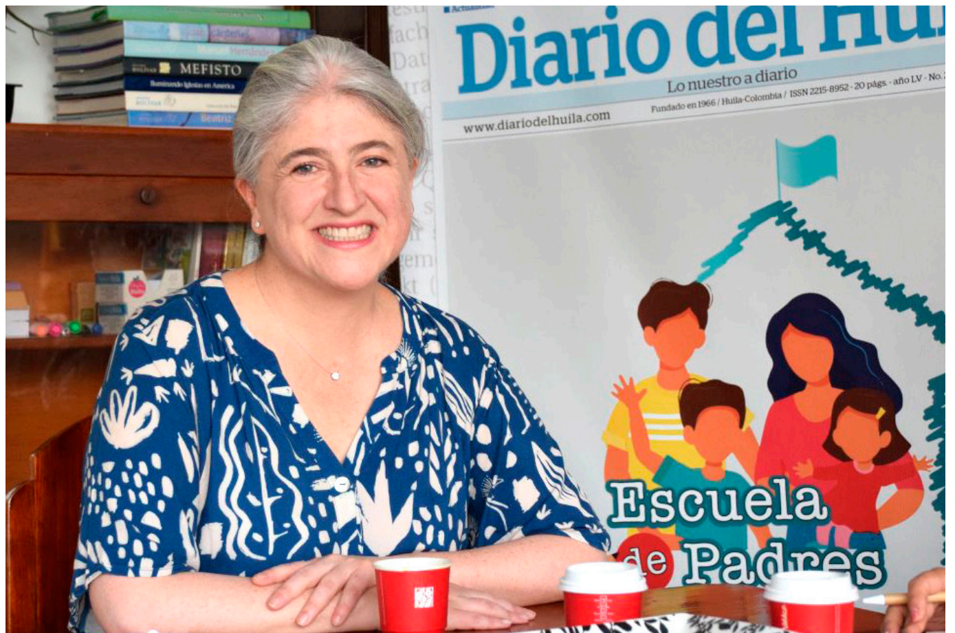
Catalina Velasco Campuzano, Ministra de Vivienda.

Durante su visita en la capital opita, la Ministra visitó terrenos donde la Administración Municipal tiene proyectos soluciones de vivienda.