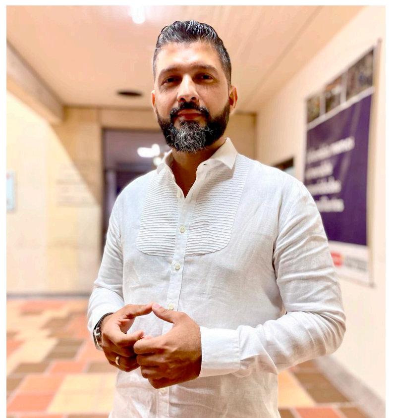
Álvaro Andrés Charry, alcalde del municipio de Villavieja.

“Primero que quede claro que no va a haber restricciones en el Desierto, aquí se tiene un carretera donde todo el mundo puede circular a la hora que sea más conveniente, pero vamos a tener unas restricciones en velocidades, en la contaminación lumínica con las exploradoras y el sonido”.