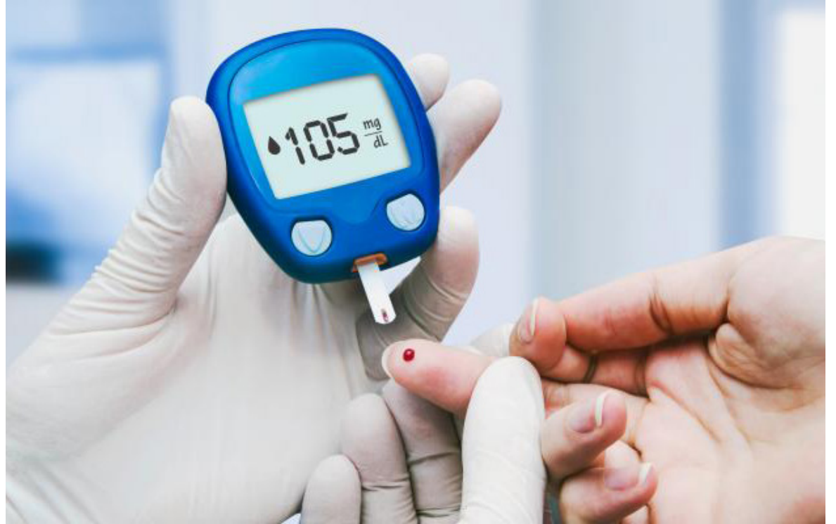
Las bebidas azucaradas elevan de manera exponencial el nivel de glucosa.

Tomarla sin control trae grandes perjuicios al organismo. Según expertos la Coca Cola, dispara los niveles de azúcar en la sangre.