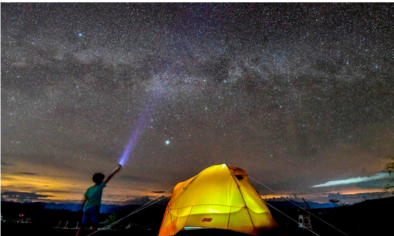
Según el mandatario, el uso de exploradoras de luces altas se va a empezar a prohibir dentro del Desierto, porque va en contra de la astronomía.

“Todos sabemos los temas de drogas donde han muerto personas intoxicadas, y creo que el Desierto de la Tatacoa está para mucho más que una fiesta donde se van a drogar las personas”.