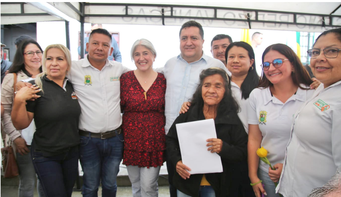
Un total de 40 titulaciones de predios fueron entregados en San Agustín.