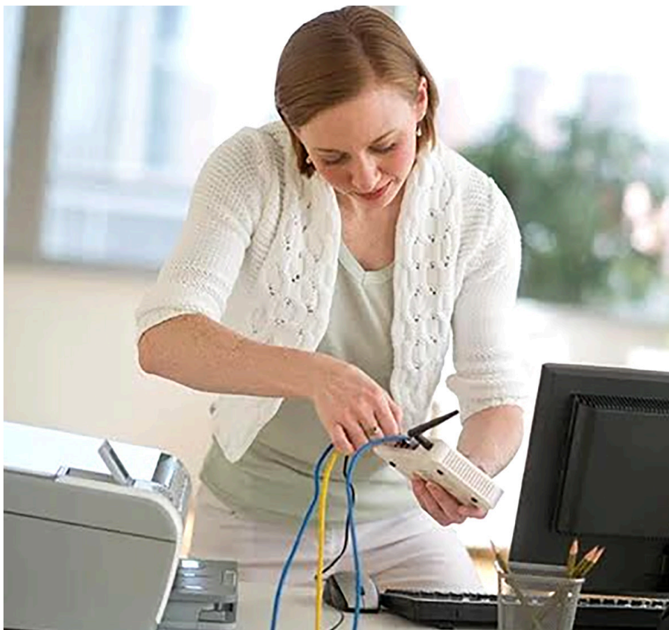
A la hora de cuidarse de los ciberdelincuentes, es necesario empezar por desconfiar de todo lo que llegue.

Mantenga su dispositivo protegido de los ciberdelincuentes. Siga estos consejos y evite caer en las trampas.