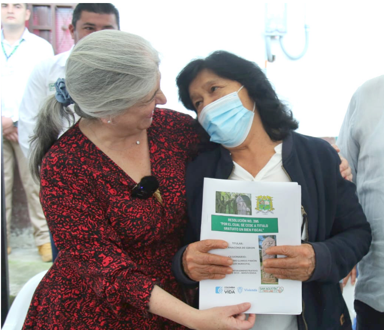
La jefa de la cartera de vivienda, estuvo en el Huila, entregando titulaciones de predios.