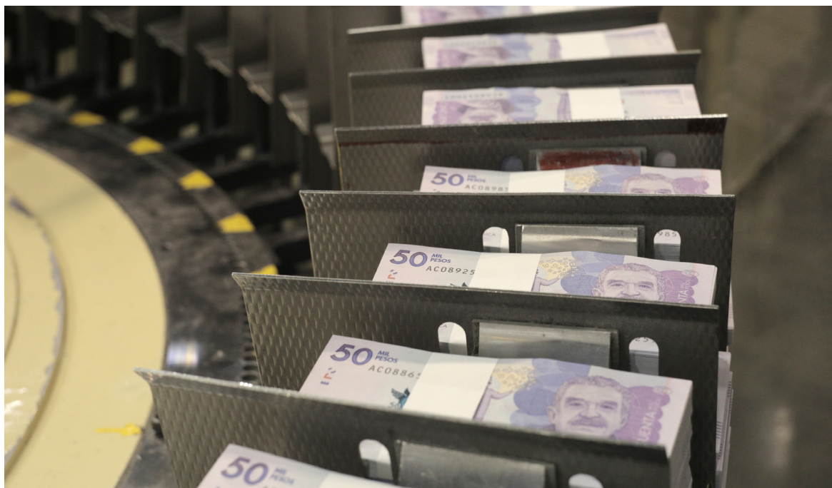
En el Huila por concepto de recursos del endeudamiento fueron aprobados por la Asamblea Departamental en octubre del 2021, $91 mil millones.

parte del soporte financiero del Consorcio Oslo, el que se esté haciendo una petición a la Secretaría no quiere decir que no cuente con los recursos, finalmente en sus procesos de contratación demuestran una capacidad financiera y con esa capacidad financiera ellos pueden garantizar la ejecución de las obras contractualmente”, concluyó.