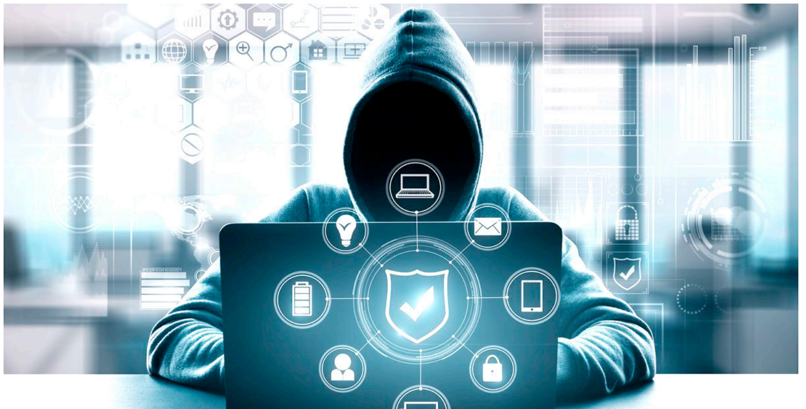
Los hackers pueden ejecutar ciberataques coordinados contra personas o marcas.

La seguridad de su dispositivo debe ser primordial. Cuando usted instala una nueva aplicación en su Android, la mayoría le solicita permiso para acceder a ciertos datos y funciones del móvil, los cuales se