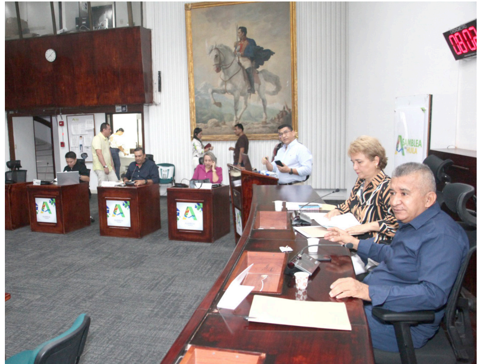
Durante la Asamblea Departamental se llevó a cabo este debate de control sobre los proyectos financiados con créditos.