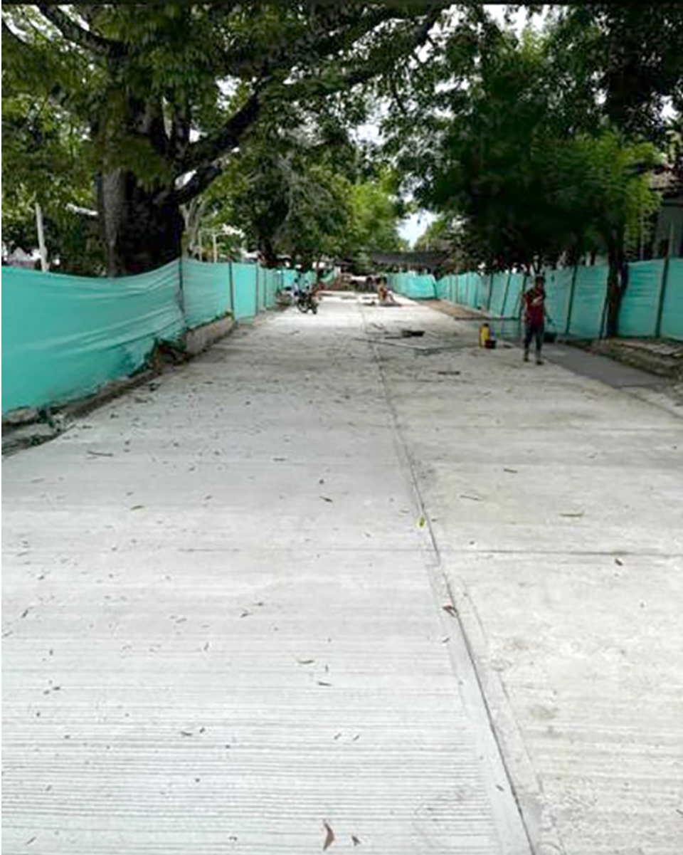
La calle frente al Museo Paleontológico fue cementada para mejorar la transitabilidad en el casco urbano.