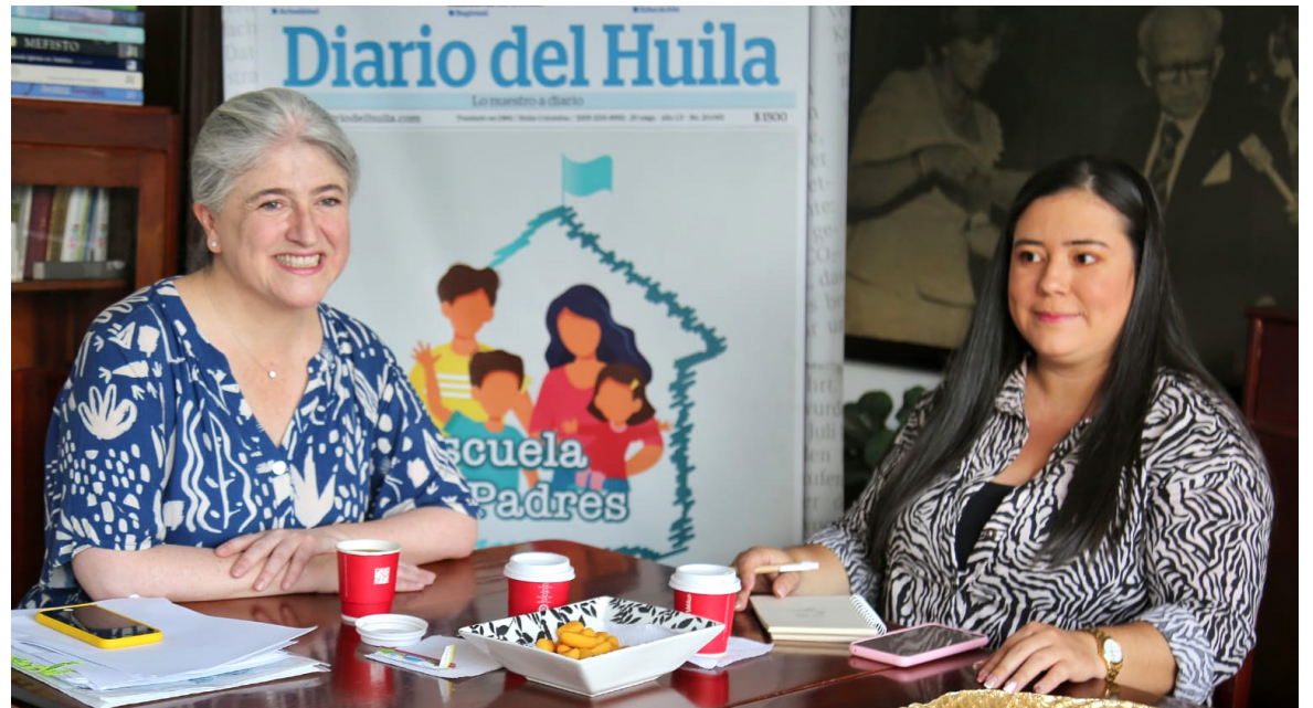
La Ministra de Vivienda visitó las instalaciones del Diario del Huila.