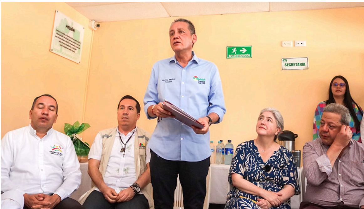
El proyecto beneficiará a 1.248 familias.

■ En un acto protocolario lleno de expectativas, se llevó a cabo la colocación de la primera piedra que marca el inicio de la construcción de Fronteras del Milenio III, un destacado proyecto habitacional ubicado en el norte de Neiva, liderado por la Alcaldía Municipal.