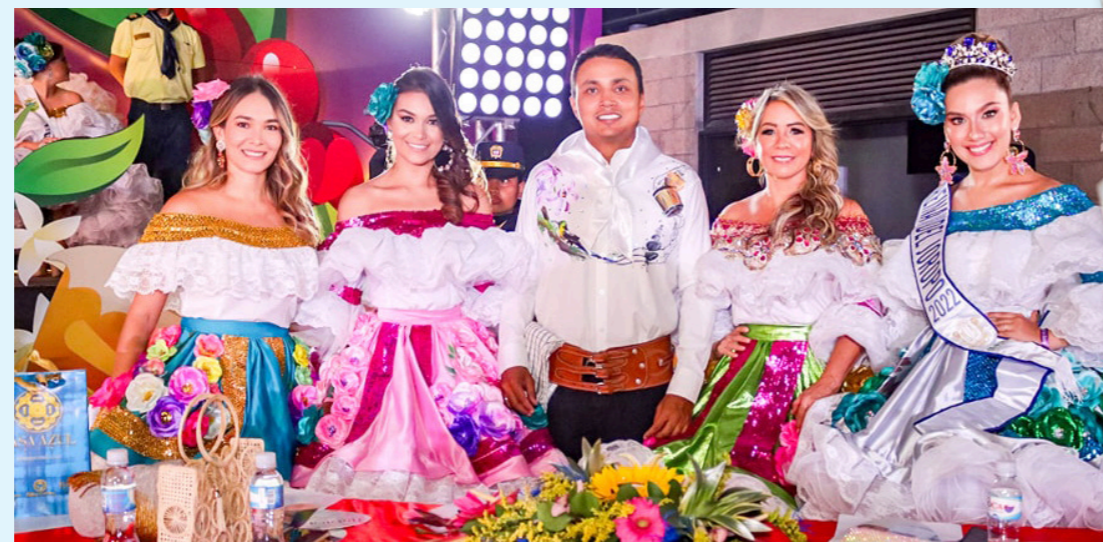
El jurado calificador escogió a cinco semifinalistas.

La velada de coronación contó con la participación de varias agrupaciones musicales que animaron al público.