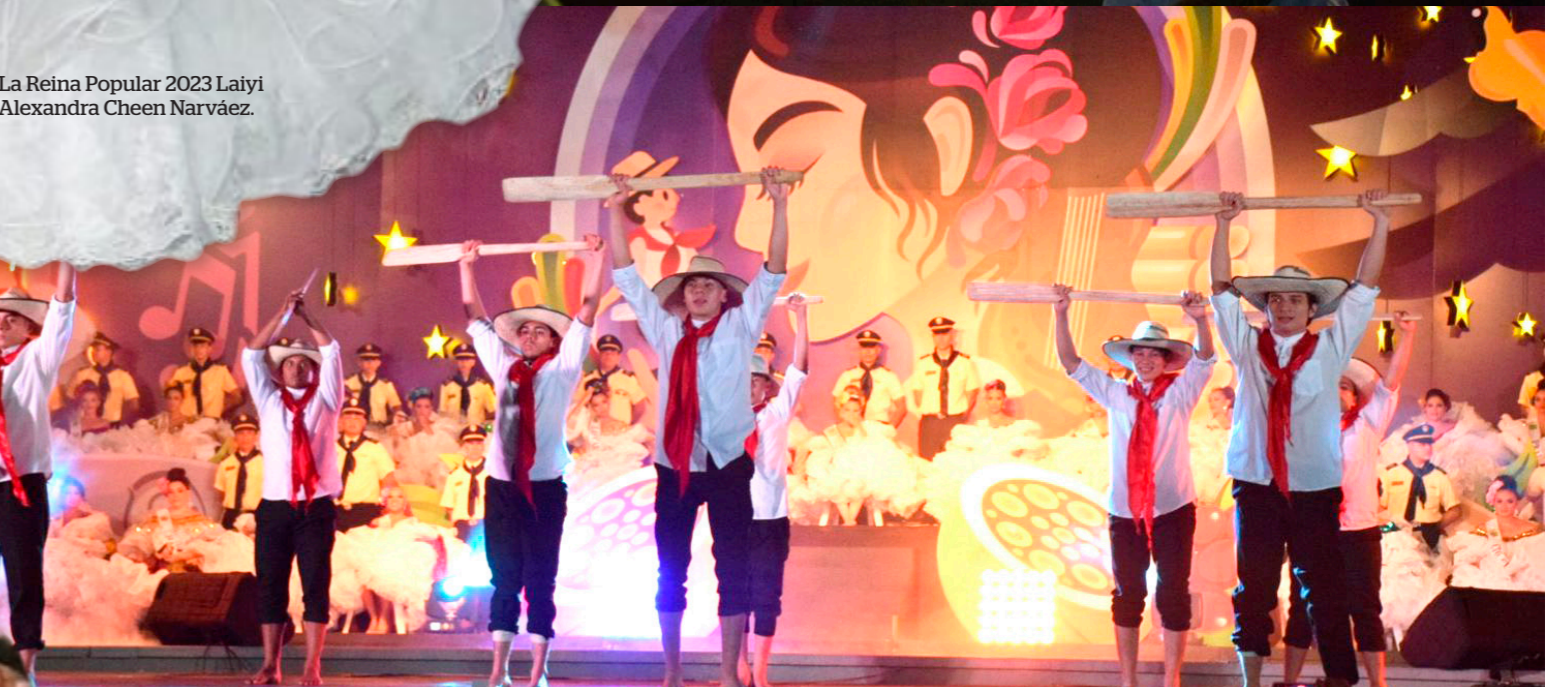
Agrupaciones de danzas hicieron parte del show en esta velada.