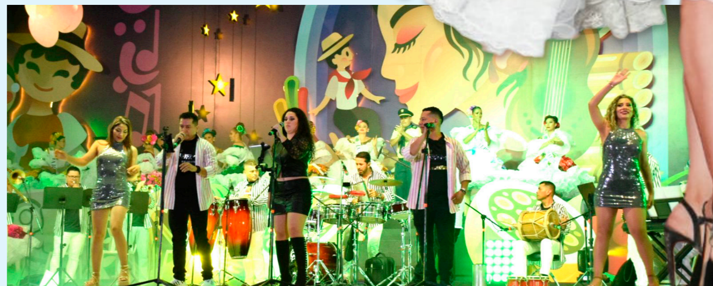
La orquesta La Cheverisima, animó al público.