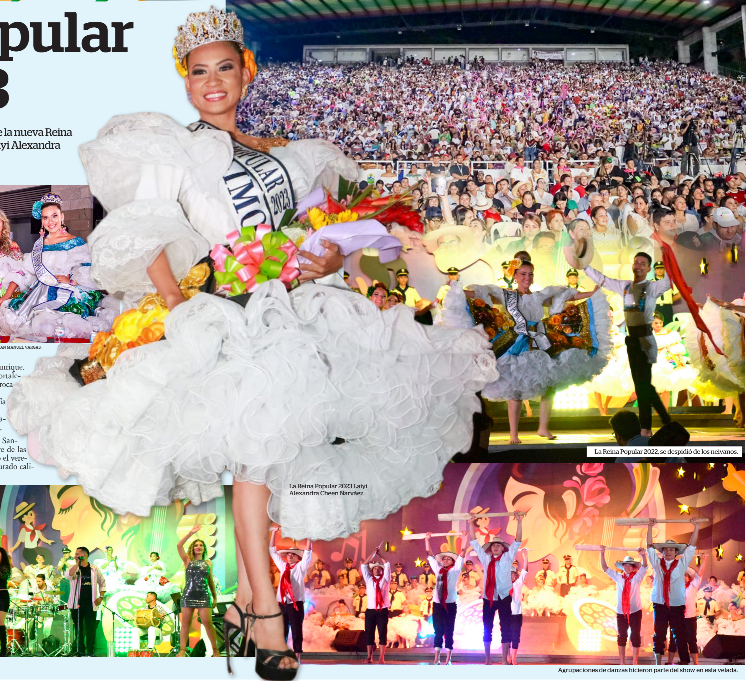
La Reina Popular 2022, se despidió de los neivanos.