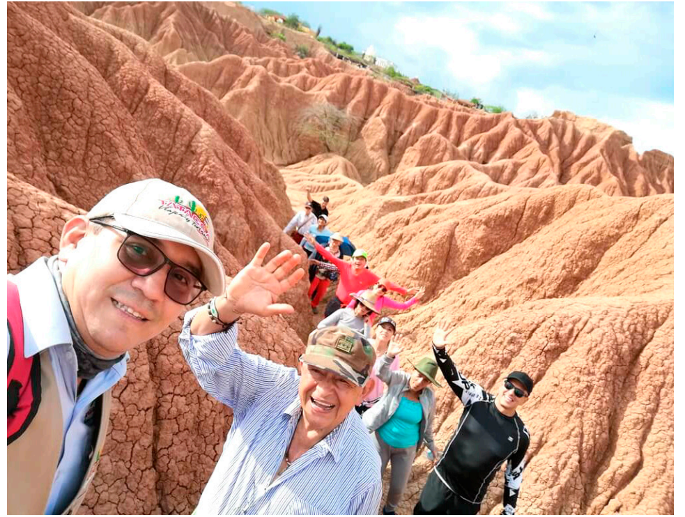
Más de 14 mil turistas se espera que visiten el destino turístico, ubicado en el norte del Huila.

Primero y hay que dejarlo muy claro, porque no va a pasar como el cobro al Desierto que nunca hubo y la gente todavía me sigue preguntando que sí se está cobrando y eso es un tema yo creo que ya está