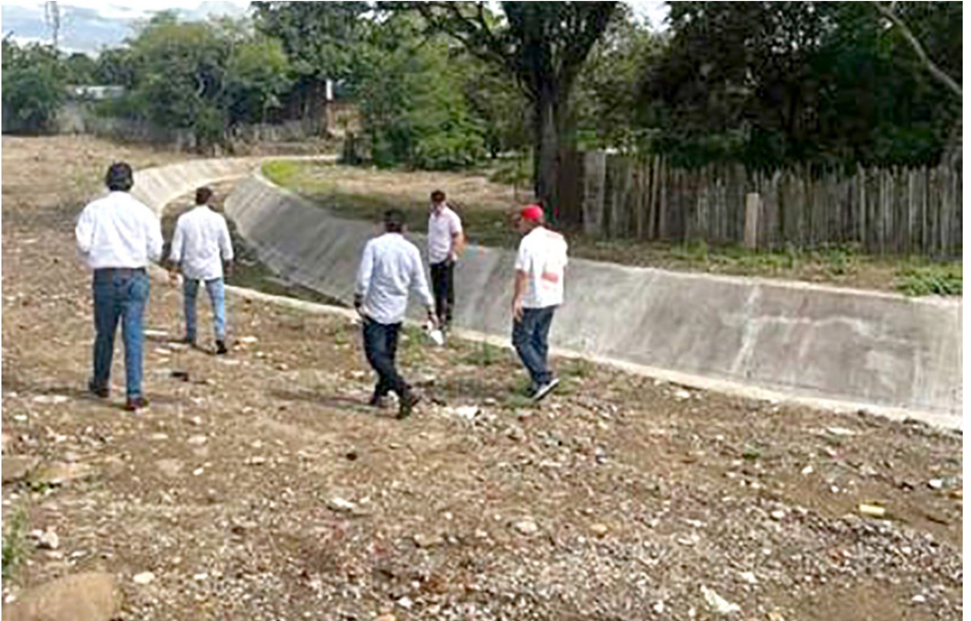
Más de 400 metros de canalización se han construido en la obra del malecón.

■ En entrevista para el Diario del Huila, el mandatario del municipio de Villavieja, señaló que esperan recibir a por lo menos 14.000 turistas durante la temporada de mitad de año. Añadió que se trabaja en conjunto con la Cam para establecer medidas que conserven el destino.