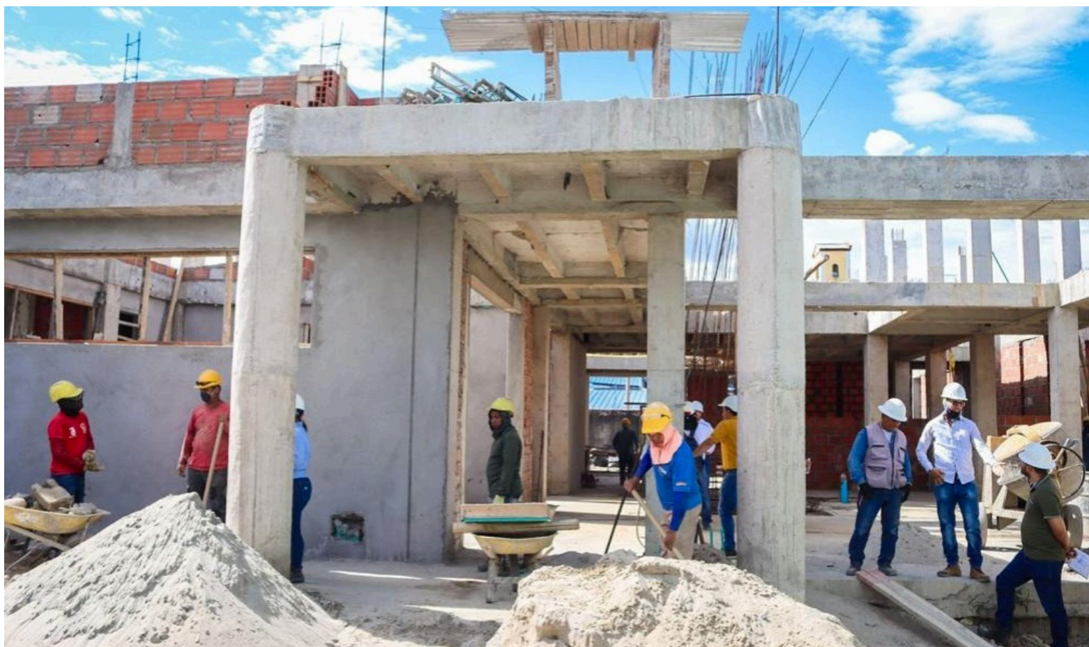
La UPJ albergará servicios de la Policía Nacional, Fiscalía General, Medicina Legal, y más, consolidando la administración de justicia en Neiva.

La culminación de la UPJ de Neiva no solo representará la concreción de una obra de infraestructura significativa, sino también un paso crucial hacia el fortalecimiento del acceso a la justicia y la seguridad en la región, contribuyendo al bienestar general de los habitantes de la Comuna 6 y de toda Neiva.