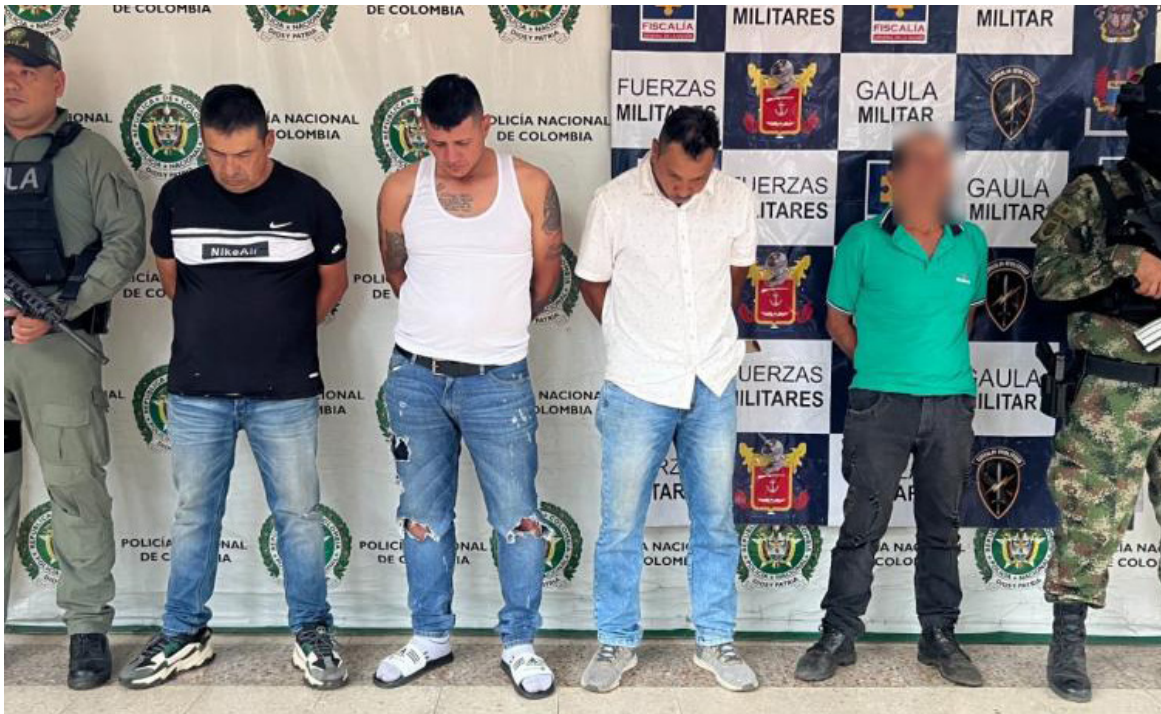
El delito que más afecta a la región es la extorsión.

que va a llegar un Batallón Móvil para los departamentos del Huila y Tolima. “En ese sentido este grupo especial va a estar haciendo acciones que tienen que ver con la seguridad por el movimiento de los grupos insurgentes en este sector, pero tenemos también como ya se ha señalado las fronteras con el Cauca y Caquetá, por eso requerimos apoyo para que nuestra región, no se convierta en el lugar cómodo para los grupos al margen de la ley”.