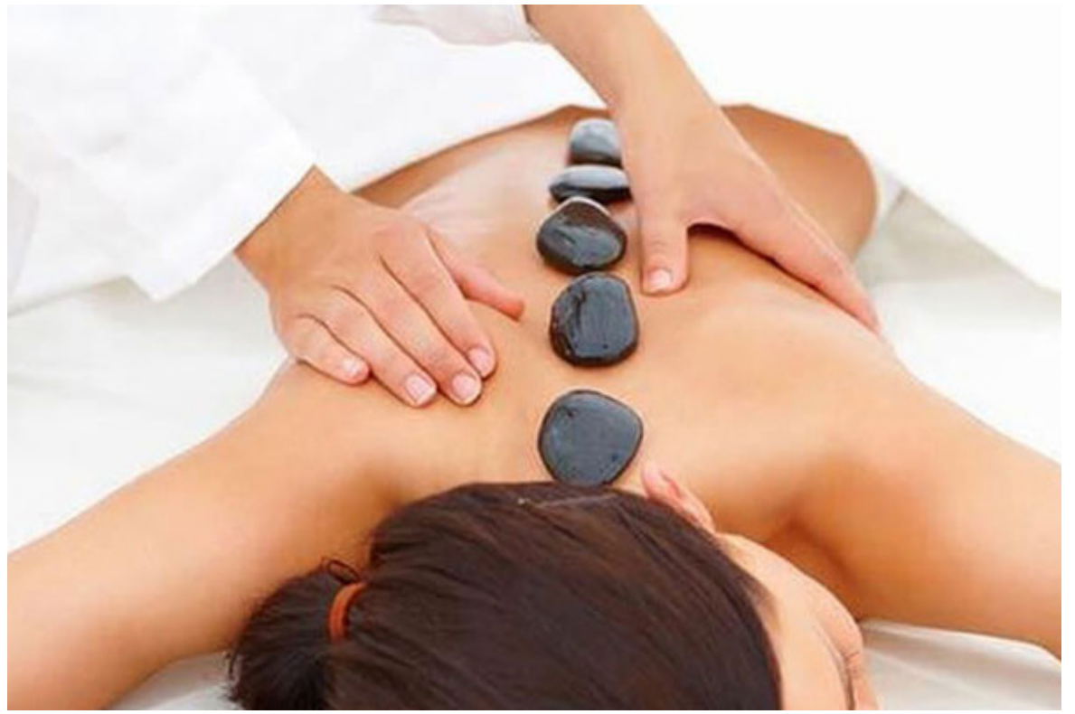
Los saunas pueden ser una nueva herramienta para luchar contra la depresión.

La termorregulación y su relación con el estado de ánimo sugieren que el calor extremo podría tener un efecto de “reseteo” en el cuerpo, mejorando así los síntomas depresivos. El fisiólogo Earric Lee explica que la exposición a temperaturas extremas puede engañar al cuerpo para que baje su temperatura, lo que a su vez podría mejorar el estado de ánimo.