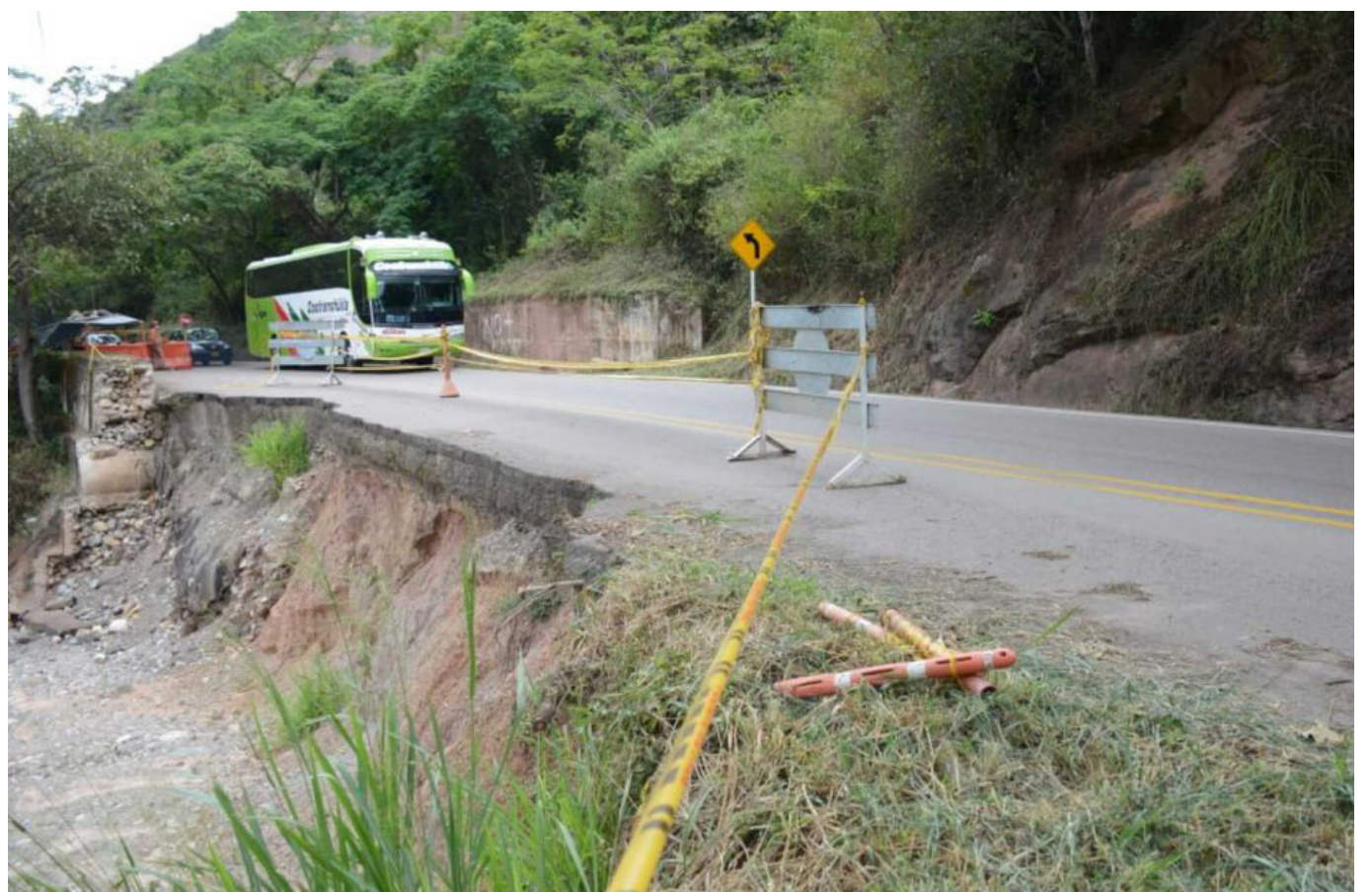
Van a haber puntos de control en las principales vías.