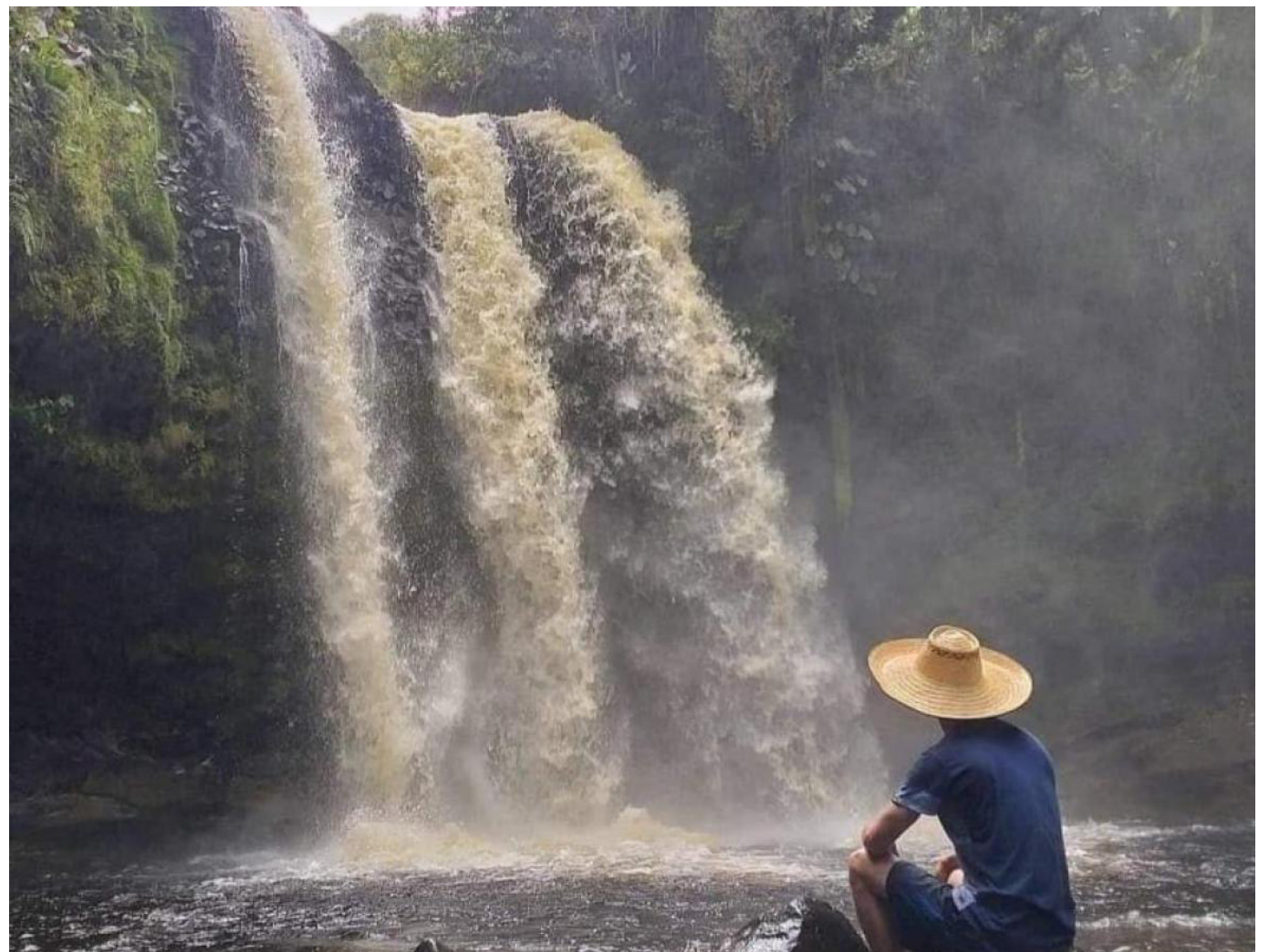
La idea es que los turistas se sientan atraídos por las riquezas naturales que tiene la región.