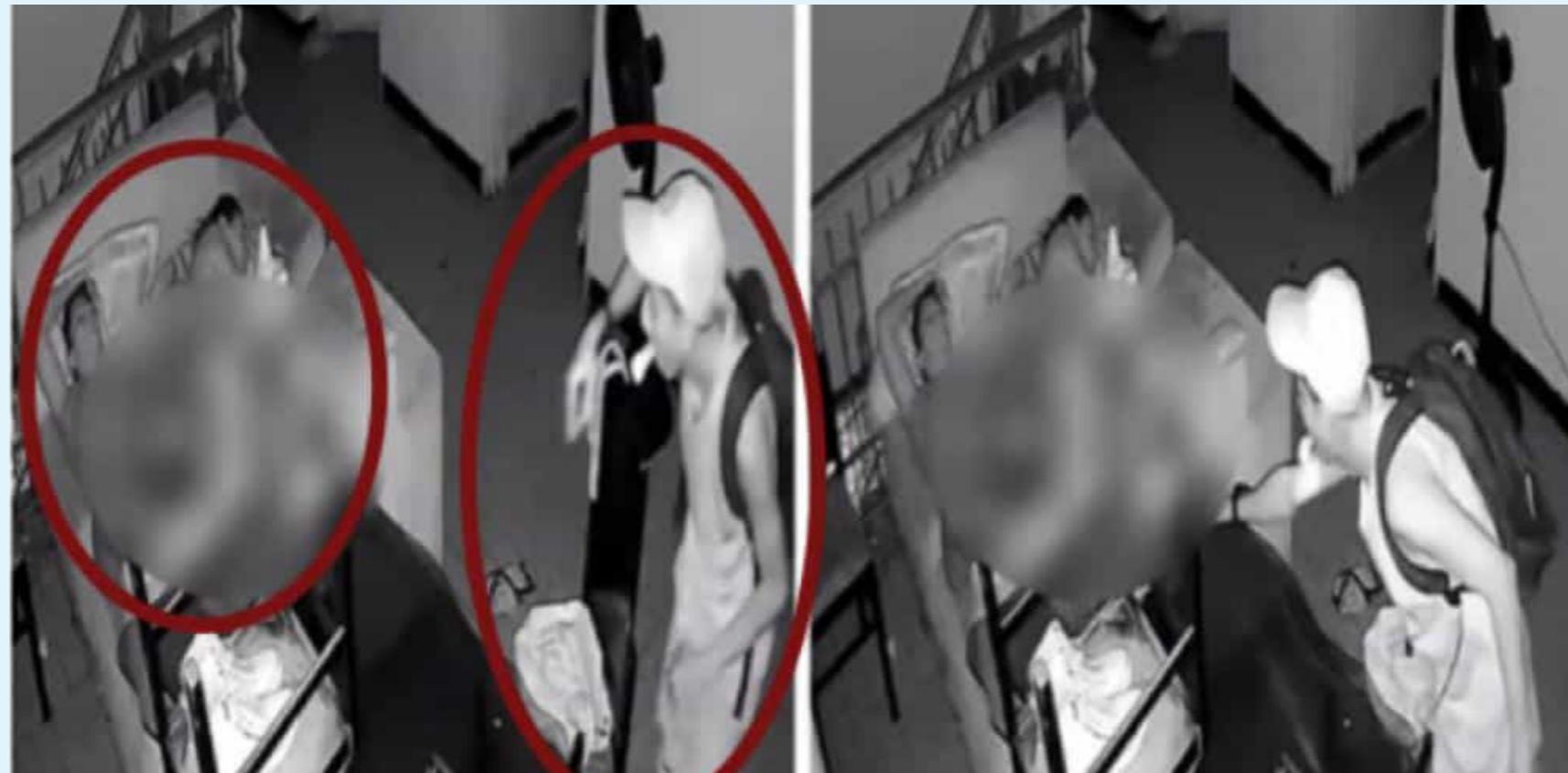
Datos recientes muestran que los casos de hurto a viviendas en Neiva han disminuido en un 3% durante el año 2024, un indicador alentador en la lucha contra la delincuencia.

El total de incidentes de hurto a comercios, personas y residencias en lo que va del año asciende a 499 casos.