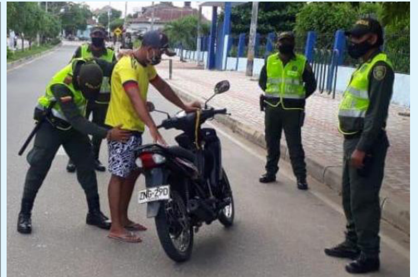
La Policía Metropolitana ha intensificado los patrullajes y las campañas de prevención del delito, enfocándose en fortalecer la cooperación entre la comunidad y las fuerzas de seguridad para mantener la tendencia a la baja en los índices de hurto.

Los casos de hurto a viviendas han mostrado una leve disminución. En 2024, se han reportado 189 incidentes, frente a los 195 registrados en 2023, lo que representa una reducción de seis casos, equivalente al 3%.