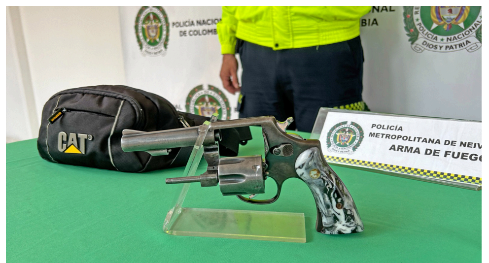
Al momento de su captura le fue hallada un arma de fuego.