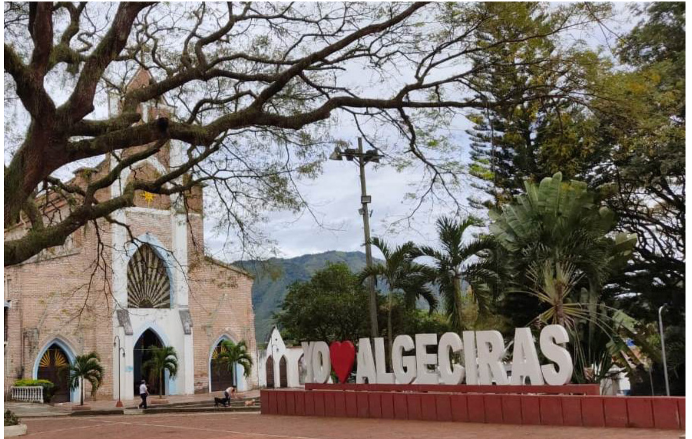
Los parques de los municipios serán embellecidos.

"La estrategia busca que todos los municipios se involucren con el mejoramiento del paisaje urbano y rural. En las ciudades, se va a tratar todo lo relacionado con infraestructura y en la parte campestre con la arborización, para tener unos senderos más amigables con el Medio Ambiente", destacó Ramiro Muñoz, coordinador del programa.