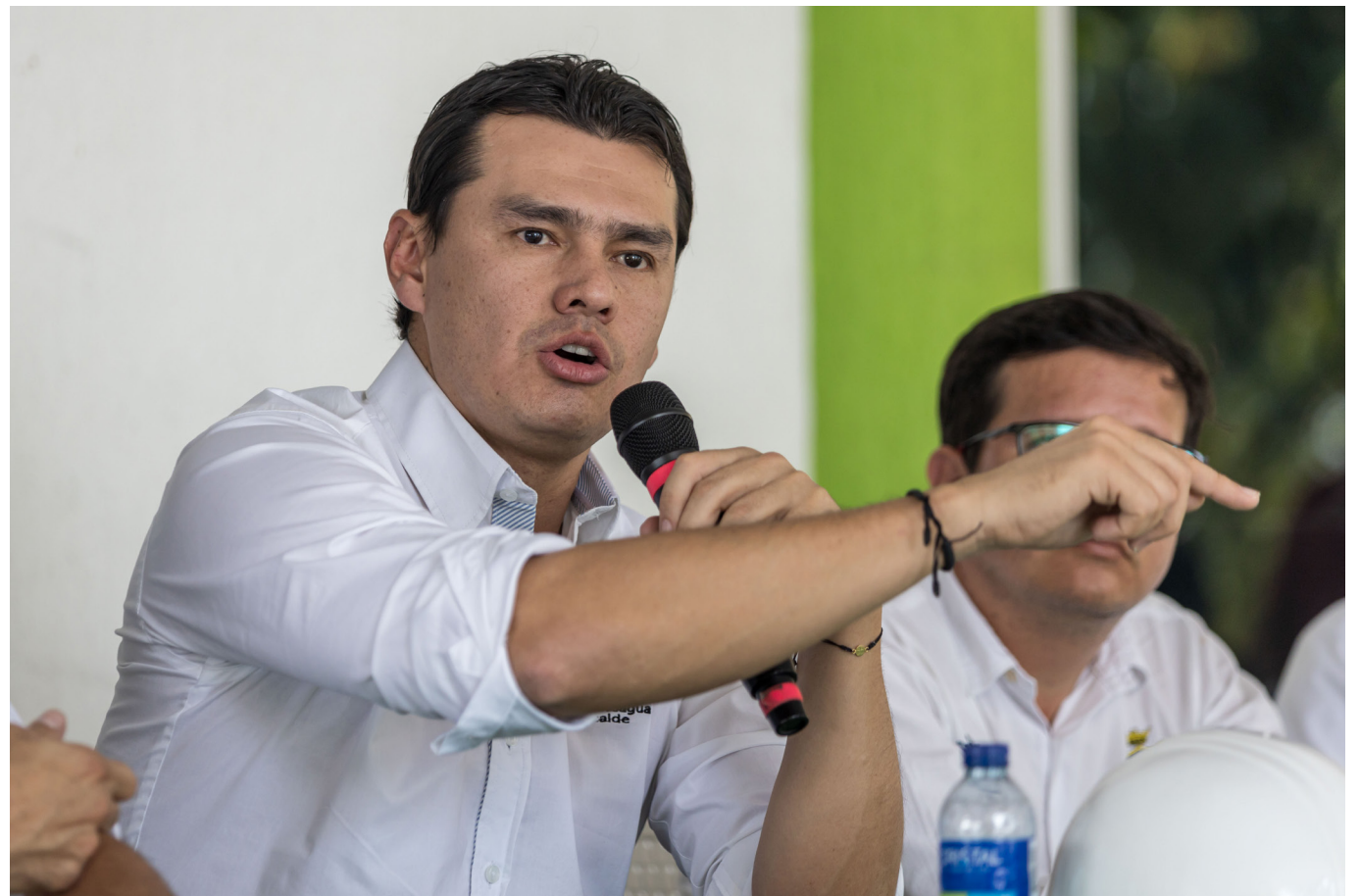
La construcción de la Unidad Permanente de Justicia en Neiva ha alcanzado un 85% de avance, con expectativas de ser completada a mediados de 2024.

La Unidad Permanente de Justicia (UPJ) de Neiva avanza en un 85% y se espera que esté operativa para diciembre de 2024, mejorando significativamente el acceso a la justicia y la seguridad en la región.