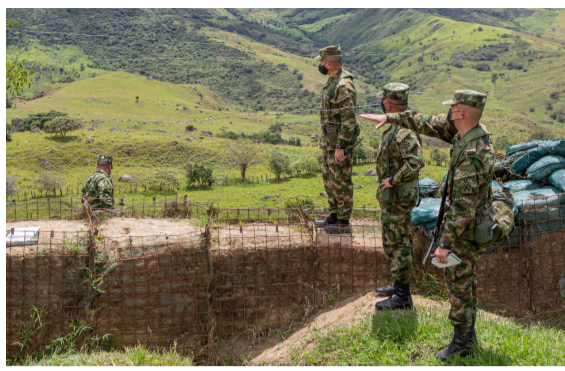
“Se requiere reforzar el pie de fuerza” ■ PRIMER PLANO 8-9