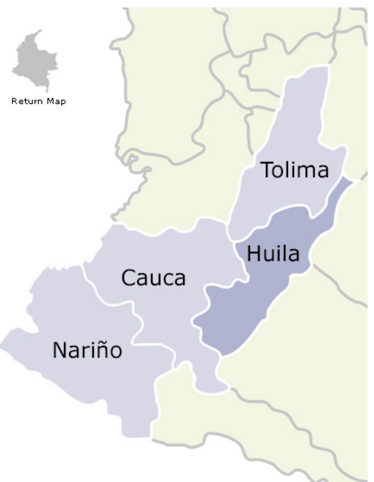
Se busca blindar a la región para que los ‘armados’ no lleguen a delinquir.

En este sentido, el secretario de Gobierno, indicó