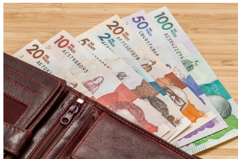
A los colombianos cada vez les alcanza menos los que ganan para comprar los productos básicos de la canasta familiar.

De acuerdo con el Dane, para este mes la división de gasto que tuvo mayor crecimiento inflacionario en abril fue alimentos y bebidas no alcohólicas (1,16%).