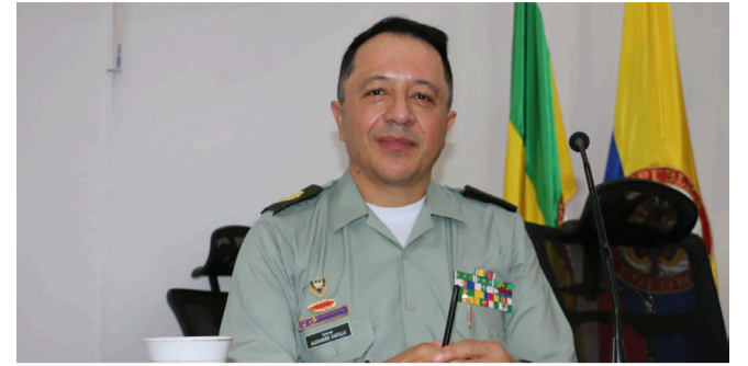
Descienden los casos de hurto a viviendas en Neiva ■ PANORAMA 10-11