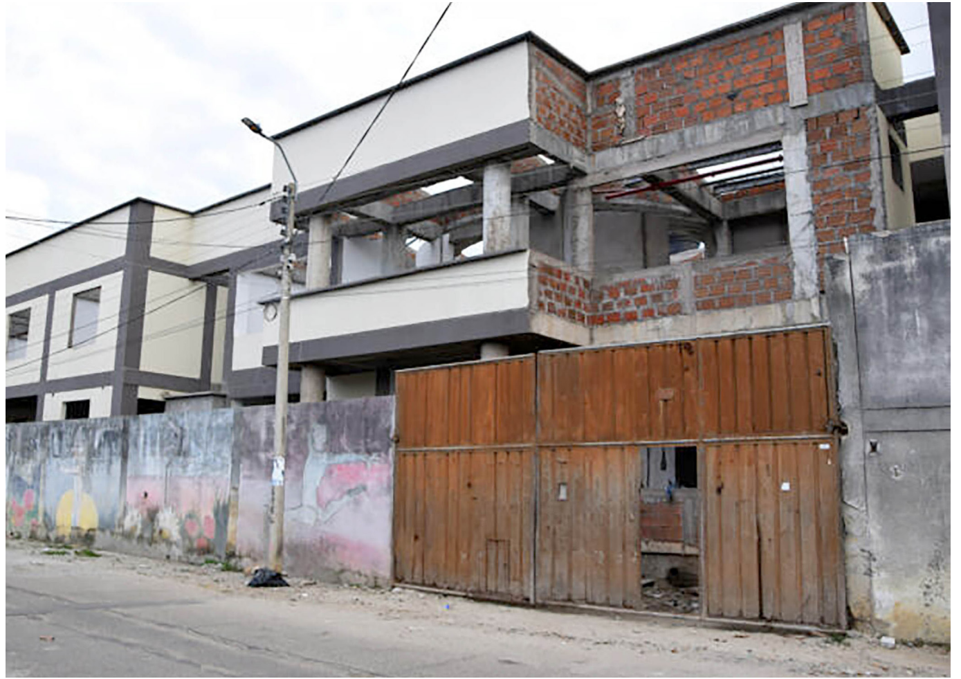
El alcalde Germán Casagua Bonilla lidera los esfuerzos para finalizar y dotar la UPJ, enfrentando retos financieros significativos.

El proyecto de la UPJ, financiado inicialmente con un crédito de 60 mil millones de pesos, enfrenta retos financieros adicionales para su dotación completa, requiriendo una inversión adicional de $2.000 millones.