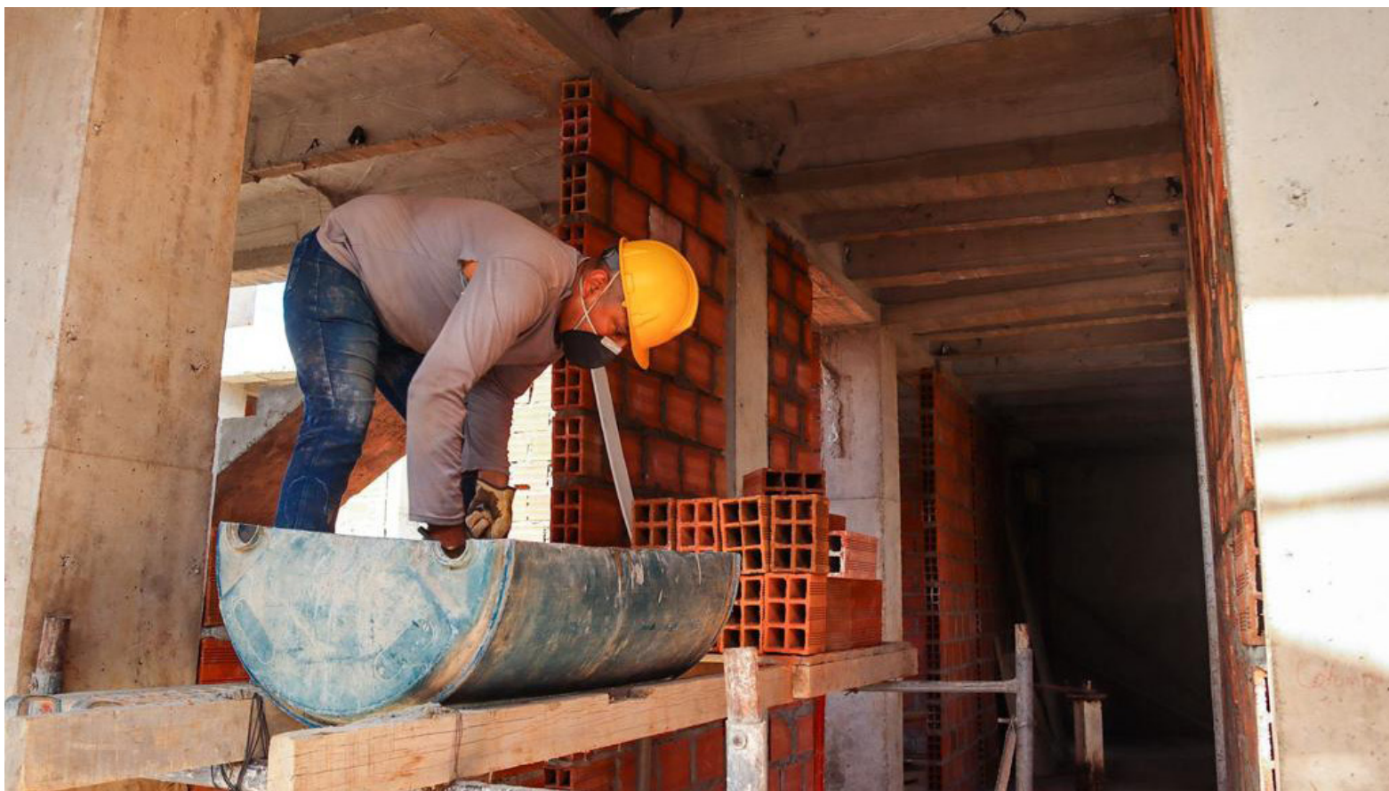
El complejo judicial en la Comuna 6 ofrecerá celdas con diseño antivandalismo y salas de audiencias para mejorar el acceso a la justicia.