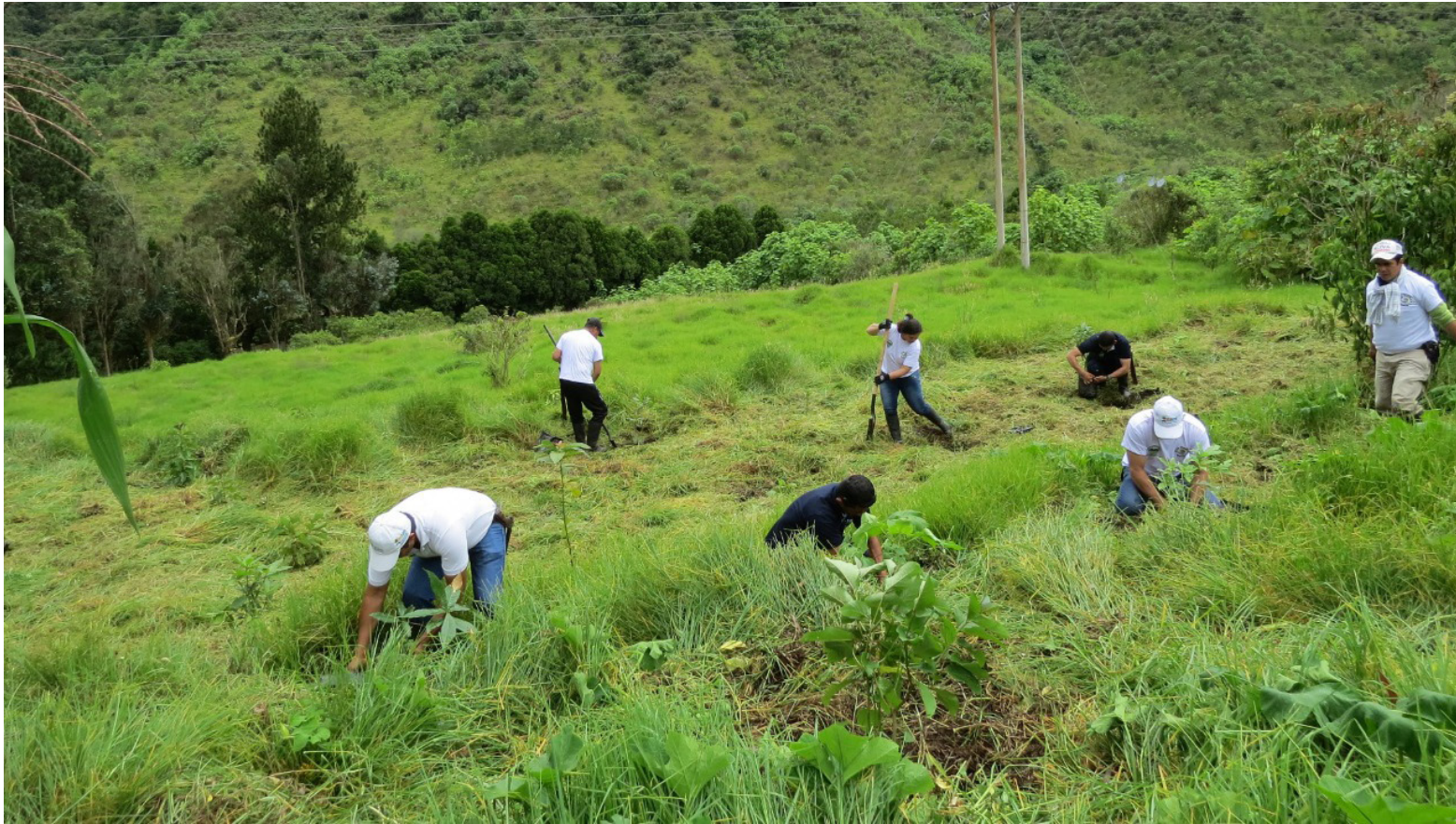
En algunos entes territoriales se van a sembrar árboles para hacer 'corredores verdes'.

y el componente de embellecimiento urbano, también va a contribuir a que sean más atractivos nuestros municipios para los turistas”.