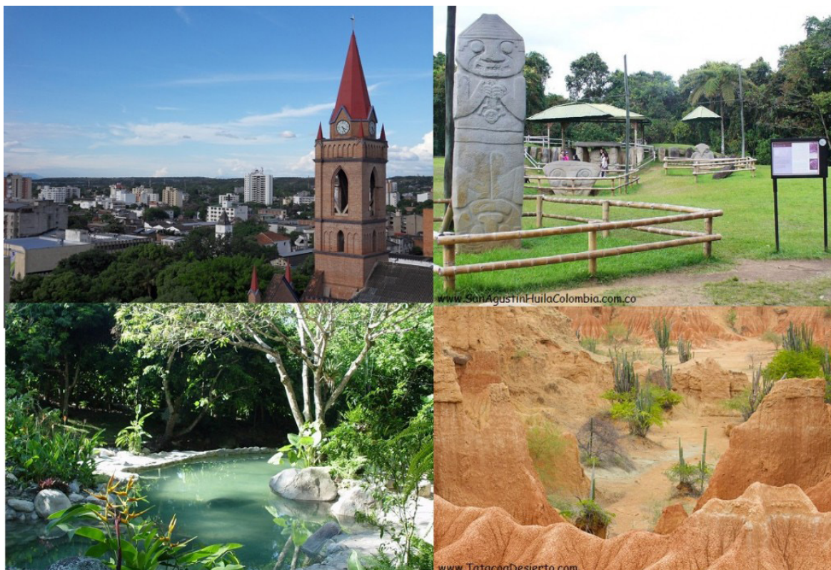
Las caravanas para conocer la región, iniciarán en Garzón, los días 8 y 9 de junio.

a conocer de lo que incluye esta estrategia. El documento lo firmó el gobernador del Huila, Rodrigo Villalba, con los alcaldes".