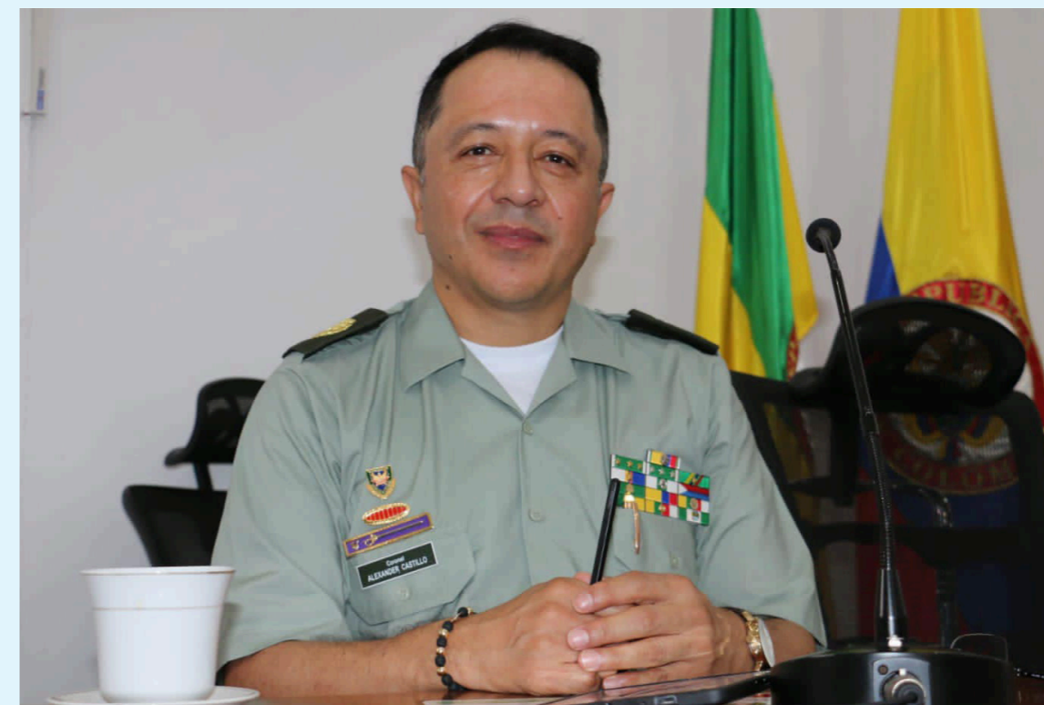
Presentación del Grupo de Operaciones Especiales (GOES) de la Policía Metropolitana de Neiva, un esfuerzo para fortalecer la seguridad en la capital del Huila.