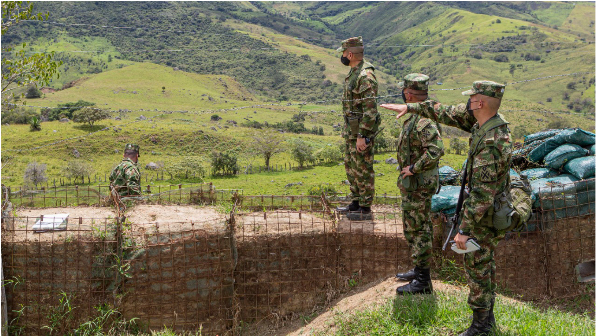
Solicitan al Gobierno Nacional, más unidades militares para el Huila, ante conflicto en el Cauca.

■ Tras la suspensión de los diálogos entre el Gobierno Nacional y el autodenominado Estado Mayor Central en el departamento del Cauca, y el recrudecimiento del conflicto armado, desde la Gobernación del Huila, solicitan más personal militar que permita blindar las fronteras de la región.