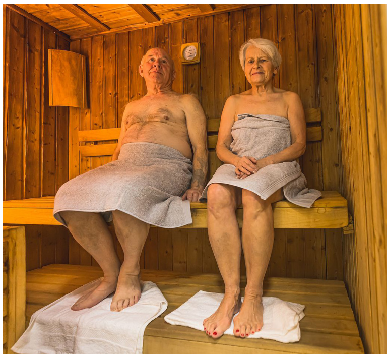
Foto 2: Las sesiones de hipertermia presentan descensos significativos en síntomas depresivos.

dicamentos de EE. UU. (FDA) autorizó la comercialización de Otsuka America Pharmaceutical, Inc., Rejoyn, una aplicación terapéutica digital recetada para teléfonos inteligentes para el tratamiento del trastorno depresivo mayor (TDM). Rejoyn es un complemento de la atención ambulatoria administrada por el médico para pacientes adultos mayores de 22 años que toman medicamentos antidepresivos, destinados a reducir los síntomas del TDM, según el comunicado de Otsuka. “A diferencia de las aplicaciones de bienestar, Rejoyn es un dispositivo médico autorizado por la FDA para su prescripción por parte de un profesional de la salud”, dicen en el comunicado.