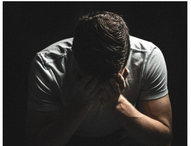
La terapia de calor ayuda a regularizar la temperatura corporal en personas con depresión.

La depresión es un trastorno emocional que causa un sentimiento de tristeza constante y