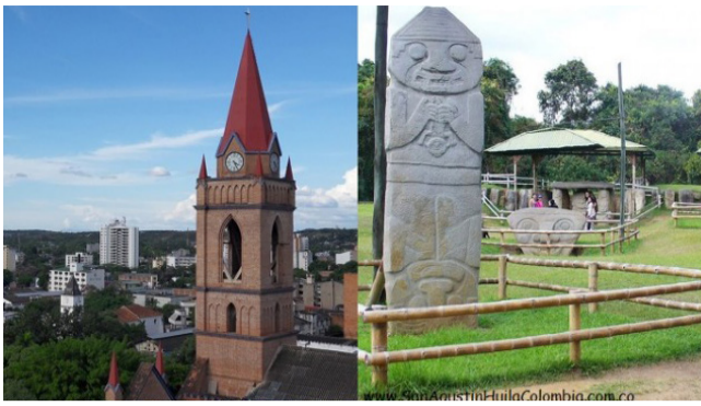
El Huila embellecerá sus municipios ■ HUILA 6-7