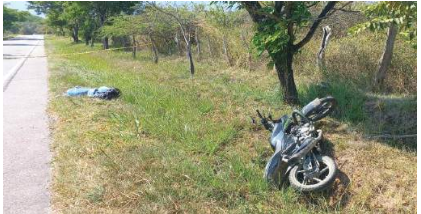
El siniestro ocurrió en la vía Hobo - Gigante.

El joven habría perdido el control de la motocicleta en circunstancias que están por esclarecerse, saliéndose de la carretera.