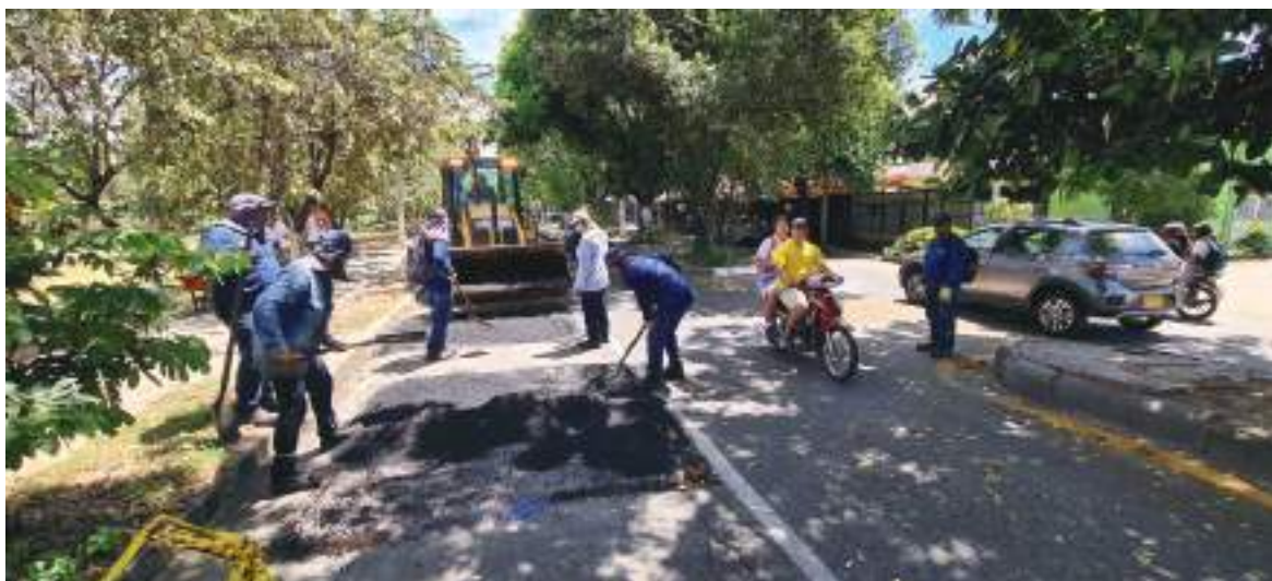
En diferentes sectores de la ciudad avanzan los trabajos de reparcho de las vías que más lo requieren.

Para concluir, el Director mencionó que, “primero le queremos pedir disculpas a las personas porque sabemos que esperaban mucho más, pero manejamos muy pocos recursos y eso lo hemos optimizados. Estamos programándonos para hacer presencia en el mayor número de sectores posibles, en el menor tiempo posible”, concluyó.