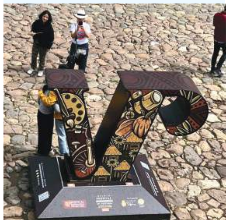
En esta oportunidad, abrirán en simultáneo 3 escenarios completamente equipados para brindar una buena experiencia para la tertulia y el debate.