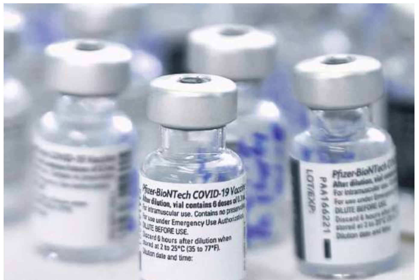
En especial las vacunas en riesgo de vencerse son la Pfizer

Finalmente, inició en que se debe realizar una campaña pedagógica más grande para la vacunación contra el covid-19, porque el virus todavía está presente, genera contagios y la muerte. Por tanto, seguirán haciendo un seguimiento a la pandemia de la Covid-19 para determinar en las próximas semanas la posible declaración de endemia si el comportamiento de la enfermedad sigue estable.