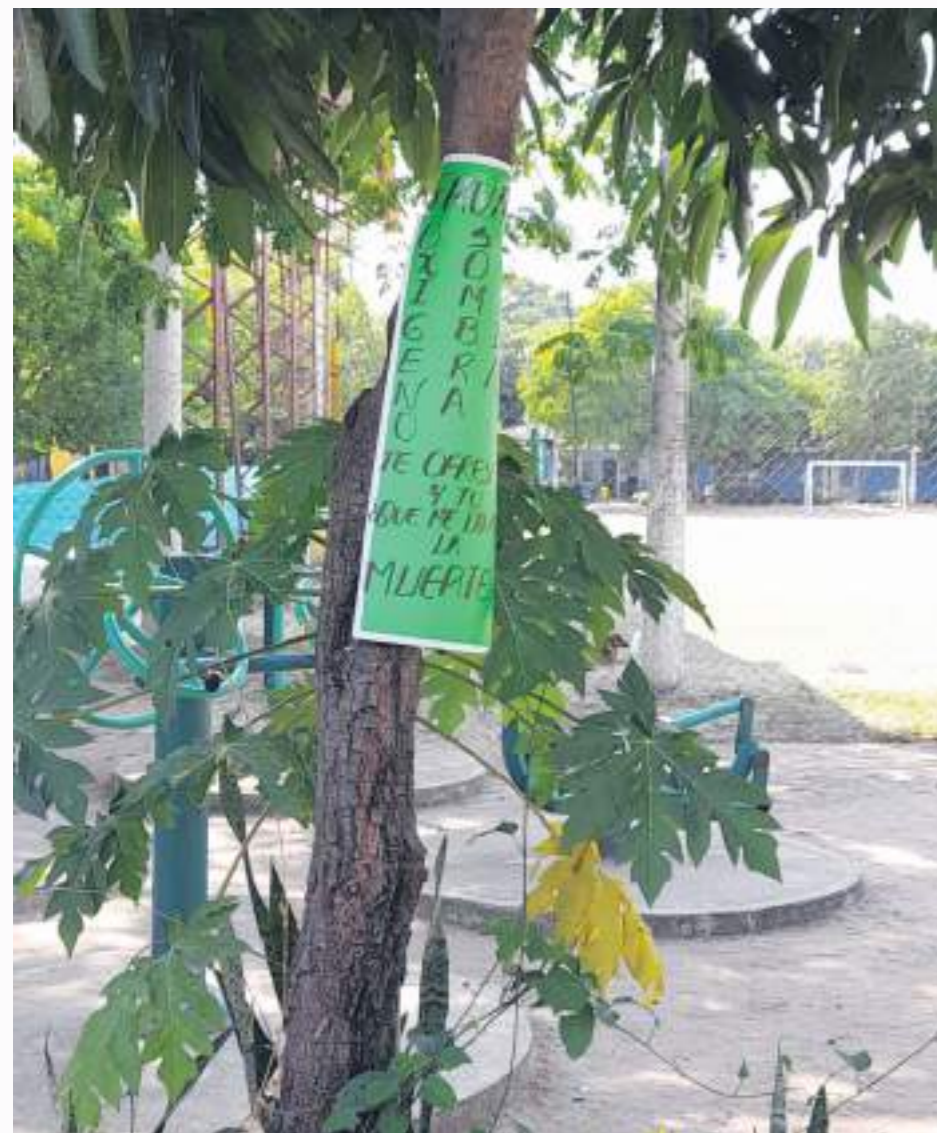
Pancartas como esta se ven en los árboles que quieren proteger.

DIARIO DEL HUILA, COMUNIDAD Por: Hernán Guillermo Galindo M