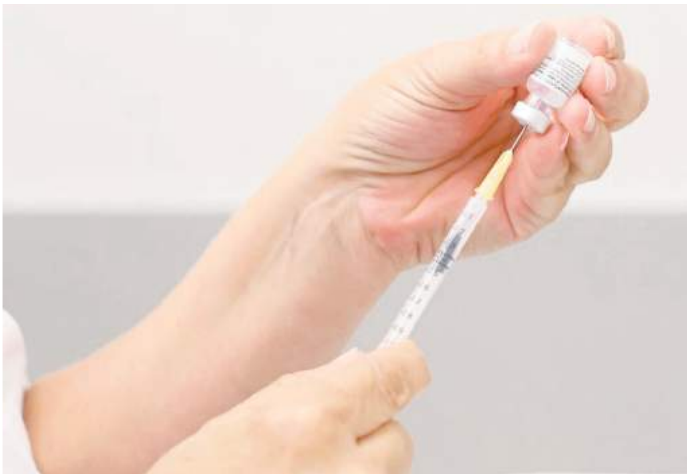
En el Huila cerca de 9.000 vacunas de Pfizer están a punto de perderse.

■ De las 50 mil dosis de vacunas que hay distribuidas en el Huila por lo menos cerca de 9.000 están a punto de vencerse. La situación tiene en alerta a la institucionalidad dado que esto obedece a la baja vacunación registrada durante los últimos días. El panorama a nivel nacional tampoco parece ser muy alentador pues según la ministra de Salud, en el país se tienen 873 mil dosis de vacunas próximas a vencer en el mes de septiembre.