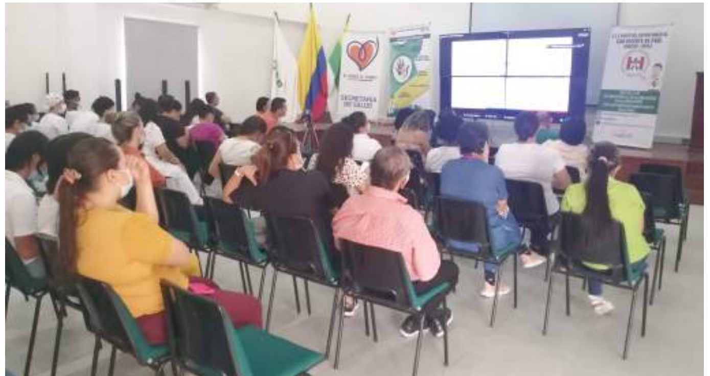
Las IPS de primer nivel y segundo nivel, recibieron orientación sobre cómo abordar las complejas problemáticas de trastornos mentales que están incrementándose en esta temporada en el departamento del Huila.

El incremento de los problemas y trastornos mentales se presenta a nivel nacional y mundial producto de la pandemia, de todas las crisis sociales que está viviendo la humanidad.