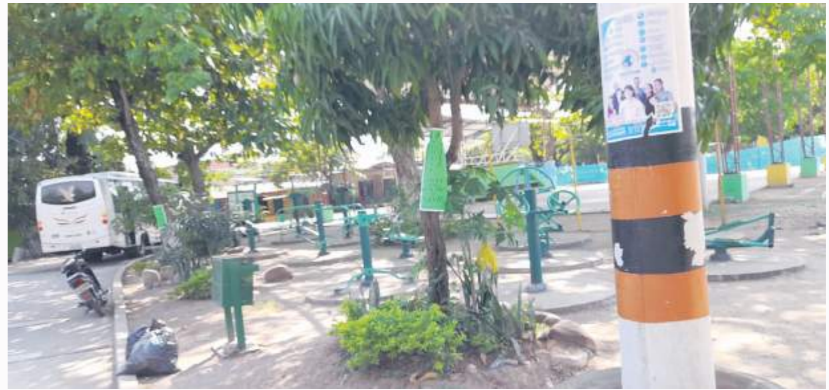
Aspectos del parque a intervenir.

"Por eso nos hemos parado en la raya, pues siguen para el puerto del remolino en donde hay otros árboles frondosos que pretenden tumar, nosotros no necesitamos que nos inviertan en cemento, queremos que se respete el medio ambiente, que se dé prioridad a la vegetación que es lo que necesitamos en esta comunidad", sostiene otro de los protestantes.