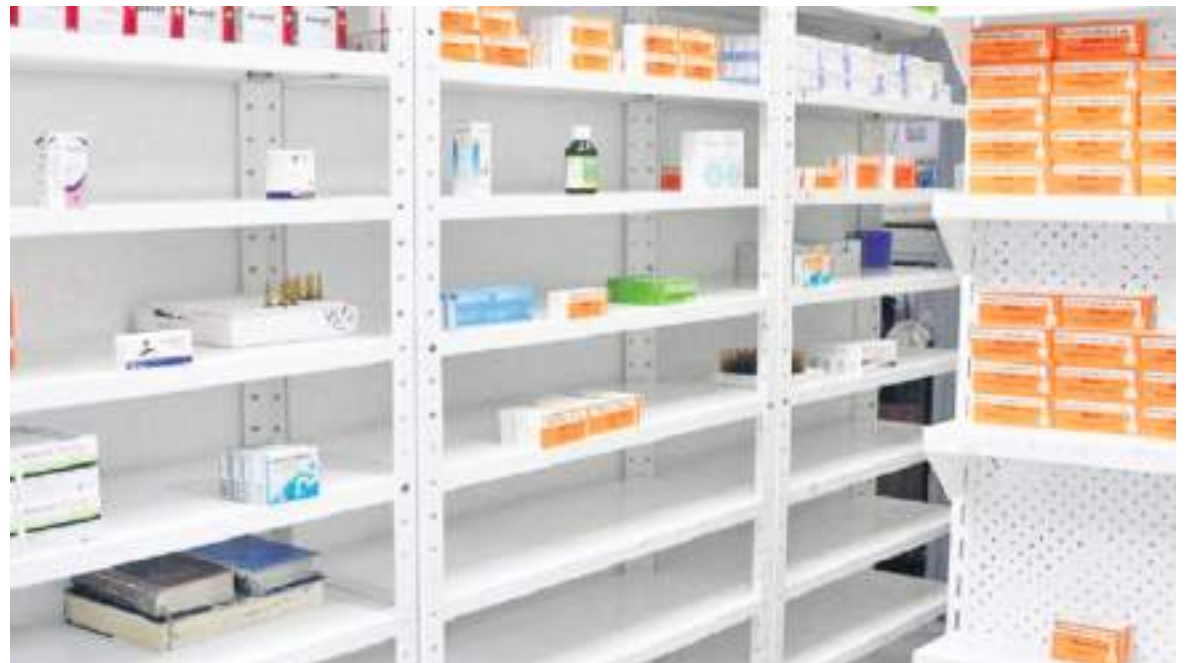
Como solución ante esta problemática, la industria nacional está ofreciendo contribuir para la producción de estos medicamentos, incluyendo algunas universidades que tienen procesos de producción.

Conforme a lo investigado, en la carta entregada hay una larga lista de medicamentos que se usan con frecuencia en los hospitales y que hoy día escasean, como: acetaminofén, amoxicilina, diclofenaco, diripidona, esomeprazol, losartán, carbonato de calcio y cloruro de potasio.