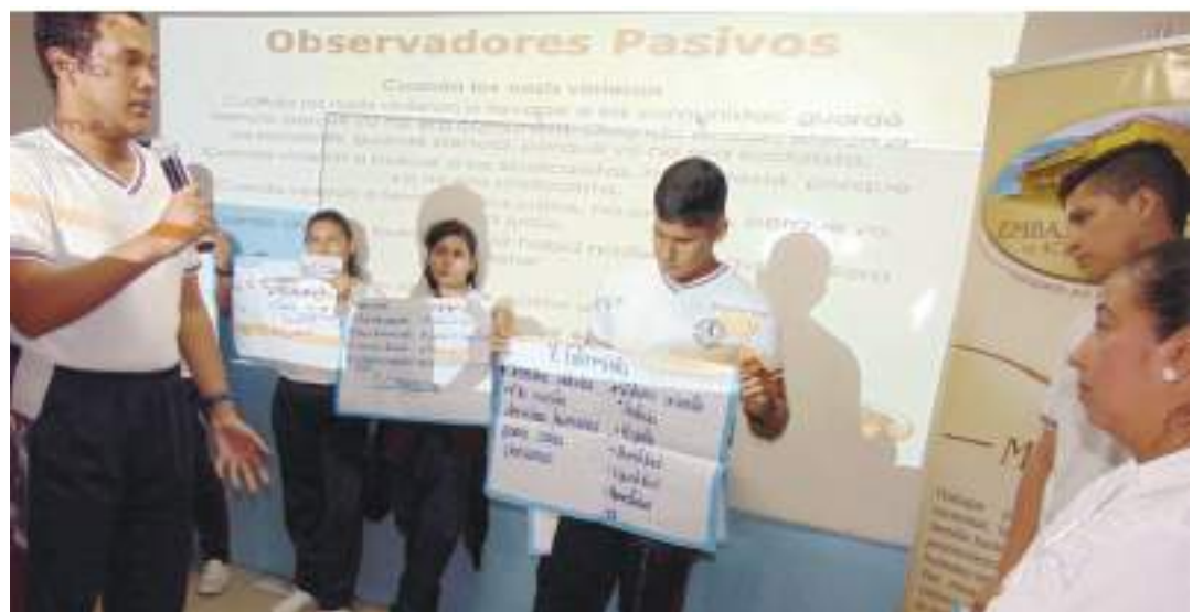
Los estudiantes tienen la oportunidad de preparar y exponer sus ponencias sobre la responsabilidad que tienen los jóvenes en su educación y protección integral.

El Teatro Parroquial de El Agrado será el escenario para el desarrollo de este Foro, que dará inicio hoy miércoles, 24 de agosto, desde las 9:00 de la mañana.