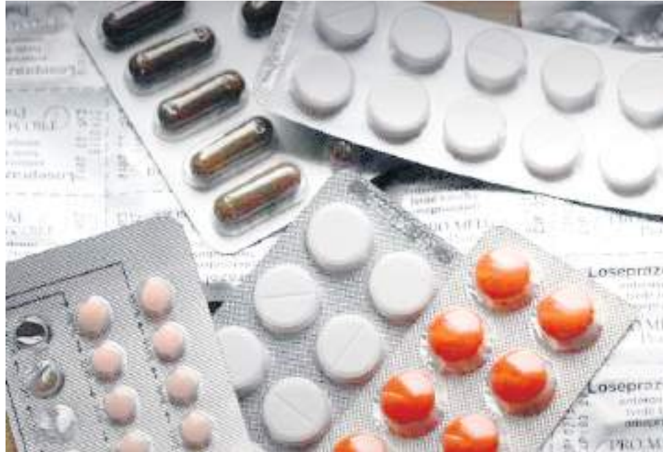
Las autoridades han identificado cinco causas del desabastecimiento de fármacos en el país.

“Mujeres, esta es una situación que está resuelta ya, prácticamente”, sostuvo la ministra, a lo que agregó que las marcas de medicamentos comerciales tan fuertemente consumidas, por una estrategia de marketing exitosa, son fácilmente reemplazables