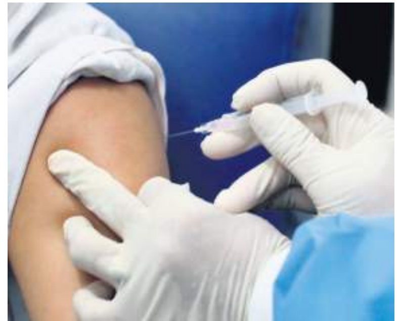
Mucha preocupación existe en el país dado la potencial caída en tasas de vacunación.

Actualmente, se trabaja en realizar una campaña pedagógica más grande para la vacunación contra el covid-19.