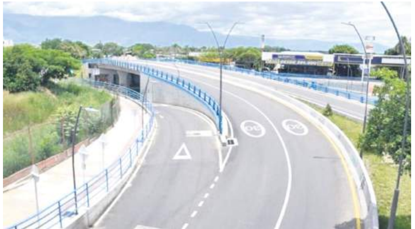
Cuentas a medias y faltante de firmas sería el “rollo” que tiene embargada la cuenta de SETP.