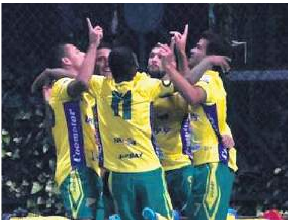
Huila celebró como visitante en la fecha ocho del Torneo

El Huila retornará a Neiva para recibir el próximo martes a Llaneros en la novena fecha del torneo, con la misión de recuperar los buenos resultados en condición, de local, nota que está pendiente en los auriverdes en este Torneo. Los capitalinos serán visitantes ante el Bogotá.