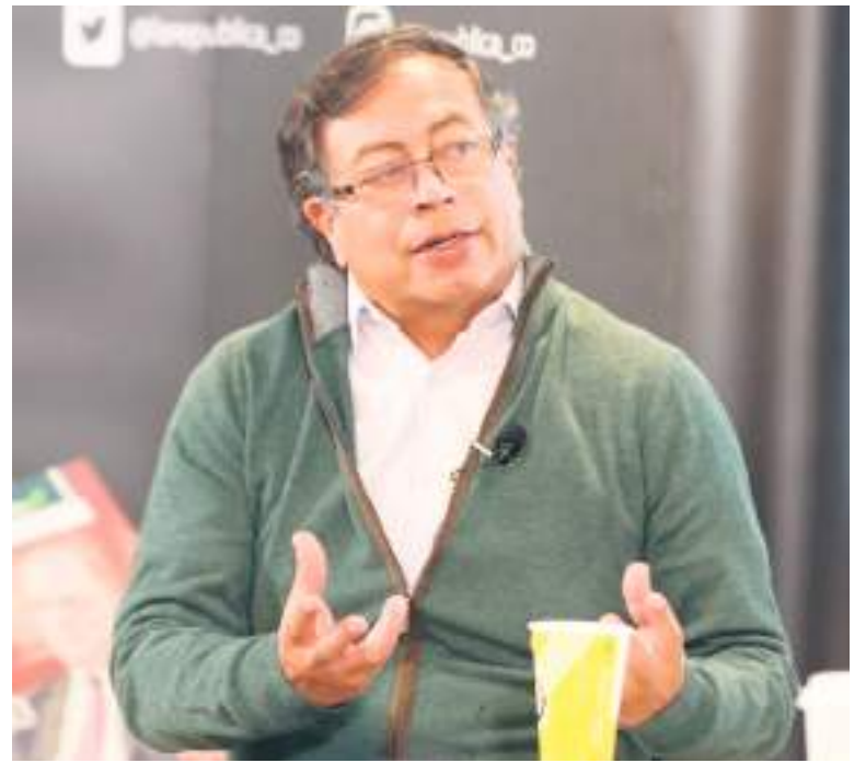
Gustavo Petro, presidente de Colombia.

Propuso definir una región que cuente con autonomía, lo que le permitiría tener mayor eficacia en el funcionamiento de la institucionalidad, así como priorizar las realidades culturales y económicas de sus habitantes.