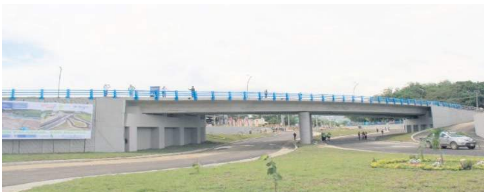
Son cerca de $3.000 millones los que faltan por consignar por parte de la Gobernación del Huila.

Al parecer, lo que podría pasar es que al no presentar la firma del interventor el Gobierno departamental no pueda girar los recursos pues no se confirma que las obras se hicieron en los términos establecidos.