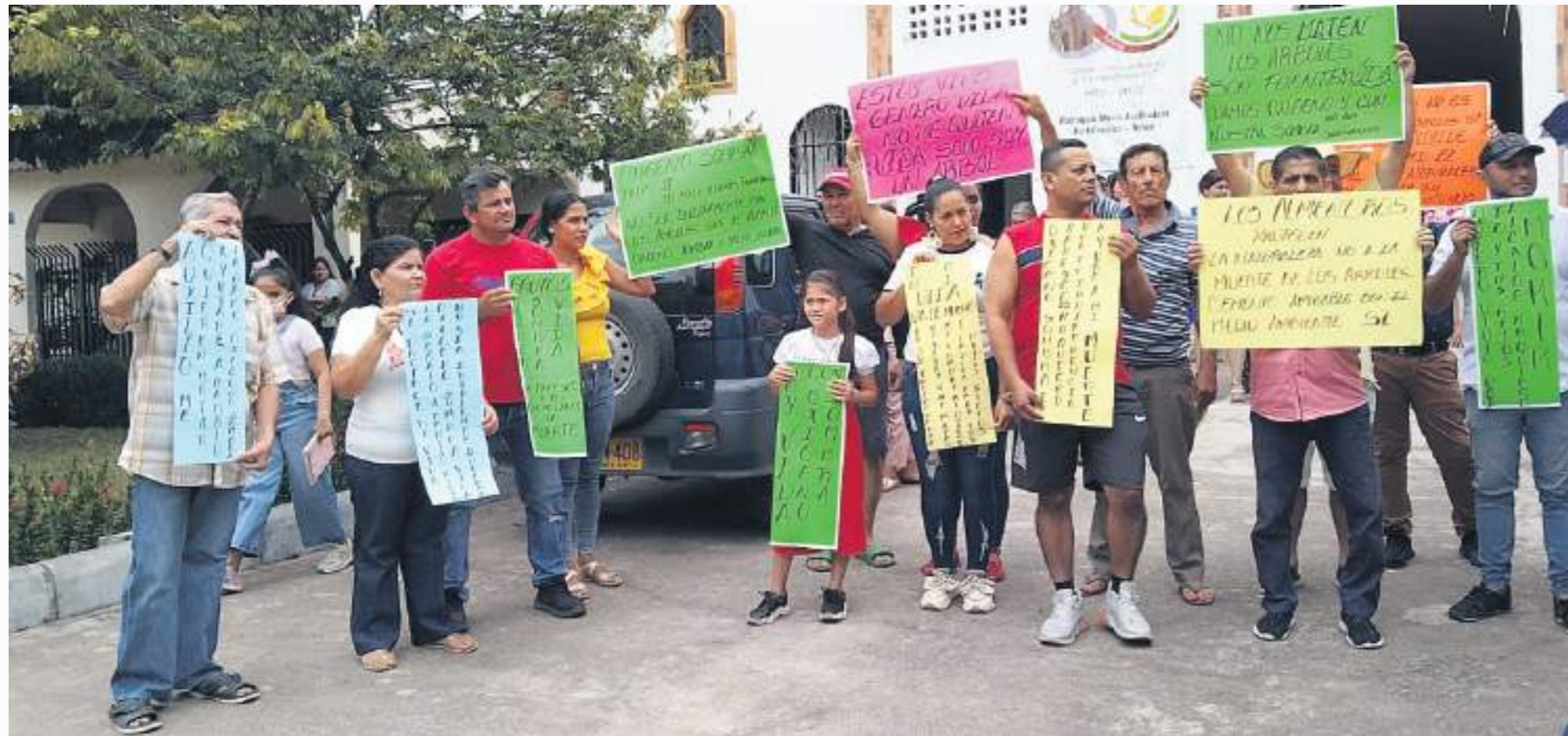
Habitantes de Fortalecillas piden que no les talen los árboles.

Los habitantes del Corregimiento de Fortalecilla se lanzaron de nuevo a las calles para llamar la atención, en esta oportunidad por lo que consideran una falta de socialización de la 'ruta de la achira', que ha significado la tala de árboles. Según manifiestan, eso va en contra del propósito turístico que tiene el proyecto.