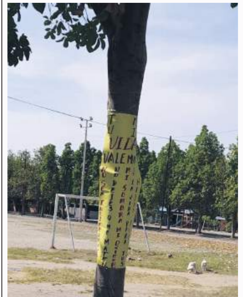
Vista de la zona donde se realiza el proyecto, desde el costado norte.