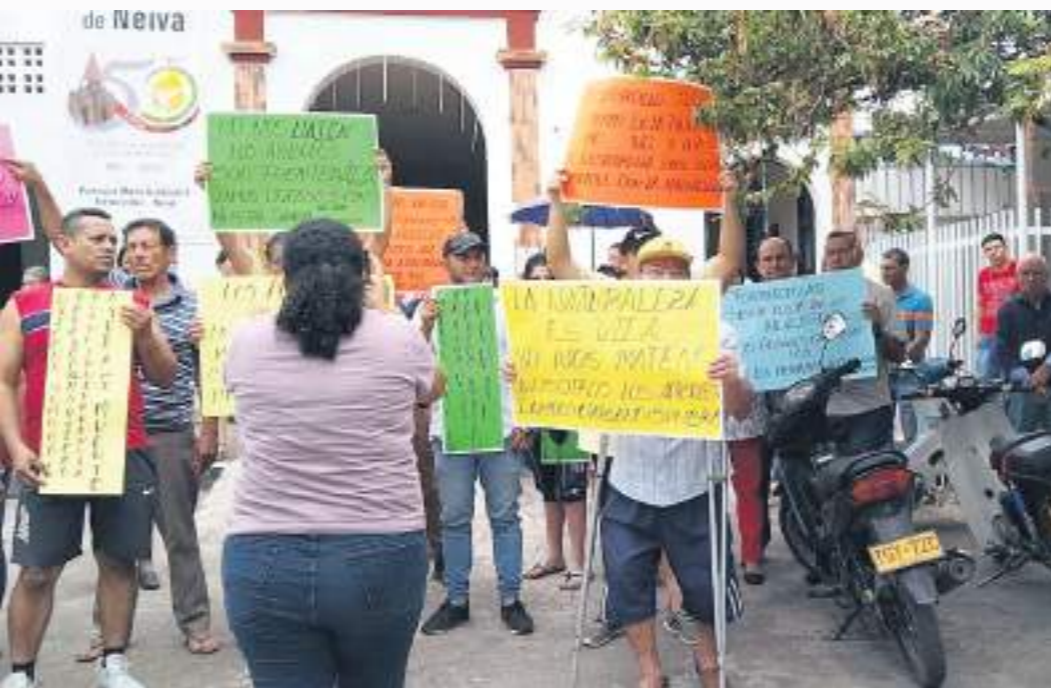
Que se respete el medio ambiente, piden los protestantes.

Ante las inquietudes que se están presentando por parte de la comunidad, desde la administración Municipal se indicó que no se realizarán acciones que vayan encontrando del Medio ambiente o afecten el inventario forestal del Corregimiento de Fortalecillas.