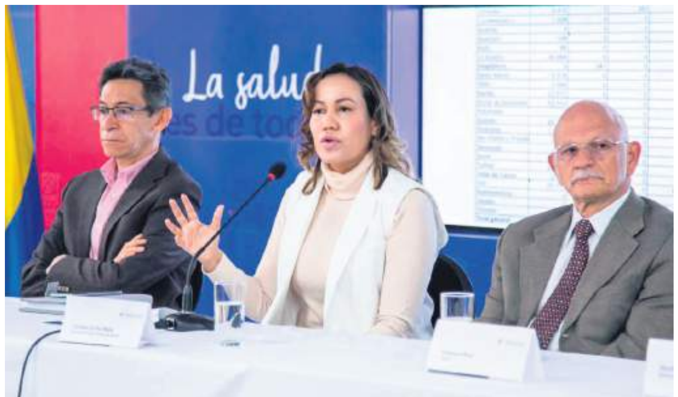
En Colombia hay 873 mil dosis de vacunas próximas a vencer, indicó la Ministra de Salud.

Así las cosas, manifestó que, desde la Secretaría de Salud Departamental, siempre han insistido en la importancia de mantener no solamente las medidas de bioseguridad sino también avanzar en las coberturas de vacunación.