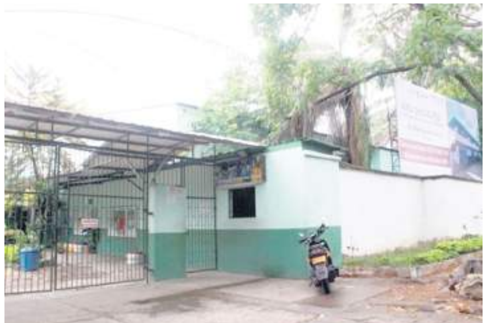
En materia de infraestructura educativa se espera que se puedan realizar inversiones que garanticen la óptima educación de los menores de edad.

Ayer se conoció que se adelantó una reunión para evaluar este tipo de inversiones en compañía de la Personería y distintas personas que han estado atentos a la debida inversión de los recursos, buscando que cada uno llegaran a las destinaciones correspondientes, donde se evidenció, según los participantes, la buena voluntad de la secretaria para poder dejar en la ciudad un desarrollo educativo que garantice el acceso de todos los menores de edad a una educación de alta calidad la cual no es posible sin infraestructura física, que es lo que solicitó la Personería de Neiva.