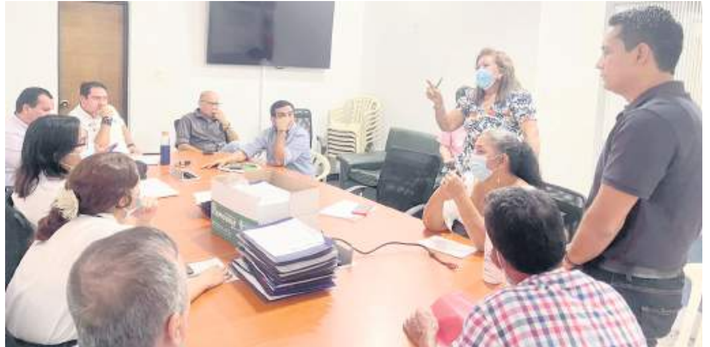
Reunión para evaluar inversión en materia educativa de la ciudad.

Hizo mención a algunas obras en convenio con Findeter y el FIE (Fondo de Instituciones Educativas) creado en el periodo de la exministra Gina Parody; donde “hay $28.000 millones de parte del Municipio de Neiva que hoy están un poco distorsionados y eso nos preocupa enormemente como personería porque estos recursos no se pueden perder”