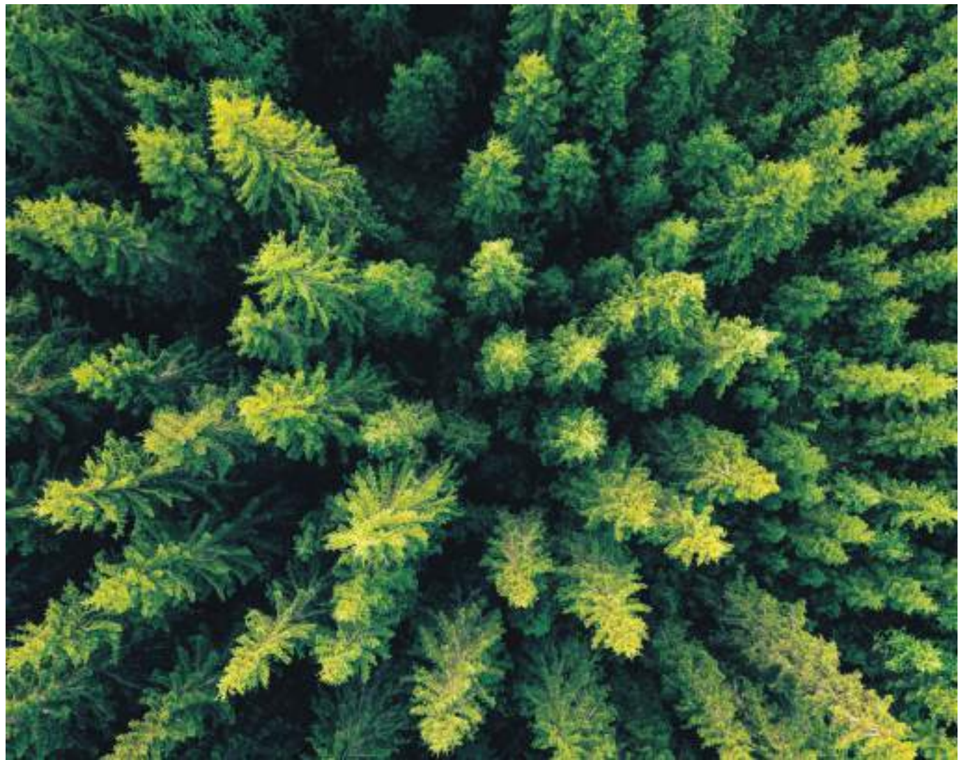
FEDEMADERAS trabaja en una nueva ley forestal para que Colombia pueda convertirse en el segundo productor forestal y de madera en Latinoamérica en las próximas tres décadas.

El objetivo es convertir a Colombia en el segundo productor forestal y de madera de la región en 30 años, generando beneficios para el país en la inclusión de la agroindustria rural, creación de empleo, aumento en las exportaciones, reducción de la deforestación, compensación de carbono, y participación en la matriz energética de fuentes renovables.