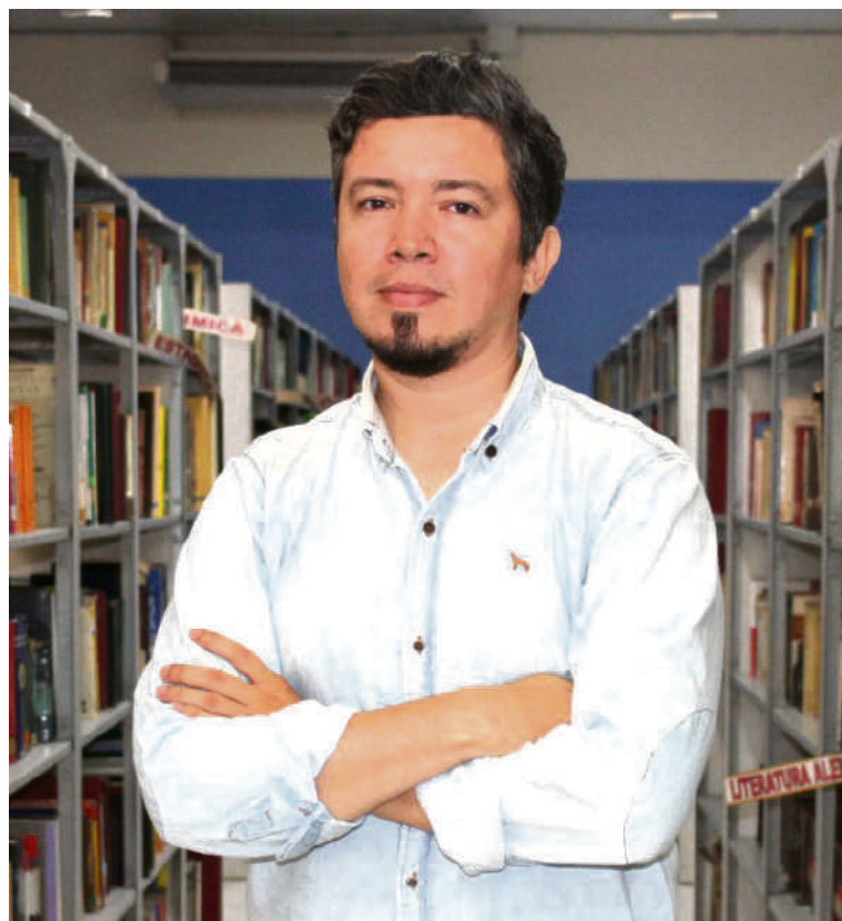
"Hay muchas personas trabajando en la ilustración y haciendo muy buenas cosas".

Qué bueno sería que en Neiva hubiese ferias, como en otras ciudades, para que los ilustradores muestren en trabajo que no es solo libros, sino también afiches, camisetas, agendas, fanzines, entonces esa es una movida muy interesante que está por nacer.