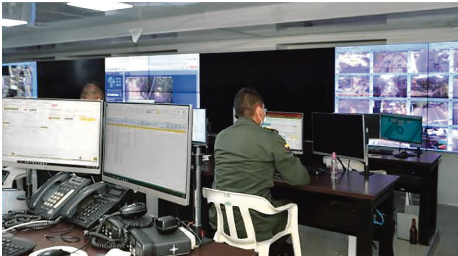
A siete días de terminarse el mes 12 del año aún no se percibe en un 100 % la operatividad de las cámaras de seguridad en Neiva.

Hay zonas estratégicas en la ciudad, que no están siendo vigiladas, es decir no hay un 'testigo' clave a la hora de una incidencia, se convierte en puntos ciegos y estratégicos para que los delincuentes puedan finiquitar sus fechorías, todo esto debilitando las herramientas que pue-