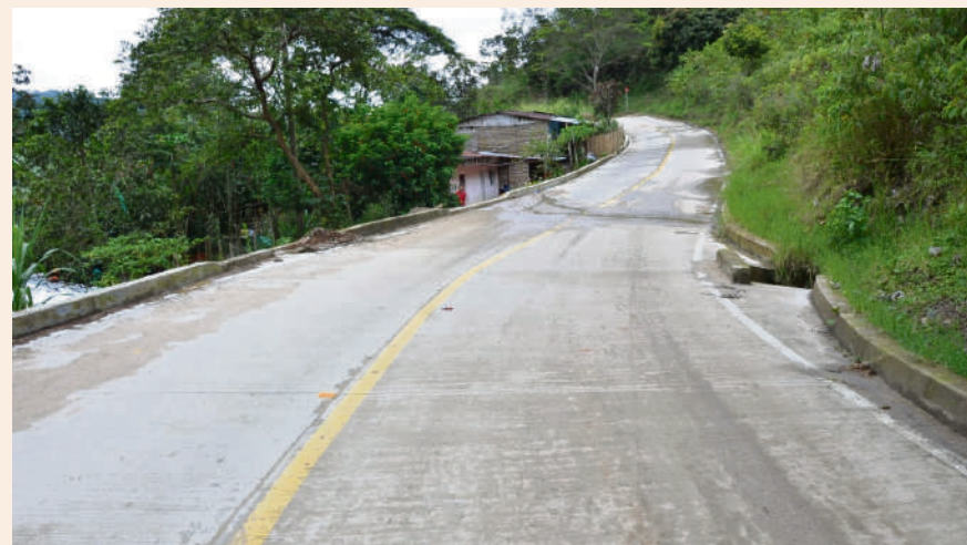
600 familias del Centro Poblado El Paraíso en Garzón hoy cuentan con su vía de acceso pavimentada.