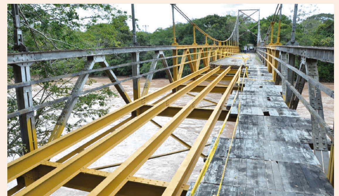
Luego de 15 años se realizan trabajos para la rehabilitación del Puente 'Guacas' que comunica a Garzón con Tarquí.

emitida por el gobierno "Huila Crece", por $38.139.811.851,00, permitirá que esta obra sea una realidad para los huilenses. Este tramo vial que permitirá la conexión entre el municipio de La Plata - Popayán y el Pacífico.