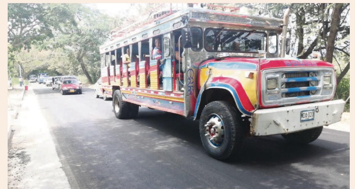
La pavimentación de la vía Palermo-La Y es una realidad.