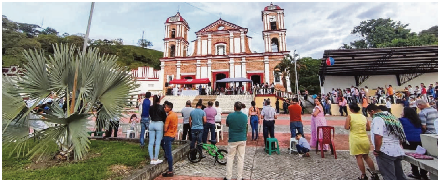
En cada Iglesia se celebra de distinta manera, pero dentro de los preceptos católicos.

El día 25 de diciembre es una fiesta de guarda, el Cristiano Católico debe asistir a la Santa Eucaristía bajo pecado grave, el 25 de diciembre o el día 24 ya cumple con precepto de la santa eucaristía, el 25 es fiesta de guarda, no un festivo como se dice ahora, es fiesta de guarda en toda la Iglesia universal, el que no participe como debe ser, está cometiendo pecado grave, porque no participa en esta fiesta en la que celebramos el nacimiento de nuestro señor Jesucristo.