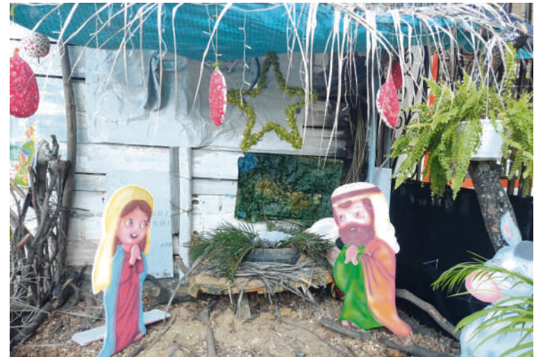
La navidad es la celebración del nacimiento de Jesús.

La celebración de la Navidad es una fiesta de tradición católica por excelencia, por lo que se espera en los países del hemisferio norte en donde viven la mayoría de los cerca de 1.272 millones de personas que profesan esta religión. Colombia no es la excepción, ya que siete de cada diez colombianos son católicos. En otras congregaciones religiosas de origen cristiano igualmente se celebra la navidad.