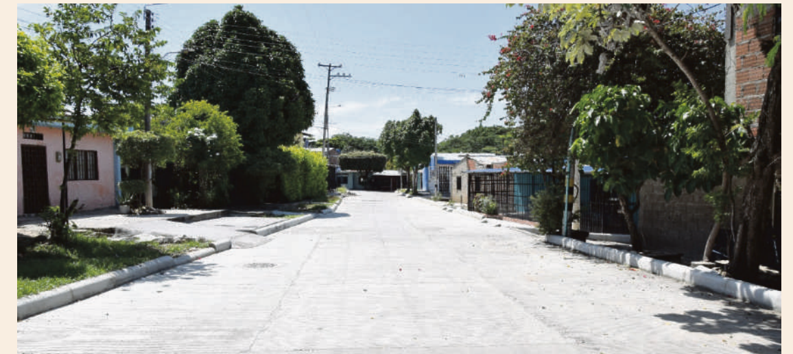
Lista para ser entregada la pavimentación de la calle 82 del barrio 'Eduardo Santos' con la adición de recursos de cerca de $1.900 millones.

La resolución de adjudicación del contrato de ejecución 630