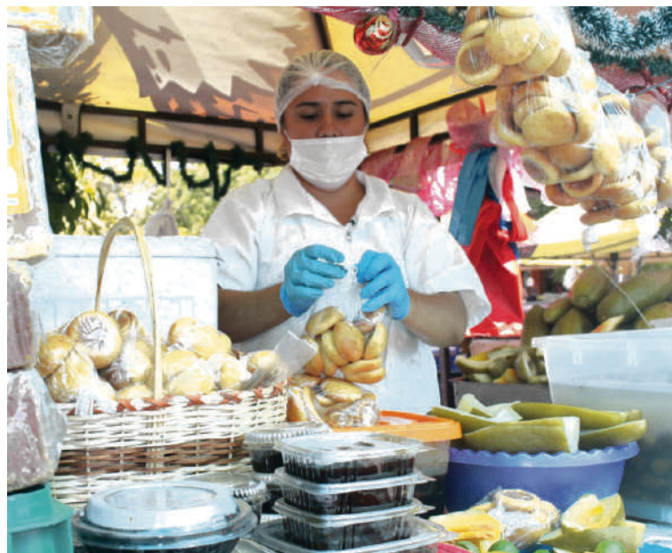
Son familias que durante años se han dedicado a preparar el dulce tradicional.

La gente pide de todo, lleva Nochebuena preparada por que no tiene tiempo para dedicarse a melar y armar el dulce, otros