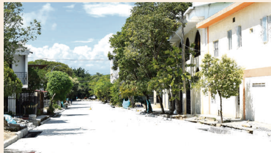
La obra de pavimentación vial de cerca de 2 kilómetros en el barrio Álamos, se realizó con recursos adicionales por más de $1.800 millones, por parte del gobierno "Huila Crece".

La vía Palermo - La Y, donde se realiza la rehabilitación de 2,7 kilómetros, en 28 tramos, donde se invierten más de $3.400 millones. En la