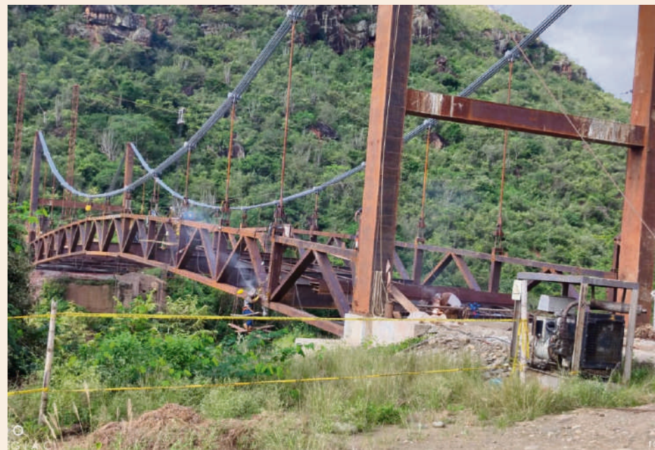
La obra del puente colgante, Las Delicias sobre el río Cabrera que une a los municipios de Baraya en el Huila con Alpujarra en el Tolima, inicialmente estaba valorada en $5.300 millones, pero el gobierno "Huila Crece" le adicionó $2.800 millones. En la actualidad este es un 90% su ejecución.

Desde la posesión del gobernador del Huila, Ingeniero Luis Enrique Dussán López, se ha buscado terminar la serie de proyectos, que se habían planteado desde gobiernos anteriores, pero que requerían reforma y adiciones presupuestales que han superado los $700.000 millones para llevarlos a feliz término. En el caso de la infraestructura vial, grandes obras están ejecutando y otros se encuentran en proceso de contratación.