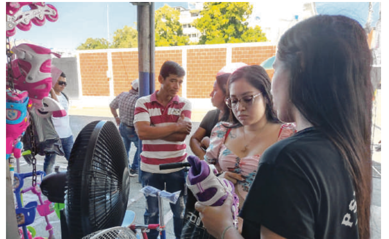
Son altos los gastos que han asumido los neivanos por esta época del año.

generados hasta el momento oscilan entre $500 mil y $4 millones. Lo anterior, dependiendo el número de familias, los planes que tienen