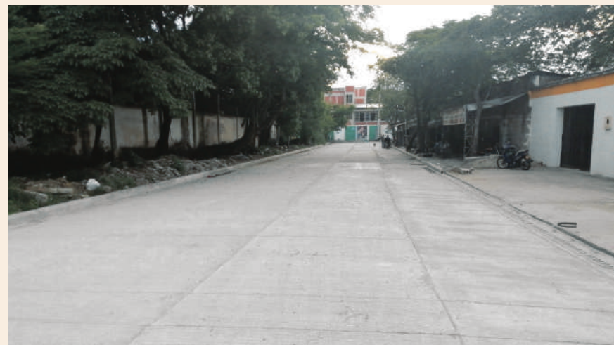
De trocha a una vía pavimentada es hoy la calle 18 en pleno corazón de Neiva, tuvieron que pasar más de 30 años para que fuera una realidad.

vía que conecta a los municipios de Garzón – El Agrado y El Pital, se realiza la rehabilitación vial de un kilómetro más 800 metros de vía con una inversión que supera los $3.600 millones y se va a iniciar la vía Suaza - Gallardo para realizar la pavimentación de 1,5 kilómetros por un valor de $3.450.118.172.