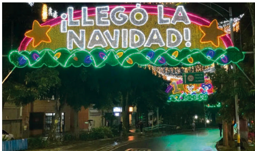
Imagen del día

La Navidad es una festividad religiosa en la que los cristianos conmemoran cada 25 de diciembre el nacimiento de Jesucristo. La palabra Navidad, como tal, procede del latín nativitas que significa 'nacimiento'. Este término también se utiliza para referirse a la época navideña, periodo que en algunos países abarca desde el Adviento, un periodo de cuatro semanas que precede a la Navidad, hasta el Día de Reyes.