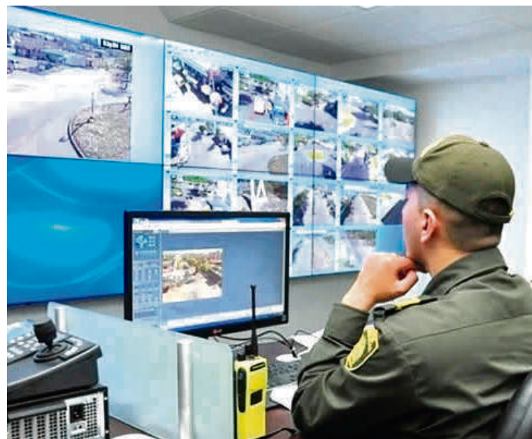
Neiva requiere de un sistema de cámaras más amplio.

Pero esta situación no solo se está presentando en el centro y microcentro de la ciudad, sino