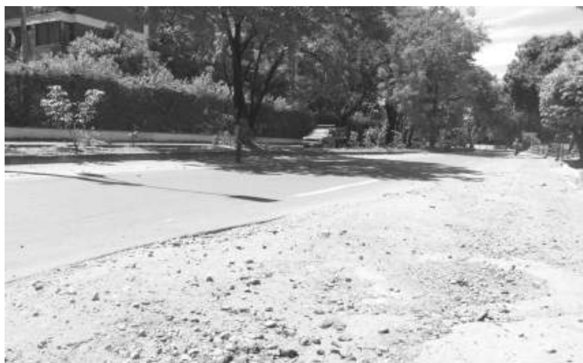
La vía que dicen quedó a medias, ya ha causado accidentes.

carril, mientras se ejecutan los trabajos. Los trancones se presentan de manera permanente. A esto se suma el mal estado en el que están dejando la vía, hecho que además genera contaminación por el polvo que se levanta y cuando llueve puede generar