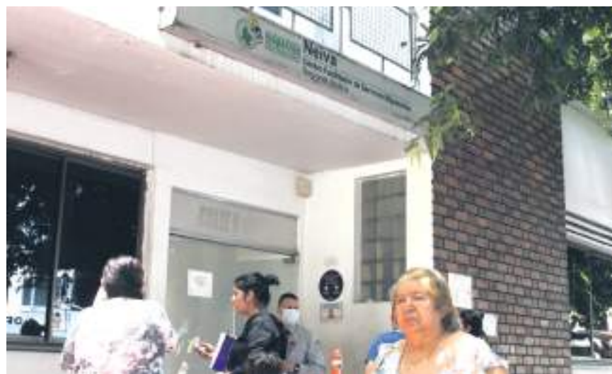
No solo venezolanos llegan hasta la oficina en Neiva para preguntar sobre temas de legalización migratoria.

» Tenemos una base de datos de una población caracterizada en el Huila de, 12591 migrantes y hasta el momento las cifras de regreso voluntario son bajas, no hay cifras altas, se han regresado. «