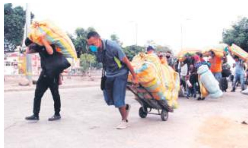
Se espera que estas sean imágenes del pasado

"Iban para Cali o Popayán, para Medellín, con la casa parroquial logramos que nos donaran alimentos, colchonetas para usar con mi familia, mis papás y hermanos pudimos ayudar a muchas familias, esto se fue crecido más por lo que vi la necesidad de venir a vivir a Neiva dónde básicamente he logrado hacer un pequeño convenio con una organización internacional que trabaja con la violación de derechos laborales y así llegar a tener un espacio físico donde podamos atender a esta población, tenemos sede en Neiva", cerró.