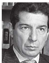
JOSÉ FÉLIX LAFAURIE RIVERA