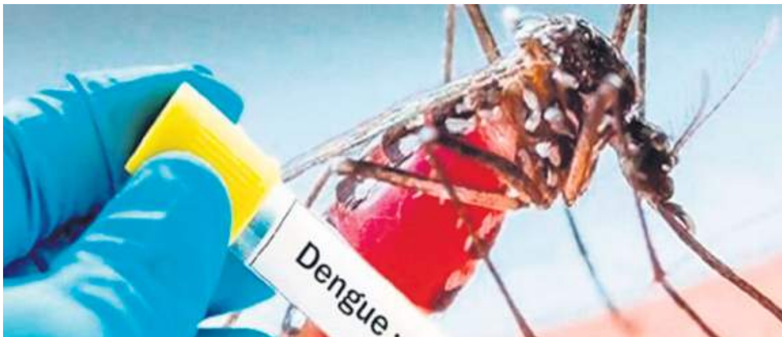
El dengue sigue rondando en las comunas de Neiva.

Para el caso de Neiva se registraron 573 casos de los cuales 402 dengues no presentan sig-