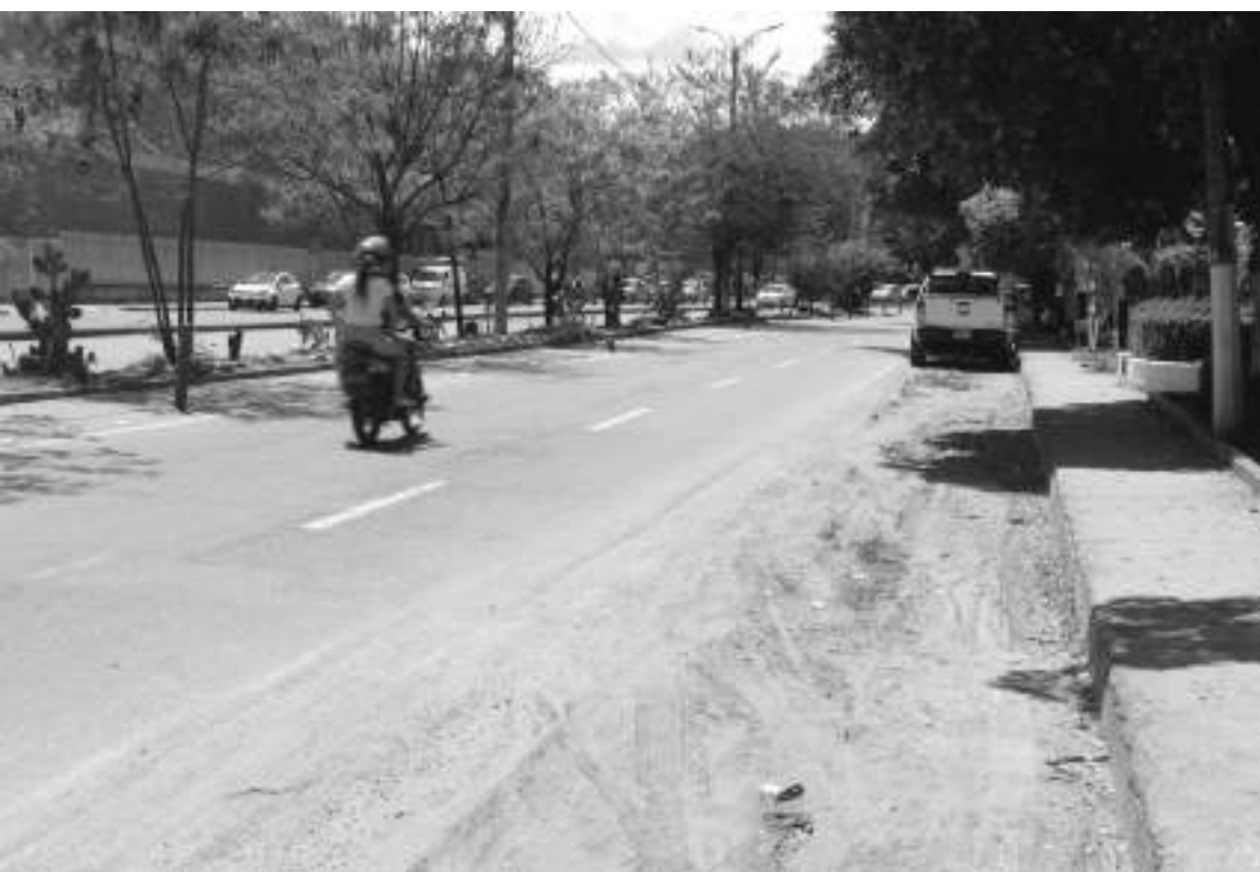
El mal estado de la vía causa polvareda que afecta a adultos mayores y niños con problemas respiratorios.

“Obras que son necesarias para la ciudad, por cuanto, una vez se finalicen se garantiza la optimización de los servicios públicos de acueducto y alcantarillado en términos de continuidad y calidad, como también el mejoramiento de la infraestructura de servicios públicos que registran niveles obsolescencia y deterioro físico de las redes”, concluyó la funcionaria.