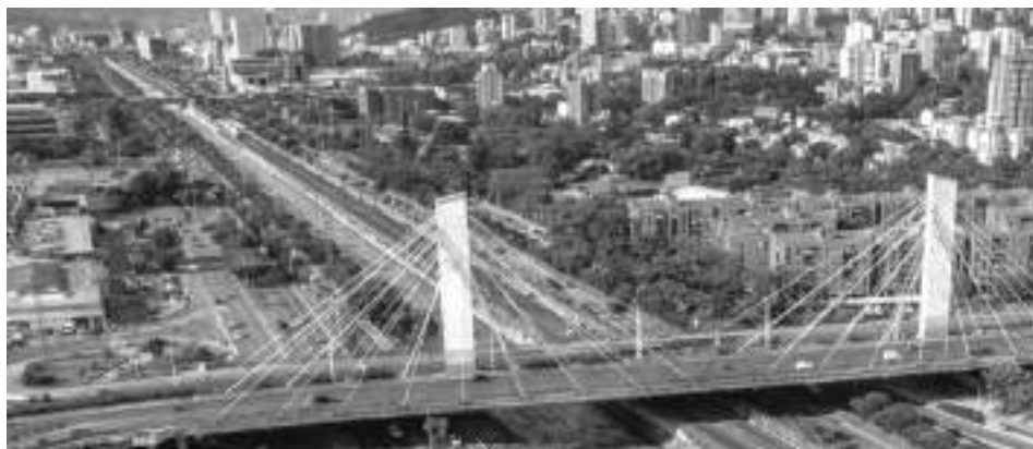
La ciudad de Cartagena, hasta el año 2019, era el segundo destino con mayor afluencia de visitantes internacionales en el país, después de Bogotá. Hoy día, luego de tres años y una pandemia, el título ha sido tomado por la ciudad de la eterna primavera: Medellín.