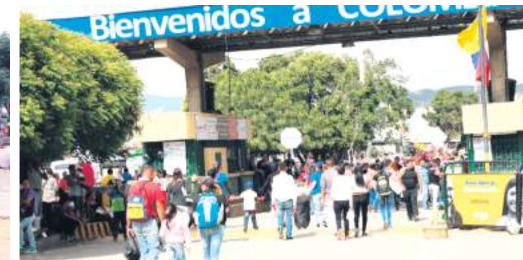
Frontera entre Colombia y Venezuela.