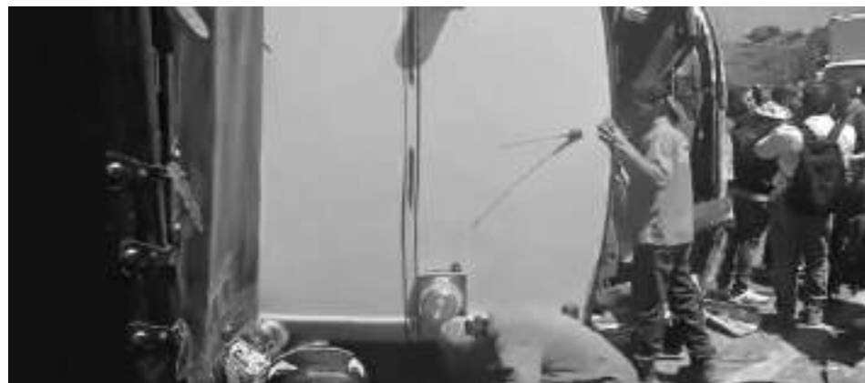
Un grave accidente se presentó este viernes en la autopista Medellín-Bogotá, donde una volqueta perdió los frenos y atropelló a un bus que llevaba pasajeros, como también varios carros particulares, dejó la suma de cerca de 20 heridos y un muerto.