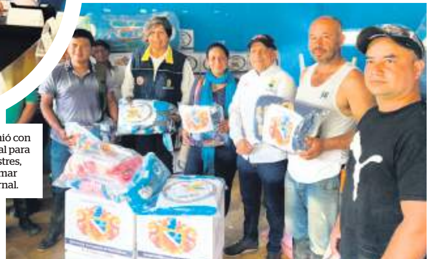
Entrega de ayudas humanitarias en La Plata y Villavieja.