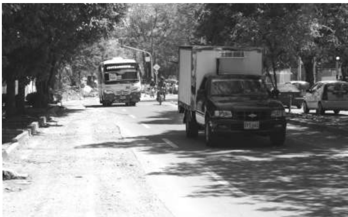
Así luce la avenida 26 a la altura de la 49 debido a los trabajos que se adelantan en la vía.

Una de las quejas recogidas esta semana por Diario del Huila, tiene que ver con las obras que se ejecutan por la avenida 26 en la comuna dos norte de la ciudad. Estos trabajos comenzaron en el sector de la Cruz Roja