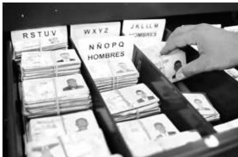
Aprovechó el momento para invitar a los ciudadanos a que reclamen sus documentos de identificación, dado que, en la actualidad, hay mucho por entregar.