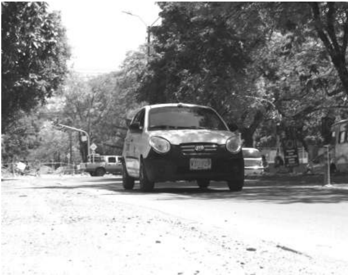
La vía la dejan a medias se quejan los conductores y residentes.

accidentes por lo liso de la superficie.