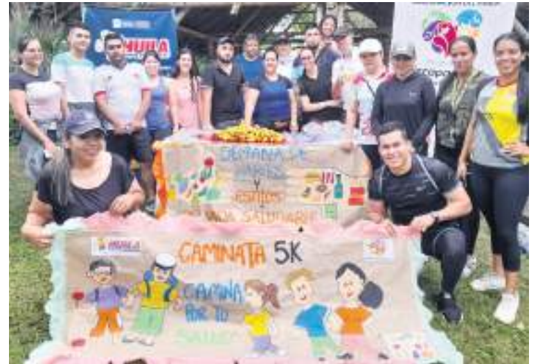
Cada vez se quiere impulsar más los hábitos de vida saludable.

Durante la semana se han gestionado espacios de encuentro con la comunidad en torno a juegos tradicionales que además de invitar a la