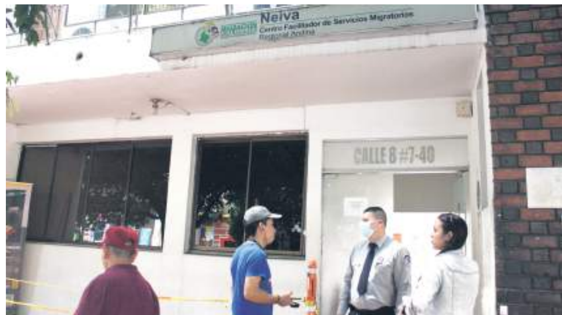
Migración Colombia es encargada de controlar quien está de manera legal en el país.

"Nosotros que trabajamos con la población grande en todo el departamento del Huila, conoce-