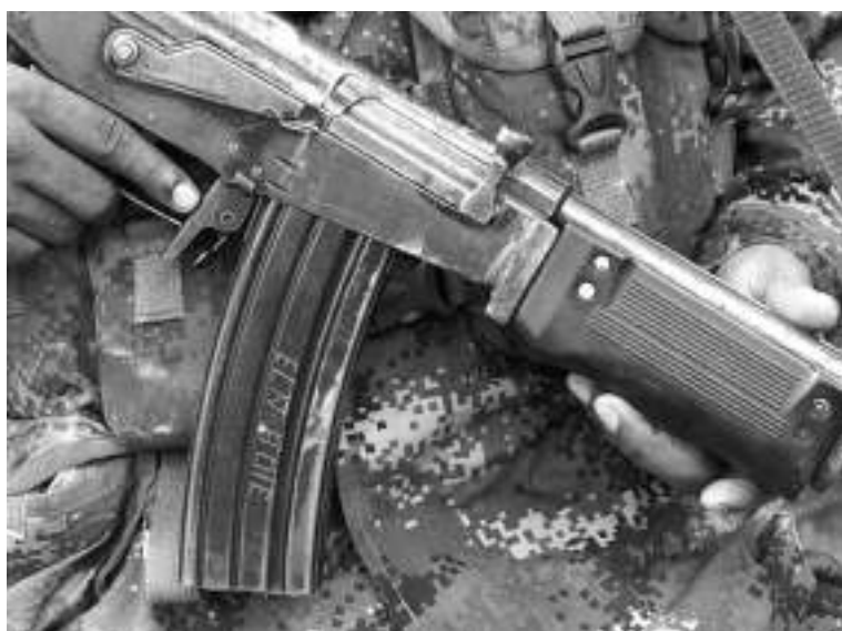
El presidente, Gustavo Petro, anunció que “en cuestión de días, también, se va a plantear un tema público: la posibilidad de un cese multilateral del fuego.

“Ya estamos en la antesala, es cuestión de días”, y aseguró que, “de hecho, ya ha existido contacto oficial de funcionarios del Gobierno, de los delegados a este tipo de tema, el alto Comisionado de la Paz, con miembros de disidencias. Es cuestión de días”, insistió.