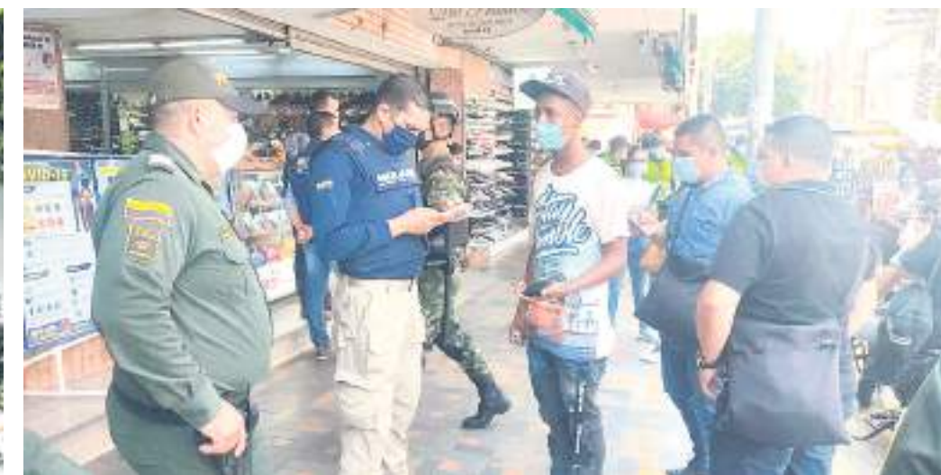
Controles de Migración en el Microcentro de Neiva.

mos que algunos han retornado de manera voluntaria a Venezuela, otros piensan con el tema de la reapertura, qué es una oportunidad para poder habilitar los pasos e ir a visitar a sus familiares" aunque también es la posibilidad para quienes no pudieron conseguir pasaporte en Venezuela puedan hacerlo.