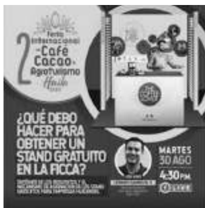
Llega una nueva versión de este importante evento para el departamento.

Esta realidad movió a la administración departamental a promover y realizar la primera Feria Internacional de Café, Cacao y Agroturismo en septiembre de 2021 a la que asistieron 11.000 visitantes y se benefició a 1.600 productores.