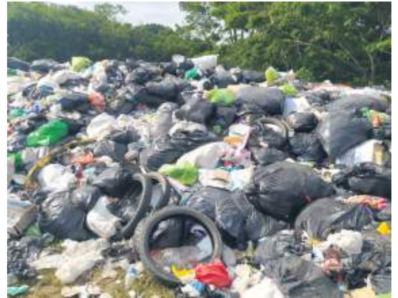
Graves problemas de contaminación y salud pública podrían presentarse en el municipio de Guadalupe.

Denunció también que, “resulta que pudimos corroborar que la PTAR no estaba funcionando