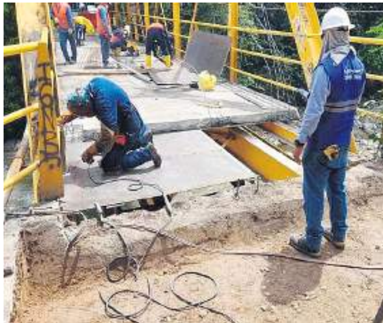
Rehabilitación de la malla vial en el municipio de Rivera

El departamento del Huila, dados los antecedentes por fenó-