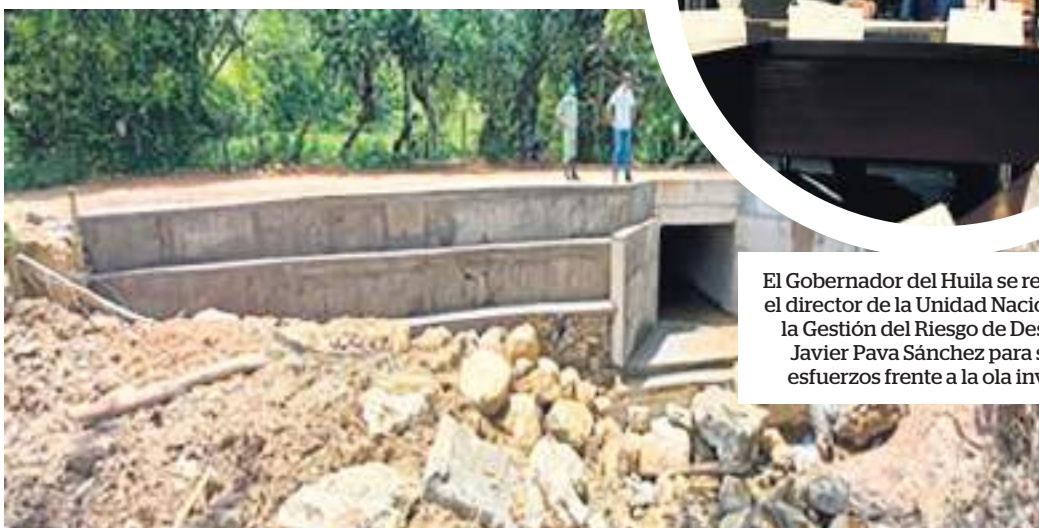
Rehabilitación en la Vía del Municipio de Yaguará