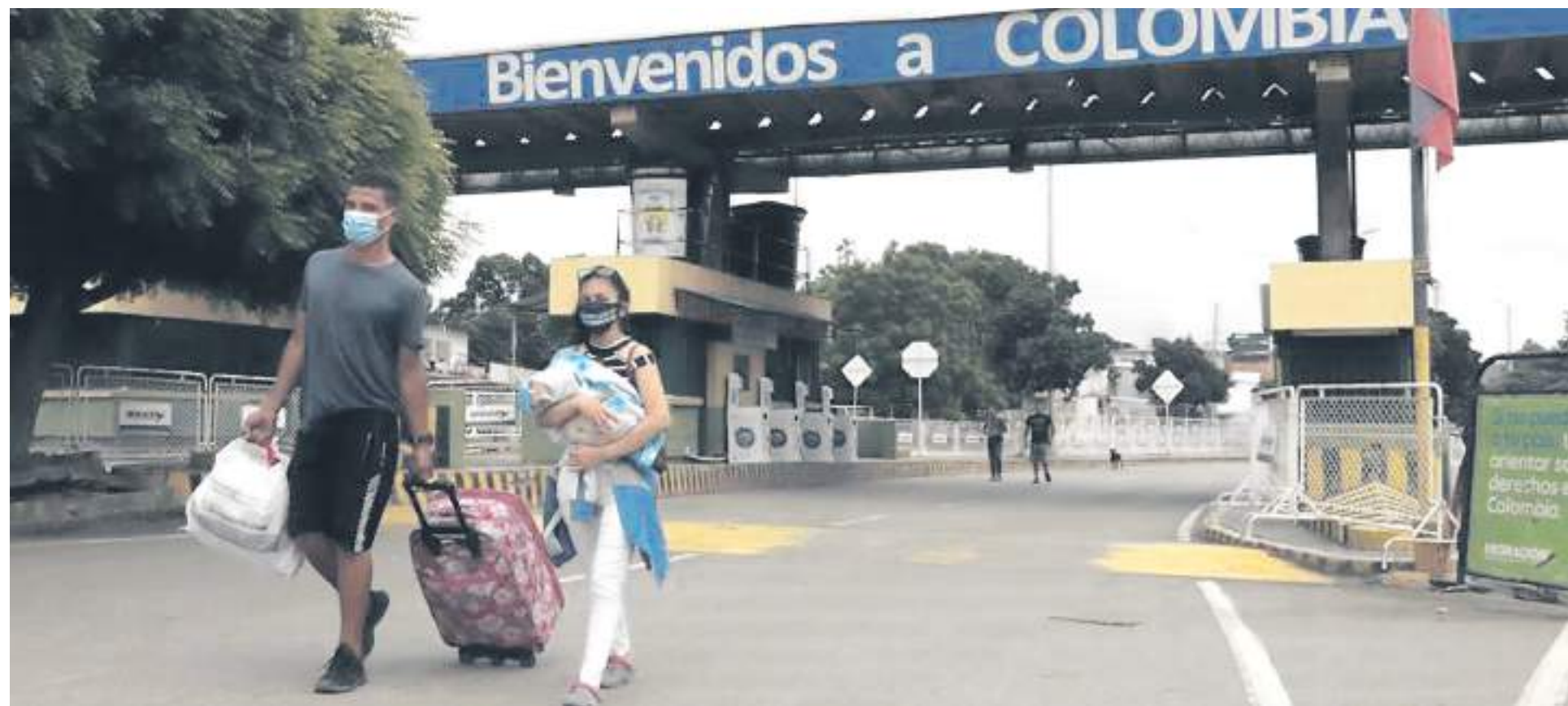
Colombia y Venezuela reabren su frontera común este lunes 26 de septiembre.

El anuncio hecho por los presidentes, Gustavo Petro y Nicolás Maduro, de reabrir la frontera común, generó una reacción positiva en los venezolanos que residen en el Huila. Para muchos será la oportunidad de obtener una visa y legalizar su estadia en territorio colombiano. Otros lo ven como una oportunidad de intercambio comercial y hay quienes dicen que es una posibilidad de poder volver a ver a sus familiares.