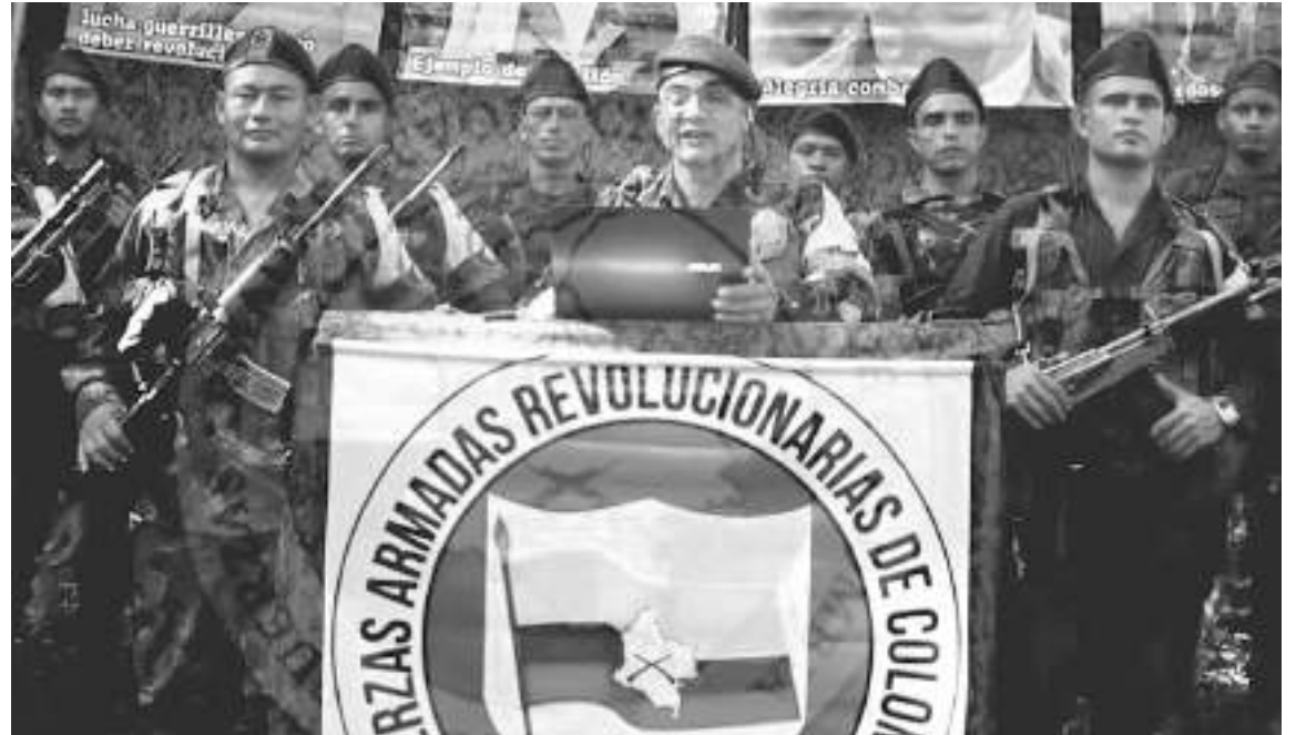
‘Iván Mordisco’, ordenó a sus unidades de disidencias de las FARC evitar enfrentamientos “siempre y cuando no sean atacados”,

“Sabemos que nos enfrentamos a enemigos poderosos y son