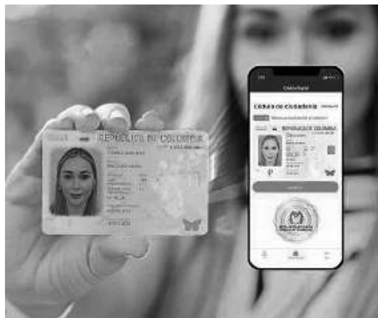
En el Huila se llevan aproximadamente 2.300 cedulados digitalmente, un avance importante que espera superarse paulatinamente.

Es necesario aclarar que, para los jóvenes que cumplen 18 años, este documento es gratuito, mientras que para el resto de los ciudadanos que requieran la renovación debe-