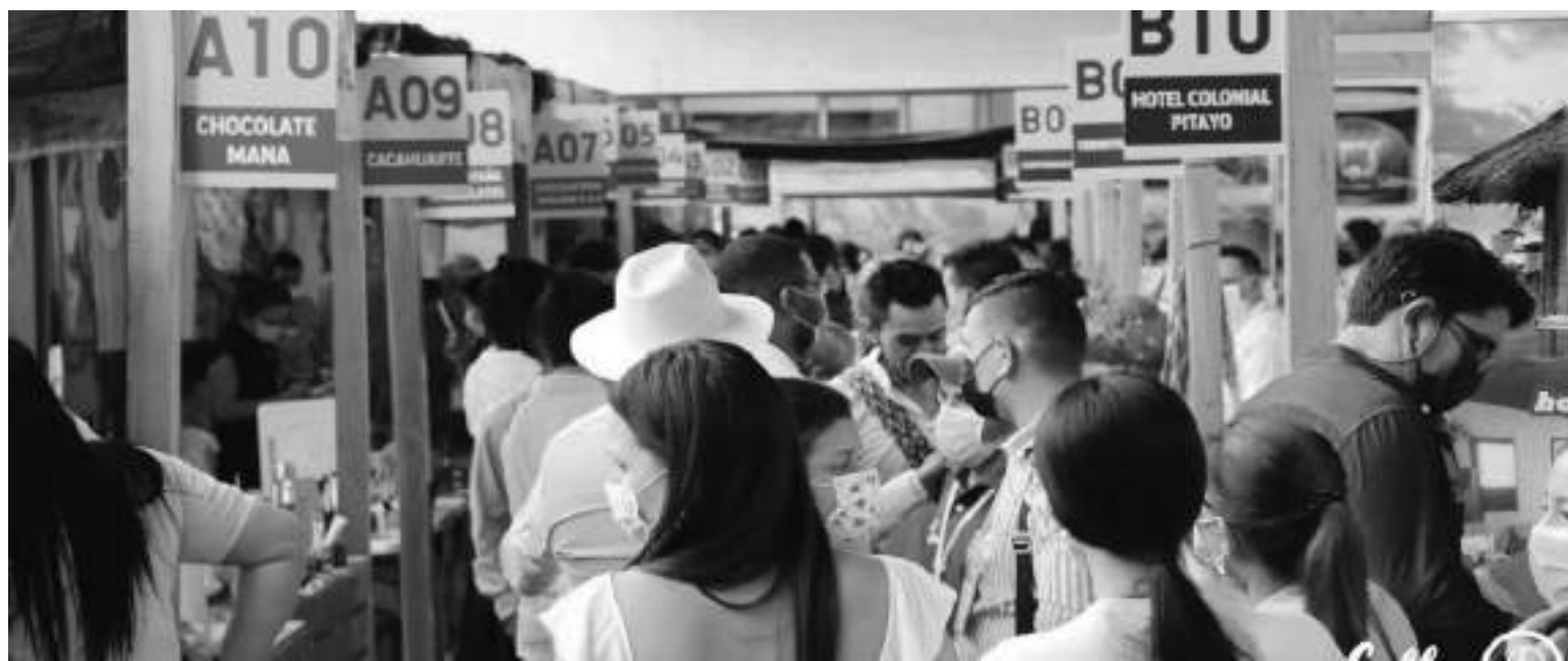
La Primera Feria Internacional de Café, Cacao y Agroturismo.

El Huila es hoy el primer productor nacional de café (20% de la producción nacional se hace en el Huila y el departamento tiene las