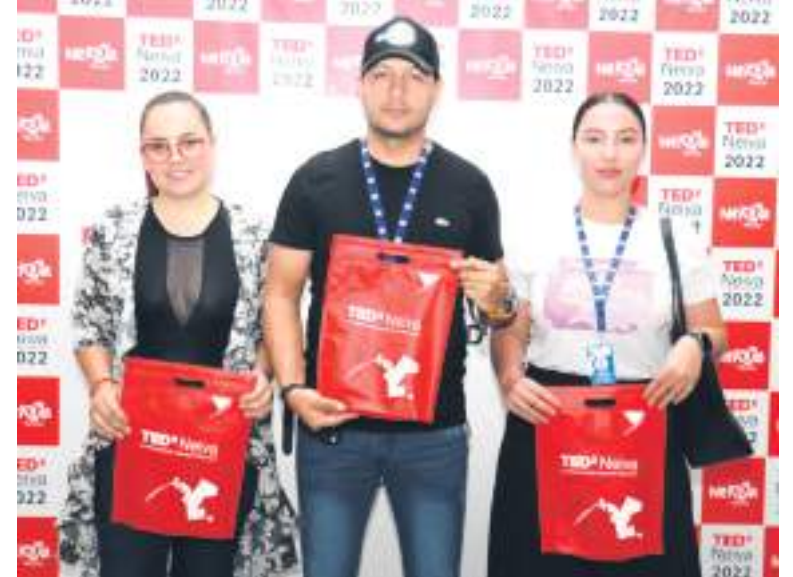
Asistentes al evento