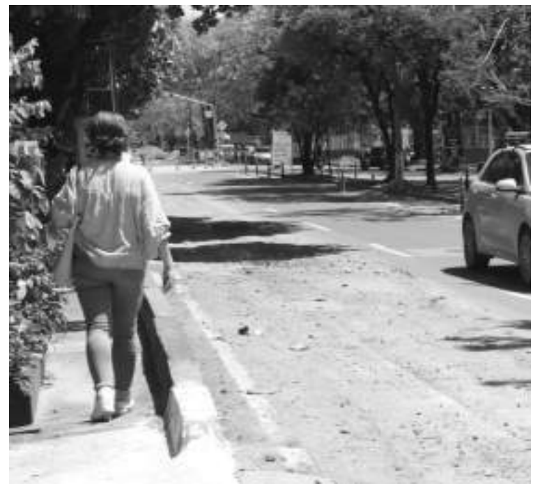
Los peatones también se ven afectados

“Los trabajos obedecen a cambios de las redes de tubería antigua por moderna, en la reposición de redes de acueducto y alcantarillado que adelantan las Ceibas