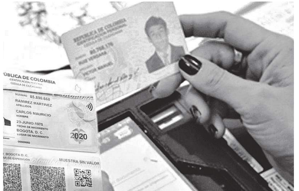
La cédula digital se convirtió en un documento pionero no solo en el Huila y Colombia sino en América Latina.