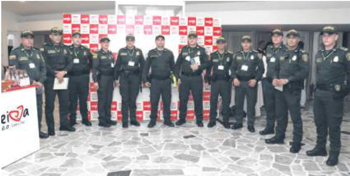
Miembros de la Policía Metropolitana de Neiva

El jueves se llevó a cabo en la ciudad la cuarta versión del evento TEDx Neiva hasta donde llegaron diferentes personalidades de la región para escuchar los diferentes panelistas y conferencistas. El tema central fue la paz.