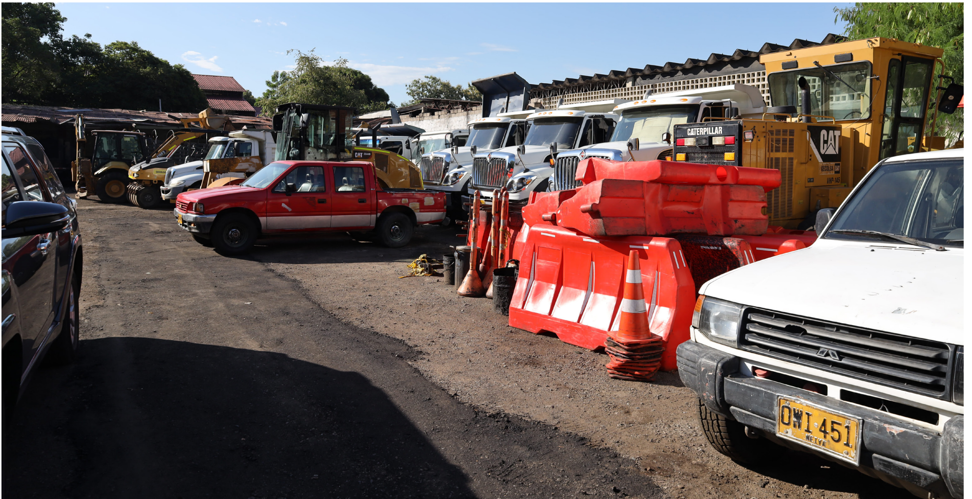
Foto 1: La maquinaria vial de Neiva enfrenta una crisis evidente: el 96% carece de mantenimiento, dejándola vulnerable a las inclemencias del tiempo y poniendo en peligro la eficiencia en el mantenimiento de las vías.