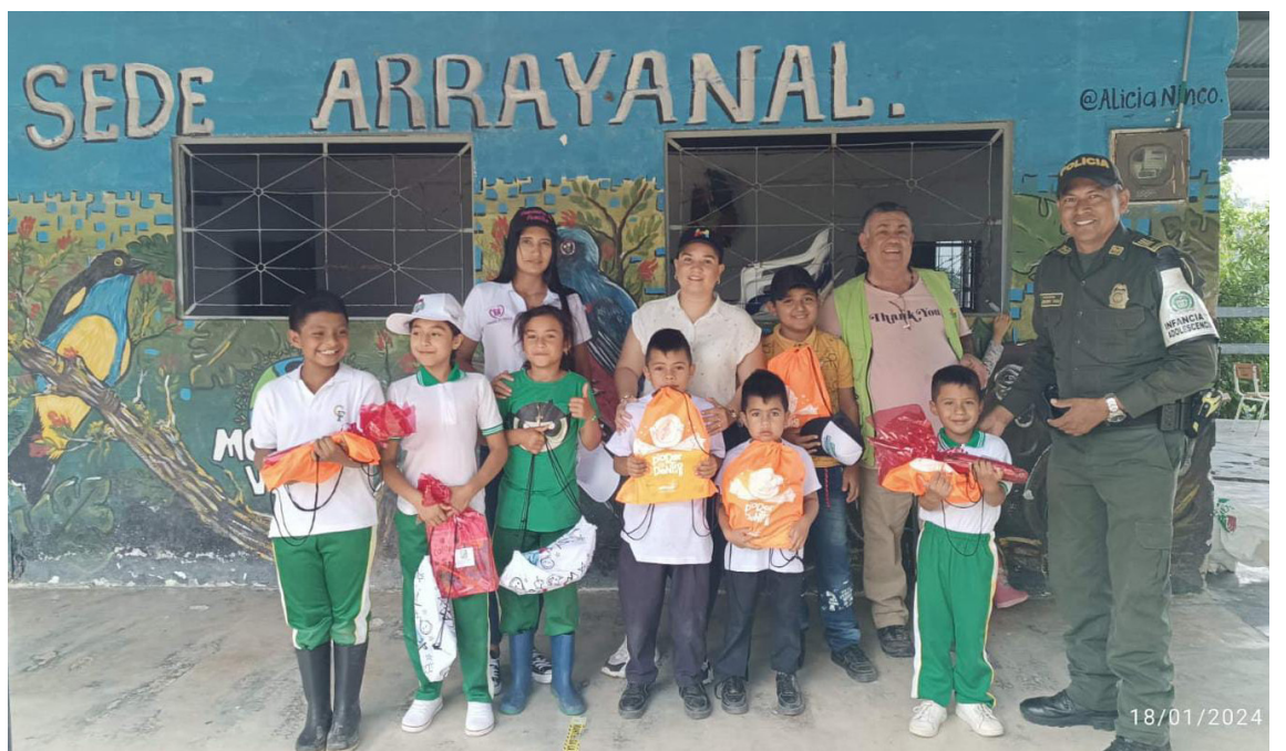
Con el fin de prevenir la violencia escolar, el grupo de Protección a la Infancia y Adolescencia, en compañía de la Comisaría de Familia y la Alcaldía municipal de Rivera; realizan actividades para consolidar espacios educativos seguros.