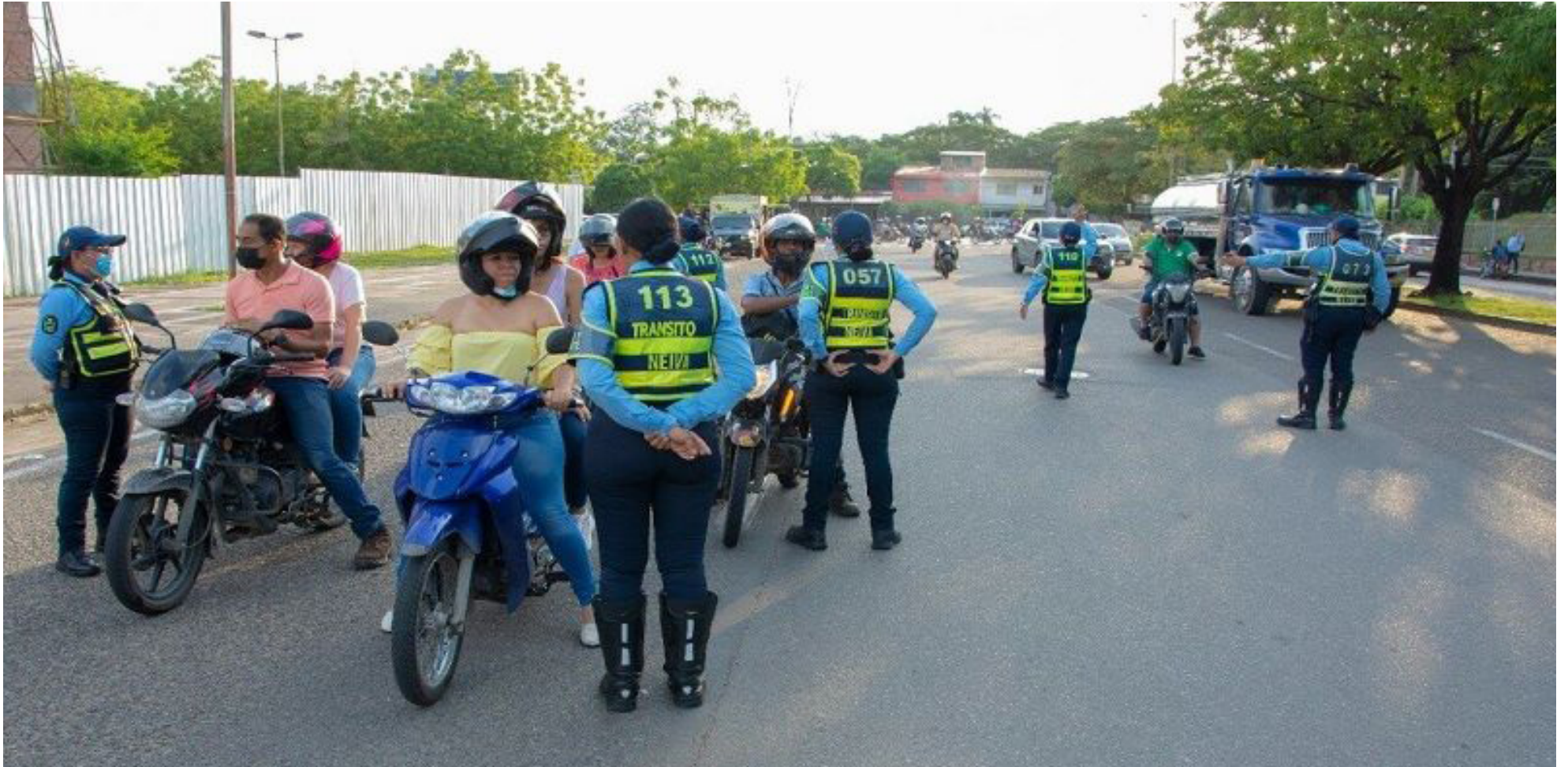
Dinero manejado por la entidad.