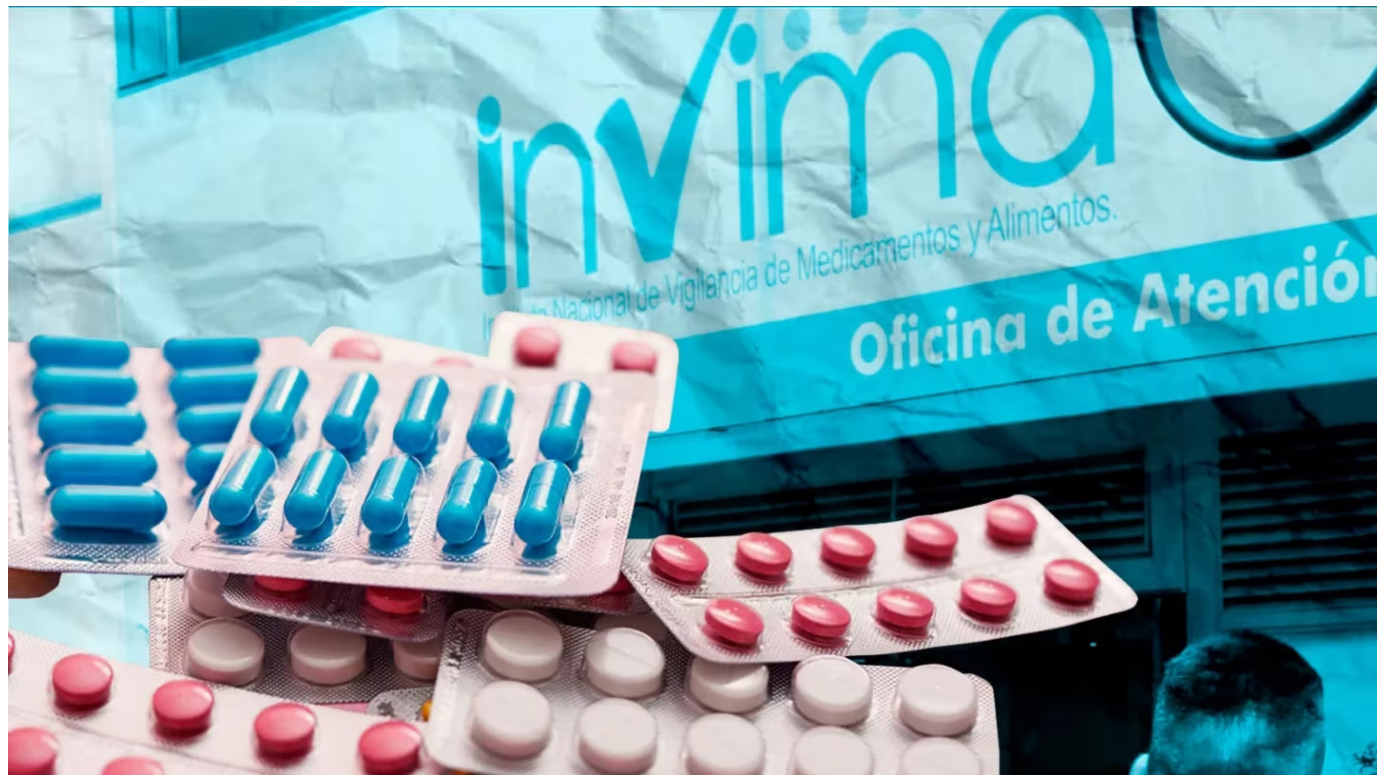
El Instituto Nacional de Vigilancia de Medicamentos y Alimentos (Invima) va a completar 17 meses sin tener un director en propiedad.

De acuerdo con Paereira Oviedo, el presupuesto actual de la entidad es de $257.000 millones. Sin embargo, se necesitan muchos más recursos para enfrentar el problema, que ha terminado afectando a los usuarios.