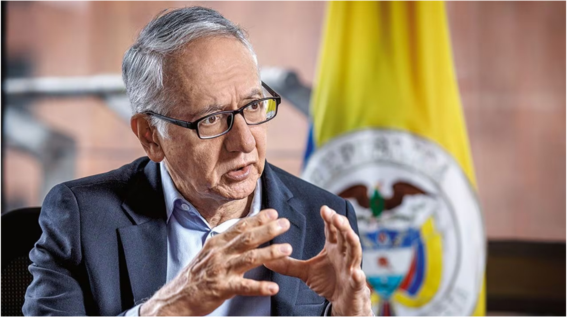
El ministro de Salud, Guillermo Jaramillo, afirmó que se necesita una nueva reforma tributaria en la que los empresarios paguen más para financiar la reforma a la salud.