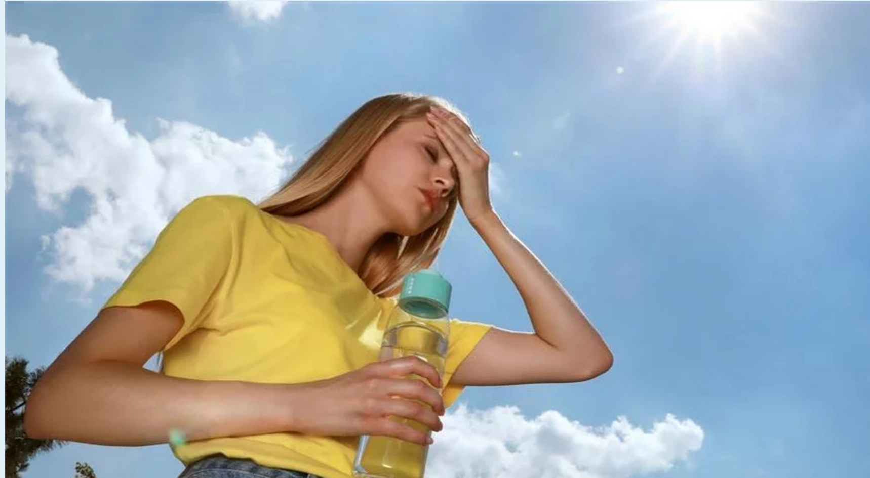
Colombia se ha visto seriamente afectada por las sequías y deslizamientos.

Los incendios, deslizamientos, desabastecimiento de agua y problemas con la calidad del aire en varios puntos del territorio nacional parecen no dar tregua, por lo que las autoridades se encuentran adelantando estrategias que permitan mitigar los riesgos.