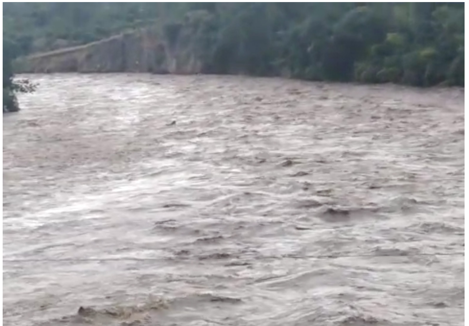
Hay que tener precaución con las crecientes súbitas de los afluentes hídricos.

Si la persona es rescatada del agua y se cuenta con el entrenamiento adecuado, se pueden iniciar maniobras de primeros auxilios, siempre priorizando la respiración. Es clave mantener a la persona en un entorno seguro, tranquilizarla y abrigoarla, manteniendo la espera de la asistencia médica y proporcionándole toda la información pertinente al llegar.