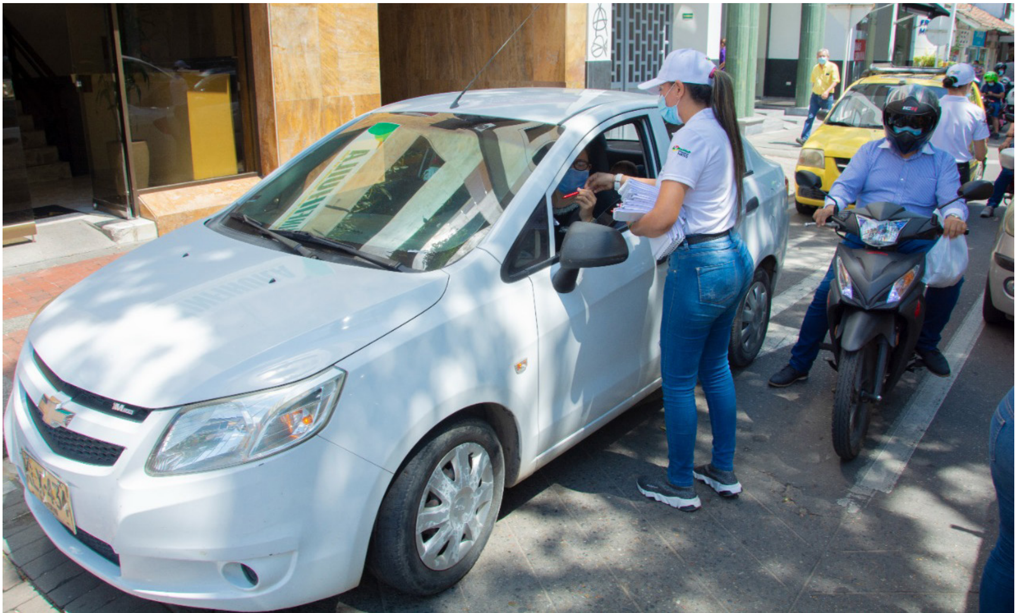
Campañas pedagógicas realizadas en Neiva.

■ Alrededor de $ 14.966 millones, llegaron en 2023 a las 'arcas' de la Secretaría de Movilidad de Neiva, de los cuales $6.906 millones, fueron por la imposición de 44.849 multas de tránsito. Asimismo, se conoció que la entidad no cuenta con ingenieros electrónicos o de sistemas para que opere la central semafórica de la ciudad.