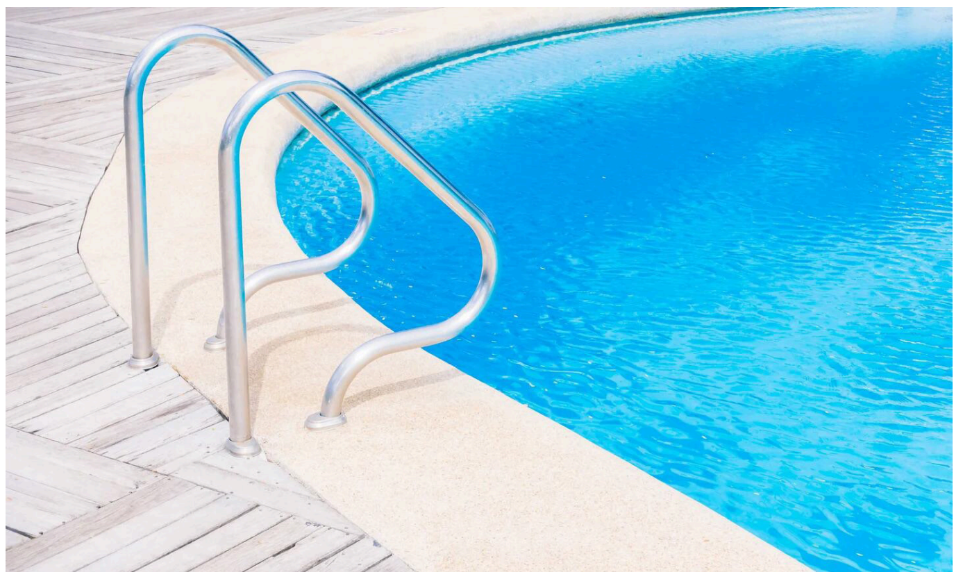
Una pequeña perdió la vida, al caer a una piscina.

En relación a estos casos en los que se presentaron pérdidas de vidas, Jonathan Capera, funcionario adscrito a la Defensa Civil, señaló: "la región ha sido testigo de hechos lamentables, en los que personas han perdido su vida, por inmersión en cuerpos de agua y un menor falleció en una piscina".