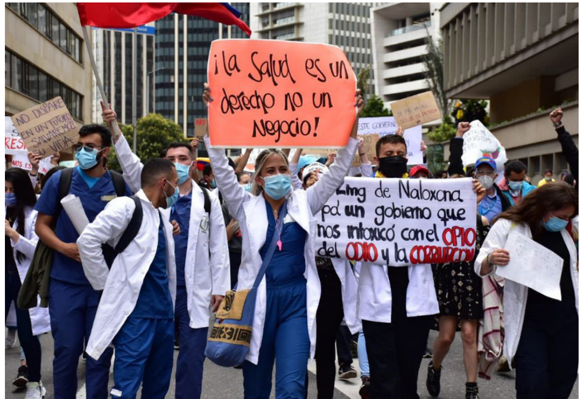
Recordó que el mundo financiero sigue muy de cerca la situación económica de Colombia.

Para la Federación, es inconveniente hablar de nuevas reformas tributarias, cuando hasta ahora se están viendo los efectos de la más reciente.