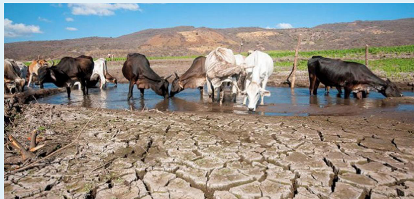
Una intensa lluvia desató esta tragedia

“Apenas vamos en la tercera semana de enero, nos queda todavía un camino largo”, alertó Muhamad, que reiteró el llamado a la ciudadanía a contribuir a ahorrar agua, mientras que la Policía de Carabineros trabaja para el rescate de fauna silvestre que también se está viendo afectada por los incendios.