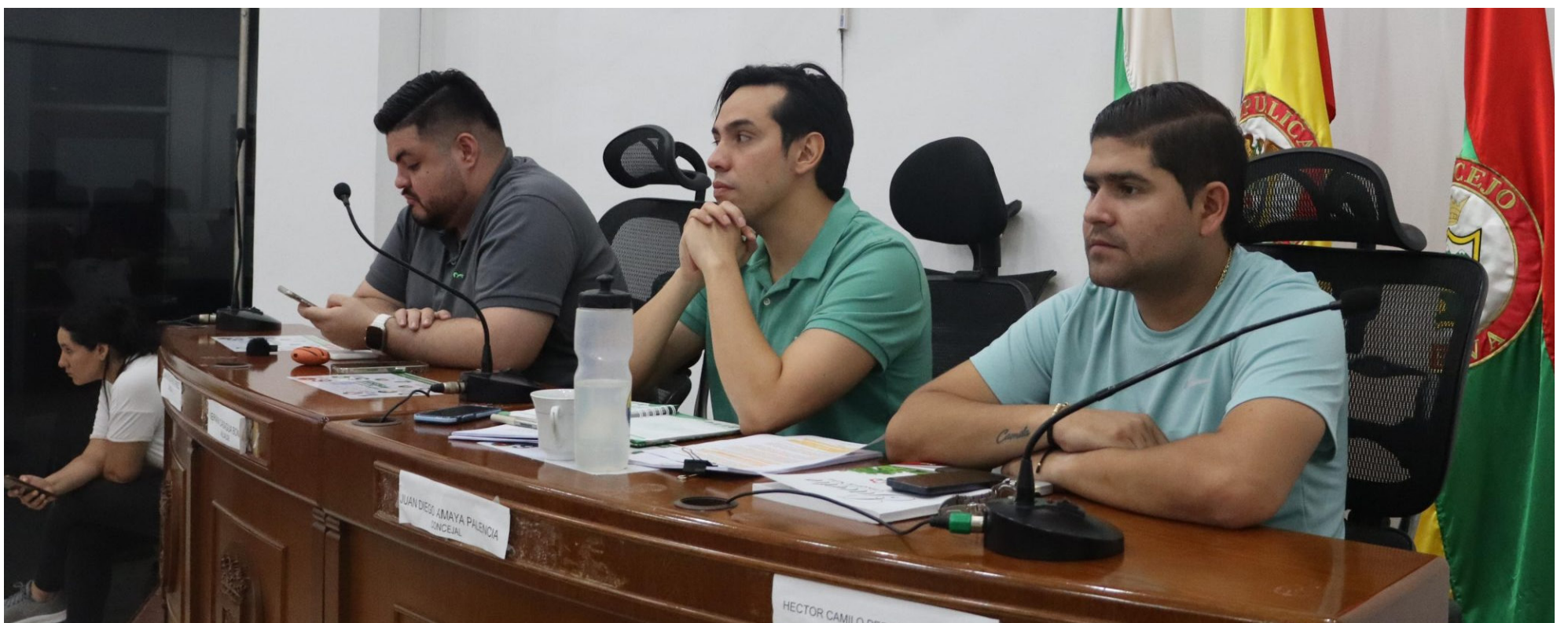
La mesa directiva del Concejo de Neiva fue cuestionada por su actuar en el proceso electoral, desde la invalidación de una entrevista hasta la desestimación de recusaciones, generando dudas sobre la ética en la selección del nuevo personero.