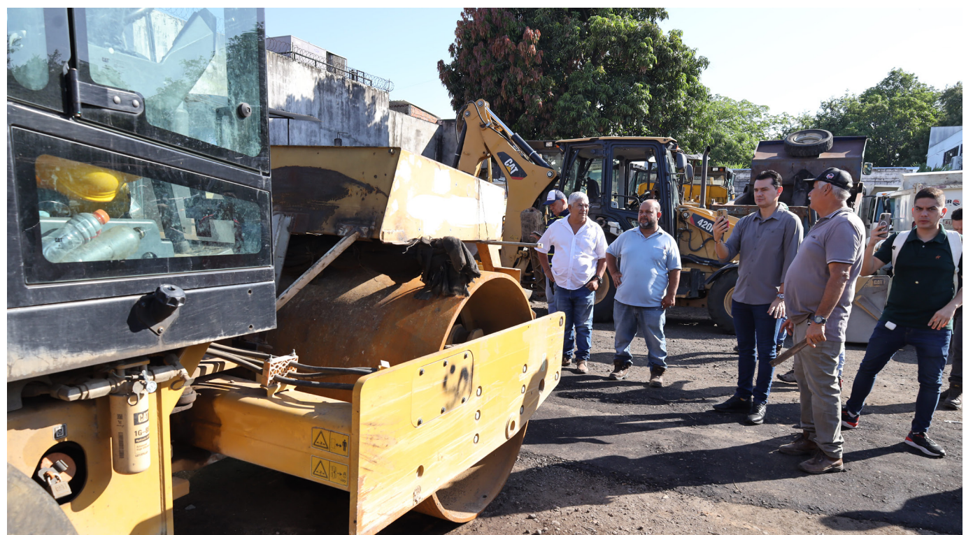
Además de los problemas mecánicos, la falta de documentación en regla, como la ausencia del seguro obligatorio (Soat), afecta a parte de la maquinaria.

El 96 por ciento de la maquinaria destinada al mantenimiento de la red vial de la capital del Huila se encuentra en un estado crítico debido a la falta de mantenimiento preventivo y correctivo.