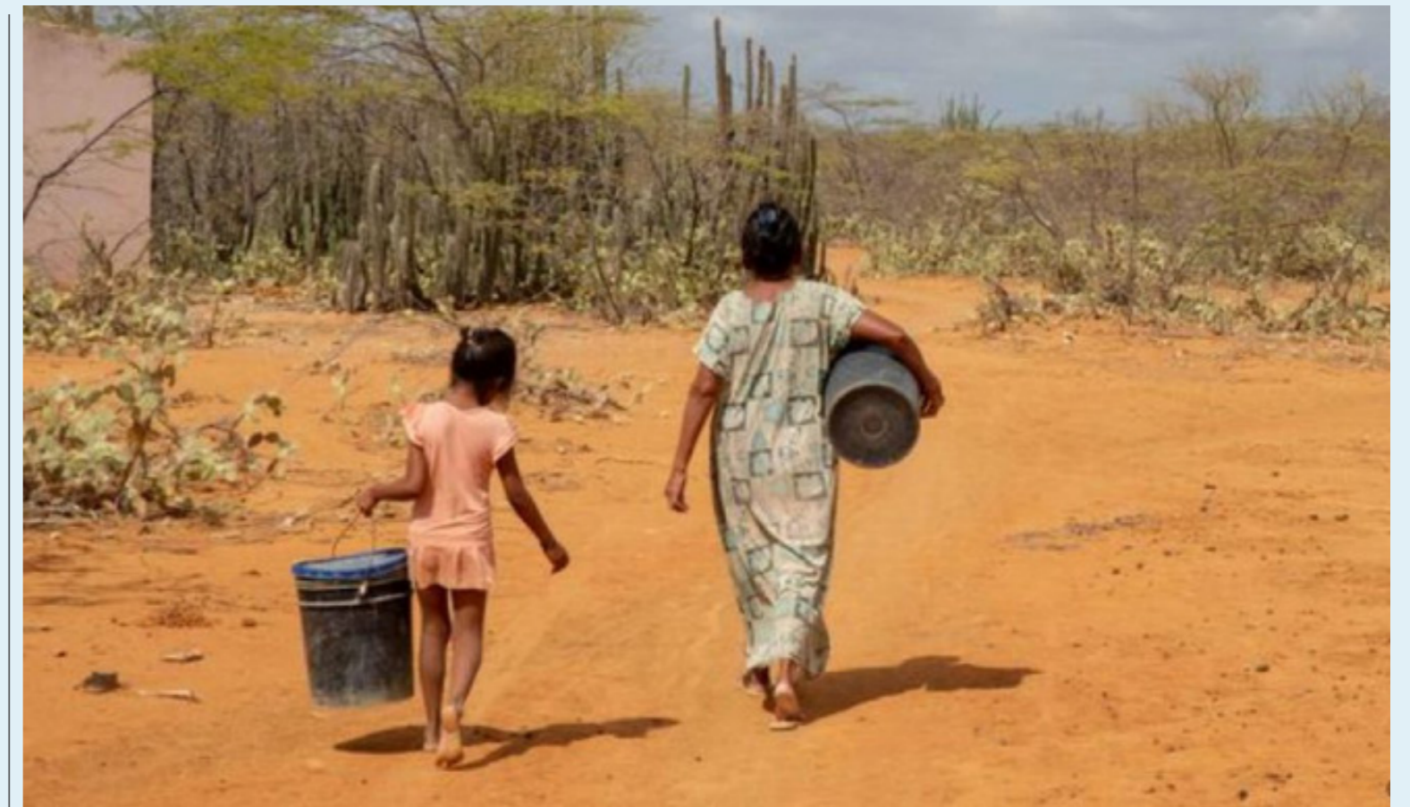
El desabastecimiento de agua genera preocupaciones en zonas como La Guajira.

De los 883 municipios en alerta por incendios, 582 están en alerta roja; además, 47 municipios tienen amenazas por deslizamientos y 89, alerta por desabastecimiento de agua.