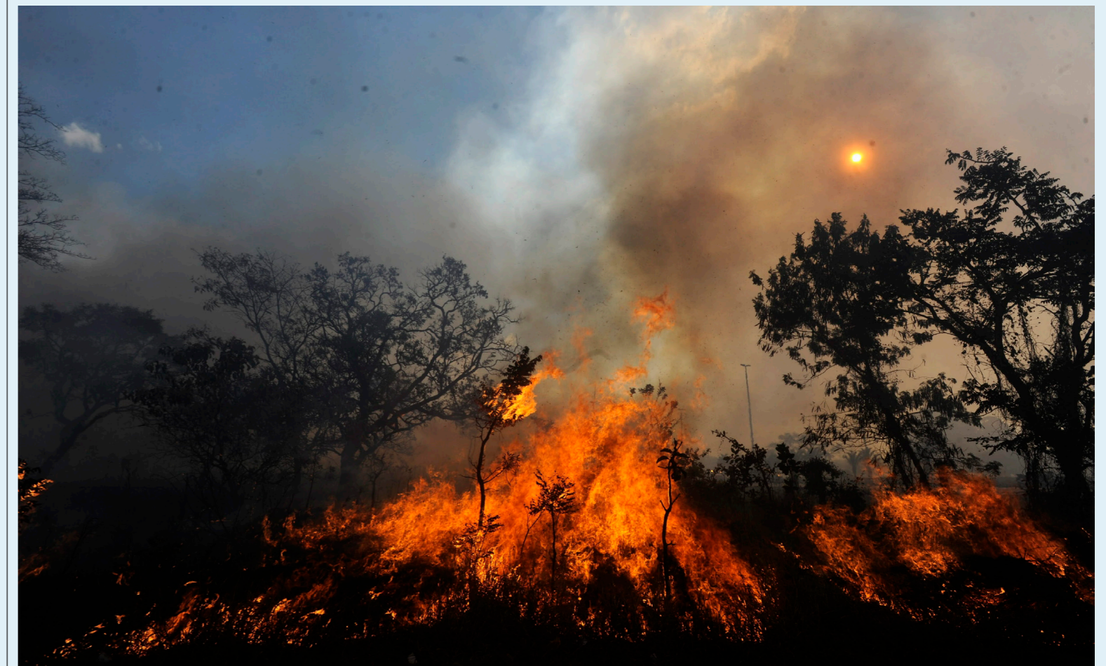
Son varios los municipios a nivel nacional que se encuentran en riesgo por incendios forestales.