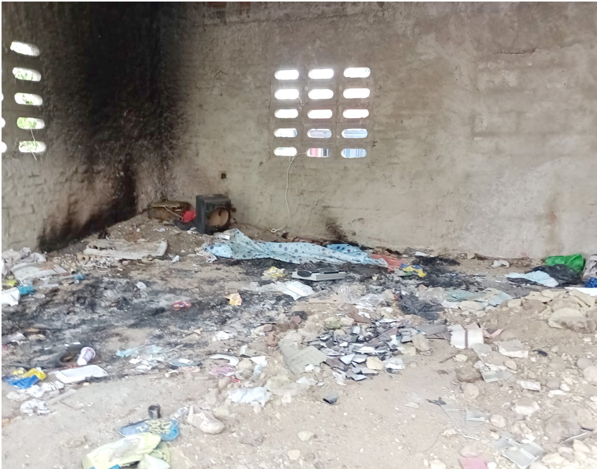
Residuos encontrados en el lugar.

cios de agua y alcantarillado, falta colocar la energía, pero no cuentan con los recursos para ello.