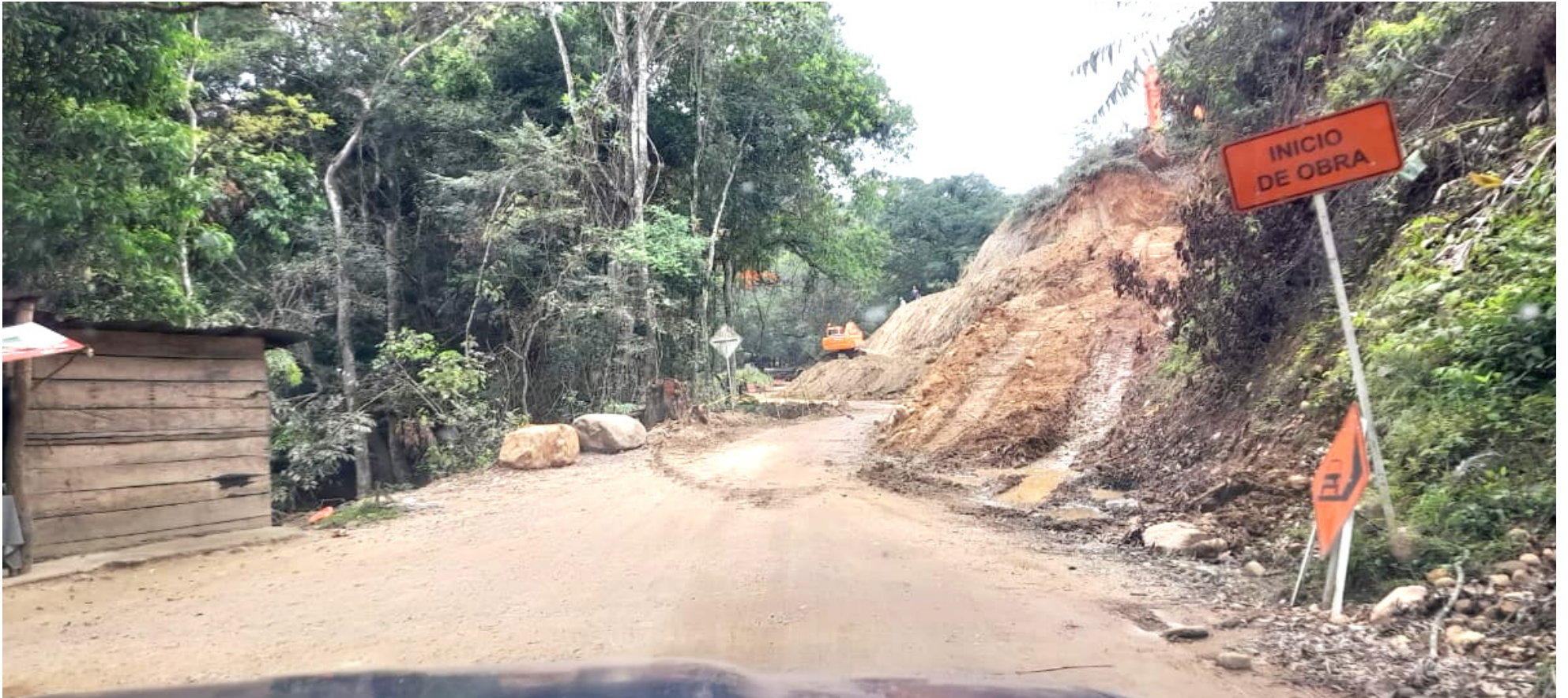
La comunidad se queja del poco avance de la obra.