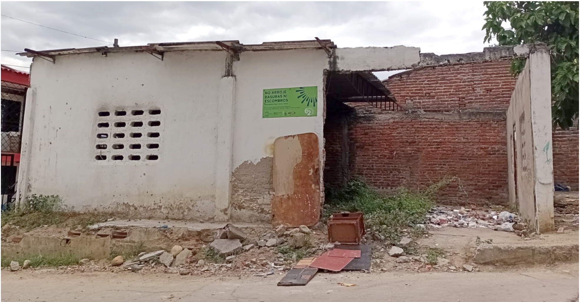
El Centro Comunitario va a ser arreglado.