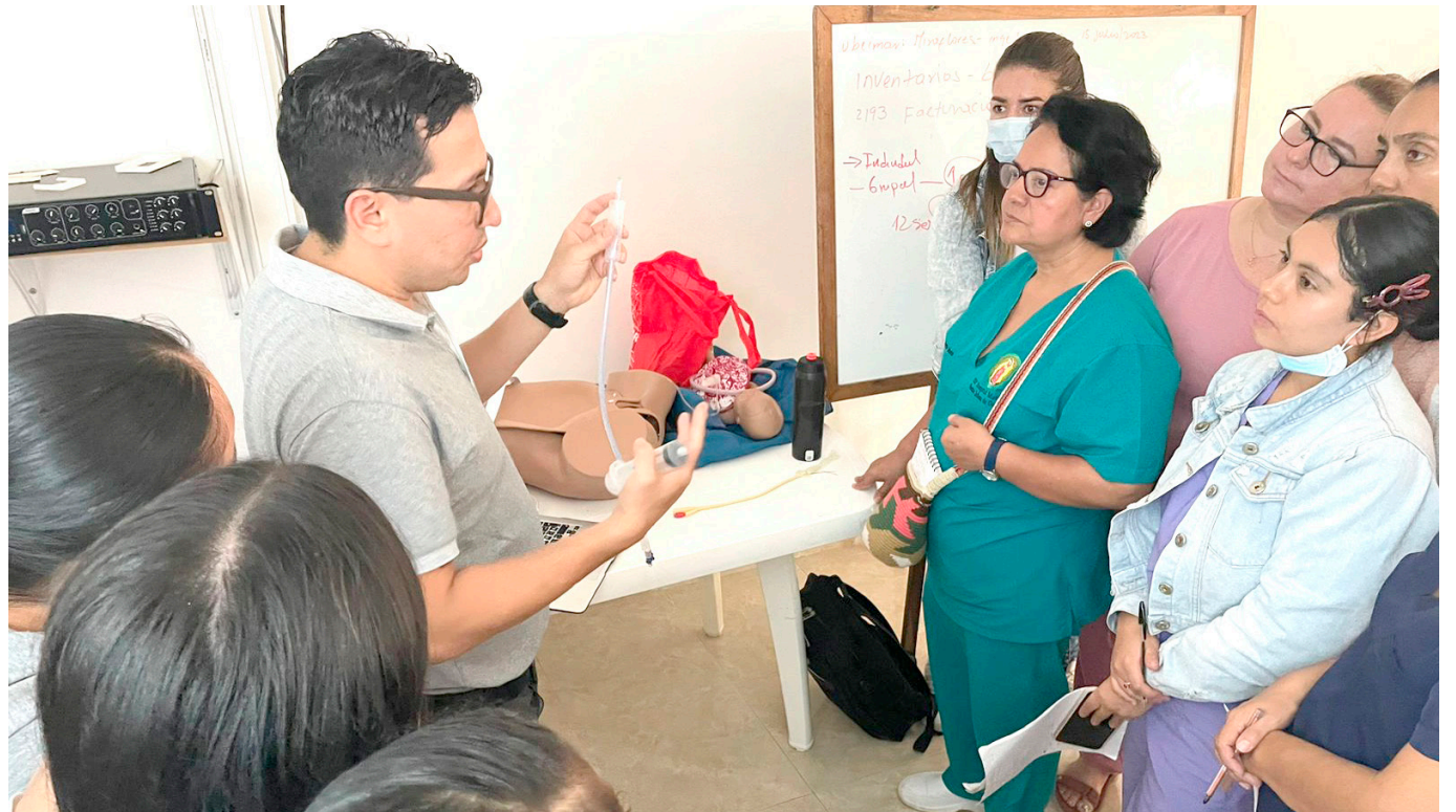
Otro factor crítico es la falta de educación sexual y reproductiva en gran parte de la población.

La desigualdad social y económica también juega un papel determinante en esta problemática.