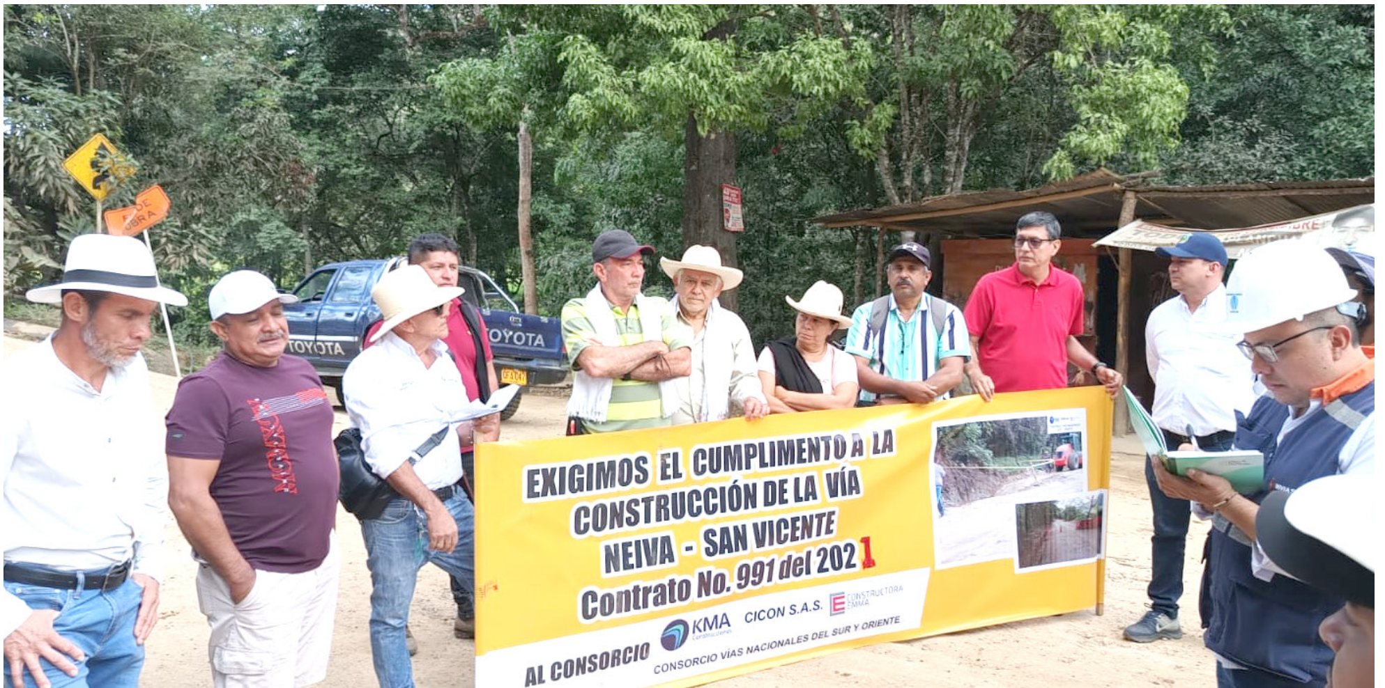
Los pobladores se reunieron con líderes del consorcio.