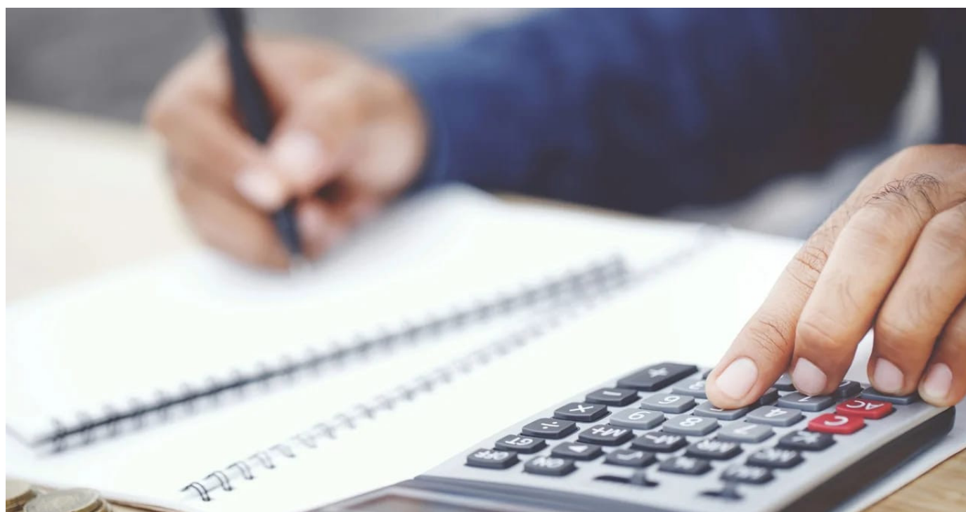
“La declaración de un activo por un valor inferior al que corresponde, no constituye activo omitido, sin embargo, la Dian puede investigar e imponer sanción por inexactitud o sanción por envío erróneo de información”.

4. Que hasta el año gravable 2022 no haya