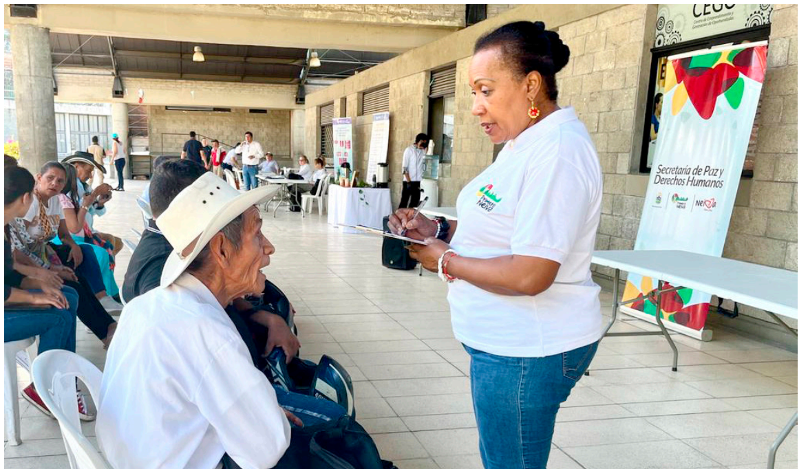
Victimas del conflicto armado y campesinado de Neiva, participaron en la destacada jornada de restitución de tierras.