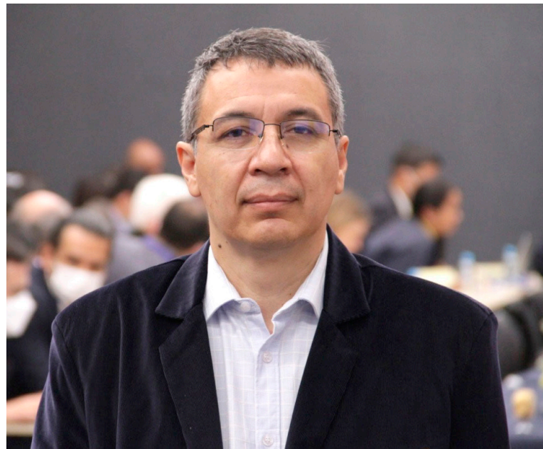
William Fernando Camargo, ministro de Transporte.

El ministro de Transporte, William Camargo, lanzó una polémica propuesta: restringir el uso de vehículos particulares en las horas pico para mejorar la movilidad en las ciudades.