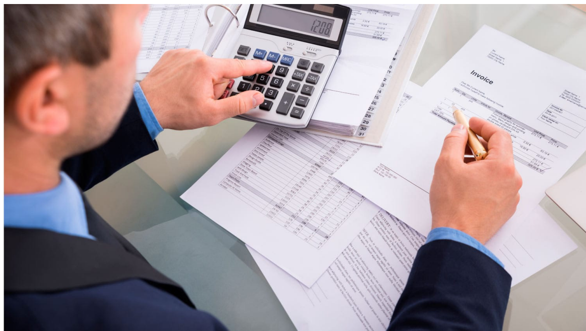
“No declare los bienes raíces por un mayor valor al que obliga de acuerdo con la ley”

Las opiniones son responsabilidad de los socios de Araque Asociados Consultores Tributarios y Legales. Nos basamos en el entendimiento de las normas vigentes y en el conocimiento del derecho tributario, y puede no ser compartido por las autoridades tributarias. Consúltenos en www.araqueasociados.com Preguntas y sugerencias en el correo: contacto@araqueasociados.com . Atención personalizada: Carrera 5 No. 14-32 oficinas 5, 7 y 8 Pasaje de la Quinta de Neiva, Huila, teléfonos 321 452 3315