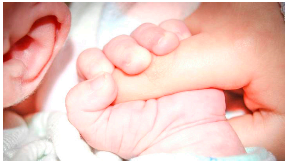
La desigualdad social y económica también juega un papel determinante en esta problemática.

efectos negativos en el desarrollo fetal. Las madres gestantes también pueden experimentar trastornos del estado de ánimo, como la depresión posparto, debido a los cambios hormonales.