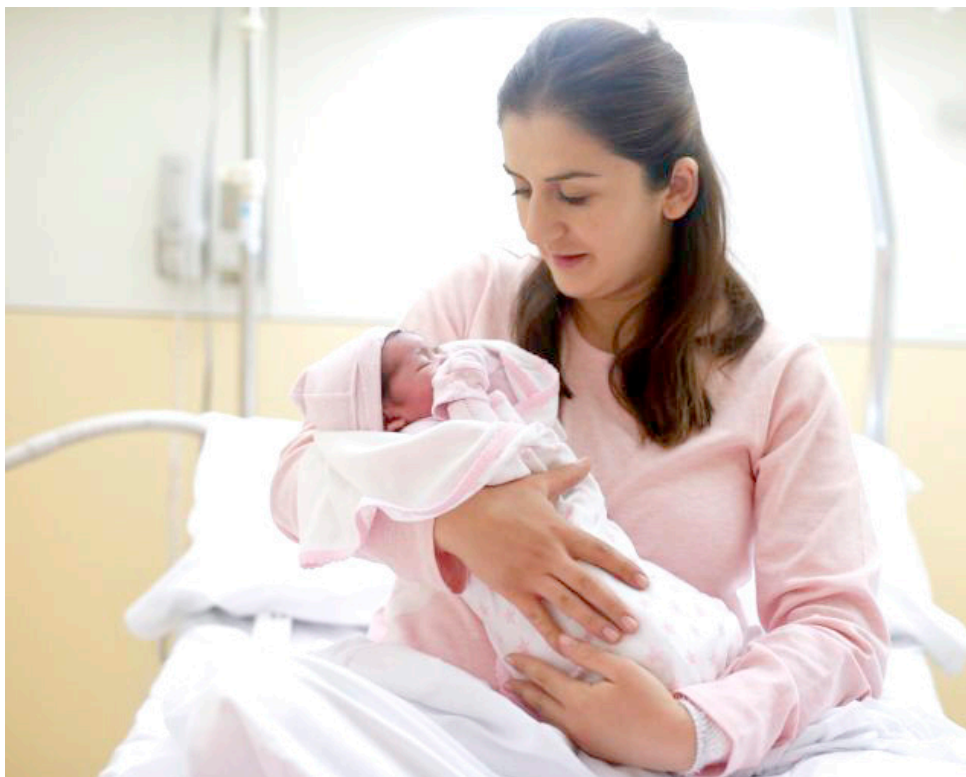
Las principales causas de muerte materna en el país están relacionadas con complicaciones durante el embarazo.

“Los controles prenatales son muy importantes en toda paciente gestante, ya que en esta etapa se puede hacer seguimiento al desarrollo del embarazo, se pueden prevenir riesgos, se puede enseñar a detectar los signos de alarma como el dolor de cabeza persistente, sensación de destellos de luz, sonidos en los oídos, dolor en el abdomen, disminución de los movimientos del bebé, sangrados o salida de líquidos por la vagina” agregó el Ginecólogo.