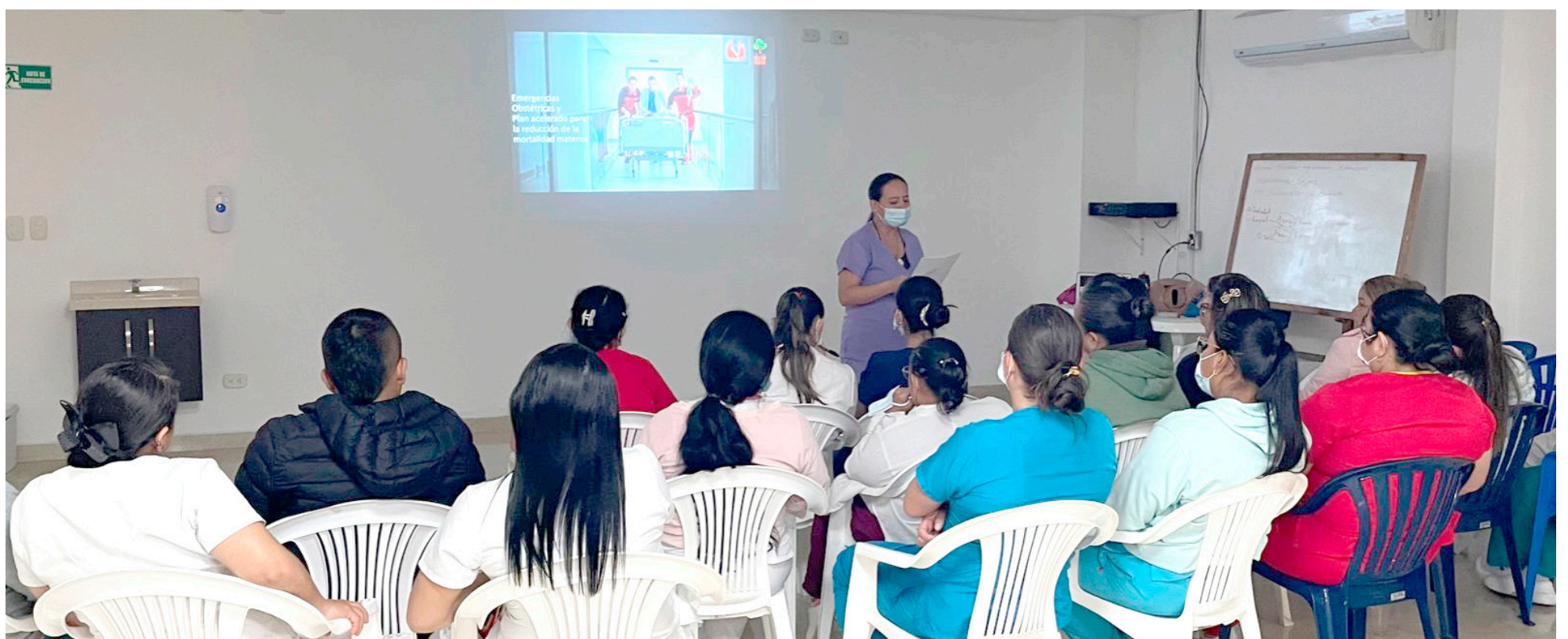
La capacitación del personal de salud también es fundamental.

En conclusión, la mortalidad materna en Colombia sigue siendo un desafío importante en el ámbito de la salud pública. Si bien se han logrado avances significativos, los desafíos persistentes requieren una acción decidida y coordinada por parte del gobierno, las instituciones de salud y la sociedad en su conjunto para garantizar que todas las mujeres del país tengan acceso a una maternidad segura y sin riesgos para sus vidas. Solo mediante un enfoque integral y continuo se podrá alcanzar este objetivo y proteger la vida de las futuras madres colombianas.