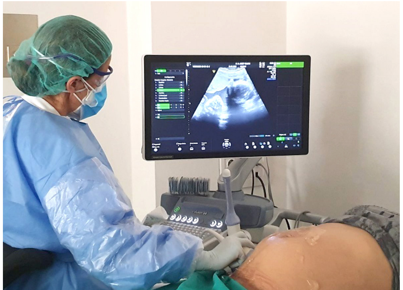
Según datos recientes del Ministerio de Salud y Protección Social, Colombia ha experimentado un estancamiento en la reducción de la mortalidad materna en los últimos años.

Las principales causas de muerte materna en el país están relacionadas con complicaciones durante el embarazo y el parto, así como la falta de acceso a una atención médica oportuna y de calidad.