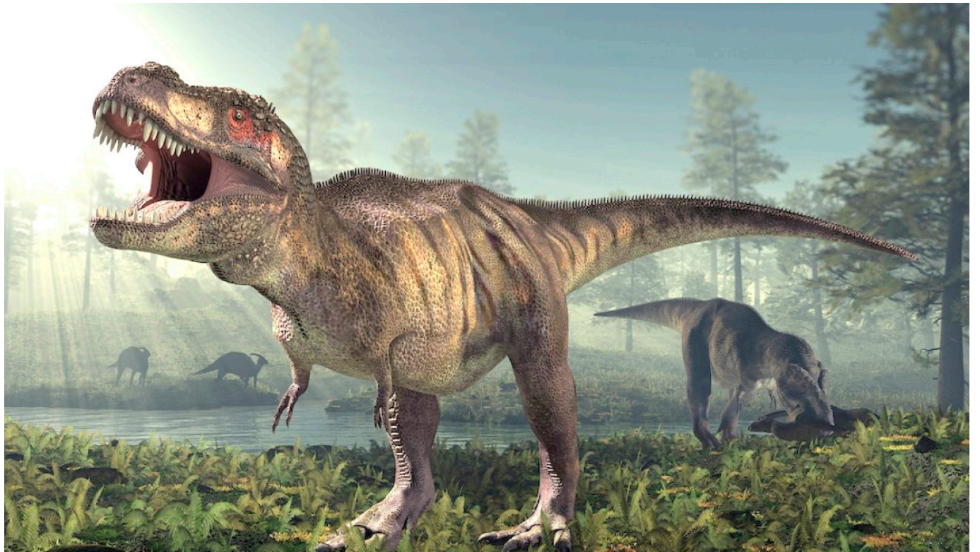
El fósil hallado es de hace 125 millones de años.

Se conoció que el fósil está expuesto en un museo en un museo, para que la comunidad científica pueda visualizarlo con mayor precisión.