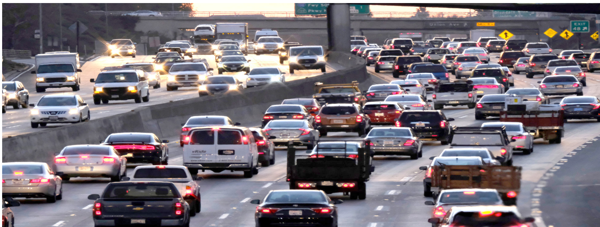
Al congelar el parque de taxis se abrió el espacio para que otras alternativas que no están atadas a sistemas de utilización de espacio entraran: plataformas, mototaxismo.

hacernos es en la malla vial cotidiana ¿quiénes son los usuarios que más utilizan la malla vial? ¿Cuáles son la mayor cantidad de viajes que debemos desplazar en las horas pico? Yo creería que la de la mayoría de ciudadanos que no son propietarios de vehículo particular”, dijo Camargo.