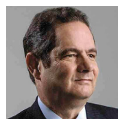
Germán Vargas Lleras

Vea columna completa en www.diariodelhuila.com