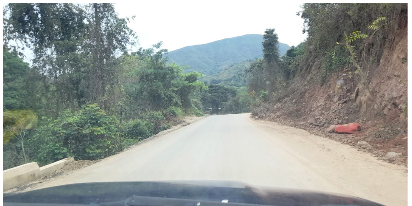
El tramo a pavimentar va de Neiva al cruce de Balsillas.