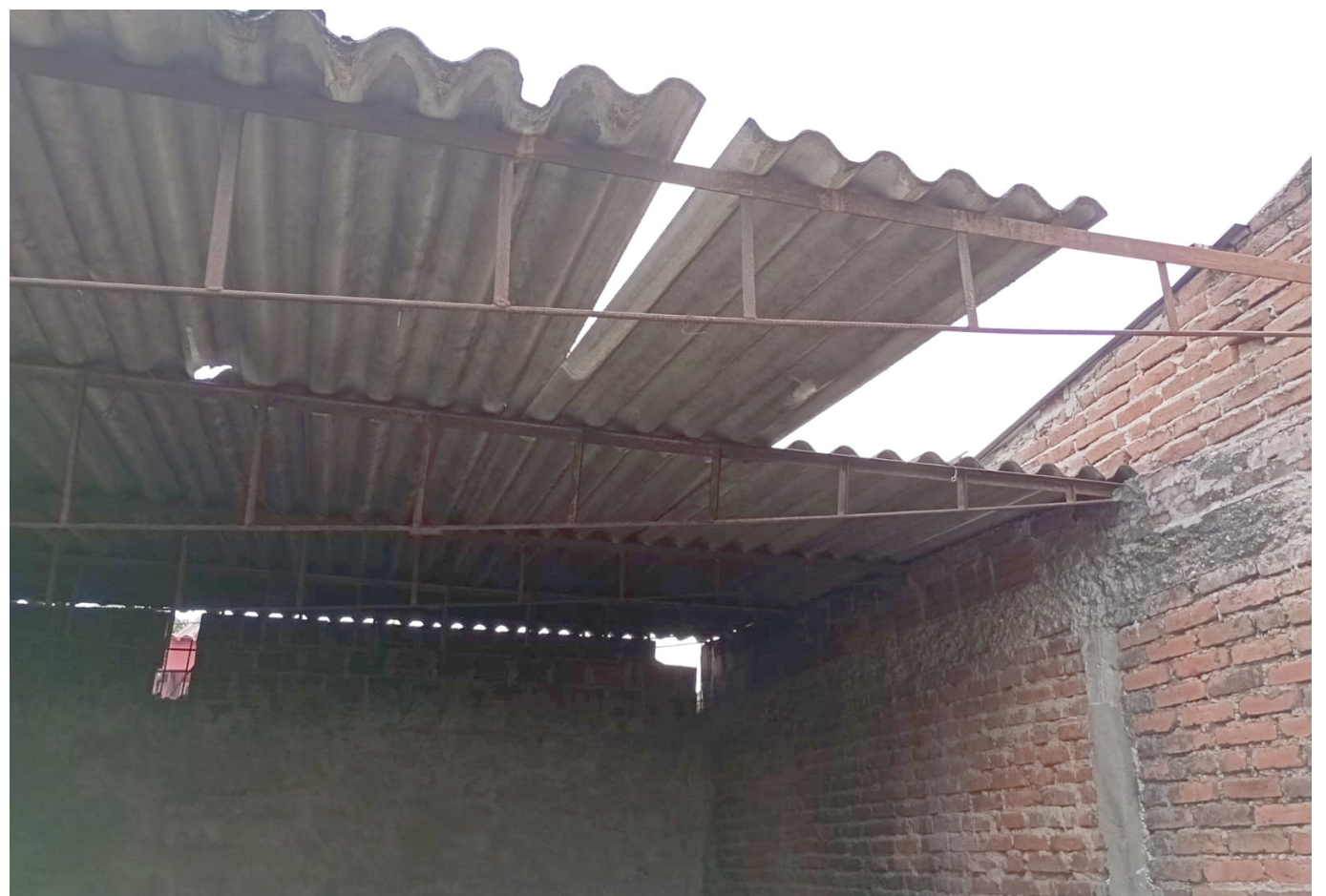
Ya se robaron las tejas de zinc.