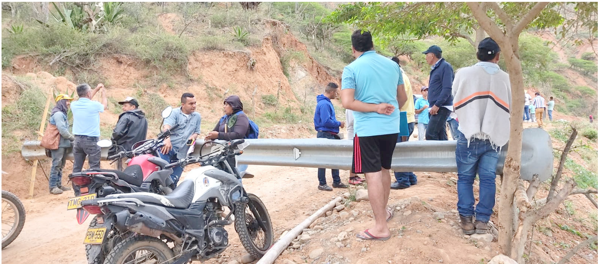
La comunidad de Colombia, Huila, se une en protesta contra la reestructuración educativa que amenaza con afectar a estudiantes y veredas locales.