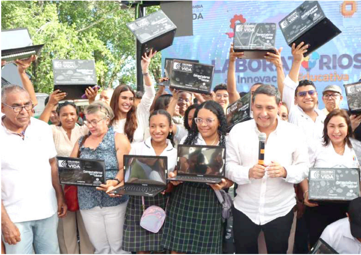
El ministro TIC Mauricio Lizcano, busca solicitar 500 mil millones de pesos para entregar más equipos móviles.

"El futuro está en el sector de las TIC por eso mi objetivo es aumentar el presupuesto y solicitar 500 mil millones de pesos al año para que los niños, tengan su propio computador y aprendan a programar desde sus colegios y casas", puntualizó el ministro Lizcano.