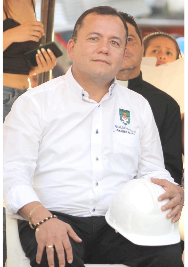
Edgar Muñoz, Alcalde de Pitalito.

El compromiso de garantizar el acceso a la alimentación escolar, como parte integral del proceso educativo, es un deber ineludible de las autoridades locales, y este caso se convierte en un recordatorio de la importancia de velar por los derechos fundamentales de los estudiantes para un desarrollo educativo integral y equitativo.