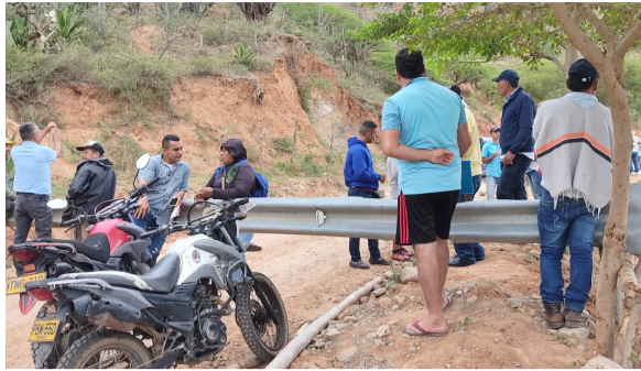
Protesta por reestructuración educativa en Colombia ■ PANORAMA 2-3