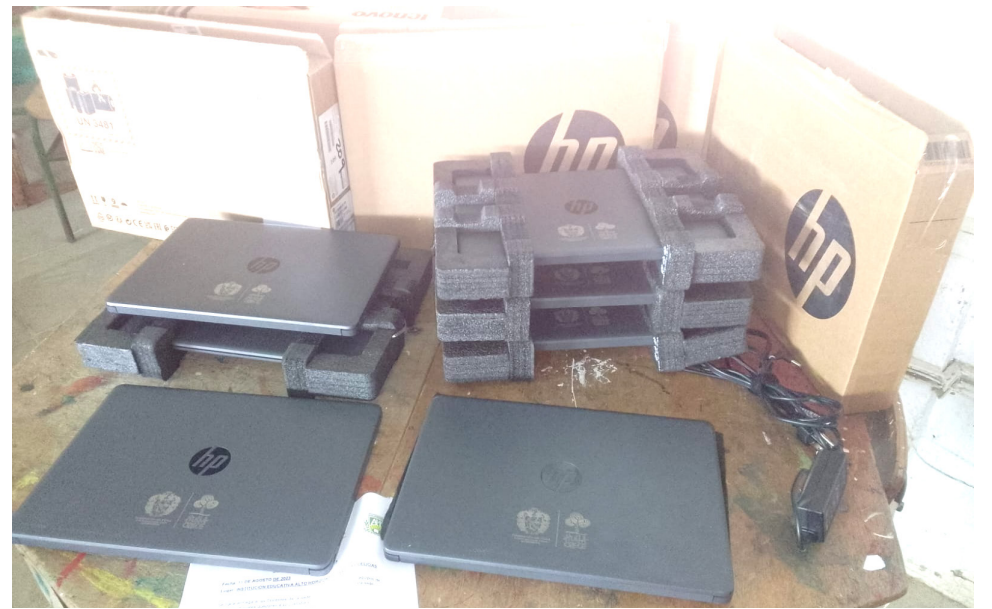
Problema ya resuelto en zona rural de Suaza.

Posteriormente, la denunciante inconforme, se comunicó con funcionarios de la Administración Departamental y le enviaron un