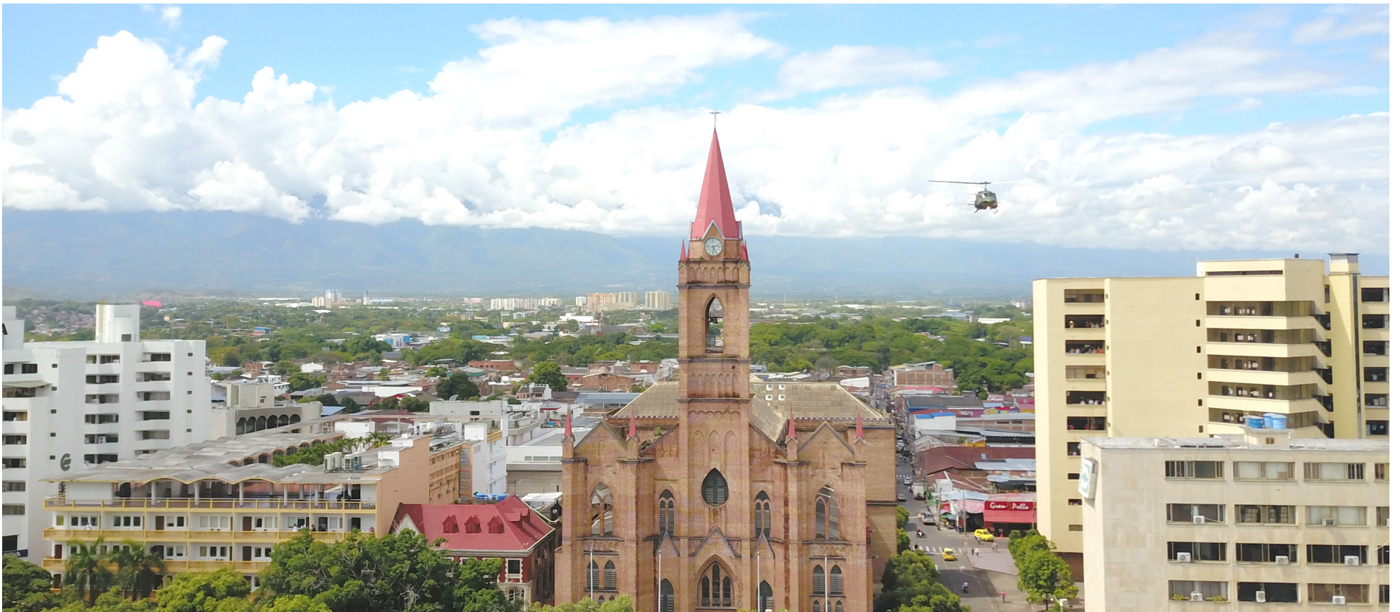
Ahora, será el alcalde Gorky Muñoz quien, mediante decreto, apruebe el presupuesto de Neiva para la vigencia fiscal 2024.

podría tener un impacto directo en la implementación de programas y proyectos municipales. La incertidumbre sobre la disponibilidad de recursos podría afectar la planificación y ejecución de iniciativas clave para el desarrollo local.