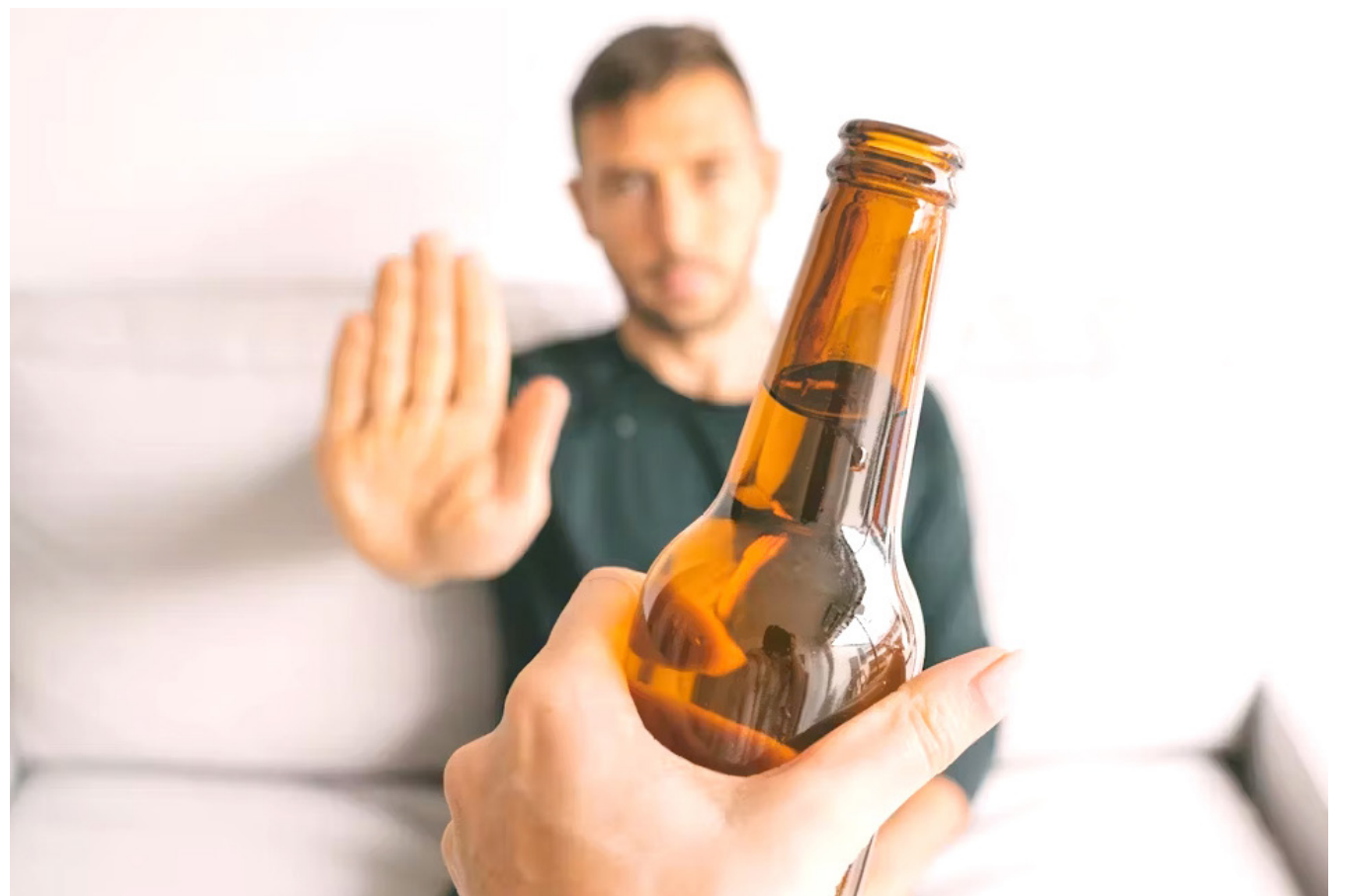
Un esperanzador fármaco podría reducir las ganas de beber alcohol.

Asociado a estos efectos, identificamos cambios en áreas cerebrales relacionadas con la adicción a sustancias de abuso, es decir, áreas del sistema de recompensa cerebral.