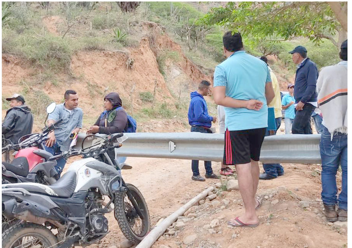
Habitantes de cinco veredas en el municipio de Colombia, al norte del Huila, han completado nueve días de manifestación pacífica exigiendo ser tomados en cuenta en la reorganización de las instituciones educativas locales.