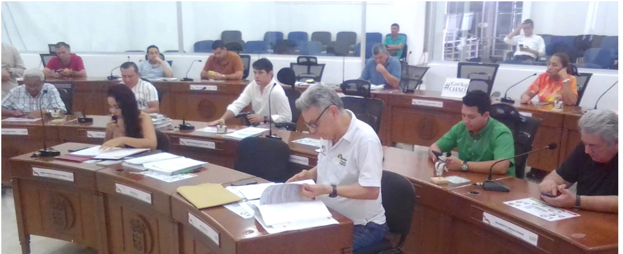
El presupuesto general de Neiva para la vigencia 2024 asciende a 925 mil millones de pesos y deberá ser aprobado mediante decreto.