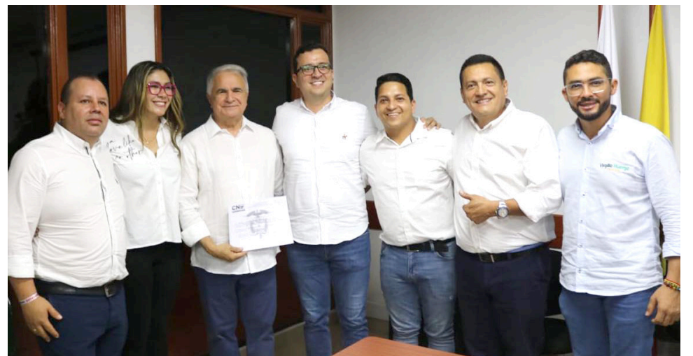
Algunos de los simpatizantes del Gobernador electo lo acompañaron.

La entrega de la credencial como Gobernador electo es el paso formal que permite a Rodrigo Villalba Mosquera comenzar a estructurar su equipo de trabajo y diseñar las estrategias que implementará durante su gestión. Este hito marca el inicio de un nuevo capítulo en la historia del Huila, cargado de expectativas y desafíos, pero también lleno de oportunidades para el crecimiento y el