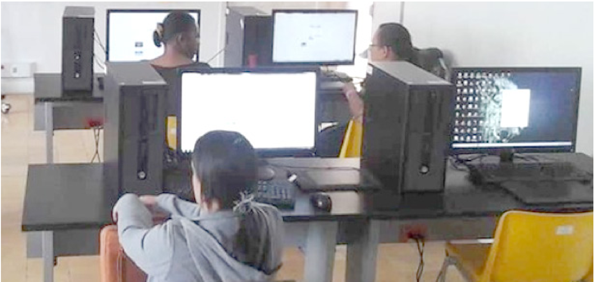
Los colegios han mejorado la dotación educativa, indicó la funcionaria.