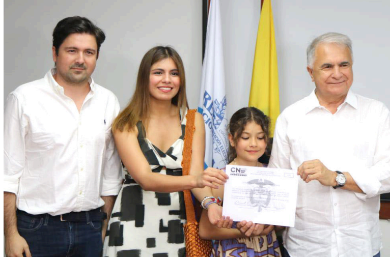
Rodrigo Villalba Mosquera Gobernador electo del Huila acompañado por su familia.

El nuevo líder departamental ha destacado en múltiples ocasiones su intención de trabajar arduamente para promover el progreso económico, fortalecer la