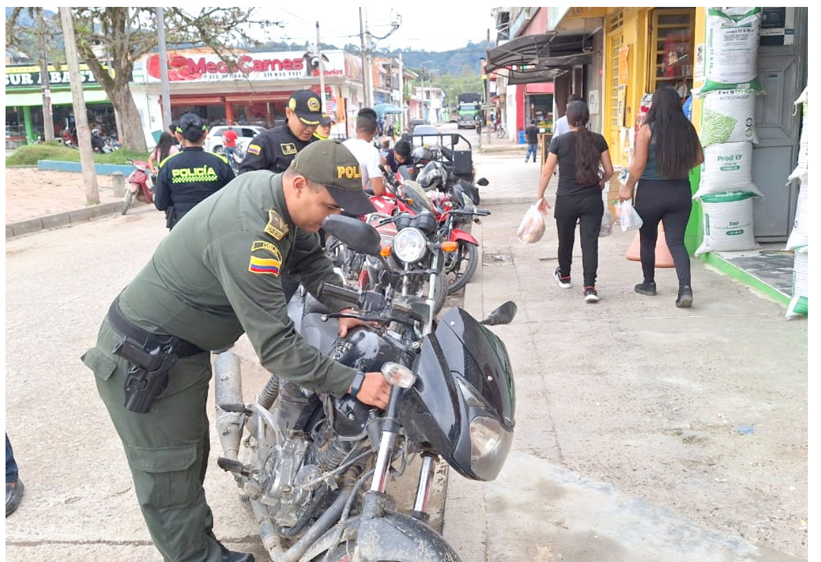
El Departamento de Policía Huila, viene realizando operativos y marcatones.

De igual forma, el día de ayer se recuperó una motocicleta que había sido robada a su propietario. La pronta notificación a los policías del cuadrante fue crucial para la recuperación del vehículo, que fue abandonado por el delincuente al verse acorralado por los uniformados en la vía Cálamo a Yamboró, en Pitalito, Huila.