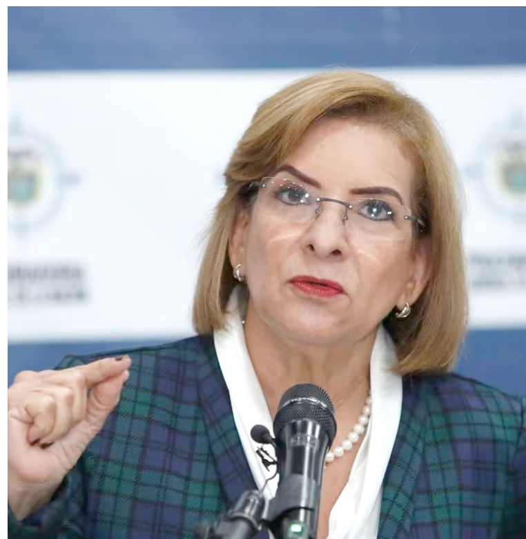
La procuradora Margarita Cabello se fue lanza en ristre contra el Plan Nacional de Desarrollo 2022-2026.