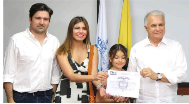
Registraduría entregó credencial a nuevo gobernador del Huila ■ HUILA 13