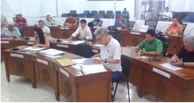
Razones del archivo del Presupuesto Neiva 2024 ■ ECONOMÍA 6-7