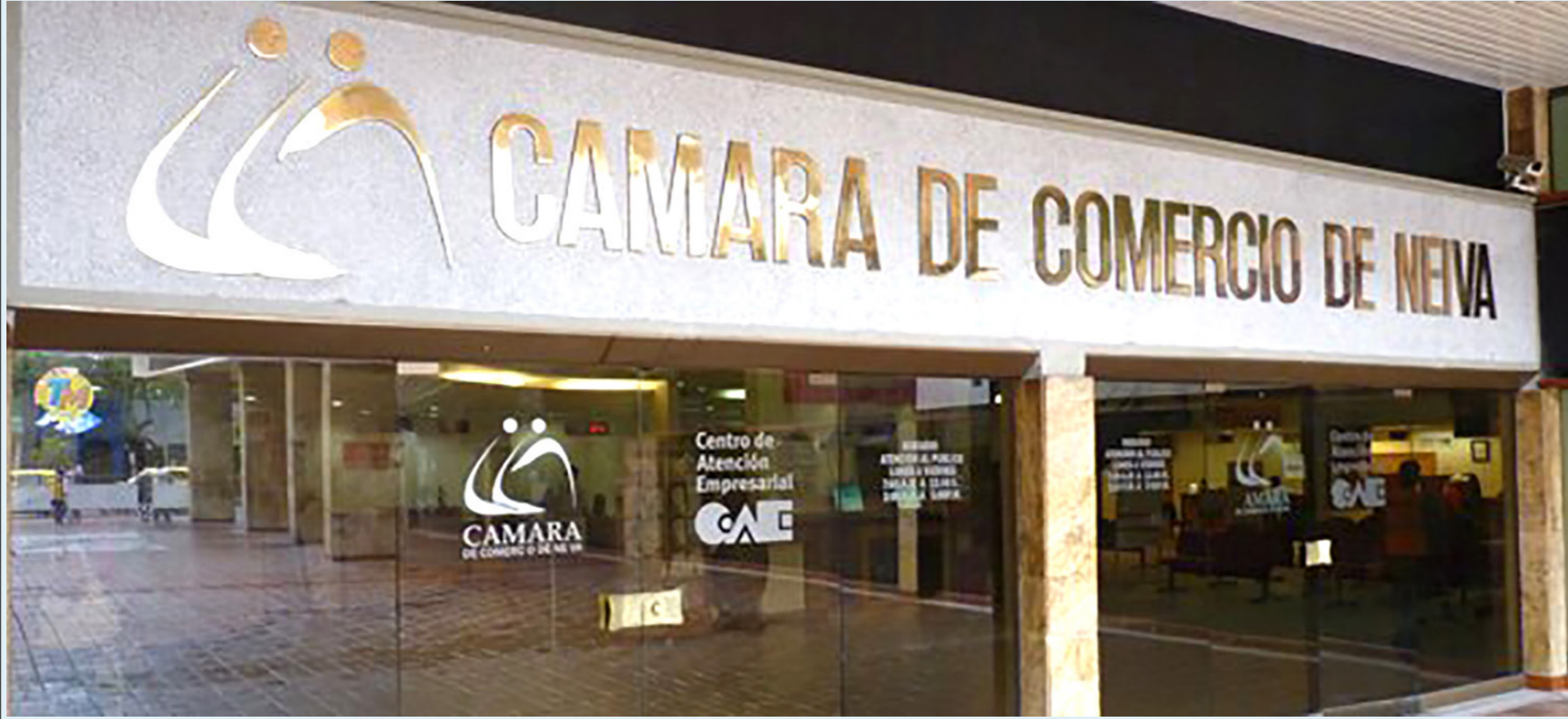
Más problemas para la Cámara de Comercio.