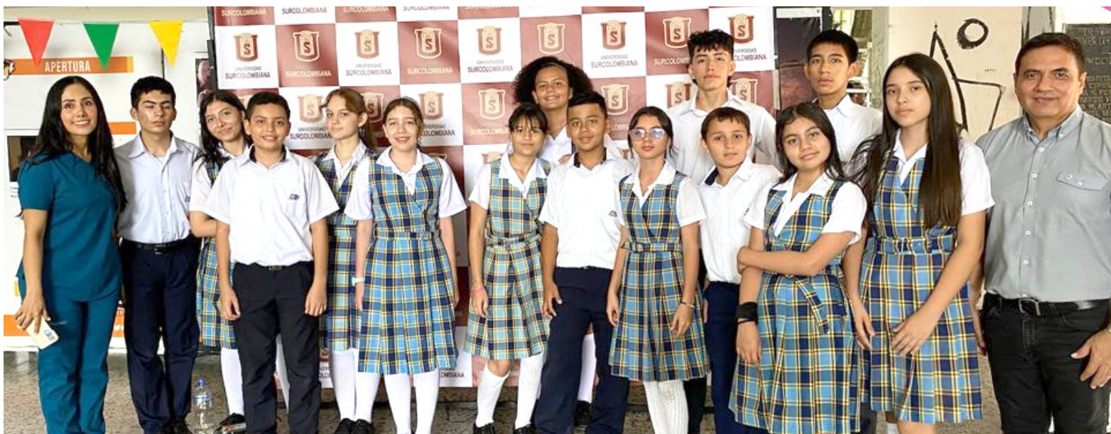
Su vocación de docente y policía se conjuga en la formación de los jóvenes.

En resumen, el papel de la mujer en la Policía Nacional de Colombia es fundamental y está en constante evolución. Su participación activa y su contribución significativa demuestran que la diversidad de género fortalece a la institución y enriquece la labor policial, promoviendo una sociedad más justa y segura para todos los colombianos.