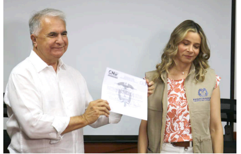
El Gobernador Electo del Huila recibió de manos de la Registraduría su credencial.