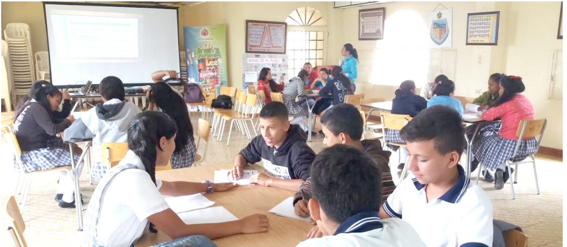
Padres de familia y líderes comunitarios expresan su rechazo a la reestructuración educativa. La falta de diálogo y consulta genera tensiones en la población afectada.

responsabilidad y tener en cuenta tanto las posibles ganancias como las pérdidas. Resulta crucial destacar que este Decreto nunca fue debidamente compartido con la comunidad, motivo por el cual hemos liderado reuniones con padres de familia y presidentes de las Juntas de Acción Comunal para dialogar con la Secretaría de Educación del Huila. En estas reuniones, logramos comprender a fondo la naturaleza de lo que está sucediendo”, indicó el concejal.