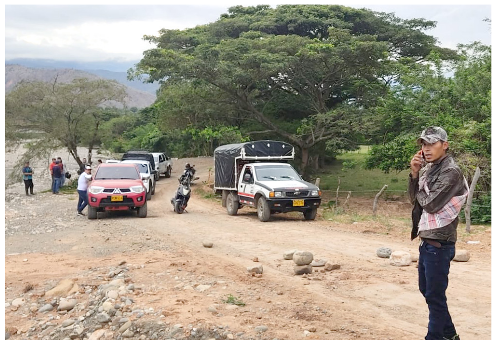
Habitantes del municipio de Colombia bloquean las vías de acceso en un intento desesperado de llamar la atención de las autoridades locales sobre la reorganización educativa que genera preocupación en la comunidad.

La población del municipio de Colombia, en el norte del Huila, manifiesta su descontento ante una reestructuración educativa impuesta por el Decreto 319 de 2023.