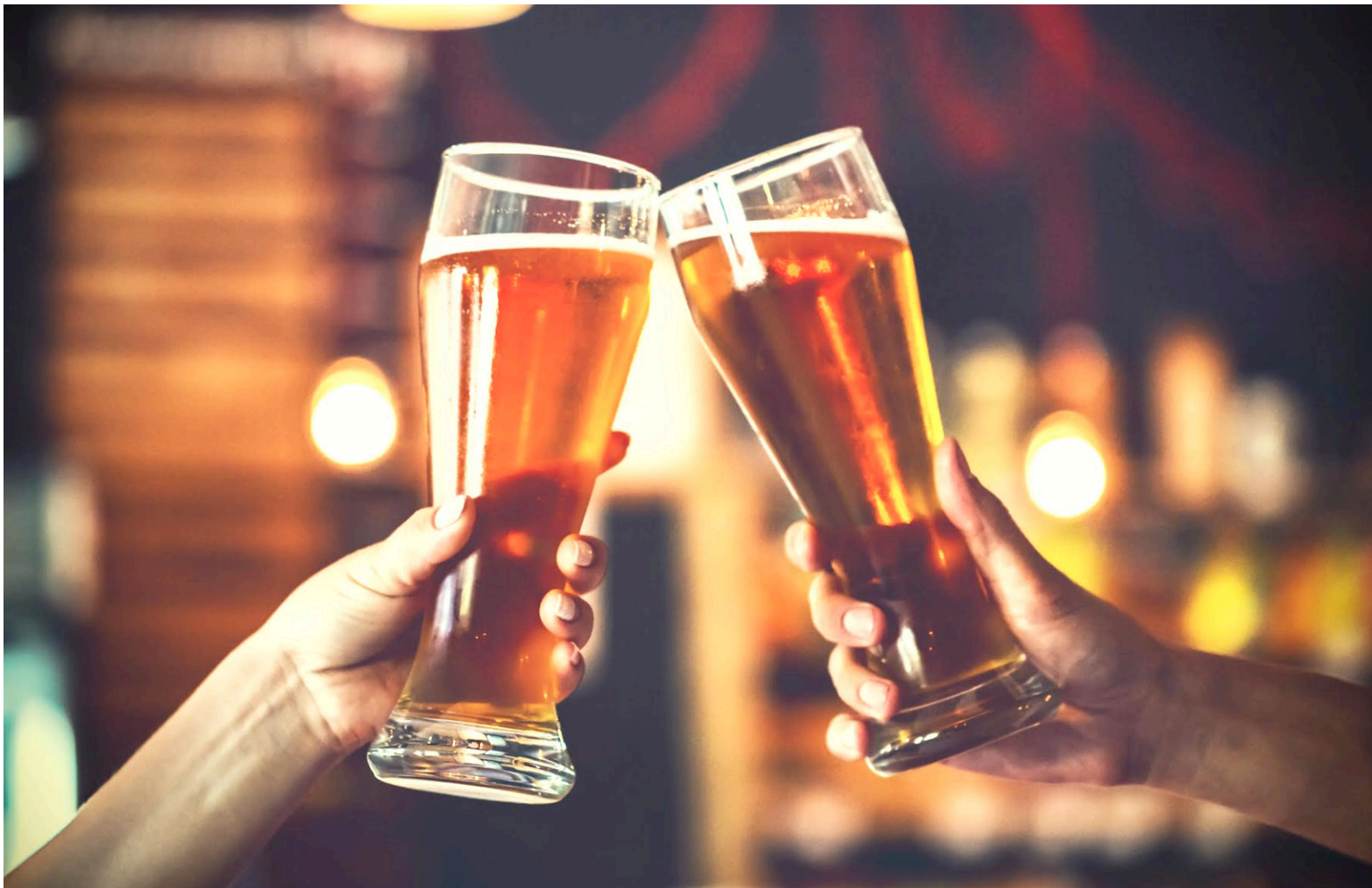
La galanina (1-15) disminuye la motivación por beber alcohol y, además, reduce la recaída alcohólica asociada al contexto en roedores.

en los peluqueros de la familia y hubo también quien se refugió en el alcohol.