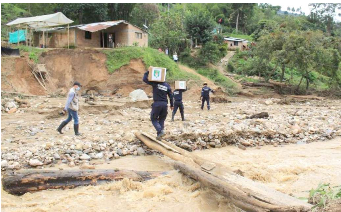
Vía rural municipio de Palermo

El alcalde concluyó que “acá, no solamente se pone en riesgo, la vida, la propiedad, o la vivienda de los ciudadanos timanenses, sino también, la movilidad