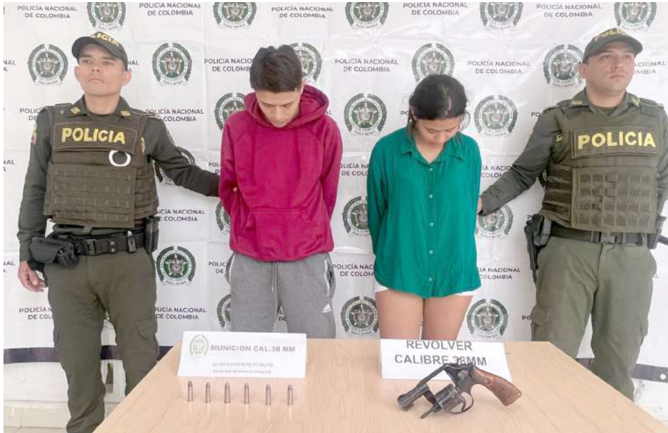
20 personas fueron capturadas en flagrancia.

■ 22 personas comprometidas en distintos hechos delictivos, entre los que se destaca una captura a un menor de edad, así mismo 20 aprehensiones fueron en situación de flagrancia y 2 por orden judicial.