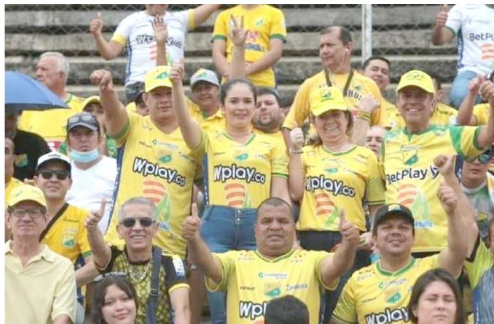
La afición fue un factor fundamental en esta fecha para el Huila.