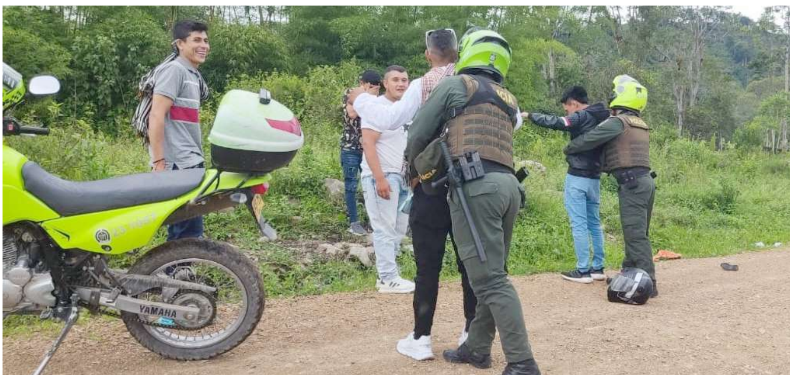
Controles en todo el departamento.

En lo que respecta a la aplicación del Código Nacional de Seguridad y Convivencia Ciudadana, se registraron un total de 73 comparendos por comportamientos contrarios a la convivencia donde resaltaron 49 por porte de armas corto punzantes, 7 por consumir, portar o distribuir sustancias psicoactivas, 4 suspensiones de la actividad al mismo número de establecimientos de comercio, por falta de documentación y realizar actividad diferente a la autorizada, propiciar la ocupación del espacio público, 4 por portar armas neumáticas y 1 por comercializar equipos terminales móviles sin la respectiva autorización.