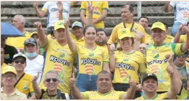
Huila empató en casa ■ Deportes 16