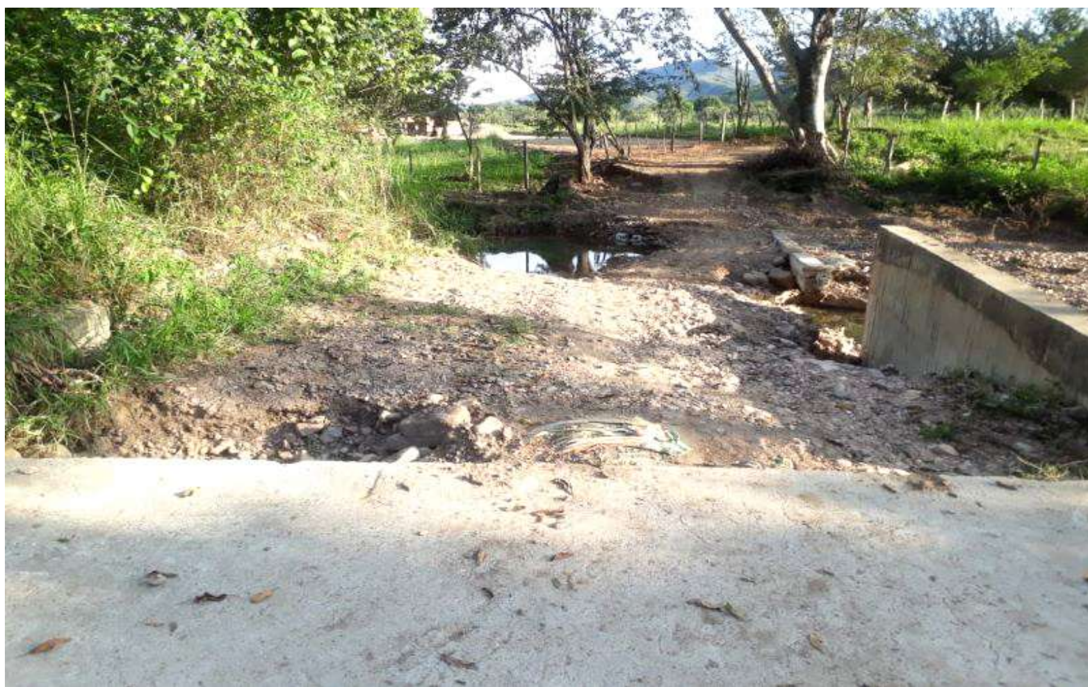
La zona de los costados que se ha ido socavando.

Se han acostumbrado a solucionar por sus propios medios los inconvenientes que les causa este paso fallido, que hasta ingenieros han llevado para que les hagan