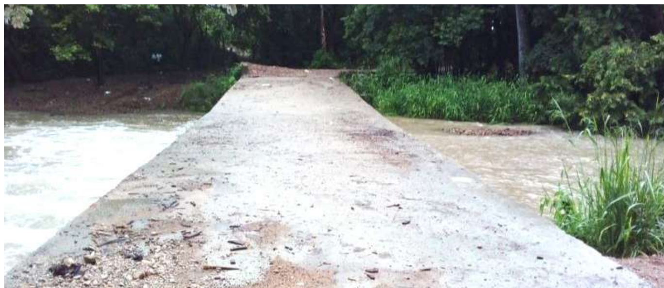
El Muro en la parte alta en la quebrada la sardinata de Palermo

“Pero nunca pensaron que eso se tapanía, quedó mal hecho, en lugar de permitir el flujo del agua de la quebrada la Sardinata se convirtió fue en una barrera”