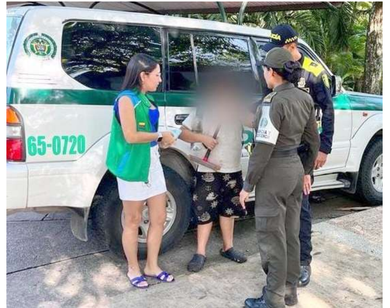
Se le restablecieron los derechos a 6 menores de edad.

Así mismo, le fueron restablecidos los derechos a 6 menores de edad hallados ejerciendo actividades de mendicidad, se realizó la suspensión de la actividad a un establecimiento de juegos de azar y la incautación de una maquina por no cumplir con la documentación exigida.