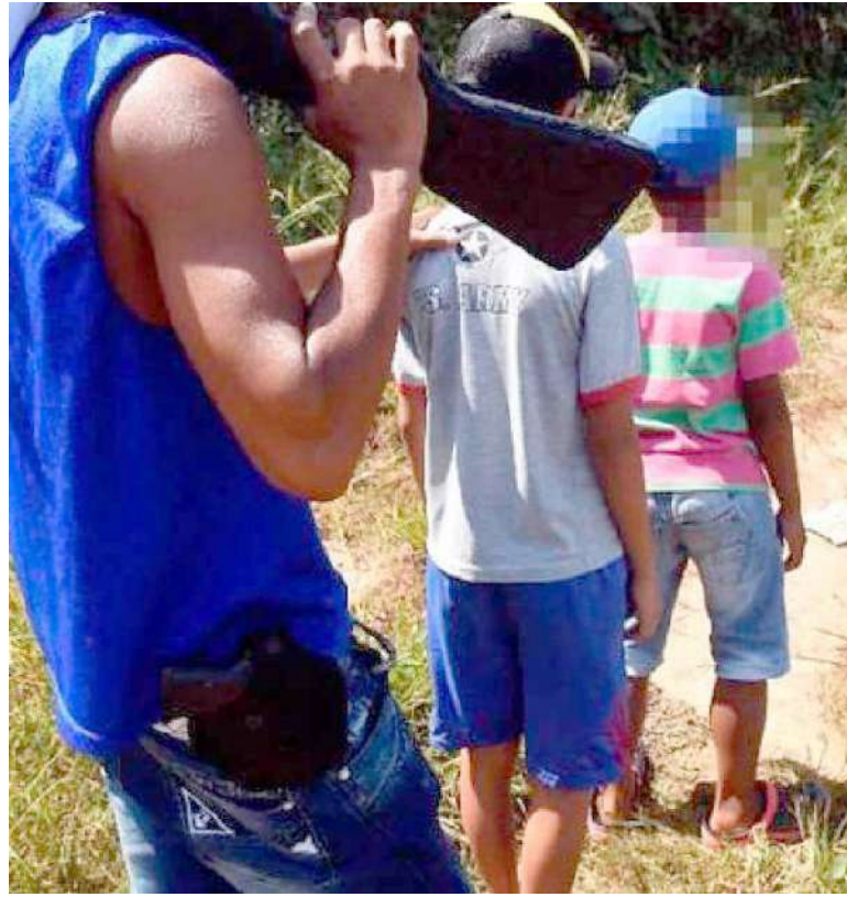
El silencio sepulcral de sus familias han sido el cómplice de la situación.