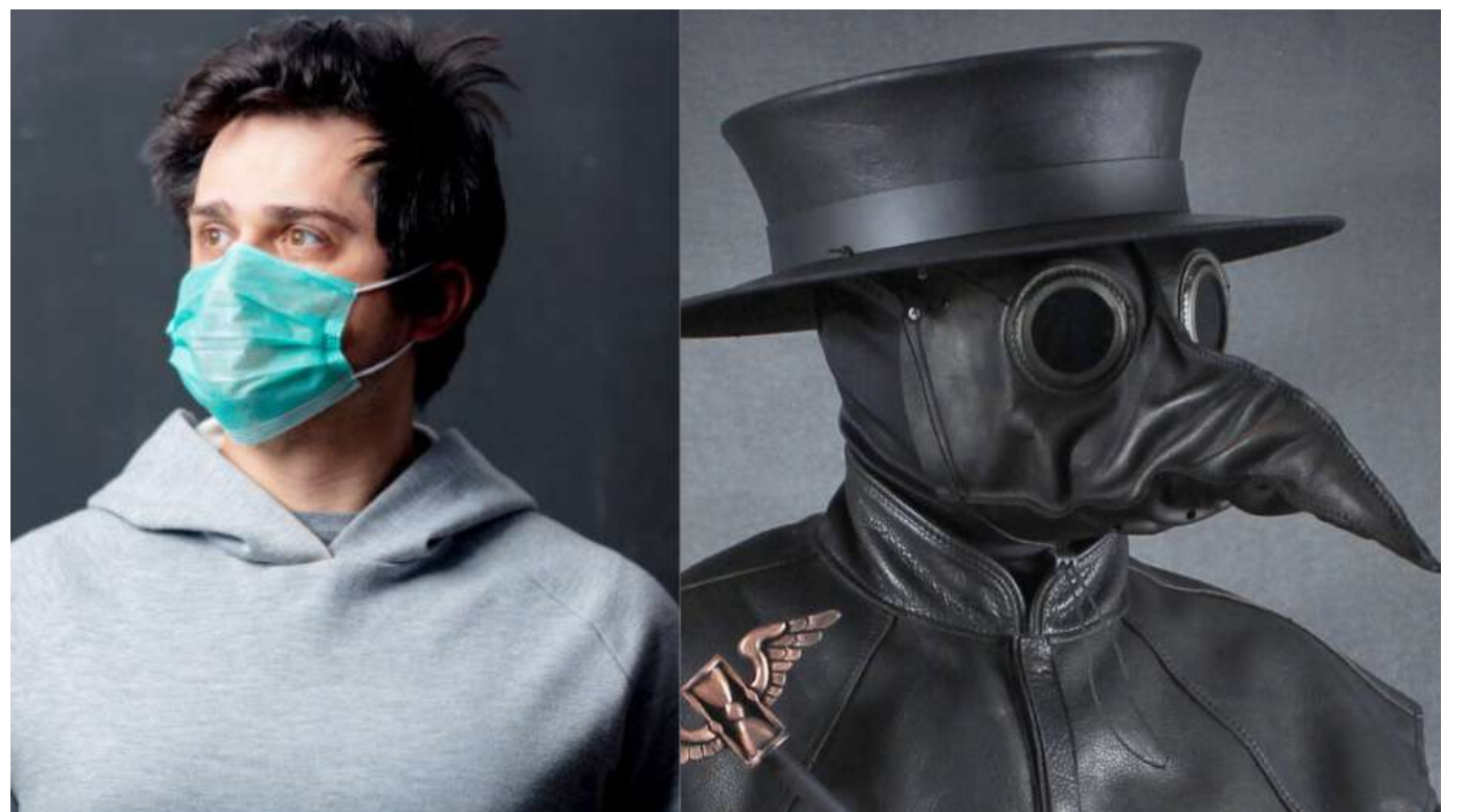
Encuentran cierta relación entre la peste negra y la Covid-19.

El principal hallazgo del estudio, publicado en la revista Nature, tuvo que ver con mutaciones en un gen llamado ERAP2. Si la persona tenía las mutaciones correctas, tenía un 40% más probabilidades de sobrevivir a la plaga.