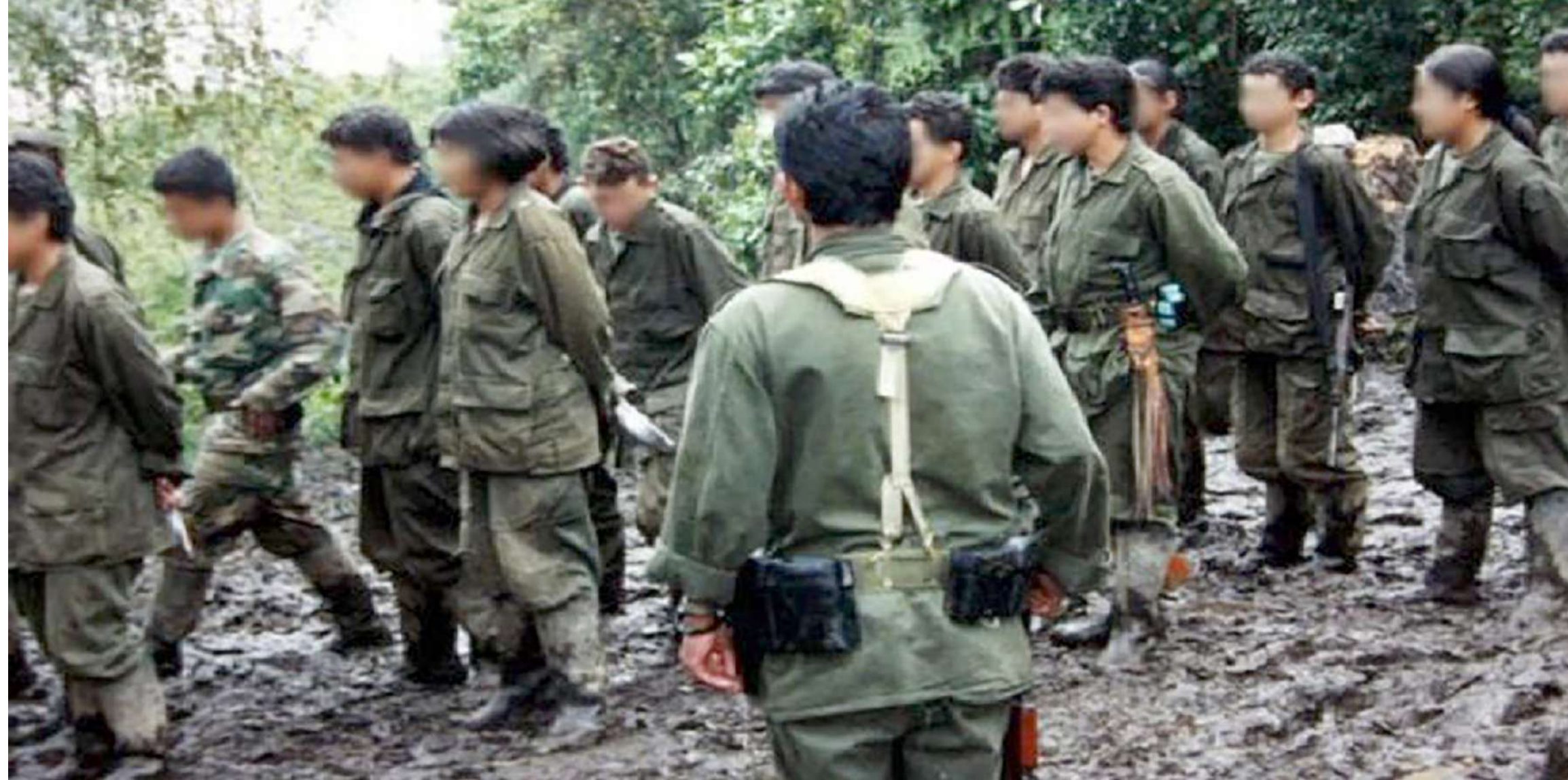
En el Huila en el 2022 se han decepcionado 3 denuncias de reclutamiento de menores.

Según la Novena Brigada con sede en la ciudad de Neiva, este año no se han decepcionado denuncias formales de estos casos y lo mismo sucede en el departamento de Policía Huila. Lo que si confirmó esta última institución es que durante el 2022 ha habido denuncias en los municipios de Guadalupe, Santa María y Tesalia.