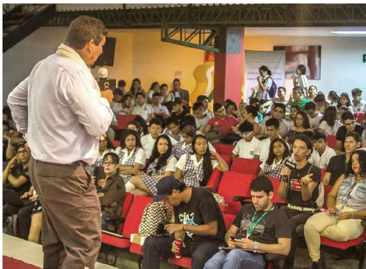
El auditorio Olga Tony Vidales de la Usco vuelve a ser el principal escenario durante el Cinexcusa.

Es en el auditorio de la Usco dónde se dará apertura al evento hoy lunes 24 de octubre, con la proyección de la película Una Madre de Diógenes Cuevas.