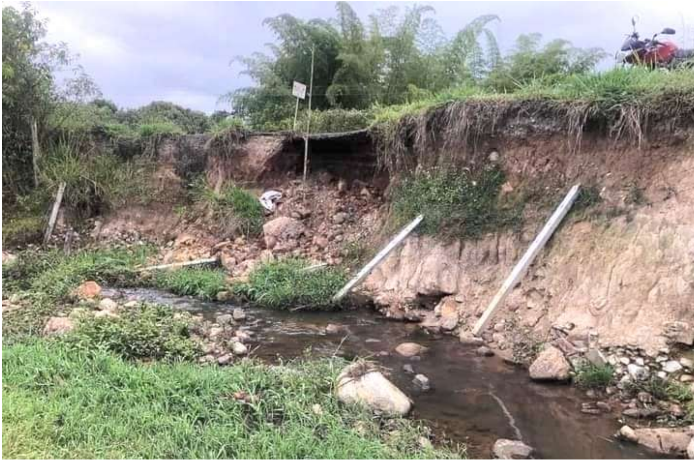
Perdida de banca corregimiento de Guacacallo, Pitalito.

y la transitabilidad, entendiendo que, la ruta al sur, en la carrera cuarta y la carrera tercera, están en peligro y en una posible socavación, entendiendo que, si continúan estas lluvias, en un término no mayor a un mes, estas vías estarían suspendidas por la socavación del agua que se presente por la precipitación, sobre todo por la constante agua que pasa y que esta ad puertas de rebosar este zanjón colorado”.