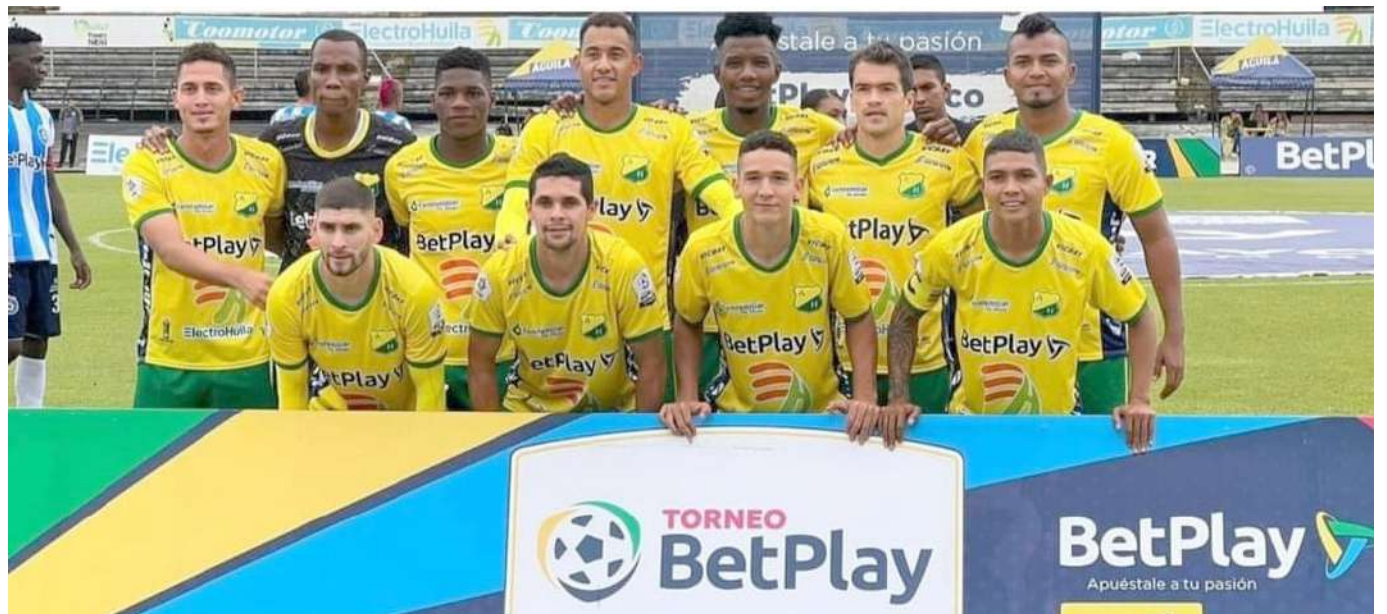
Atlético Huila se mantiene como líder en su grupo.

Quindío fue el gran beneficiado de la jornada tras ganarle a Tigres, mientras el cuadro bogotano sigue en el sótano de la tabla con apenas 1 punto. Huila se perdió la posibilidad de cerrar la primera vuelta