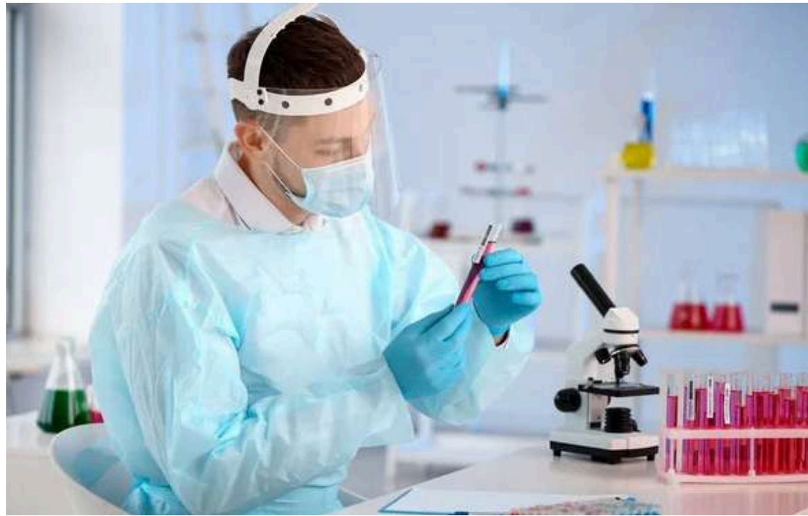
Científicos estudian los genes transmitidos de los antepasados que pueden tener relación con la Covid y la manera como afectan el sistema inmunológico.

“Es como ver el desarrollo de la peste negra en una placa de Petri, eso es revelador”, afirmó el profesor Poinar. Incluso hoy en día, esas mutaciones resistentes a la plaga son más comunes que an-