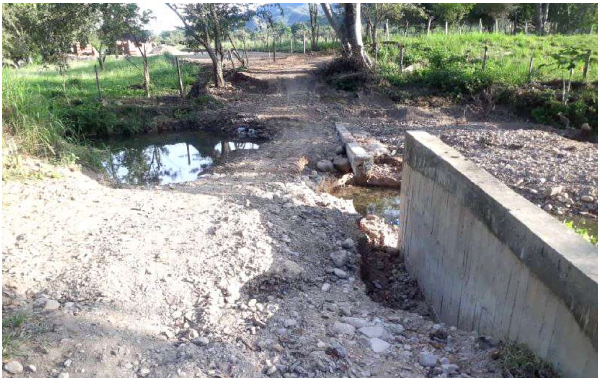
Muro que han construido para tratar que la quebrada vuelva a su curso.