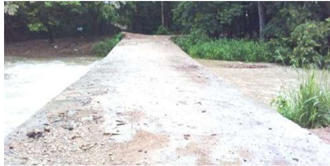
Palermunos preocupados por la batea ■ Regional 8-9