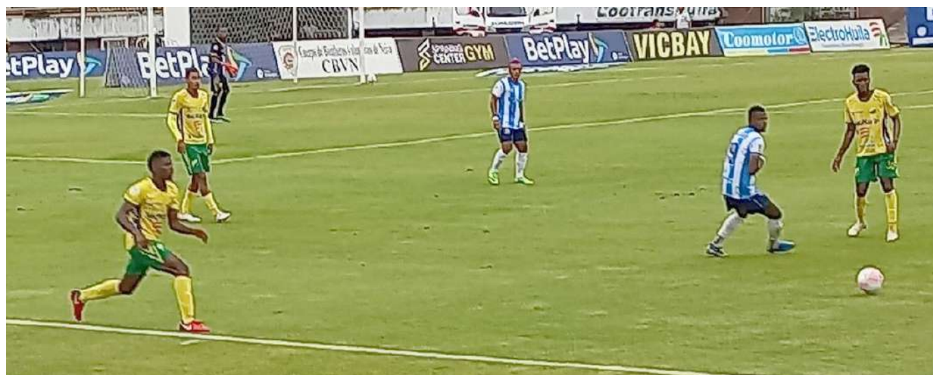
Real Santander sigue siendo el fucú del Huila.

con puntaje perfecto. Los resultados de esta fecha le dan un toque de dramatismo a la cuarta fecha cuando se invierta la localía y Ti-