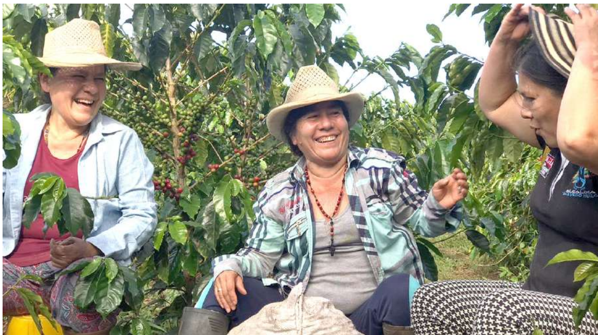
Asociación de Mujeres Cafeteras y Artesanas Martica de Acevedo

Estos cambios resultan muy positivos, pues la actual representante legal, aseguró llegar con muchas ideas y ganas de trabajar para con-