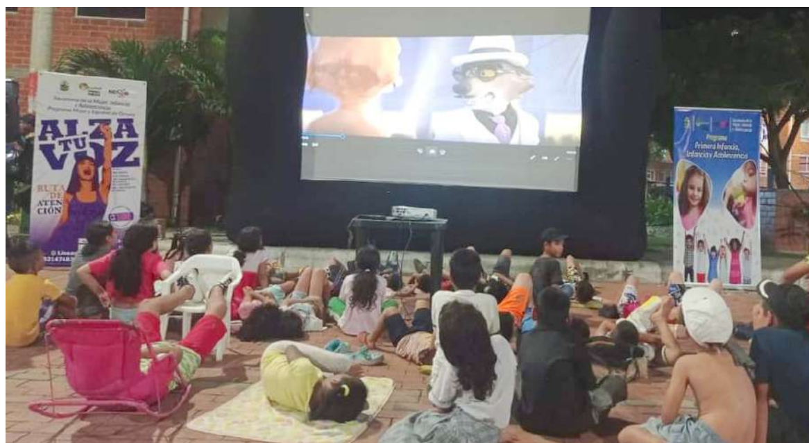
Panorama de participación.