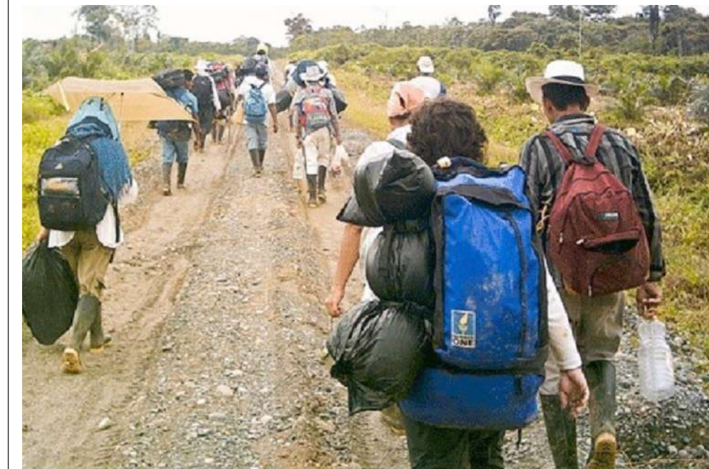
El reclutamiento de menores es solo una problemática de las que sufren los niños, niñas y adolescentes en el marco con conflicto armado.