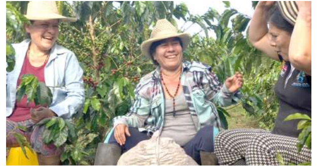
En busca de una renovación ■ Enfoque 6