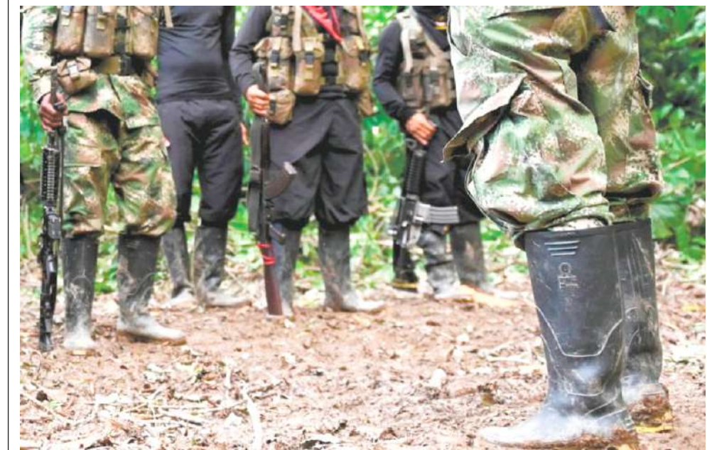
La problemática no termina.

Ese fue el inicio de su "desgracia" pues una vez los jefes del frente 17 se dieron cuenta del hecho, empezaron a amenazar su familia y a desalojarlos de todos los lugares donde lograran encontrar un refugio. Las cartas de amenazas llegaban a diario hasta cuando exigieron que su hermano menor