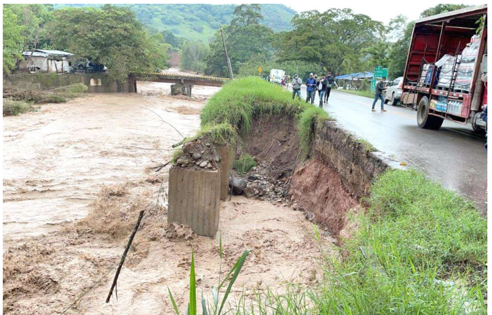
Pérdida de banca de la vía Timana a Pitalito.

De no tener una ayuda inmediata por parte del departamento, por parte de la nación y por parte de la concesionaria ruta al sur, entendiendo, repito, que estos son los dos pasos obligados para conectar la cadena alimentaria del transporte del sur del país, vamos a tomar la decisión de suspender el tráfico.