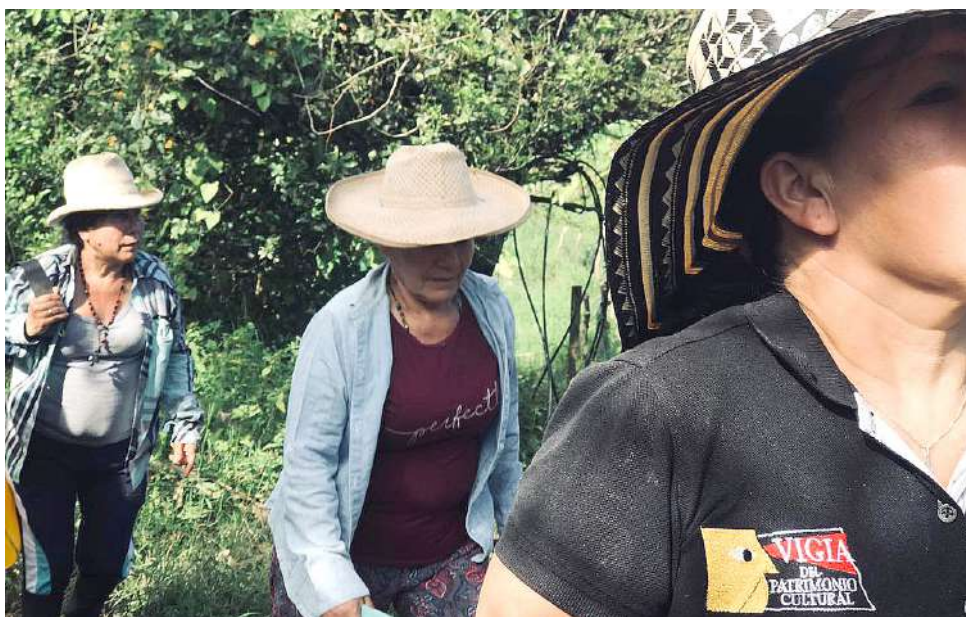
Actualmente son 14 mujeres asociadas.

Finalmente, como mujeres campesinas, se encuentran preocupadas por los diversos problemas que vienen afrontando el campo, por tanto, piden apoyo a las instituciones encargadas para que las apoyen.