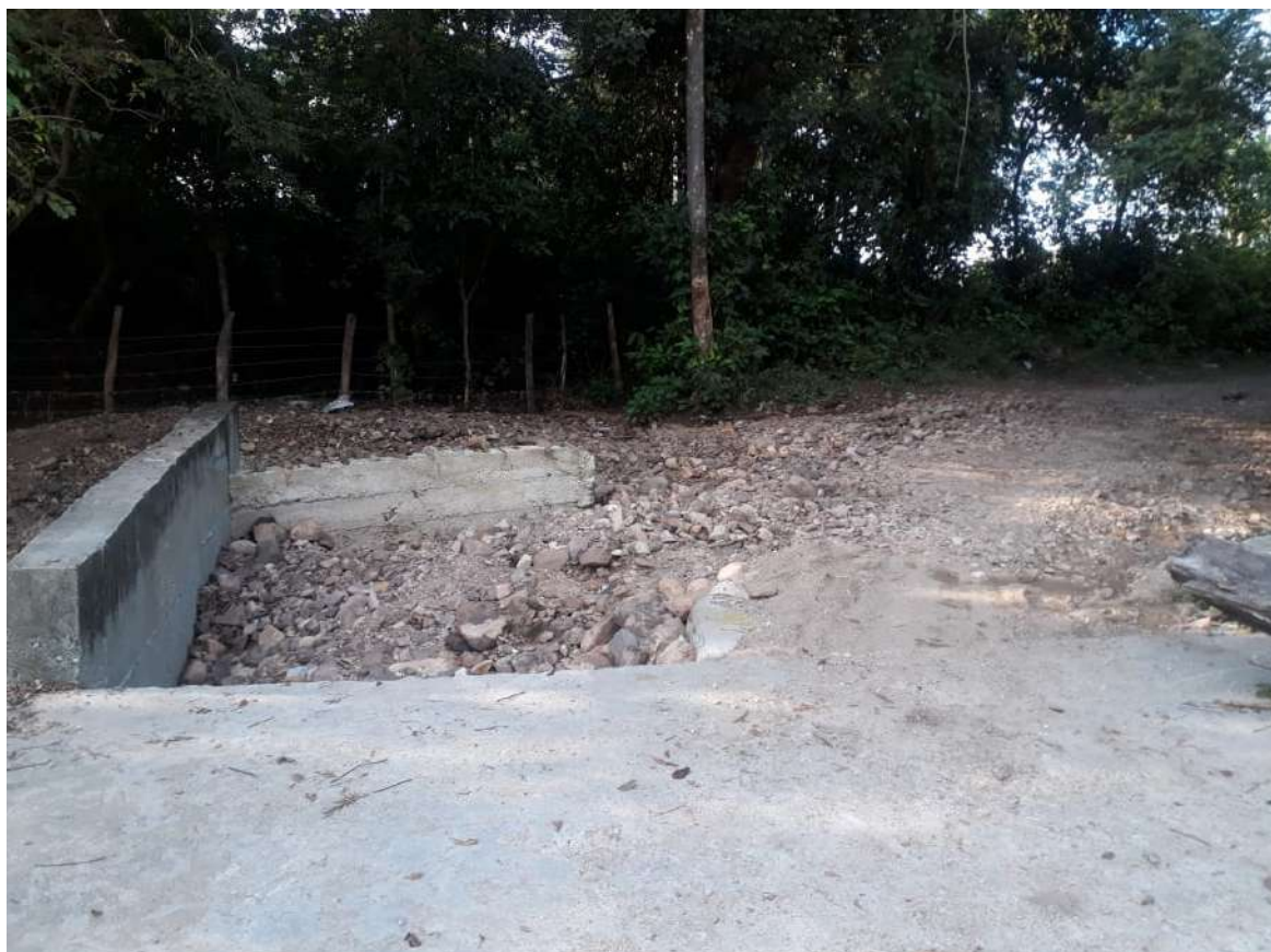
El terreno requiere que se empareje y volver a ser cementado.

“La solución que planteó es que se puede fraccionar el sector y el terreno en pequeños tramos para permitir el paso de las aguas, sobre todo en época de invierno como ahora”