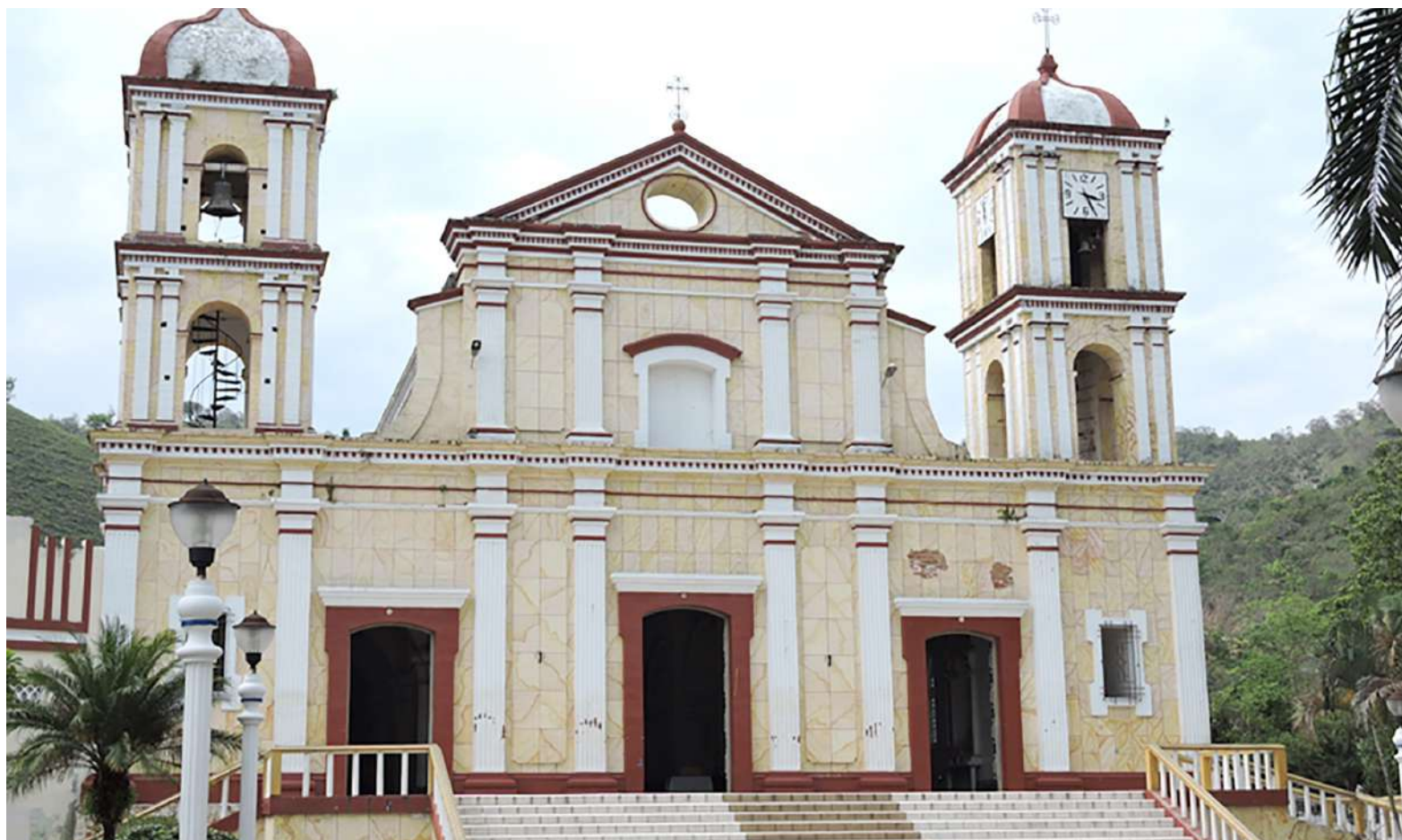
Juez del juzgado Primero Civil del Circuito de Garzón, ordenó el arresto de tres al alcalde del municipio de Guadalupe

Finalmente, ella está desempleada, recibiendo los tratamientos médicos y a la espera de que su situación sea resuelta; mientras que el alcalde dice estar estudiando la situación para poder cumplir lo más pronto posible ¿En qué parará esto?