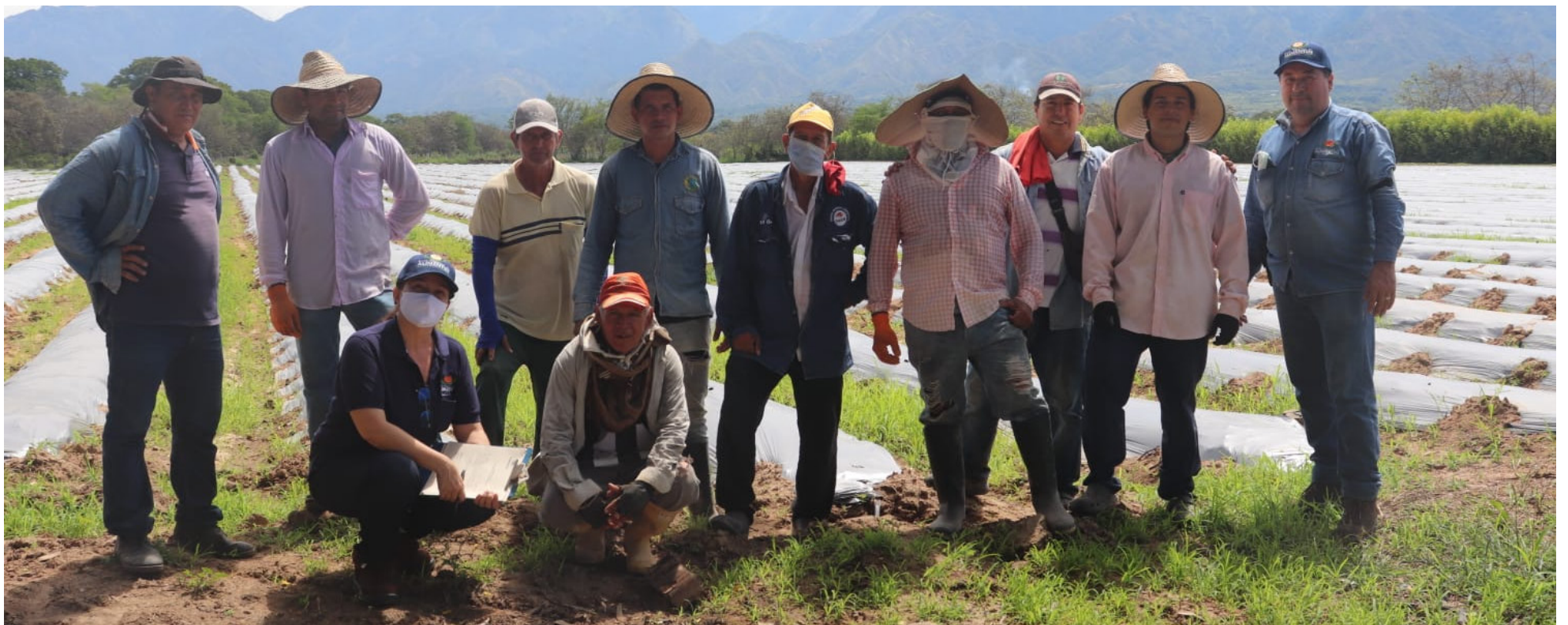
Programa 'Re-agro', que receptiona en las fincas alimentos pequeños o con imperfecciones en buen estado.

Esta entidad benéfica, tiene un programa conocido como Reagro, que consiste en recolectar