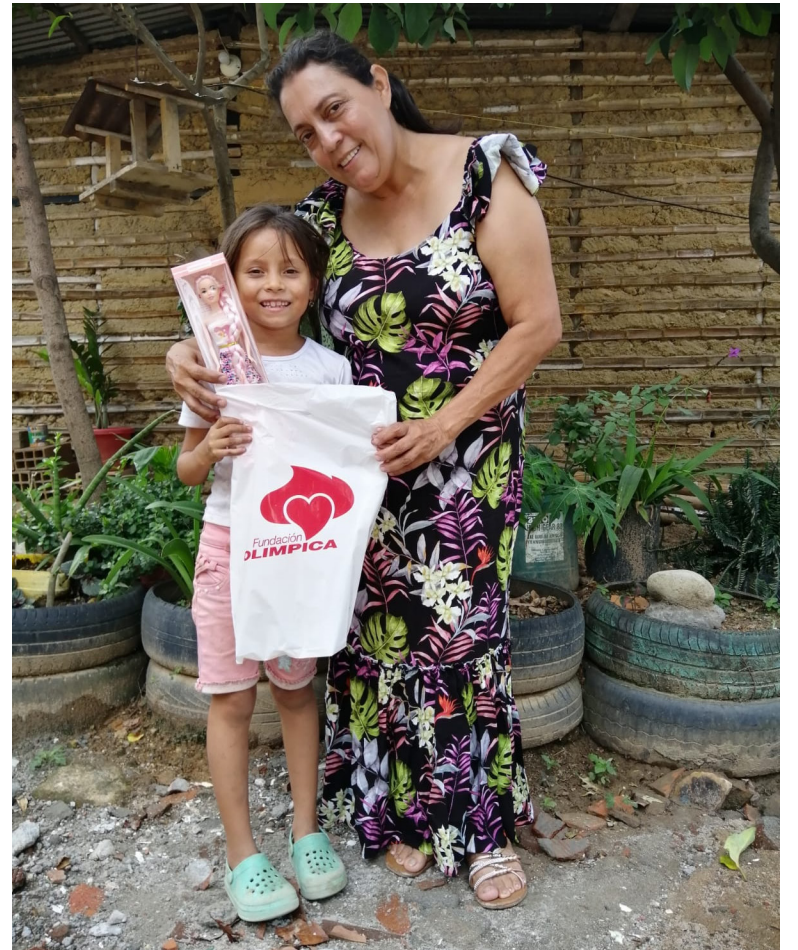
El pasado mes de diciembre la Institución, entregó regalos.

La entidad benéfica, tiene un programa conocido como Re-agro, que consiste en recolectar productos agrícolas en las fincas, que no se comercializan y pueden ser aptos y útiles para familias de escasos recursos. Si contactan los operarios del Banco, ellos van y recogen las donaciones, adonde les indiquen.