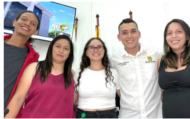
A luchar contra la deserción escolar