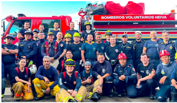
Bomberos voluntarios de Neiva, una labor a pulso