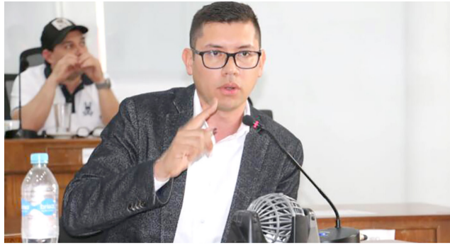
“Por promulgación y defensa de los derechos humanos”