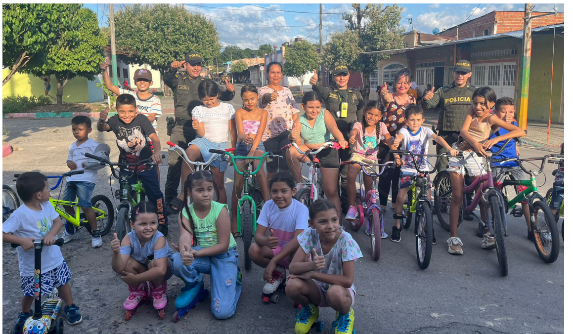
La Policía Metropolitana de Neiva, en cabeza del Grupo de Gestión Comunitaria y en compañía de uniformados adscritos al CAI Ipanema, ponen en marcha la ciclovia al barrio, un espacio para compartir en familia.