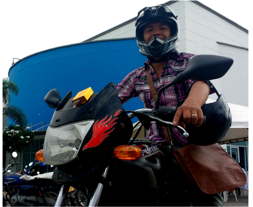
Al no tener trabajo, una fuente de ingresos, sería el mototaxismo.

También, esta situación afecta a los universitarios. “Hice conversatorios en colegios populares, donde los estudiantes, me decían no puedo seguir educándome, porque tengo que trabajar. A veces son quienes sostienen a las familias”, añadió el presidente del Consejo.