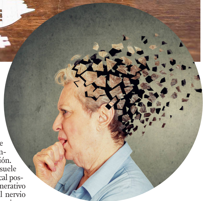
El alzhéimer es el tipo de demencia más común.

abuelos y nietos puede traer beneficios para ambos, como prevenir el deterioro cognitivo, así como enfermedades crónicas como el alzhéimer o la demencia senil, según informó el director Médico, Calidad e Innovación de Sanitas Mayores, David Curto.