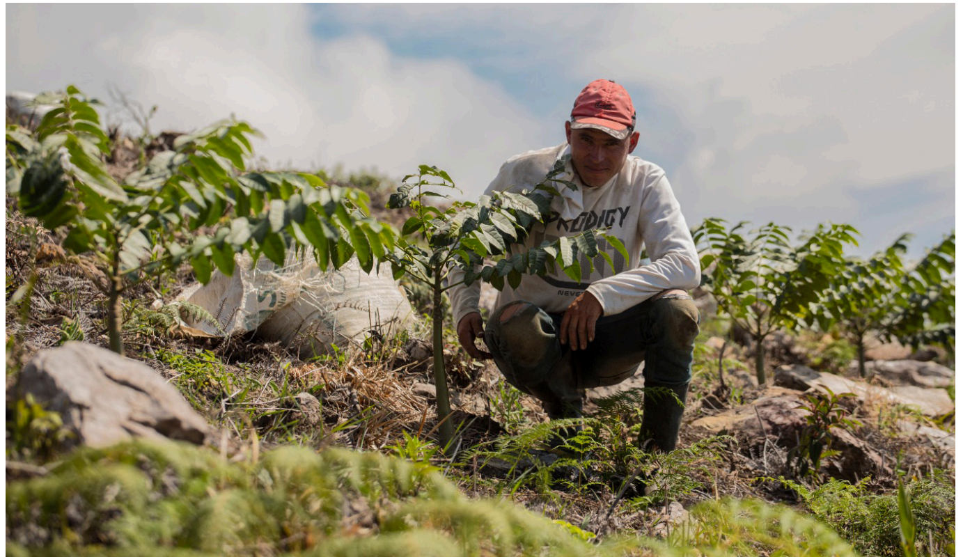
Las elevadas temperaturas en el Huila están afectando la producción de cultivos esenciales como maíz, arroz, cacao, plátano y café, generando pérdidas significativas para los agricultores locales.

Las altas temperaturas generadas por el fenómeno 'El Niño' están ocasionando estragos en la producción de maíz, arroz, cacao, plátano y café en el Huila, impactando gravemente la economía agrícola de la región.