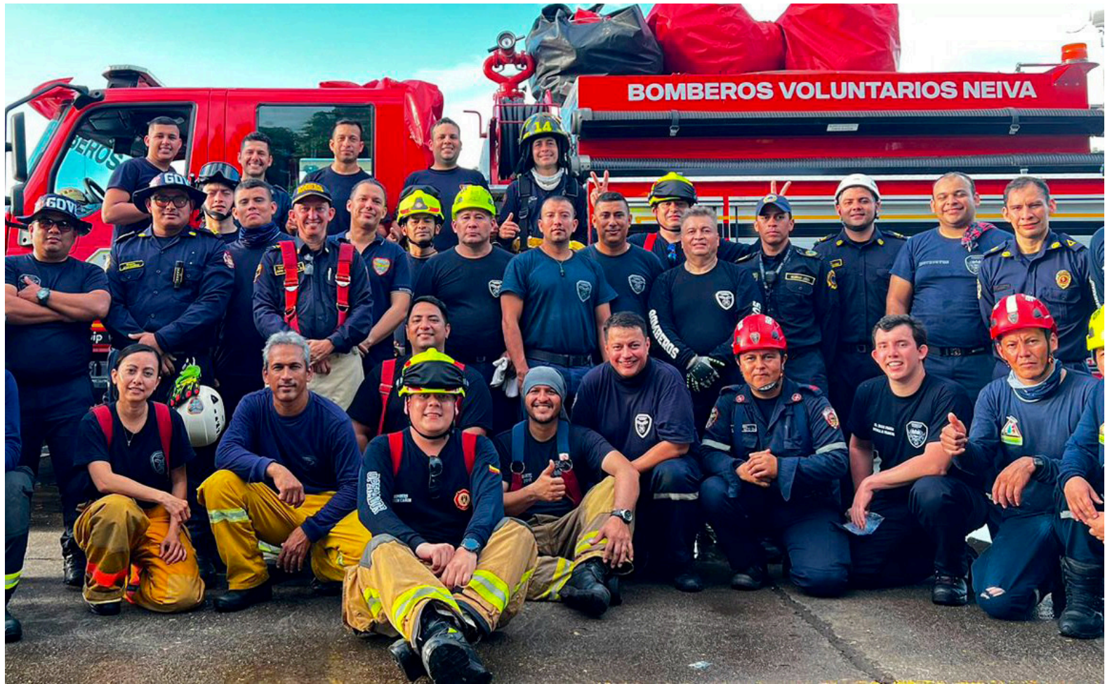
Actualmente cuentan con 76 voluntarios, quienes trabajan de manera altruista en la entidad.

En el contexto de Neiva, donde coexisten Bomberos Oficiales y Voluntarios, han surgido conflic-