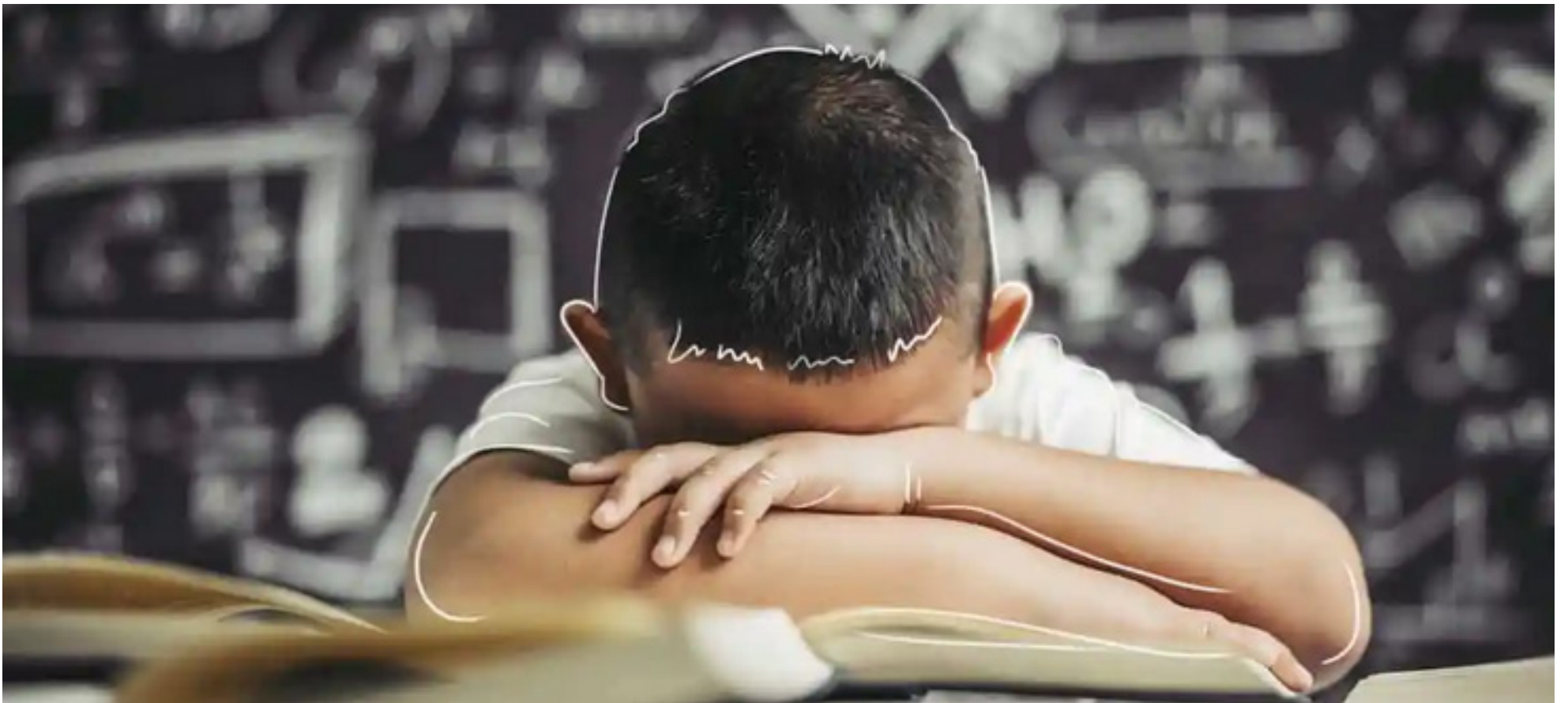
La deserción escolar preocupa al presidente del Consejo de Juventud.