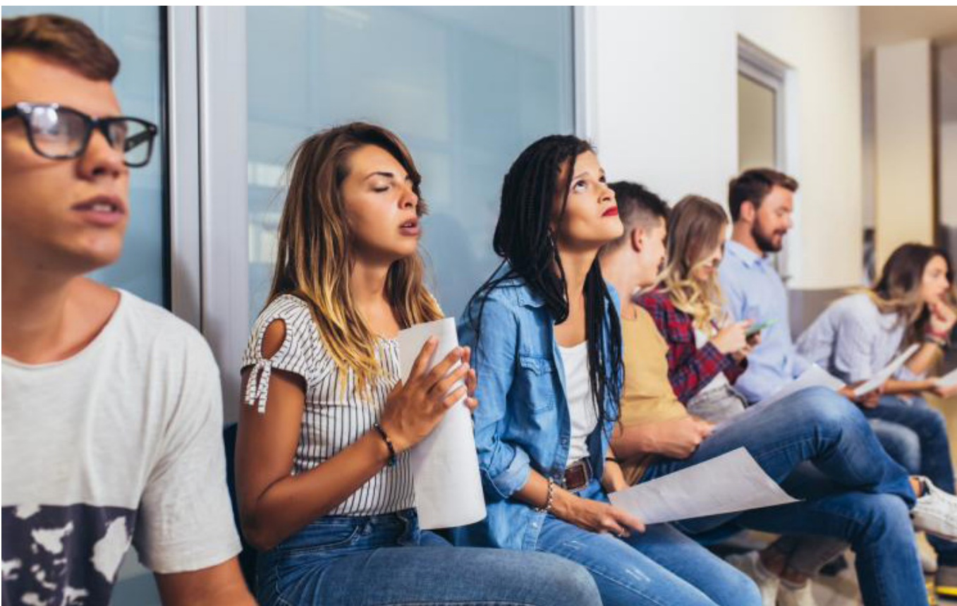
La falta de empleo otro ‘dolor de cabeza’ que afecta a los muchachos.

“Se entenderán por empleados, los trabajadores dependientes por los cuales el empleador haya cotizado el mes completo al Sistema General de Seguridad Social en la Planilla Integrada de Liquidación de Aportes, PILA. Con un ingreso base de cotización, de al menos un salario mínimo legal mensual vigente y que estén afiliados como empleados del postulante en el Registro Único de Afiliación, RUAF y realicen aportes en todos los subsistemas que le correspondan”, indica el decreto.