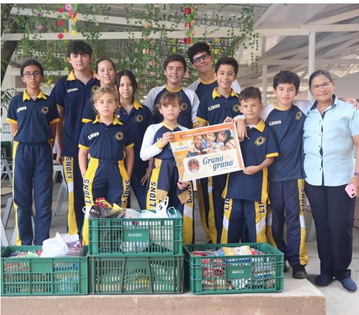
Las Instituciones Educativas se han vinculado a la campaña ‘grano a grano’.

Ya para finalizar, el sacerdote dijo: “el Banco Diocesano, se sostiene gracias a la generosidad, por esta razón los invitó a las personas de buen corazón a que realicen las donaciones, que sin duda, los beneficiarios se lo agradecerán infinitamente”, finalizó el sacerdote.