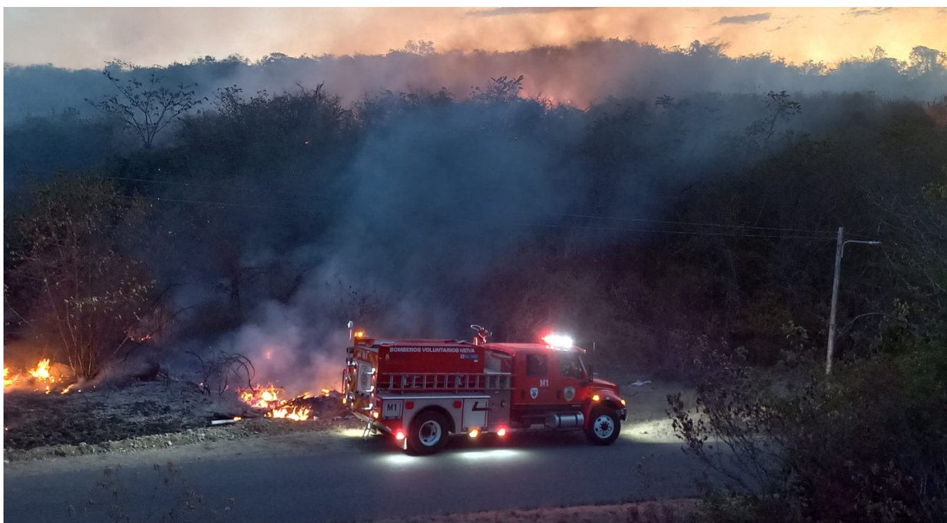
Hay optimismo con la nueva administración, pues aseguran que han pasado tres que solo han dejado promesas y nada concreto.

El Cuerpo de Bomberos Voluntarios de Neiva, reactivado en 2015, ha labrado un camino de esfuerzo y dedicación, buscando el merecido reconocimiento por su labor altruista.