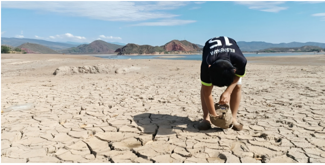
Pescadores denuncian crisis en el embalse de Betania