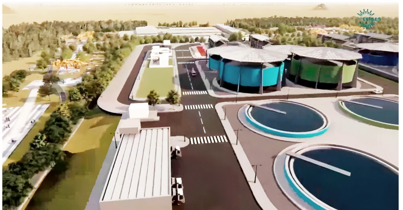
Los nuevos estudios ambientales podrían costar $3.000 millones.

Y los lotes que se compraron para ubicar la PTAR, será en la parte norte del Puente Santander.