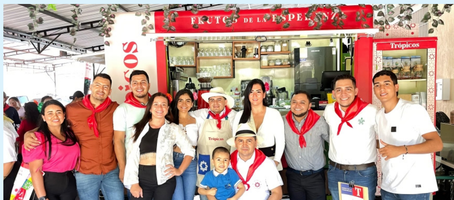
Femncafe, es la cooperativa detrás de este proyecto, integra a más de 1.340 firmantes del Acuerdo de Paz.

Aunque enfrentaron dificultades, como el desplazamiento por violencia, la Federación sigue adelante, presente en siete departamentos y con 28 formas asociativas. La nueva tienda de café