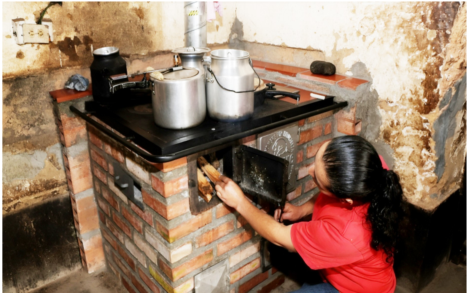
Las familias del campo, aun cocinan con leña, afectando su salud.

“Por esta causa nos encontramos realizando, todos los esfuer-