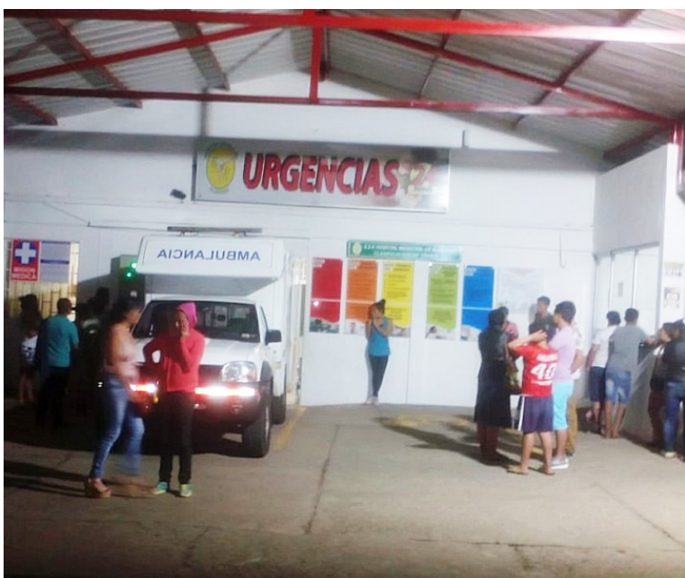
El Hospital, se encuentra en una falla geológica.

Estas campañas seguirán por el departamento del Huila; en Acevedo hoy 19 de diciembre, y en San Agustín este 20 de diciembre, con las que se espera que en esta navidad y fin de año, se registren menos accidentes y muertes a causa de siniestros viales.