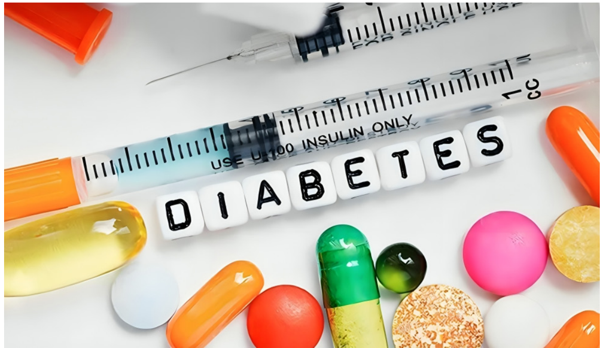
La diabetes se puede tratar y sus consecuencias se pueden evitar.

■ La diabetes es una enfermedad metabólica crónica caracterizada por niveles elevados de glucosa en sangre (o azúcar en sangre), que con el tiempo conduce a daños graves en el corazón, los vasos sanguíneos, los ojos, los riñones y los nervios, de acuerdo con la Organización Panamericana de la Salud.