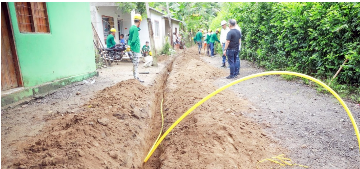
Catorce veredas, se beneficiarán con gas domiciliario.