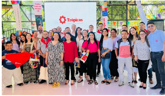
Firmantes de paz transforman el café en el Huila