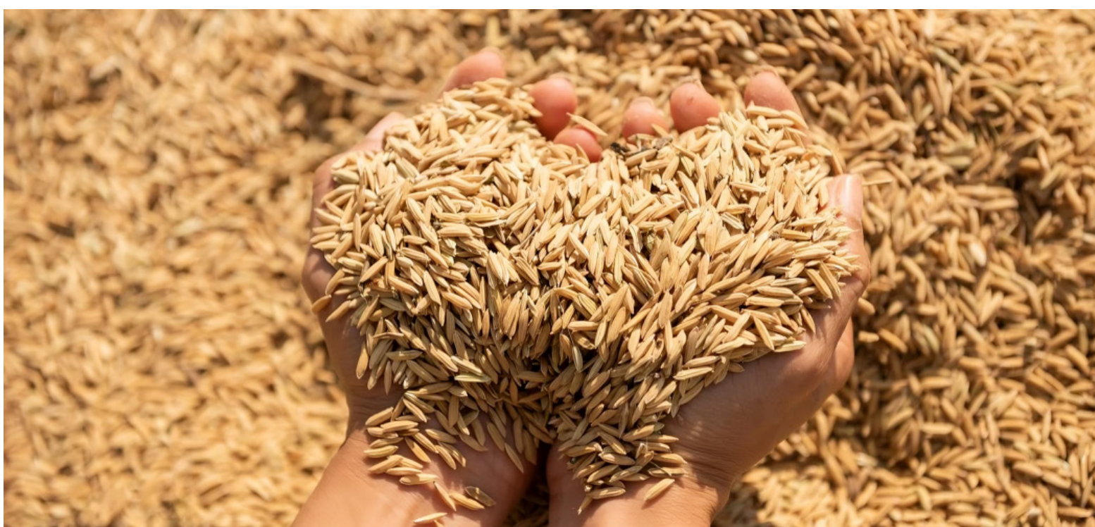
El gremio subrayó que la sostenibilidad del sector arrocero es fundamental para la economía rural y la seguridad alimentaria del país.

Hoy, la industria molinera paga 210 mil pesos por la carga de arroz paddy y además es panorama no es nada alentador si se tiene en cuenta que es posible que continúe la tendencia a la baja en los próximos días.