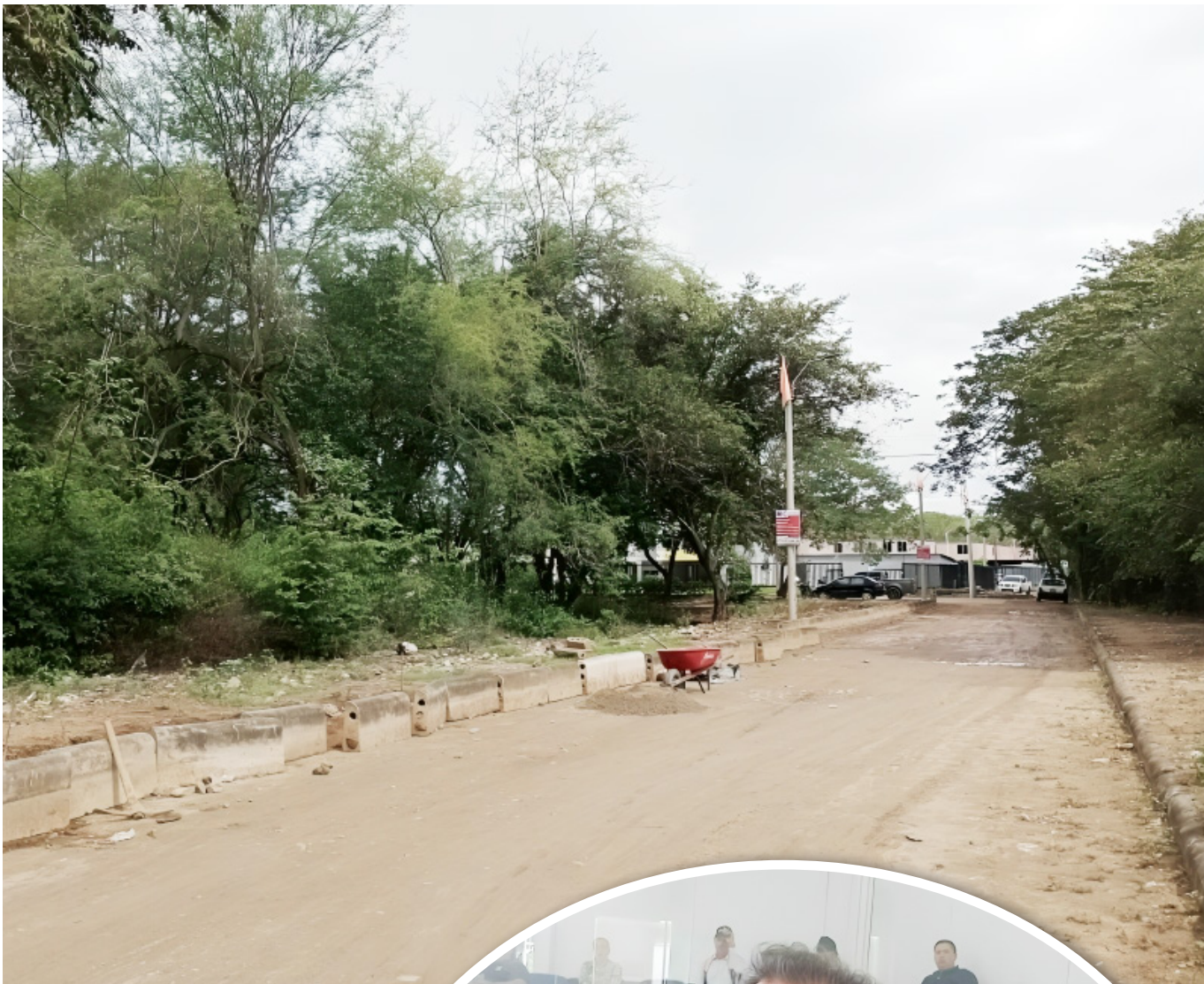
El predio donde se pensaba construir la PTAR, se ha urbanizado más.

ra fase del proyecto. De continuar en este sentido, el proyecto tiende el fracaso”.