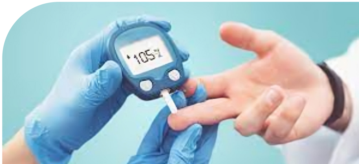
Las complicaciones de la diabetes a largo plazo se desarrollan de manera gradual.

Diabetes tipo 2: es la más común y el cuerpo no produce o no usa la insulina de manera