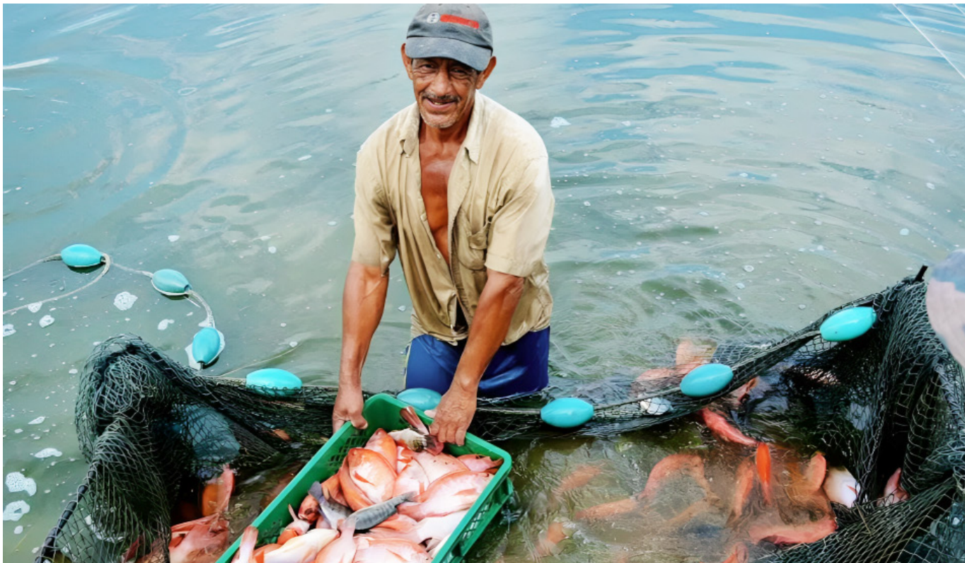
Los pescadores artesanales han hecho un llamado de auxilio.

asegura el representante de los pescadores artesanales.