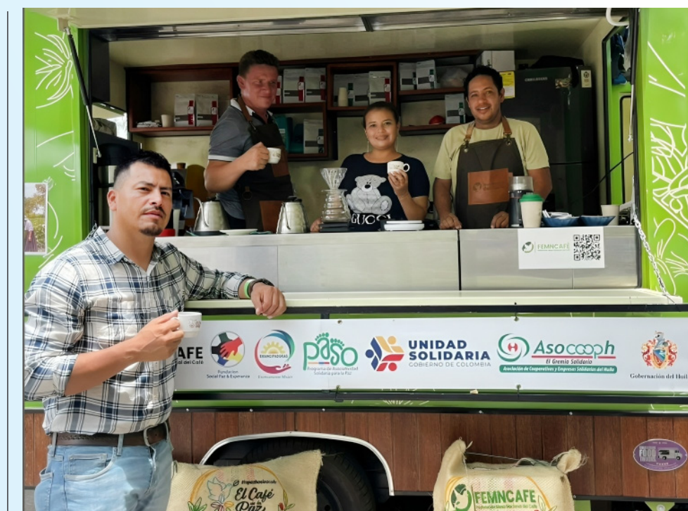
La iniciativa busca estabilizar la vida económica de los firmantes y sus familias.

Femncafe, la cooperativa detrás de este proyecto, integra a más de 1.340 firmantes del Acuerdo de Paz y trabaja en siete departamentos, promoviendo la producción y comercialización de café de alta calidad. Con el respaldo de organizaciones internacionales, estas iniciativas no solo mejoran las condiciones de vida de las comunidades, sino que también envían un poderoso mensaje de esperanza y resiliencia en tiempos de conflicto.