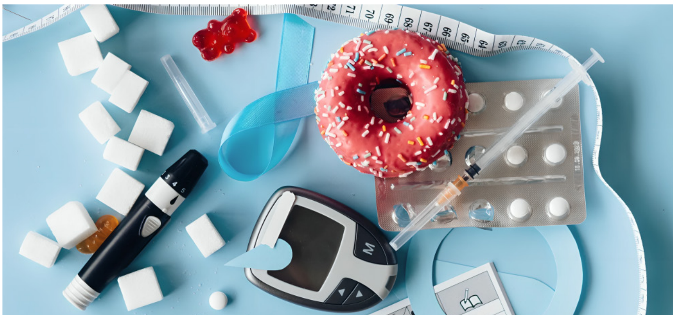
Un estilo de vida saludable es importante para tener una buena salud.

En 2019 la diabetes fue directa responsable de 1,5 millones de defunciones en el mundo, según la OMS.