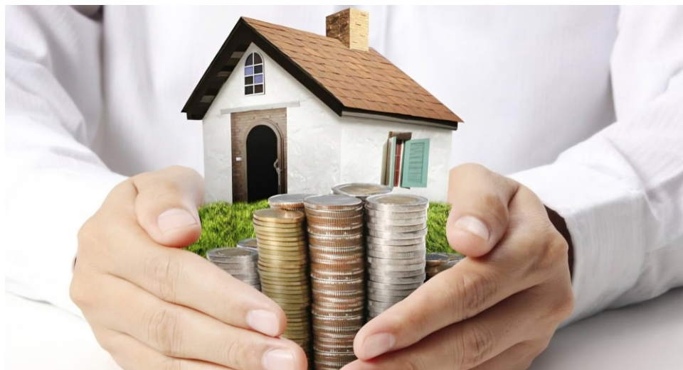
Se busca que los impuestos a la renta y el patrimonio sean recaudados y administrados por los departamentos.

Varios analistas a nivel nacional han criticado la propuesta, señalando que al ser los impuestos a la Renta y al Patrimonio los que van a pasar a ser administrados directamente por los departamentos, los entes territoriales que tienen menos densidad poblacional se verán perjudicados, ya que no recaudarían suficientes recursos, ante esto el exministro vallecaucano señaló que igualmente se pretende crear un fondo de solidaridad, en el que los departamentos con más recaudo apoyen a los que no lo tienen, “tenemos que recordar que en nuestro país hay 32 departamentos donde las necesidades y los enfoques son distintos, es así que la fórmula de distribución de los recursos debe ser a partir de los requerimientos de cada territorio de modo que no podemos suponer que todos