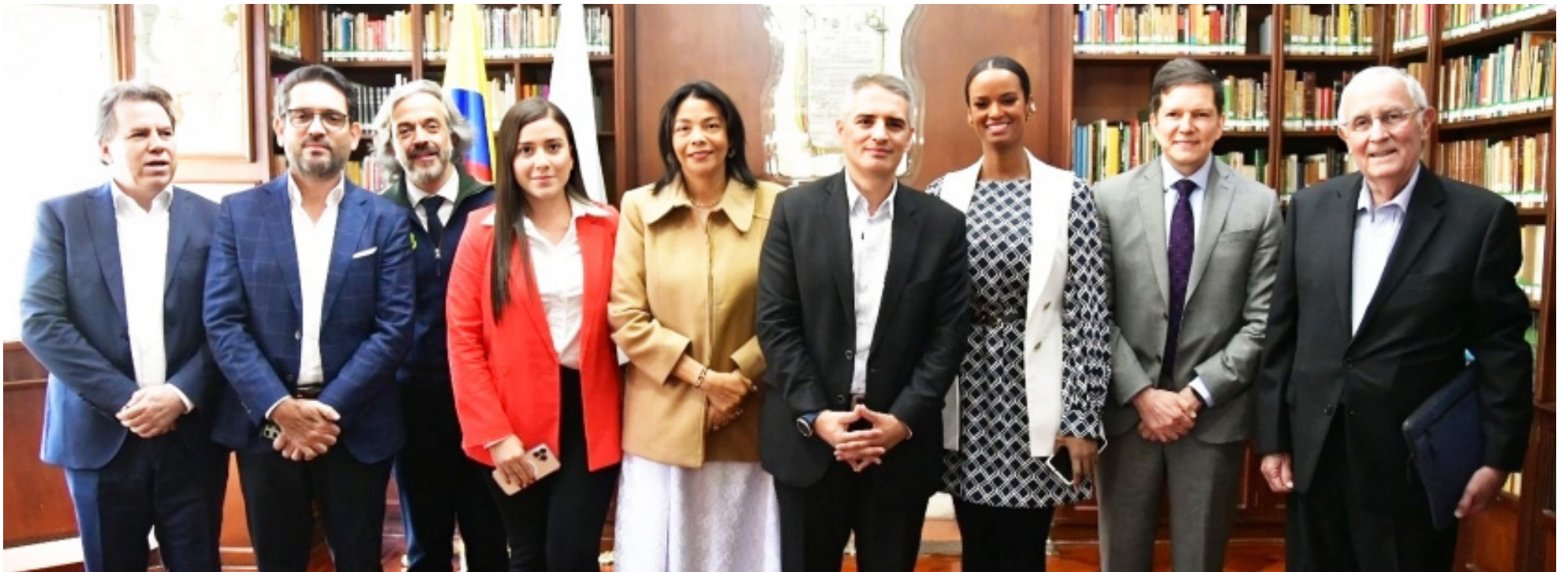
El equipo de impulso de la iniciativa fue reconocido por la Registraduría mediante la Resolución 6343 del 27 de junio del 2024