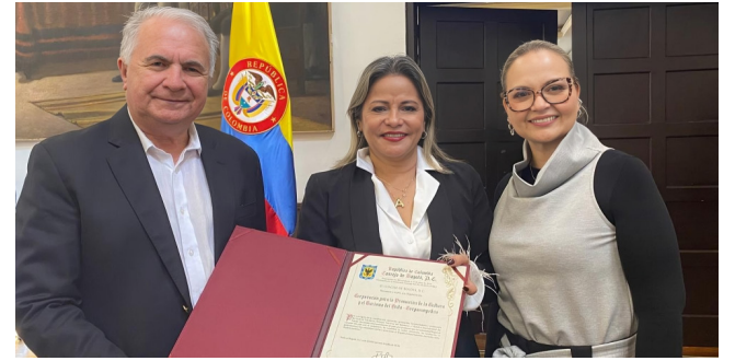
Gobernador fue exaltado por el Concejo de Bogotá