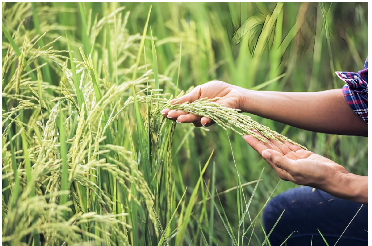
El arroz es uno de los alimentos preferidos por los colombianos.

En el documento, se recomendó la implementación de un in-