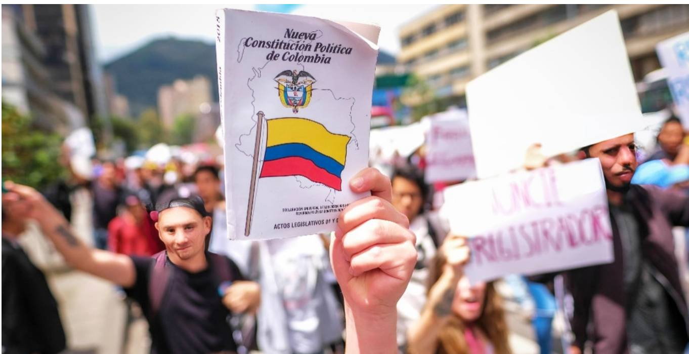
El referendo propone agregar un parágrafo al artículo 298 de la Constitución Política.

Desde el momento de la expedición de la Resolución 6343, el comité de impulso de referendo tiene un plazo de seis meses para recoger las firmas necesarias, que luego pasarían a evaluación de la Registraduría, posteriormente al Congreso y desde allí hasta la Corte Constitucional, eso significaría que al momento de llegar a los electores, el referendo coincidiría con los tiempos electorales del 2026, lo que según varios analistas políticos se puede leer como un intento por activar en las regiones a la ciudadanía y que la oposición llegue fortalecida a los comicios. Ante esta insinuación el exministro de Justicia señaló que, aunque los tiempos coinciden, la iniciativa no tiene un afán electoral, “es parcialmente cierto en que coinciden los tiempos del ejercicio del referendo con los comicios de los años venideros porque los primeros seis meses desde luego es para recoger las firmas, estamos hablando finales del 2024, luego pasaría al congreso, la legislación arranca en marzo del año entrante, pongamos que lo tengan listo en septiembre y octubre y luego pasa a la Corte Constitucional, entonces digamos que estamos hablando necesariamente que esto se iría para marzo del 2026 antes de las elecciones parlamentarias, de modo que los tiempos coinciden un poco, pero esto nada tiene que ver con que vayamos en contra del gobierno, simplemente lo que se busca es un beneficio de las personas que más lo necesitan para que vean que estos recursos no se les vayan”, aseguró.