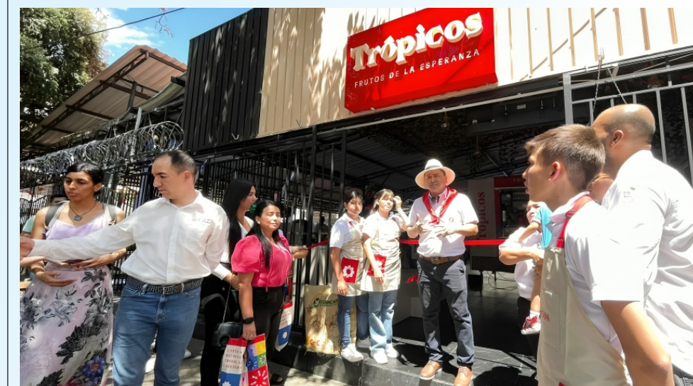
El impacto social de estas iniciativas es significativo.