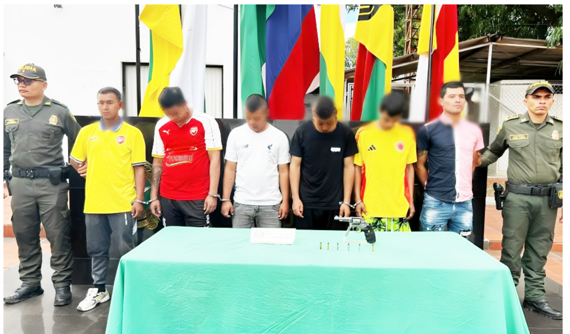
Policía Nacional captura 6 hombres por el delito de fabricación, tráfico, porte, o tenencia de armas de fuego. Incrementan controles en las diferentes comunas de la capital huilense.