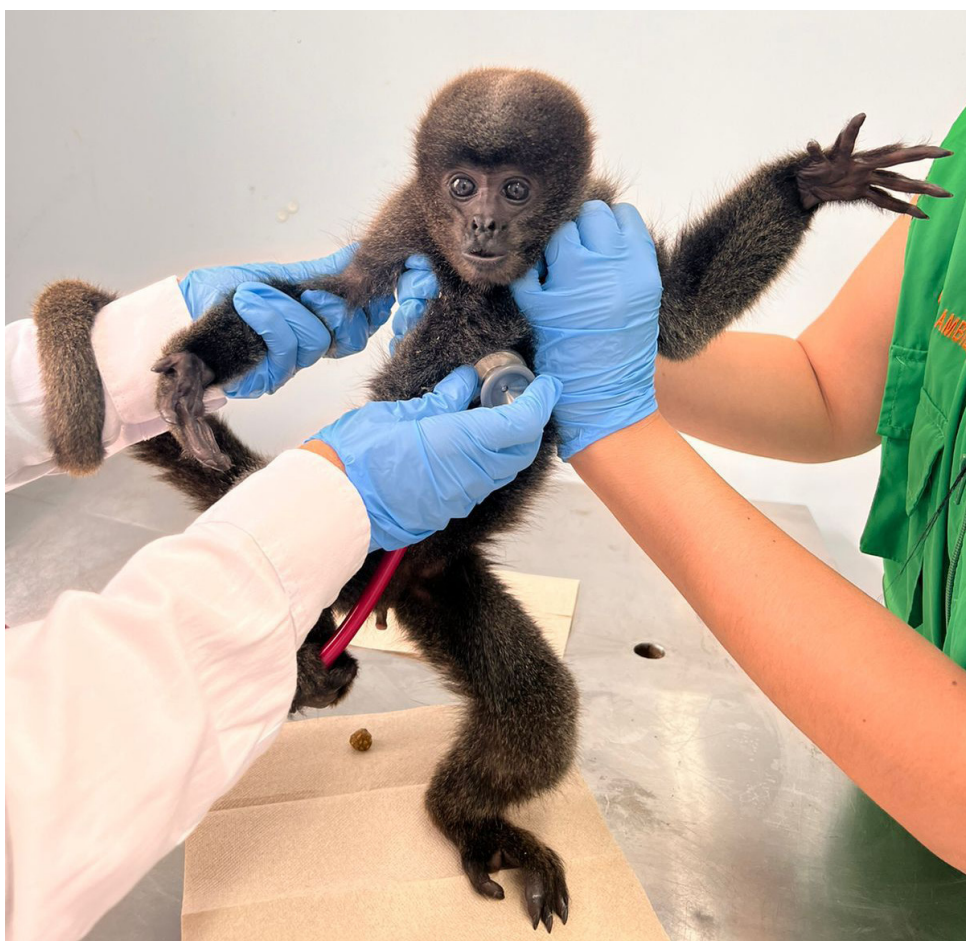
Tienen registrados casos donde se auto-mutilan (primates), se encuentran flacos, porque los acostumbran a suministrarles comida de sal.

Y de los 27 mamíferos que fueron captados en cámara trampa, 5 se encuentran amenazados, y 14 se encuentran incluidos en los listados CITES que prohíbe o regula su comercio internacional. Las especies más abundantes fueron el Guara (Dasyprocta punctata), el oso de anteojos (Tremarctos ornatus), el cusumbo (Nasua nasua), el tigrillo (Leopardus tigrinus), Ardillas (Syntheosciurus granatensis), la Taira (Eira barbara) y la danta de montaña (Tapirus pinchaque).