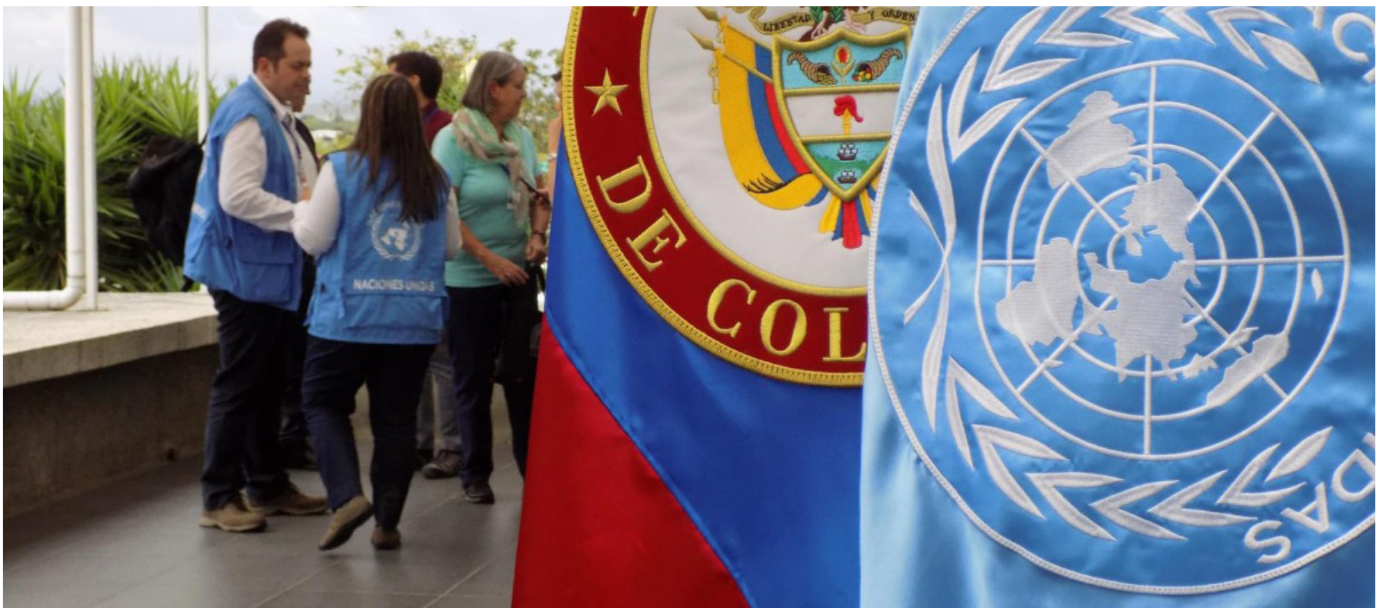
La Organización de Naciones Unidas (ONU).

El jefe del Estado colombiano también se refirió a la "destrucción de la democracia por la corrupción y por la toma armada de territorios por organizaciones criminales en América Latina".