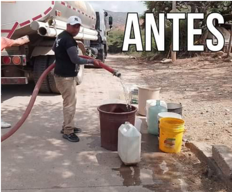
Les llevaban el líquido en carrotaques.

un acueducto alterno, pero ante la fuerte sequía, se secó”.