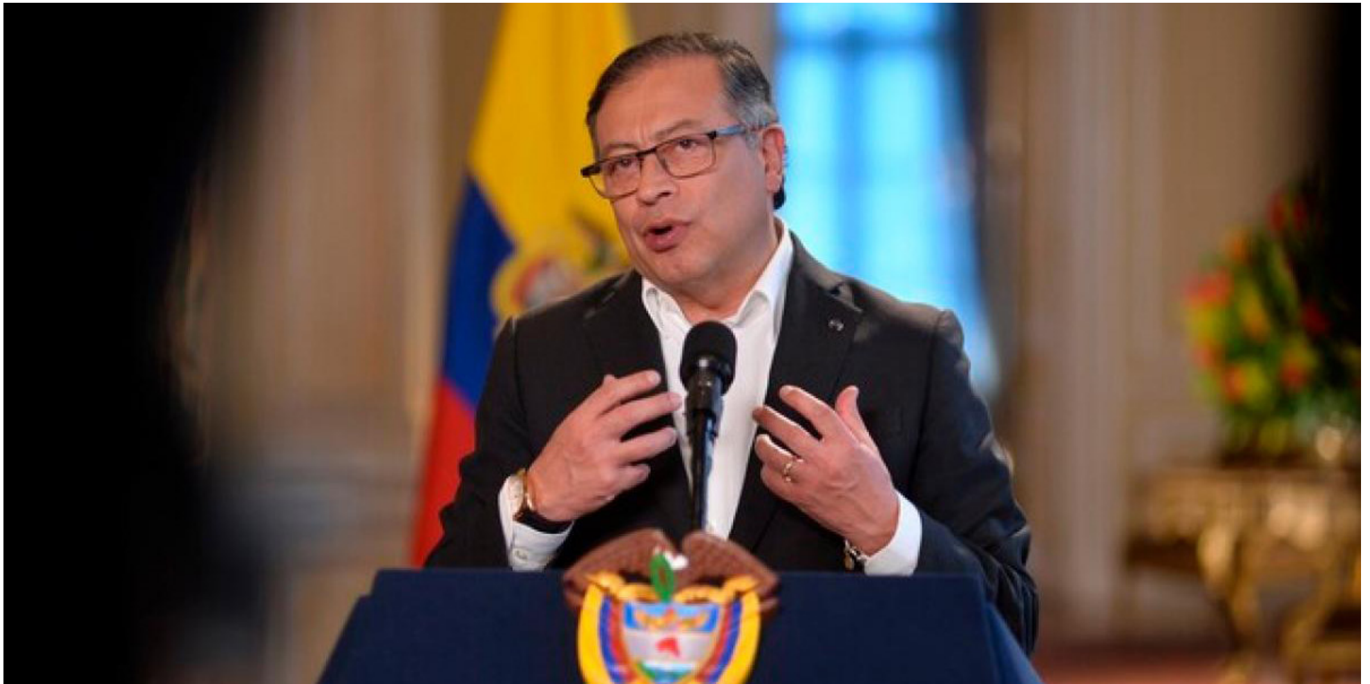
El presidente Petro celebró en su cuenta de X decisión de la ONU sobre tratamiento del consumo de drogas como problema de salud pública.

■ El jefe de Estado en su cuenta de X comentó que a su parecer dicha decisión es algo “histórico” y que ocurrió más rápido de lo que él se imaginaba y añadió que aquello fue liderado por Colombia.