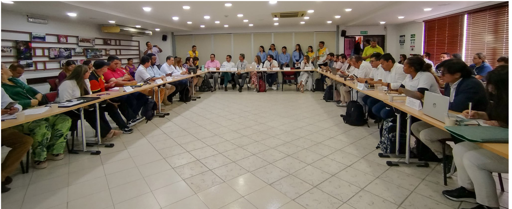
En Neiva, se dio inicio a los recorridos territoriales para fortalecer la política pública de la economía popular, con un enfoque en la participación activa de tenderos, tenderas y comerciantes de todo el país.

■ En Neiva, iniciaron los recorridos territoriales para el fortalecimiento de la política pública de la economía popular con los tenderos, tenderas y comerciantes del país. Una de las propuestas del Gobierno Nacional, es que las tiendas de barrio se conviertan en factores de impulso de la asociatividad solidaria.