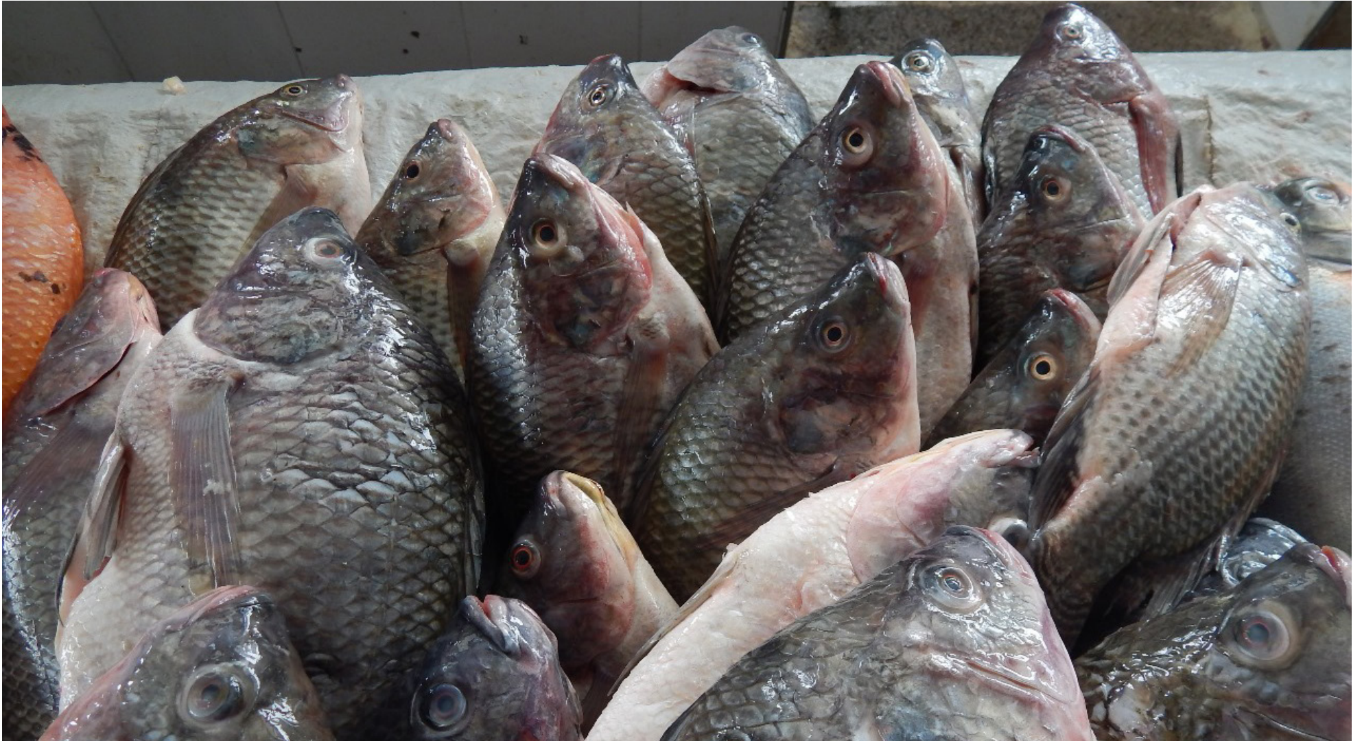
La tilapia, una de las especies más consumidas durante la Semana Santa, es cultivada en el departamento del Huila.

■ Los productores piscícolas del departamento del Huila están preparados para atender la demanda de pescado más importante del año en el país, ofreciendo un producto de alta calidad para las mesas de los hogares colombianos durante la Semana Santa.