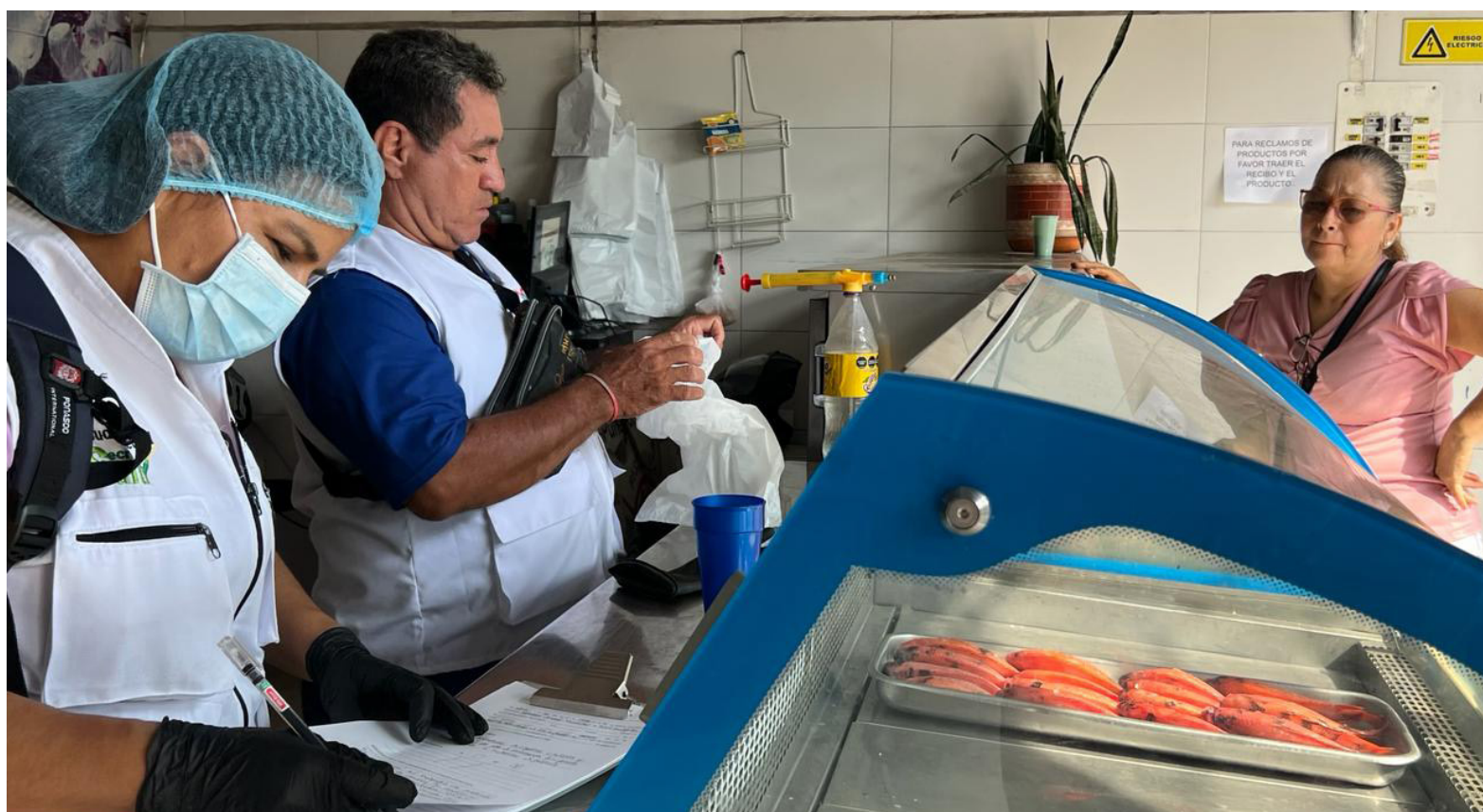
Los consumidores deben verificar las características de frescura del pescado antes de adquirirlo, según las recomendaciones de las autoridades de salud.

Además, Mojica detalló las especies más comercializadas durante la Semana Santa, que incluyen variedades de cultivo como la tilapia roja y negra, cachama, camarón y trucha arcoíris; especies de río como bagres, doncella, bo-