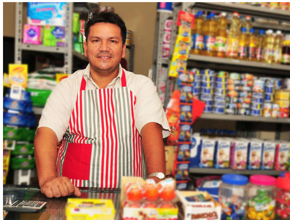
La propuesta de las Tiendas Solidarias busca unir esfuerzos entre asociaciones de productores, consumidores y tenderos para revitalizar el rol de las tiendas de barrio como agentes de la asociatividad solidaria.

Además de la creación de las Tiendas Solidarias, el Gobierno ha anunciado su compromiso con el fortalecimiento de otras medidas destinadas a apoyar a este sector vital de la economía. Entre ellas se incluyen la creación de