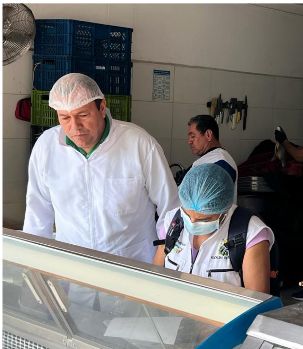
Las familias huilenses y del resto del país pueden tener la tranquilidad de que al adquirir pescado producido en la región.

El propósito de las autoridades de la Salud es que durante esta temporada las comunidades puedan disfrutar de buenos alimentos. El pescado requiere cuidados especiales y el aumento de su consumo en estas fechas resulta requiere de cuidados especiales.