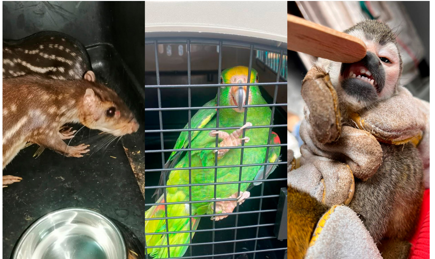
No haga de la tierra un ‘infierno’ para los animales, evite su comercialización.