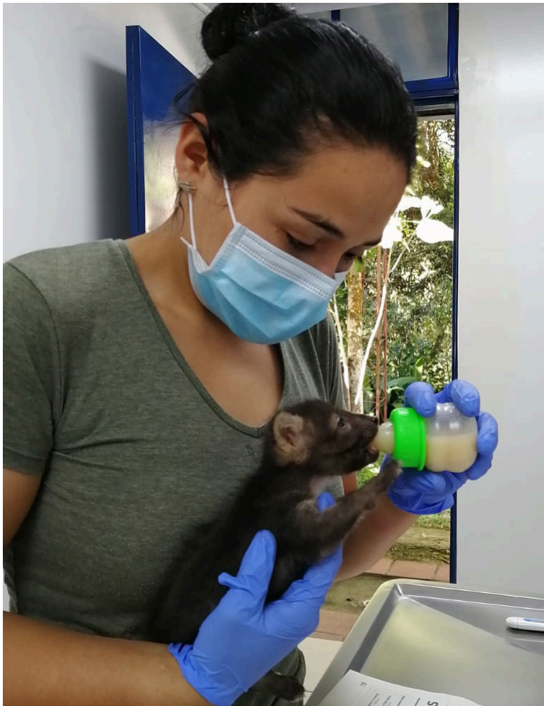
Centro de recuperación animal en Teruel.