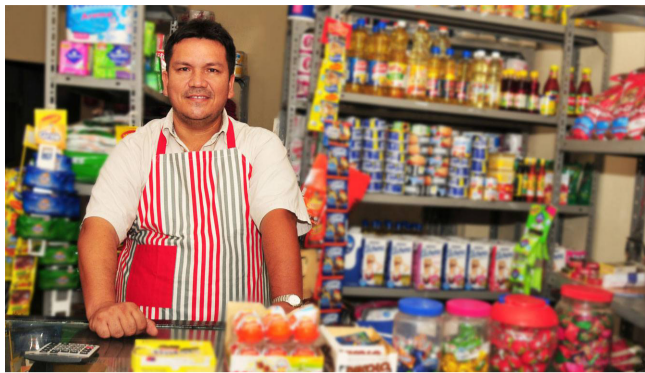
El salva vidas para las tiendas de barrio