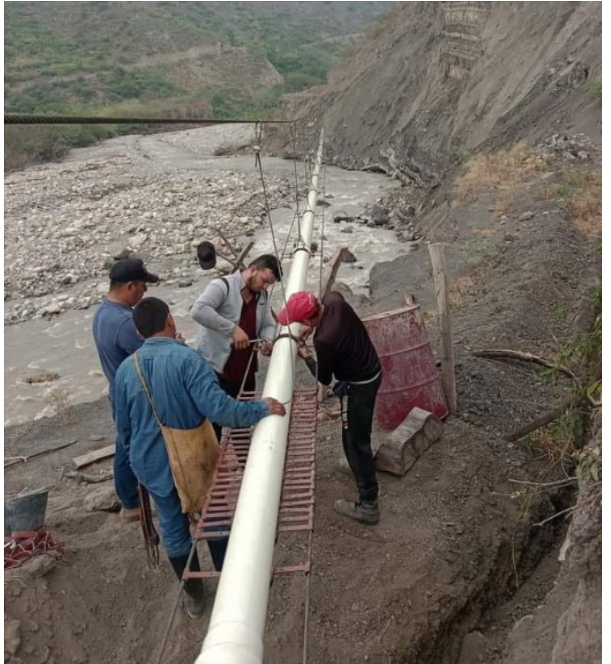
En trabajo mancomunado entre la Administración Municipal y la comunidad, lograron el objetivo.

Siendo importante que los alcaldes, firmen los convenios con los Bomberos para la atención de emergencias y estos deben contar con las herramientas y capacitación suficiente, “para atender esas condiciones de riesgo especialmente el foco de la actividad de la corporación orientados al control de los incendios forestales” añadió el funcionario.