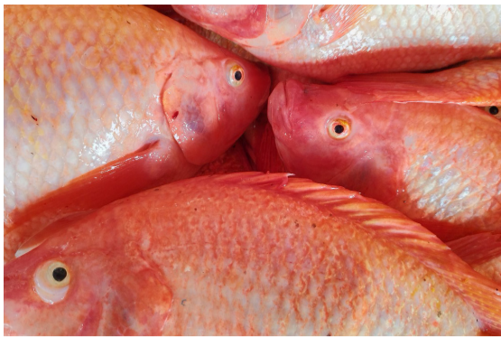
A consumir pescado opita