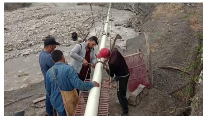
Volvió el agua a Colombia