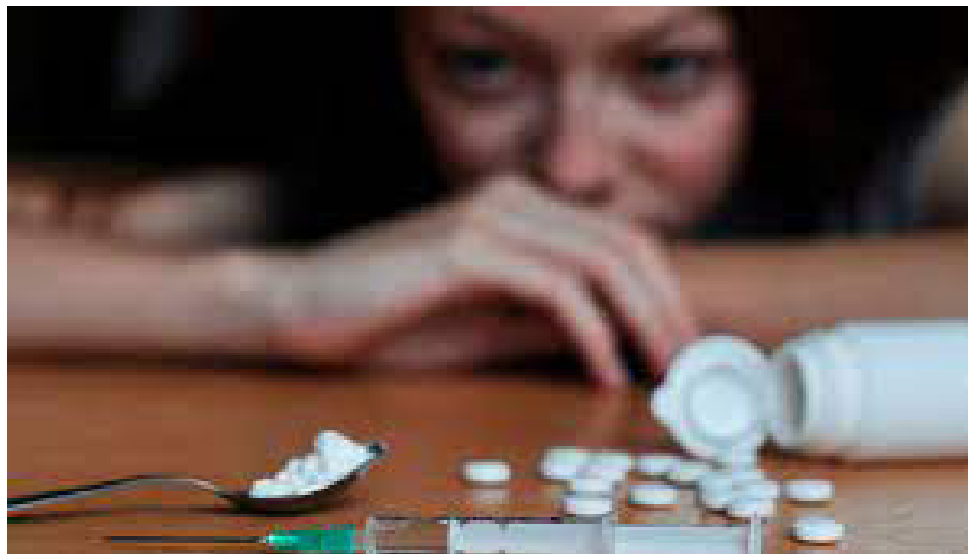
“Queremos hacerlo todo con Naciones Unidas, pero no con unas Naciones Unidas sordas, ciegas y en silencio”, aseguró.

Petro denunció que un millón de personas han sido asesinadas en América Latina por la criminalización de las drogas y que el abuso de las sustancias ilícitas sólo puede ser mitigado mediante una política de salud pública.