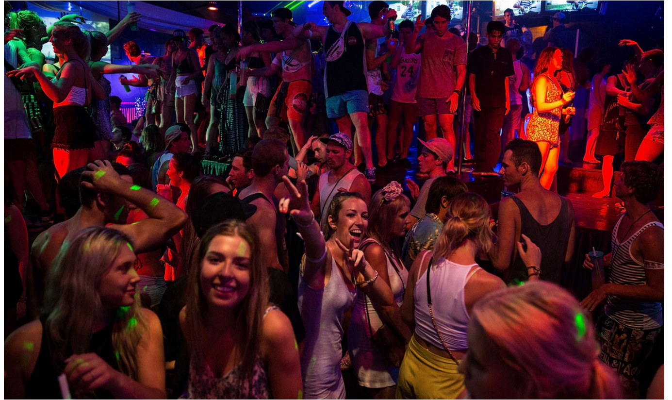
La comisión de drogas de la ONU, Colombia solo buscaba destacarse como el país más represivo.

Esta política, definió Petro, estaba centrada en el uso de la violencia armada y judicial en lo que se conoce como la guerra contra las drogas, un enfoque que fue promovido por primera vez hace cincuenta años por el presidente Richard Nixon de Estados Unidos.