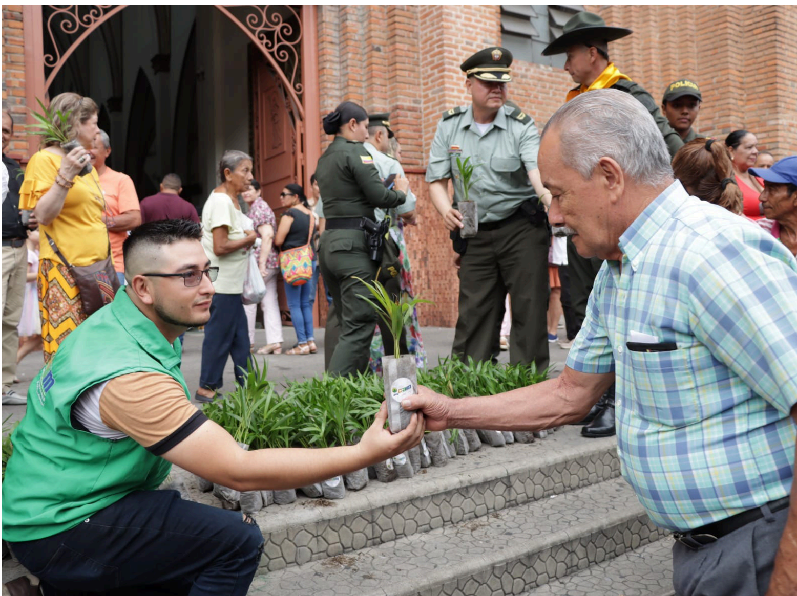
Plántulas entregadas para evitar afectaciones de la palma de cera.

La especie sufre demasiado. “El año pasado logramos la liberación de seis de ellos en el departamento del Meta. Hay que recalcar que este es un proceso largo, primero hay que enseñarlos a no depender de las personas, a que aprendan a comer frutos del bosque y a trepar”, puntualizó el especialista.