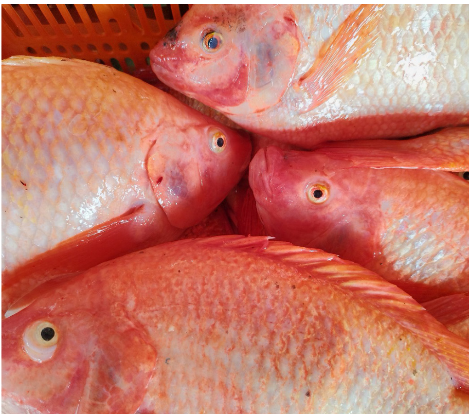
Se estima un consumo de aproximadamente 47.000 toneladas en los hogares colombianos, según datos del Ministerio de Agricultura.

Los productores piscícolas del departamento del Huila están preparados para atender la demanda de pescado más importante del año en el país, ofreciendo un producto de alta calidad para las mesas de los hogares colombianos durante la Semana Santa.