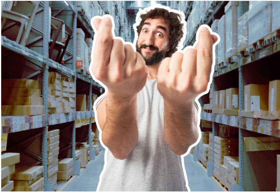
En este lugar hay canastos llenos con objetos de todo tipo por 5.000 y 15.000 pesos.

■ La Superintendencia fue alertada por los datos personales que siguen adheridos a los paquetes en venta.