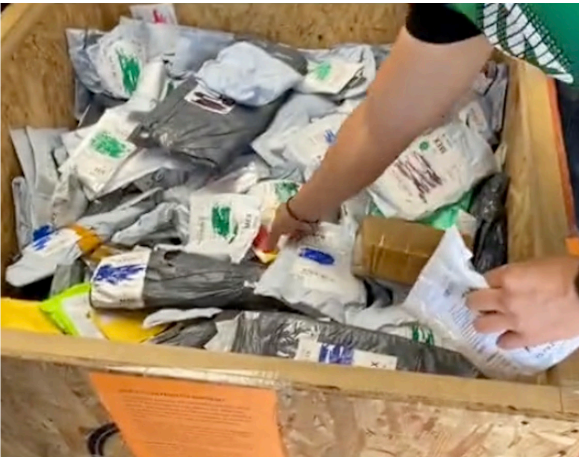
Las bodegas con envíos perdidos a la venta se hicieron virales gracias a los videoblogs en redes sociales.

Se desconoce el futuro de estos negocios, pero, antes de prosperar con el boom que causaron en redes, deberán enfrentarse a medidas que, se espera, sean establecidas cuanto antes.