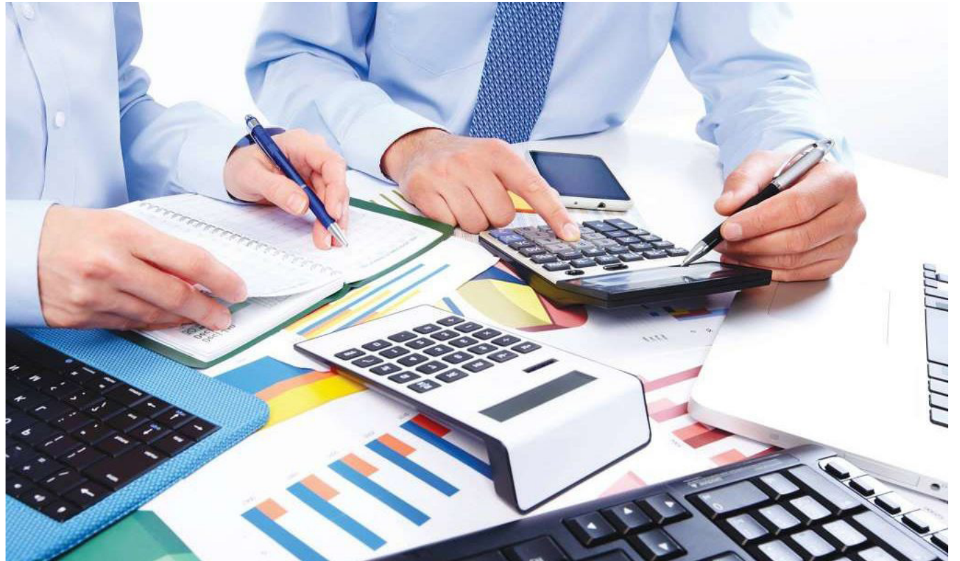
“Un adecuado cierre contable nos brinda la realidad económica y financiera de la empresa y nos permite visualizar óptimas cifras tributarias”