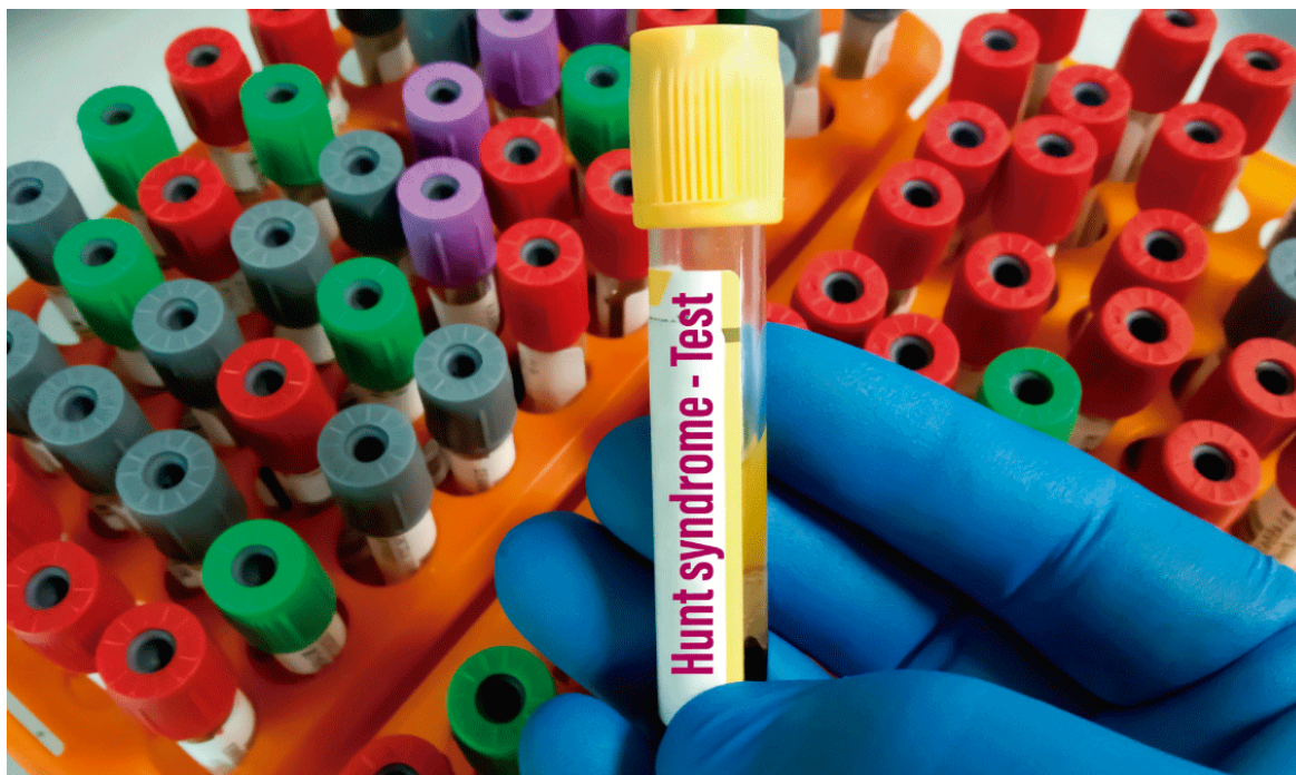
Las enfermedades huérfanas afectan el estilo de vida de las personas.

Por otra parte, se busca promover una educación inclusiva, dado que a diario las personas se enfrentan a dificultades en este ámbito, lo que les impide desenvolverse en un entorno de aprendizaje seguro, cómodo y acogedor.