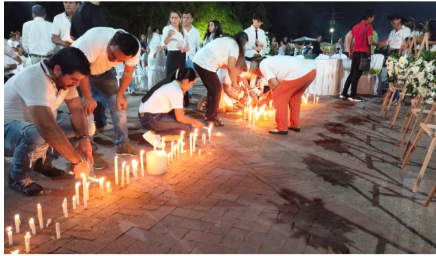
Commemoración a concejales de Rivera