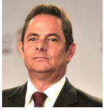
Germán Vargas Lleras

Ya ningún sector se escapa a los intentos del Gobierno por des-institucionalizar y pretender a la fuerza concentrar en el Presidente decisiones que competen a otros poderes públicos. El más reciente, un burdo decreto que desconocía toda la normativa que regula la ejecución del presupuesto nacional, y que terminó cobrándose la cabeza de dos de los funcionarios más competentes de los que disponía el Gobierno.