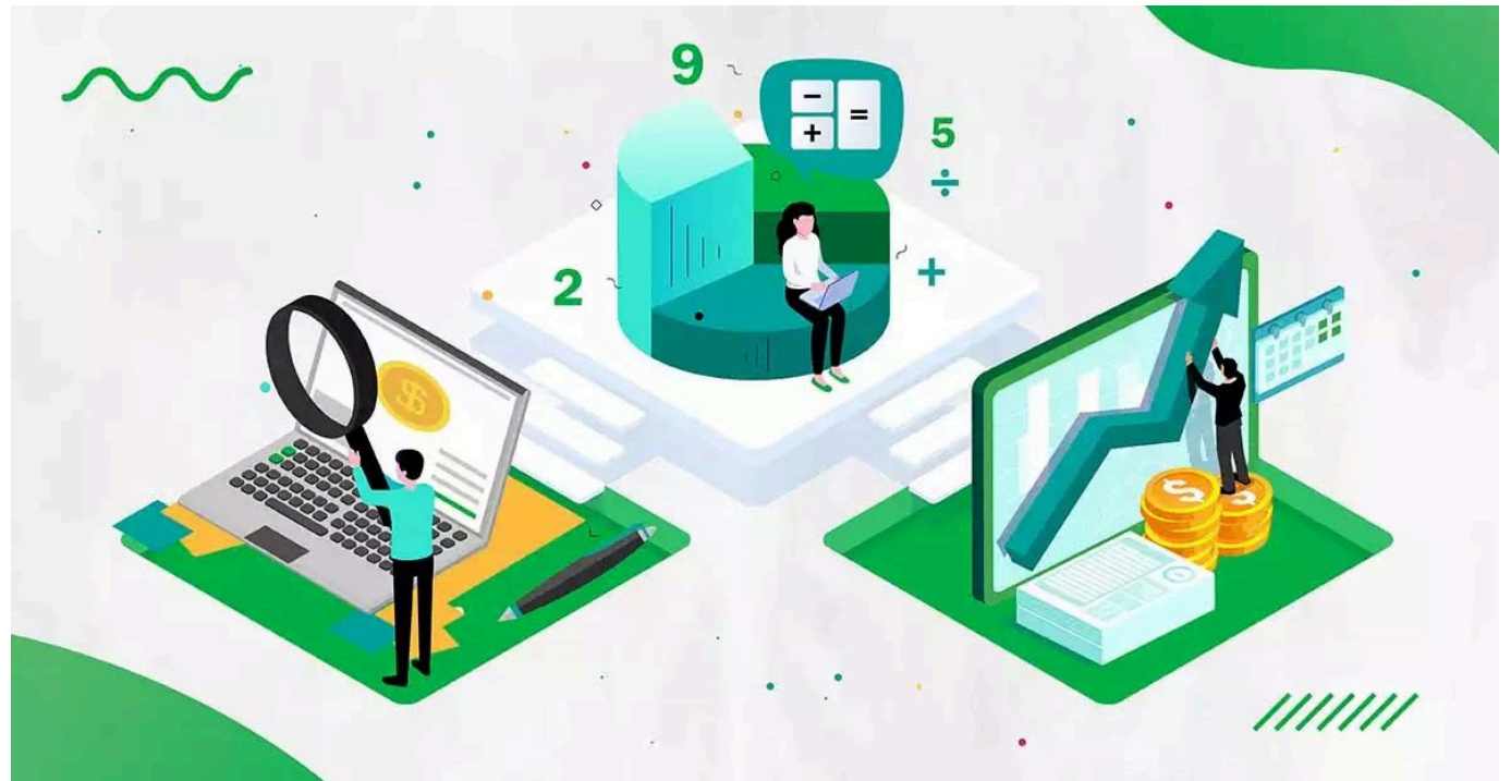
"La conciliación fiscal comprende dos elementos: a) el control de detalle y b) el reporte de conciliación fiscal"

"No estarán obligados a presentar el reporte de conciliación fiscal a través del portal de la Dian los contribuyentes que en el año gravable hayan obtenido ingresos brutos fiscales inferiores a 45.000 UVT"