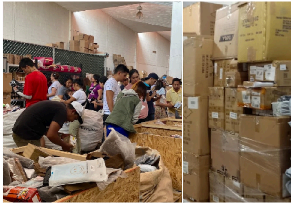
Su experiencia, habla mucho del contenido encontrado en los paquetes.