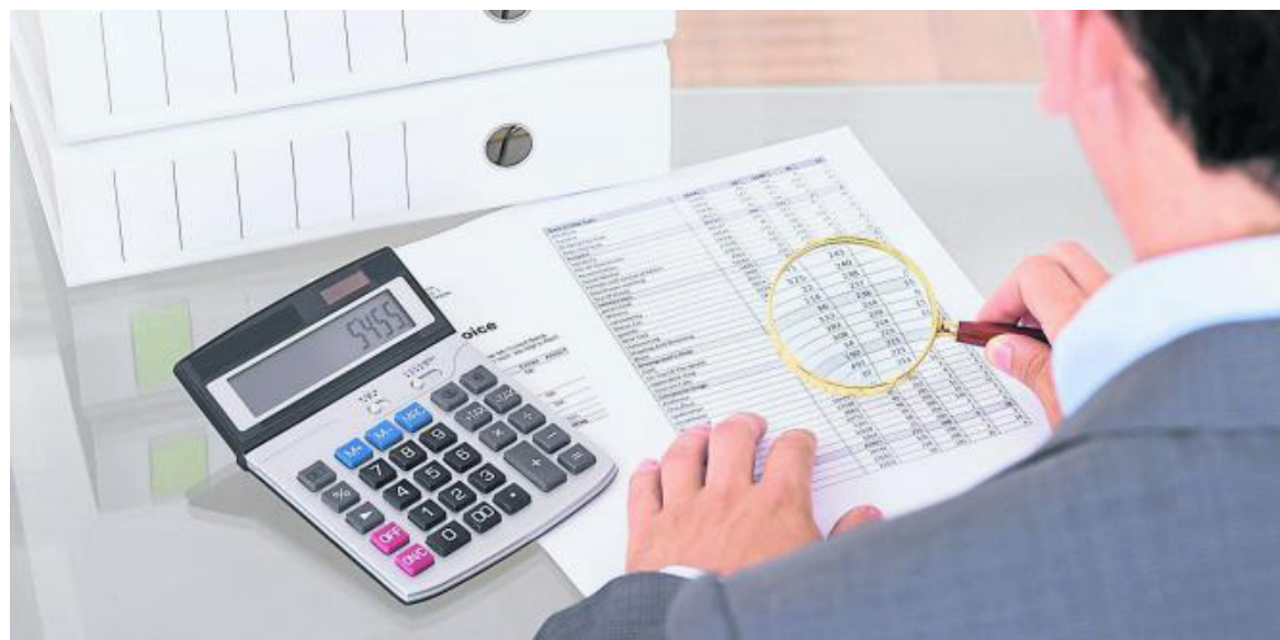
"Sabe usted cual es la tasa mínima de tributación del impuesto a la renta que le corresponde pagar a la sociedad de la cual es socio o accionista"

Las opiniones son responsabilidad de los socios de Araque Asociados Consultores Tributarios y Legales. Nos basamos en el entendimiento de las normas vigentes y en el conocimiento del derecho tributario, y puede no ser compartido por las autoridades tributarias. Consúltenos en www.araqueasociados.com . Preguntas y sugerencias en el correo: contacto@araqueasociados.com . Atención personalizada: Carrera 5 No. 14-32 oficinas 5, 7 y 8 Pasaje de la Quinta de Neiva-Huila, teléfonos 321 452 3315.