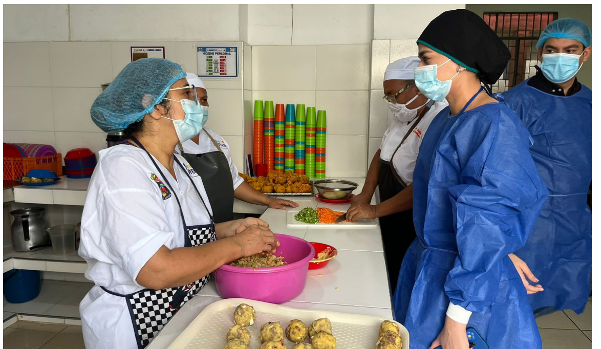
Personal de la Unidad de Alimentos para Aprender, UApA, junto a la secretaria de Educación, realizaon visita sorpresa a la Institución Educativa Ricardo Borrero Álvarez para conocer el estado de operación del PAE.