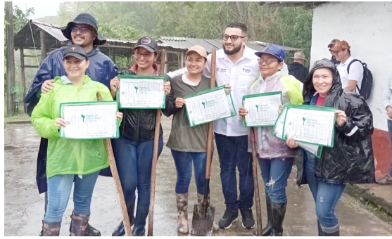
Entregaron 419 títulos de tierras en Pitalito