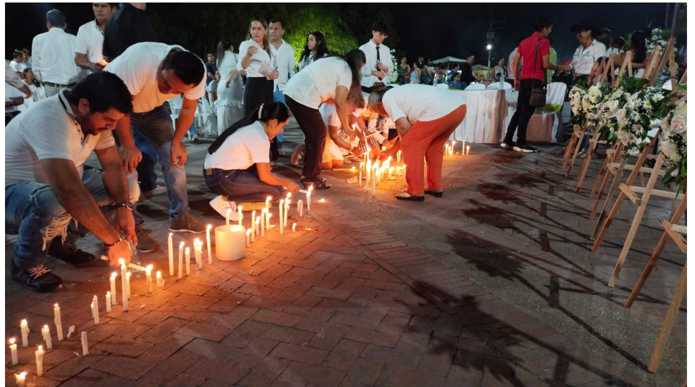
En la “marcha de la luz”, viudas y familias de los concejales de Rivera conmemoran el doloroso recuerdo de la masacre ocurrida hace 18 años. La persistente lucha por la verdad y la justicia sigue siendo el motor de estas valientes mujeres.

A pesar de los obstáculos, las viudas y sus familias, persisten en su incansable búsqueda de verdad y justicia, rindiendo tributo a los líderes caídos y manteniendo viva la memoria de esta trágica historia.