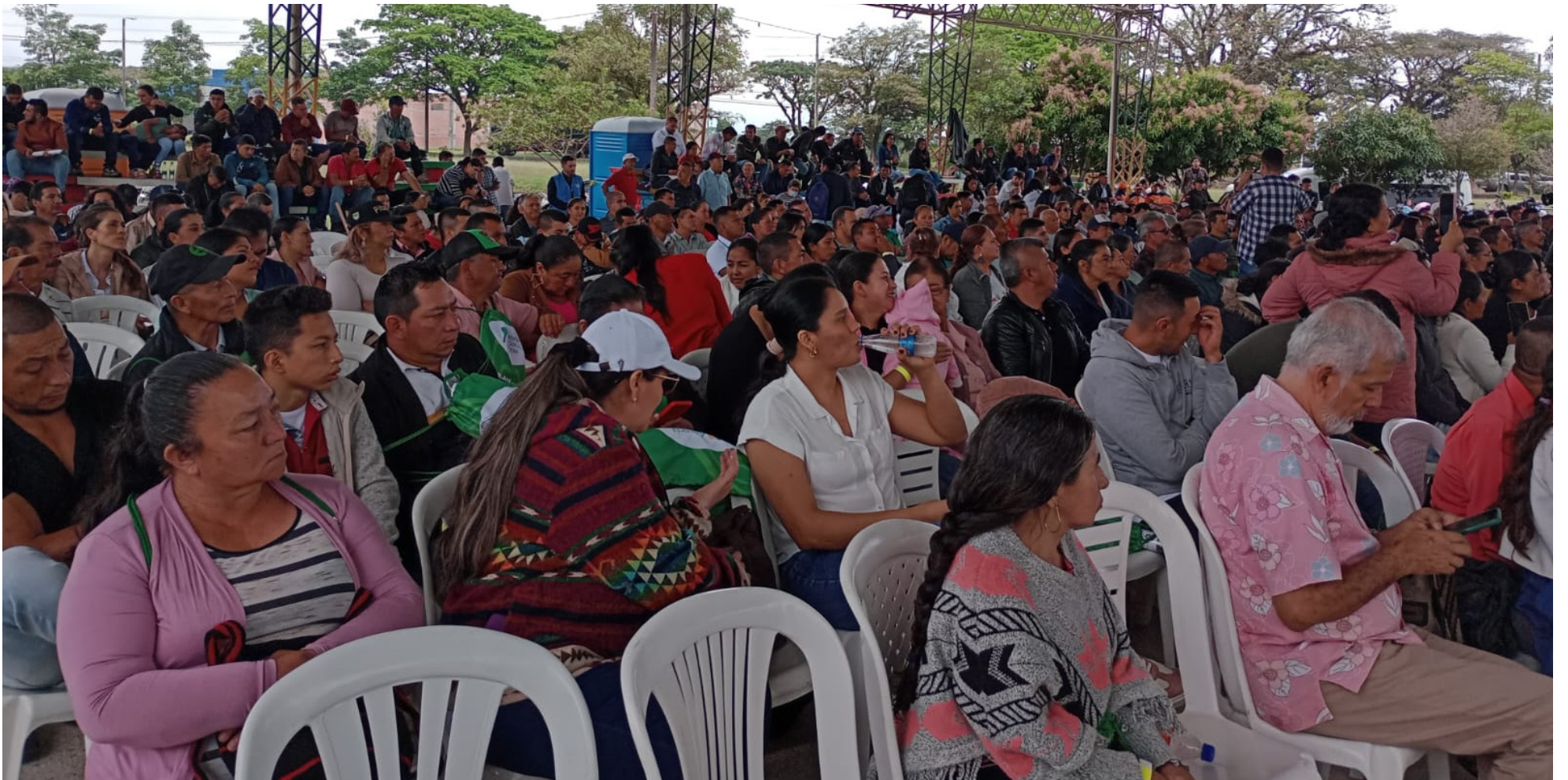
En la jornada, hubo cerca de 2.000 asistentes.