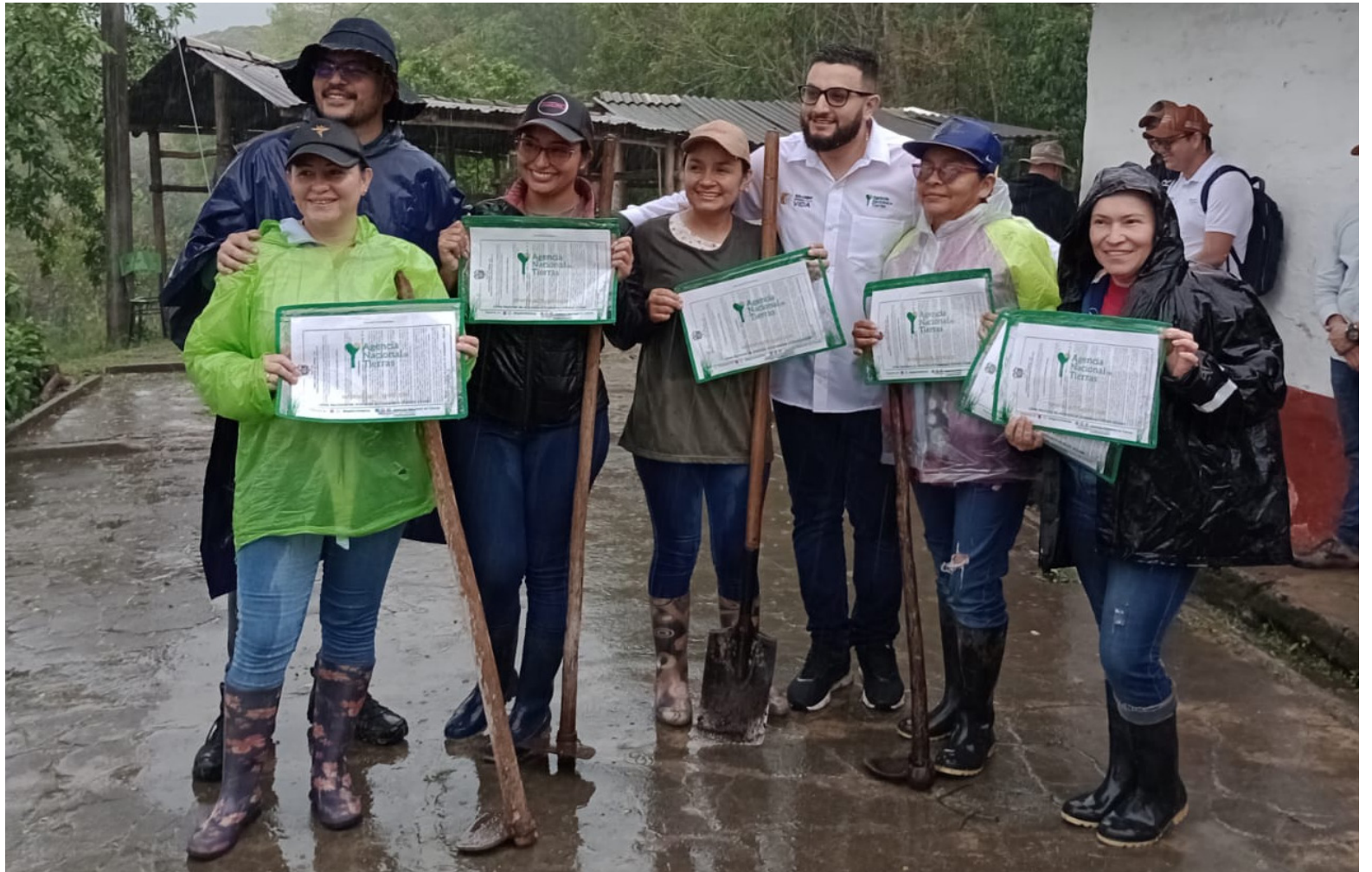
Titulación de predios entregados a cinco mujeres en la vereda Miravalle, Pitalito.

En cuanto a la titulación de tierras a los cafeteros, el funcionario destacó que están cumpliendo