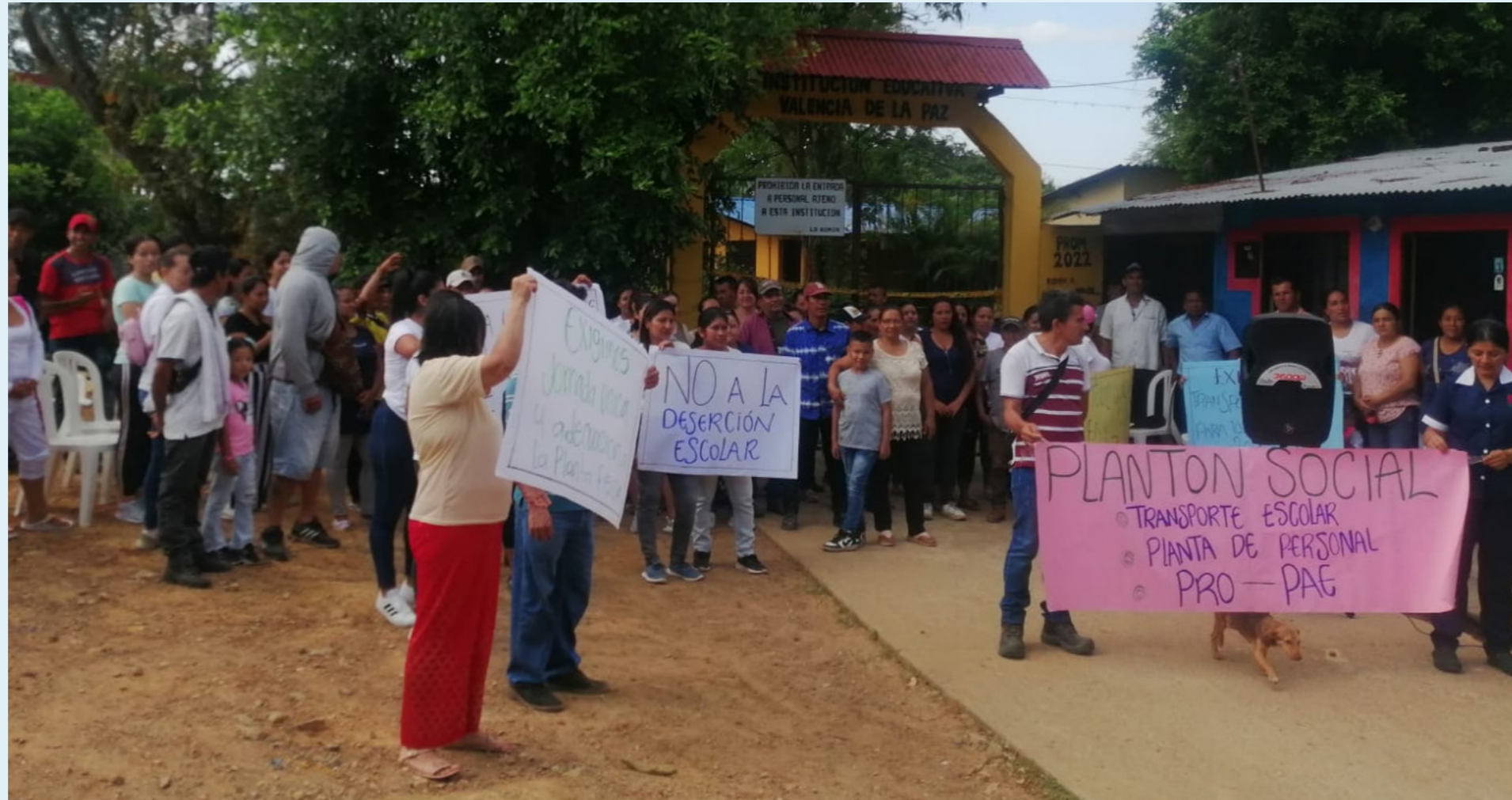
En la I.E. Valencia de la Paz de Íquira esta semana los padres de familia siguen con la manifestación.

Para el personero de Íquira, es muy probable que impugne la decisión pidiendo que el reconocimiento de la alimentación escolar sea en la modalidad de almuerzo.