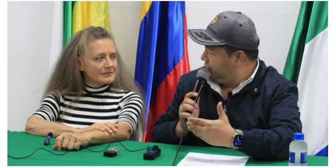
Investigación disciplinaria contra el Alcalde de Pitalito