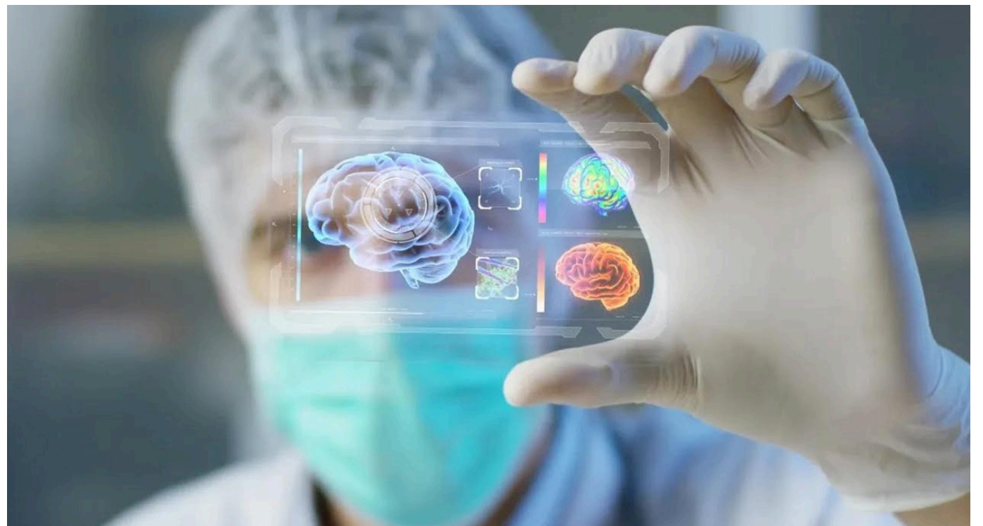
La enfermedades huérfanas son las padecen un grupo reducido de personas.

El último domingo de febrero se conmemora el Día Mundial de las Enfermedades Huérfanas, según el Instituto Nacional de Salud. En el mundo entre 6.000 y 7.000 personas padecen una de estas enfermedades, en Colombia las sufren 1.920 y en Armenia con corte al 31 de diciembre de 2023 se habían reportado 111 casos nuevos.