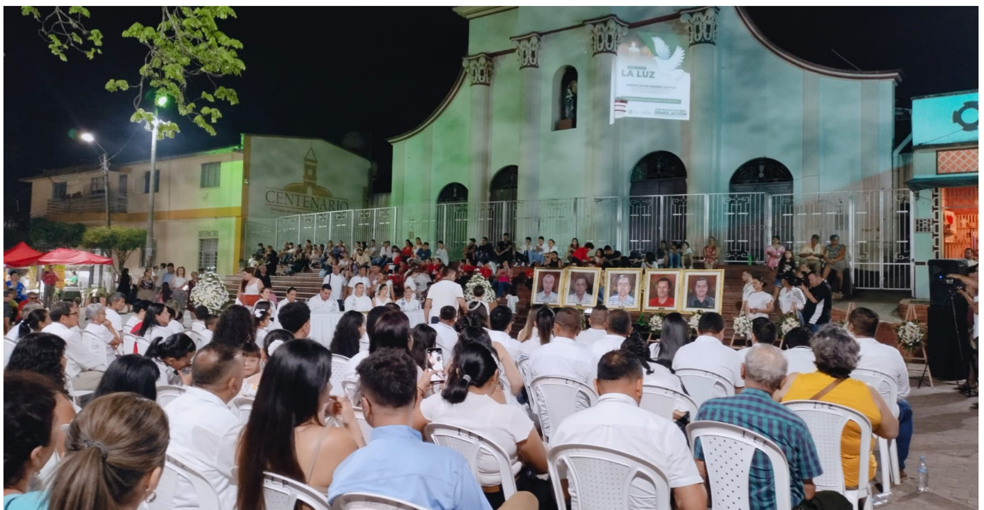
La unión de las familias ha permitido, sobrellevar durante estos 18 años la ausencia de sus seres queridos.

“La decisión de la JEP de no conceder amnistía ni indulto a los responsables de la masacre es percibida como un acto de justicia, brindando cierta satisfacción a las familias afectadas. Este paso representa un avance significativo en el abordaje de las masacres en Colombia, evidenciando la necesidad de que la ley sea equitativa tanto para aquellos que causaron el daño como para las familias que han sufrido la pérdida de sus seres queridos”.