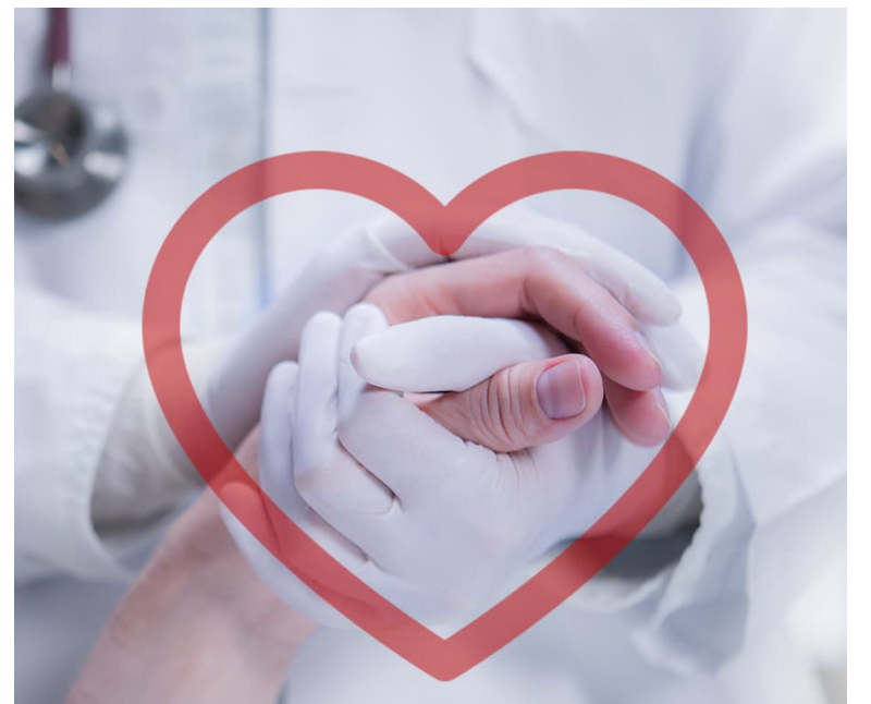
El 25 de febrero se conmemora el Día Mundial de las Enfermedades Huérfanas.

Además, la escasez de información disponible sobre estas enfermedades puede generar frustración y sentimientos de aislamiento entre los pacientes.