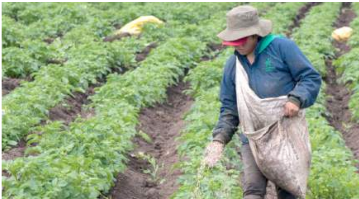
Uno de los grandes problemas de los agricultores son los costos en los agroinsumos.

Se trata del proyecto Fortalecimiento de la Producción Agrícola a través de la dotación y mejoramiento de activos productivos a 470 agricultores del sur del Departamento del Huila, financiado con recursos del Sistema General de Regalías por un monto de $823.017.142, dirigido a una población objetivo de 470 productores pertenecientes a 13 grupos asociativos, de los municipios de Pitalito, Acevedo, Palestina, Oporapa, Timaná, Isnos y San Agustín, que tiene como objetivo impulsar la transformación productiva, la competitividad agropecuaria y agroindustrial y el desarrollo rural, promoviendo condiciones que dinamicen la provisión de bienes y servicios,