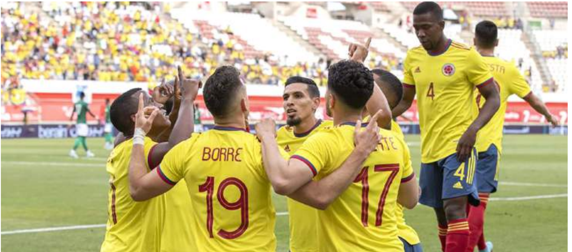
Colombia celebró en cuatro ocasiones ante Guatemala.