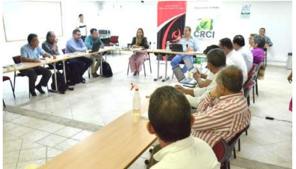
Reunión de retroalimentación con los distintos actores que participan en la construcción del POT.

“Es el plan de ordenamiento actual, las tendencias, y estamos planteando hacia dónde queremos ir, cómo queremos ver nuestro territorio y a dónde vamos a poder llegar, que es el modelo de ordenamiento territorial futuro”