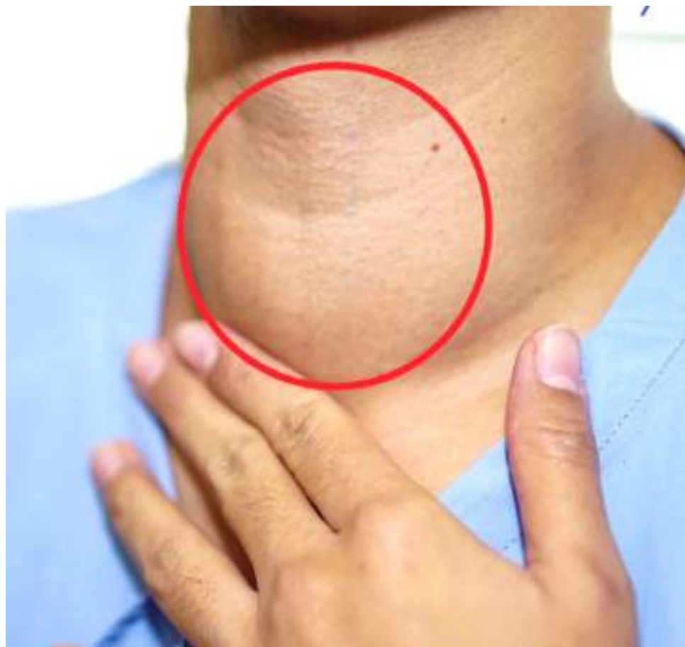
La hinchazón del cuello es uno de los síntomas.

Algunos tipos de cáncer de tiroides son los siguientes; Cáncer papilar de tiroides, folicular de tiroides células de Hurthle, diferenciado de tiroides y medular de tiroides.