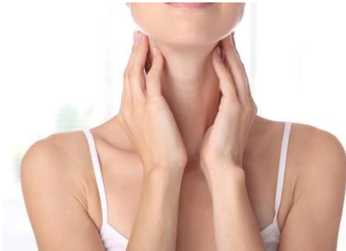
El cáncer de tiroides puede tardar en presentar sus síntomas.

Los índices de cáncer de tiroides parecen estar al alza. El aumento puede deberse a una tecnología de imágenes mejorada que permite a los proveedores de atención médica encontrar pequeños cánceres de tiroides