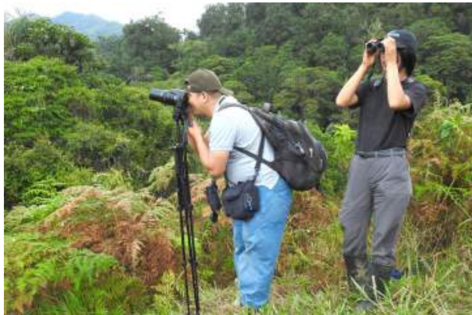
El Huila, en esa oportunidad ocupó 15 a nivel nacional con un total de 415 especies registradas.

De los esfuerzos que se hicieron en el Global Big Day durante el mes de mayo, se puede decir que, más de 185 personas de 25 municipios del departamento salieron a observar aves y de esos se censaron 76 localidades o sitios específicos, en donde se hizo el registro de especies.