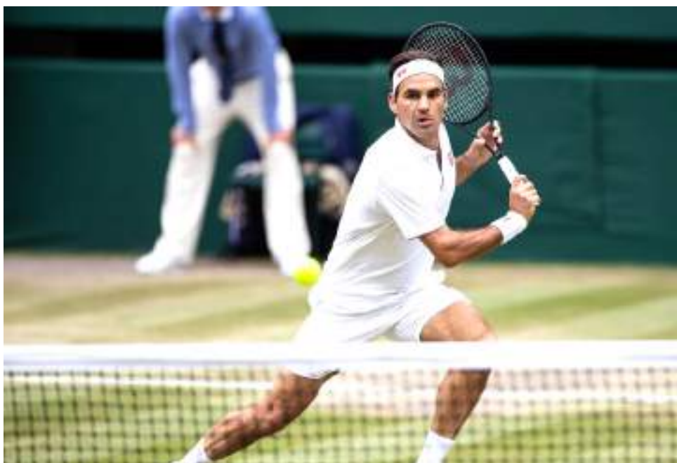
Después de una carrera en la que no tuvo que lidiar con demasiadas lesiones, la rodilla derecha fue la que le dijo basta.