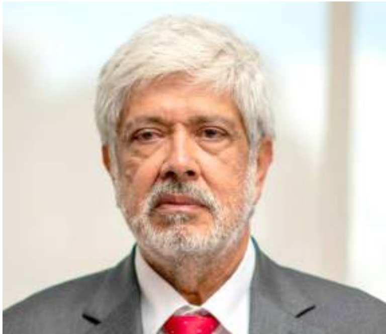
Se espera, a su vez que, para el final del gobierno del presidente Gustavo Petro alcanzar un comercio de entre US$4.000 y 4.500 millones.

■ Hoy, 26 de septiembre, con la reapertura de la frontera entre Colombia y Venezuela, comienza el camino para restablecer las relaciones comerciales binacionales, por lo que se espera que esta relación ayude a impulsar la economía no solo de la frontera, sino del país y en Venezuela.