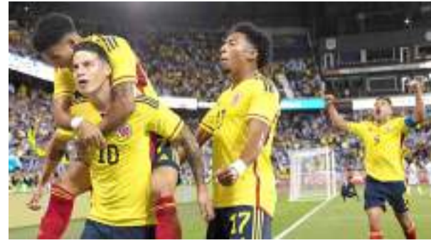
Empezó la era de Lorenzo