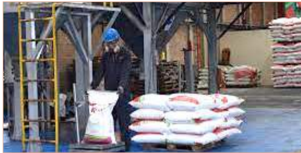
Avanza construcción de plantas de fertilizantes