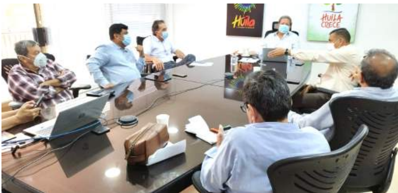
Analizan el avance de las plantas de fertilizantes.

En articulación con actores del orden regional y nacional, están direccionados a cristalizar el proyecto de las plantas de fertilizantes en el departamento, como una estrategia para contribuir al desarrollo del sector agropecuario de la región, y hacerlo más competitivo mediante la reducción de los costos de producción mediante el aprovechamiento de la riqueza mineral.