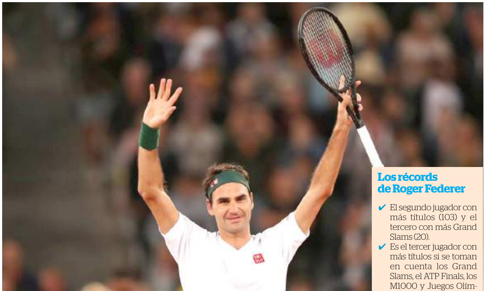
Roger Federer terminará una carrera espectacular con un total de 103 títulos, quedando como el segundo más ganador de la historia.

“Los últimos 24 años en el tenis, han sido una increíble aventura. Si bien parece que se han ido en 24 horas, también han