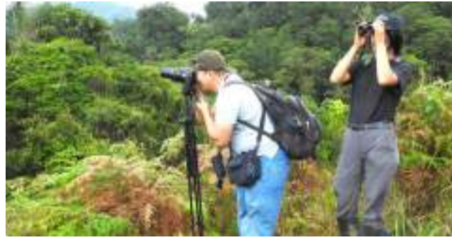
El Huila avanza en observación de aves