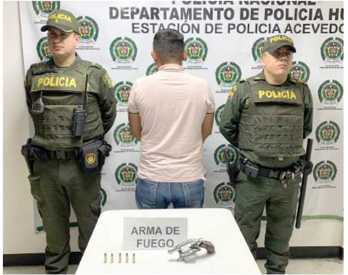
Uno de los capturados por porte ilegal de armas.

En los controles realizados a establecimientos de comercio de licor, puestos de información y la atención de casos de policía, se logró la incautación de 7 armas de fuego, 3 neumáticas, 200 kilos de marihuana, 700 gramos de base de coca y la recuperación de 2 motocicletas.