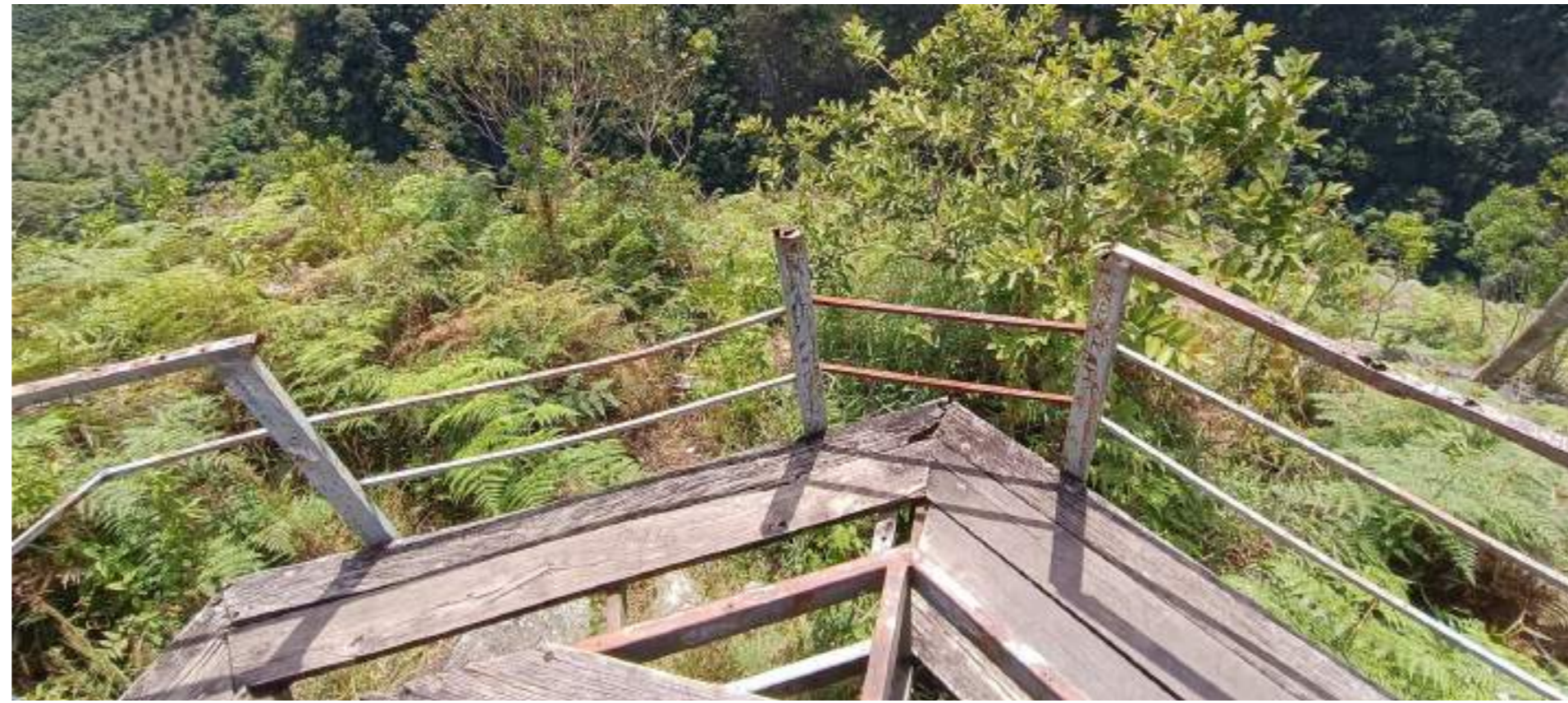
El sitio es realmente alto.