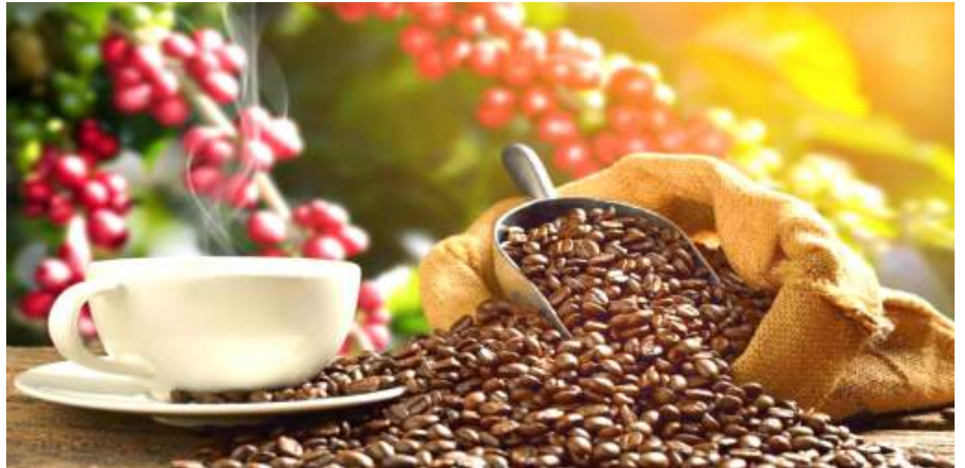
Los mejores cafés podrán acceder a bolsas de premios hasta por $125 millones.

Además este año la FICCA 2022 acoge la premiación del Concurso de Cafés Especiales "Colombia Tierra de Diversidad" organizado por la Federación Nacional de Cafeteros, al que se presentaron más de 700 lotes de 23 departamentos, y donde el Huila ha logrado escalar al top 41 con granos de los municipios de Gigante, Palermo, Pitalito, Acevedo, Tarqui y Rivera.