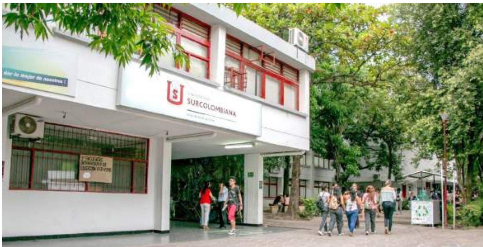
El desfinanciamiento de la universidad Surcolombiana tiene preocupados a estudiantes y docentes dado que posiblemente no podrán culminar el periodo académico 2022 - 2.

“Específicamente los gastos de docentes ocasionales y catedráticos, así como también de docentes visitantes a partir del 13 de noviembre en adelante. El periodo académico se aprobó desde el 5 de septiembre hasta el 13 de noviembre, pudiendo realizarse 10 semanas de clase y las otras 5 semanas restantes para culminar el calendario académico están pendiente de financiación y son las que para poder realizarse necesitan esos $3.600 millones con