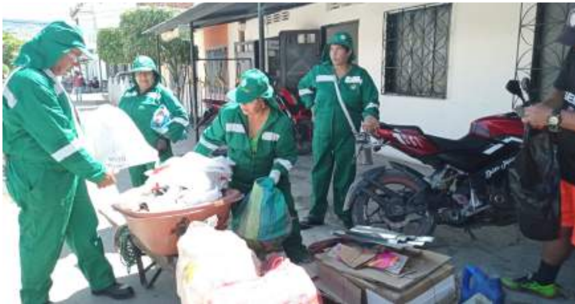
En suma, la participación de los tarqueños en esta ruta piloto es la pauta para seguir desarrollando jornadas en todo el departamento, que ayuden a lograr el objetivo del programa “Huila Gestiona sus Residuos” lo que significaría una mejora en la calidad de vida para todos los opitas.