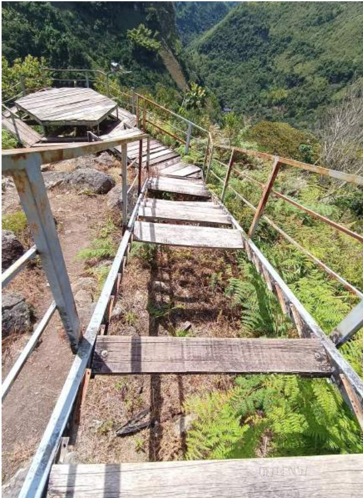
Estado de las escalinatas en el mirador de la chaquira en San Agustín