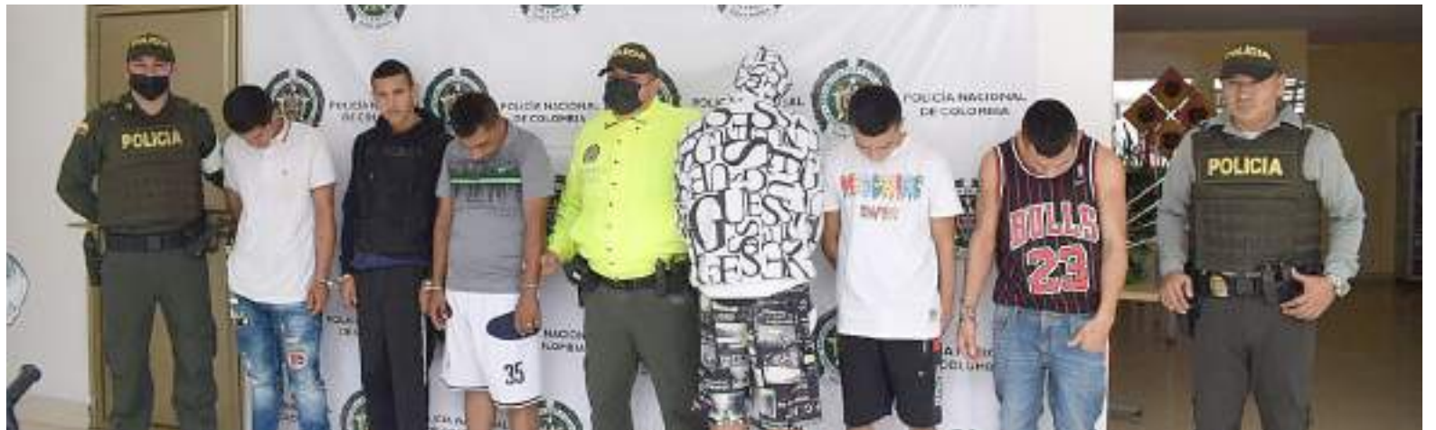
Desarticulada banda 'Los Fachada' en Pitalito.

Gracias a la denuncia ciudadana y el trabajo de los investigadores de responsabilidad penal del grupo de Infancia y Adolescencia en coordinación con la Fiscalía, se logró identificar un grupo de al menos 10 hombres, quienes, instrumentalizando varios menores de edad y aprovechando los días de mayor afluencia de personas en el sector de la galería, salían a cometer los hurtos a personas y motocicletas, utilizando armas de fuego y cortopunzantes.