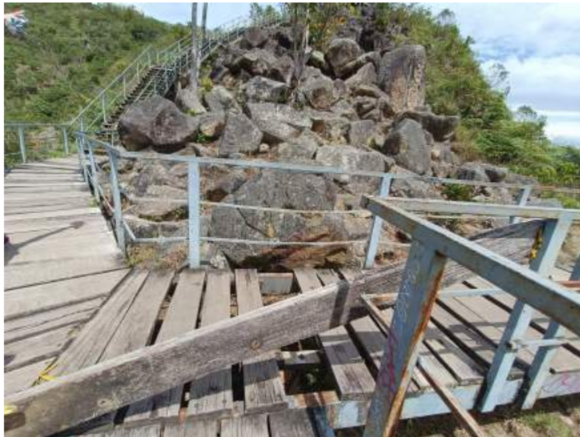
Petroglifos que se observan desde la parte posterior.