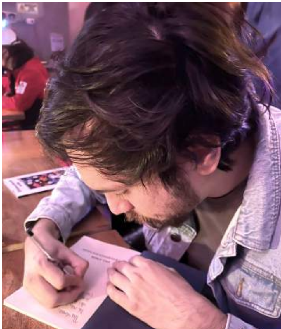
Su más reciente éxito.