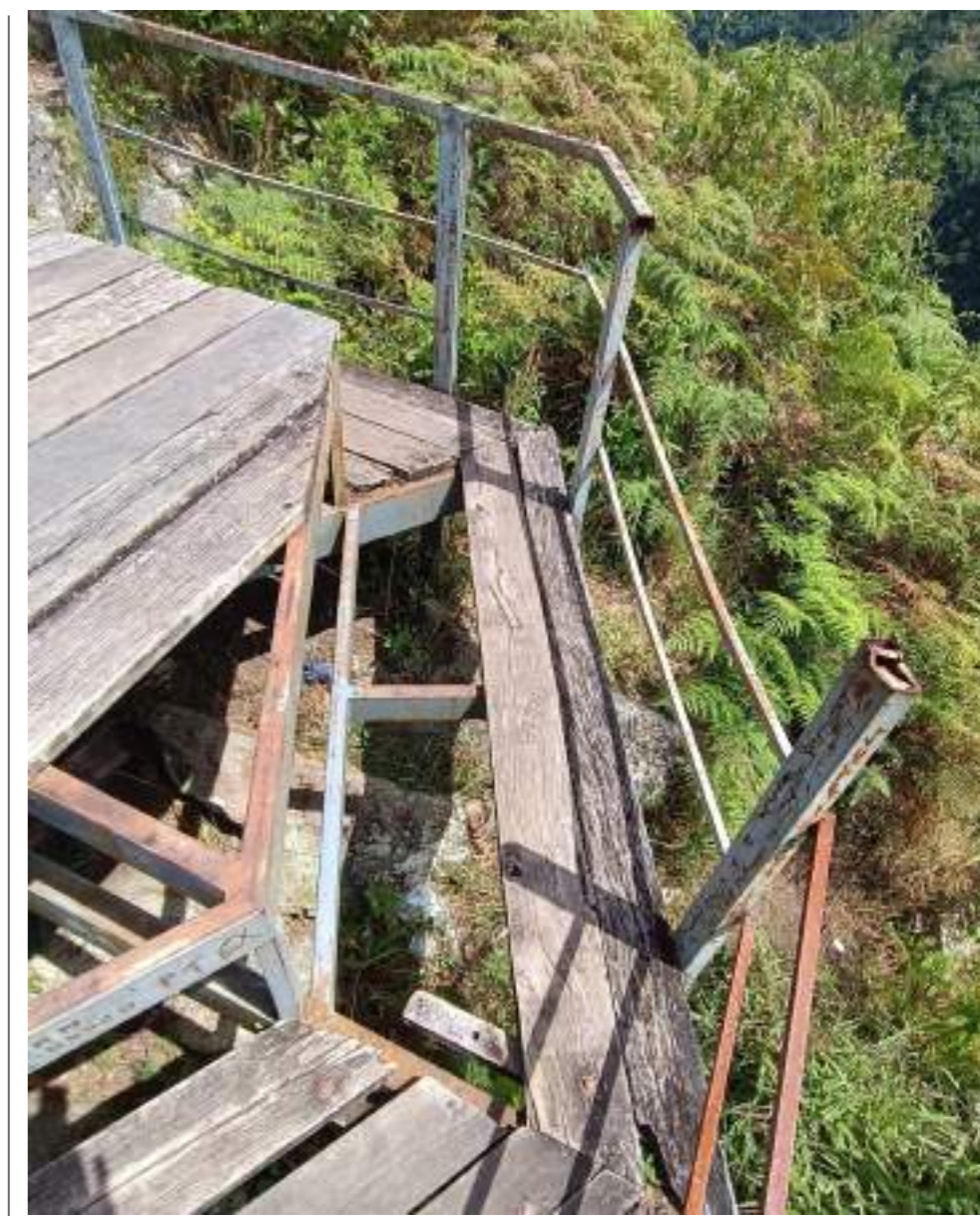
Las barandas también están en mal estado.