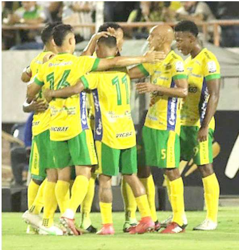
Nacional ante el Huila con la necesidad de ganar.

puso en evidencia que he hecho contaron con la suerte de jugar ese día: "Tanto la CONMEBOL, como la DIMAYOR y el propio Deportivo Independiente Medellín, unieron voluntades para que Atlético Nacional pudiera jugar su fecha por Liga el mismo lunes, pero tres horas antes de lo inicialmente programado", reveló el doblemente campeón de Copa Libertadores.