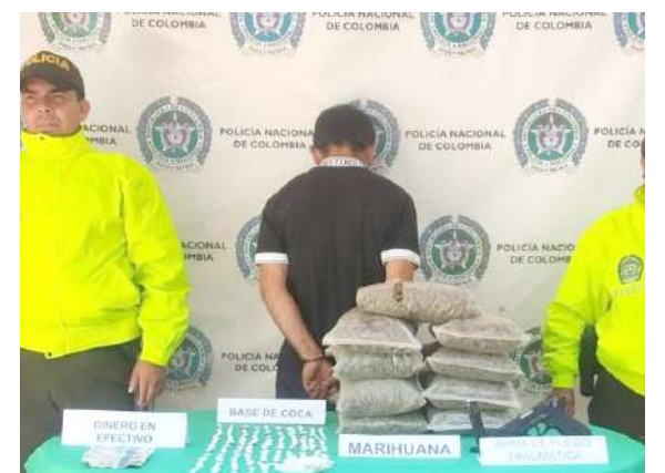
Fue capturado con 115 dosis de bazuco.

tendrá que responder por el delito de tráfico, fabricación y de estupefacientes.