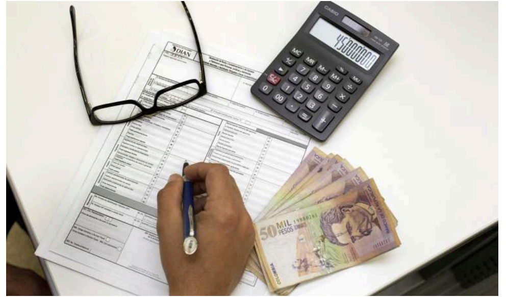
Es importante conocer las variables que tiene el impuesto.

Es el valor del patrimonio bruto poseído a 1° de enero de cada año menos las deudas a cargo del mismo vigentes en esa misma fecha, determinado conforme a lo previsto en el Título II del Libro I de este Estatuto, sin perjuicio de las reglas especiales.