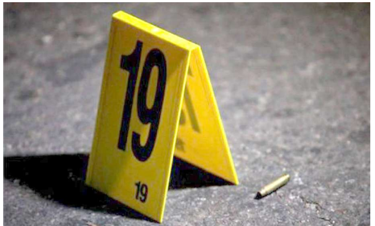
En Huila hay 700 personas en proceso de reincorporación, 50 de ellos tienen amenazas en su contra.

con la descentralización de las políticas de reincorporación.