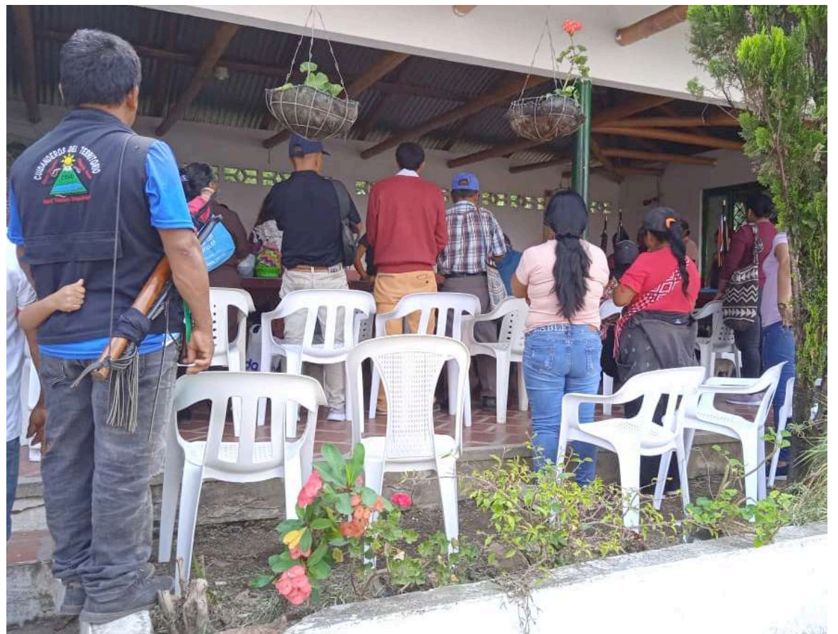
En 2019 ocurrieron los hechos en el resguardo indígena La nueva esperanza, ubicado en la vereda San Martín de La Plata.

En sesión virtual de la Sala Plena celebrada el 11 de octubre de 2022, se realizó la audiencia de repartición del proceso en la Corte Constitucional.