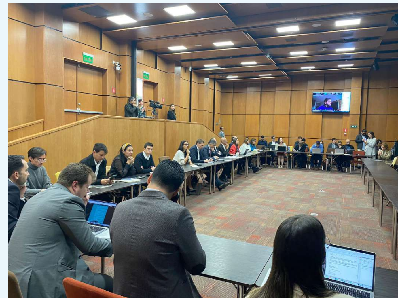
Realiza mesas con expertos para sacar conclusiones y advertencias de lo que propone el gobierno.