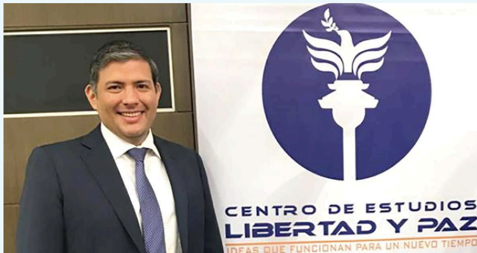
Promueve las libertades económicas.

A ustedes por este espacio, por visibilizar lo que hacemos y por tenernos como referentes.