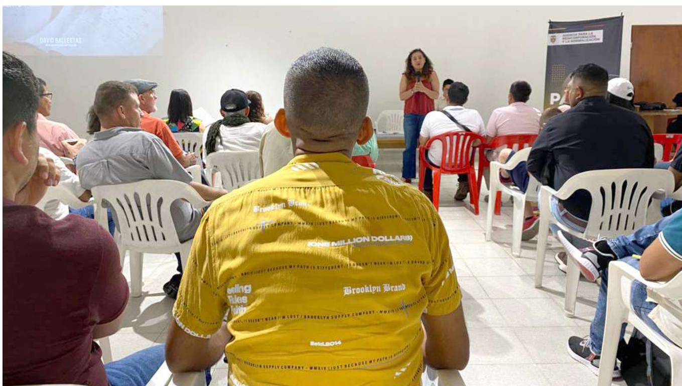
Con la participación de varios firmantes la ARN, se cumplió la jornada de trabajo en Neiva.

nacional y encaminada en la política de la Paz Total, se está trabajando en un sistema de fortalecimiento.