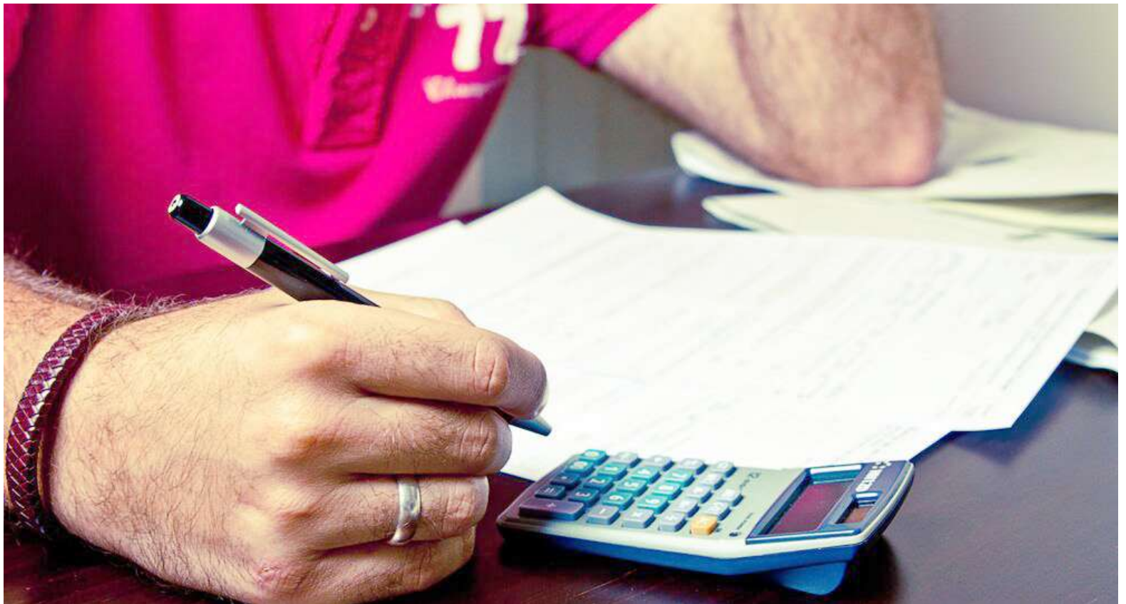
El valor que se excluye es el valor patrimonial neto de la casa o apto de habitación.

Luego, transitoriamente también, por Ley 2110 de 2019, por los años gravables 2020 y 2021, nuevamente, el Impuesto al Patrimonio con los mismos elementos y características de años anteriores, pero que, de alguna manera, no obstante los debates públicos y legislativos que alertaban que este impuesto es totalmente inconveniente para el crecimiento