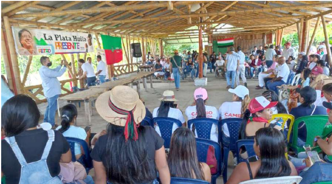
El resguardo Indígena se encuentra ubicado en la vereda San Martín de La Plata.