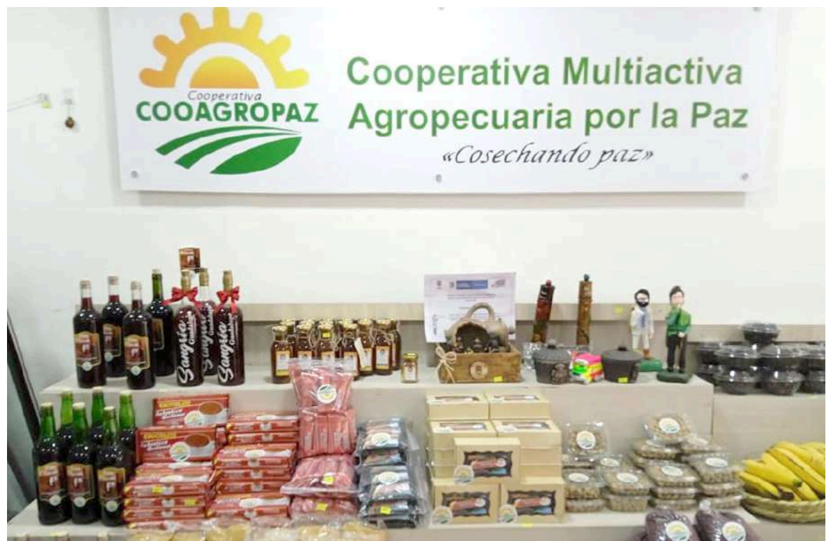
Desde la cooperativa Coagropaz se han realizado varios proyectos productivos con firmantes, víctimas del conflicto armado y campesinos.

“Queremos que se entienda a nivel nacional que la centralización es lo que no deja que las propuestas productivas anden y que el proceso de paz llegue a los”, Coagropaz.