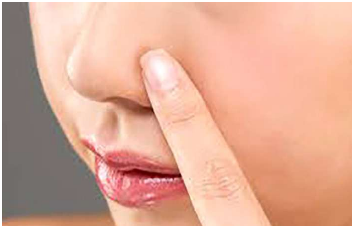
El 90% de las personas con obstrucción nasal grave presentan algún trastorno del sueño.

Varios estudios científicos y guías internacionales demuestran la gran carga emocional que conlleva la anosmia, pues quienes la padecen suelen presentar bajos niveles de concentración.