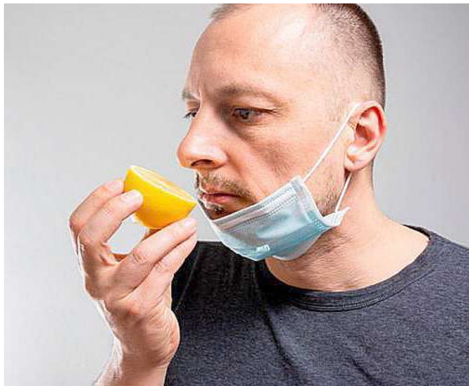
Cerca del 76% experimenta emociones negativas y sentimientos de desesperación.

Varios estudios científicos y guías internacionales demuestran la gran carga emocional que conlleva la anosmia, pues quienes la padecen suelen presentar bajos niveles de concentración, acompañados de altas cargas de frustración e irritabilidad. El 90% de las personas con obstrucción nasal grave presentan algún tras-