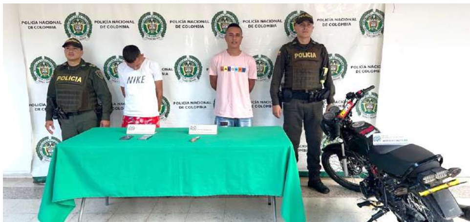
Los capturados y los elementos encontrados.