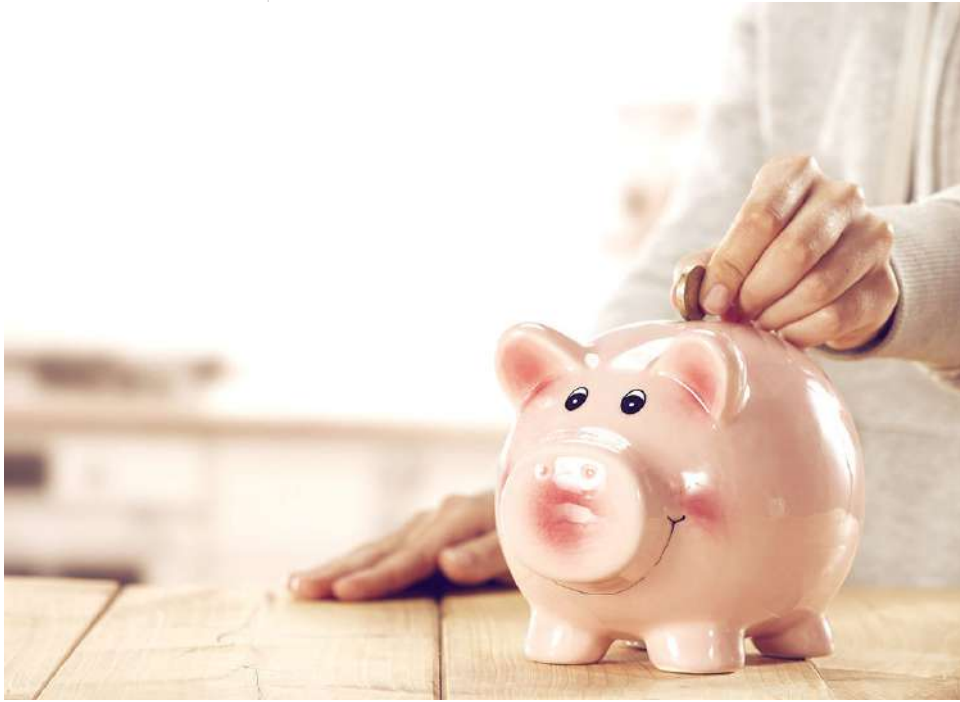
Hacer un fondo de emergencia es una de las recomendaciones.

particularidades de cada uno, es decir, la conformación, gastos e ingresos, la recomendación general y el llamado es: ahorrar.