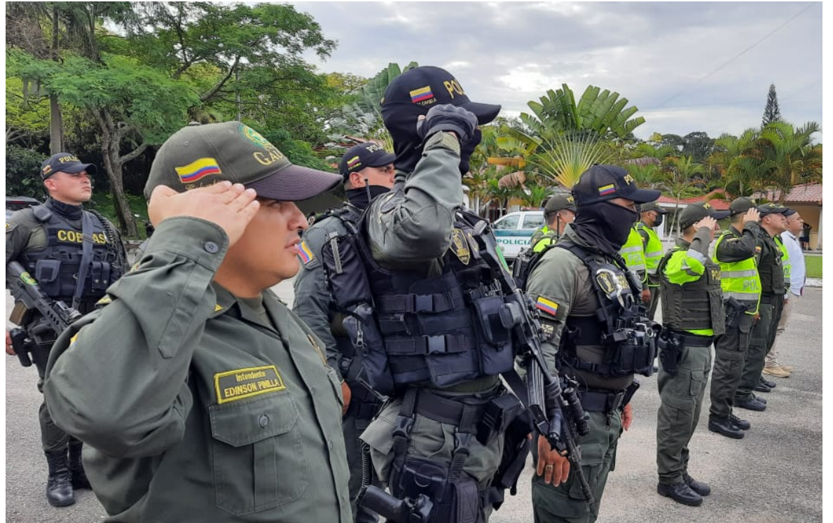
La Policía-Huila, tendrá unidades de reacción inmediata en Pitalito, La Plata, Garzón y Neiva.

suplantación de identidad”, indicó la funcionaria.