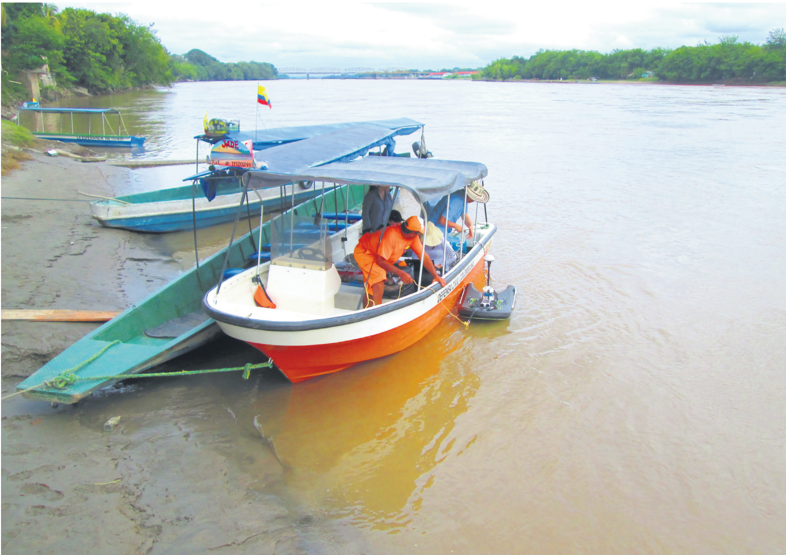
Hicieron talleres con las mismas comunidades y entidades.

“Eso nos permite el Plan Maestro, identificar ¿cuál fue la meta? ¿qué indicador me permite medir? Y ya desde Cormagdalena, poder contribuir a hacer un seguimiento, de si se está logrando o no y que nos hace falta para cumplirla”, dijo la delegada.