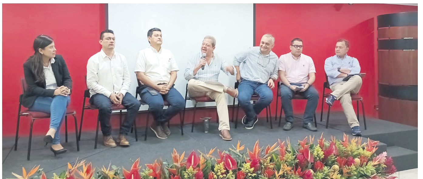
Funcionarios que estuvieron en la presentación del proyecto.

“Debido a que la información obtenida, es necesario procesarla, por ende creamos el Observatorio de la Cuenca del río Magdalena, que está en las primeras fases de constitución, y esperamos convertirlo en un sistema de soporte de decisiones, que nos permita hacer un ordenamiento integrado del afluente”, añadió la subdirectora.