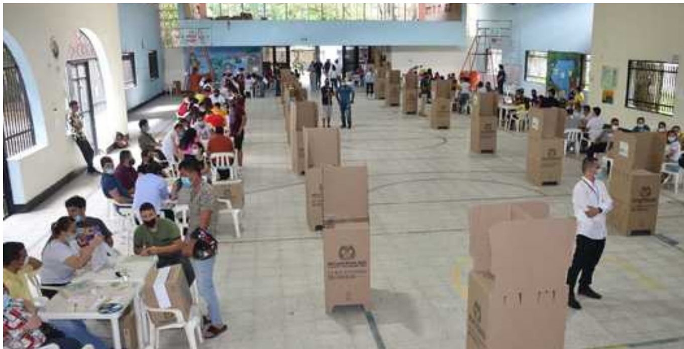
En el departamento del Huila, existen 910.119 potenciales electores.

En materia de seguridad, “ya hemos tratado estos temas con Ejército y Policía, está última, va a tener unas unidades de reacción inmediata en municipios como Pitalito para cubrir la zona sur, en el centro van a estar ubicados en Garzón, ya en el occidente en La Plata y en Neiva”, agregó la registradora delegada.