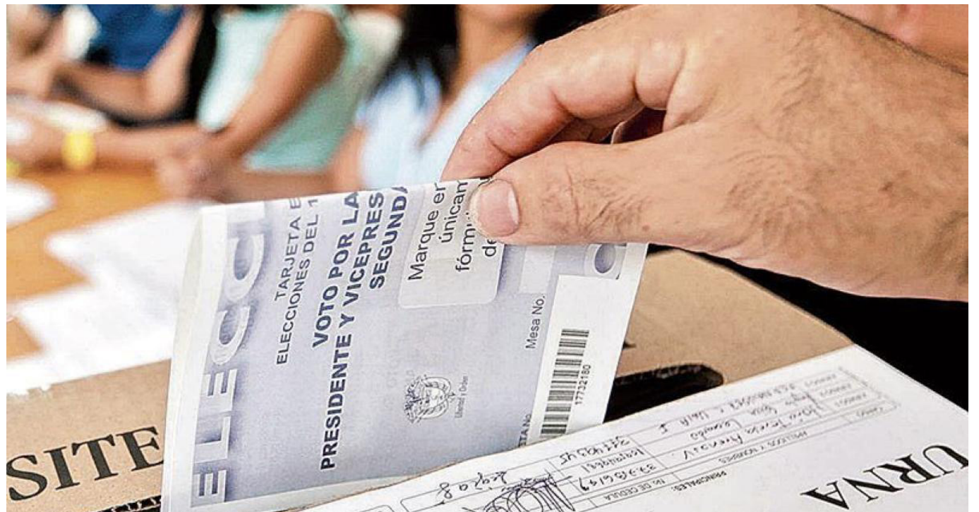
Los municipios del Huila cuentan con una estrategia actualizada y socializada para garantizar elecciones seguras y una respuesta adecuada en caso de incidentes.

Esta alerta, vigente del 28 al 30 de octubre, busca asegurar la adecuada prestación de los servicios de salud y la respuesta eficaz a situaciones de urgencia o emergencia, especialmente en el marco de las elecciones programadas para el 29 de octubre.