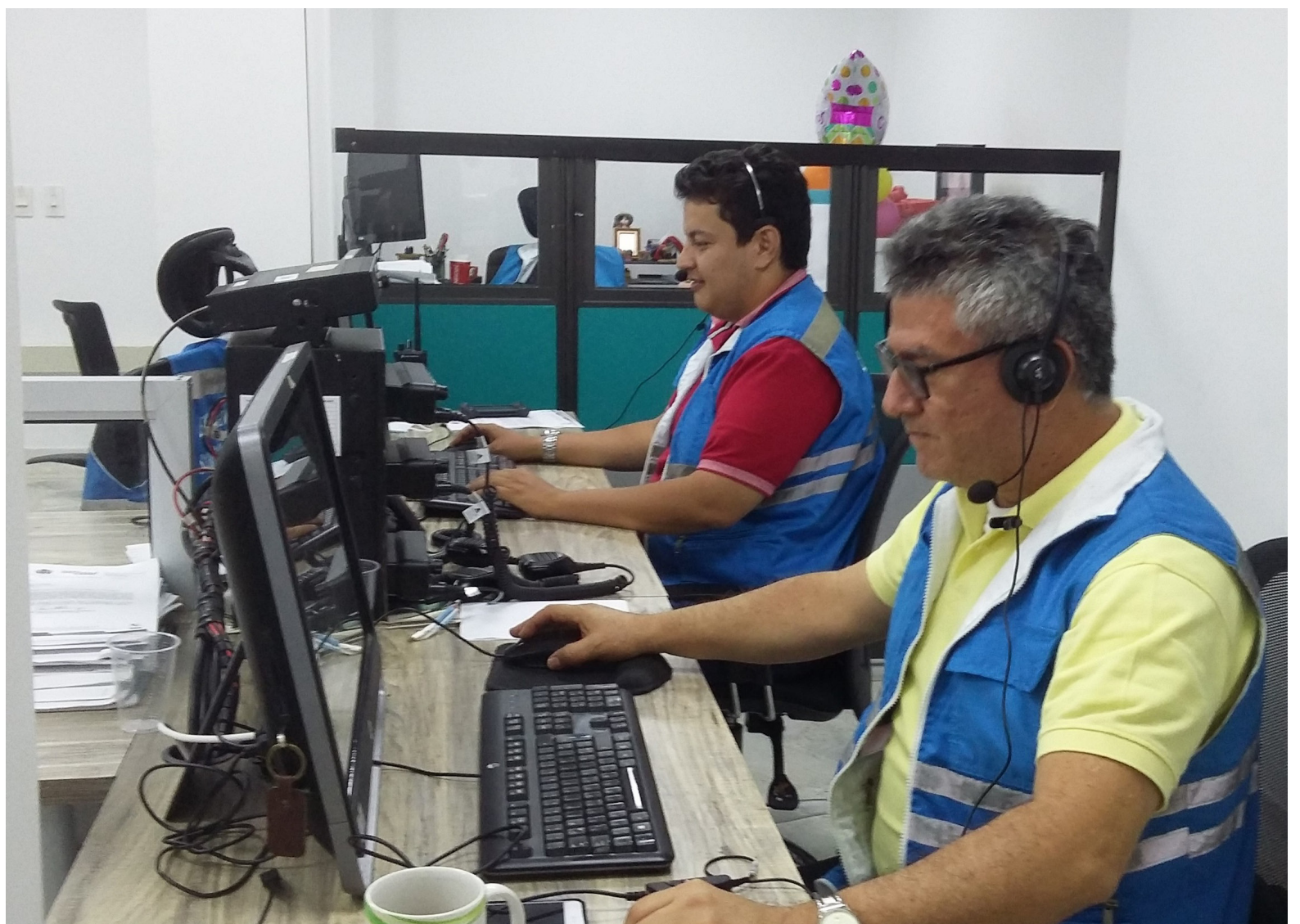
El CRUE Huila se encargará de monitorear y coordinar las respuestas a emergencias en el departamento durante el período de alerta verde.

La alerta verde en la red hospitalaria del Huila y de todo el país es una medida preventiva que busca asegurar la capacidad de respuesta ante situaciones de urgencia o emergencia. La coordinación, el alistamiento del personal de salud y la activación de planes de emergencia son aspectos fundamentales de esta alerta, que tiene como prioridad garantizar la atención médica de calidad en cualquier circunstancia. La colaboración de todas las instituciones de salud y autoridades involucradas es esencial para superar cualquier desafío que pueda surgir durante el período de alerta.