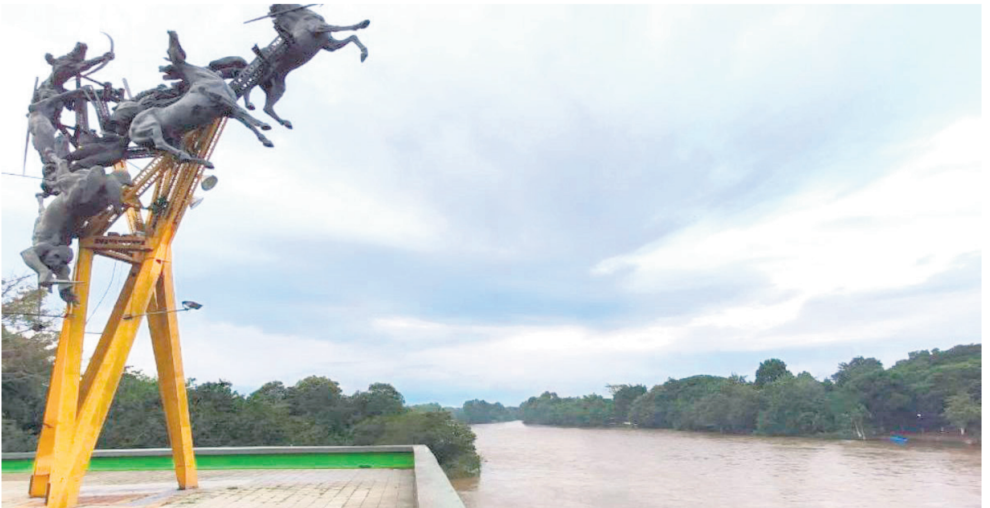
El río Magdalena recorre 1.500 kilómetros hasta su desembocadura.