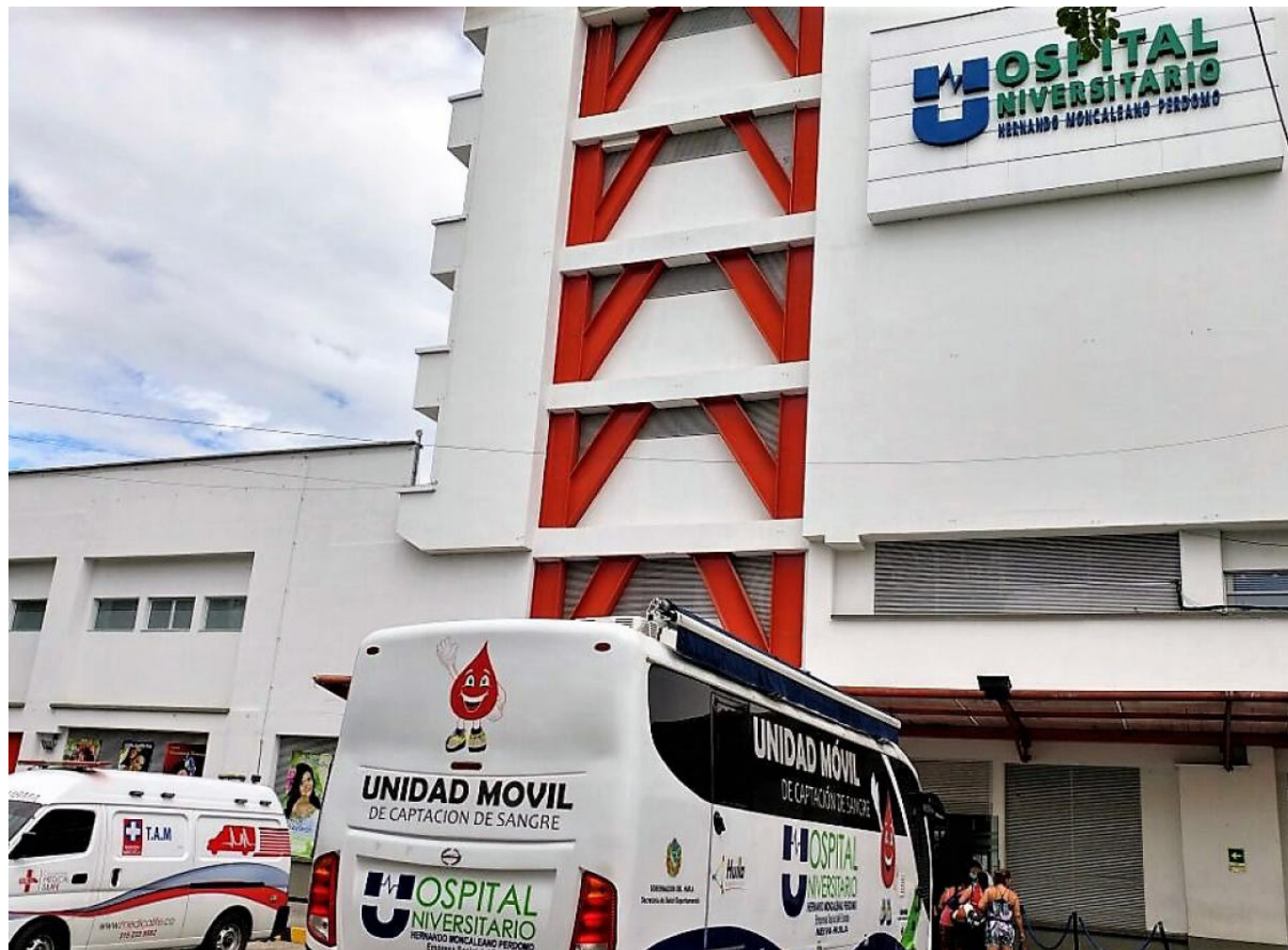
La preparación del personal médico es esencial para garantizar una respuesta eficaz en situaciones de urgencia durante la alerta verde en el Huila.

La red hospitalaria pública y privada del Huila se encuentra en alerta verde, de acuerdo con la Circular Externa No. 0018 de 2023 del Ministerio de Salud y Protección Social.