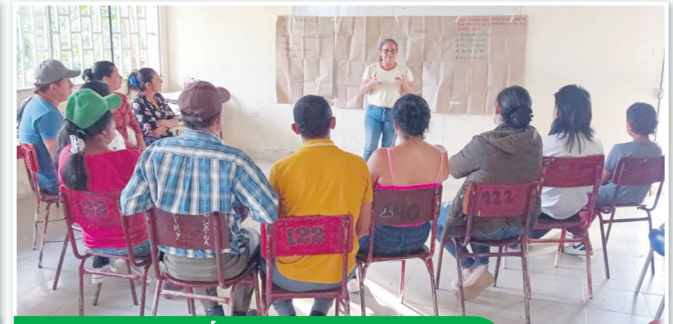
MUNICIPIO DE NÁTAGA IE PATIO BONITO