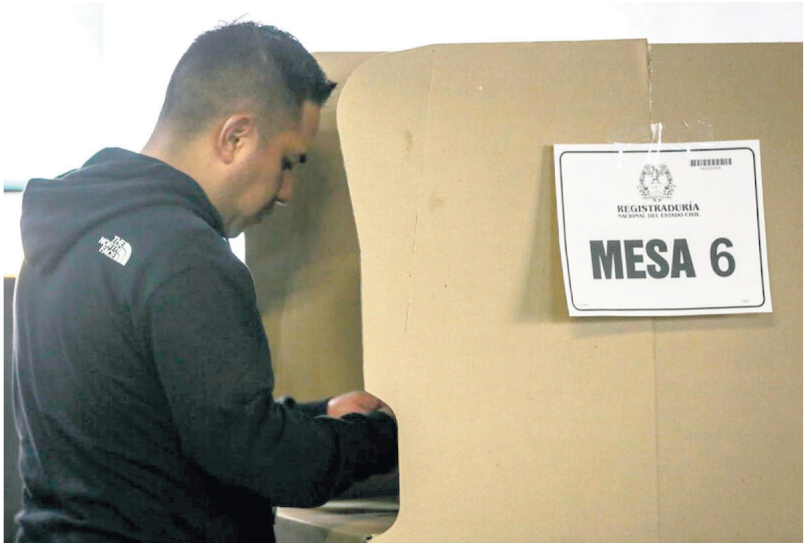
Los ciudadanos del Huila están listos para ejercer su derecho al voto en las elecciones territoriales del próximo domingo, con más de 900 mil personas habilitadas.

bianos que residen en el exterior no podrán votar en estas elecciones territoriales.