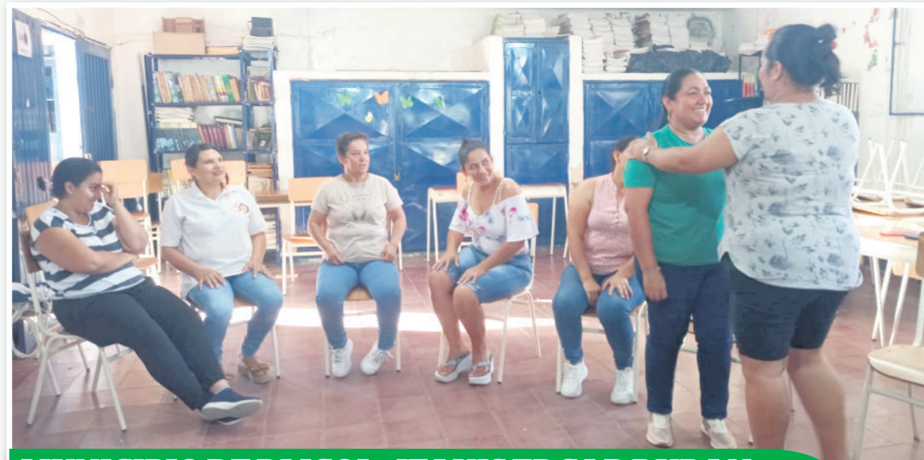
MUNICIPIO DE PAICOL - IE LUIS EDGAR DURAN