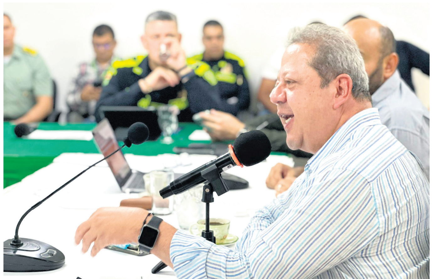
El mandatario de los huilenses manifestó que se han hecho reuniones con todos los actores del proceso electoral, para brindar las garantías de seguridad y transparencia.

El Departamento del Huila se prepara para un importante evento cívico, con 910,119 ciudadanos listos para ejercer su derecho al voto en las elecciones territoriales del 29 de octubre.