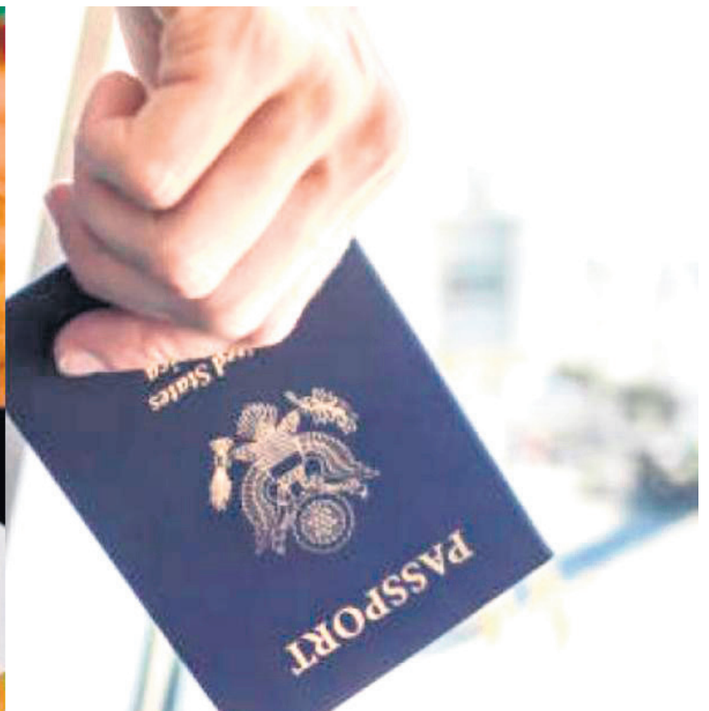
Los colombianos que residen en el exterior no podrán votar en estas elecciones territoriales.