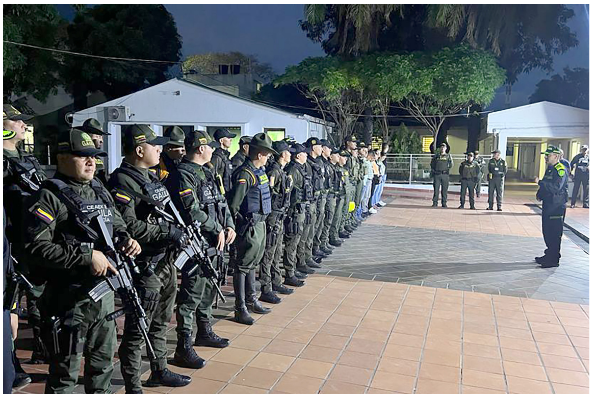
Policía Metropolitana de Neiva, lista con todas sus capacidades institucionales para garantizar las elecciones territoriales a través del Plan Democracia "Colombia vota segura". Son más de 1.500 uniformados que prestarán su servicio en sector urbano y rural.