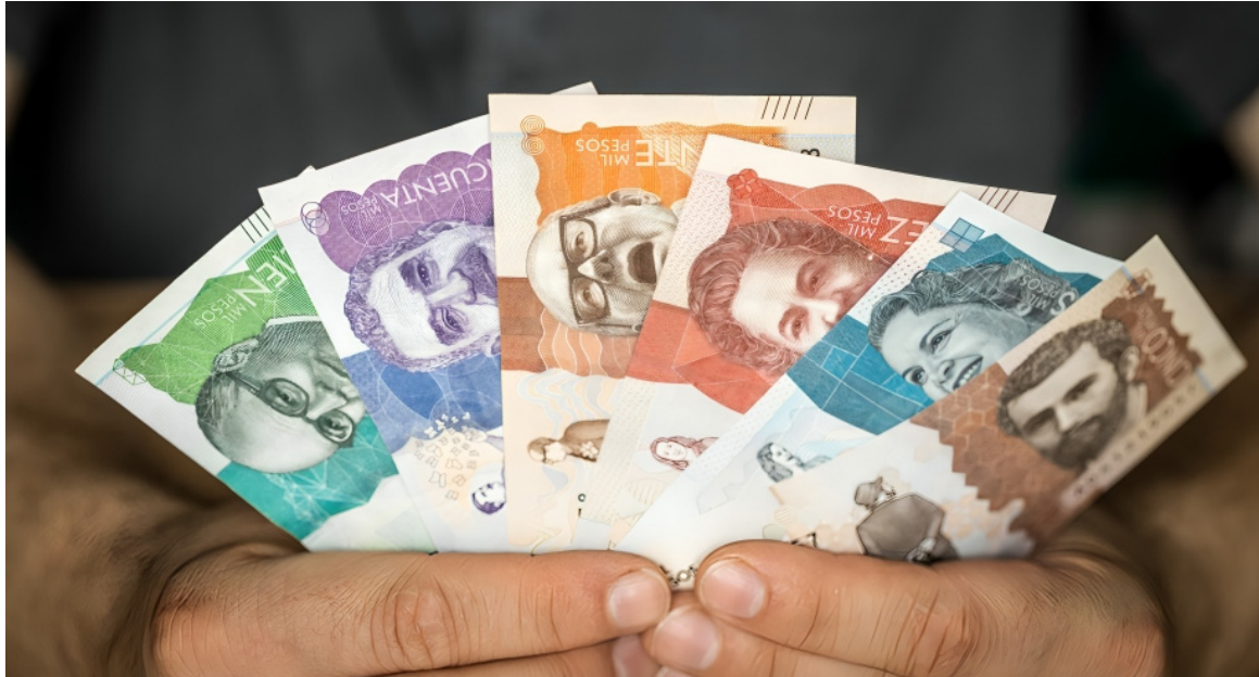
Las próximas decisiones serán clave para el futuro económico del país.

El principal argumento a favor de un incremento moderado radica en su posible impacto sobre