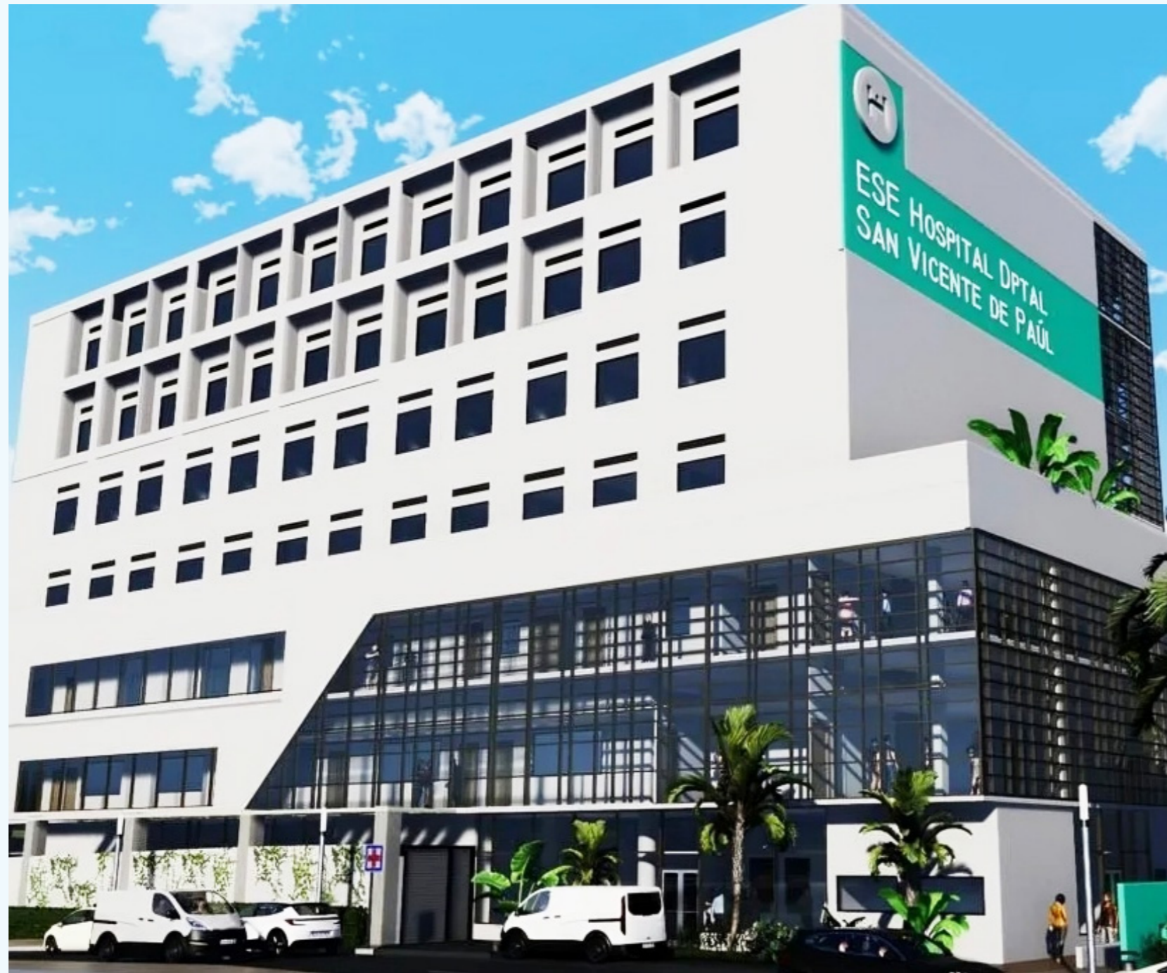
Asamblea del Huila, hace seguimiento a avance de la construcción de la nueva sede del Hospital San Vicente de Paúl.

Y con el objetivo de hacerle seguimiento a la infraestructura hospitalaria en el muni-