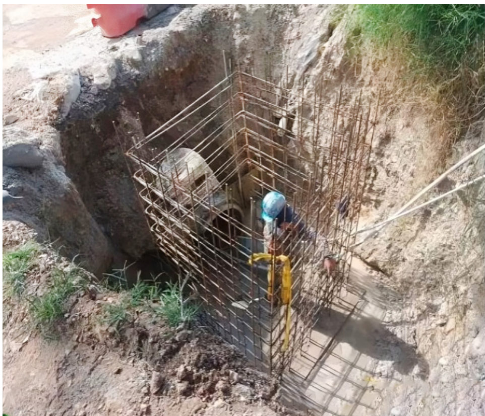
Cabrera explicó que ya se han realizado acercamientos con Alcanos y la Electricidad del Huila para resolver los problemas.

Las autoridades departamentales, junto con el Gobierno Nacional y las empresas contratistas, están trabajando en resolver los problemas técnicos que han llevado a la paralización temporal de las obras, y se espera que en los próximos días se firme el acta de reinicio. A medida que se reanuden los trabajos, el desafío será acelerar la ejecución para compensar el tiempo perdido y asegurar que esta obra estratégica pueda estar lista en el menor tiempo posible.