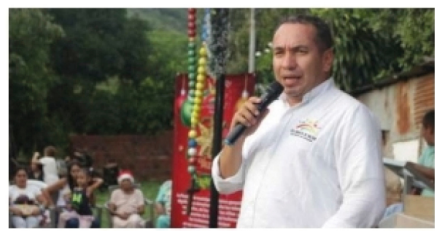
'Es necesario un rediseño institucional de la personería de Neiva' ■ ENTREVISTA 2-3