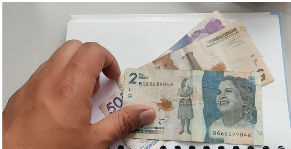
La tasa de desempleo a julio de 2023 fue del 9,9%, lo que genera preocupación ante un posible aumento elevado.

Los últimos tres años han estado marcados por fuertes incrementos en el salario mínimo. En 2022, el aumento fue del 10,03%; en 2023, se situó en un 16%; y finalmente, para el año 2024, el incremento alcanzó el 12%.