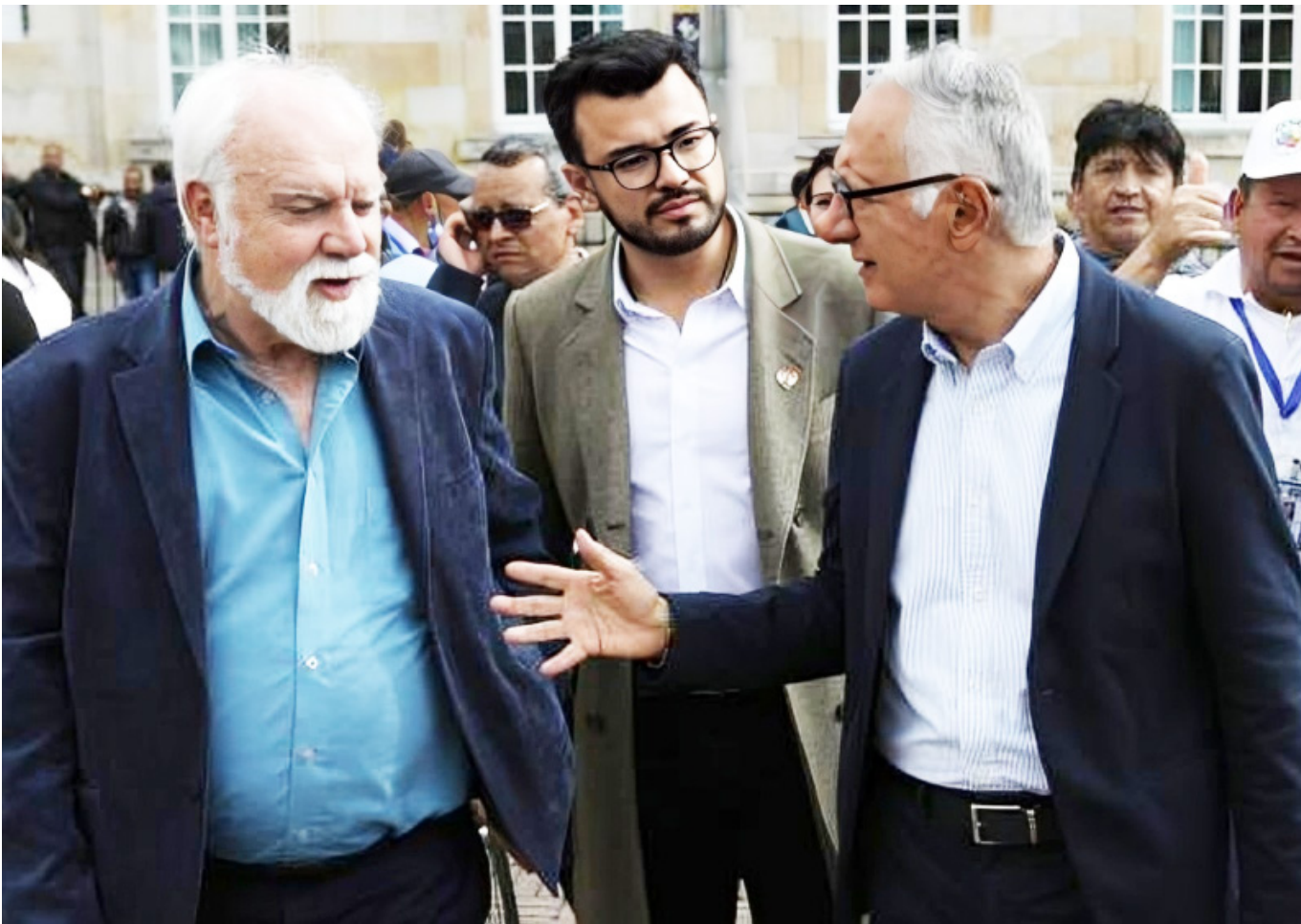
Durante las manifestaciones de 09 de abril, a las afueras del congreso de la república de Colombia, se le vio al director de la Adres, Félix León Martínez.

en el pagador único del sistema de salud, como lo propone la reforma que actualmente se discute en el Congreso.