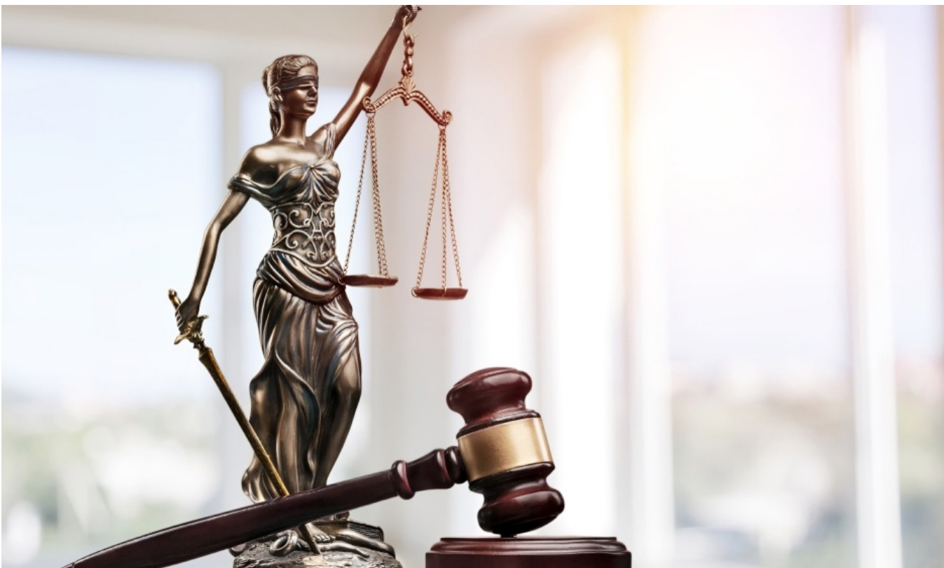
Los allegados temen que este caso quede en la impunidad.

Hay que recordar que para la fecha de los hechos, la Clínica Alejandría, agregó que las explicaciones del caso fueron expuestas a sus familiares, no habiendo lugar a ninguna otra manifestación del cirujano ni de la IPS, en escenario diferente al abordado y al presente. Y habrá pronunciamiento únicamente ante las autoridades competentes en caso de requerirnos.