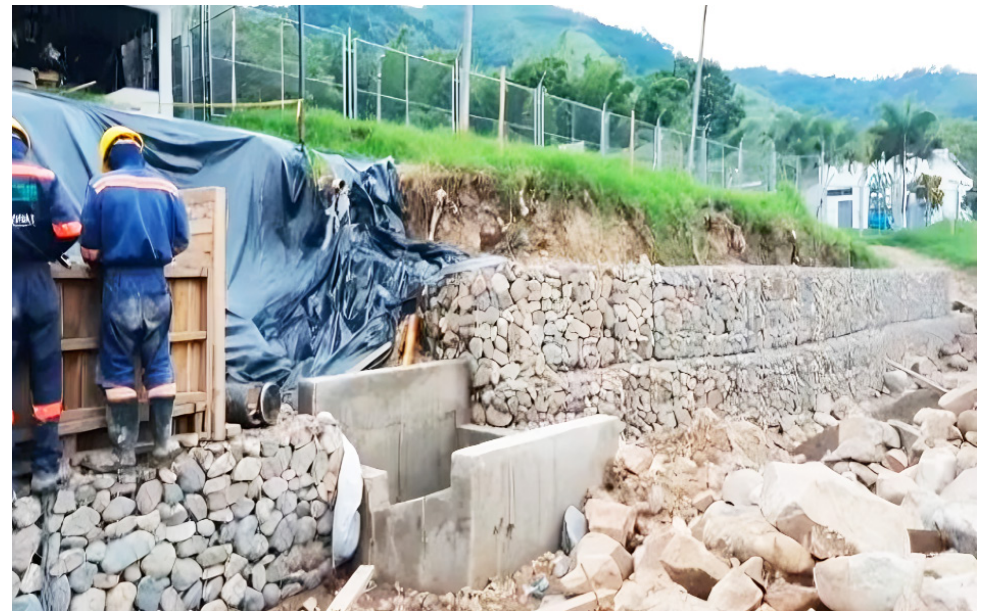
En términos de avance físico, la obra ha alcanzado un 47,70%, con una inversión de más de 17,871 millones de pesos.