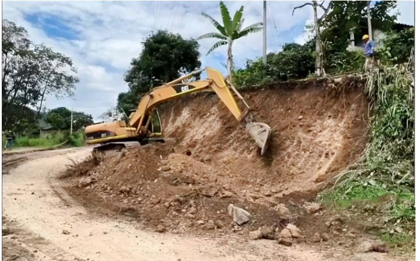
El plazo de ejecución original del proyecto es de 24 meses, con una fecha de inicio el 10 de febrero de 2023 y una proyección de entrega para el 10 de febrero de 2025.

Sin embargo, este progreso está por debajo de lo esperado, considerando que la obra ya ha superado la mitad del tiempo de ejecución programado. A poco más de un año de haber iniciado, el proyecto debería haber avanzado en una mayor proporción, lo que genera incertidumbre sobre si se logrará cumplir con la fecha de entrega original, fijada para febrero de 2025. La suspensión de las obras y los problemas logísticos que han surgido en el camino podrían retrasar aún más la finalización del proyecto, lo que ha llevado a que muchos en la región expresen su preocupación por el destino de esta importante infraestructura.