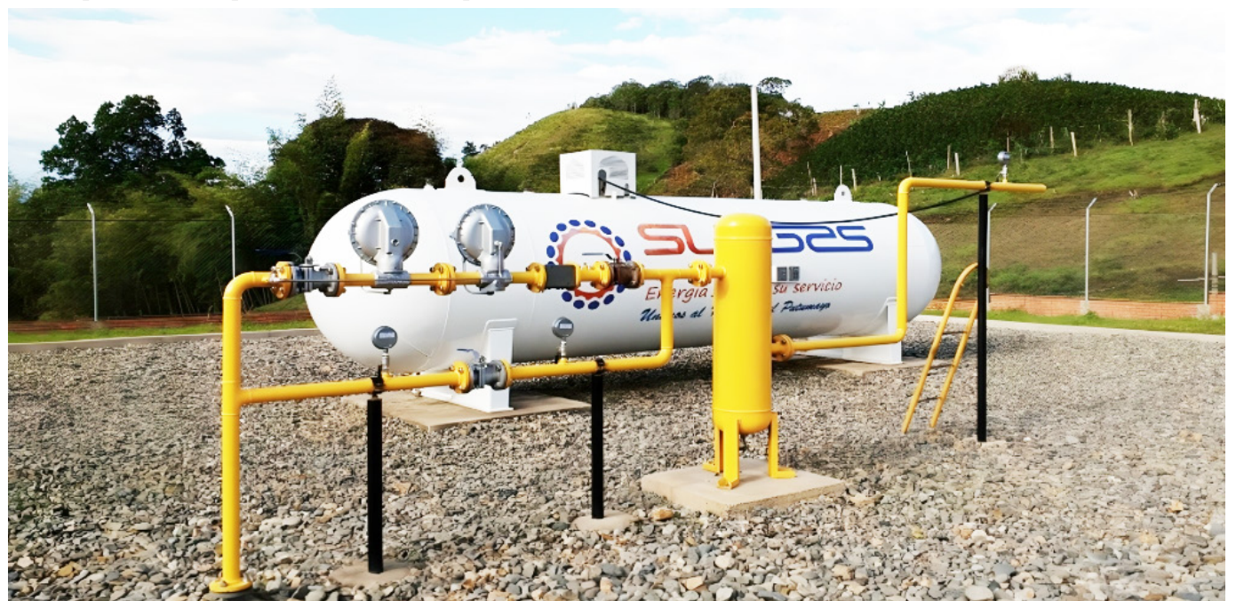
Estación de abastecimiento instalada por Surgas en zonas rurales.