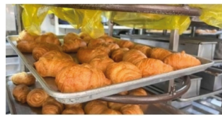
Panaderos del Huila, afectados por bajo consumo ■ ECONOMÍA 6-7