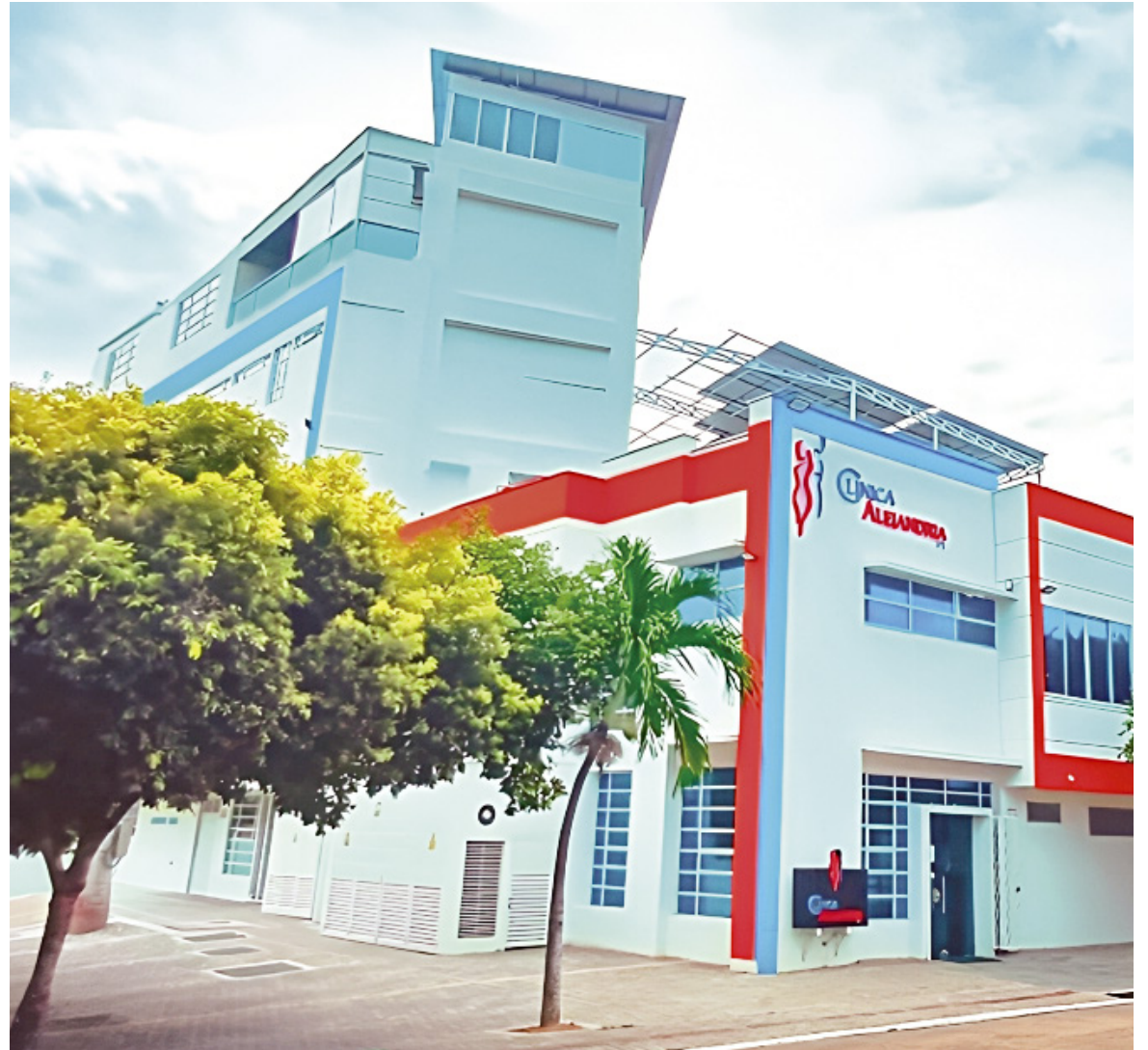
Centro asistencial donde fue intervenida la mujer.

“Queremos saber si ya han llamado al cirujano, que tampoco se ha comunicado con nosotros y conocer, si el Instituto de Medicina Legal, ya envió el informe acerca del fallecimiento de mi esposa al ente investigador. Y tengo miedo de conseguir un abogado, porque muchos no sirven para nada”, dijo el declarante.