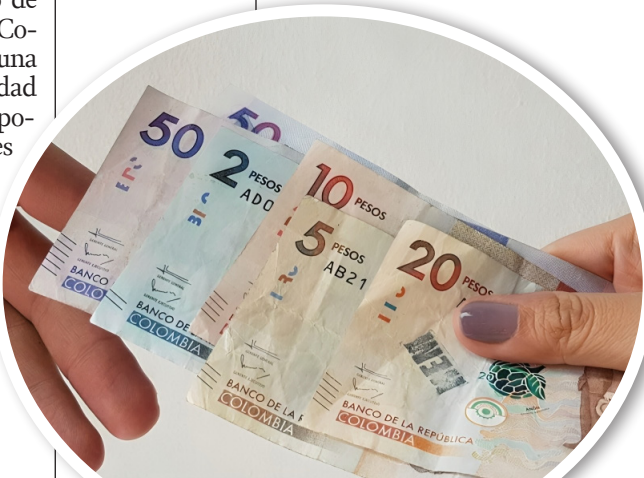
El ministro de Hacienda espera un crecimiento del PIB del 1,7% para finales de 2024.

En conclusión, el incremento del salario mínimo para 2025 se perfila como un tema de gran relevancia en la agenda económica del país. Si bien un aumento moderado, de un solo dígito, podría ser la opción más prudente para evitar presiones inflacionarias y desequilibrios en el mercado laboral, las negociaciones entre el Gobierno, los empresarios y las centrales obreras serán decisivas para determinar el futuro del salario mínimo en Colombia. Con un panorama económico incierto y una inflación que, aunque en descenso, sigue siendo una preocupación, la decisión final tendrá un impacto significativo en la estabilidad y el crecimiento económico del país en los próximos años.