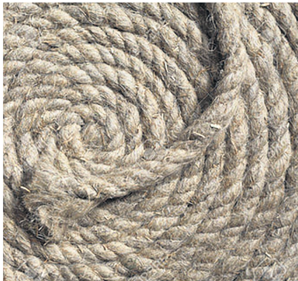
El cáñamo de la planta es utilizado en ladrillos de construcción y en ropa por su resistencia.

La marihuana medicinal, se refiere al uso del narcótico para tratar ciertas afecciones. En los Estados Unidos, más de la mitad de los estados la han legalizado para uso medicinal.