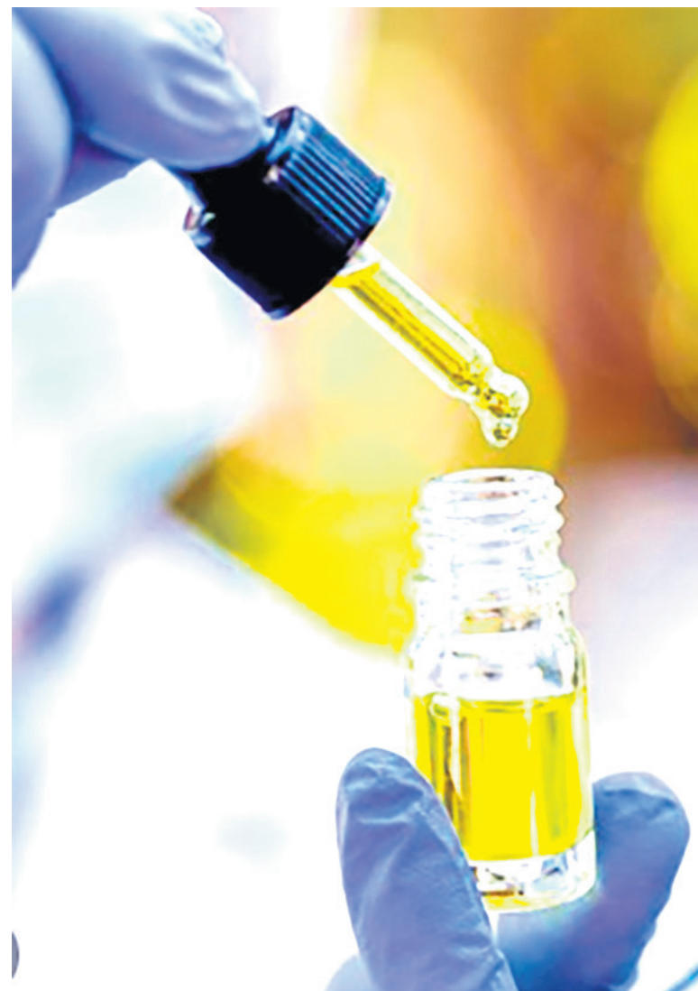
Se están utilizando gotas de uso veterinario en perros, gatos y bovinos.

Para dimensionar las 'trabas' en la exportación de los productos cannábicos, un comerciante se contactó con un comprador alemán y debía enviar la mercancía al país teutón. Los artículos tardaron entre 60 y 70 días en llegar a su destino, lo que generó una inconformidad de parte del comprador. "Ya ha perdido calidad y frescura", agregó el funcionario.