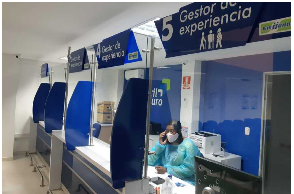
¿Sabe usted si hace parte de estas EPS?

Pero también es posible habilitarlo en otro navegador como