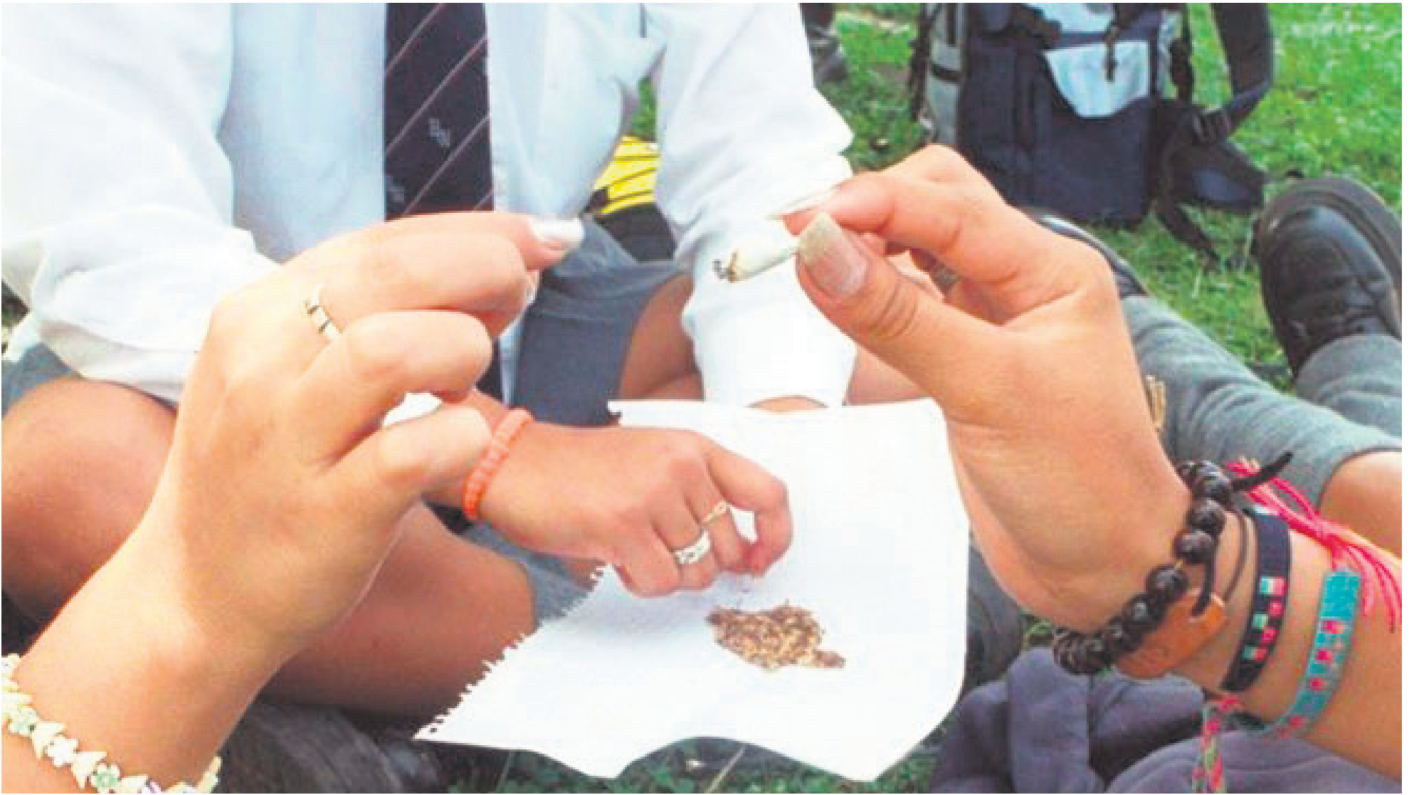
Alarma por consumo de alucinógenos en colegios.