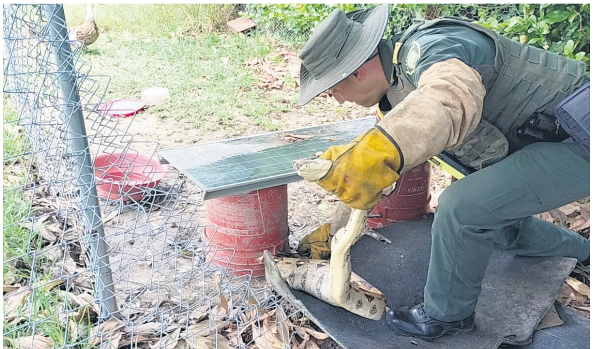
Uniformados de la Policía del grupo de Protección Ambiental y Ecológica, rescataron una culebra en un conjunto residencial en Palermo.