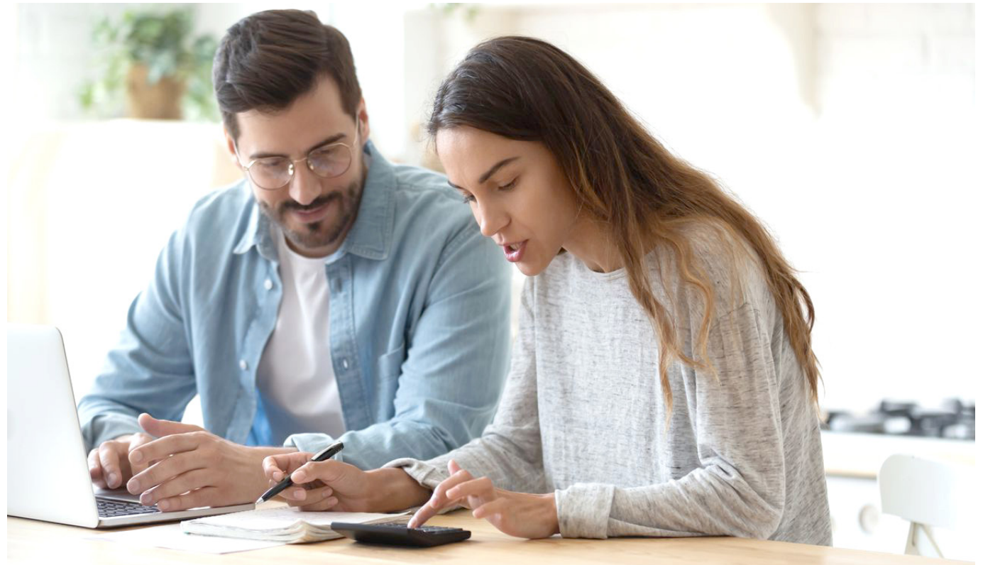
Como empleado o trabajador independiente, puede tener derecho a ingresos no gravados, a rentas exentas y a deducciones especiales"