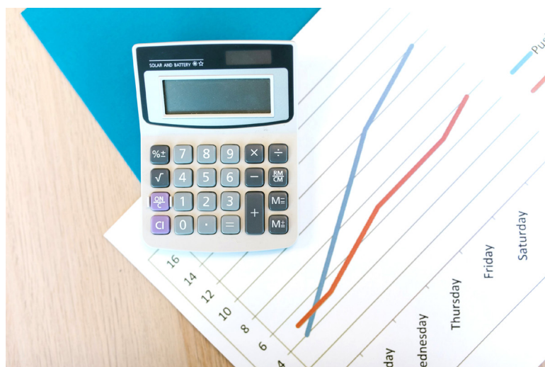
¿Sabe usted, cuales beneficios tributarios contemplo la reforma tributaria del actual gobierno?