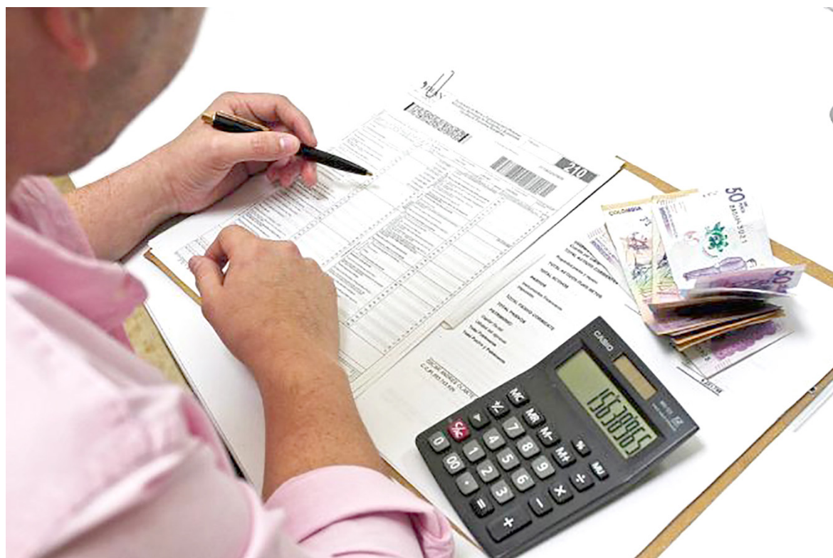
¿Sabe usted, cuáles beneficios tributarios derogó la reforma tributaria del actual gobierno?

Para efectos tributarios, una cosa son los ingresos no constitutivos de renta ni ganancia ocasional y otra cosa son las rentas exentas del impuesto a la renta.