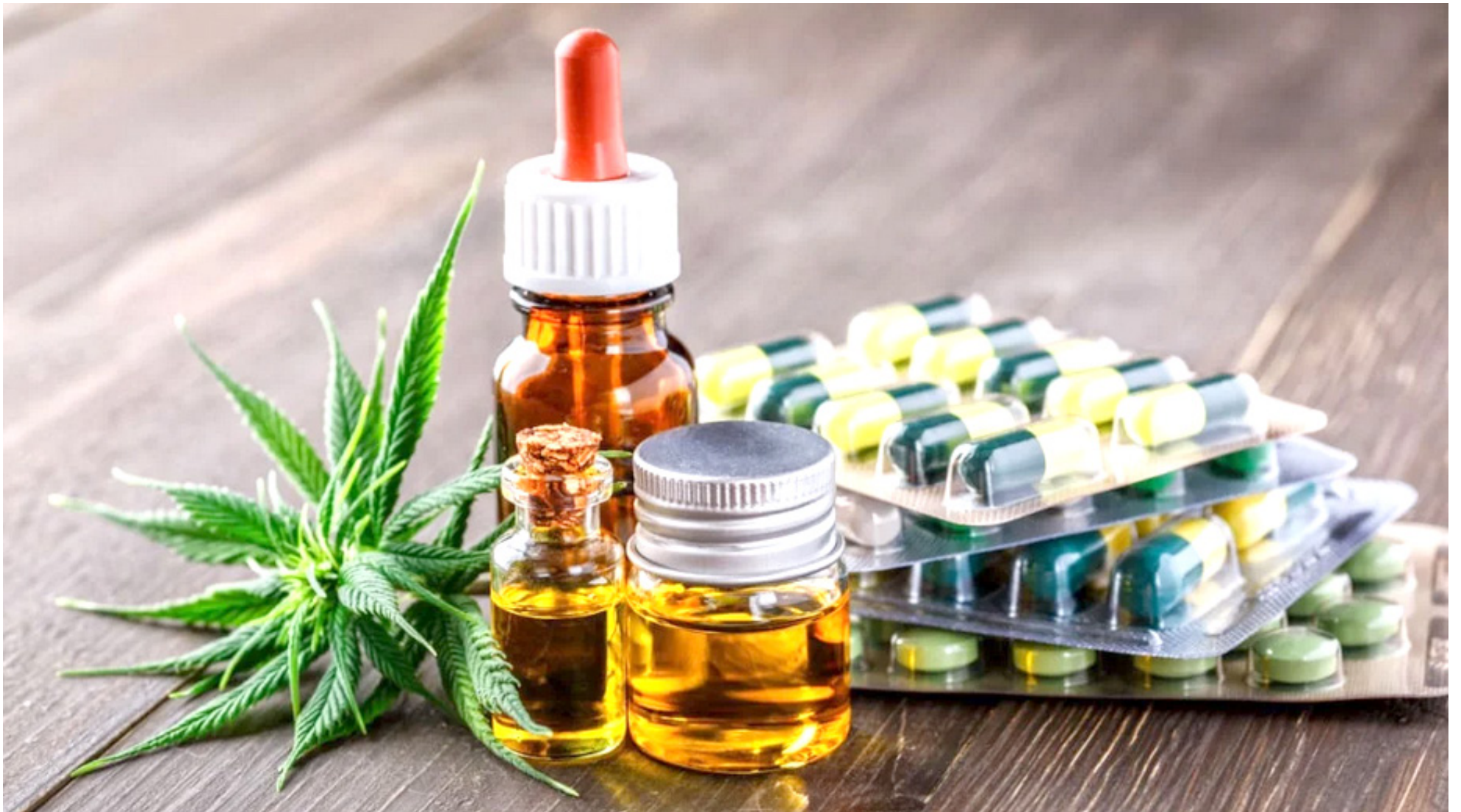
Entre los productos derivados del cannabis se encuentran: jabones, champú, aceites de uso sublingual, pomadas de recuperación muscular.