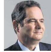
Germán Vargas Lleras

Celebro que las investigaciones en relación con los contratos de la firma Odebrecht en Colombia finalmente empiezan a esclarecer los actos de corrupción que tuvieron lugar con las actuaciones de esta empresa en el país. En el caso concreto de la adición presupuestal al contrato Ruta del Sol 2 tramo Ocaña-Gamarra, que dio lugar al informe del Departamento de Justicia de Estados Unidos ya se conocen los involucrados, excepto el que denominan 'oficial 3', señalado como principal beneficiario de este entramado.