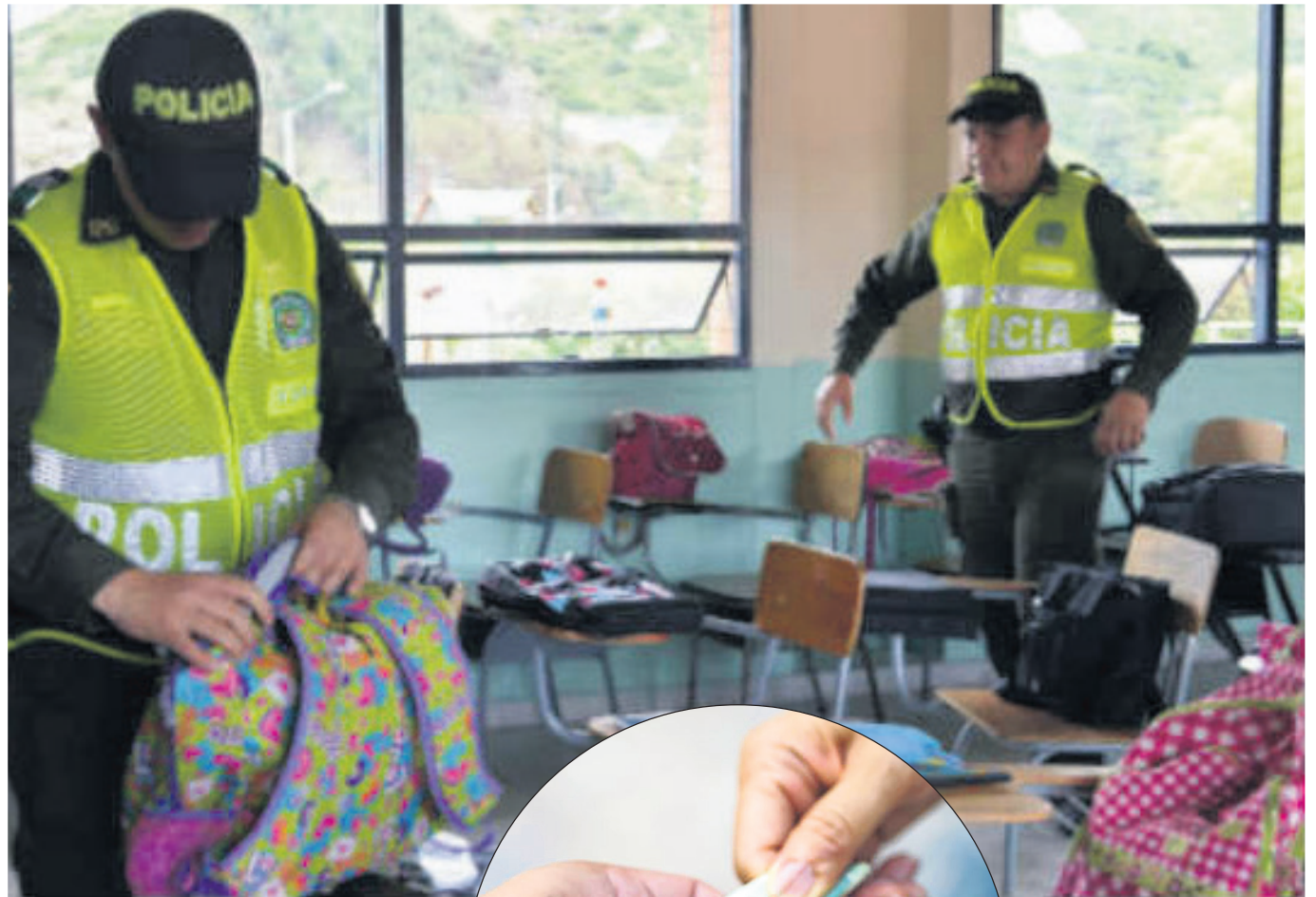
Las autoridades policiales van a adelantar operativos.

La Corte Constitucional señala, que los concejos distritales y municipales deben regular las condiciones de tiempo, modo y lugar para que el consumo no genere condiciones de riesgo para los menores de edad.