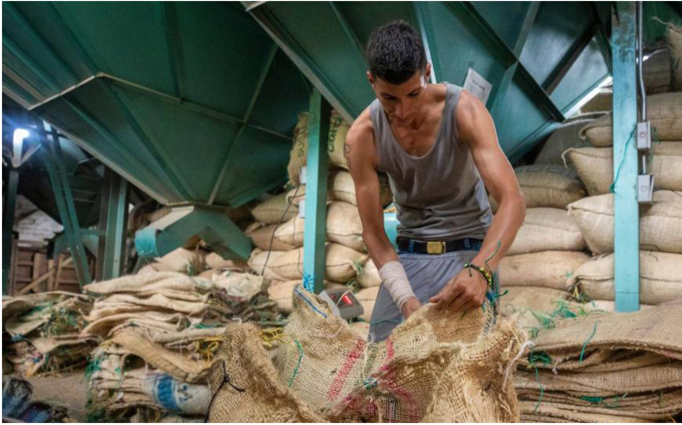
La FNC hace un llamado a la necesidad de soluciones por parte del Gobierno Nacional para respaldar a los caficultores en este momento crítico.

exploración de nuevos mercados”, destaca el directivo, resaltando además el compromiso con los caficultores y el esfuerzo por ofrecer resultados tangibles en cada una de las empresas de este grupo, así como en la captura del mercado asiático y chino, y por supuesto, en el trabajo realizado para promover la austeridad en la Federación.