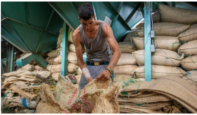
Respiro para los caficultores