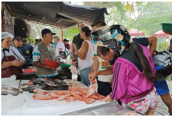
Pescado bueno y de calidad en Neiva