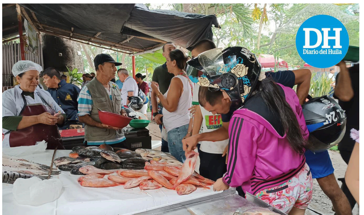
Con gran afluencia los neivanos se acercan a comprar las diferentes clases de pescado que se ofrecen desde la orilla del Río Magdalena, en el Malecón.