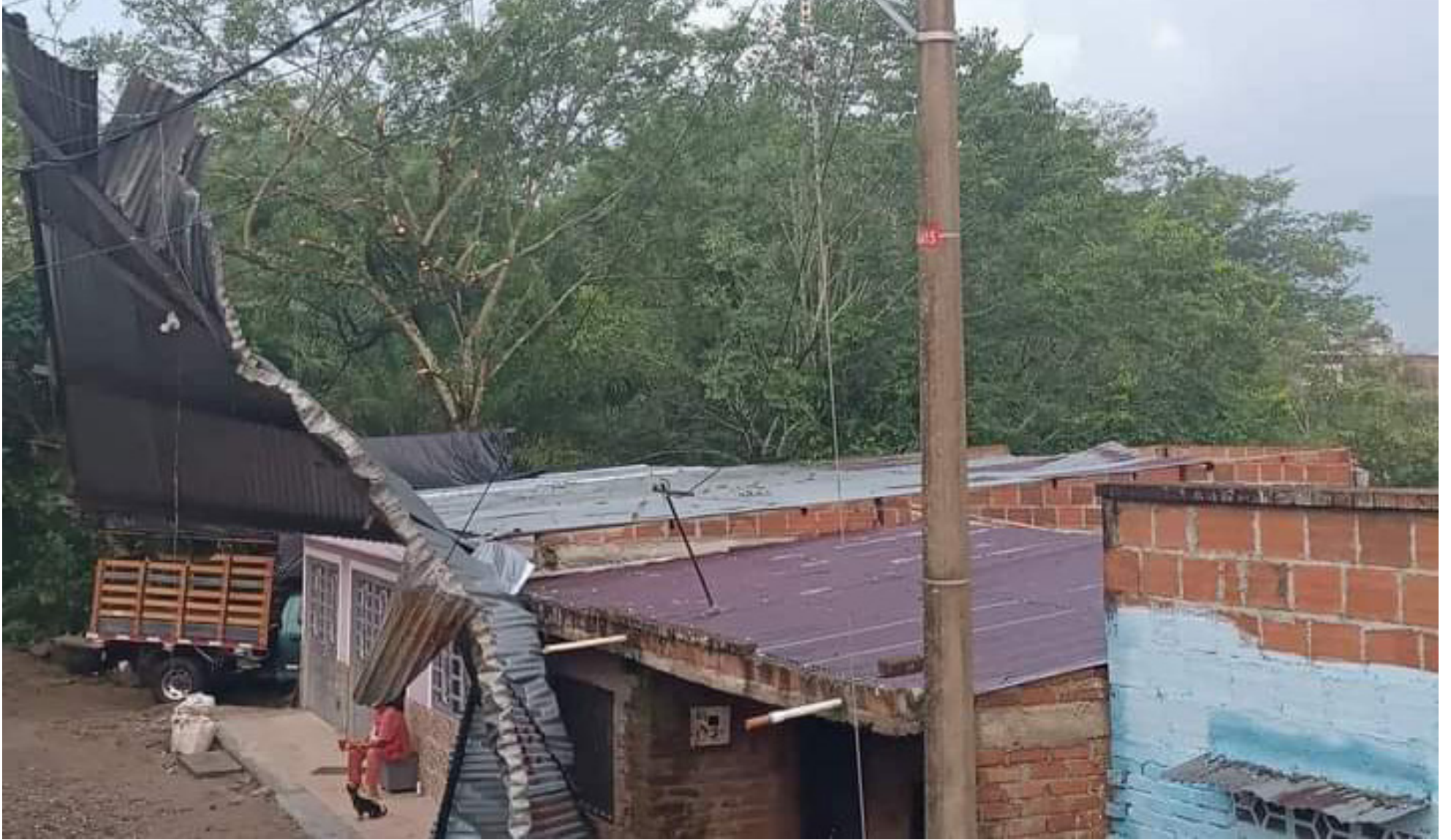
En el municipio de Algeciras, se presentó un vendaval que dejó seis viviendas afectadas.