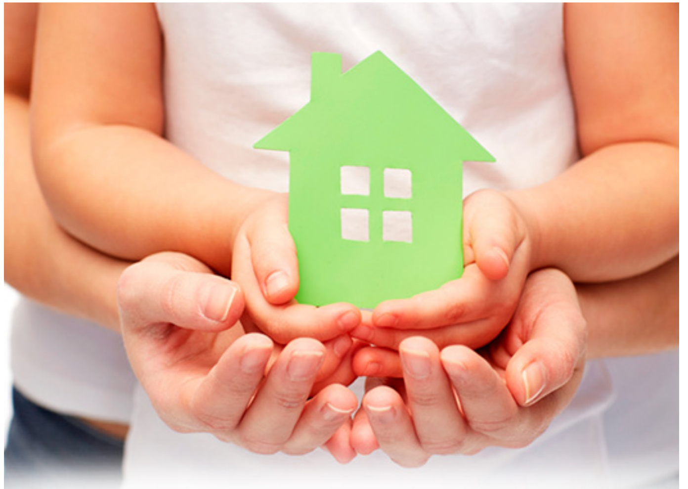
Suspenden asignación del subsidio de vivienda hasta abril.

Así las cosas, solo hasta el 5 de abril de 2024 se retomará la dinámica con la que venía el programa.