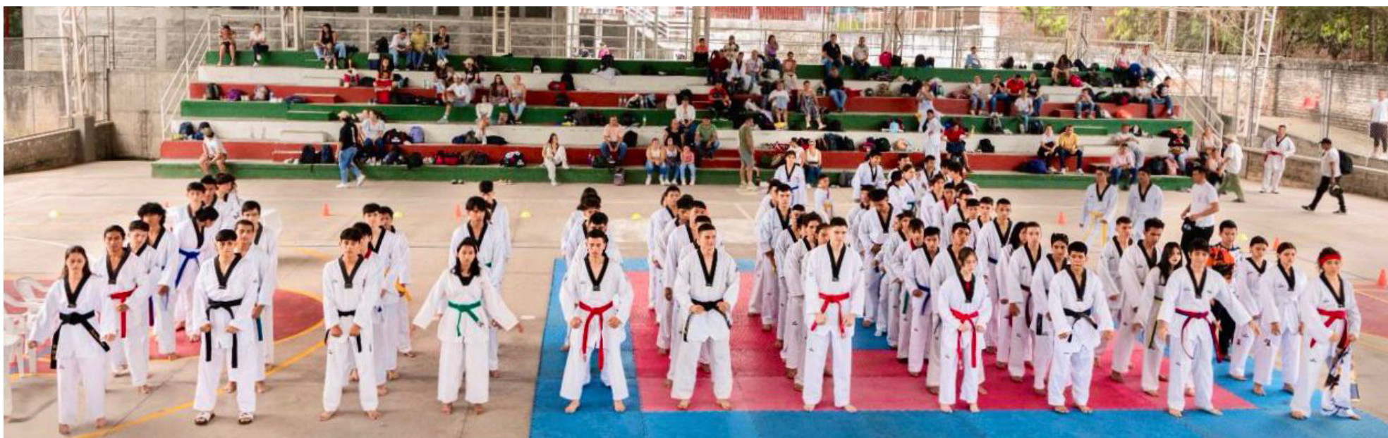
La realización del campeonato y de futuros eventos deportivos en la disciplina, sirven como herramienta para hacer seguimiento a los deportistas.