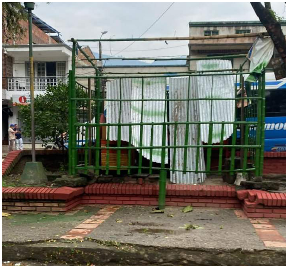
Crecente del río Frio, se llevó la bocatoma del acueducto del municipio de Rivera.

tamental, le vienen haciendo la invitación a los mandatarios de cada localidad, para que den cumplimiento a los principios normativos de la Ley 1575, garantizando el flujo de recursos para la prestación del servicio de Bomberos, las 24 horas del día”.