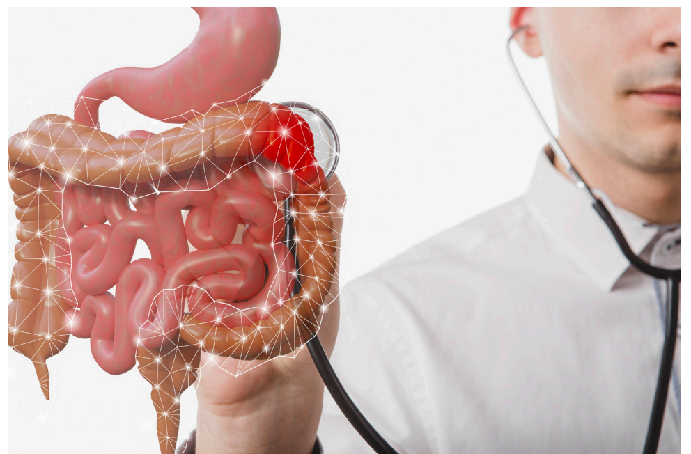
La identificación de los factores de riesgo, la detección temprana y el tratamiento adecuado son claves para prevenirlo y curarlo.

“Sobre el primero, solo del 10 al 20% de pacientes con cáncer colorrectal tienen historial familiar y solo del 5 al 7% cuentan con una alteración genética definida. También como factor de riesgo personal se incluye la presencia de enfermedad inflamatoria intestinal, los pólipos o la diabetes mellitus y los pacientes