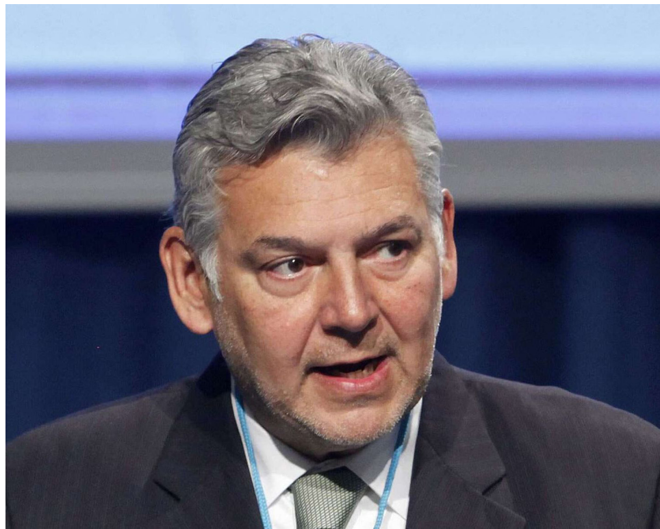
Jaime Alberto Cabal, presidente de Fenalco, enfatiza la necesidad de implementar un plan de choque para la reactivación de la economía y estimular la creación de empleo en Colombia.

Según el gremio de los comerciantes, el incremento del desempleo se atribuye al declive en los sectores del comercio, la industria y la construcción. Estos sectores han enfrentado dificultades que se han reflejado en el empleo del país.