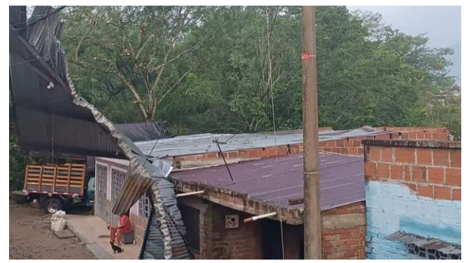
Lluvias ya dejaron afectaciones