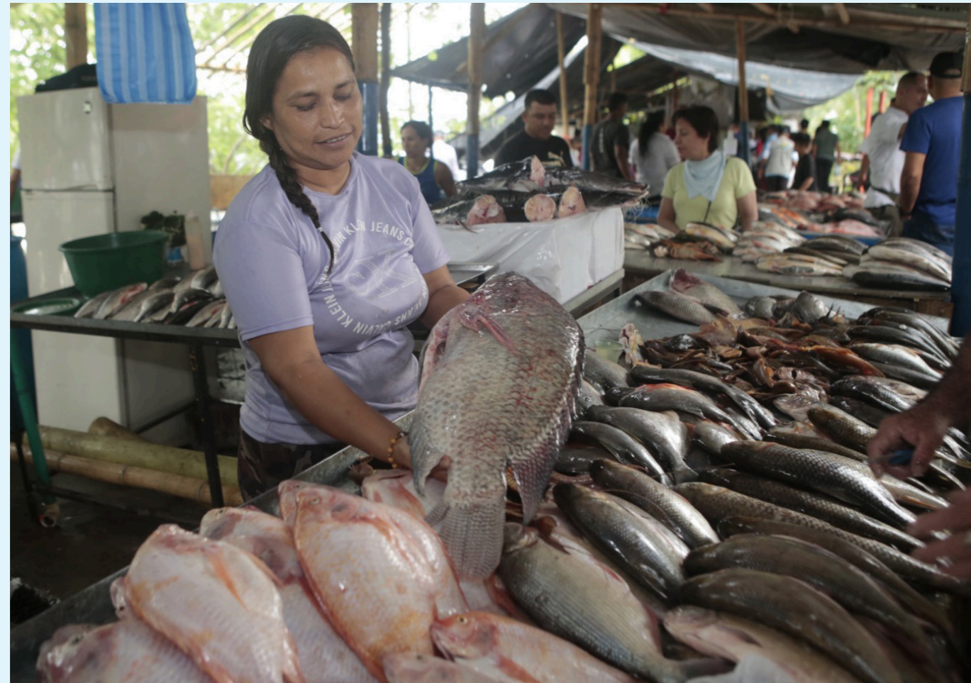
Los comerciantes invitan a la ciudadanía a consumir pescado.

Para que la población tenga en cuenta que la libra de cachama, se encuentra en