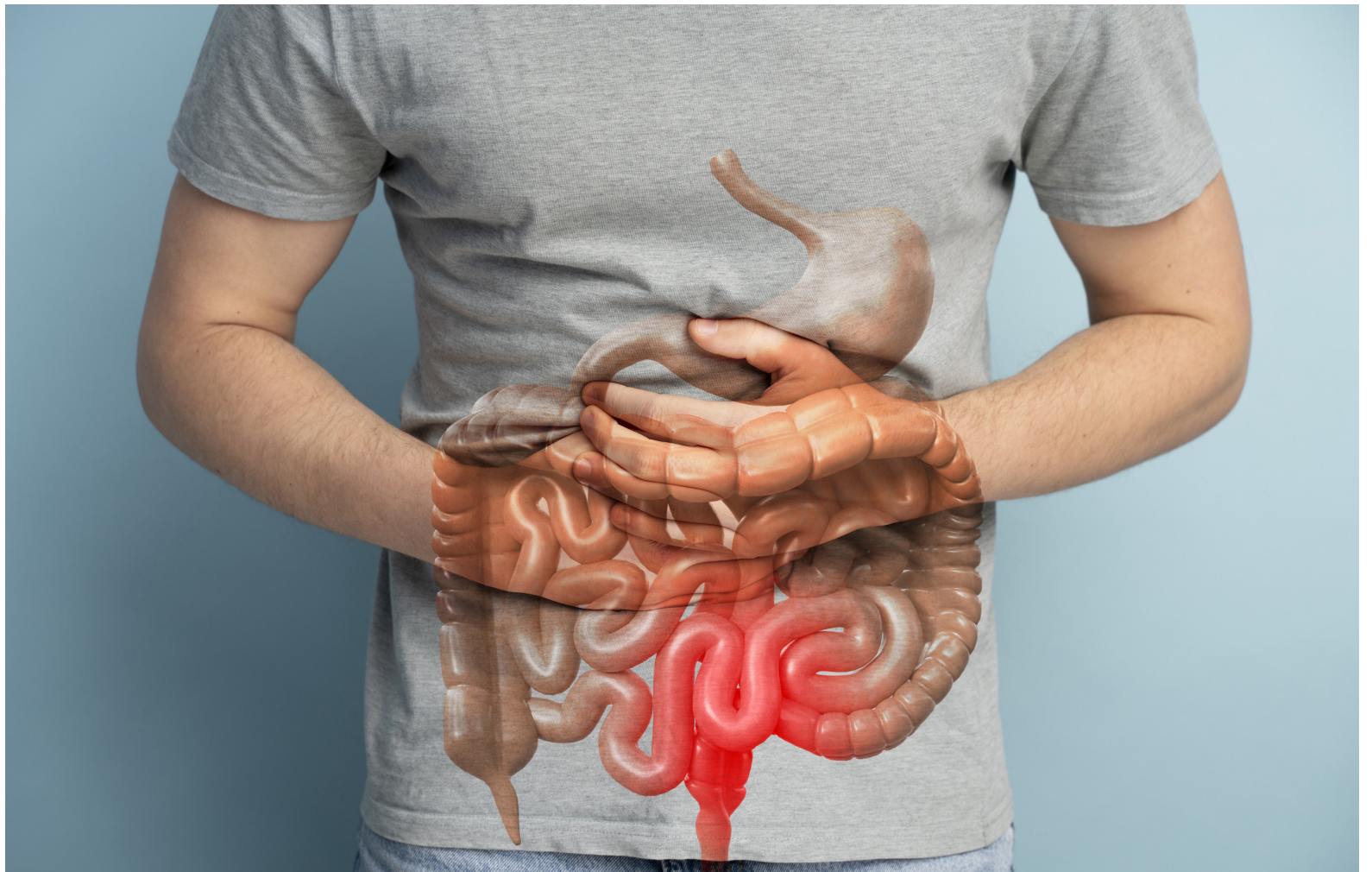
El cáncer de colon es uno de los tipos de cáncer con mayor incidencia en Colombia.

El experto recomienda que hombres y mujeres entre 45 y 50