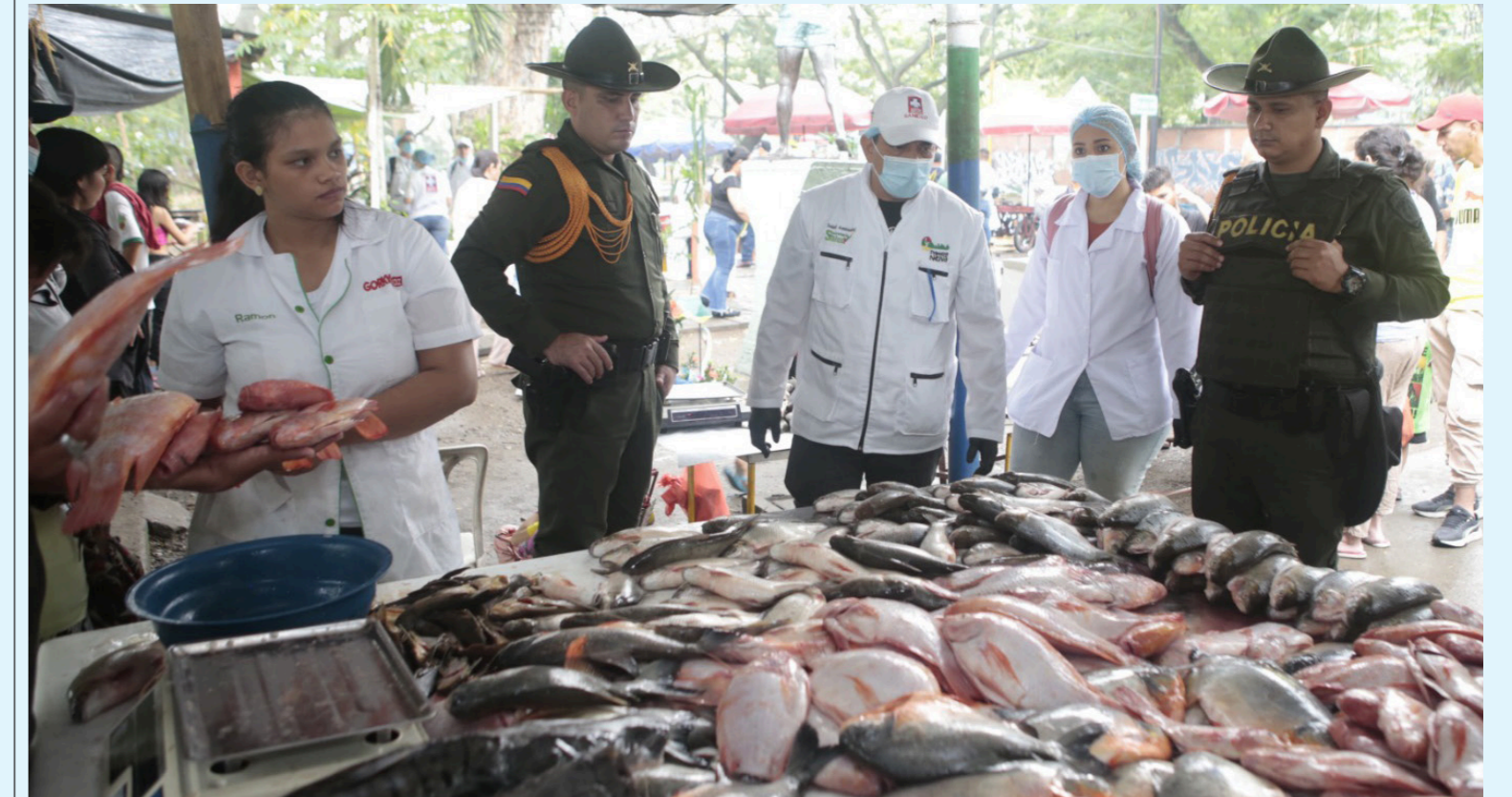
Vaya tranquilo que hay estrictos controles sanitarios.

Y es que, durante el período de enero a septiembre del año pasado, con respecto al mismo período de 2022, el PIB de pesca y acuicultura registró un crecimiento de 17%. Durante el mismo período de enero a septiembre de 2023, con respecto a 2022, las exportaciones de tilapia y trucha crecieron.