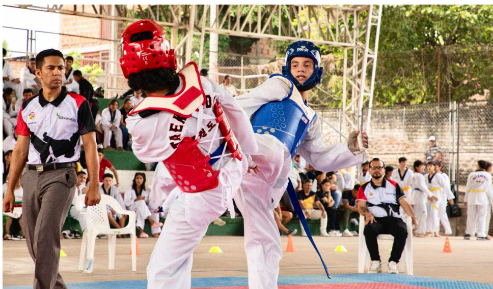
La fiesta del Taekwondo se vivió en Campoalegre.