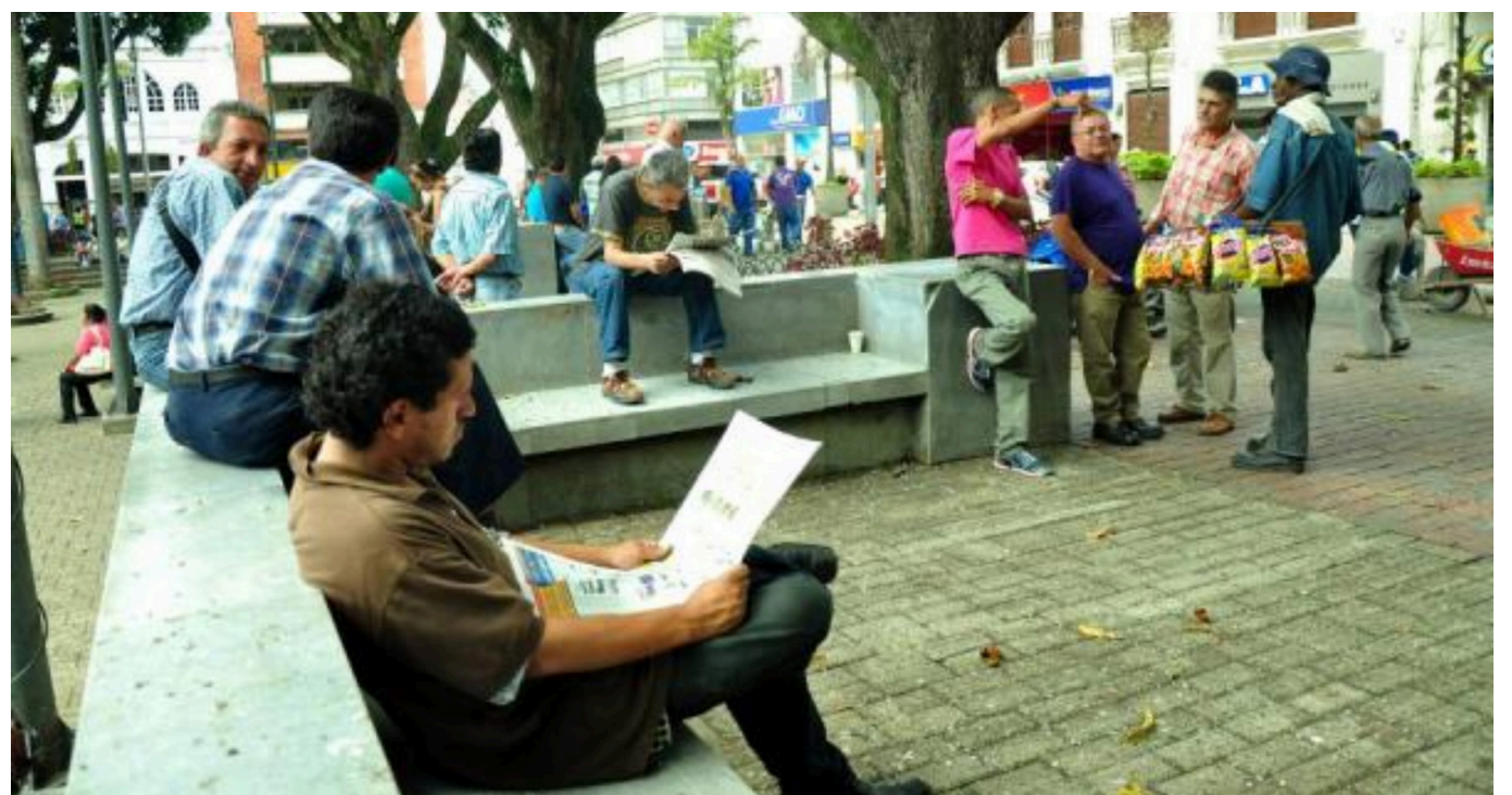
Quibdó, Riohacha y Florencia son algunas de las ciudades colombianas con las tasas de desempleo más altas, según los datos del trimestre comprendido entre diciembre de 2023 y febrero de 2024.

La tasa de desempleo en Colombia ha experimentado un preocupante aumento, según revela el reciente informe del Departamento Administrativo Nacional de Estadística (DANE). Neiva figura entre las ciudades más afectadas por esta tendencia adversa.