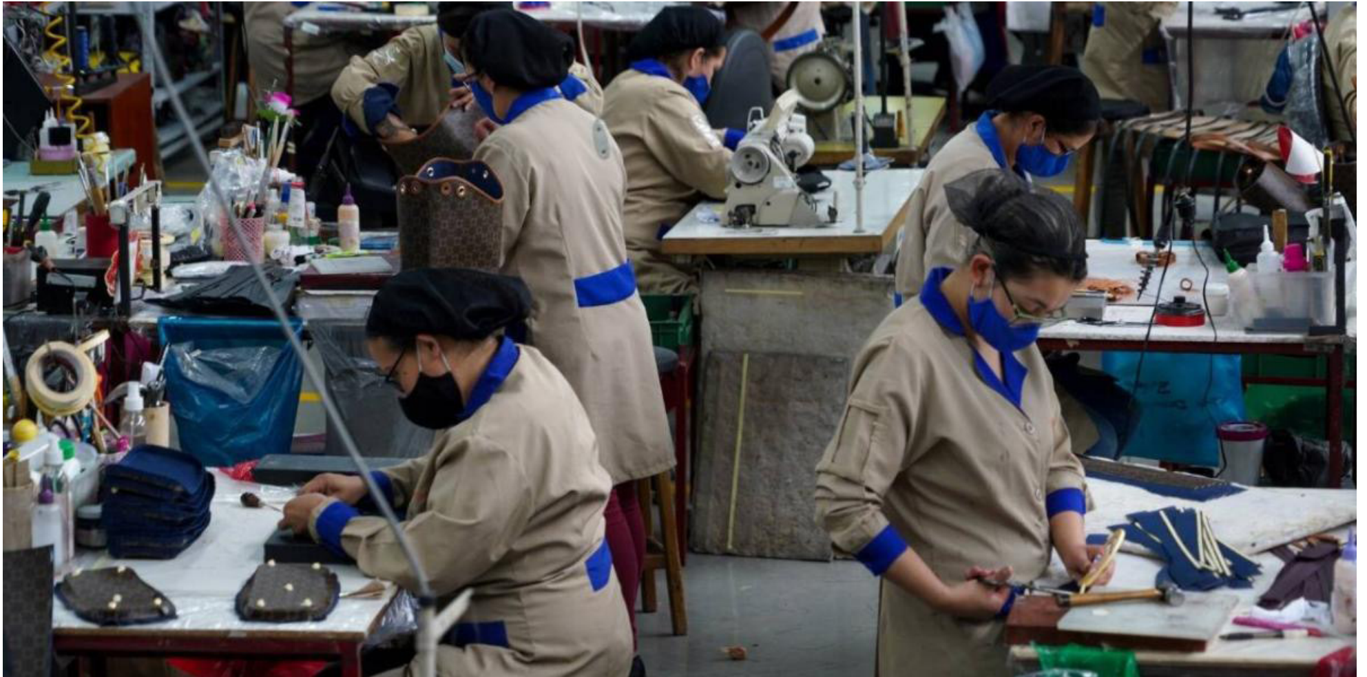
La industria manufacturera lidera la generación de empleo, mientras que sectores como la construcción y el comercio enfrentan dificultades en la creación de nuevos puestos de trabajo.

tribuido a la creación de empleo, la industria manufacturera lidera con la generación de 149.000 nuevos puestos de trabajo, seguida de cerca por actividades artísticas con 141.000 y transporte y almacenamiento con 112.000. Sin embargo, actividades como la construcción, actividades profesionales y el comercio y reparación de vehículos han experimentado una disminución significativa en el empleo, lo que se atribuye en parte a las medidas económicas del Gobierno Nacional y las altas tasas de interés que aún persisten.