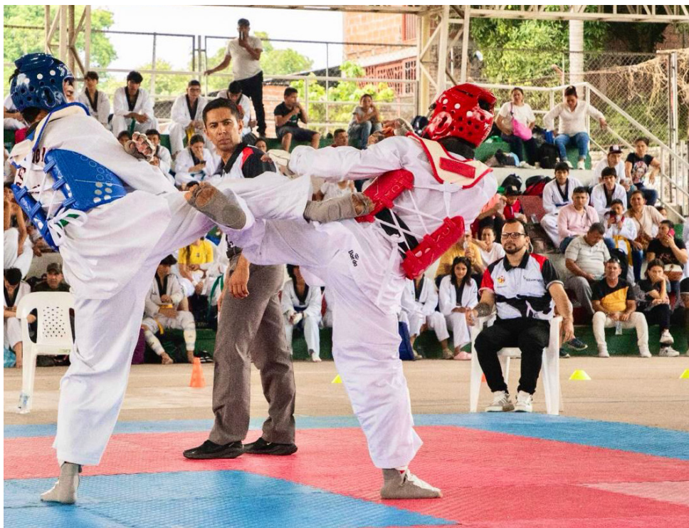
El objetivo principal de este campeonato fue establecer el ranking departamental del Taekwondo.

En conclusión, el Taekwondo en el Huila está en un momento de auge y crecimiento, gracias al compromiso y la dedicación de todos los involucrados en su promoción y desarrollo. Eventos como el campeonato departamental son fundamentales para seguir impulsando este deporte y para brindar oportunidades a los jóvenes talentos que representarán con orgullo al departamento en futuros eventos nacionales e internacionales.