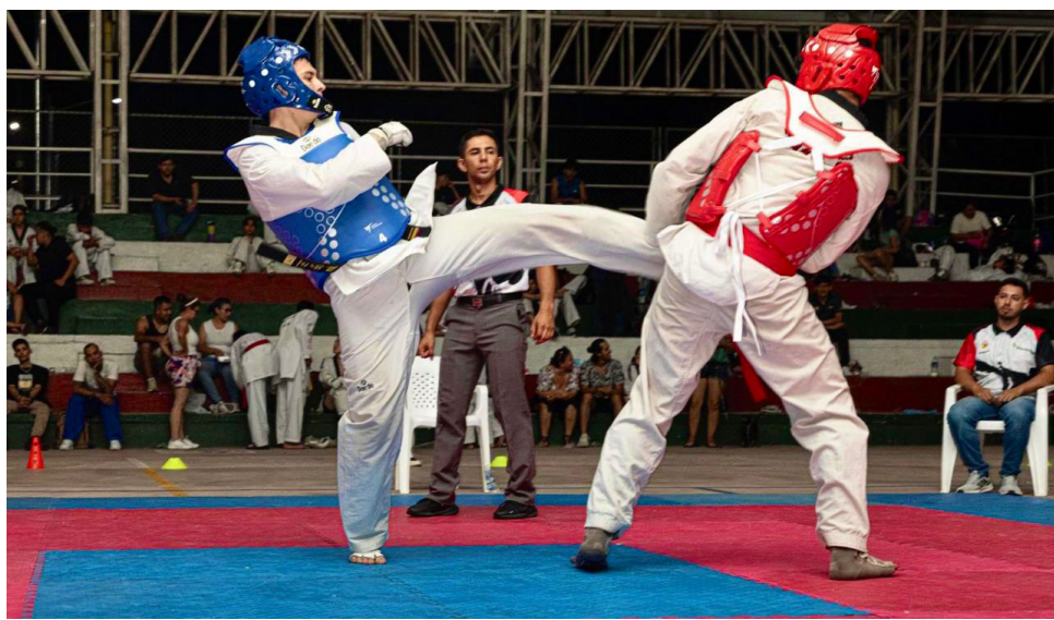
Un total de 110 deportistas participaron.