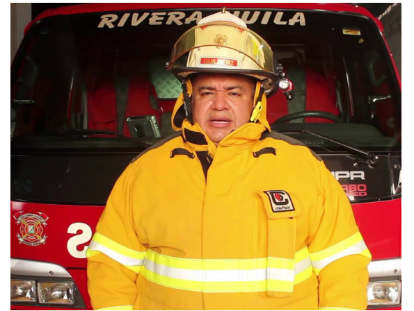
Es importante que las Alcaldías, que faltan por firmar los convenios con los Bomberos, lo hagan, para que puedan atender las emergencias.

“En este sentido, el Gobierno Departamental, va a estar muy atento en estos días de Semana Santa, para poder complementar y subsidiar el esfuerzo, que hagan cada uno de los municipios, en el tema de la prevención de situaciones y atención de emergencias que se registren”, agregó la funcionaria.