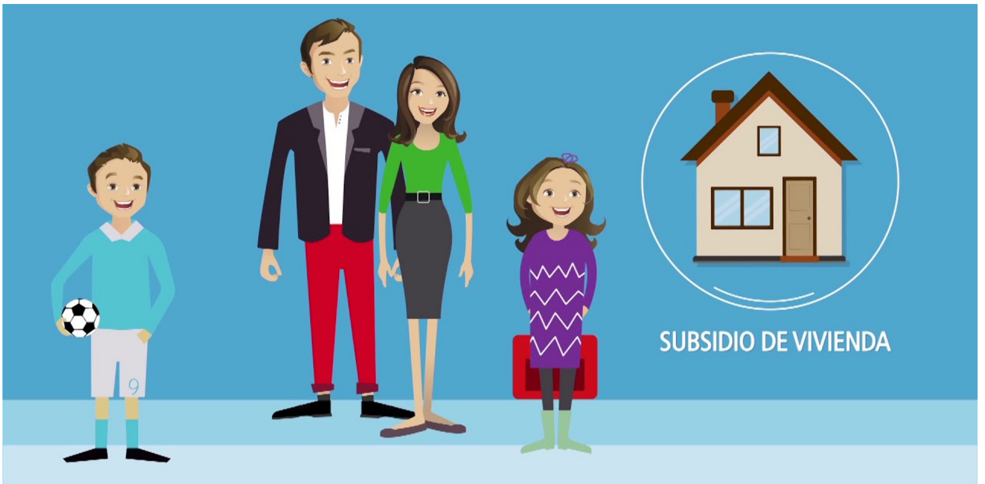
Catalina Velasco, ministra de Vivienda, dio a conocer los pasos que se deben seguir para postularse a obtener un subsidio de vivienda por medio de Mi Casa Ya.

te del crédito hipotecario o leasing habitacional.