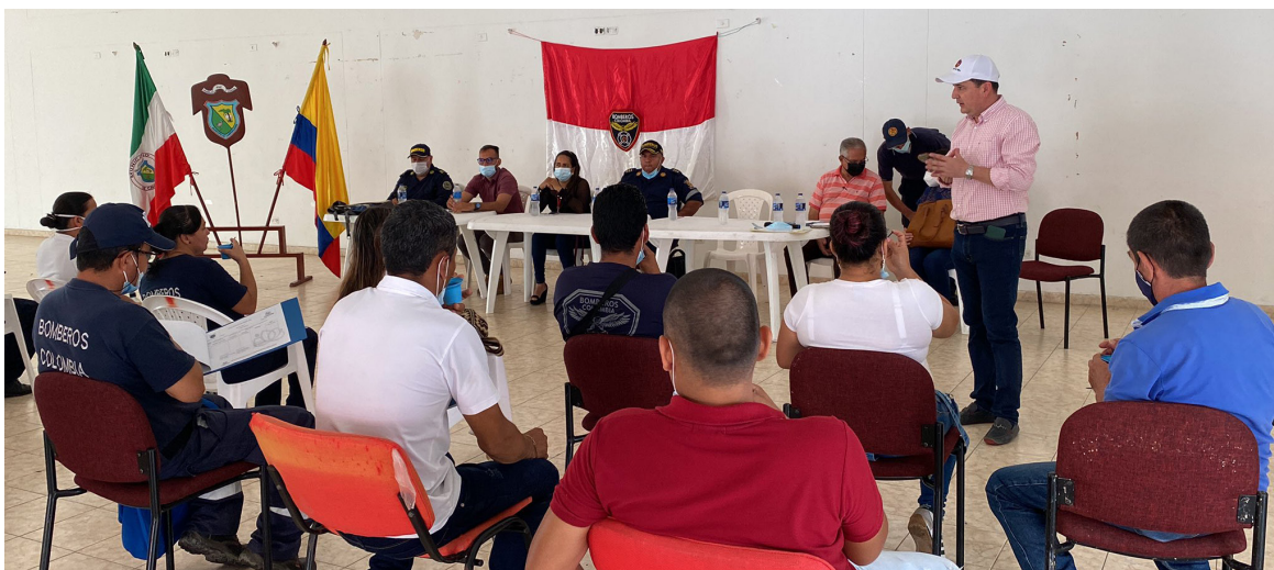
Consejos Municipales para la Gestión del Riesgo de Desastres, deben activar planes de contingencia.