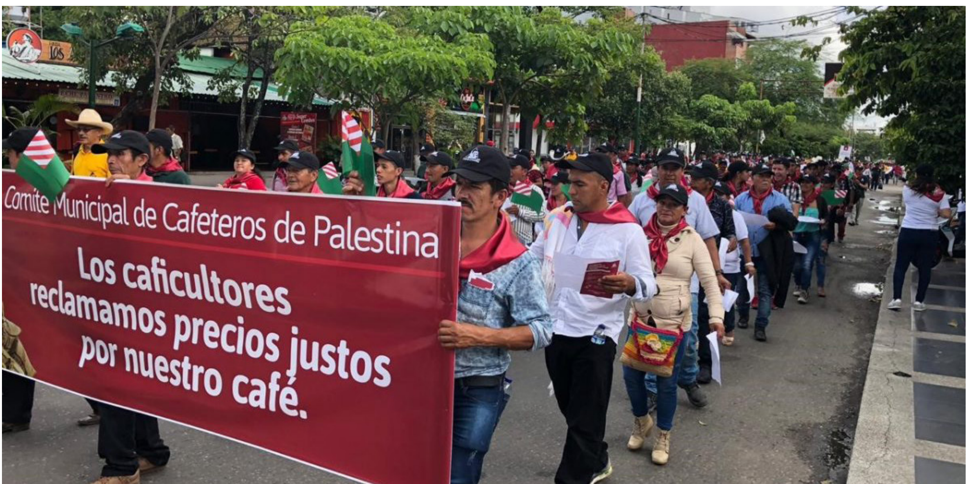
La Asamblea Nacional Cafetera, que se realizará en Bogotá el 3 y 4 de abril, busca nuevas propuestas para mejorar las condiciones sociales, agrícolas y ambientales de los caficultores del país.

La ministra Jhenifer Mojica destacó la inclusión del factor de rendimiento 94 en la metodología para la activación del Fondo, así como otras medidas de apoyo financiero y técnico destinadas a los pequeños caficultores.