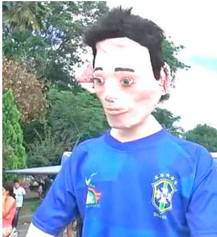
Rivera despide el año con el tradicional desfile de años viejos.

“Hay que destacar que, si bien algunos participan por el premio, muchas familias, porque son familias enteras las que participan, teniendo en cuenta que a Rivera llegan por esta época muchos turistas, el desfile adquiere connotaciones del orden nacional”.