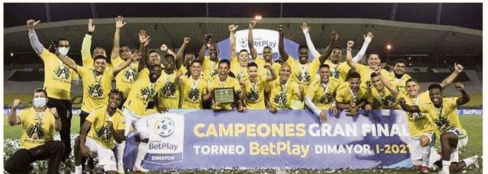
Se quiere aprovechar el entusiasmo del retorno de Atlético Huila a primera.