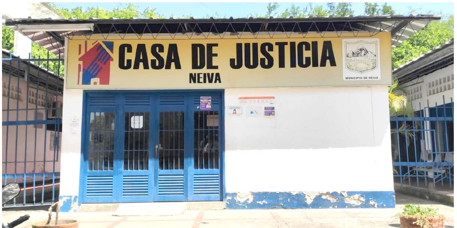
Casa de Justicia prevé un nuevo aumento debido a la época decembrina

Es un programa que está enmarcado en un convenio interadministrativo con el gobierno nacional específicamente con el Ministerio de Justicia, y adoptado por el municipio de Neiva desde hace varios años, con el ánimo