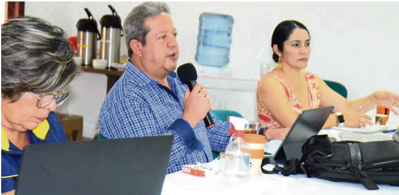
Se analizó lo que dejó el paso del fenómeno de La Niña en el Huila.

cos y especies nativas como tal, pero también generando un periodo de sequía que nos puede traer problemáticas en el sector de agua potable afectando las bocatomas urbanas y rurales sobre todo en el tema de desabastecimiento de agua. Algunos municipios tienen riesgo porque se disminuyen los caudales”, explicó.