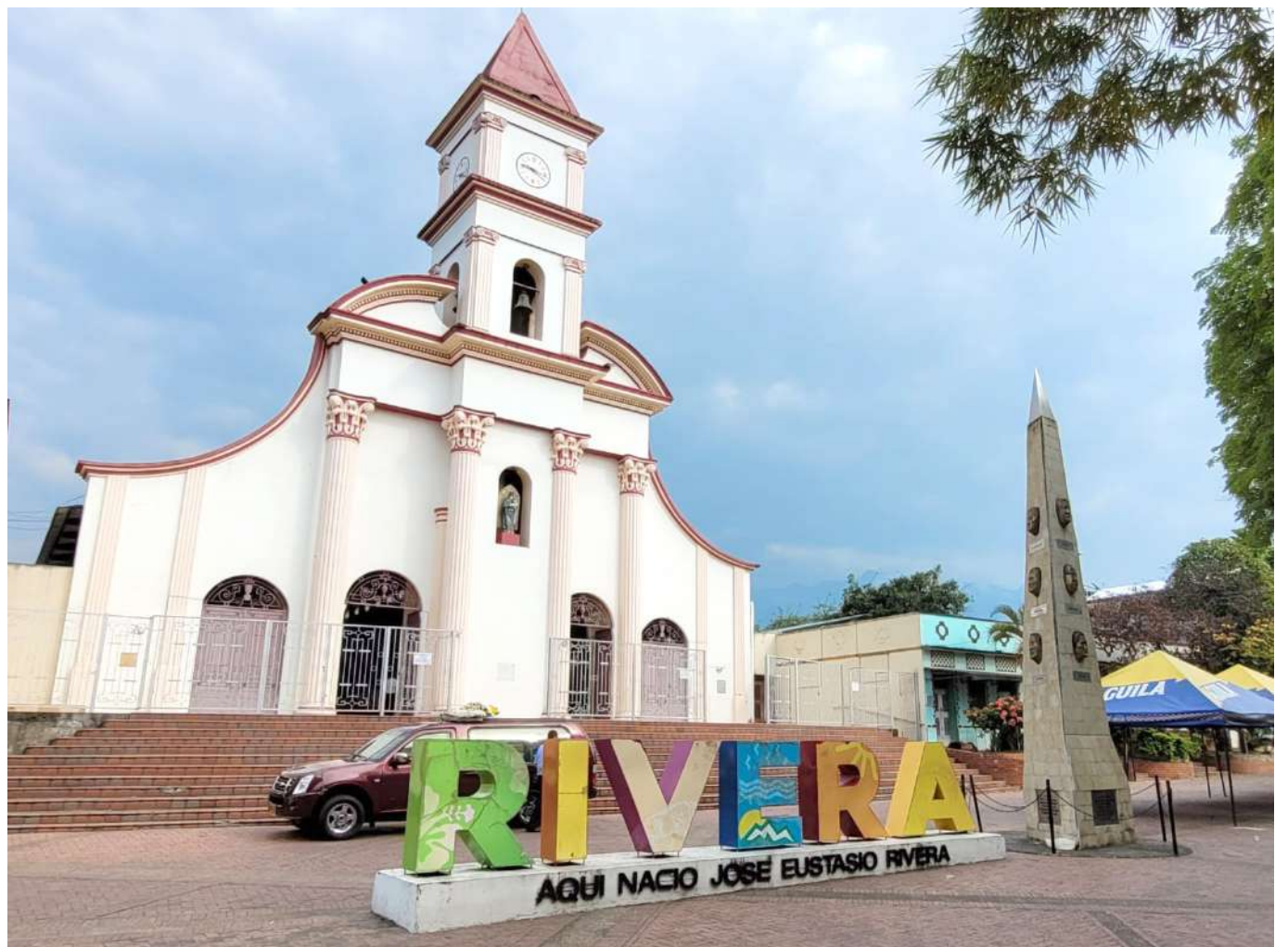
Estuvo huyendo de la justicia escondido en Rivera- Huila.

Parte de la familia de 'Pescadito', reside en el Huila, entre tanto este hombre de tez morena, delgado y mirada poco expresiva, con menos de 30 años, suma los casi 40 crímenes cometidos.