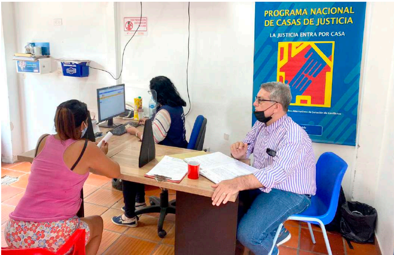
Actualmente atienden en promedio 120 personas

cómo articular ese tipo de iniciativas. Para los no quiera participar, sin lugar a duda, toca solicitarles a los entes competentes que sean contundentes.