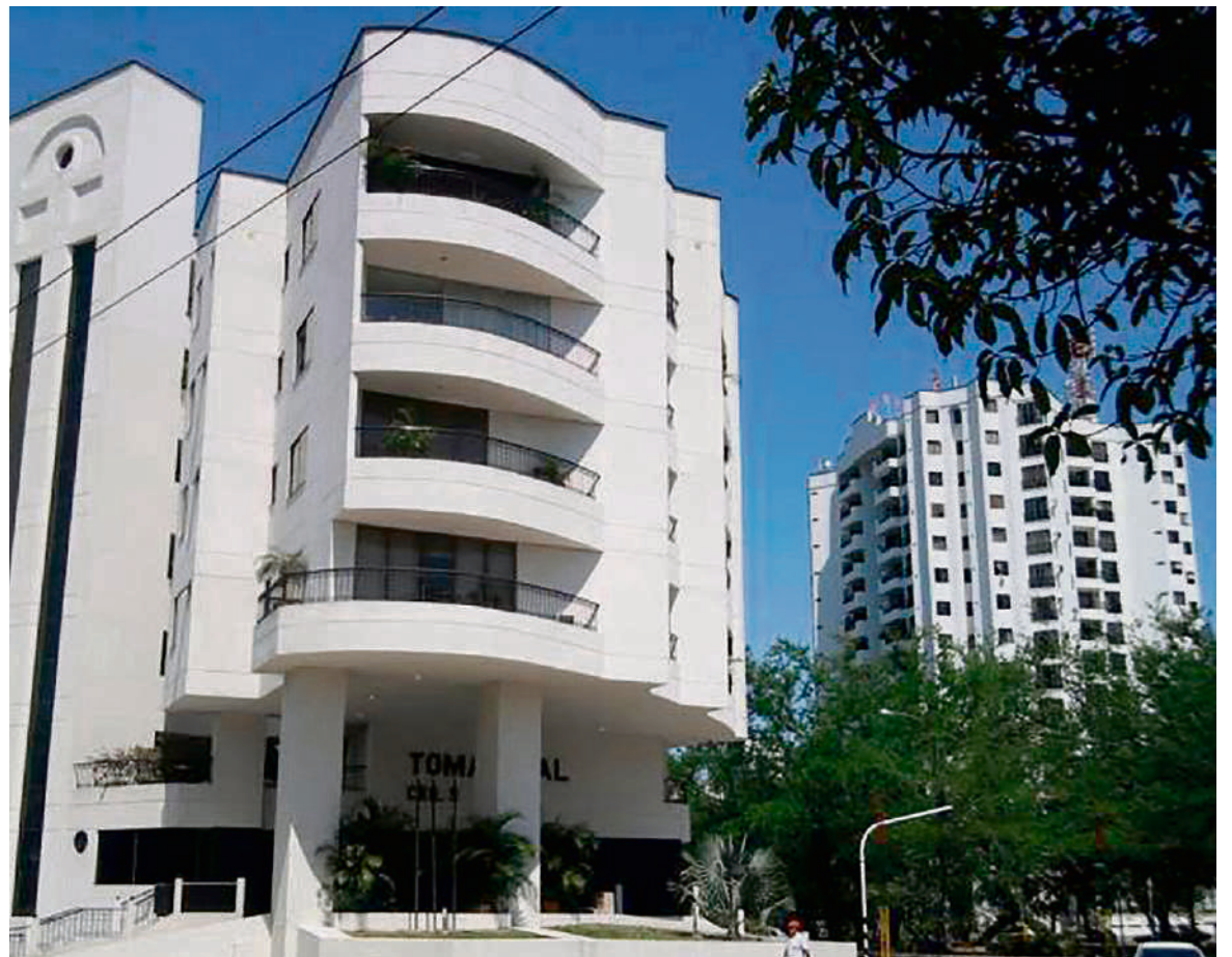
Los hechos ocurrieron el 26 de junio de 2019 en el edificio Toma Real.

Además se indicaría “la actitud de este último (victimario) frente a la niña luego de los hechos, entre otros aspectos trascendentes para esclarecer los hechos objetos de acusación”, señala la providencia. Además, indican los solicitantes que el vigilante “pre-