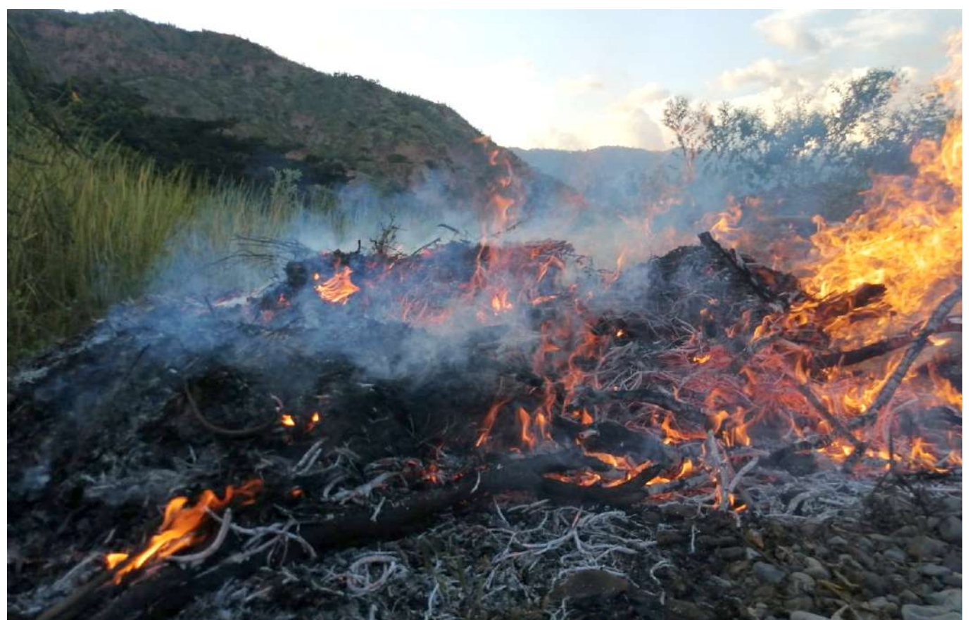
Durante esta época de transición se advierte que normalmente esto conlleva a algunos riesgos

Según el último pronóstico del Instituto de Hidrología, Meteorología y Estudios Ambientales (Ideam), este mes de diciembre inició la transición hacia la temporada seca, sin embargo, el fenómeno de La Niña seguirá azotando al país hasta el mes de febrero de manera paulatina.