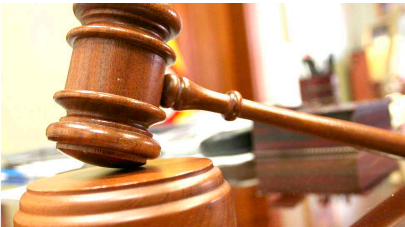
Quedó en firme la condena de 48 meses de prisión.