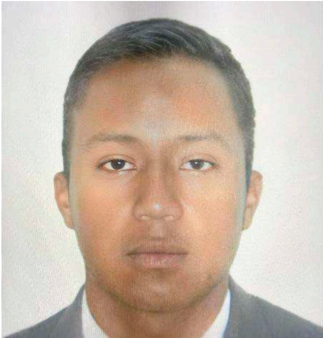
Alias 'Pescadito' mató a la primera persona a la edad de 11 años.

El apodo de 'Pescadito' lo llevó desde muy niño por vender pescado en la carretilla con su padre y años más tarde por ser resbaloso ante las autoridades.