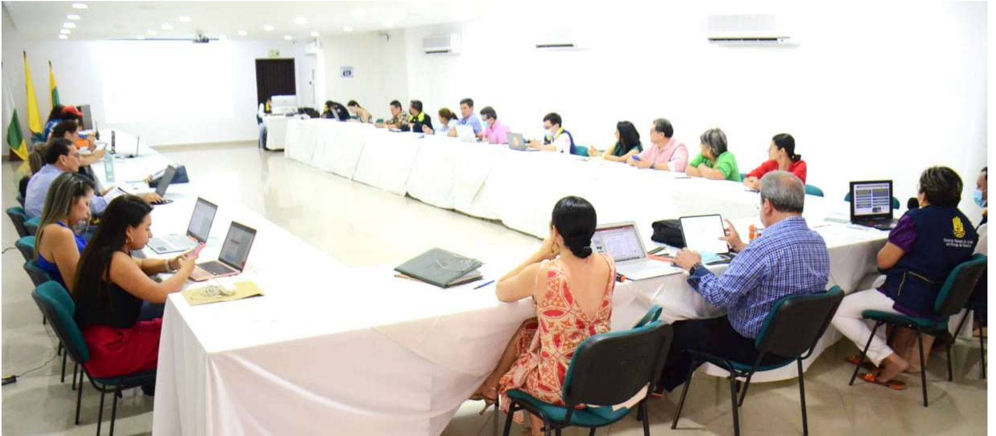
El departamento se prepara para la temporada seca