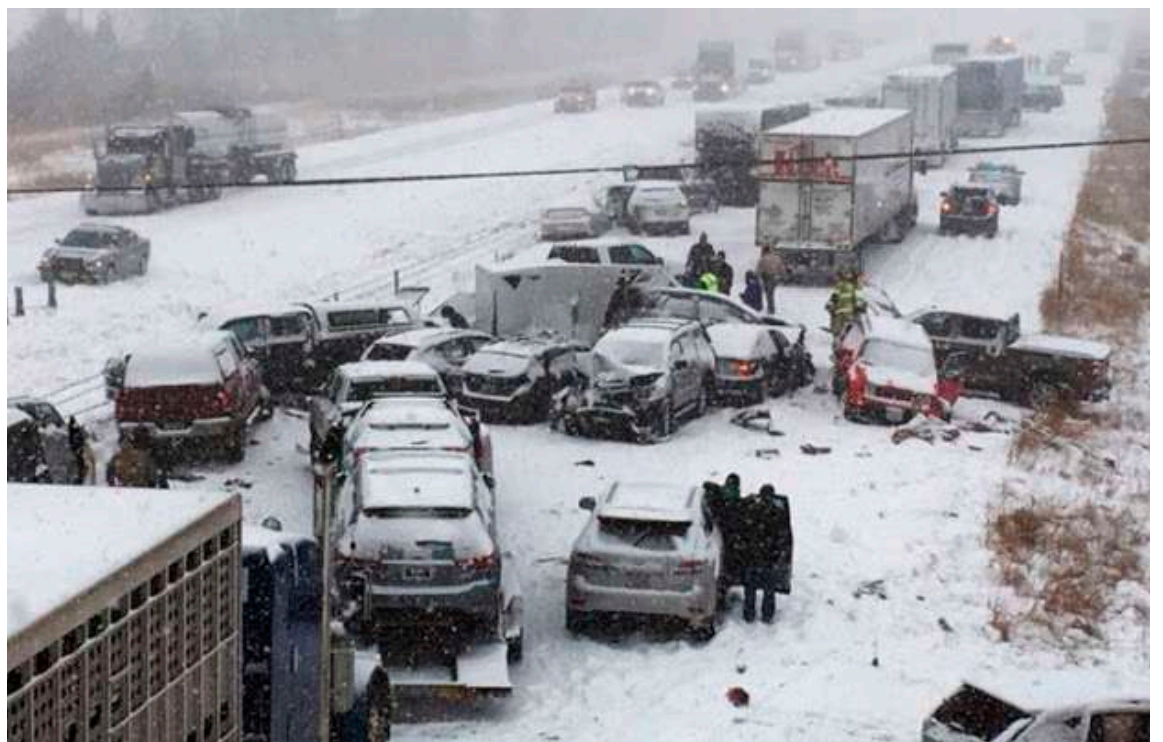
Más de 200 vehículos se vieron envueltos este miércoles en una colisión múltiple en la provincia china de Henan (centro), causada por una densa niebla que limitaba la visibilidad, informaron las autoridades de tráfico provinciales.