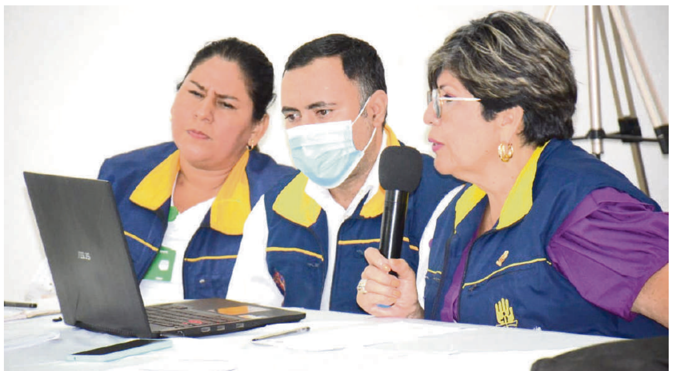
Las inversiones en cada sector han sido acertadas, aseguró el Consejo Departamental para la Gestión del Riesgo de Desastres.

Acevedo, Elías, Guadalupe, La Argentina, Oporapa, Palestina, El Pital, Pitalito, Saladoblanco y San Agustín