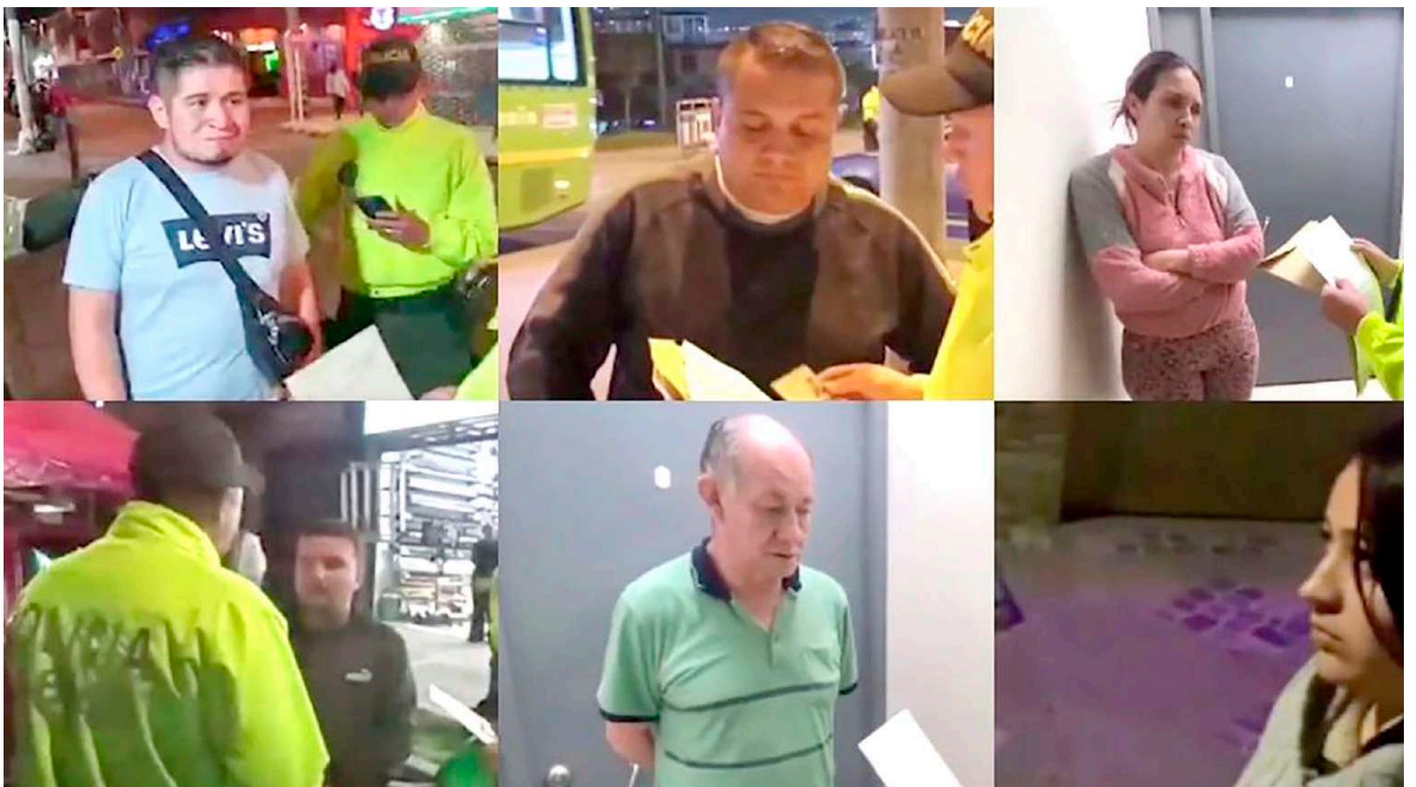
Algunos de los integrantes de 'Los Camilos', detenidos en la primera fase de la operación.

Empezó a robar desde los cinco años elementos menores como bolsos, billeteras y todo lo que quedaba a la vista desde la parte externa de los vehículos estacionados en las calles de la fría Bogotá, años después pasó de emplear armas blancas para utilizar armas de fuego, conoció un grupo de jóvenes en su misma condición quienes lo invitaron a robar apartamentos en el norte de Bogotá.