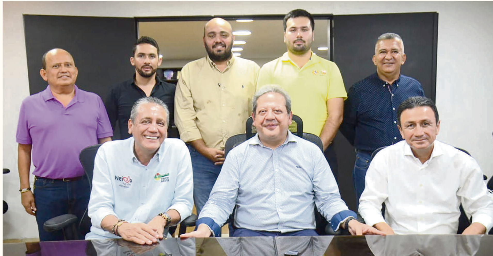
Retoman proyecto de escenario multipropósito para Neiva.