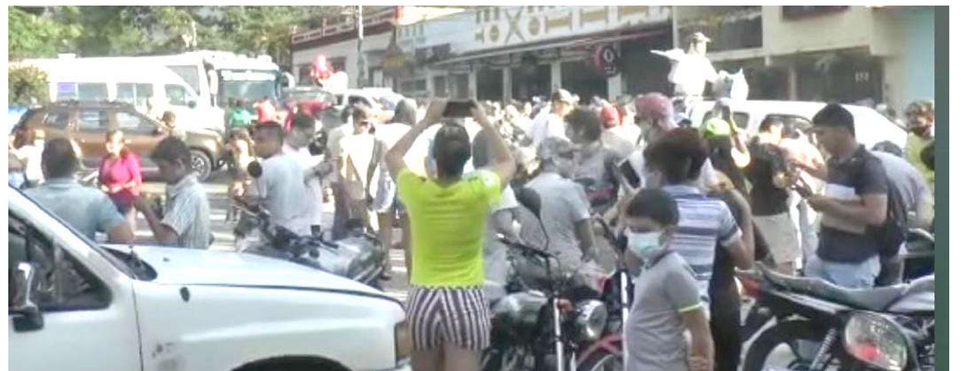
El desfile se convierte en todo un carnaval.