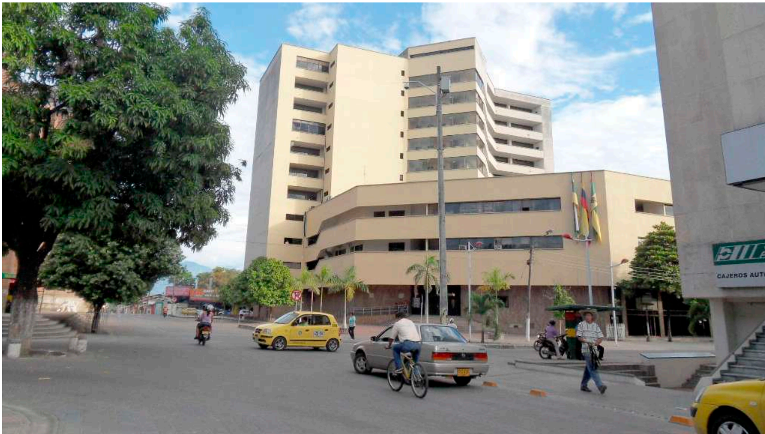
El Tribunal Superior Del Distrito Judicial De Neiva tomó la decisión de no beneficiar a la exalcaldesa.

la cual aun así no deja de coexistir el remembrado principio.