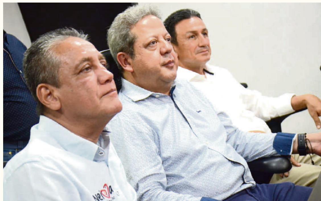
El escenario se construirá en una alianza público-privada

La inquietud que ronda a muchos es el tema de los tiempos y la coincidencia de la ejecución del proyecto con un año electoral y el término de las actuales administraciones. Ojalá esta sea la vendida porque ya van a ser nueve años desde que el malogrado proyecto de remodelación del Plazas Alcíd se puso en marcha.