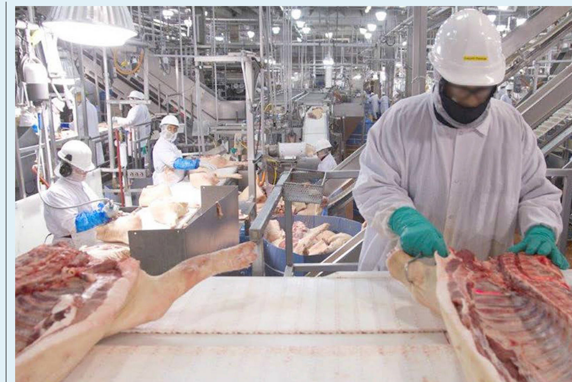
El fenómeno de El Niño ya deja 9.000 animales muertos y millonarias pérdidas en el sector ganadero, lo que podría afectar el precio de la carne en las próximas semanas

Además, remarcó que las ventas internacionales de carne, leche y otros productos del campo colombiano hacen parte de los planes de este y otros gobiernos que han planteado una menor dependencia de las rentas de la industria del petróleo dentro de la canasta exportadora.