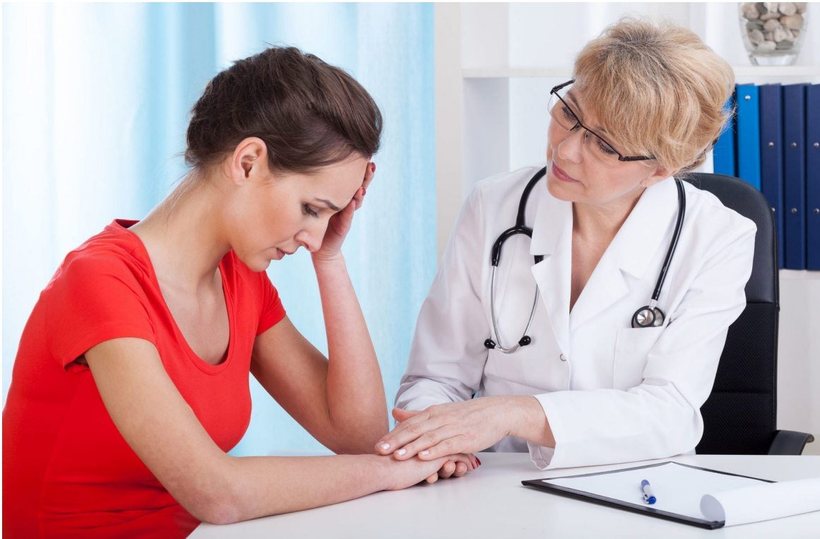
Foto 3: Es así como el aislamiento que produce la soledad representa un grave problema para la salud mental.

■ La soledad puede causar más daños al cuerpo que el mismo tabaco.