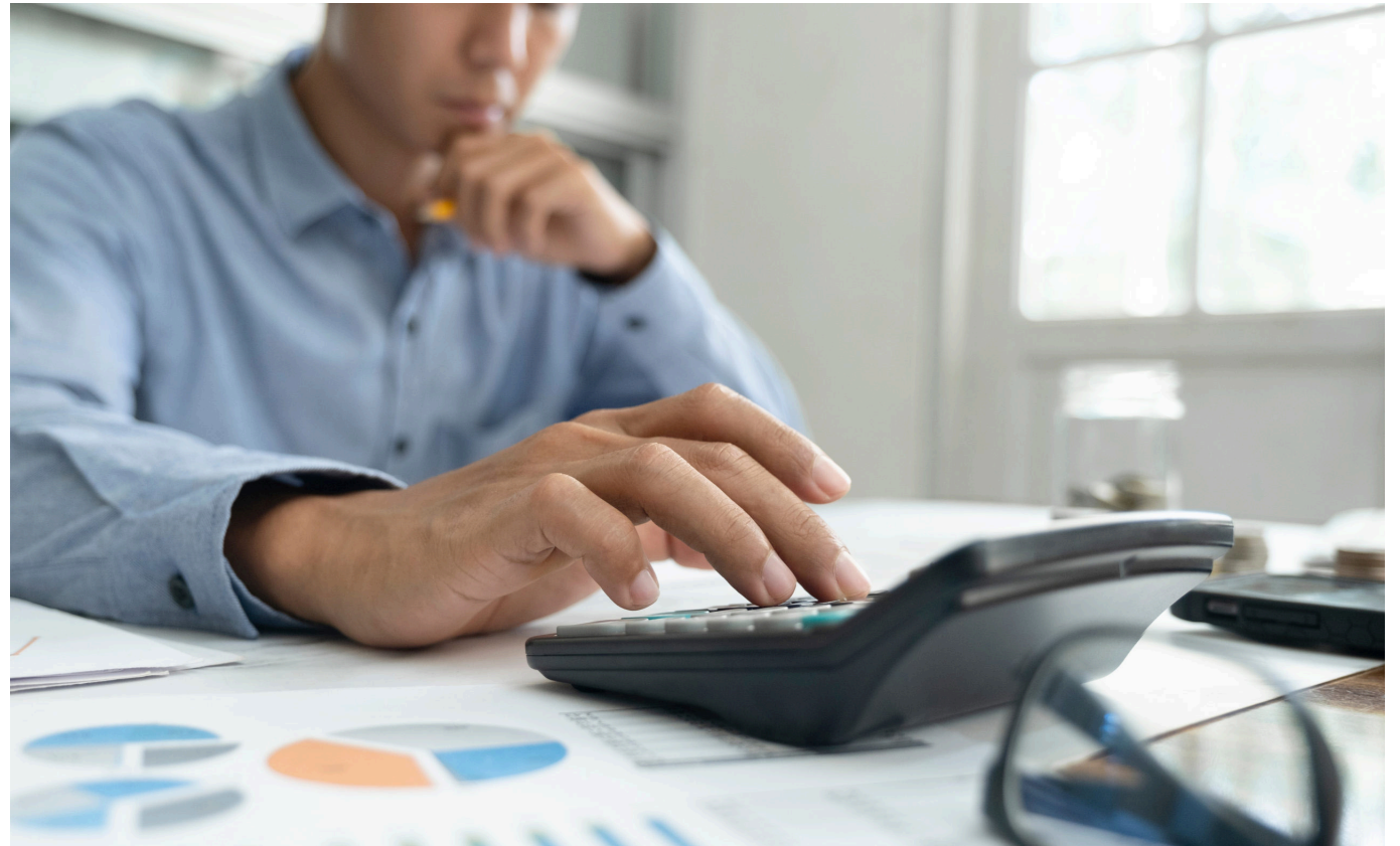
Sabía usted, que a partir del año gravable 2023 se debe calcular también una tasa mínima de tributarios para las sociedades.

“Sabía usted, que a partir del año gravable 2023 se debe calcular un límite a los beneficios y estímulos tributarios para las sociedades”.