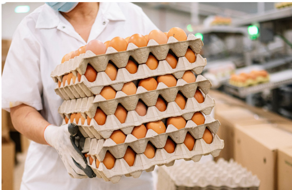
El precio del huevo se puede ver afectado por las protestas en vías del país.

“El sector avícola mueve un millón de toneladas al mes, que son 100.000 camiones mensuales por todas las carreteras del país. Cualquier cierre de vías en los más de 605 municipios donde se tienen granjas y, en fin, en todo el territorio nacional, tiene una afectación en los costos del transporte que al final afecta a todos los consumidores”, precisó el líder gremial.