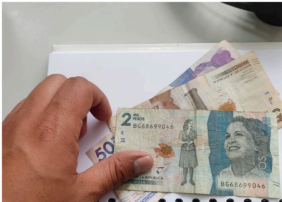
La conciliación fiscal comprende dos elementos: a) el control de detalle y b) el reporte de conciliación fiscal.

Destacado 2: "Aquí hablamos de cuáles son esos beneficios y estímulos tributarios que a partir del año gravable 2023 con la declaración del impuesto a la renta se deben limitar".