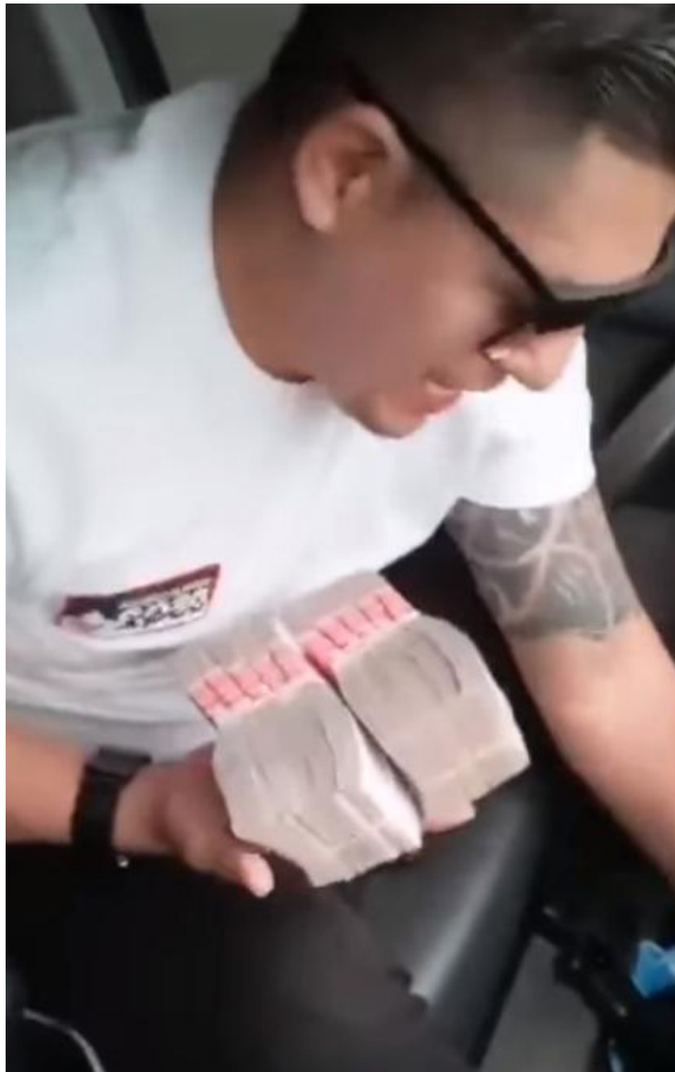
Ante estas acusaciones, el cabildante se ha defendido, afirmando que el video en cuestión es antiguo y que las acciones mostradas no son ilegales.