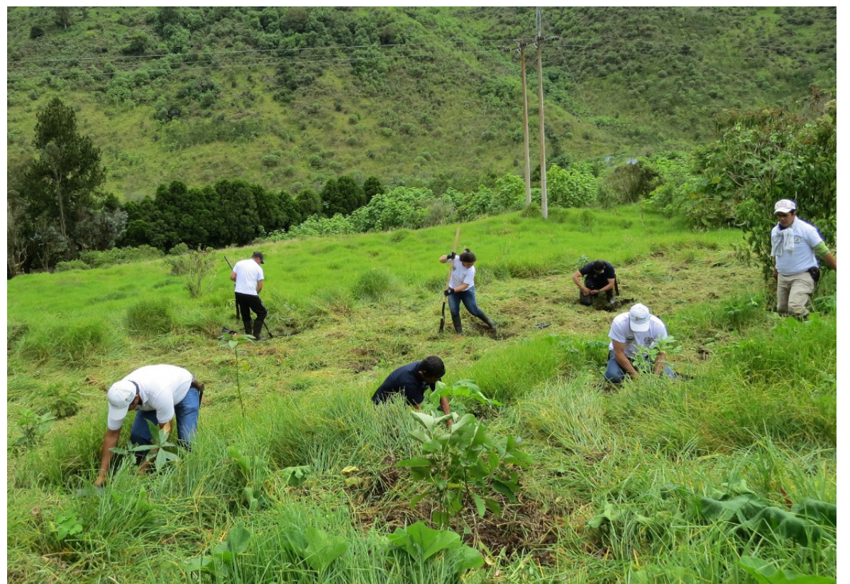
Uno de los planes del mandatario, es la compra de predios ubicados en el cerro para reforestarlo.

Y es que entre enero y septiembre de 2023 la deforestación en la Amazonía colombiana, se redujo en un 70% con respecto al mismo periodo de 2022, al pasar de 59.345 hectáreas deforestadas a 17.909 hectáreas, informó la ministra de Ambiente y Desarrollo Sostenible, Susana Muhamad, con cifras del Instituto de Hidrología.