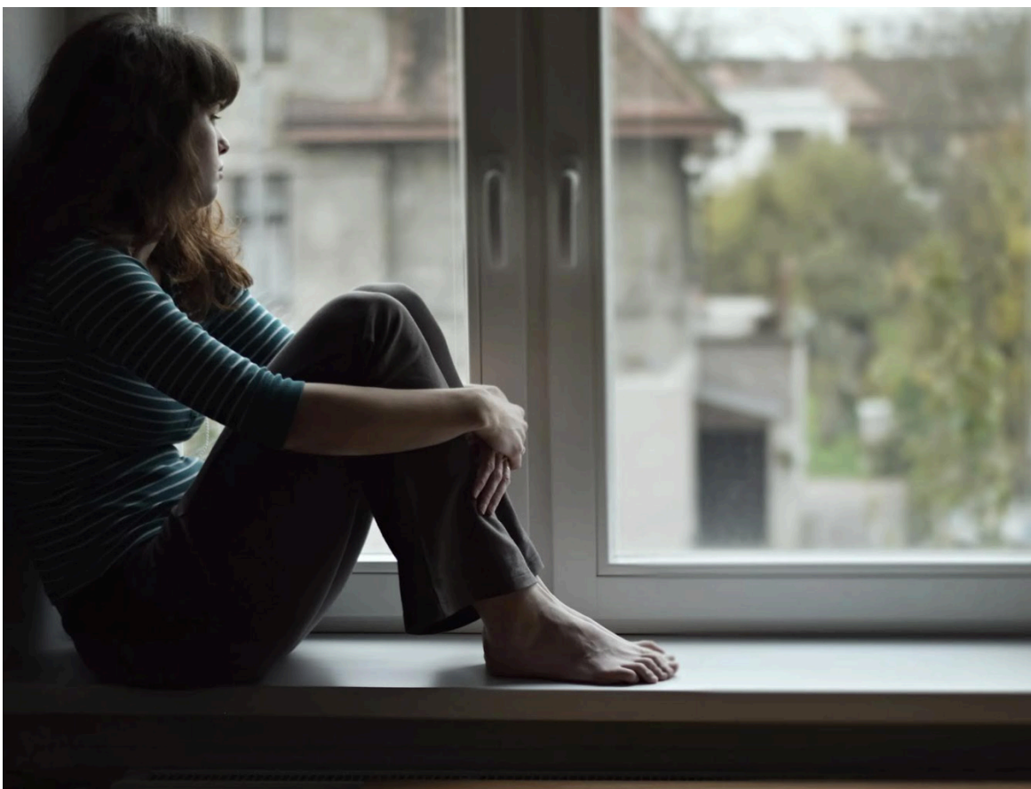
La soledad puede ser más letal que fumar.

“Ahora sabemos que la soledad es un sentimiento común que experimenta mucha gente. Es como la sed o el hambre. Es una sensa-