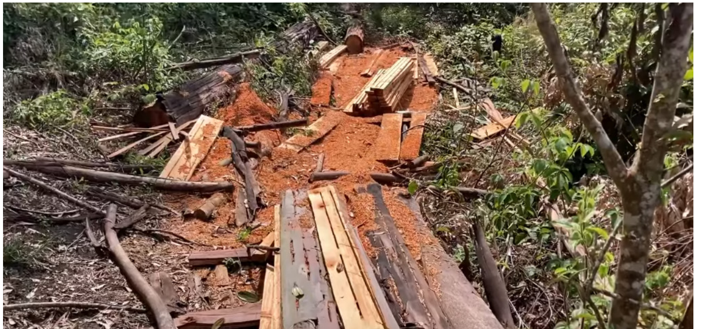
Deforestación en esta zona por el lado del municipio de Nátaga.