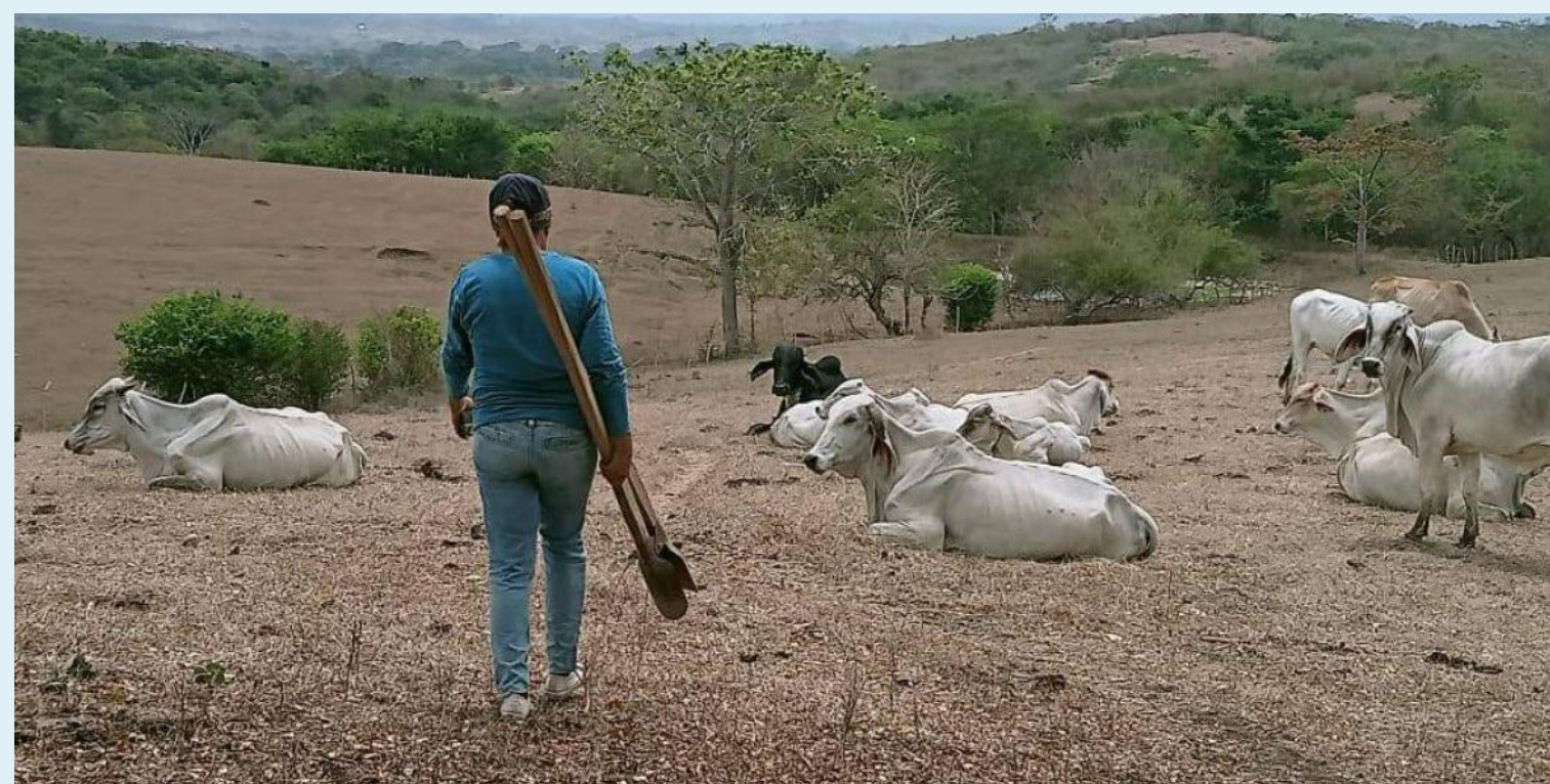
Un total de 308.481 reses tuvieron que ser desplazadas desde sus establos originales para evitar que murieran.

primer lugar, que la inflación mundial cedió y bajó el precio internacional. Además, que mientras el peso se apreció en beneficio de los importadores, el real brasileño, la moneda del gran vendedor en la región se devaluó y su carne alcanzó mayor competitividad-precio.