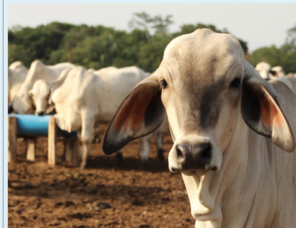
La emergencia climática no solo provocó estragos en la vida animal, sino que también generó una crisis alimentaria.

ciones a Venezuela cayó el precio del ganado, pero no se redujo un peso el precio al consumidor, margen que no se sabe en manos de quién queda.