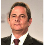
Germán Vargas Lleras

El país arde en llamas. Más de 700 incendios. 952 municipios en peligro, de los cuales 600 en alerta roja. Nadie, pero mucho menos el Gobierno Nacional, puede declararse sorprendido ante la catastrófica situación. Pero, como siempre, el presidente Petro en su permanente búsqueda de responsables ahora acusa a los alcaldes y gobernadores por falta de previsión.