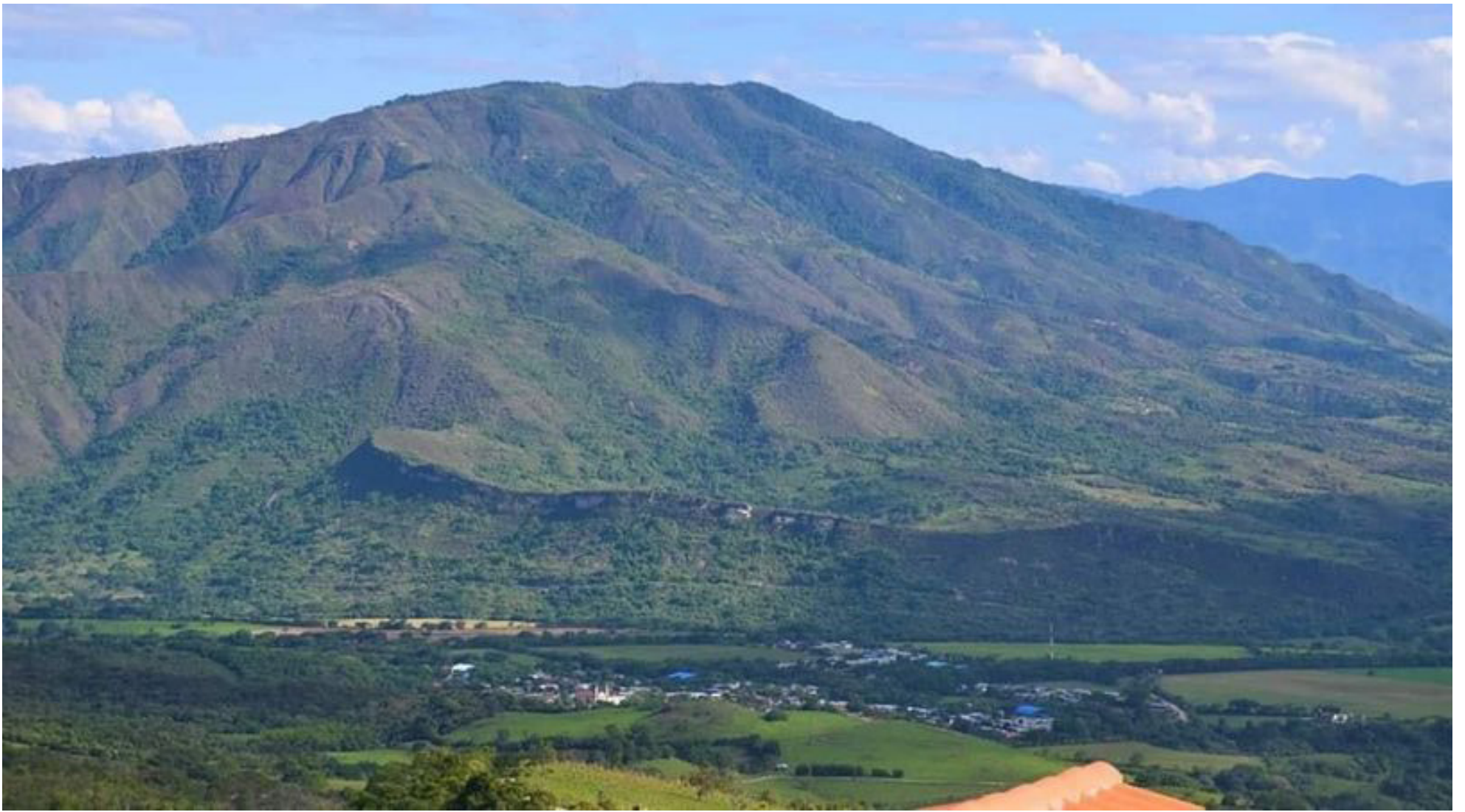
El Cerro Las Nieves, ha sido perjudicado por la tala de árboles.