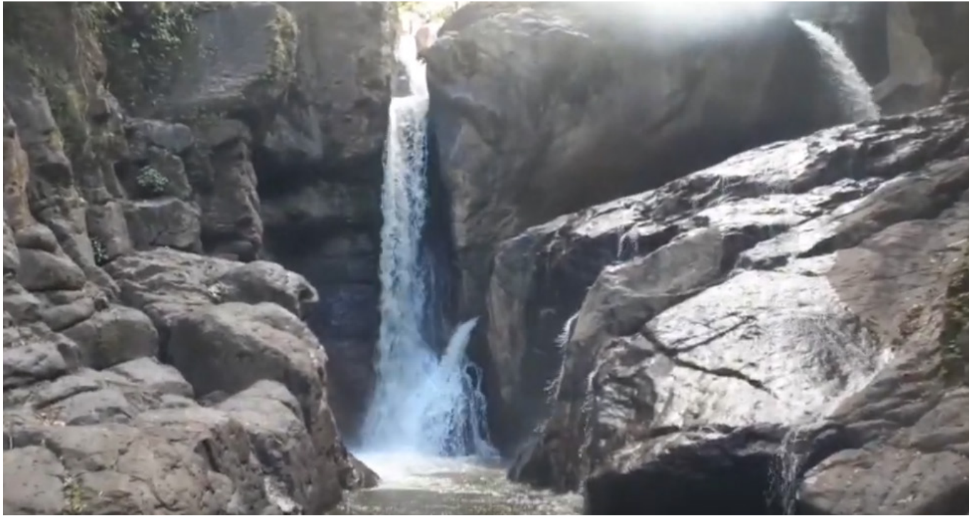
De la quebrada La Venta, se benefician las comunidades de Paicol y Tesalia.