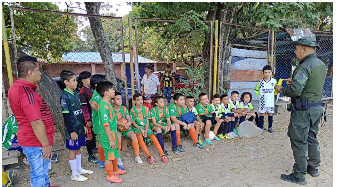
La Policía Metropolitana de Neiva, en cabeza del Grupo Antinarcóticos de la Región # 2, da inicio al programa contra las drogas, llega hasta las canchas de fútbol del coliseo cubierto La Libertad, enfocados en la prevención al consumo de estupefacientes.