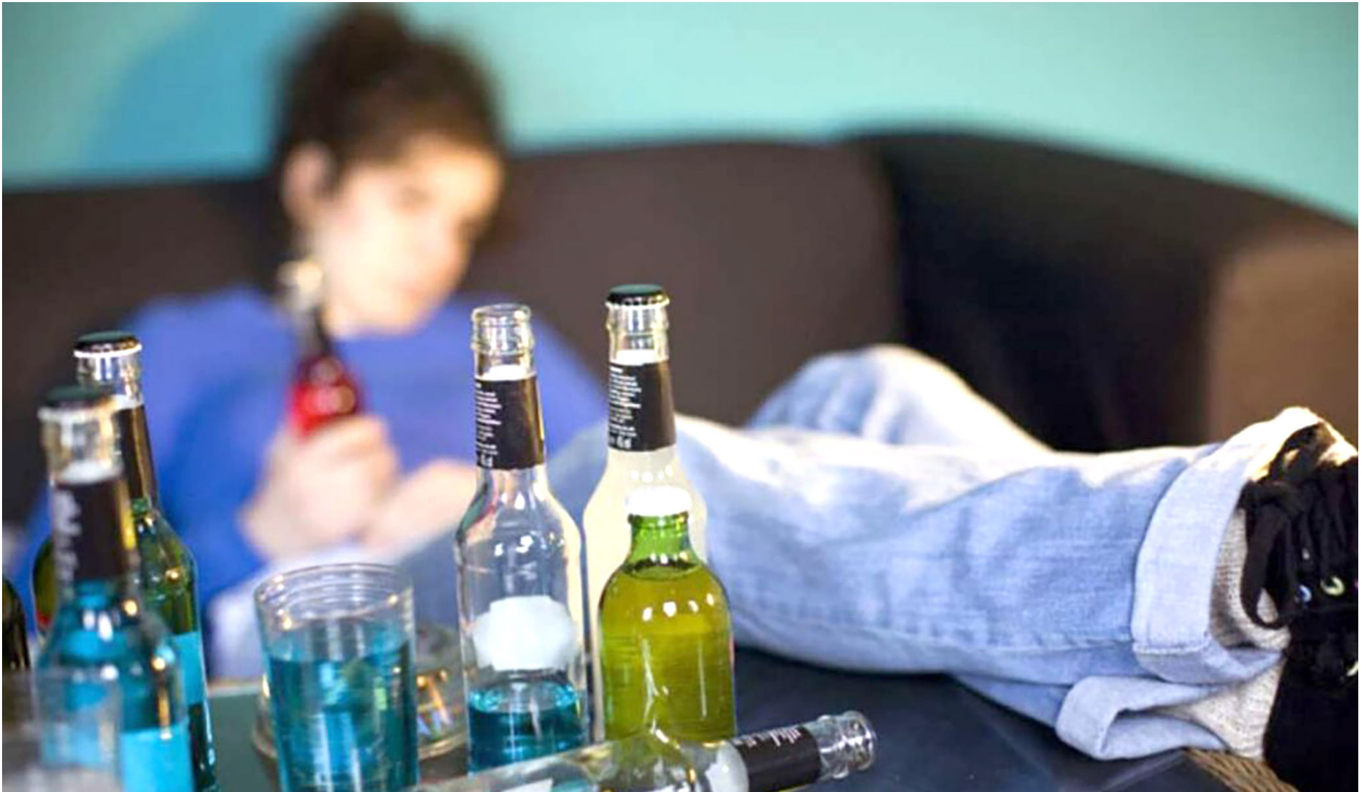
Los jóvenes iniciarían a consumir licor desde los 12 años.