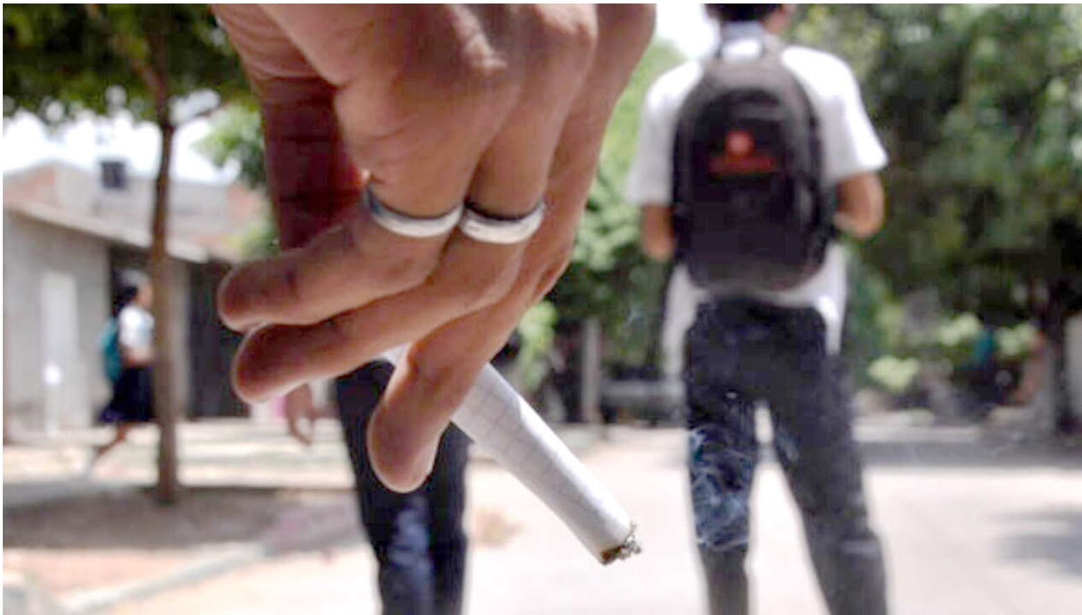
Las autoridades buscan atacar el expendio de estupefacientes en escuelas y colegios de Neiva.

Otro de los aspectos importantes, es el fortalecimiento de los vínculos familiares con el fin de luchar el consumo de 'droga' en adolescentes