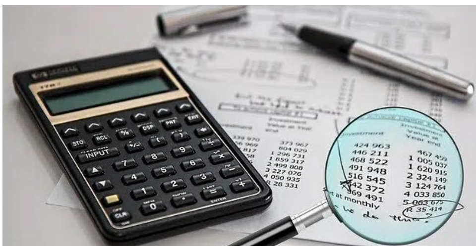
Los beneficios y estímulos tributarios declarados no pueden exceder del 3% anual de su renta líquida ordinaria antes de restar las deducciones especiales.