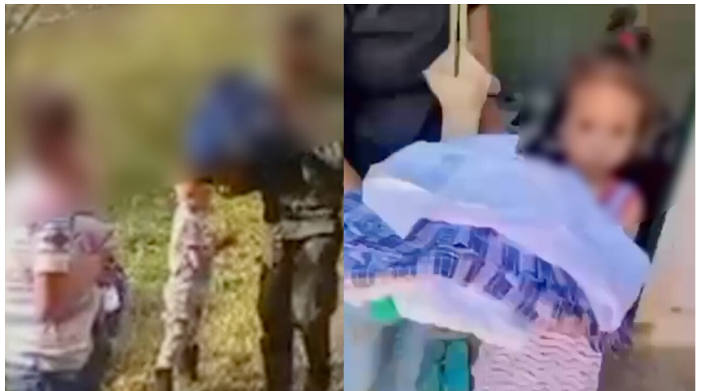
En este video publicado en X (anteriormente Twitter), miembros de las disidencias de las FARC, vestidos con uniformes de camuflado, entregan kits escolares a niños en la vereda El Dorado, generando preocupación en la comunidad.

La entrega de útiles escolares en Huila por parte de las disidencias de las FARC genera controversia en las redes sociales. Algunos opinan que podría tener trasfondos políticos o ideológicos, mientras otros creen que es un gesto humanitario.