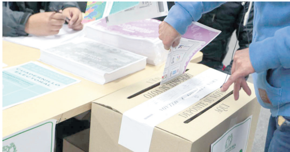
Registraduría se alista para lo que será la próxima jornada electoral.

Finalmente, lo que espera el registrador es que mancomunadamente se empiece a concretar el desarrollo electoral, finiquitándose en primer lugar en el territorio urbano, posterior en las zonas rurales y corregimientos.