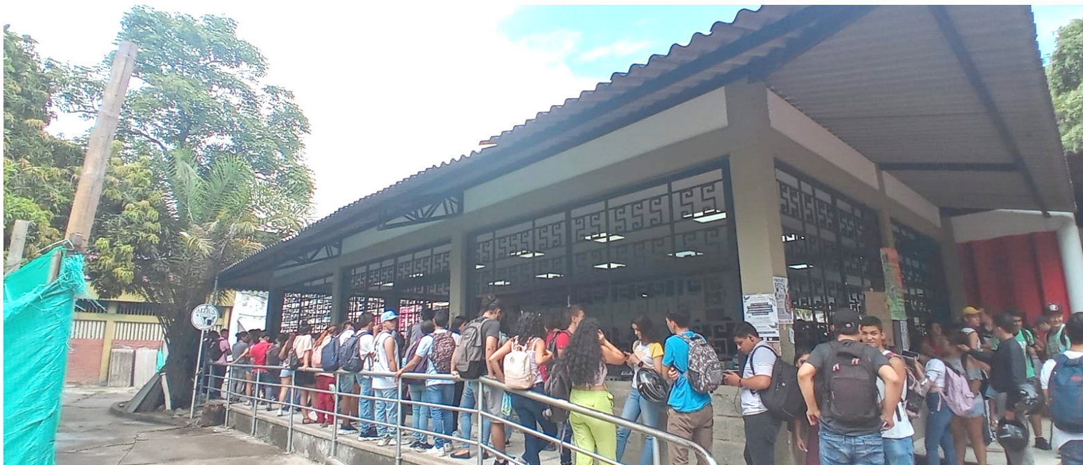
A veces toca hacer largas colas.

Finalmente indicó que siempre están dispuestos para el diálogo en aras del bienestar de toda la comunidad estudiantil de la universidad.