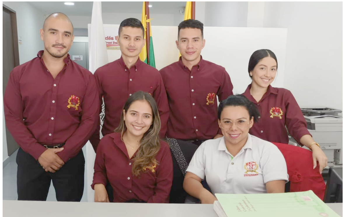
Estudiantes de la Uninavarra en el consultorio Jurídico.

“La atención la prestamos en el consultorio jurídico Martin Luther King y el centro de conciliación, aquí podemos atender a cualquier persona que tenga cualquier controversia, situación adversa, tiene que acudir para ser