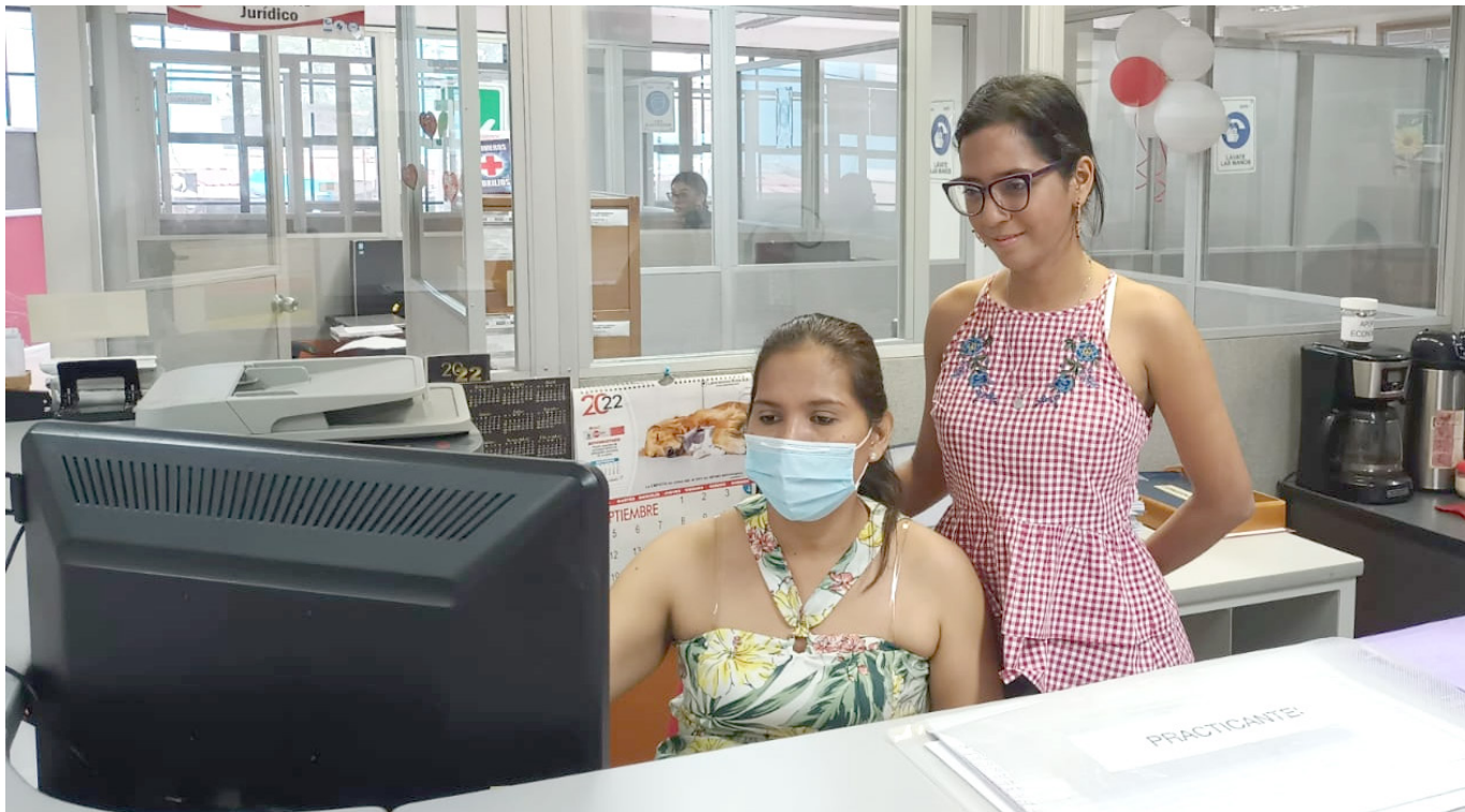
Consultorio Jurídico de la Universidad Surcolombiana

las prácticas que lo regulaban las universidades, ahora nos rige la ley 2113 de 2021”, afirmó