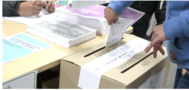
Reto electoral del nuevo registrador delegado ■ REGIONAL 8