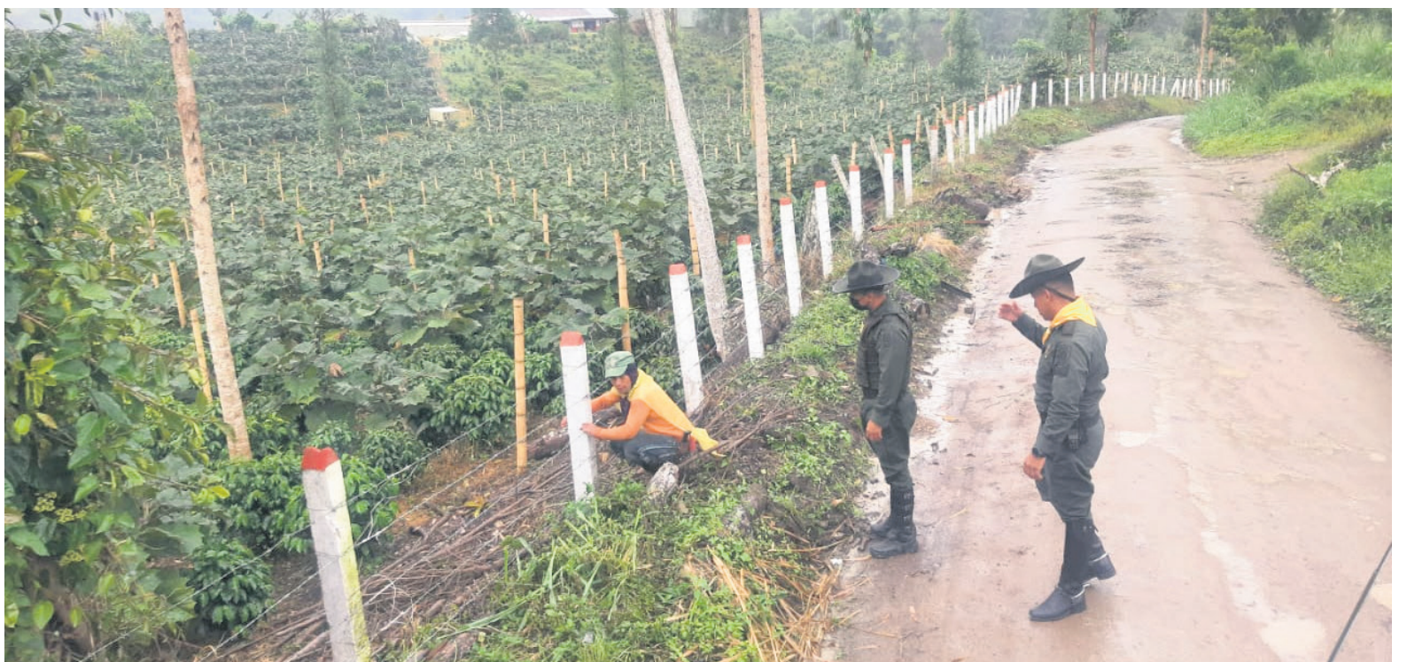
A varios municipios del Huila lliga plan ‘cosecha segura’.

Brindar la información enlazada con la comercialización de productos de cosecha, prevenir el acceso a los terrenos con personas desconocidas, validar con anterioridad antecedentes de las personas que van a ingresar al predio, solicitar el acompañamiento de las autoridades policiales cuando se vaya a realizar consignaciones de dinero numerosos, eludir lugares extraños para efectuar negocios y tener precaución con personas que soliciten información o quieran ofrecer negocios tentativos.