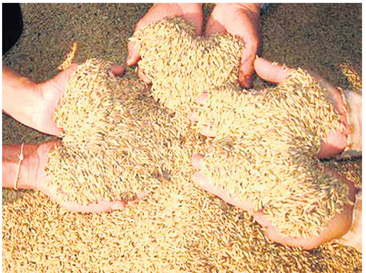
El trasplante de arroz les sirve para tecnificar más el cultivo del grano.