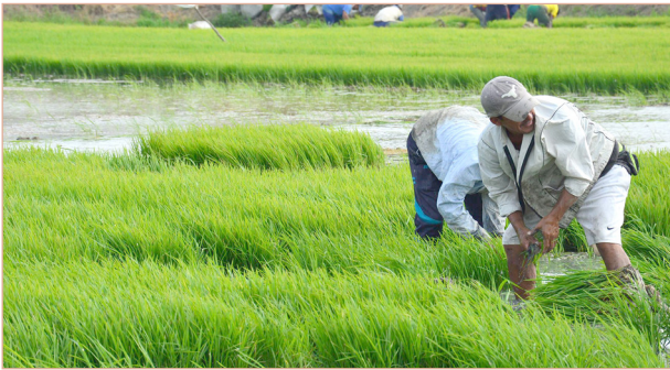
Nuevos proyectos para arroceros ■ ENFOQUE 6-7