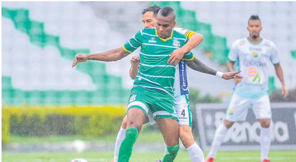
Quindío y Huila igualaron a un gol en el Centenario de Armenia.