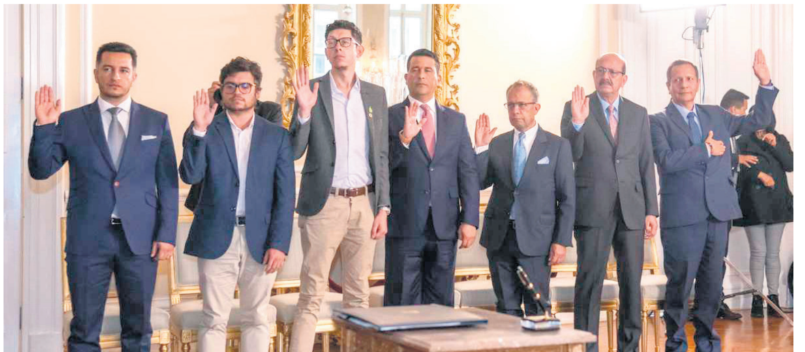
Nuevos miembros del alto gobierno.