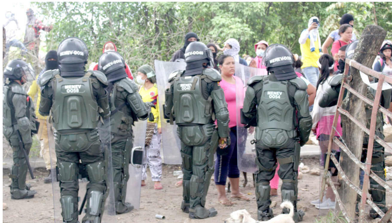
Finalmente, el clamor, llanto y desesperación en medio de la lluvia, fue una constante.