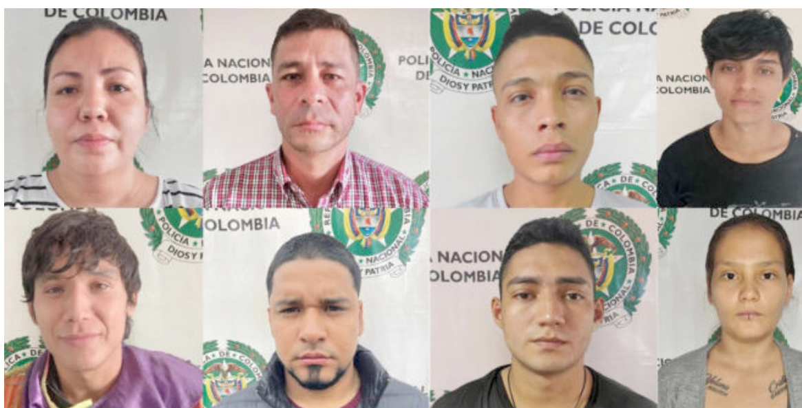
Los 8 integrantes de la 1 línea fueron dejados en prisión domiciliaria.