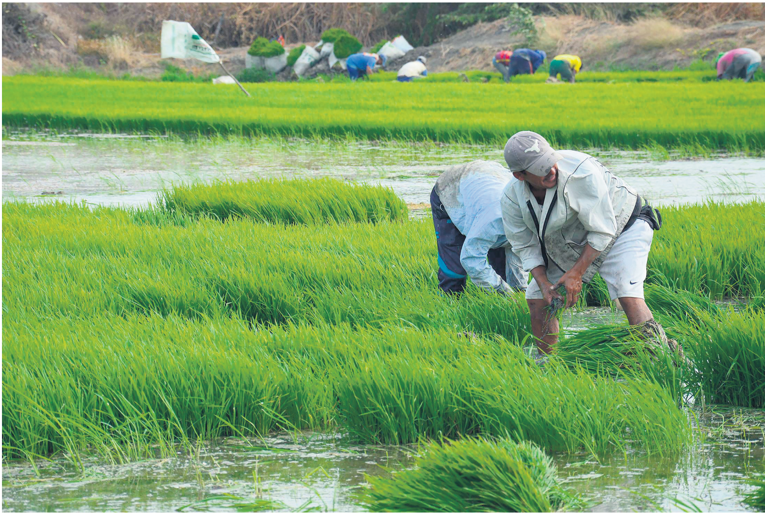
En los cultivos de arroz tradicional se desperdicia mucha agua

colocan en unas bandejas. Este trasplante se hace con el agua, con lo que se busca que los lotes salgan más limpios para que se dignifiquen los cultivos y se erradiquen los problemas. Este proyecto es un trabajo que hay que hacer mancomunadamente para poder sacar buena producción. Digamos que para todo el departamento no es posible, sino que se hace unos pilotos para entrar en el proceso y de esa forma seguir creciendo, pero no es fácil cambiarles el chip a los arroceros. Esto es favorable porque en el departamento no se estaban llevando a cabo esos procesos”, insistió.