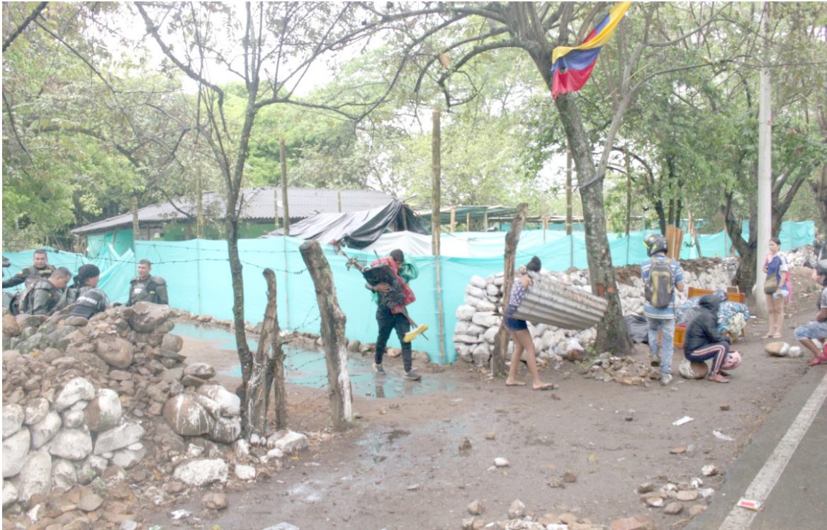
Tras las advertencias realizadas y un ambiente denso, algunos invasores decidieron marcharse de forma voluntaria.