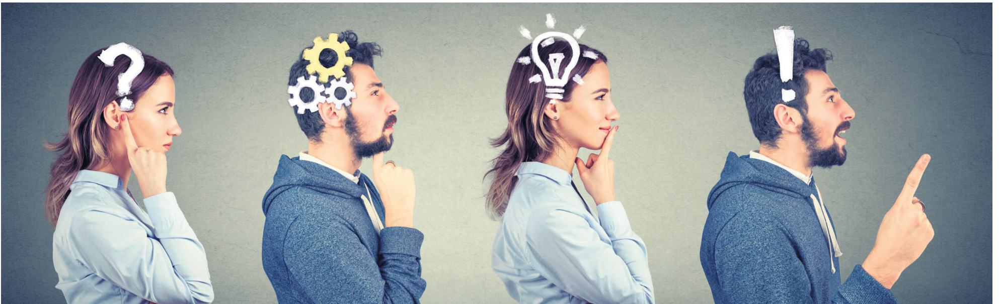
Diferentes trastornos pueden derivar del TDAH.