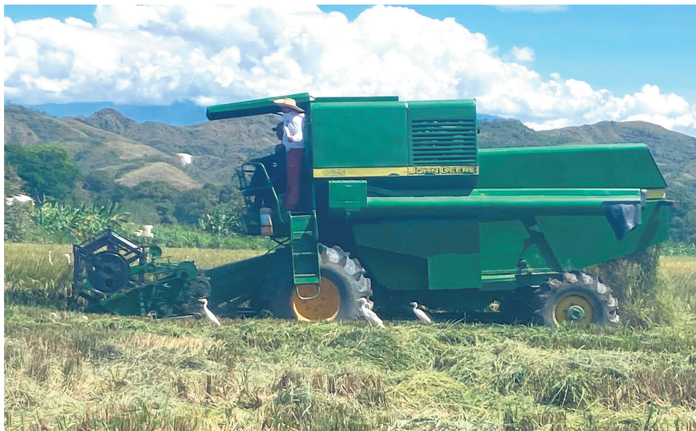
En el Huila se adelanta un proyecto de investigación en trasplante de arroz.

Diario Del Huila, ha registrado las diversas problemáticas a las que se han enfrentado los arroceros de la región. Sin embargo, ahora se adelanta un proyecto de investigación en trasplante de arroz que busca generar mayor productividad y hacer más eficiente el uso de los recursos.