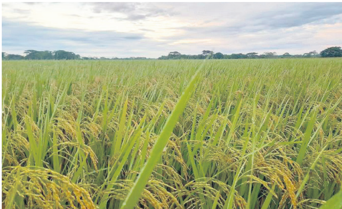
Esta sería la forma de incentivar a los agricultores para que inicien con el proceso.

“El trasplante de arroz se hace con una máquina especial en la cual inicialmente se hace un procedimiento y cuando el arroz está más grande, se