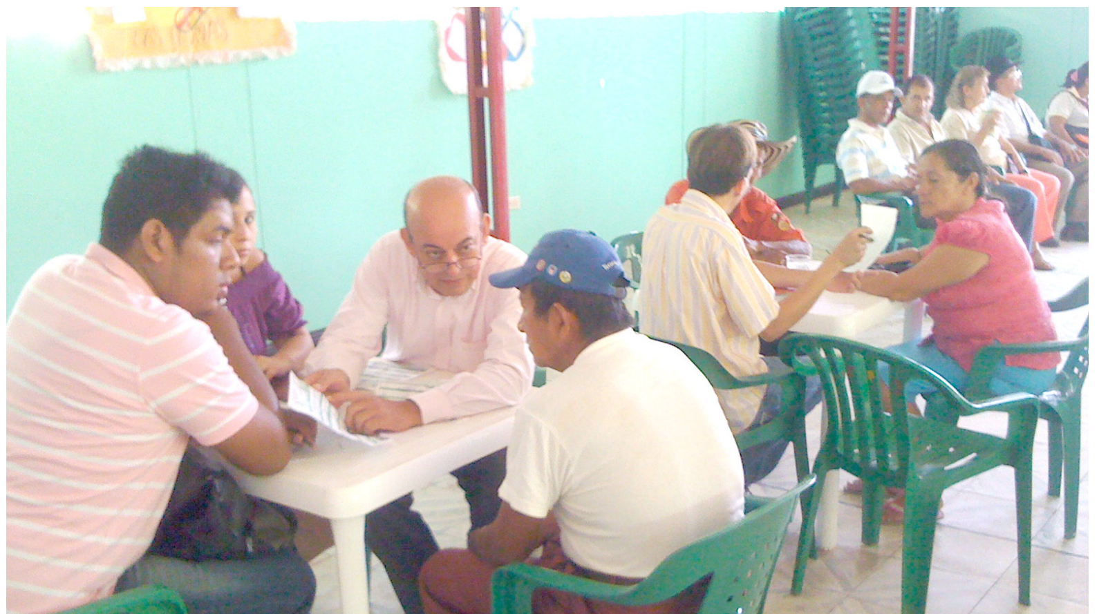
En ocasiones se hacen sesiones descentralizadas para llegar a más población

“Yo toda la vida trabajé de manera informal, nunca coticé pensión y este era mi trabajo formal, me sacaron y ahora quedé enferma y sin poder soluciones”, añadió.