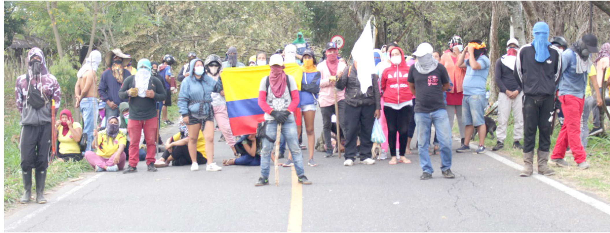
En el Guácimo se encontraba el 80% de la población invasora de estos terrenos

Durante la diligencia que arrancaron con el despeje de la vía Neiva – El Caguán se contó con el acompañamiento de todas las instituciones garantes de los derechos humanos, como la Procuraduría General de la Nación, la Defensoría del Pueblo, la Personería de Neiva, el Instituto Colombiano de Bienestar Familiar (ICBF), la Comisaría de Familia y las secretarías con competencia de la administra-