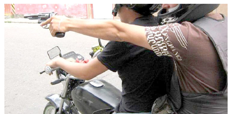
En intento de fleteo termina herido guarda de seguridad.

De momento no se conoce el informe medico del guarda de seguridad herido que fue trasladado a un centro asistencial para recibir la atención por parte de los galenos.