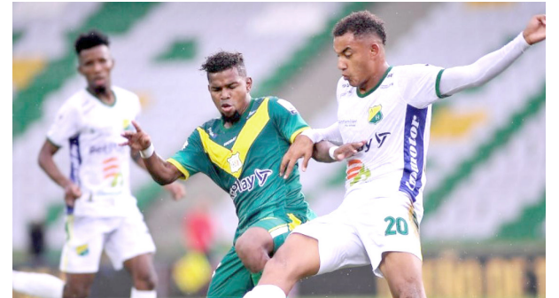
Huila empató ■ DEPORTES 16