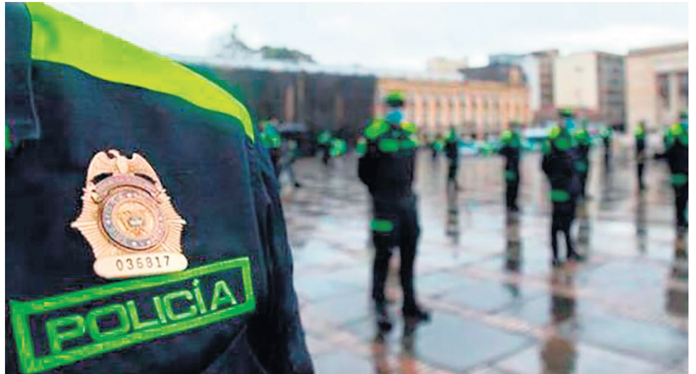
El inconformismo por parte de algunos Policías estaría causando renuncias masivas en la institución