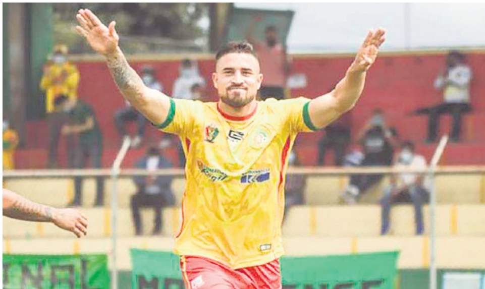
El soldado Gómez marcó para el líder Quindío.