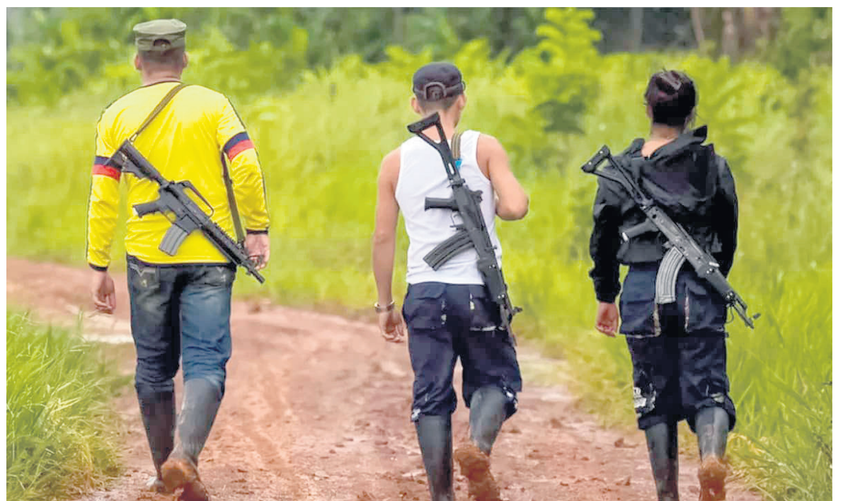
10 grupos al margen de la ley anunciaron cese al fuego.

"El día 30 de junio el comandante Iván Márquez, un hombre comprometido con la paz de Colombia, fue víctima de un atentado criminal dirigido desde los cuarteles del Ejército y los comandos de Policía. Por fortuna salió ileso, solo sufrió pequeñas afectaciones, está gozando de buena salud y desde su trincheras de combate continuará la lucha de las ideas por una nueva Colombia", expresaba en el video Alberto Cruz Lobo, alias 'Enrique Marulanda', hijo del fundador de las Farc, Manuel Maru-