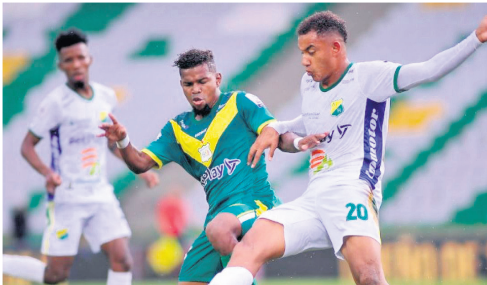
El partido fue muy disputado entre cuyabros y opitas.