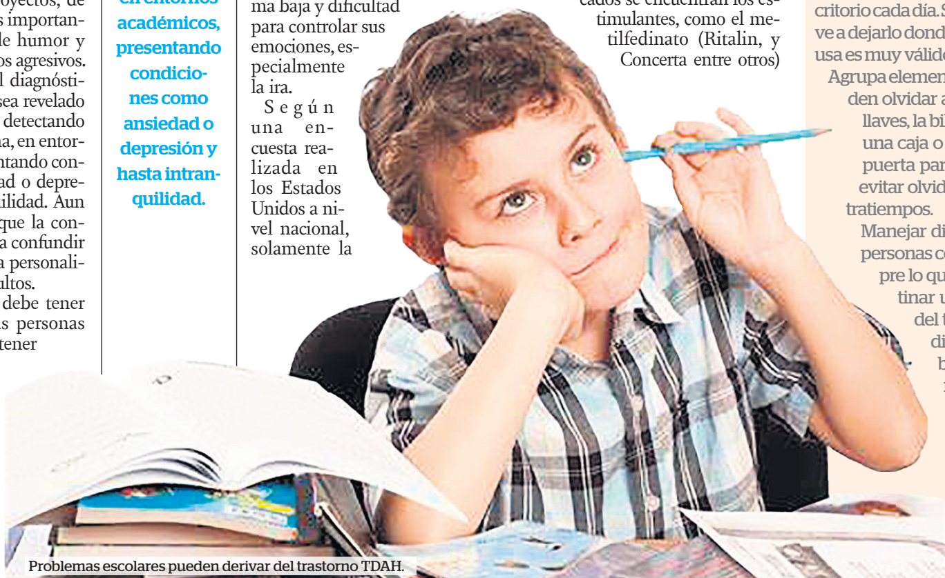
Problemas escolares pueden derivar del trastorno TDAH.

Eliminar las distracciones en el trabajo. Si se tiene que completar una tarea, redirigir las llamadas al contestador; usar audífonos con música relajante para bloquear el sonido que hay alrededor.