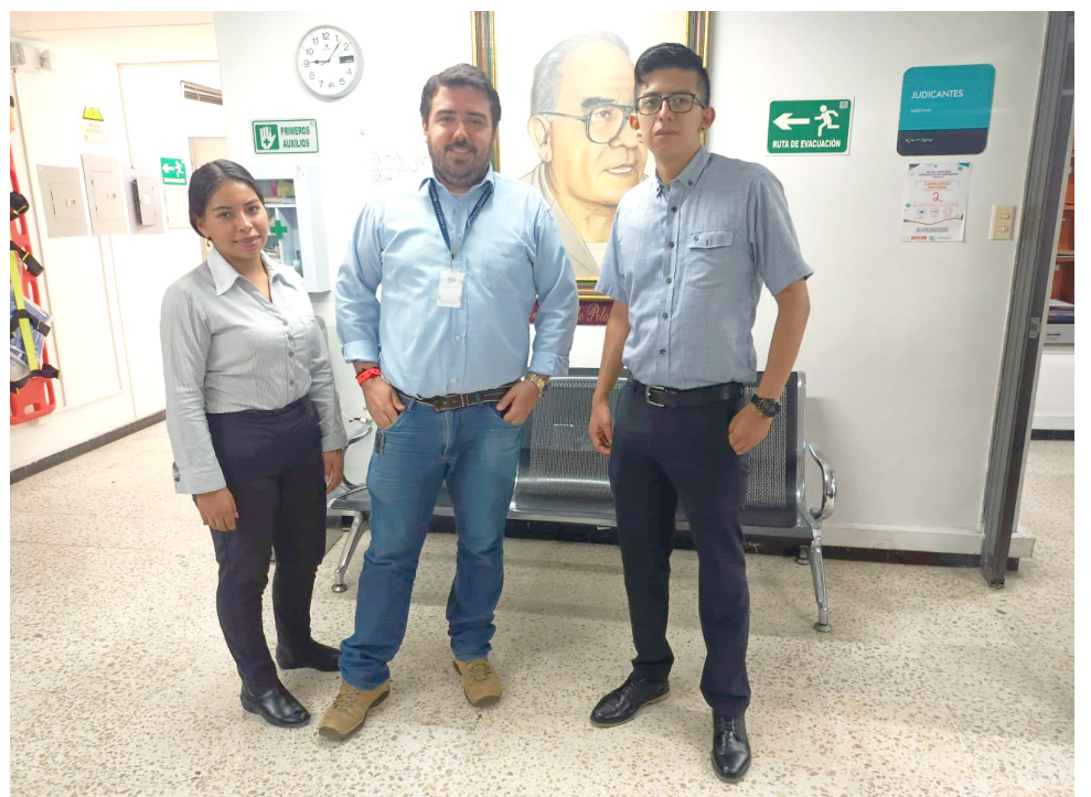
Consultorio Jurídico de la Universidad Cooperativa sede Neiva.

Un Consultorio Jurídico gratuito y de dimensión social, es el prestado por estudiantes de las facultades de Derecho de las universidades, están dirigidos a la ciudadanía en general que requiera asesoría jurídica.