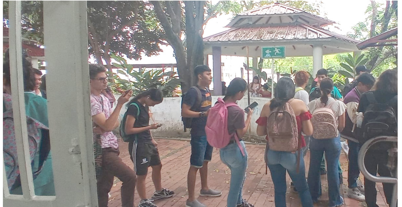
La venada a la hora del almuerzo.

Para muchos estudiantes de la Universidad Surcolombiana el servicio de alimentación es fundamental para poder cumplir con sus actividades académicas, por ser de escasos recursos o por venir de la provincia y no contar con familiares en Neiva.