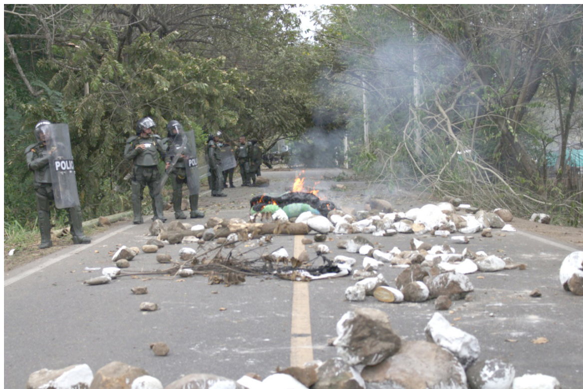
Luego de más de un mes de invasión, ayer se iniciaron labores de restitución de predio invadido en el Caguán.

Durante el operativo, se realizaron dos capturas por delito de daño en bien ajeno y asonada. Los capturados presentan anotaciones