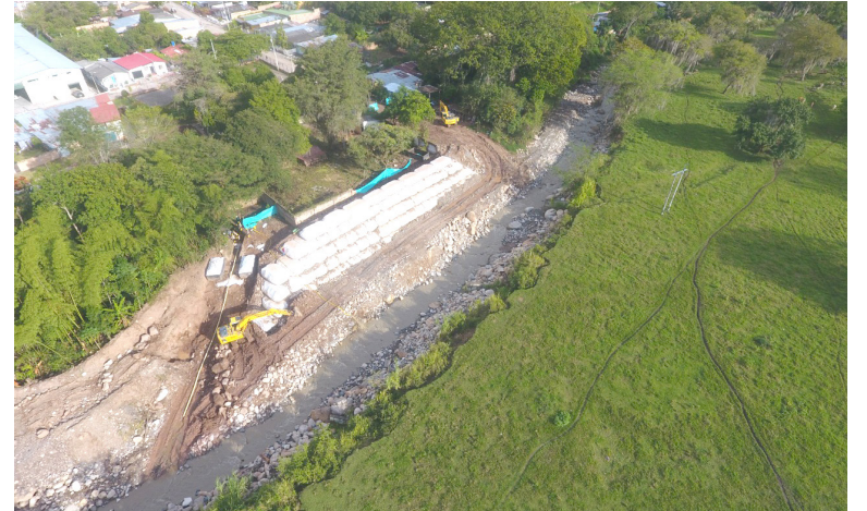
Como avanza la obra.

Esta localidad del sur del Huila presenta uno de los más altos índices de vulnerabilidad a nivel departamental. El fenómeno de El Tobo en la parte alta del municipio y el río Timaná, constituyen una alta amenaza para los habitantes que se podrían ver afectados por este tipo de fenómenos naturales.