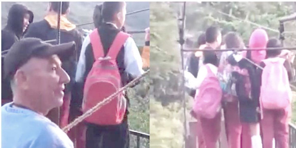
Así es como se trasladan los menores para llegar a sus instituciones educativas.