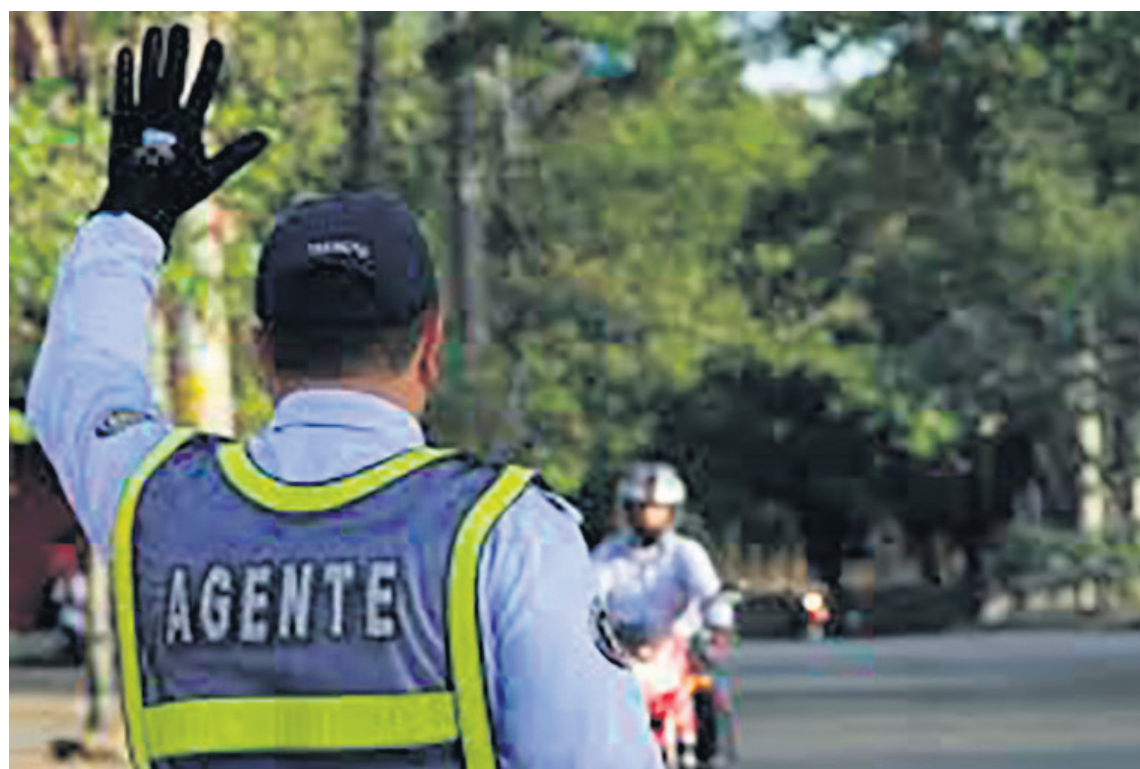
Es importante que se empleen los parqueaderos para disminuir el impacto que genera el bloqueo de las vías.