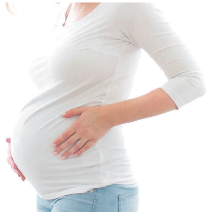
El papa cargó contra quien “presume como conquista del insensato derecho al aborto”.