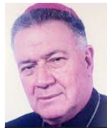
Mons. Libardo Ramírez Gómez*

Después de haber conmemorado, como se merece, el insuperable milagro de la Resurrección de Jesucristo, en una Semana Santa bien aprovechada, seguimos anhelando, para bien de las naciones y del mundo entero, nuevo milagro grandioso de múltiples aspectos. Se trata del estilo, de gobierno, en las naciones, que, con debido respaldo, busquen verdadero bien general y no rebatiña de intereses económicos y políti-