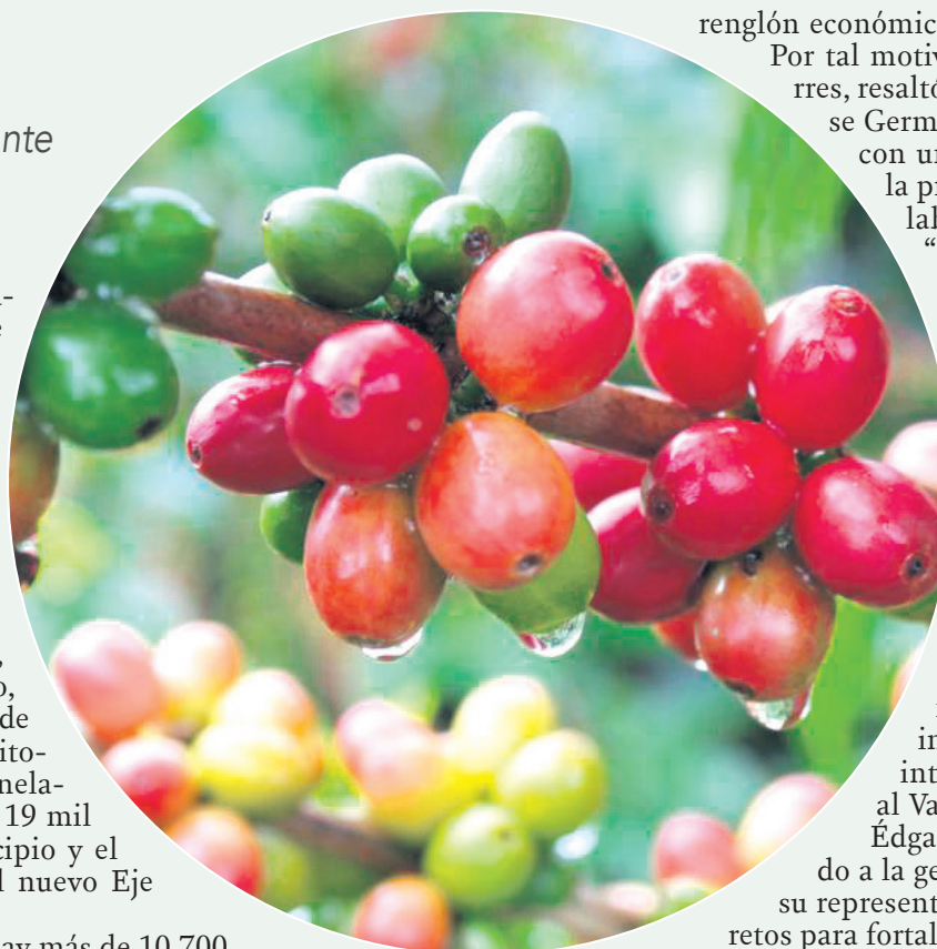
Pitalito tiene más de 17 mil hectáreas de café, según Fedecafeteros, es el primer productor de café del país.

Es de resaltar que en el Valle de Laboyos hay más de 10.700 caficultores, los cuales también generan por encima de los 12 mil empleos a recolectores locales y de toda la nación. Lo anterior refleja el gran impulso económico y mayor bienestar que se fomenta en Pitalito y la región, siendo así un enorme