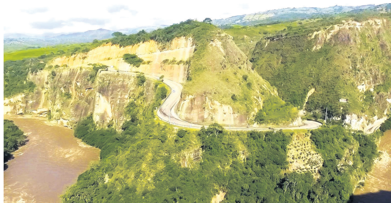
En solicitud ante Minambiente se encuentra trámite de Sustracción de Reserva, para poder iniciar las obras que tomarían dos años en Pericongo.

longitud aproximada de 300 metros, para luego con un nuevo viaducto salir y conectar al corredor existente. Este trazado que acabo de describir, básicamente lo que hace es que a futuro abandonemos el corredor que hoy en día está en ese sector de Pericongo para transitar por el nuevo.