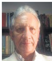
ANÍBAL CHARRY GONZÁLEZ

‘Según la Constitución, la Fiscalía General de la Nación es un organismo independiente que hace parte de la rama judicial, encargado de dirigir el poder investigativo y el sistema penal acusatorio, o sea la función de su titular, se circunscribe a investigar los delitos y acusar a los presuntos infractores ante los tribunales y juzgados que tengan la competencia, entre ellos los altos funcionarios que tengan fuero constitucional y colaborar en la creación de la política del Estado en materia criminal proponiendo proyectos de ley que den solución a estos asuntos de la Justicia.