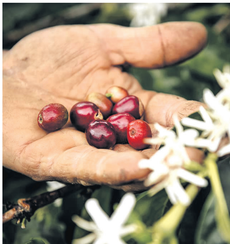
La producción anual de café de Colombia cerró 2022 en 11,1 millones de sacos de 60 kg.