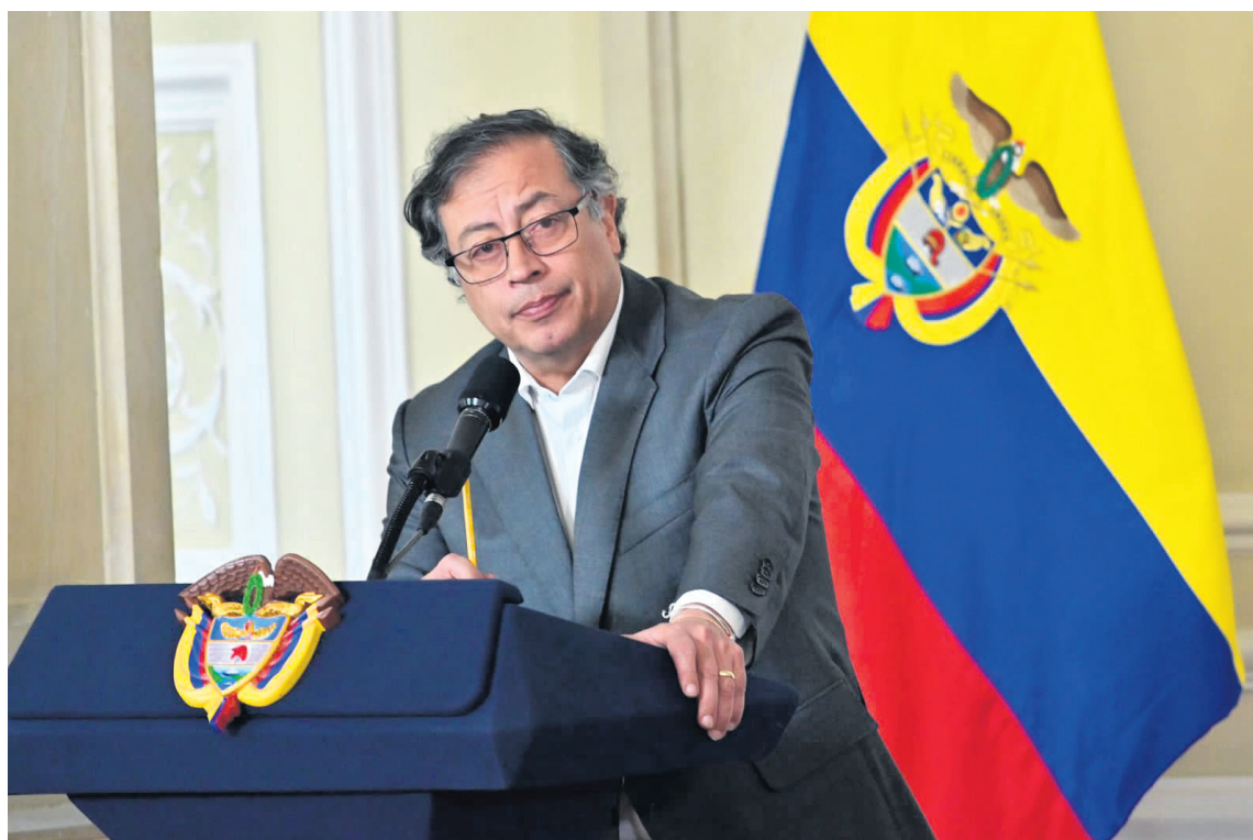
A través de su cuenta en Twitter, el mandatario ha lanzando varias opiniones que han sido calificadas como “incendiarias para la caficultura”

Finalmente señaló que “hay un plan de la caficultura y hay que seguir trabajando en él, pero hay que ver el estado de cada una de las unidades funcionales y ver las oportunidades que tenemos para y obtener resultados, eso es lo que voy a hacer en los primeros 30 días. De ahí en adelante, lograr que la Federación ahora sí se convierta en una empresa que mire hacia los cafeteros y hacia el comercio exterior. Nos hemos gastado más de cinco meses en una elección, ahora es momento de que todos los esfuerzos de la Federación y de cada uno de los empleados, sea en beneficio del desarrollo rentable y productivo de la caficultura de Colombia”.