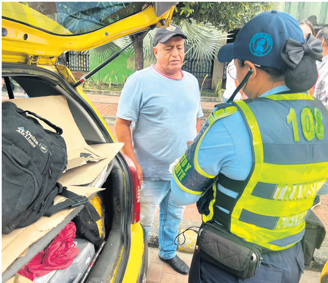
Una de las maniobras más peligrosas es el “afán”, idea con la que apelan los infractores.

“Desafortunadamente cuando Neiva se fundó, no se proyectó que fuera a tener un crecimiento tan grande como el que se ha tenido actualmente, razón por la cual en algunos momentos las vías como las del microcentro colapsan porque no están diseñadas para el tráfico que transita. La segunda infracción de mayor