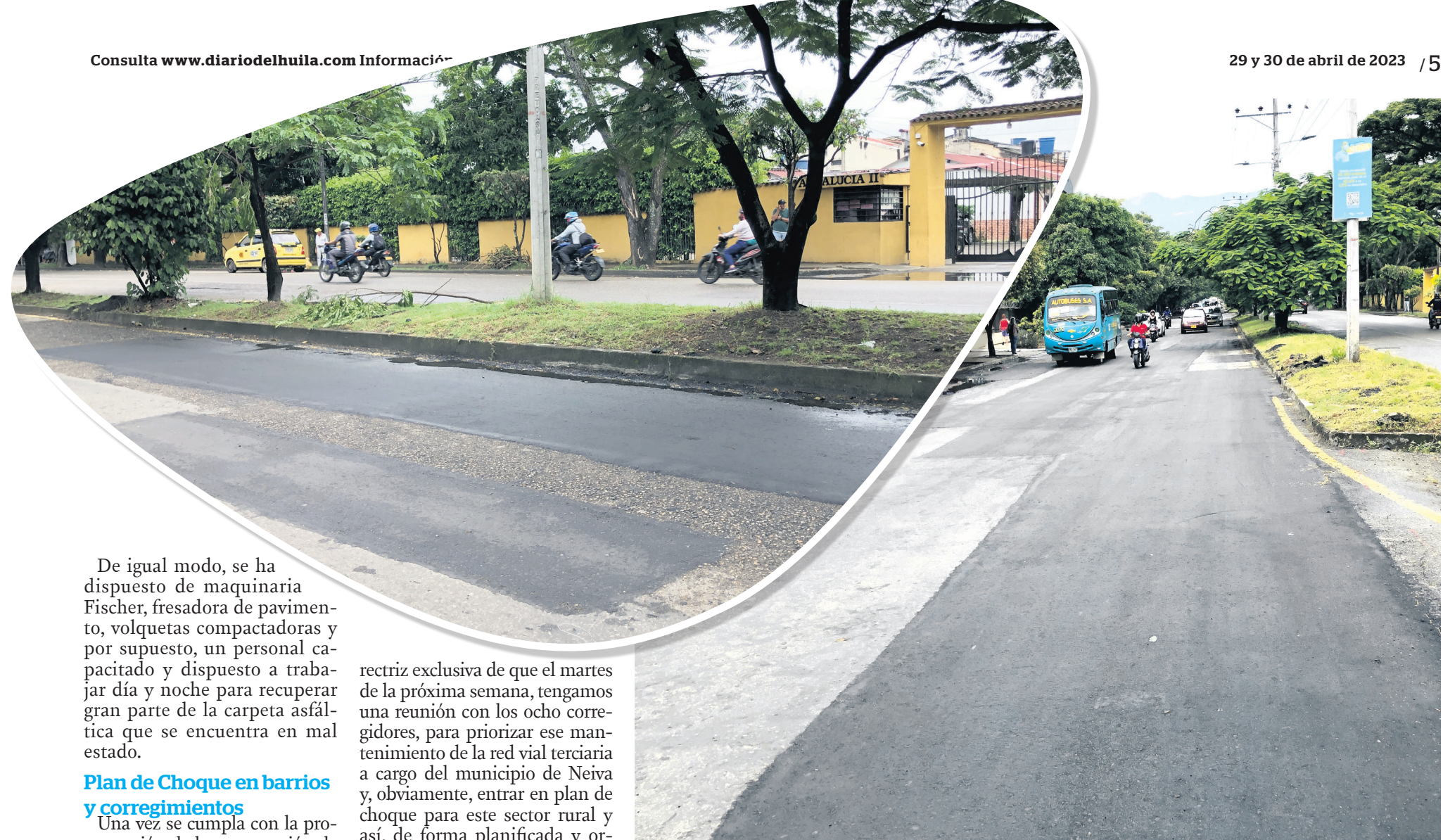
Pavimentación terminada en la Carrera 11 No 6-14 - 42 - 68, Sector Los Arrayanes, frente al conjunto Andalucía.

De igual modo, se ha dispuesto de maquinaria Fischer, fresadora de pavimento, volquetas compactadoras y por supuesto, un personal capacitado y dispuesto a trabajar día y noche para recuperar gran parte de la carpeta asfáltica que se encuentra en mal estado.