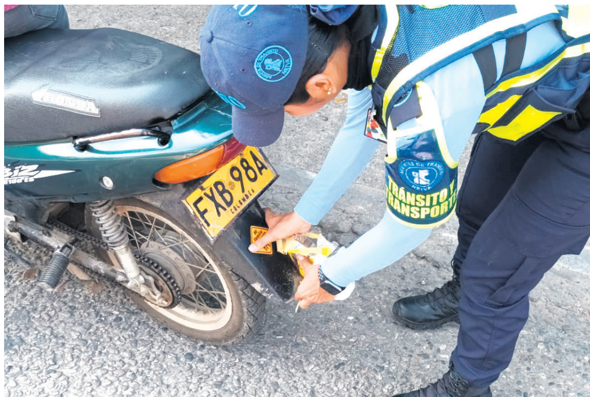
La funcionaria confirmó que se está trabajando en la adecuación de la malla vial.