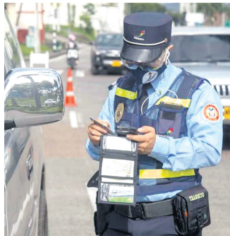
Durante 2023 se han registrado 15 fallecimientos por accidentes de tránsito en Neiva.

dar en materia de piques en vía pública, también denominados piques ilegales”, agregó Robles.