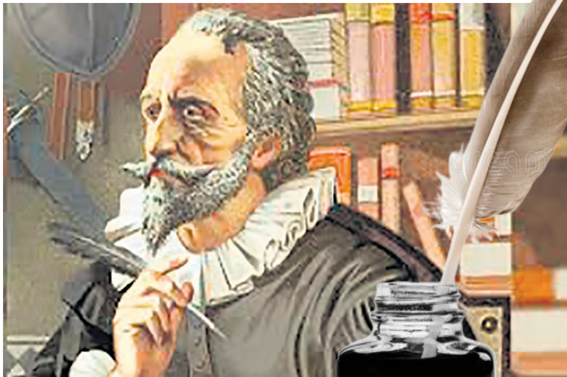
El lenguaje tiene efectos y enerva criterios que pueden llegar a sorprendernos.

Nada escapa al vehículo natural de la comunicación que es el lenguaje verbal —esto sin negar que existen otros lenguajes como la música, las simbologías y las expresiones metalingüísticas como