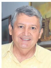
AMADEO GONZÁLEZ TRIVIÑO

En pleno microcentro de Neiva, una madre orienta a su pequeño hijo en la realización de sus tareas. La mujer quien se dedica a la venta informal, adecuó un lugarcito en la calle para que su hijo pueda seguir con sus estudios.