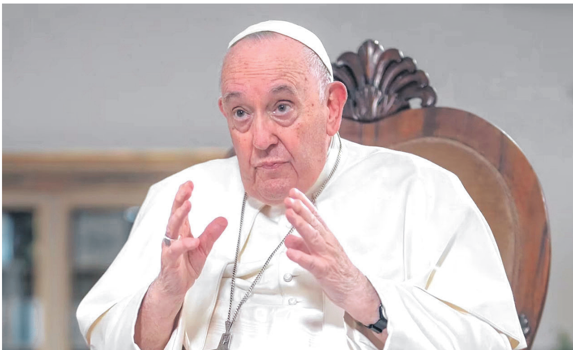
El Papa visitará a los migrantes, muchos de ellos ucranianos, pero también procedentes de África y Asia, de los que se ocupa Caritas.

Y, retomando la encíclica Humanae Vitae de Pablo VI, subraya la conexión inseparable entre los significados unitivo