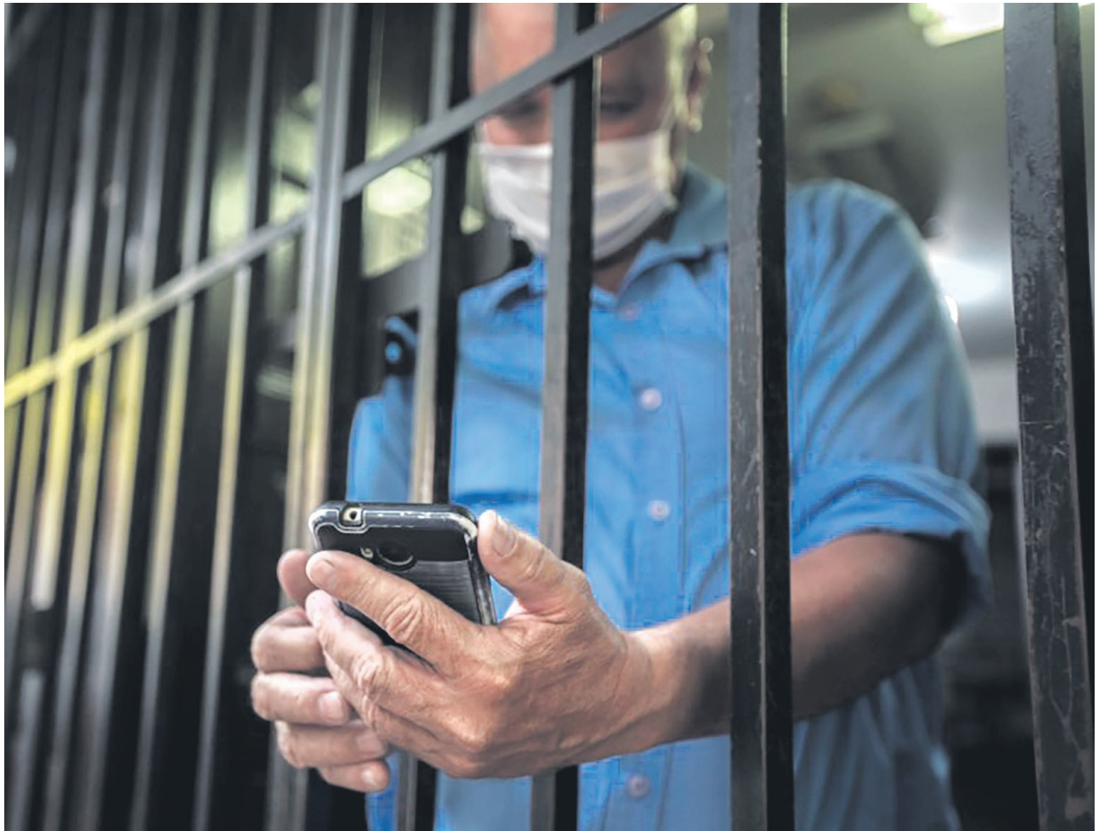
Autoridades militares y policiales buscan erradicar la extorsión carcelaria.

res, estarían siendo citados por los disidentes a zonas rurales