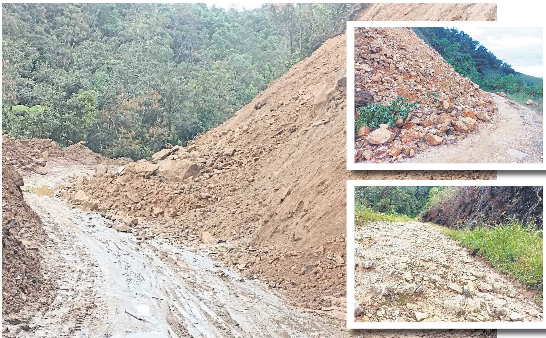
El mal estado de la vía que comunica a Santana Ramos con Algeciras en el Huila, sigue siendo una de las problemáticas más urgentes a solucionar.

Santana Ramos, una zona próspera donde la ganadería, los cultivos de café, caña y productos de subsistencia florecen, y que actúa como frontera entre Huila y Caquetá, sigue siendo un punto de interés para grupos al margen de la ley. Además de la deplorable condición de las vías que obstaculiza el flujo económico, se suma la persistencia del conflicto armado en la región.