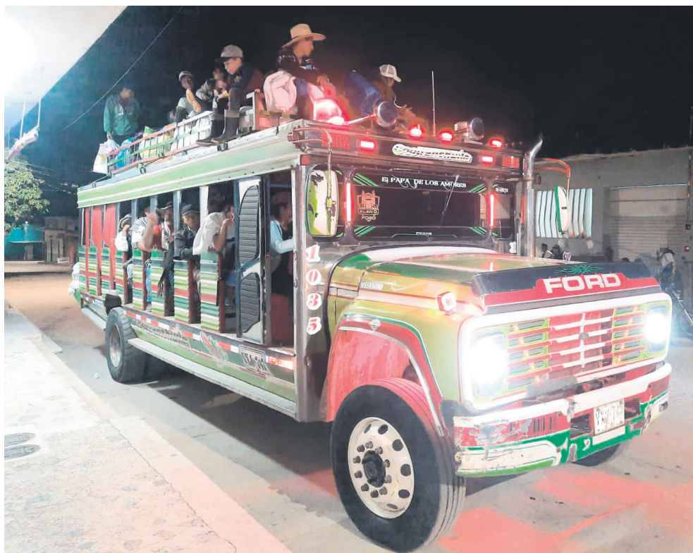
Así salen las chivas que hacen línea de Algeciras a Santana Ramos a las 5:00 a.m.

Por otro lado, la difícil situación de los campesinos, quienes luchan por vender sus productos debido al pésimo estado de la vía, es un ejemplo de cómo la falta de infraestructura adecuada puede afectar gravemente la economía local. Los altos costos de transporte y fletes hacen que sea difícil acceder a los mercados y obtener un precio justo por sus productos. Esta realidad pone de relieve la necesidad de invertir en la mejora de las carreteras y la infraestructura de transporte en estas regiones rurales, lo que no solo beneficiaría a los agricultores locales, sino que también impulsaría el desarrollo económico de la zona en su conjunto.