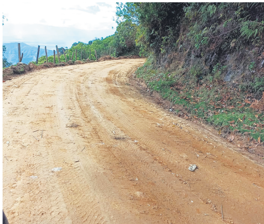
Algunos tramos viales deben ser mantenidos por la misma comunidad.