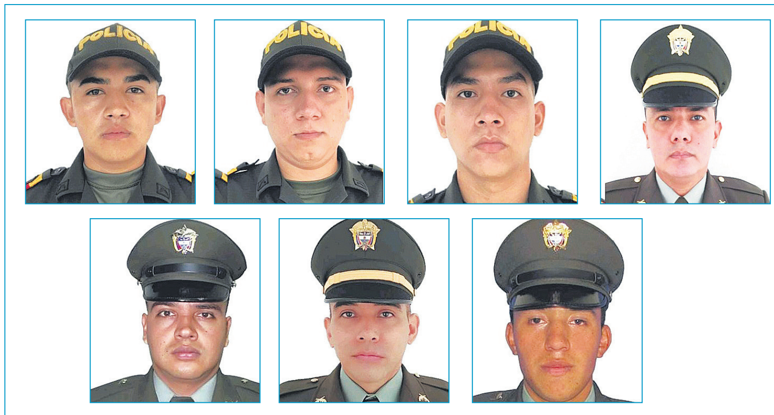
Al conmemorar el primer aniversario de la masacre, honramos la memoria de cada uno de los valientes uniformados de la Policía Nacional que perdieron sus vidas.

a una integración. Así lo recordó su esposa.