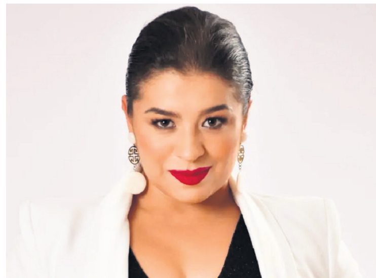
Figura de la semana

ADENDUM- Recomiendo ver la película “Sonidos de libertad” basada en una historia real sobre el nefasto tráfico de menores. Rodada en buena parte en Colombia. Alarman las cifras que se dan a conocer sobre este flagelo.