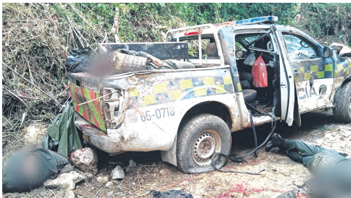
Los uniformados fueron emboscados cuando se movilizaban en esta patrulla con destino al corregimiento de San Luis, zona rural de Neiva.