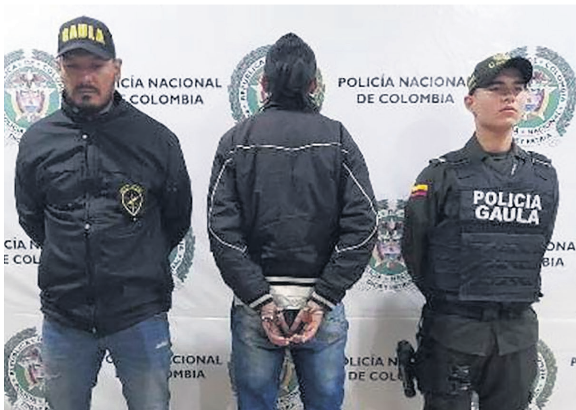
En operativo adelantado en Pitalito, fue aprehendido un joven de 16 años de edad.

Los hechos, motivo de la acción judicial, se habrían registrado el 28 de mayo de 2021 en Manizales, cuando la víctima, un campesino de la región, recibió una llamada del supuesto comandante de las Águilas Negras, quien aseguraba tener un acuerdo con organismos de seguridad para adelantar una 'limpieza social', y requerían contribuyera con la causa, asegurándole que el dinero exigido sería empleado para la compra de armas y munición. Que de no cumplir con las exigencias de la organización, atentarían contra la vida de su familia.