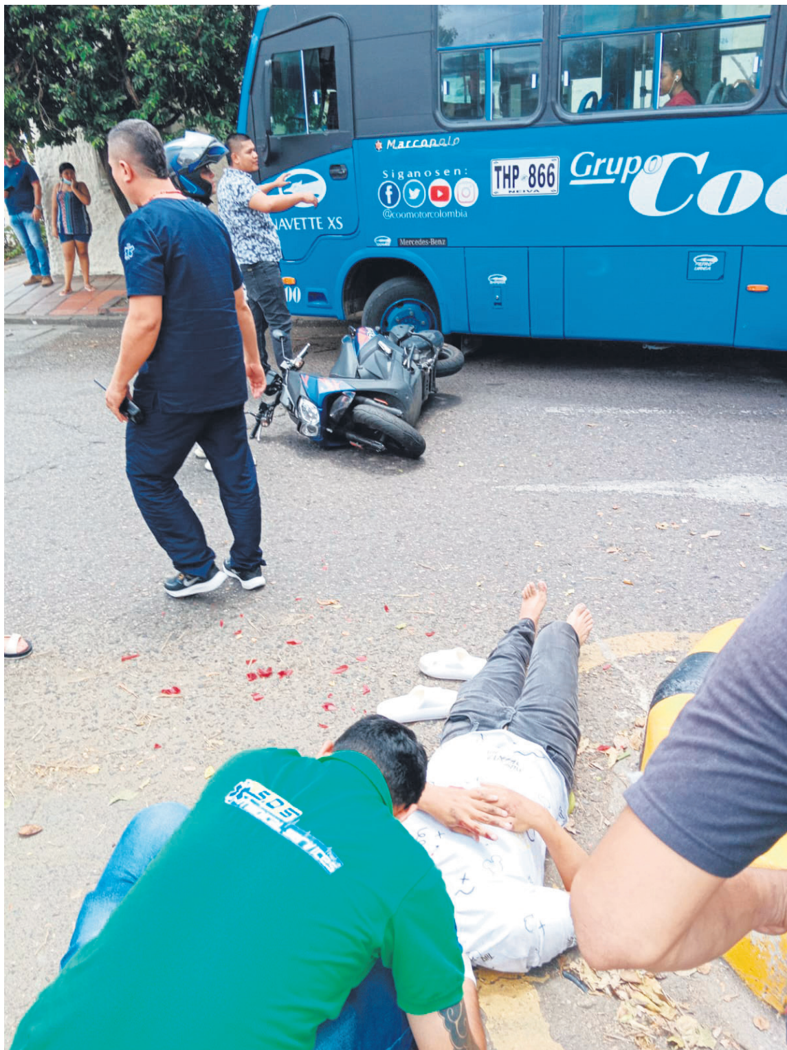
Los motociclistas, mayores víctimas de siniestros viales.

De acuerdo con cifras de esta entidad, el año pasado fallecieron 4.194 usuarios de moto a causa de siniestros viales en Colombia, y según datos preliminares, el saldo de