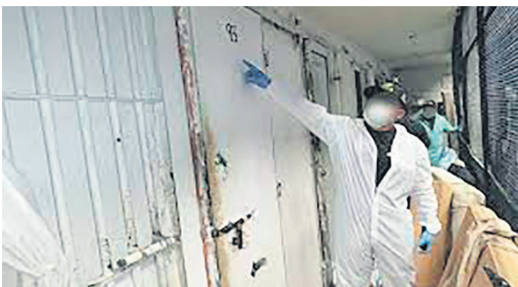
En las penitenciarías de La Tramacúa, Picalaña, Valledupar, Modelo, de Bello, es donde más salen llamadas telefónicas.

Dentro de las modalidades utilizadas por los criminales son: la carcelaria, falso servicio, ciber-estafa. Esta última se da de la siguiente manera: “son mensajes de texto que le llegan a su celular, donde le dicen tiene una encomienda por reclamar y si usted indica que acepta, ahí mismo el ciber-delincuente le roba la información del teléfono”.