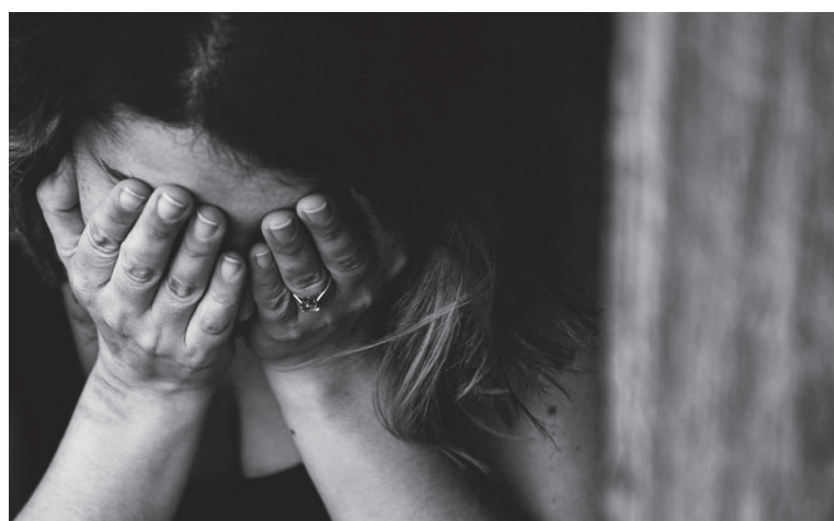
En los años anteriores ha aumentado la cifra de muertes asesinadas en el Huila.

Asimismo, de continuar la tendencia creciente que marcó el punto de giro en 2021, la meta a 2030 de 16,4 por cada cien mil habitantes, sin adoptar medidas adecuadas para la disminución de las violencias que originan el homicidio, será prácticamente imposible de cumplir, lo cual muestra un retroceso en los logros alcanzados.