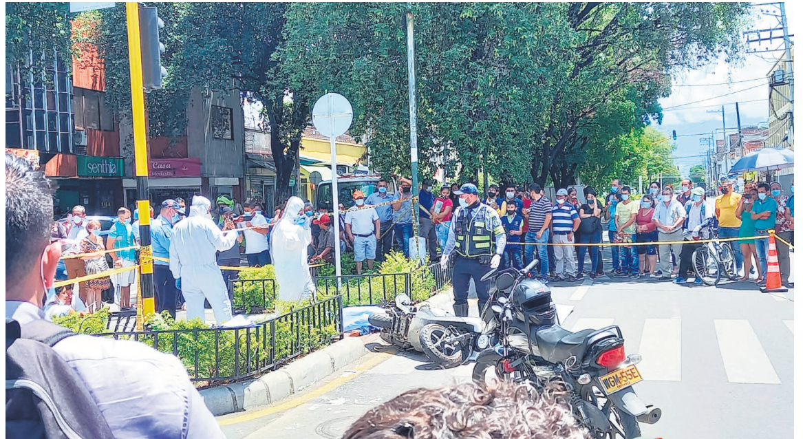
Quienes más se accidentan son los hombres y en un menor grado las mujeres.

Las muertes en siniestros viales no tienen que pasar' ese es el mensaje de la nueva campaña del Ministerio de Transporte, la Agencia Nacional de Seguridad Vial (ANSV) y las Secretarías de Movilidad de Bogotá y Cali. A través de esta producción, desarrollada con el apoyo de la Iniciativa Bloomberg para la Seguridad Vial Mundial, y su socio Vital Strategies, donde familiares de jóvenes motociclistas que fallecieron en siniestros viales,