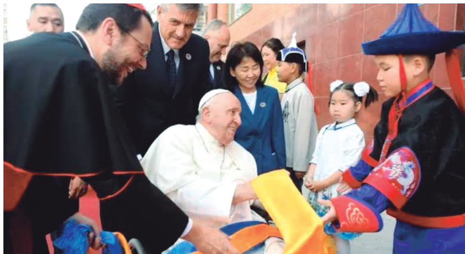
El papa saluda a niños durante una ceremonia de bienvenida en la Nunciatura Apostólica en Mongolia.