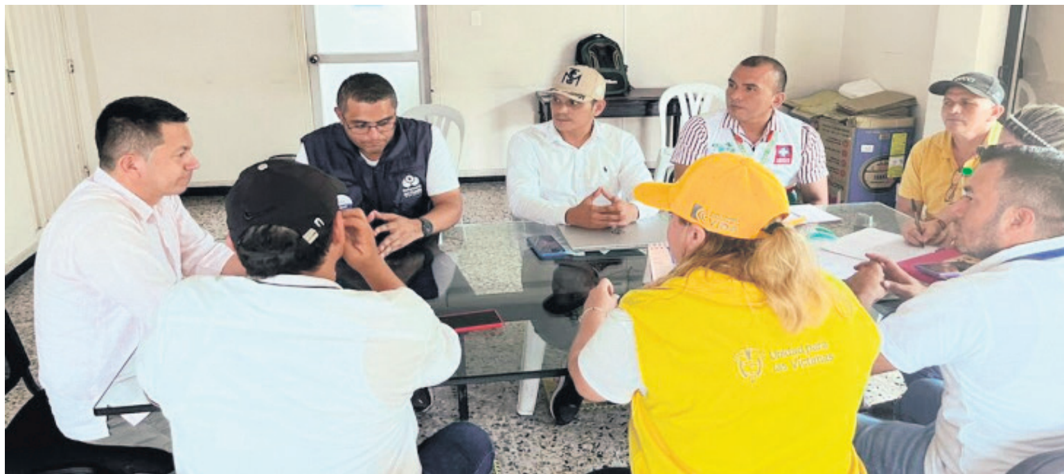
Habitantes del corregimiento Santana Ramos en Puerto Rico, Caquetá, están confinados por enfrentamientos entre estructuras armadas ilegales.

El Diario del Huila obtuvo información que revela que los residentes de esta área han sido objeto de un proceso de identificación (carnetización) y han sido convocados por las disidencias con el propósito de “restablecer el orden” en la región. Según lo discutido en estas reuniones, se ha enfatizado la necesidad de trabajar en beneficio de la comunidad, prometiendo una política de “tolerancia cero” contra los delincuentes y los consumido-