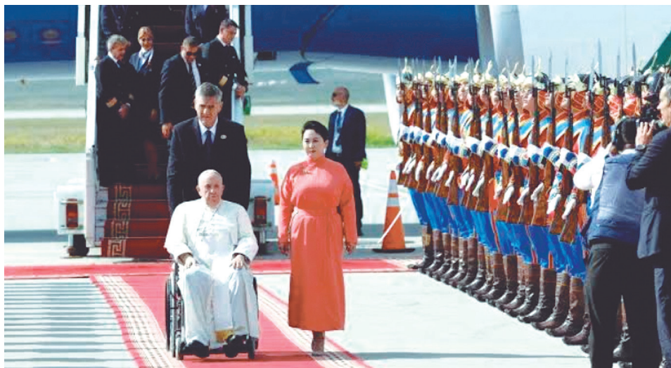
El papa Francisco llegó este viernes 1 de septiembre de 2023 a Mongolia.

La visita, la 43ª que realiza Francisco en sus más de diez años al frente de la Iglesia católica, es crucial para las relaciones del Vaticano con Pekín y Moscú, adonde el papa no ha sido invitado aún.