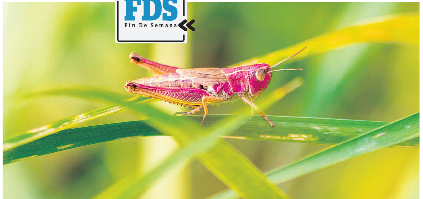
A pesar de que parezca extraño, los saltamontes rosas no conforman una especie nueva.