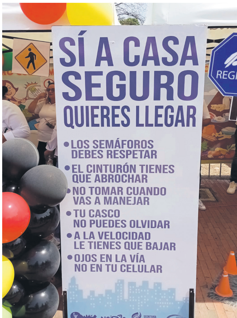
Campañas para reducir la accidentalidad.

Ya para finalizar, la secretaria, indicó que se van a incrementar los controles y se harán campañas pedagógicas con el fin de alcanzar la meta, que es disminuir la accidentalidad en Neiva.