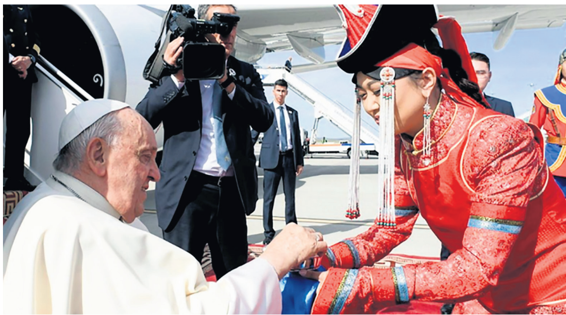
Francisco recibe una muestra de bienvenida al llegar al Aeropuerto Internacional Chinggis Khaan en Ulán Bator.

El Papa Francisco está iniciando su 43 viaje apostólico a Mongolia, donde se encontrará con sus hermanos, con esta pequeña Iglesia en esa tierra de misión, donde desde 1992 la Iglesia ha sido “readmitida”.