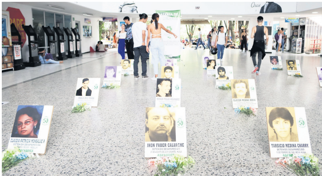
Neiva conmemoró a las víctimas de desaparición forzada. Se llevó a cabo en la Universidad Surcolombiana el foro 'Raíces de nuestra lucha: contexto histórico de la desaparición forzada en Neiva'.