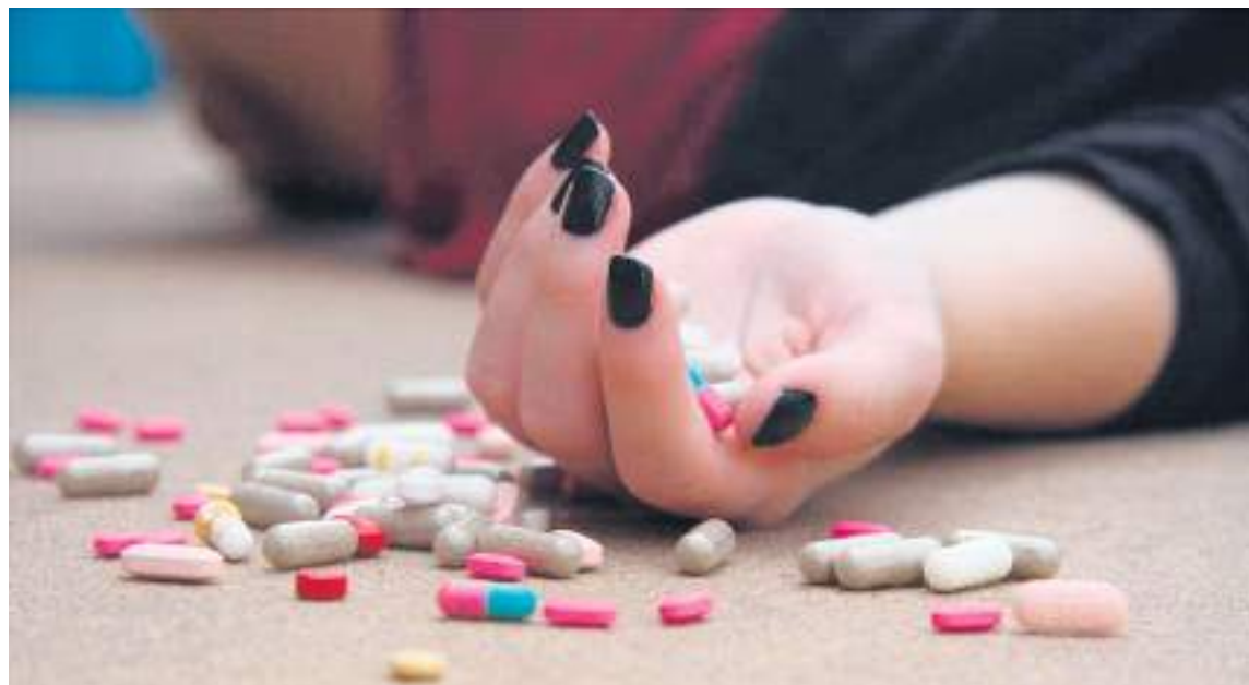
El consumo de sustancia psicoactivas vienen siendo relacionadas con problemas de salud mental.

En confinamientos, el estrés, la pérdida de seres queridos, la fractura de las relaciones de familia o matrimoniales y los altos índices de violencia intrafamiliar que desencadenó la pandemia han sido condicionantes muy específicos para que los casos de afectación en la salud mental de las personas hayan crecido.