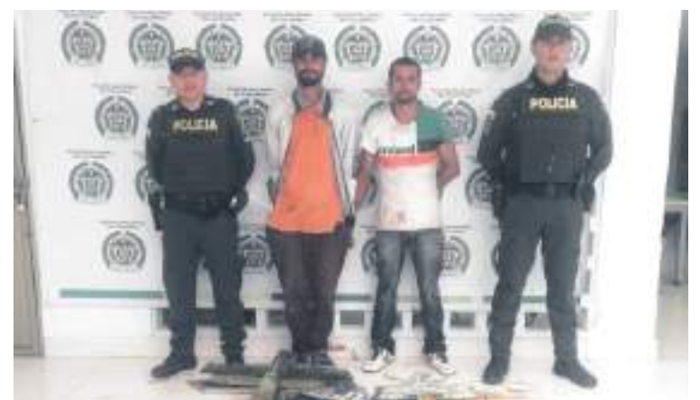
Estos dos hombres fueron capturados con 18 cruces del cementerio central en Pitalito.

Al término de las audiencias, los dos sujetos fueron cobijados con medida de aseguramiento en centro carcelario. Al parecer el objetivo del hurto era revender las cruces.