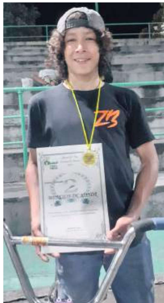
El objetivo es hacer del municipio de Neiva un producto de deportistas de alto rendimiento.

Destacó el deportista que es la empresa privada la que les ayuda en las necesidades del proyecto y que, gracias a ellos, han podido hacerse ver en distintos sectores del país, al punto que el Departamento del Huila se ha convertido en un referente para deportistas de otras regiones. Finalmente, solicitó apoyo por parte de las autoridades públicas debido al crecimiento exponencial que han tomado los practicantes de este deporte, los cuales necesitan de mayores y mejores oportunidades.