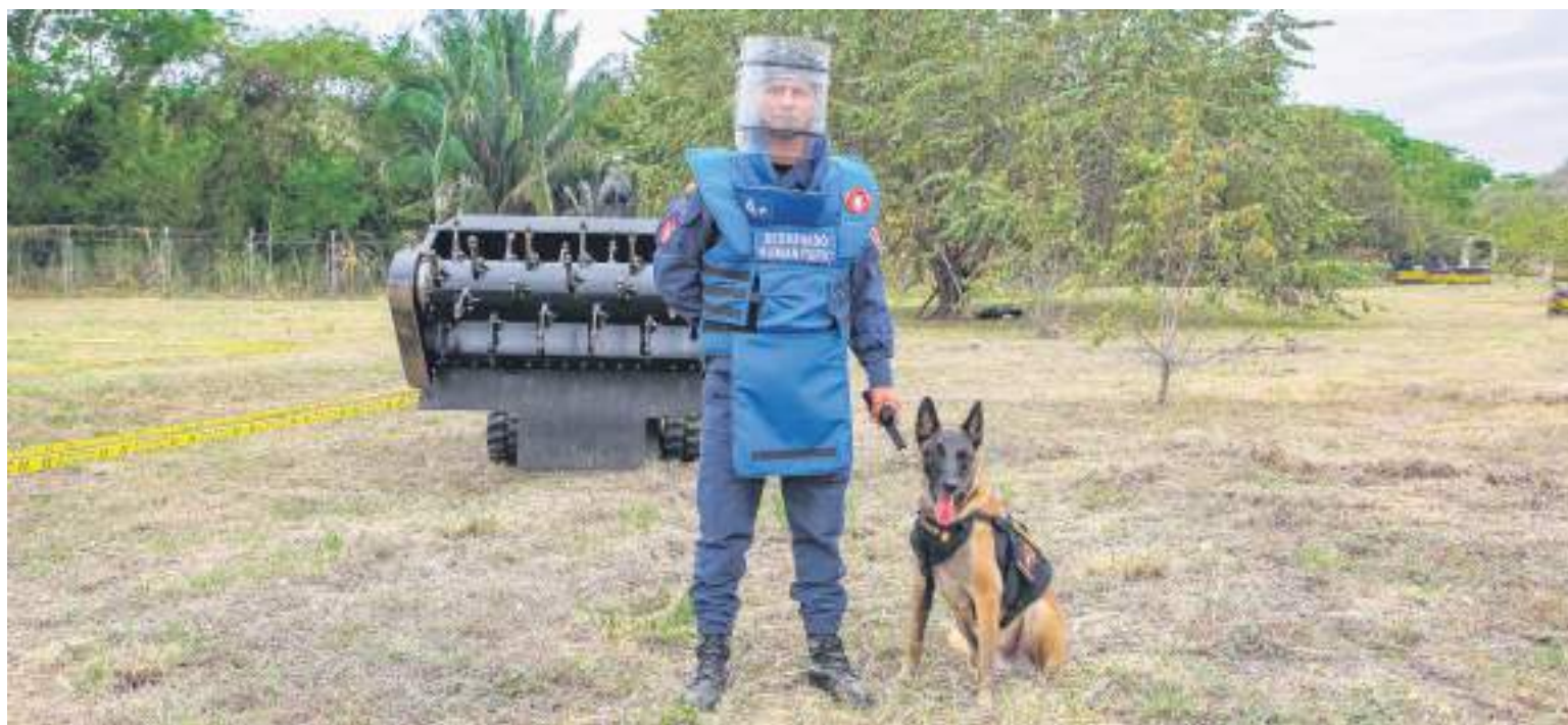
Los caninos militares que están al servicio de Colombia cada vez ganan más protagonismo.

Luego de servir aproximadamente por una década dentro las unidades militares en los equipos de Explosivos y Desminado (EXDE), los caninos pasan a ser jubilados dado que su desempeño laboral empieza a disminuir. Aunque gran parte de la ciudadanía no está de acuerdo con estas prácticas, lo cierto es que los