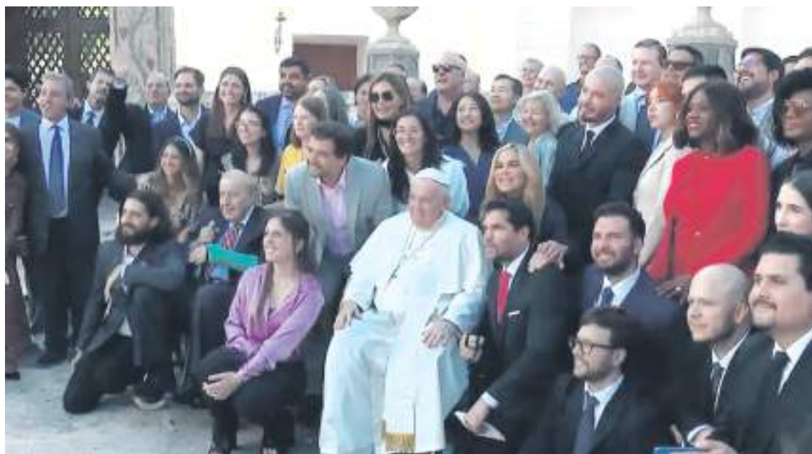
El Papa Francisco con J. Balvin, Eduardo Verástegui y otros artistas en el Vaticano.

En el diálogo, indica la nota del Vaticano, "el Papa ha indicado algunos caminos de la comunicación como la verdad, la bondad y,