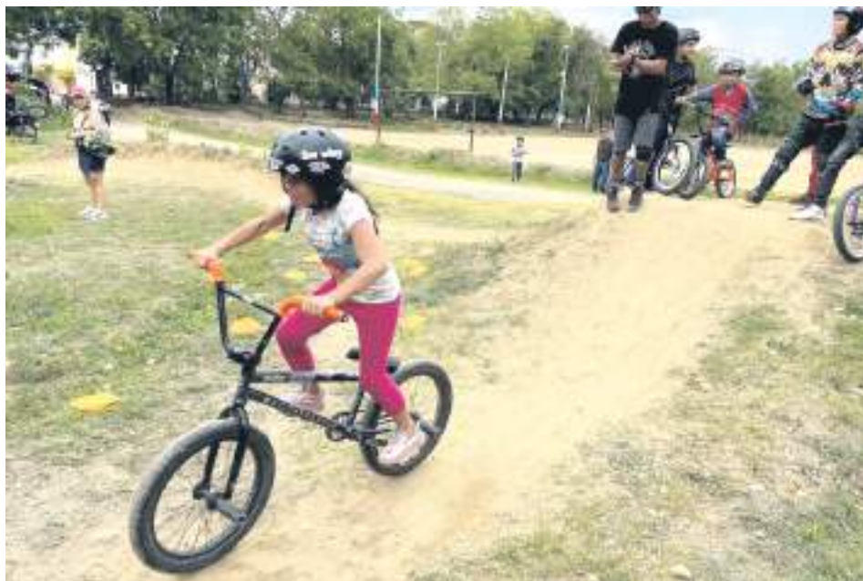
Los niños son el principal público de la organización deportiva.

Para él, la capacidad no depende solo del entrenamiento físico con la bicicleta, sino también, del manejo adecuado de los nervios, las emociones en público, etc.