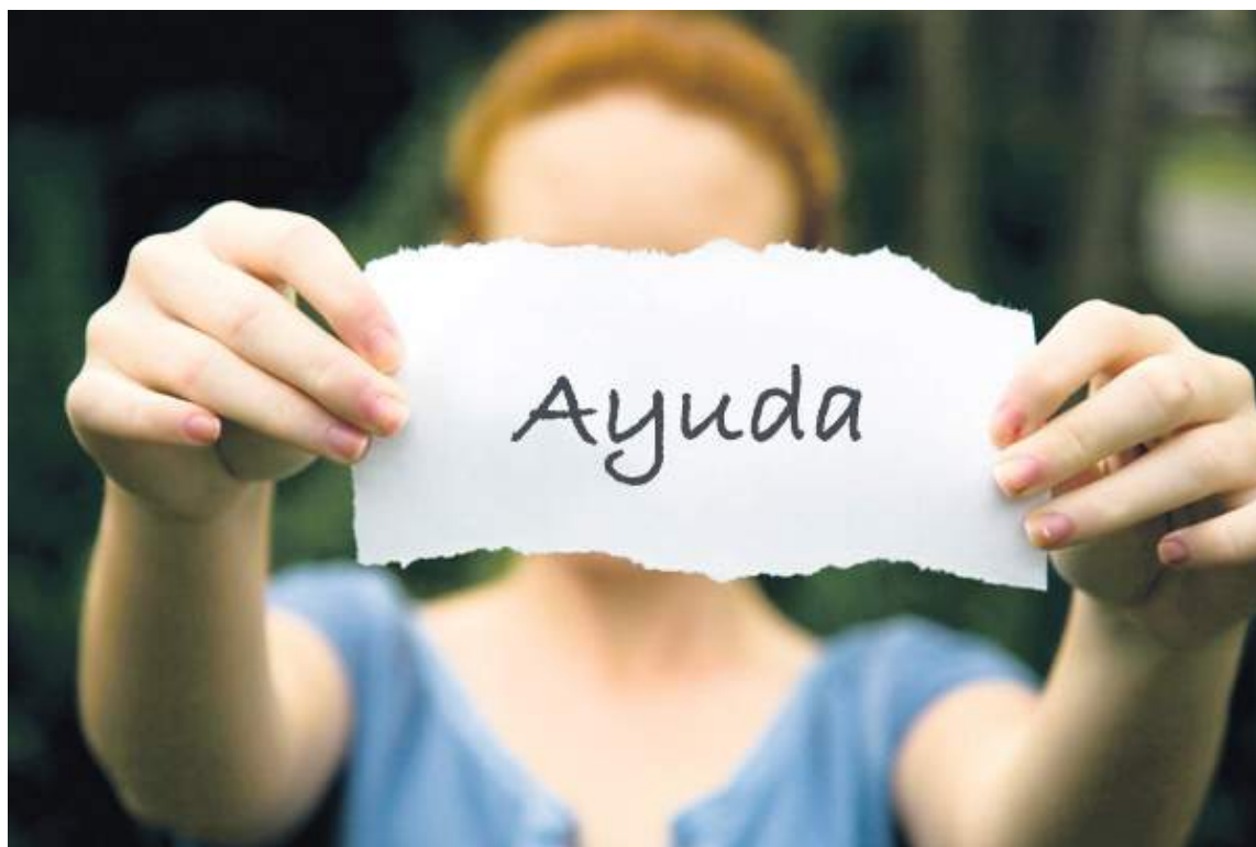
En el Huila se han incrementado los casos de trastornos mentales.

nen es el incremento casi del doble de los casos clínicos relacionados a la salud mental de los huilenses que prende las alarmas en el Huila y lleva a buscar soluciones pertinentes que sirven como plan de contingencia frente al posible riesgo de aumentar las cifras de trastornos relacionados con esta problemática como la de-