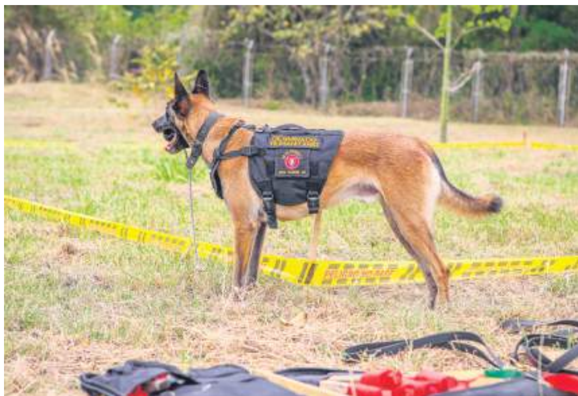
Veter, sin jubilarse ya tiene adoptante.

“Ese es un proceso que uno lleva y uno se apega, entonces yo aspiro cuando él se pensione poder llevármelo. La experiencia ha sido muy agradable, me siento muy satisfecho por la oportunidad que me ha dado el batallón. El trabajo que he venido haciendo con el perro me ha gustado mucho y en este momento estoy preparado para trabajar”, aseguró.