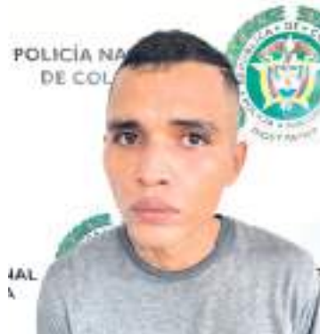
Alias “Lucifer”, capturado.

Según informaron las autoridades, estos individuos serían los responsables del hurto de un teléfono celular, joyas en oro, tarjetas de crédito y más de 1.500.000 mil pesos que se encontraban en