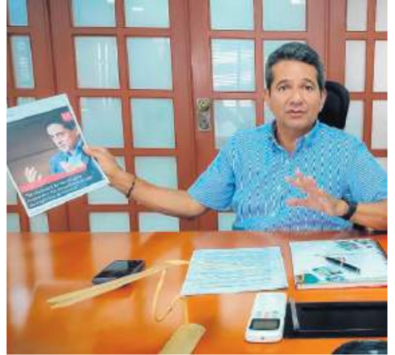
Desde la Cámara de Comercio se articularán las mesas de trabajo.