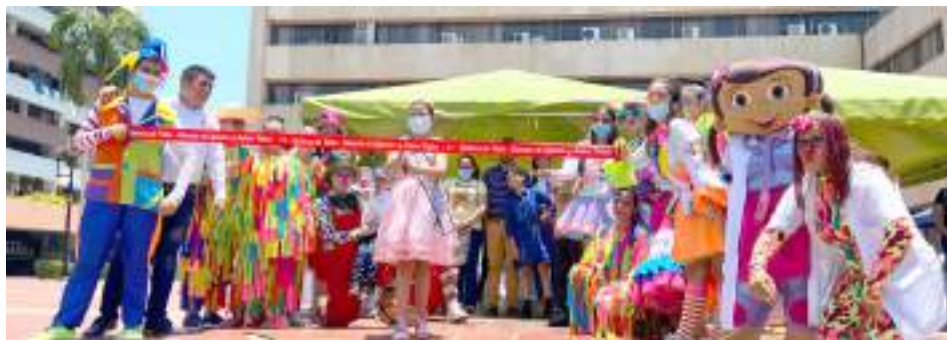
Imagen del día

Vea columna completa en www.diariodelhuila.com