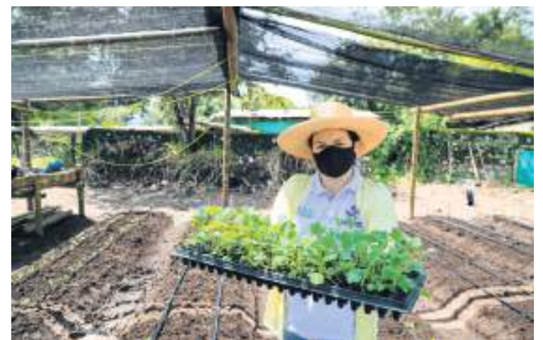
Expertos internacionales harán parte del staff de conferencistas durante el seminario.

Quienes estén interesados en participar de manera virtual o presencial podrán inscribirse hasta el domingo 4 de septiembre, a través de https://tinyurl.com/3ytcnmd . Sumado a esto, la asistencia no tiene costo y será certificada.