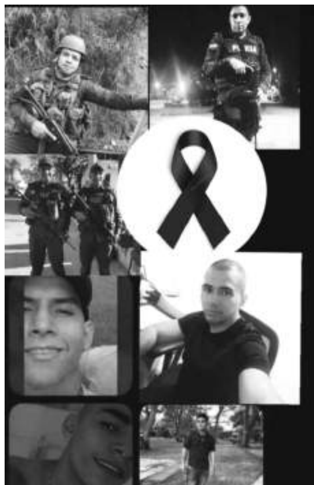
Imágenes de los uniformados pertenecientes a la estación de Policía de San Luis que fueron blanco de este vil atentado.

El grupo denominado Cultura Motor Neiva, se solidarizó con la Policía Metropolitana de Neiva por el vil asesinato de estos ocho miembros de la institución. Con el Himno de la Policía y un minuto de silencio, le dieron el adiós a los héroes caídos.