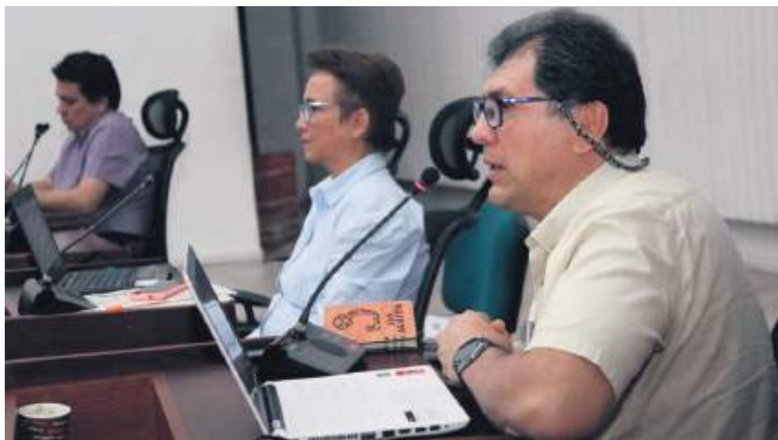
Ya se ha ido socializando el plan de acción 2022-2031 en torno a la salud mental en el Huila.

Actualmente en la Unidad Mental del Hospital de Neiva, se tienen 30 camas para este fin los cuales ya están en ocupación total y vienen siendo insuficien-