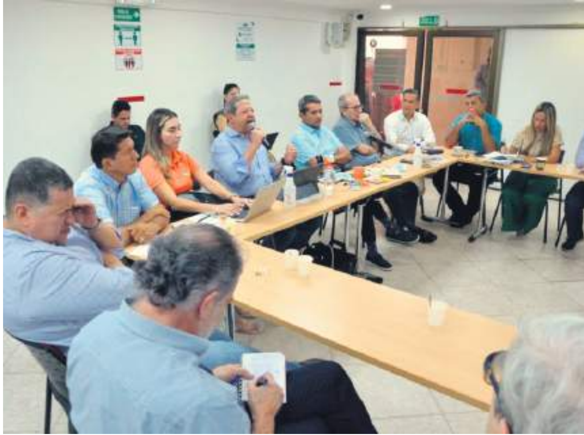
Las soluciones fueron planteadas ante diferentes actores de la economía regional.

Surcolombiana, se refirió a una de las soluciones posibles: