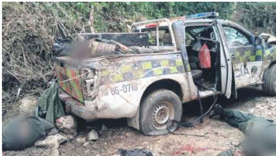
Las imágenes del ataque son escalofriantes. Los cuerpos de los uniformados yacen, algunos sobre un vehículo, y otros sobre el piso. Las llantas están pinchadas y la camioneta en la que se movilizaban prácticamente destruida, con impactos de bala por todos lados.