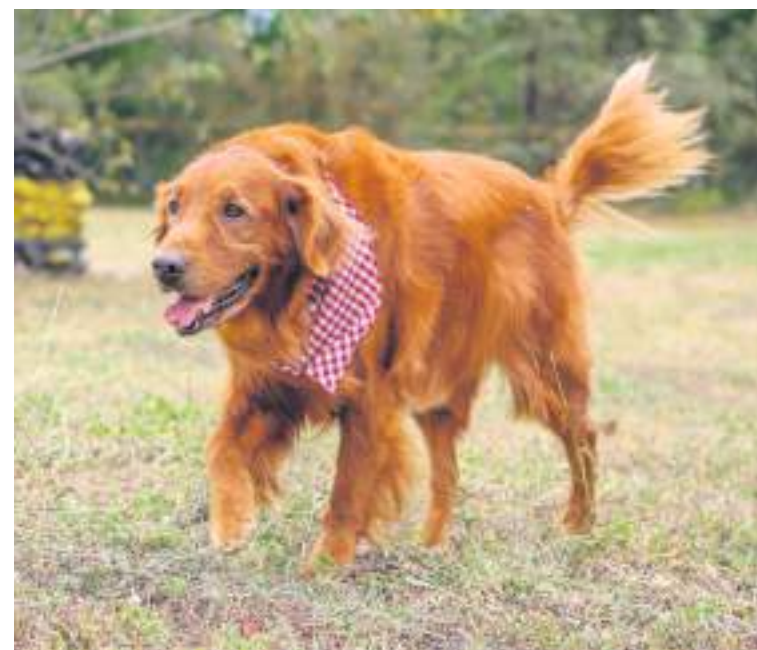
Mate, un jubilado condecorado.

"Yo trabajé dos años en el Grupo Marte de Segunda División y cuando salí me fui ya con él para la casa. Un perro es una alegría y él es otro hijo más. Cuando se da en adopción uno firma un documento en el cual usted no lo puede utilizar en ningún procedimiento con explosivos e inmediatamente pasa a ser un perro doméstico, pero ellos quedan con el entrenamiento básico que son las normas de disciplina que tienen. De igual forma, uno trata de que se adapten más a una familia y no a un trabajo. Siempre es la risa de nosotros porque se mete en los charcos y llega empanado a subirse al carro", afirmó