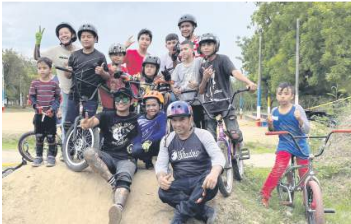
La comunidad Rider ha hecho posible este proyecto en el Huila.

La asistencia a eventos en otras regiones del país les ha permitido tomar experiencia, un elemento importante en la formación de deportistas. Por eso, uno de los métodos de aprendizaje aplicados en dicha escuela, es la participación en todo tipo de convocatorias. “Hemos compe-