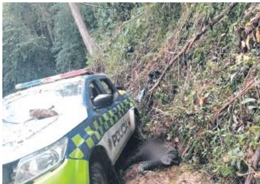
El saldo es de ocho agentes muertos por ataques con ráfagas de fusil y explosivos.

Estos hombres, garantizaban la seguridad de un territorio históricamente golpeado por la violencia. Campesinos de la zona registraron los duros momentos de este repudiable