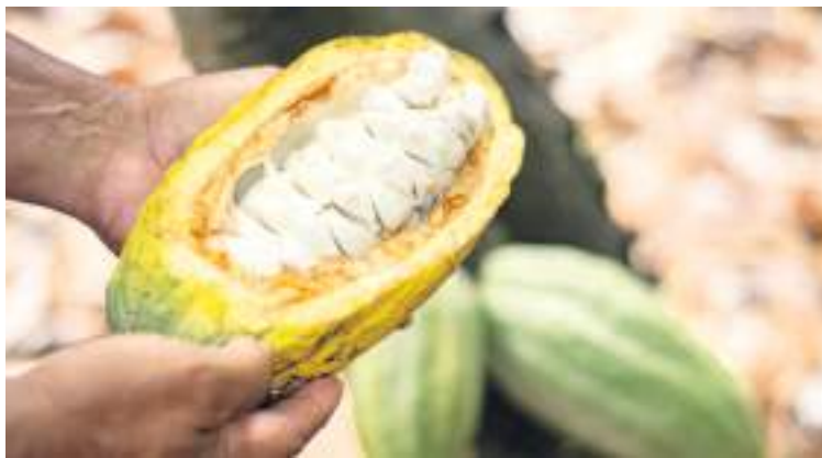
El cultivo de cacao en el Huila se viene consolidando como uno de los más exitosos y con mejor producción.

Otra de las buenas noticias, es que 7 muestras de cacao del departamento hacen parte del listado de los 40 semifinalistas que estarán disputándose los primeros lugares de este concurso que llega a su novena versión, y se