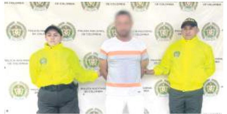
Alias “Pacheco”, fue capturado en la ‘capital arrocerera del Huila’.