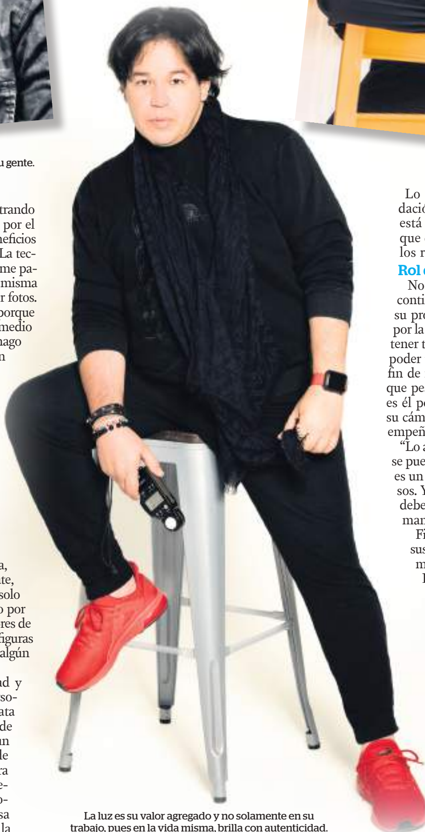
La luz es su valor agregado y no solamente en su trabajo, pues en la vida misma, brilla con autenticidad.

Lo fundamental siempre será generar recordación por un trabajo bien realizado y ahora se está apelando a la naturalidad en medio de lo que cabe. Eso es lo que piden las empresas para los registros de trabajo.