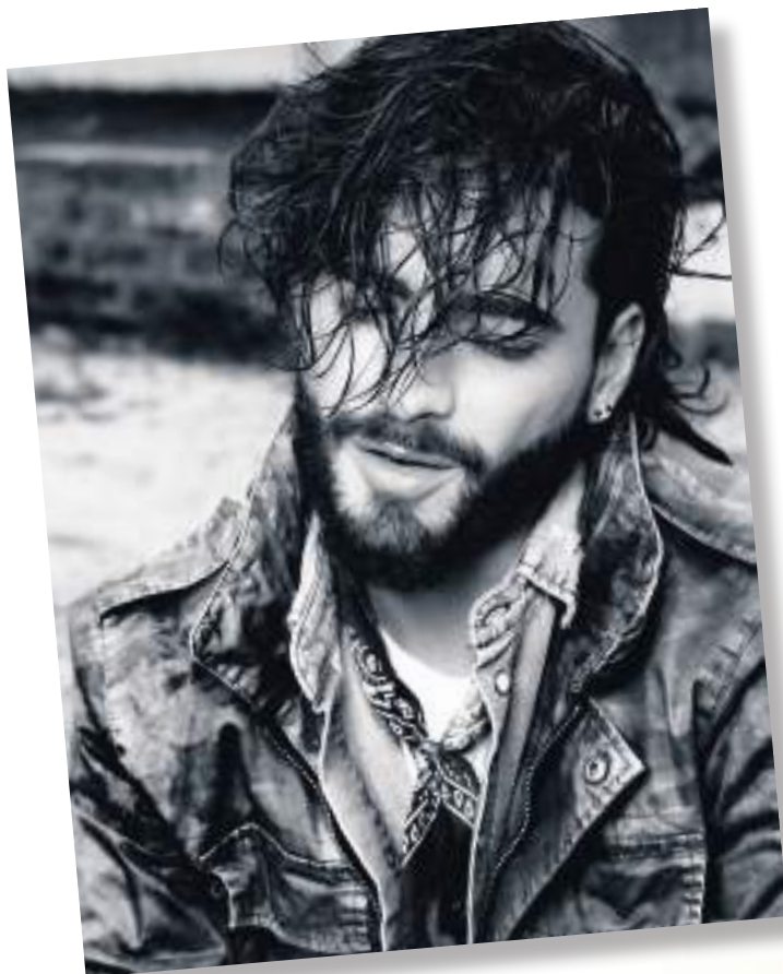
Ese amor patriótico lo hace defender a capa y espada a su gente.