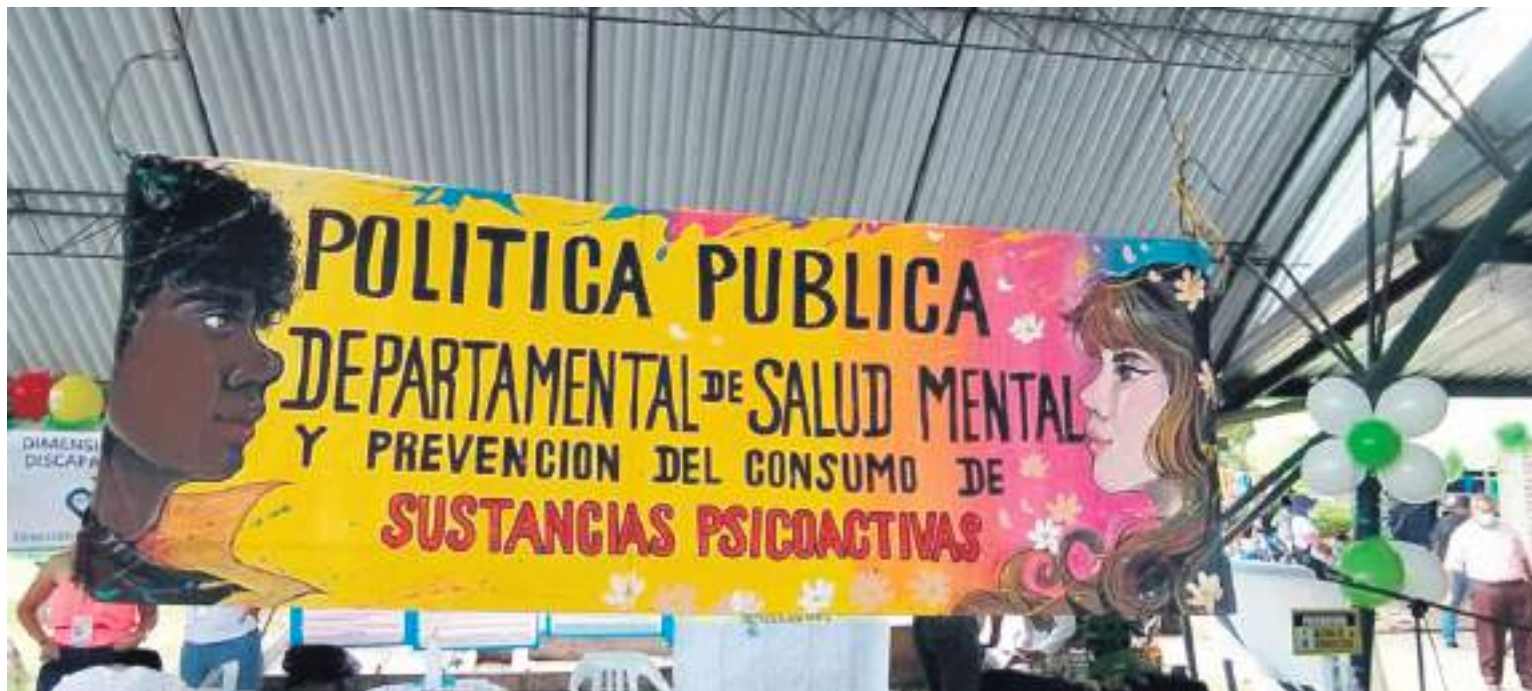
En el departamento se requiere de una política pública de salud mental que pueda ayudar a implementar acciones que bajen los indicadores de afectaciones en los seres humanos relacionados con trastornos mentales.