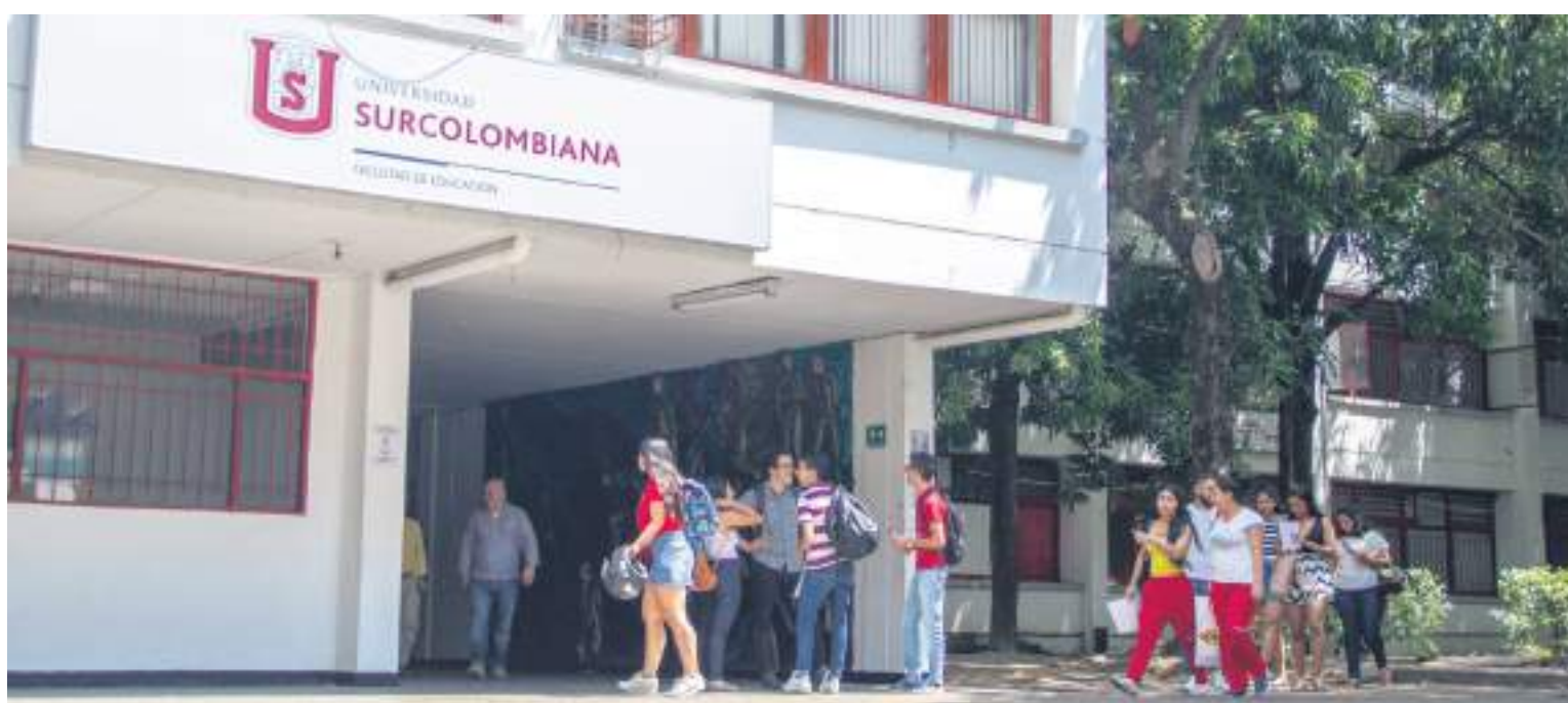
La situación de la universidad depende del Gobierno Nacional.