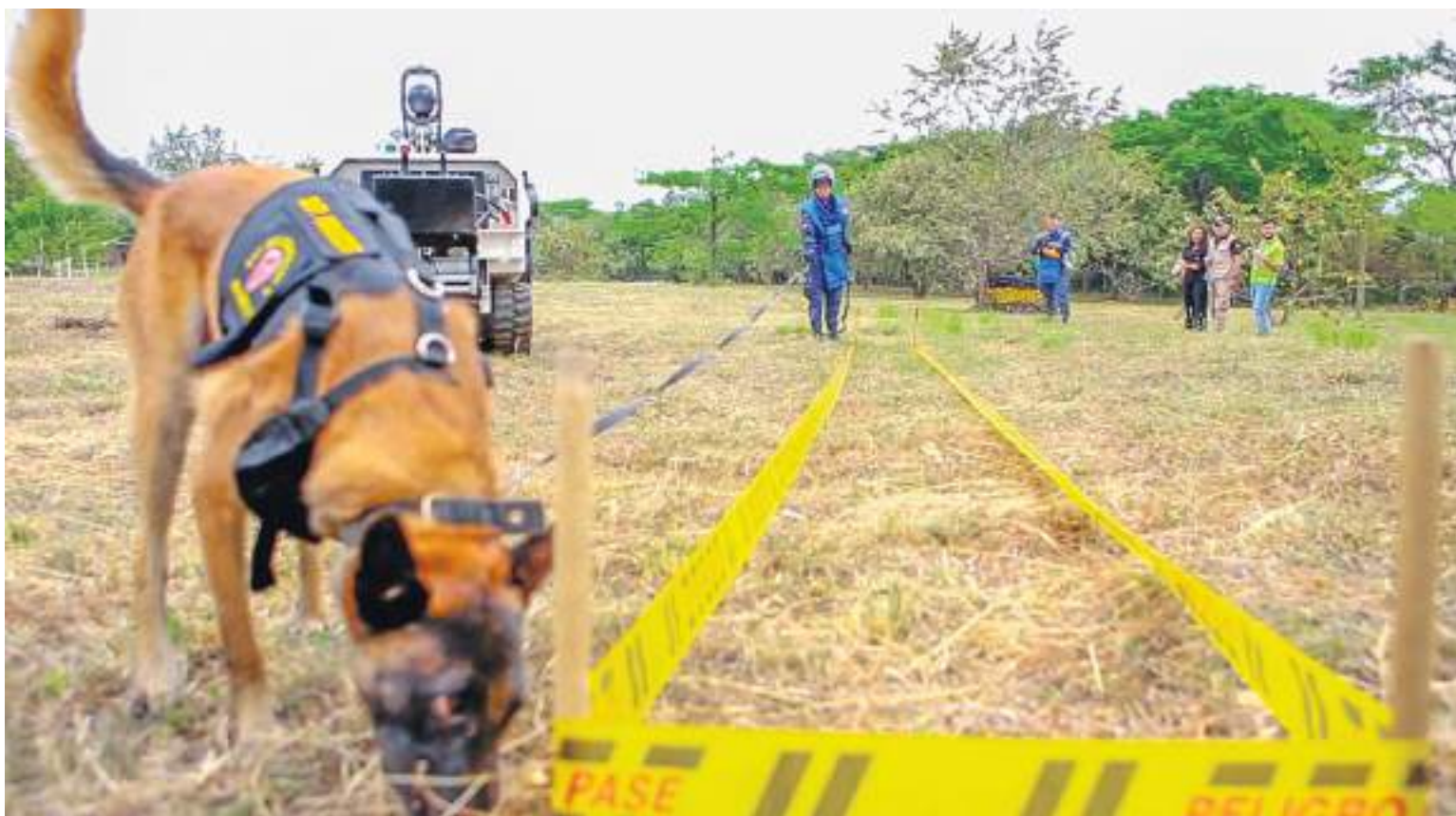
Con sus capacidades, estos animales se convierten en compañeros fundamentales en las labores que adelantan las unidades militares.

Explicó también que, “cada ejemplar tiene un chip que lo identifica como un bien del Estado y determina la raza y la vida útil; así mismo se le hace el proceso y cuando está listo para la jubilación el chip es extraído para que el animal quede a cargo de la persona que lo va a adoptar. Cuando va a iniciar la intervención en las diferentes partes, se le implanta el chip en el cuello mediante una pequeña operación y queda monitoreado por parte de la entidad encargada de esto”.