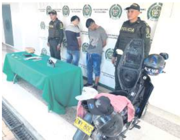
Los dos sujetos habrían participado en el hurto de un bolso, un celular y más de un millón de pesos en la comuna uno.

La Policía Nacional hizo el llamado a la ciudadanía para que denuncie cualquier situación que atente contra la seguridad, informando a la línea de emergencia 123 o con la patrulla del cuadrante más cercano.