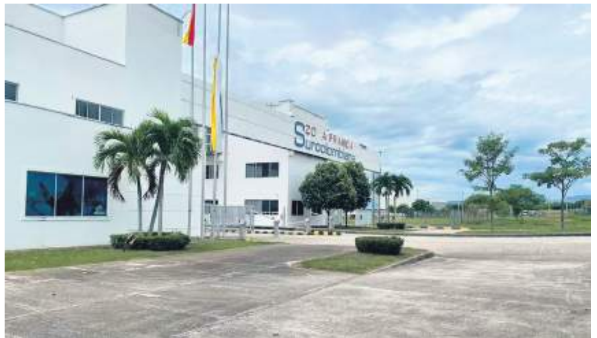
Frente común hacen, inversionistas, gremios y autoridades para salvar la Zona Franca Surcolombiana.

“La invitación es a que no perdamos este entusiasmo y nos pongamos en un ritmo de trabajo por sectores, los invito a que miremos por sectores, el Huila tiene vocación exportadora en varios sectores. Tenemos que diversificar nuestra canasta exportadora como lo tiene que hacer el país, igual en el departamento del Huila lo venimos trabajando desde el Plan de Reactivación Económica de la Política de Emprendimiento, pero obviamente tenemos que ir con los pies