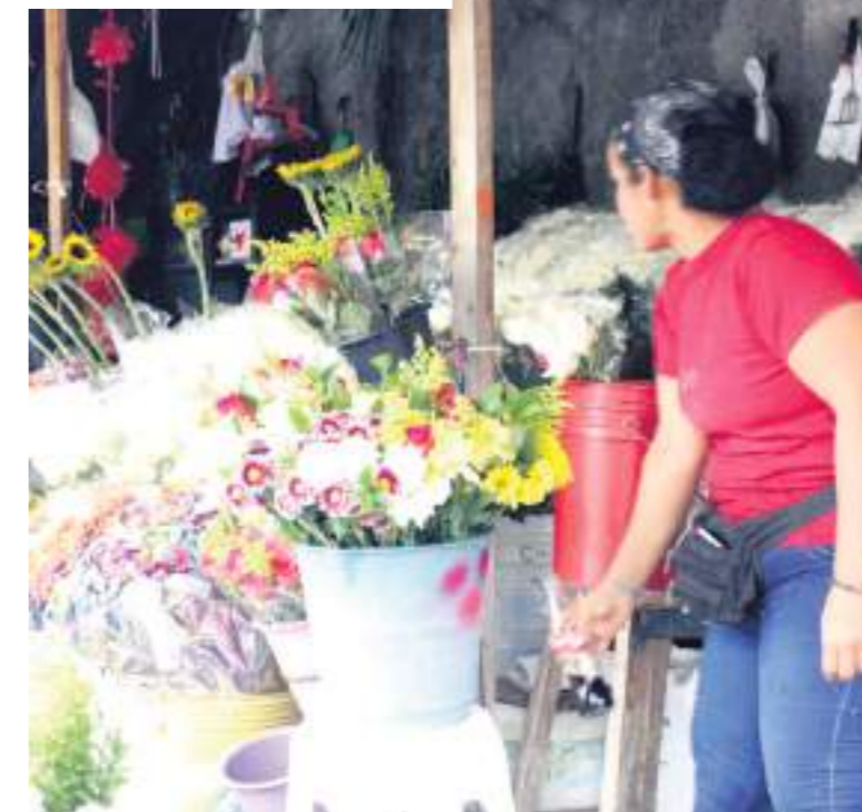
La otra cara de la conmemoración, los vendedores de flores.