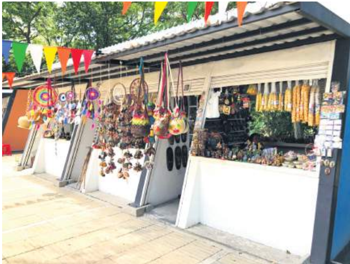
Artesanos y comerciantes del Malecón piden apoyo.