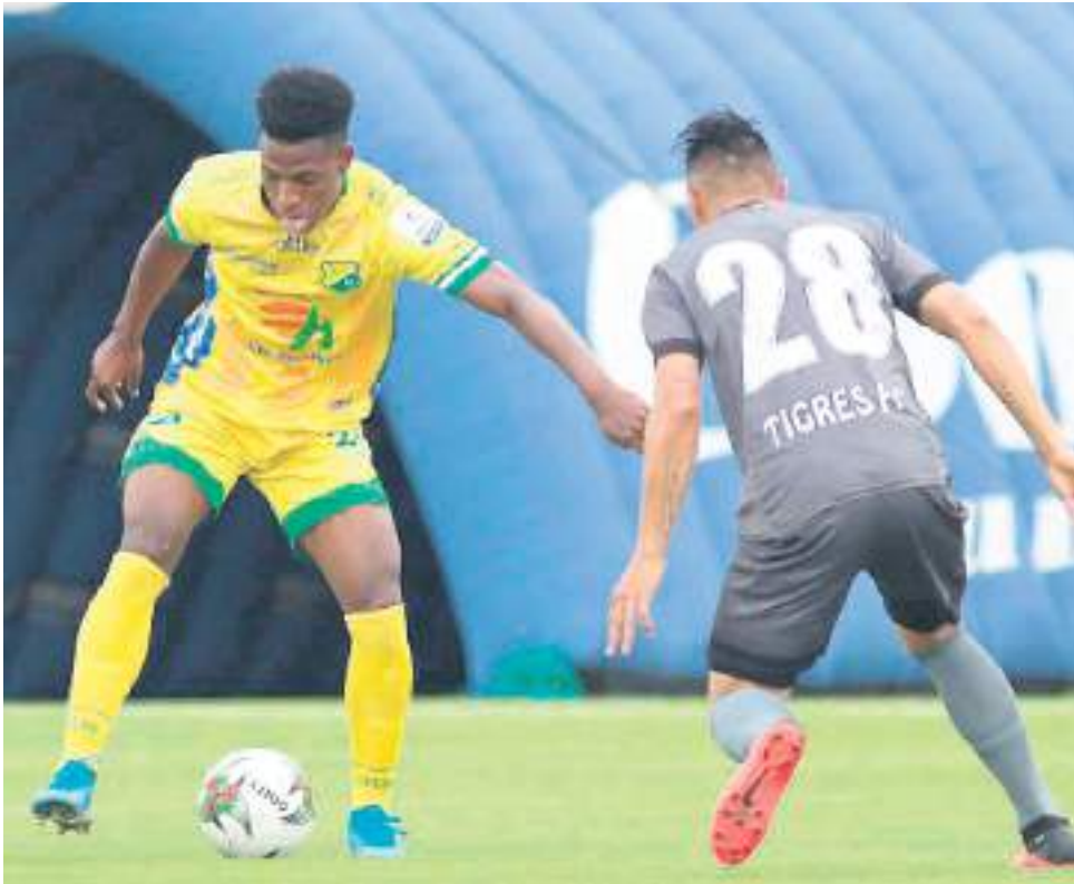
Atlético Huila recibe a Tigres en juego crucial por la clasificación.