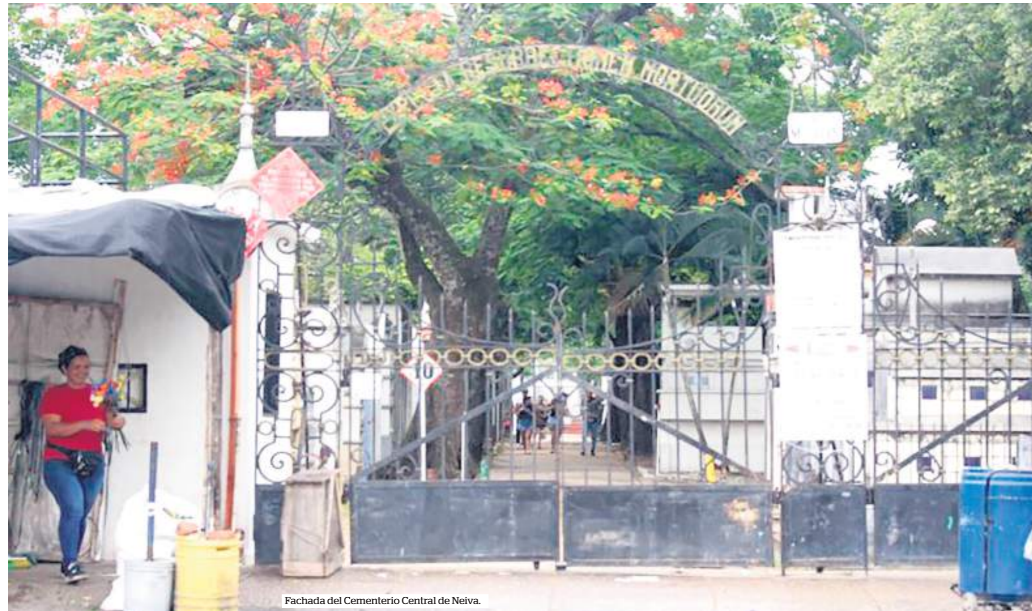
Fachada del Cementerio Central de Neiva.

En Neiva, como en otras ciudades de Colombia, desde tempranas horas del día, muchos llegan a los cementerios ubicados en la ciudad, ingresan con rosas, también llevan materiales para limpiar y mantener las tumbas en buen estado.