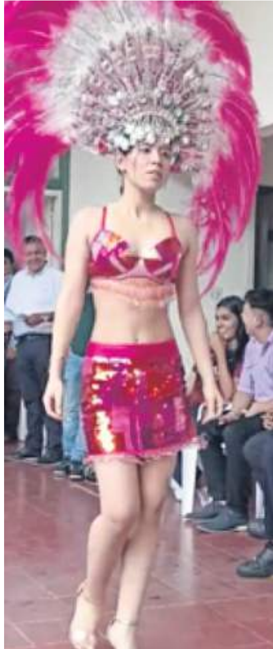
Crossword time. For more information about the event, you can watch a video by scanning the QR code:

were present. Finally, as a way to celebrate Halloween, some students were disguised wonderfully. They showed us their talent to create their costumes and to model in this amazing Fashion Show.