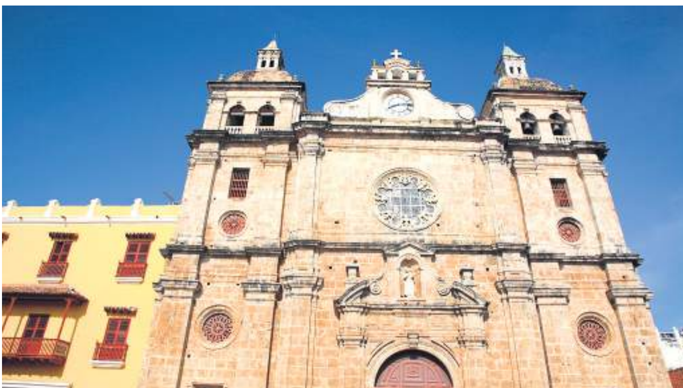
Se salvaron las iglesias.

■ Desde que se inició a hablar de la reforma tributaria, se ha dicho cómo se va a recaudar, pero poco se habla de las inversiones. El sector de la Educación, agua potable y el fortalecimiento de la “banca pública”, como principales fuentes. Más de 70% de la reforma ha sido aprobada.