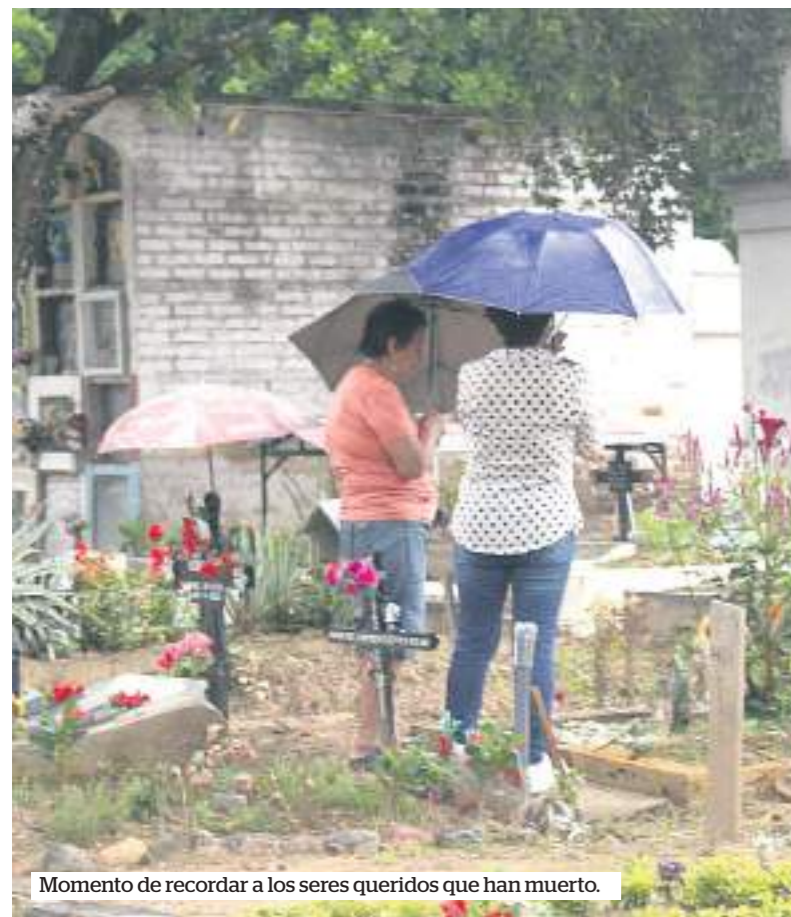
Momento de recordar a los seres queridos que han muerto.

Lo primero que observamos es que después de la pandemia, que cambió la forma y horarios de visitas al camposanto, ahora se abre en horarios especiales y no todos los días. A la entrada aparecen los letreros en los que se puede conocer esos horarios y los días de visita.