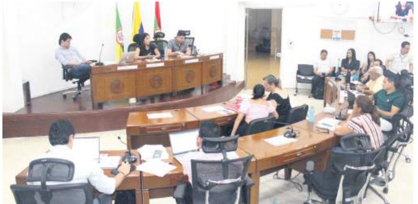
La operatividad del sistema estratégico del transporte público en la ciudad de Neiva y, por ende, la tarifa diferencial según se constató ayer está en veremos

Mucho tiempo ha pasado desde que se viene hablando de la operatividad del sistema estratégico transporte público y la tarifa diferencial que involucra a estudiantes, adultos mayores, presidentes de juntas de acción comunal y personas con capacidades especiales.