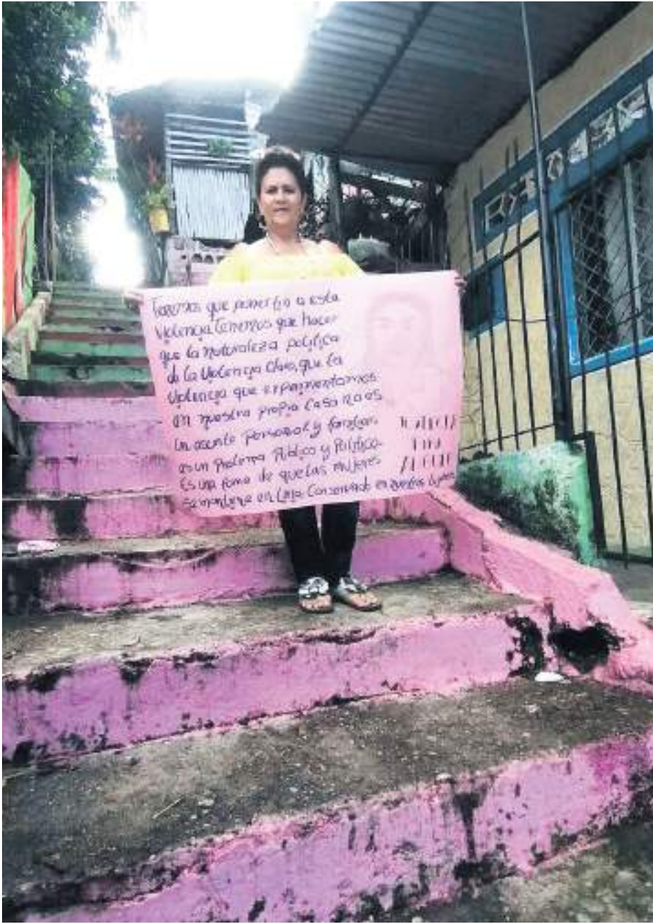
En Neiva, vecinos del barrio Los Parques, realizan una velación cada mes en memoria de la joven. Quienes la conocieron piden justicia y esclarecimiento en este misterioso hecho.