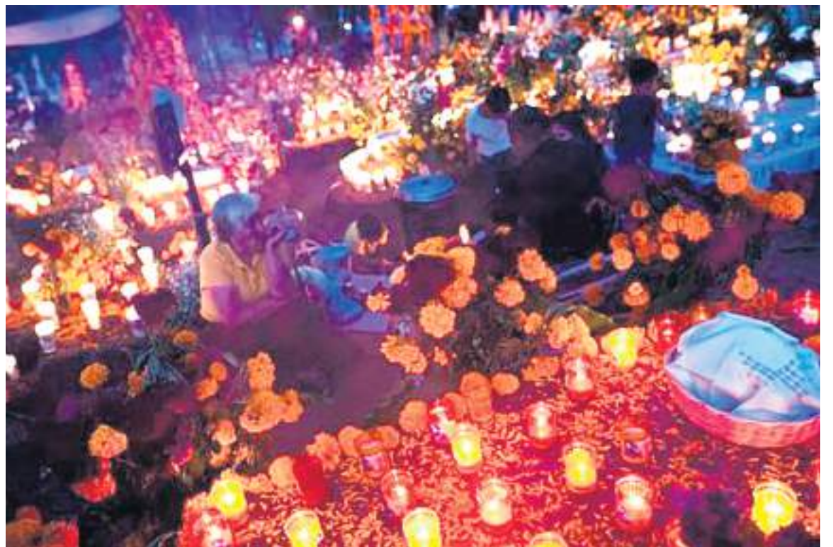
Para el día de los muertos en México, las personas acostumbran a rendirle tributo a sus familiares ya muertos, decoran las tumbas y pasan la noche junto a ellos. Es toda una celebración.