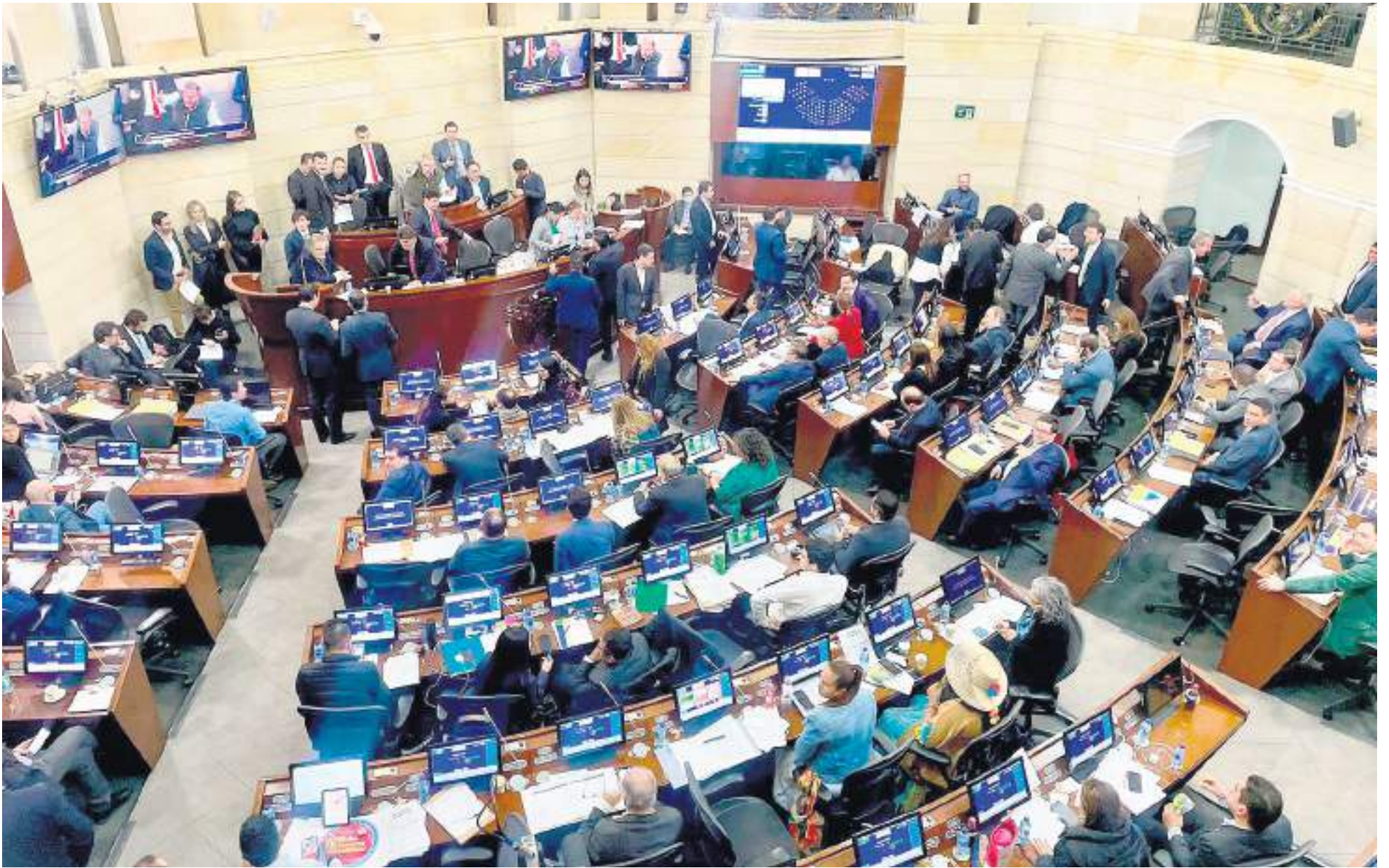
Avanza votación de la reforma tributaria en el Senado.