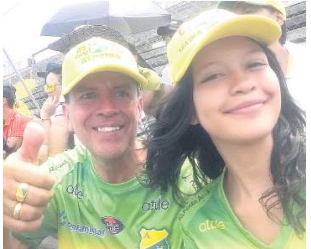
La afición como en otras jornadas será el jugador doce.