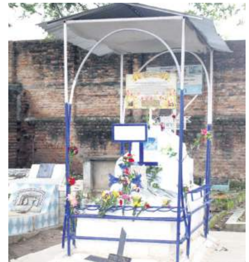
Tumba de Saúl Quintero el legendario guerrillero.