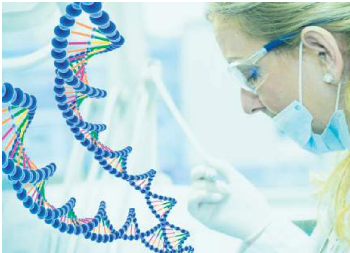
Terapia genética podría ayudar en el tratamiento funcional de los pacientes con VIH

En el contexto de lo que se ha llamado medicina personalizada y de precisión y según detallan los investigadores en su descripción del proyecto, estos novedosos vectores AAV “facilitarán la expresión in vivo de leronlimab, pero lo más importante es que apoyarán el uso futuro de otros enfoques contra el VIH mediante la entrega de terapias al tipo de célula inmune pertinente”.