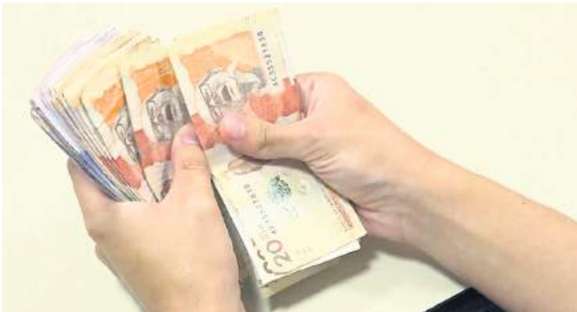
$22 billones serían recaudados en la reforma.

cen que los efectos ya se han empezado a notar, lo cierto de todo es que el pasado gobierno, cuando intentó radicar la reforma que proponía, se produjo el estallido social. Esta al ser “un poco más racional” también ha suscitado marchas en el país y versiones encontradas.