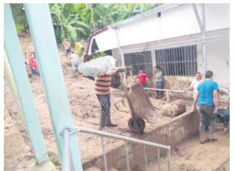
Algunas afectaciones que se han presentado.

Finalmente, se estableció que las comunas más afectadas por la ola invernal son la comuna 6; asentamiento Río del Oro, Los