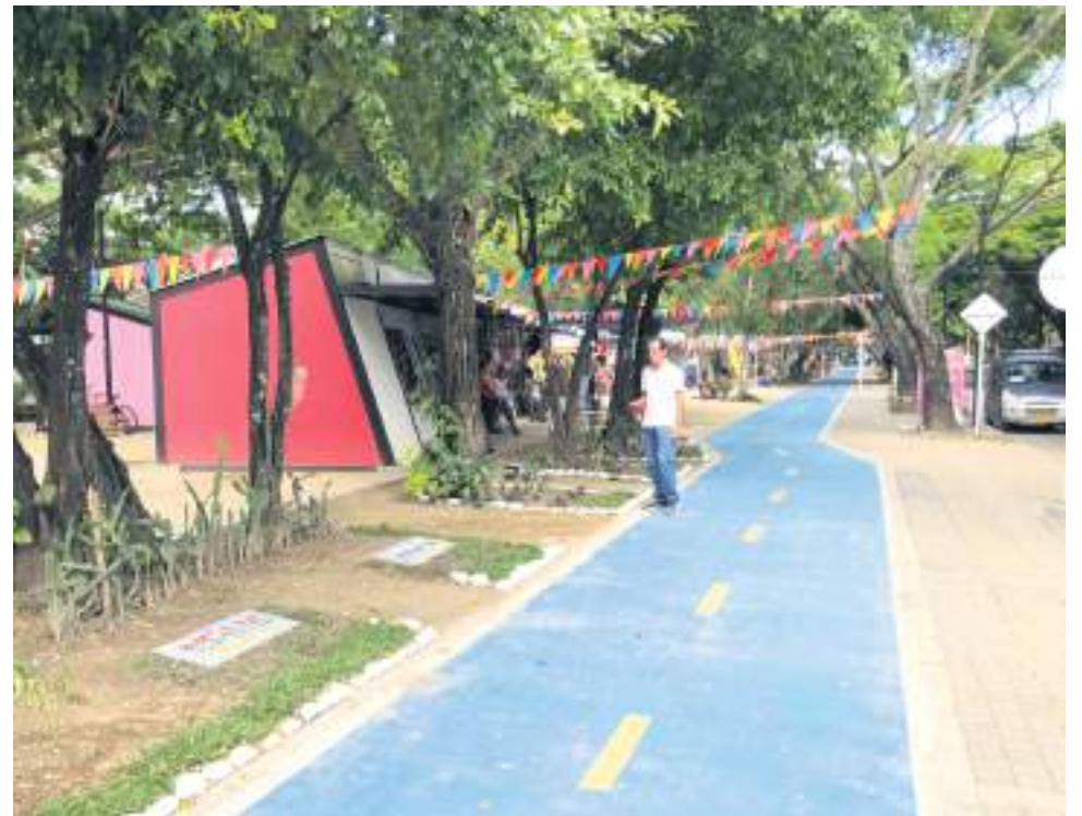
De 54 módulos que entregaron a los artesanos, a la fecha tan solo aproximadamente están abiertos 20.

El Malecón del río Magdalena ha sido históricamente percibido como un sitio inseguro y desagradable para gran parte de la sociedad.