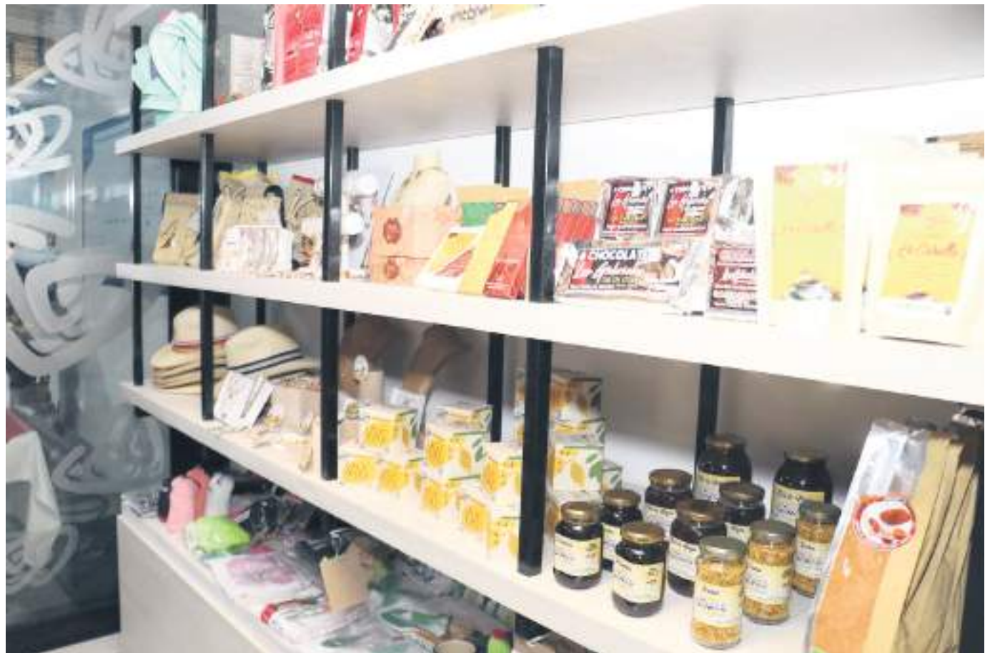
La ilusión de los emprendedores es poder tener unas buenas ventas en estos tres días.

“Una Feria sin precedente alguno, es la primera vez que se realizará una Feria de Emprendedores de Barrio, además, con un número de participantes tan alto. La participación no tiene costo, la entrada será gratuita y el 100% de las ventas son para los emprendedores”