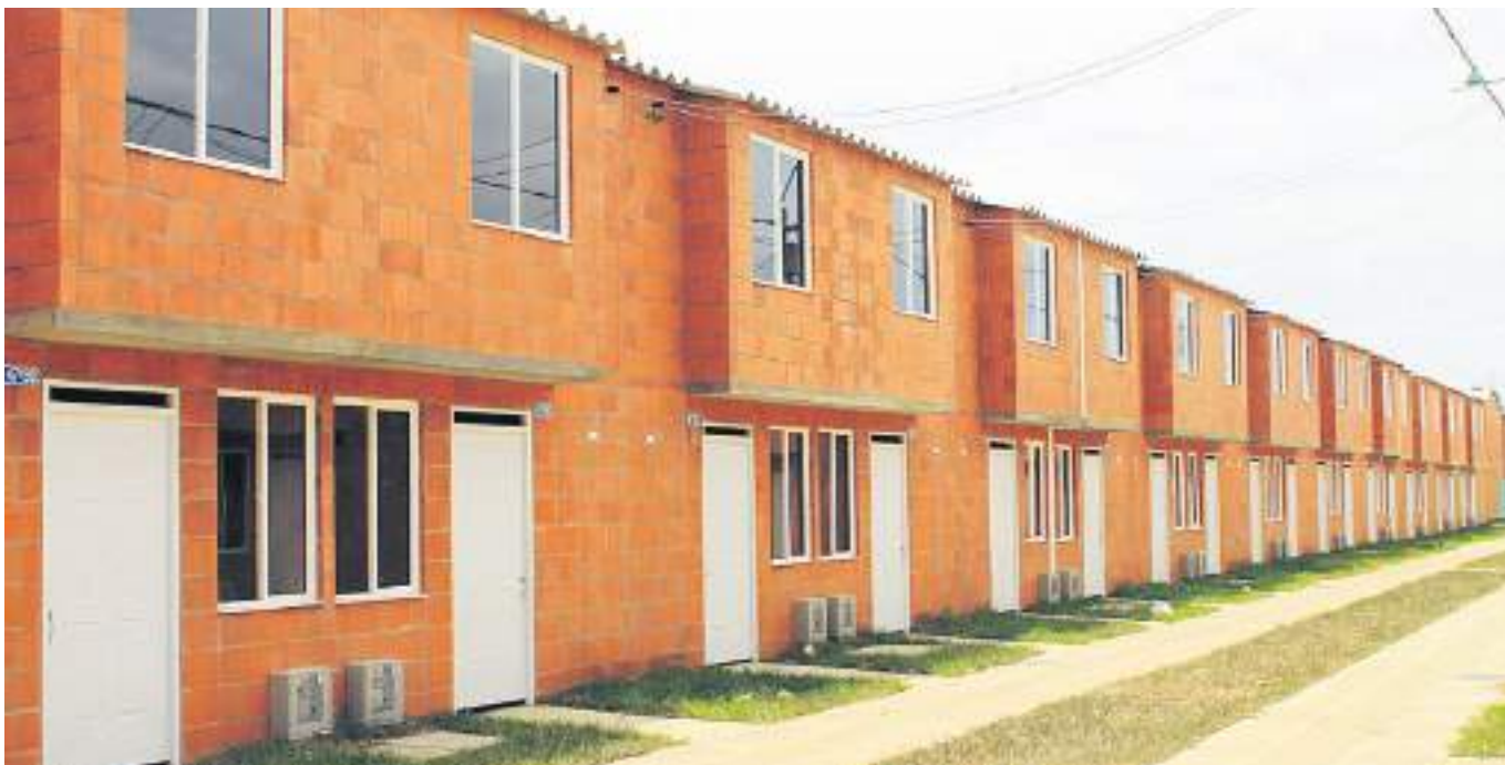
Continuarían los apoyos para vivienda de interés social.