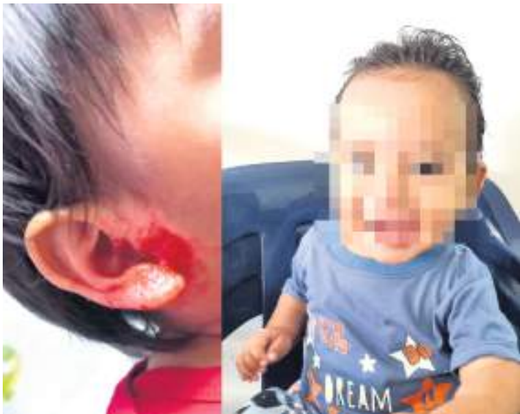
El menor quien está bajo protección del ICBF, al parecer en un día de visita fue hallado lesionado en una de sus orejas por sus familiares.

toridad ha podido establecer qué llevaban esos paquetes y a donde finalmente fueron a parar. Desde el Casanare llegaron los familiares de la joven quienes interpusieron la denuncia, empezaron las investigaciones e incluso por cuenta propia trataron por todos los medios de hallar a su ser querido.