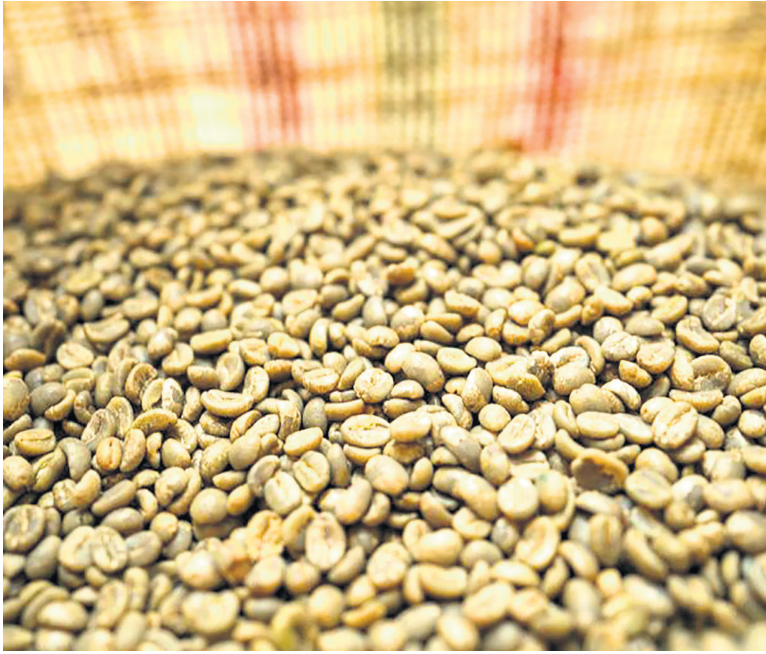
Las exportaciones han bajado.