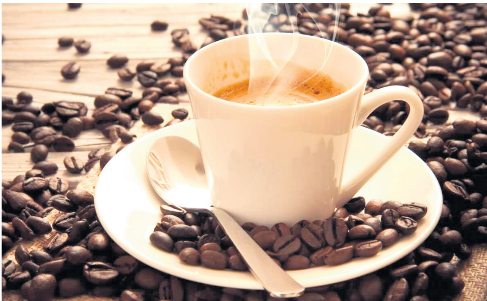
Italianos y chilenos consumen café colombiano.