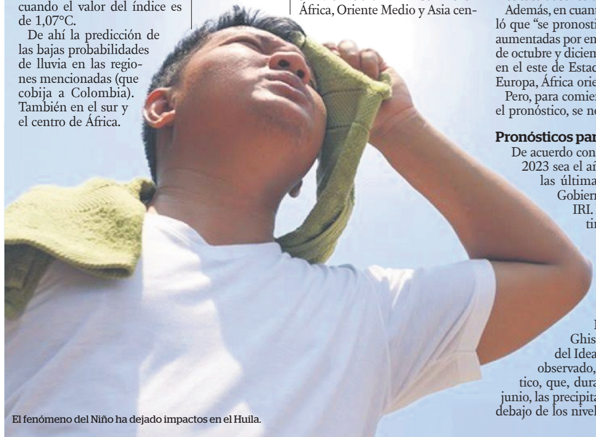
El fenómeno del Niño ha dejado impactos en el Huila.

“Cuando la temperatura externa sobrepasa los 71° celsius, el hipotálamo no puede mantener la temperatura interna y, como un motor viejo, se recalienta, tu sangre se recalienta, las vísceras se recalientan, el cerebro se recalienta y se hincha. Eso se llama golpe de calor o insolación. Las personas pueden morir de eso”, explicó el médico Elmer Huerta, oncólogo y especialista en Salud Pública en entrevista con CNN.