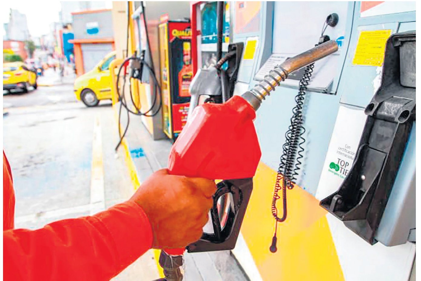
Villavicencio sigue siendo la ciudad con la gasolina más cara del país.

Recientemente, expertos señalaron que el valor por galón ya estaba muy cercano a cumplir la meta del Gobierno nacional, que pretende ajustar los valores del combustible al precio internacional.