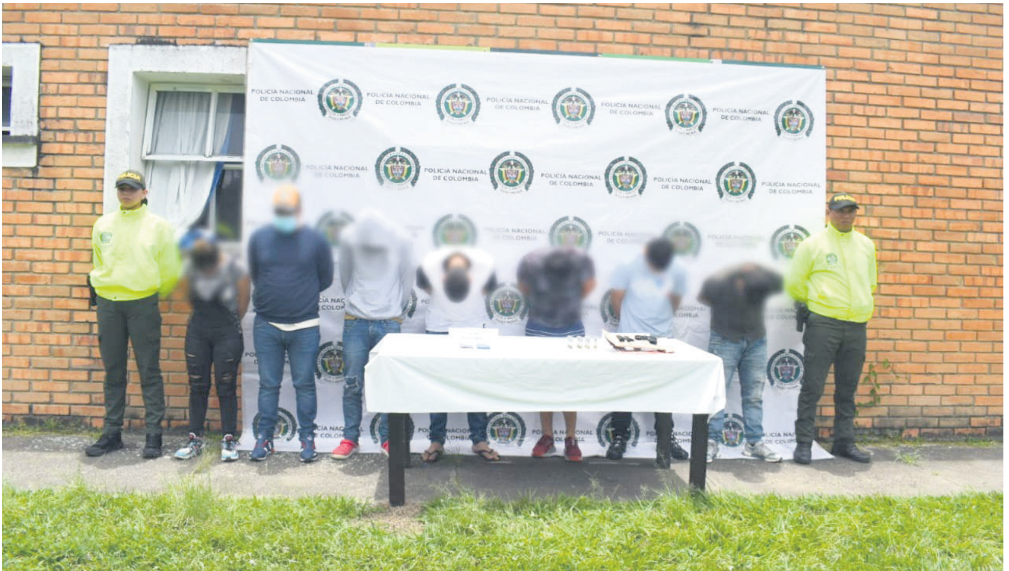
La desarticulación de 'Los Bujías' representa un avance significativo en la lucha contra el crimen en la ciudad de Pitalito y sus alrededores.

dadana, las autoridades también han identificado un factor de oportunidad en la oleada de robos. Muchas personas optan por dejar sus motocicletas en la calle para evitar los gastos de estacionamiento, lo que ha contribuido significativamente a los robos. Además, los delincuentes apro-