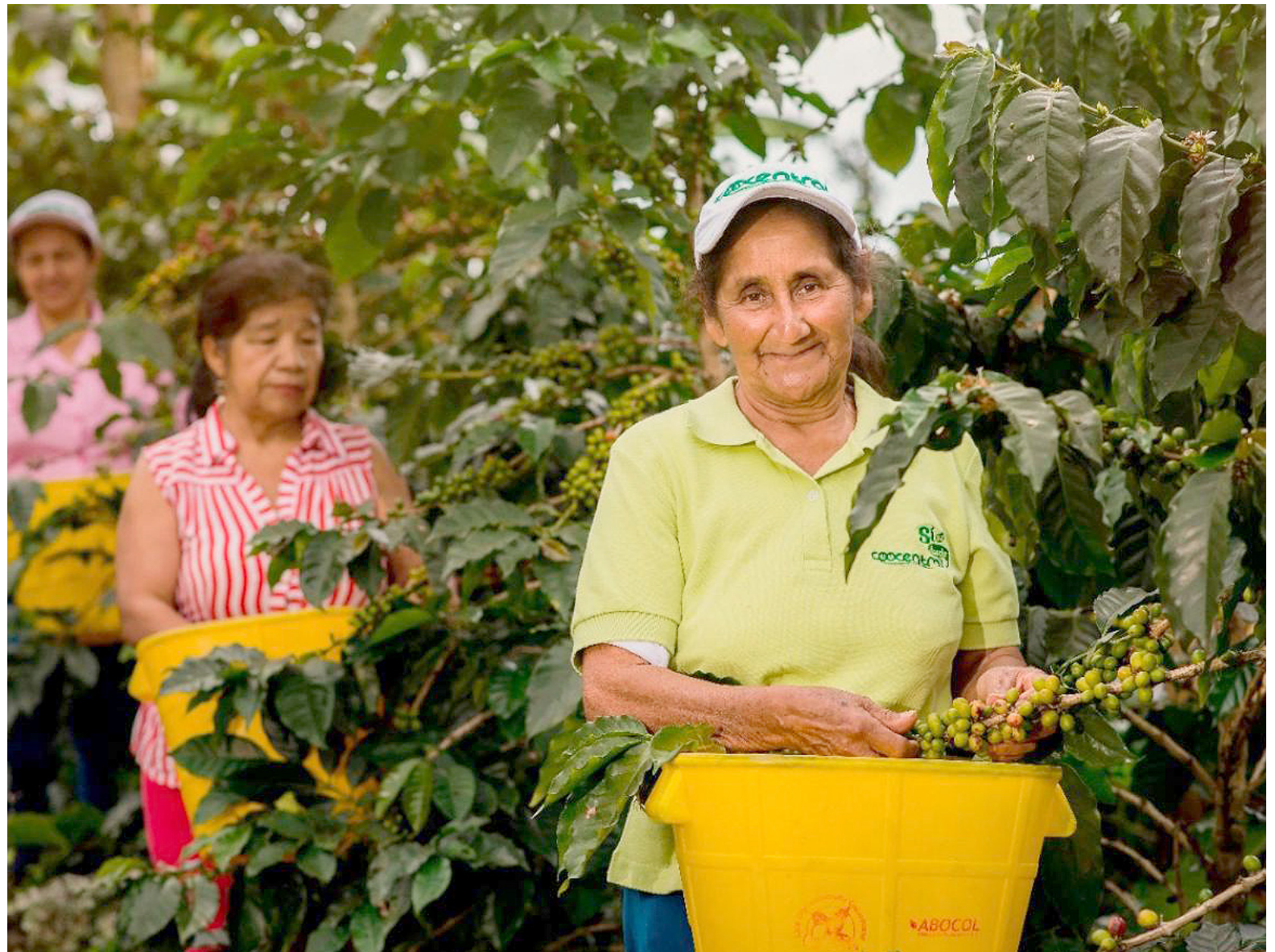
La colaboración y la asociatividad son fundamentales en el proceso de internacionalización de las empresas lideradas por mujeres, según el Fondo Mujer Emprende.

Nuestra organización ha estado impulsando varios programas de desarrollo rural en el Pacífico y la Orinoquía, así como programas relacionados con la gastronomía en la región del Caribe. También hemos establecido una línea de crédito en colaboración con el Banco Agrario, que incluye componentes específicos para mujeres rurales y para mujeres con iniciativas de comercialización y transformación. Además, estamos comprometidos con la educación financiera y próximamente lanzaremos dos mil cupos para programas de formación en emprendimiento en colaboración con Promujer. Les invitamos a seguir nuestras redes sociales para estar al tanto de estas y otras iniciativas que tenemos preparadas para las mujeres colombianas.