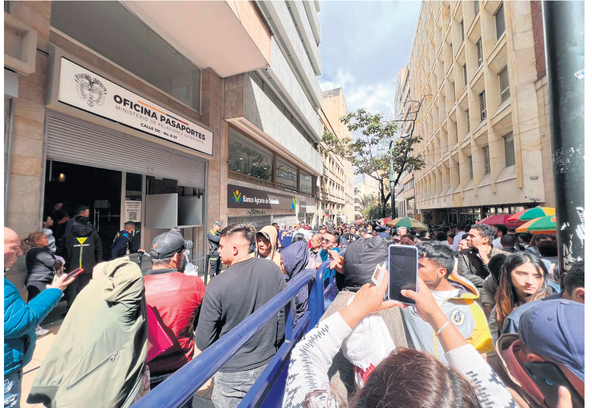
La decisión llama la atención porque precisamente todo el revuelo se ha generado porque el Gobierno no quería que la empresa continuara con ese trabajo.