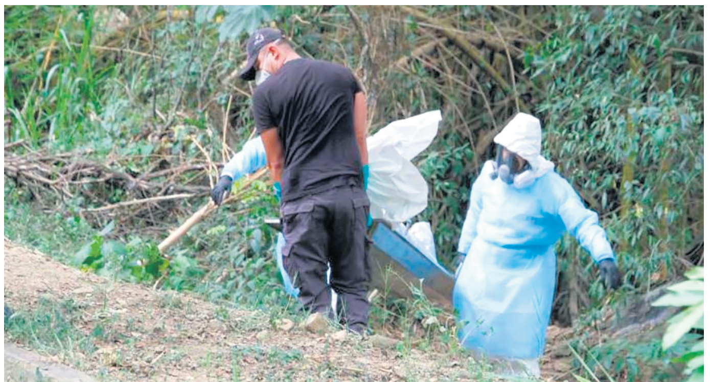
En Neiva fueron halladas partes del cadáver.