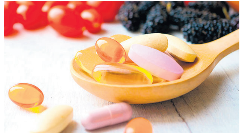
No consumir agua provoca cálculos en los riñones.

Además de esta enfermedad renal, los cálculos renales, conocidos popularmente como piedra en el riñón, hacen referencia a masas sólidas compuestas de pequeños cristales que se depositan en el tracto urinario. Esta es una de las patologías más comunes que puede afectar los riñones y se puede presentar con síntomas como el dolor, la presencia de sangre en la orina, náuseas, vómitos y otros signos.