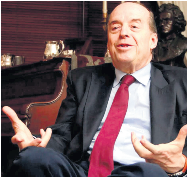
El canciller Álvaro Leyva firmó la prórroga del contrato.

■ Ante el vencimiento del contrato que tenía la empresa Thomas Greg & Sons con el Estado colombiano para la producción de pasaportes en el país, el Canciller habría extendido este por un año más. Ese hecho ha generado gran incertidumbre, tanto así que en varias de las sedes de expedición del documento se han registrado largas filas.