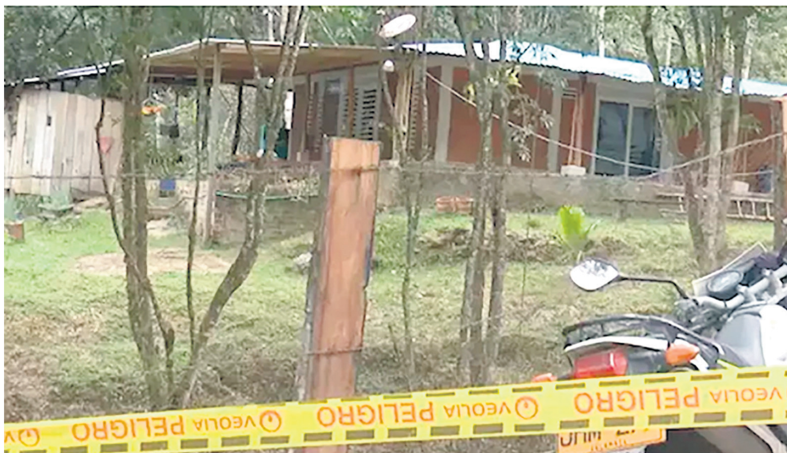
En la residencia, los familiares encontraron restos de cabello, rastros de sangre y evidencia de un objeto quemado.

La Procuraduría reiteró su llamado a la sociedad por la defensa de los derechos humanos de la mujer, especialmente a las autoridades competentes para que se priorice la atención oportuna de los casos alertados y de todas las denuncias por violencia de género.