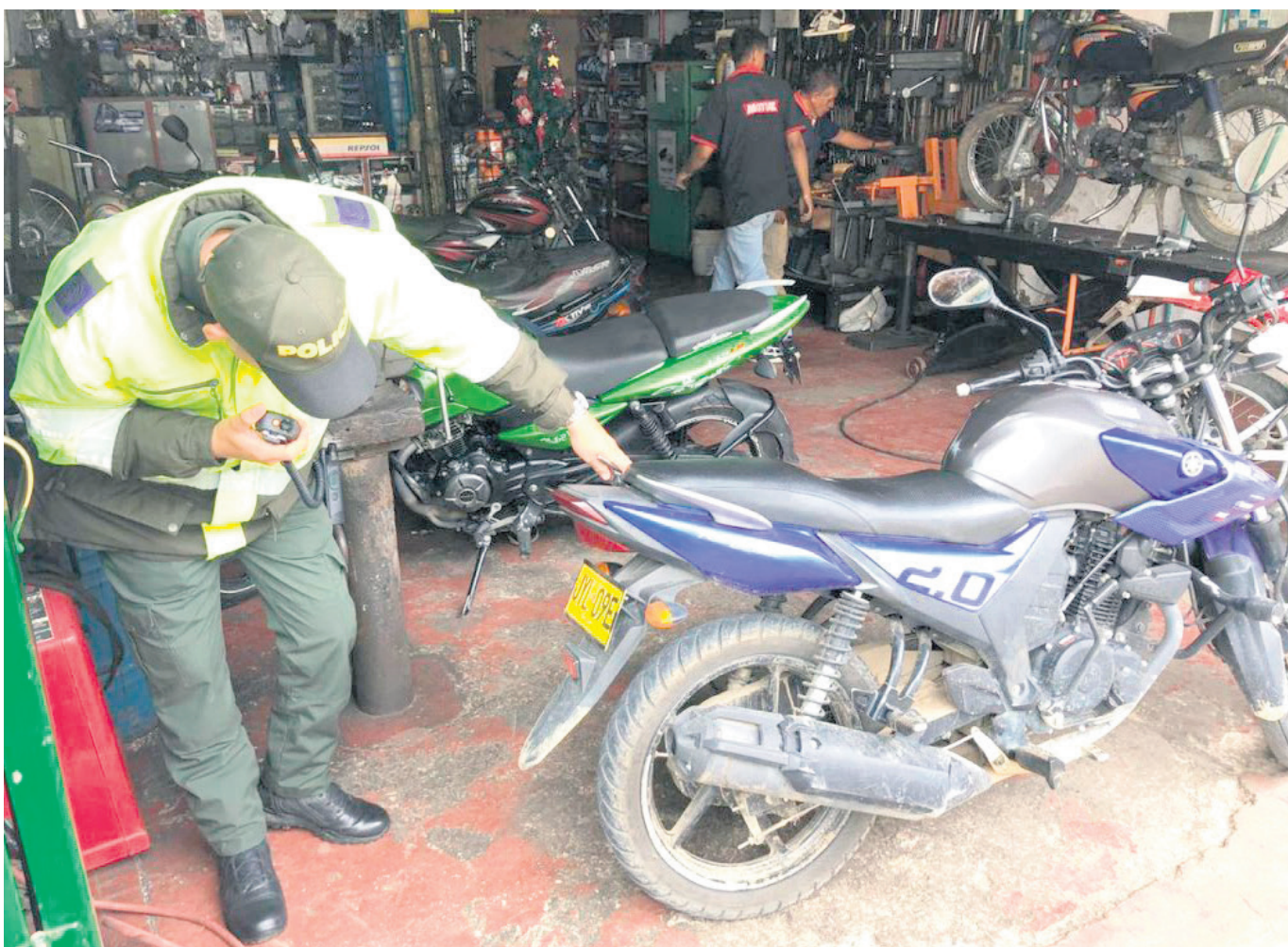
La falta de estacionamiento seguro para motocicletas ha contribuido a la oleada de robos en la región, lo que subraya la necesidad de medidas preventivas y de denuncia.

En este contexto, las autoridades enfatizan que la denuncia sigue siendo la mejor opción para recuperar estas motocicletas.