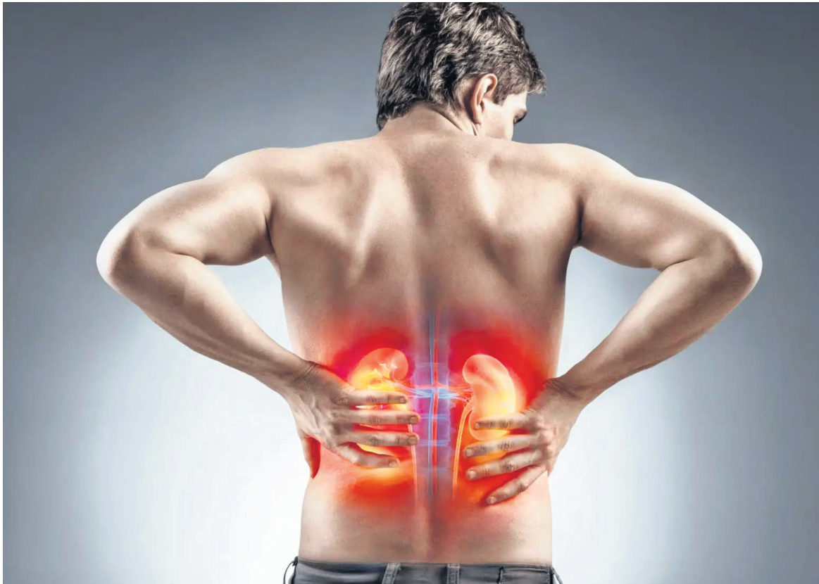
Existen ciertas vitaminas que si se consumen en exceso pueden ocasionar daños graves.

■ El consumo excesivo de ciertas vitaminas puede no solo provocar daños en los riñones, sino también la función hepática.