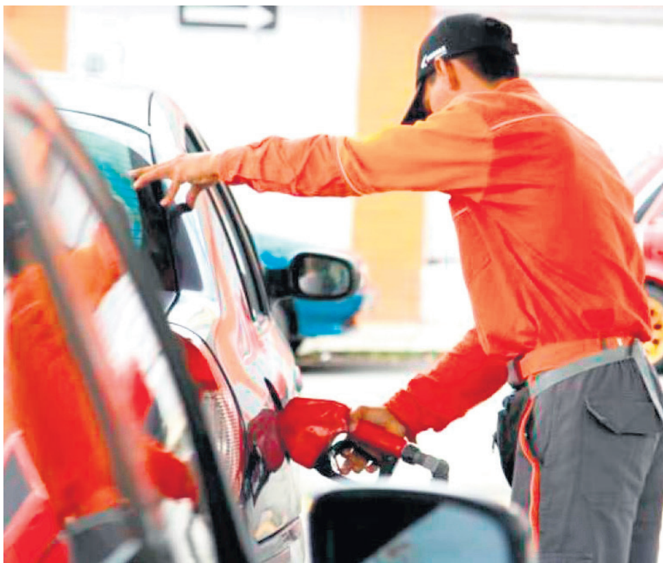
El precio del Acpm seguirá estable hasta que el Gobierno nacional logre estabilizar el valor por galón de gasolina corriente.

Con el anuncio del Gobierno nacional, el valor de la gasolina corriente oscilará en promedio en los $14.000 en todo el territorio nacional. Aun así, Villavicencio, Bogotá y Cali siguen siendo las ciudades con el precio por galón más elevado en todo el país.