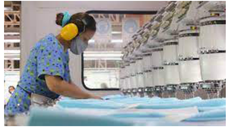
La entidad destaca el potencial de los sectores agroindustriales y manufactureros en el mercado africano para las mujeres emprendedoras colombianas.

El Fondo Mujer Emprende impulsa la internacionalización de empresas lideradas por mujeres: Programa "Ella Exporta a África" abre oportunidades en el continente africano.