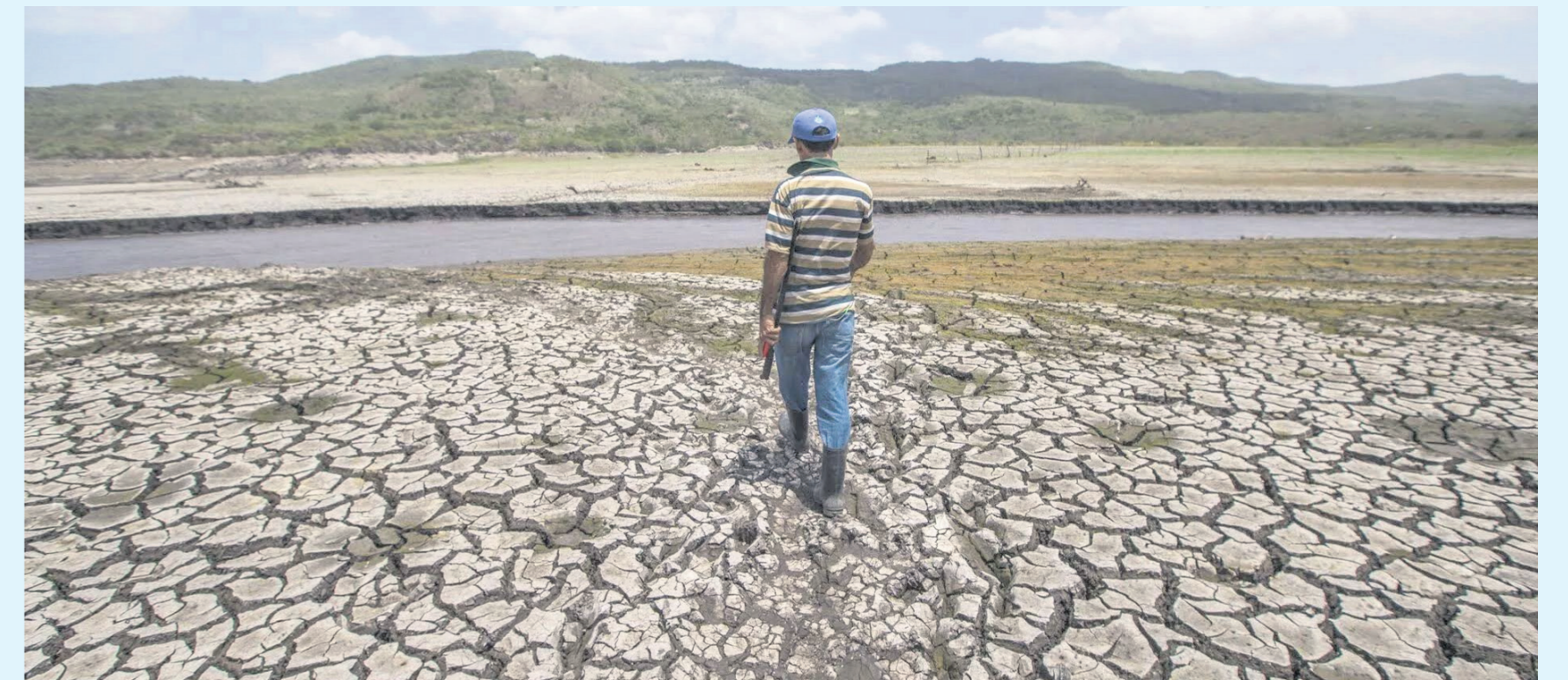
El Huila se prepara para su transición a las precipitaciones.