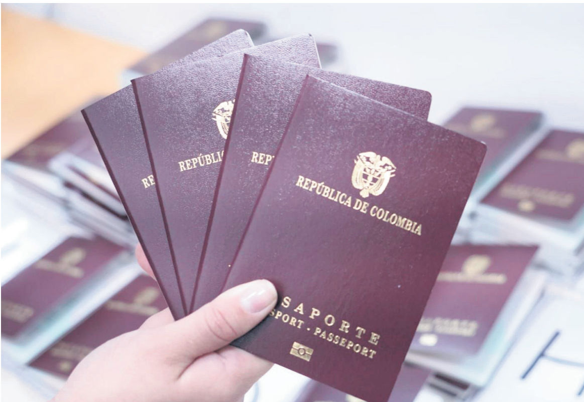
Los colombianos, tendrán un año más para tramitar su pasaporte.

La Cancillería adjudicó el millonario contrato de pasaportes a la firma Thomas Greg & Sons, la cual se encargará de fabricar y distribuir dicho documento durante los próximos 12 meses.