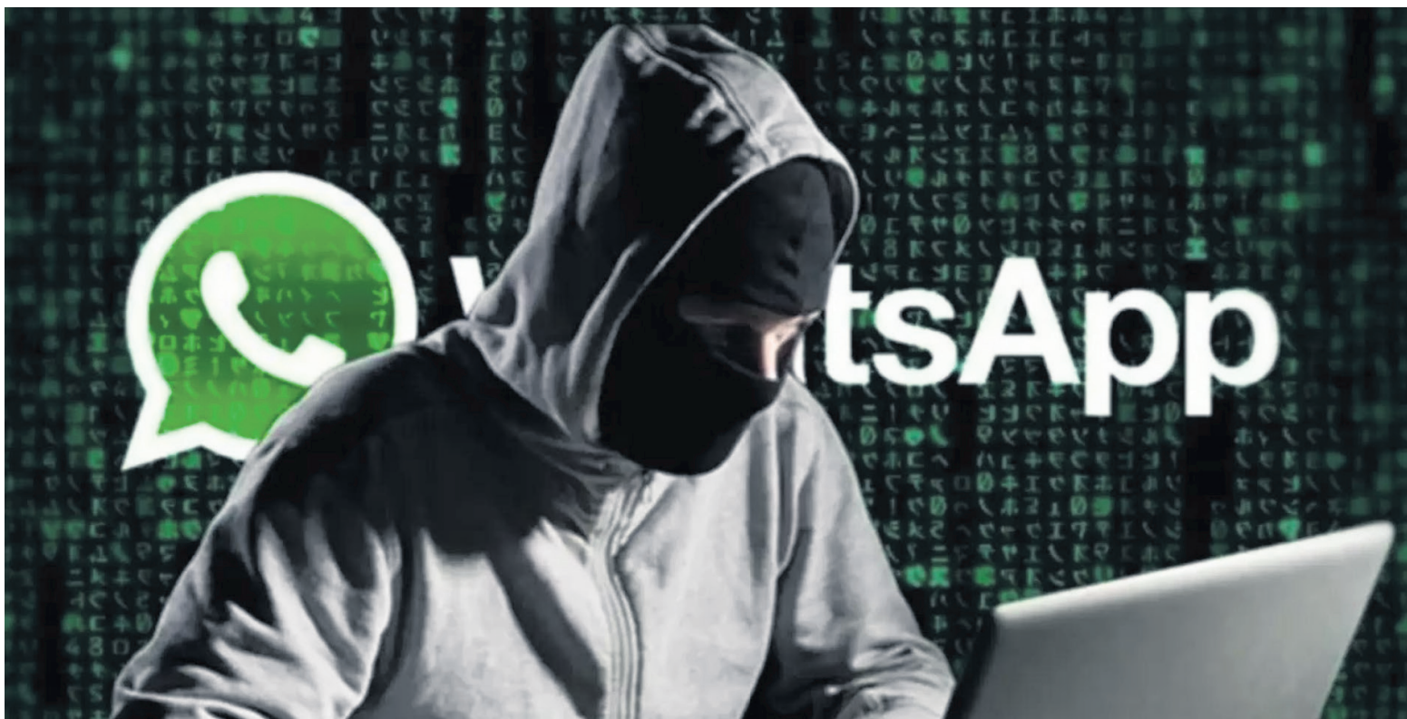
En una ocasión consignaron $200.000 pesos y, a cambio, recibieron $260.000, como parte de las ganancias.