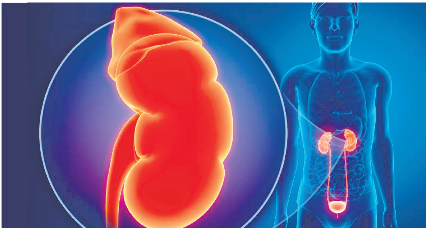
El consumo excesivo de vitaminas puede afectar los riñones y el hígado.

“Reiteró la importancia de buscar asesoría profesional para iniciar un plan vitamínico, ya sea con el médico o con el nutriólogo, y en cuanto a la ingesta de bebidas rehidratantes sugirió no consumirlas en exceso, ya que su contenido de vitamina C es cinco a seis veces mayor que el recomendado diariamente”, acota Escalante.