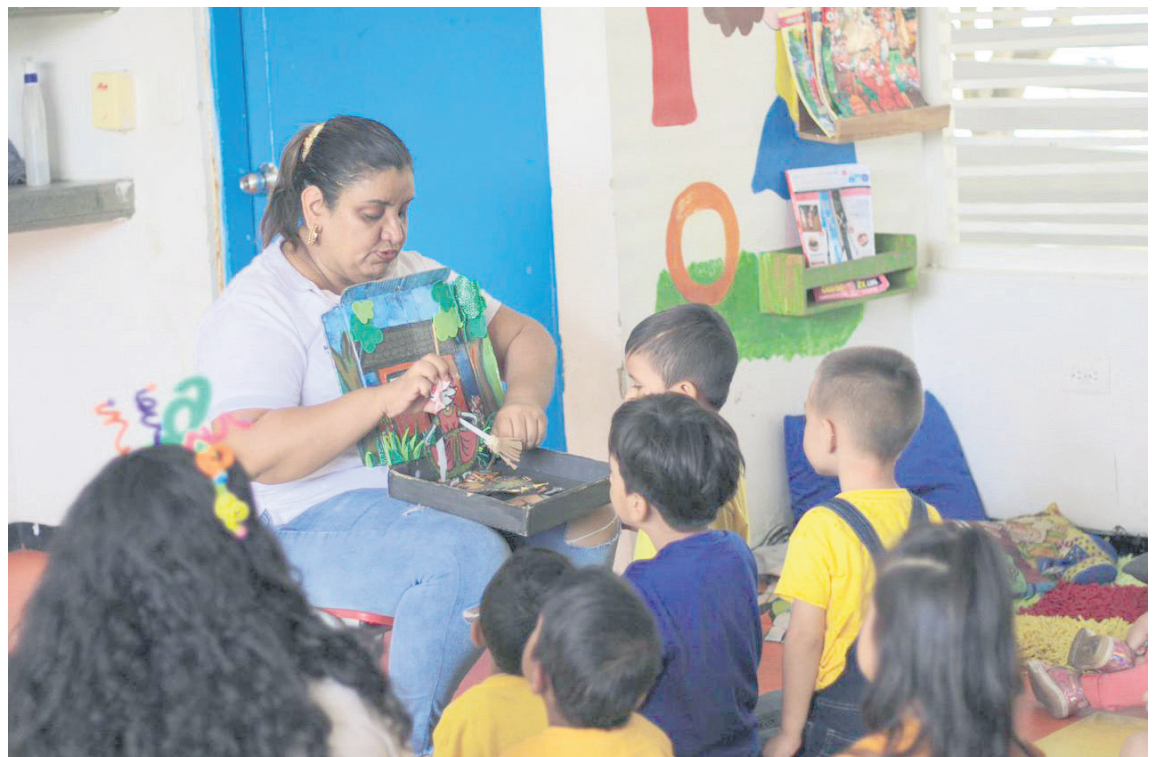
La Biblioteca Departamental Olegario Rivera, a través de su sala infantil ‘Tío Conejo’ celebró el aniversario del CDI Mi Hogar Huellitas del barrio Cuarto Centenario de la ciudad de Neiva.