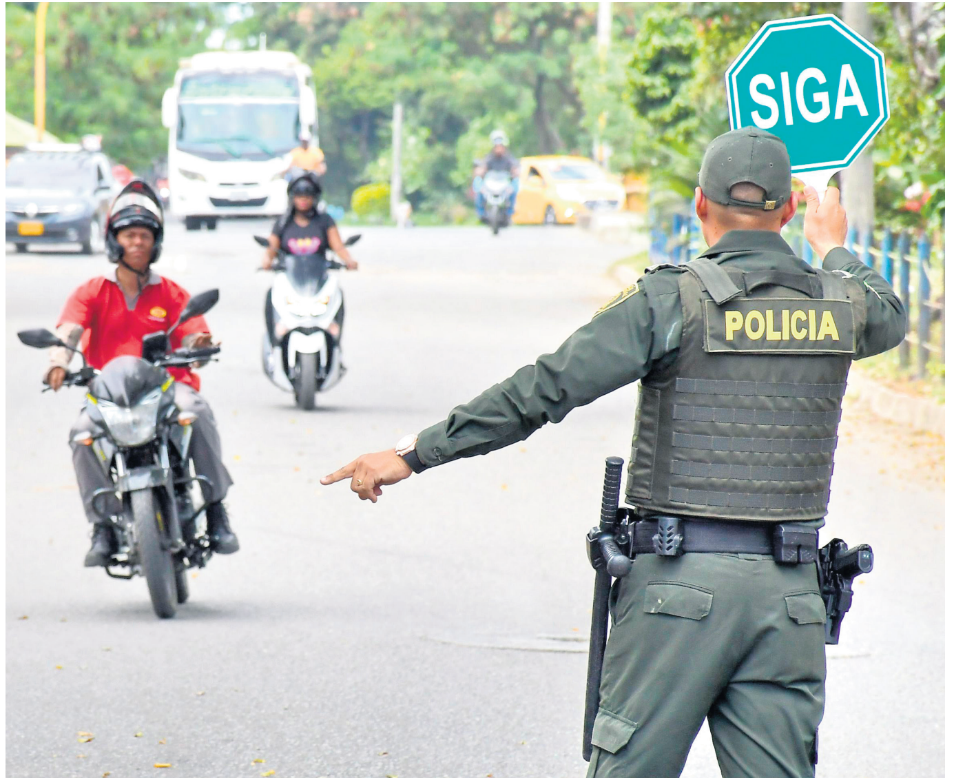
Las autoridades del Huila instan a la ciudadanía a denunciar en lugar de ofrecer recompensas para recuperar motocicletas robadas.

Las autoridades urgen a la comunidad a denunciar en lugar de caer en extorsiones tras la desarticulación de 'Los Bujías', una banda dedicada al robo de motocicletas en el sur del Huila.